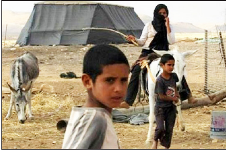
صورة أرشيفية لعائلة في صحراء النقب

وقال الغربي إنه توجه إلى مكتب وزارة الداخلية من أجل تجديد بطاقة هويته، وأضاف أن هناك، ومن دون أي إنذار، قالوا أنهم يأخذون