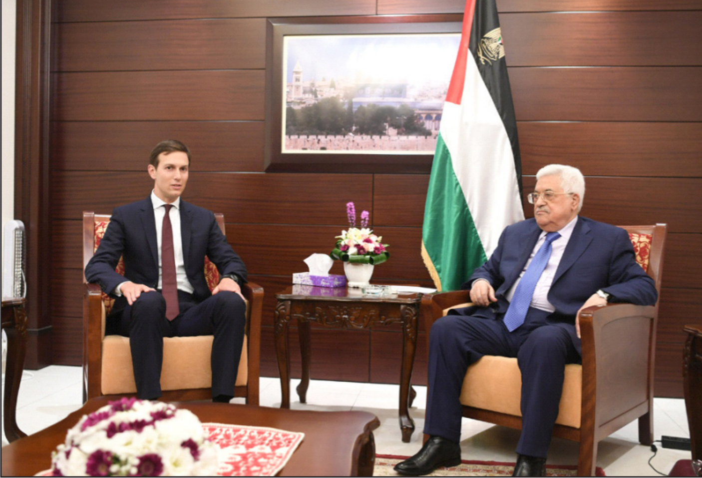
عباس لدى استقبال مبعوث ترامب في مقر الرئاسة في رام الله مساء أول من أمس