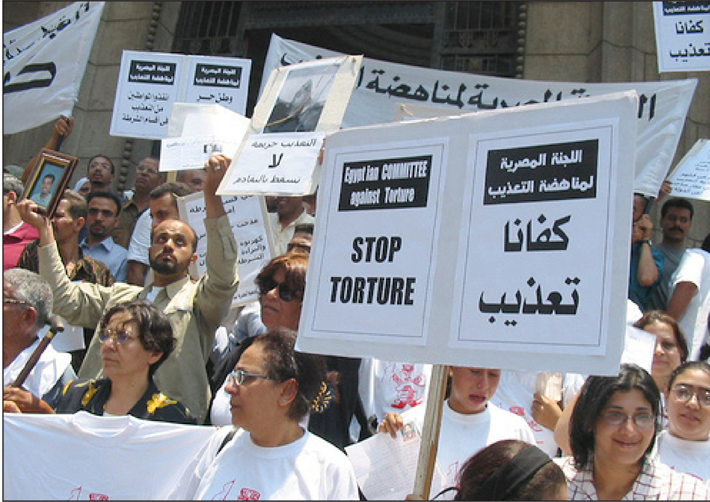
تظاهرة في مصر مناهضة للتعذيب