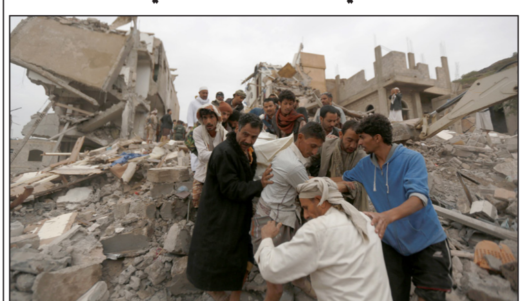
يعميتون ينقلون أحد ضحايا الغارة الجوية على صنعاء

عدد المدنيين الذين قتلوا في حزيران/يونيو، حين قتل 52 مدنياً وفي تموز/يوليو الذي شهد مقتل 57 مدنياً». وأضاف في الغارة الجوية «جميع الأطراف ونبه المفوض السامي في النزاع، بما في ذلك التحالف، بالترامهم القائم على ضمان احترام القانون الدولي الإنساني بالكامل. كما دعا «السلطات المعنية إلى إجراء تحقيقات وثيقة وشاملة وغير محيزة بشأن هذه الحادثة». ووفق الإحاطة فإنه «منذ آذار/مارس 2015، وثقت مكتب الأمم المتحدة لحقوق الإنسان 13.829 مدنياً، بما في ذلك 8.719 شخصاً، وتمتلك هذه الأرقام إلى الإصابات التي تحقق منها مكتب في اليمن بشكل مستقل، وقد يكون الرقم الإجمالي أعلى من ذلك بكثير». وكانت هيئة الأمم المتحدة أعلنت مؤخرا عزم الأمين العام التوصلية بإدراج التحالف الذي تقوده السعودية ضمن القائمة السوداء لرتكي جرائم بحق الأطفال خلال