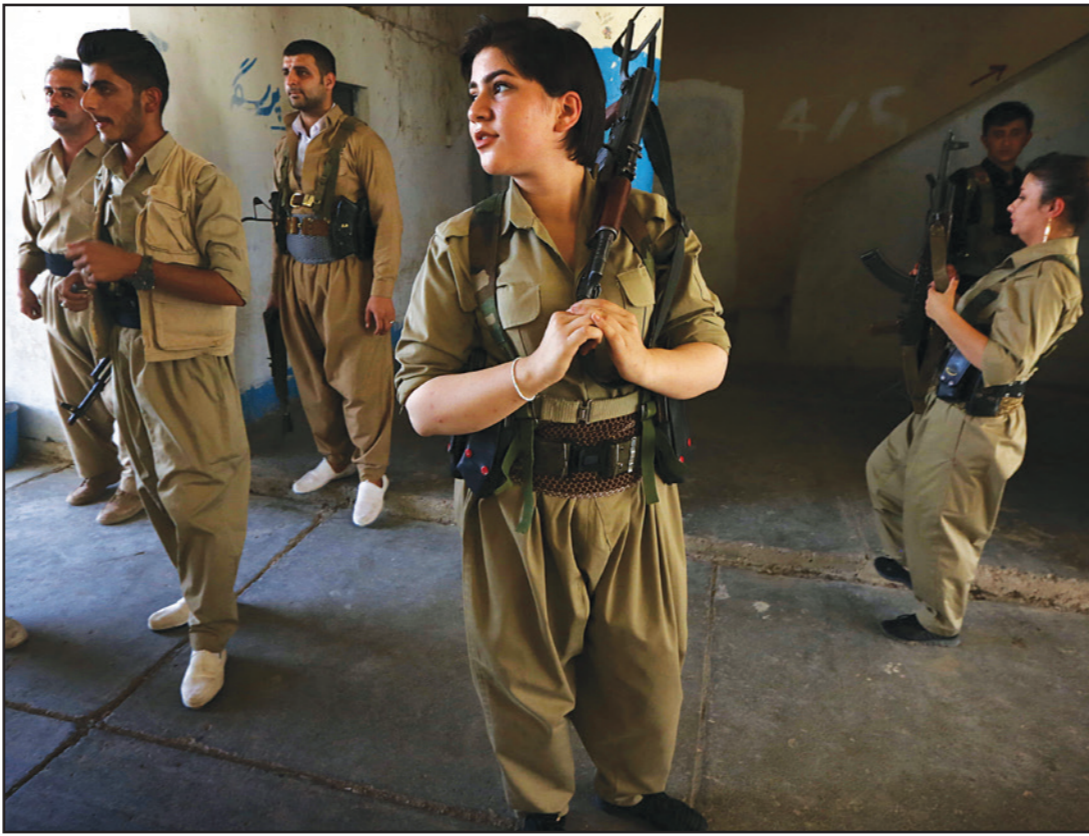
كرديات إيرانيات من الحزب الديمقراطي الكردستاني الإيراني خلال تدريب عسكري في كويبا، شمال إربيل، أمس

وأكدت السلطة القضائية إلقاء القبض وبدء التحقيق مع الجندي الذي قتل المسؤول الإداري في بغداد.