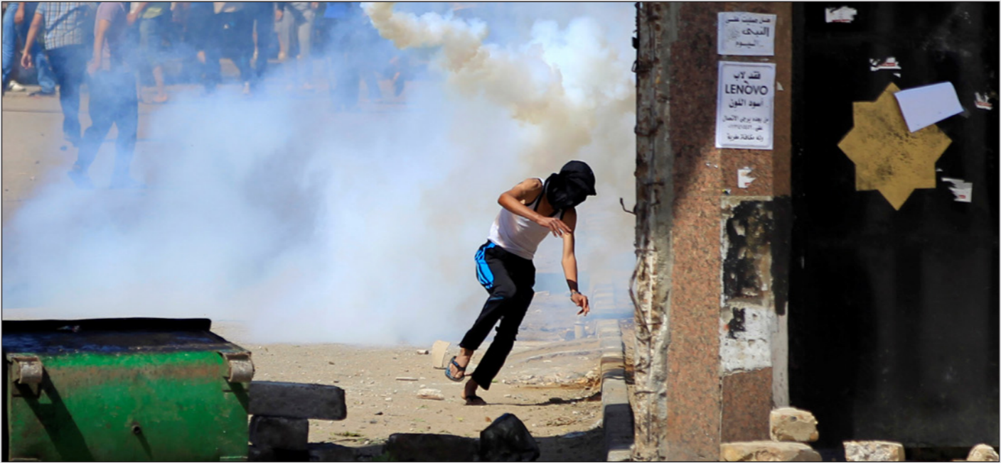
من إحدى المواجهات بين أنصار الإخوان والشرطة المصرية

الطهرية التي تمارس في السعودية والتي تتنافس مع الإخوان المسلمين. فعادة ما يعقت الجهاديون الإسلاميون المعتدلون الذين يركزون على العبادة والخدمات الإجتماعية في مصر بدأ محمد مرسي في حكمه القصير كأنه حاكم للإخوان فقط. وعينهم فسي كل فواصل البيروقراطية ووضع نفسه فوق القانون ونفر منه الأحزاب الأخرى وجعل الناس يخرجون للتظاهر.