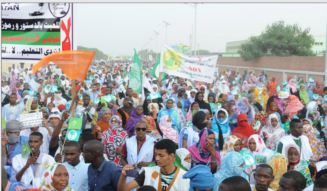
من إحدى مظاهرات المعارضة الموريتانية في نواكشوط