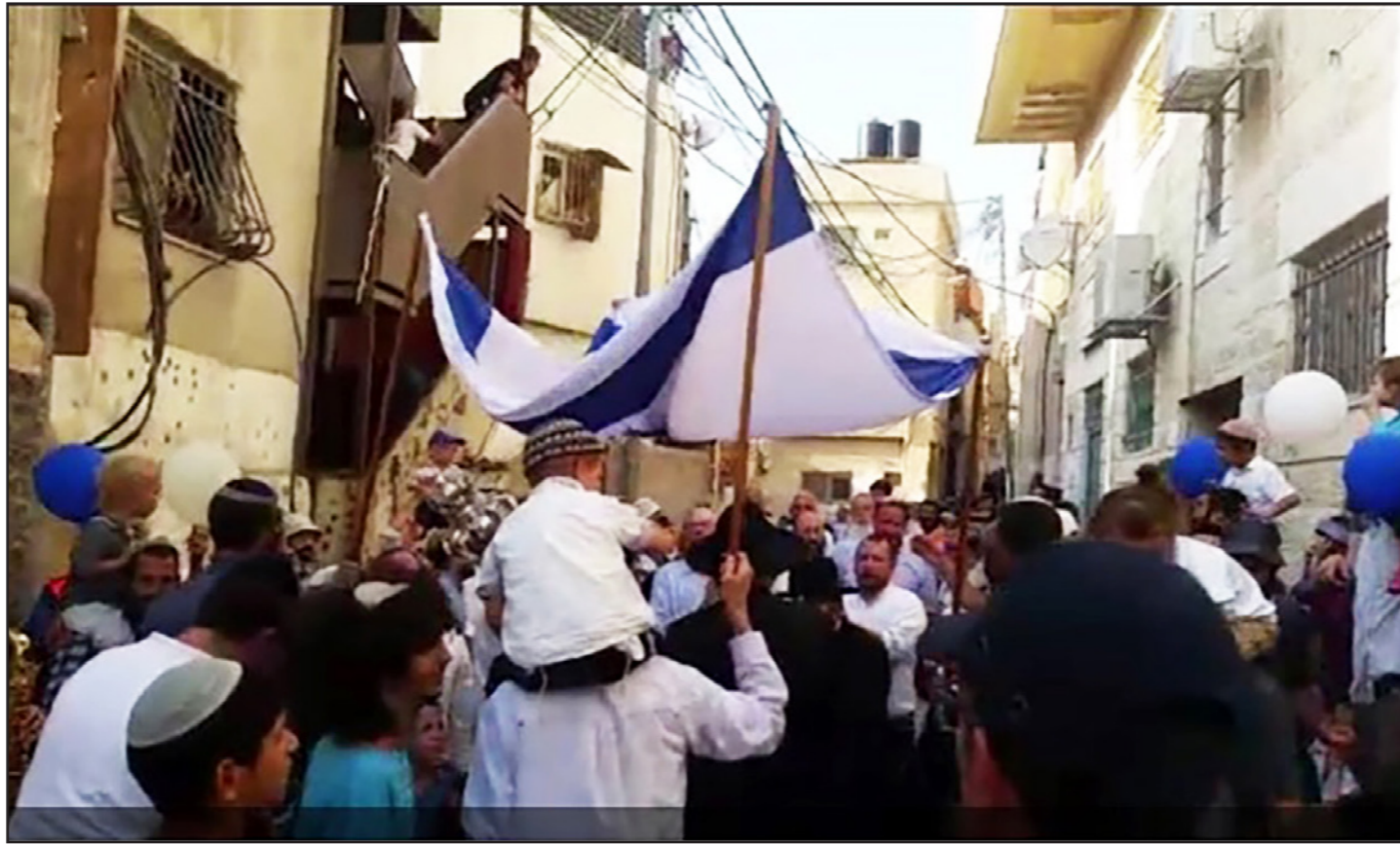
مستوطنو يحتفلون بافتتاح كنيس يهودي في قلب حي سلوان في القدس المحتلة أمس