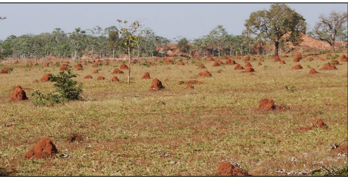
ما تبقى من أشجار قلع لصنع الفحم النباتي في منطقة غران تشاكو في باراغواي

أخرى يعني انتقال نشاط قطع الأشجار إلى مكان آخر، وللحيلولة دون حدوث ذلك، قال إنه ينبغي أن يكون هناك تنسيق دولي للمشروعات البيئية.