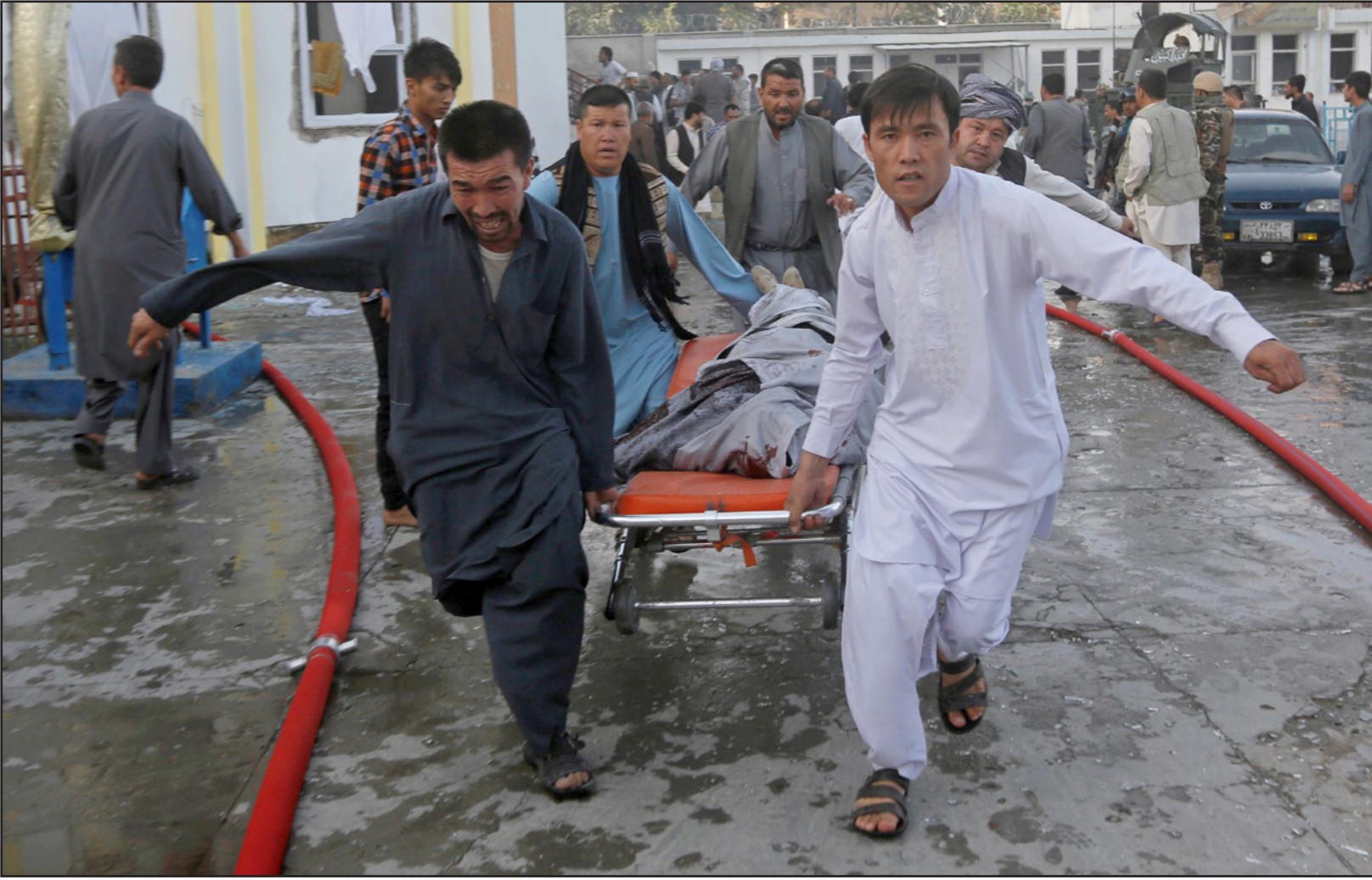
أفغان ينقلون أحد ضحايا العملية الانتحارية في كابول