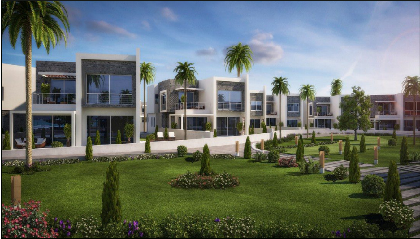
مباني جاهزة للتسليم في «مشروع سيزر»