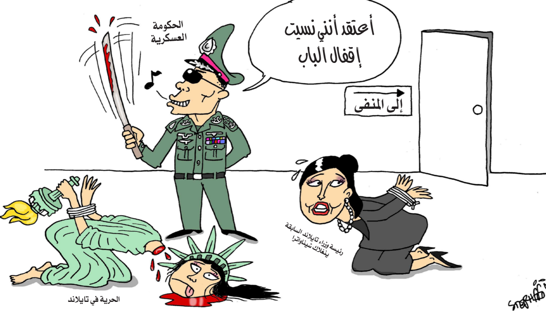
الحرية في تايلاند