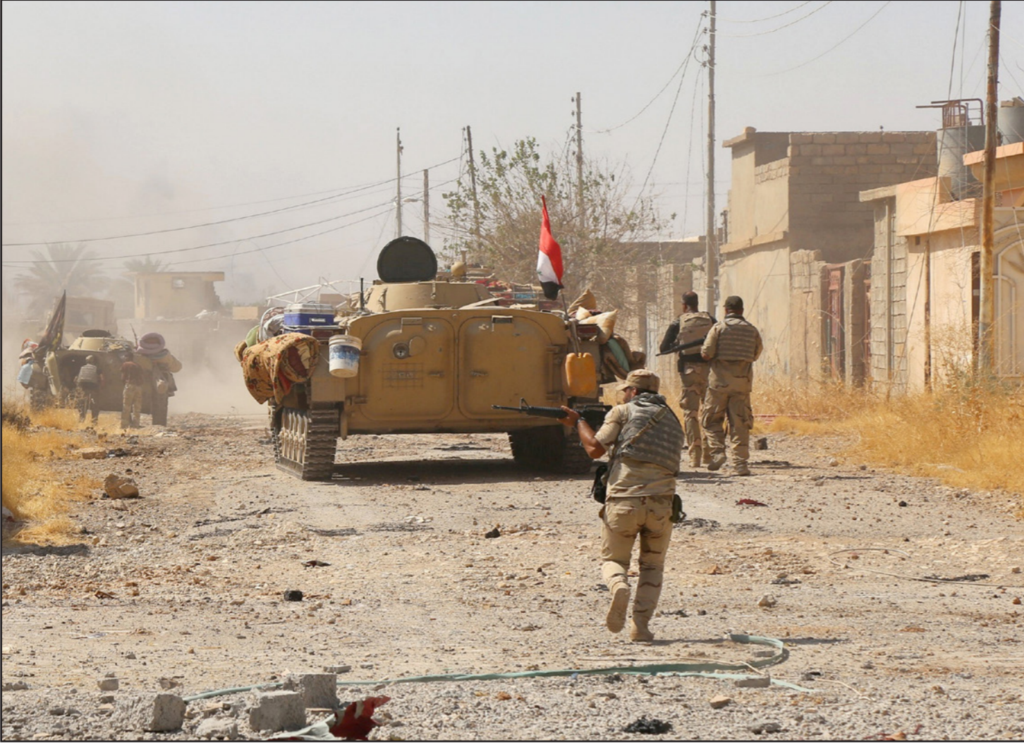
عناصر من الجيش العراقي في مواجهات مع تنظيم «الدولة» في تلعفر

إجلاؤهم من الأحياء الشرقية والغربية داخل قضاء تلعفر خلال الـ48 ساعة الماضية، وكانت الأمم المتحدة، أعلنت الإثنين الماضي، فرار 30 ألف مدني من قضاء تلعفر.