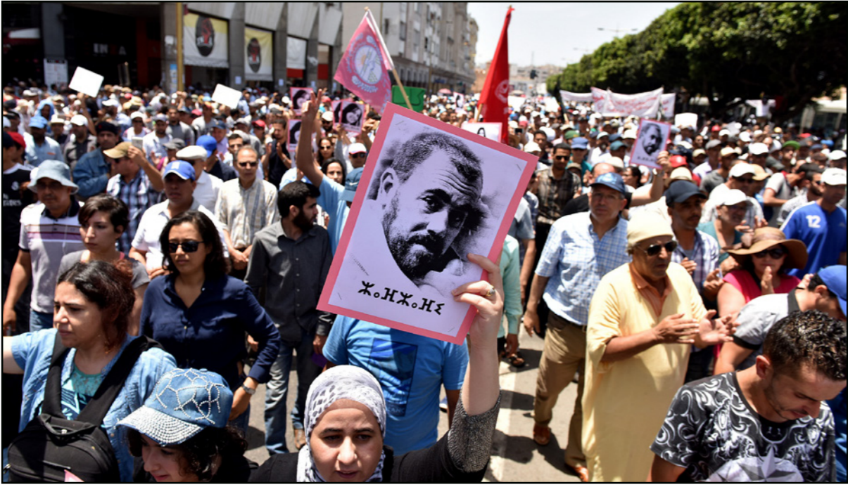
جانب من احتجاجات الرباط تضامنا مع حراك الريف

تدبير المؤامرة ارتكاب عمل ولا الشروع فيه لإعدام التفتيش. فإن العقوبة تكون الحبس من ستة أشهر خمس سنوات ويعاقب بالحبس من ستة أشهر إلى ثلاث سنوات من دعا إلى تدبير مؤامرة ولم تقبل دعوتهم.