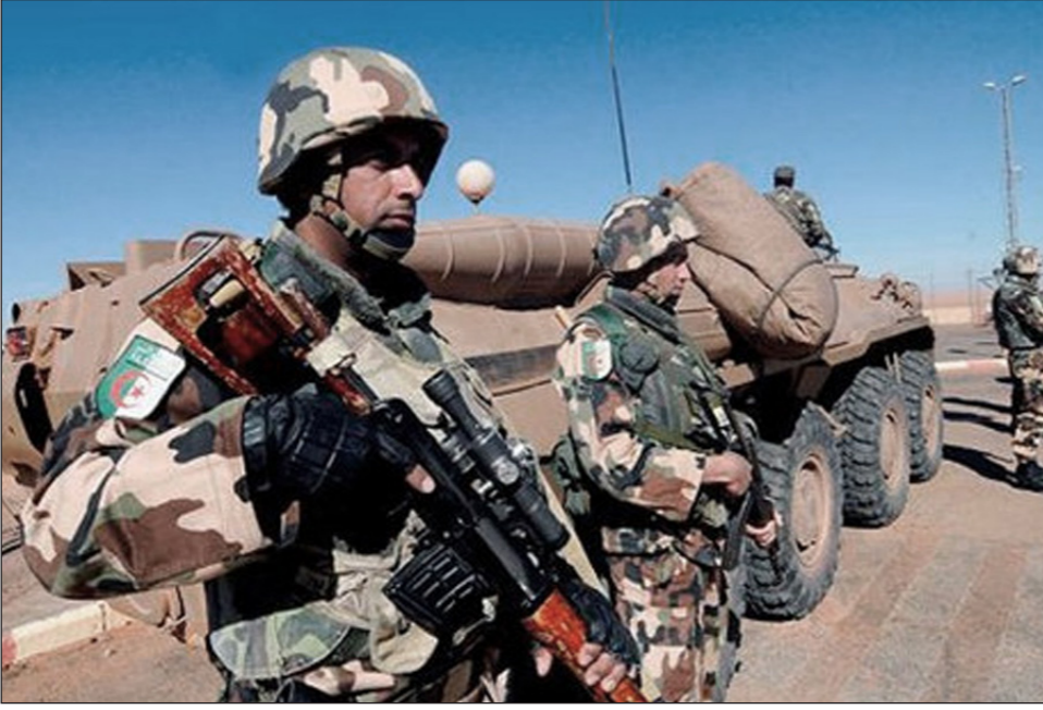
عناصر من الجيش الجزائري

نفسه لم يعد قادرا على لعب أدوار سياسية، خاصة بعد تحجيم جهاز الاستخبارات وتوزيع مديرياته بين قيادة الأركان ورئاسة الجمهورية. كما أنه لم يعد داخل الجيش أو المخابرات جنرالات مسيسون، وتدخل في السياسة وتصنع الرؤساء وتعين الوزراء والسفراء وكل المسؤولين تقريبا على عدة مستويات. ورغم ذلك، فإن قائد أركان الجيش نائب وزير الدفاع أحمد قايد صالح ارتأى الرد على تلك الإشاعات بطريقة غير مباشرة، لكن الرسالة كانت واضحة، وذلك على هامش زيارة عمل وتفقد قام بها إلى الناحية العسكرية الخامسة، إذ أكد أن الجيش متمسك بمهامه الدستورية، التي تتمثل أساسا في حماية أمن واستقرار البلاد، ومواجهة الأخطار المحدقة بالجزائر. مشددا على أنه كان ولا زال حريصا على بقاء الجيش مؤسسة جمهورية حماية السيادة الوطنية والوحدة الترابية وصون استقلال البلاد، كما ذكر بالرسالة التي وجهها الرئيس عبد العزيز بوتفليقة القائد الأعلى للقوات المسلحة وزير الدفاع الوطني، الذي حيا الجهود التي يبذلها الجيش في إطار القيام بواجباته الدستورية، خاصة ما تعلق بحماية أمن وسيادة وحدود البلاد.