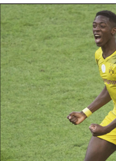
ديمبلي ما زال يثير الجدل مع دورتموند إلى حين انتقاله إلى برشلونة

■ برلين - د ب أ: نفى هانز يواخيم فاتزكه، الرئيس التنفيذي ليوروسيا دورتموند الألماني، التوصل إلى اتفاق نهائي لانتقال اللاعب عثمان ديمبلي إلى برشلونة، لكنه اعترف بأن حسم القرار بات وشيكا. وقال فاتزكه: «لا توجد اتفاقية نهائية، وسنرى كل الأمور». تجدر الإشارة إلى أن ديمبلي (20 عاما) موقوف في الوقت الحالي عن المشاركة مع دورتموند، بسبب تغيبه عن تدريبات الفريق بدون إذن مسبق، ويسعى برشلونة للتعاقد مع ديمبلي ضمن مساعيه لإيجاد الحل البديل، بعد رحيل النجم البرازيلي نيمار إلى باريس سان جيرمان. ونشرت تقارير، منها لصحيفتي «بيلد» الألمانية و«بليك» الفرنسية، أن صفقة ديمبلي حسمت. لكن فاتزكه قال إن «حسم القرار بات قريبا فقط. وسيكون أمرا جيدا أن نتكمن من توضيح الأمور قبل مطلع الأسبوع»، ويتردد أن دورتموند يطالب بالحصول على 130 مليون يورو نظير الاستغناء عن اللاعب، الذي انضم للفريق الصيف الماضي مقابل 15 مليون يورو.