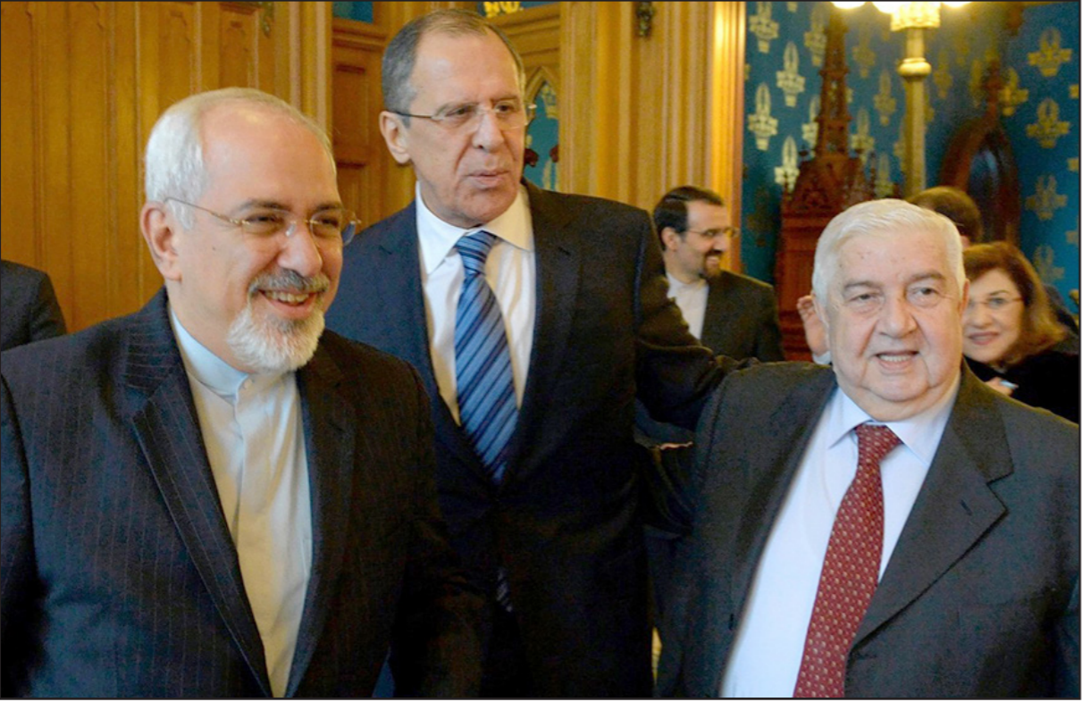
قلق إسرائيلي من العلاقات السورية الإيرانية الروسية

من الجزرالات الإسرائيليين؛ لاصلة لهم القاعدة السياسية لإسرائيل في أمريكا، اللوبي، القنصرين، الفاجينيين، المنتصحين. الفرضية الخفية في كل لقاء للجنرالات والزعماء المذنبين هي أن الجزرالات يسعون إلى الحرب والمذنبون إلى المفاوضات. فمهمة الجنرال الفارس السكي، بنذفع إلى الأمام؛ أما المسؤولون القوي فيسبرون خلفه أو يكبحونه؛ حروب عصرنا