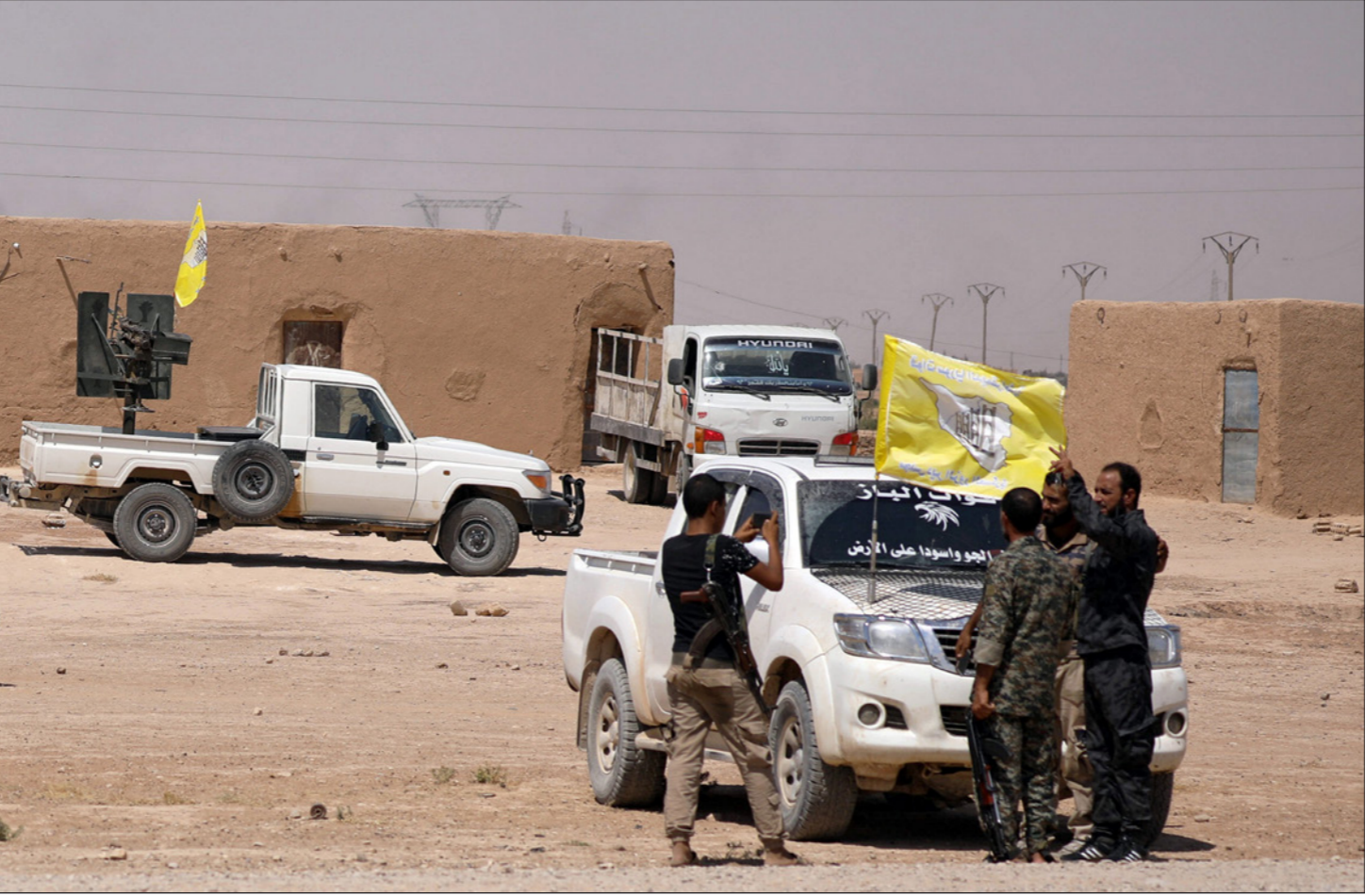
مقاتلون من «قسد» في ريف دير الزور استعداداً للمعركة المقبلة ضد تنظيم «الدولة»

وأضاف لـ «القدس العربي»: إن ميليشيات «الأسايش» قامت بتطويق المظاهرة، ثم فضها بإطلاق