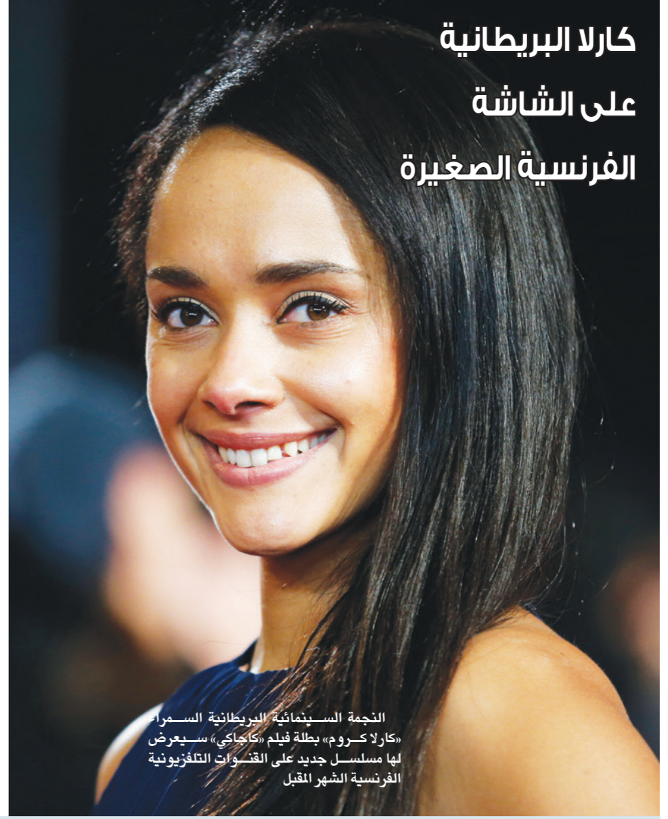
التجمة السينمائية البريطانية السمر «كارلا كروم» بطلة فيلم «كاجي» سيعرض لها مسلسل جديد على القنوات التلفزيونية الفرنسية الشهر المقبل