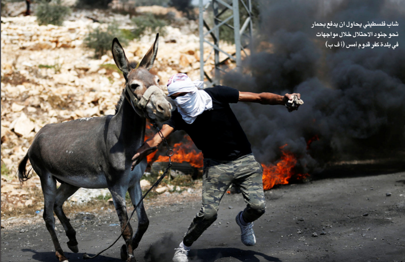
شاب فلسطيني يحاول ان يدفع بحمار نحو جنود الاحتلال خلال مواجهات في بلدة كثر قدم امس

سببها «جمود الاتصالات» وحماس لم تعلق على الأمر