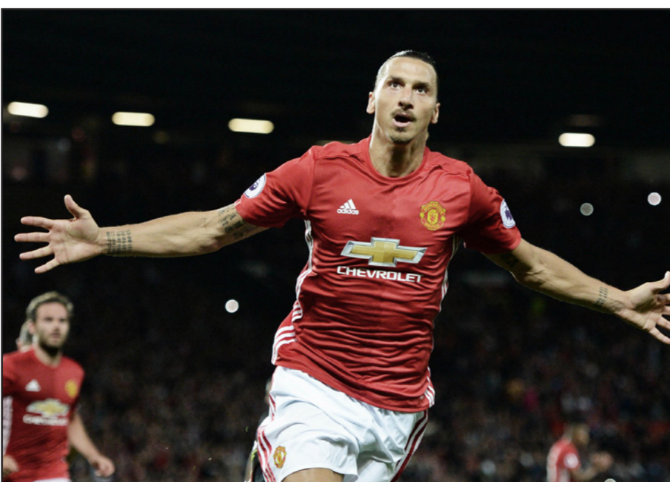
إبراهيموفيتش عاد إلى صفوف مانشستر يونايتد ويتطلع إلى اللعب معه مجددا

■ مانشستر - الأناضول: أعرب النجم السويدي زلاتان إبراهيموفيتش عن سعادته لتجديد موسم إضافي مع مانشستر يونايتد. وقال: «أنا في غاية السعادة. أنا سعيد جدا، والسعادة لا تمن لها». وأضاف: «حظيت بموسم رائع مع يونايتد وحصدنا 3 بطولات، إنه ناد عظيم وأصدقاء مدهلون، ومدرب أعرفه قُبيل قدمي للفريق». وأوضح: «أريد أن أعيش نفس الضغوط عندما أعود، وأن أكون كما كنت دائما، وأن تكون التوقعات كما هي دائما أيضا». وتابع: «لا أعلم متى سأعود، هناك من يتحدث ويقول 8 أشهر، عام كامل، هم يجهلون إصابتي، أشعر بأنني على ما يرام. أنا عائد لأهني ما بدأت، وأعتقد أن قدوم روميلو لوكاكو سيجعل الفريق أقوى، فهو لاعب بإمكانات مختلفة عني وعن راشفورد، لاعب قوي وسيضيف للفريق إمكانات أخرى، وسيكون يونايتد الأقوى في الموسم الحالي». وعن رحيل وين روني، قال إبراهيموفيتش: «خسرنا روني هذا الصيف وهو أسطورة في هذا النادي».