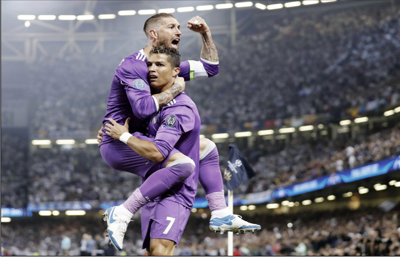
راموس يعانق زميله رونالدو عقب الانتصار أمام برشلونة في الكأس السوبر لكنهما سيغيبان عن الريال هذا