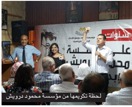
لحظة تكريمها من مؤسسة محمود درويش

ويعدّون لي مسائلين لماذا لا أזור لبنان. وقالت إنها لا تشعر بأنها منيت بخسارة كبيرة أو أنها حبيسة وداخل قصص خاصة أنها تشارك دائماً في مهرجانات موسيقية في كل أنحاء العالم وموجودة في المديا المحلية والعالمية أيضاً معززة جداً بجمهورها المحلي، مشيرة إلى أن للأغاني منطوق الأشجار، كما قال الراحل محمود درويش: للأغاني منطق الشمس، وتاريخ الجداول... ولها طبع الرزائل... والأغاني كجذور الشجرة... فإذا ماتت بأرض، أزهرت في كل أرض. وأوضحت مرفس التي لا تشارك بإباحتها حفلات الأعراس حفاظاً على مستوى أدائها الفني أنها لا تتنازل عن فنها وعن خطوطها الحمراء، وتقول إن كل شيء نسبي في الحياة فشيئاً ما زال تحت الاحتلال وبدون دولة وغزة بلا كهرباء فلماذا «تبتعد وتململ»؟