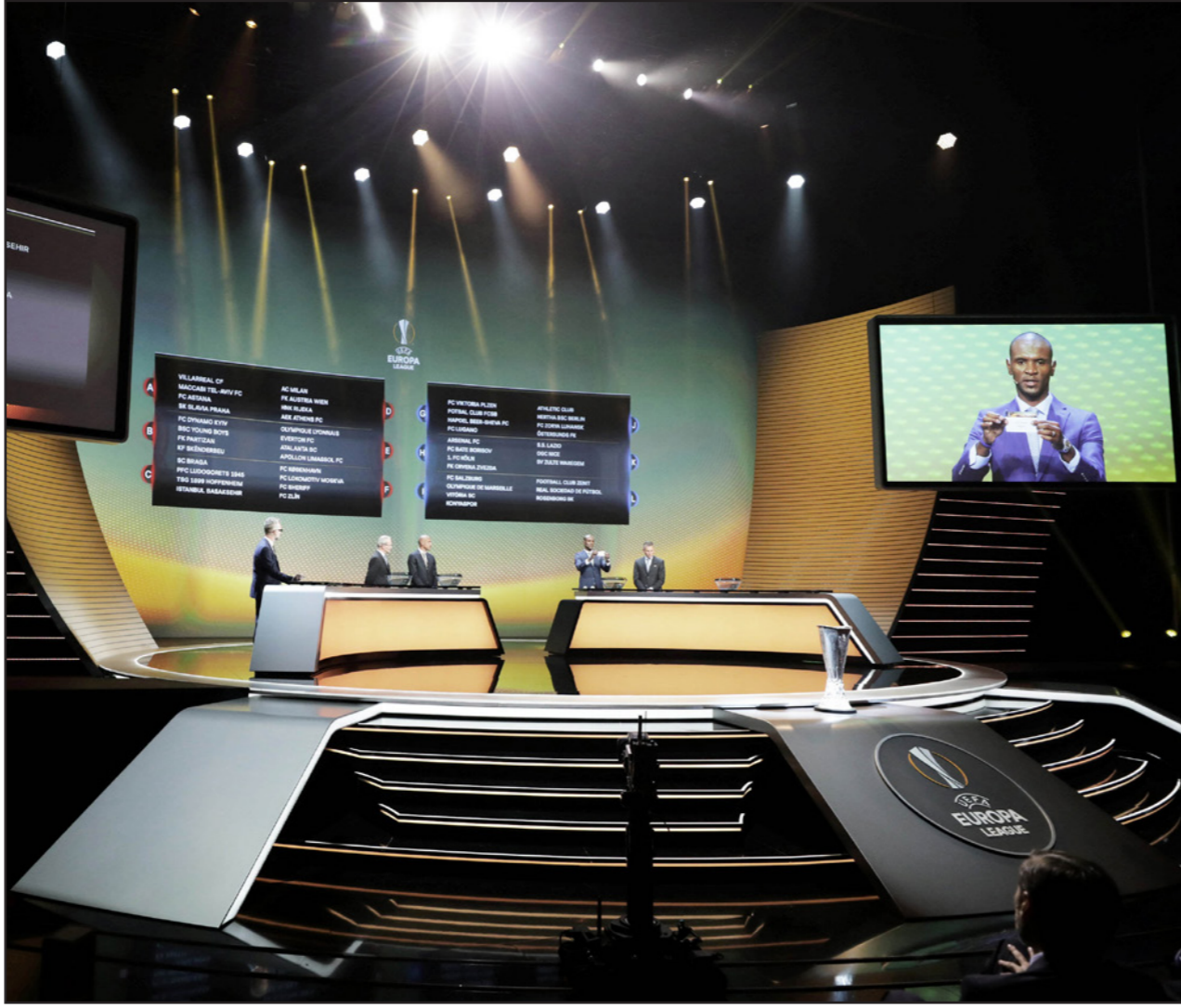
النجم الفرنسي ايريك ابيدال يظهر على الشاشة خلال مراسم القرعة

■ موناكو - د ب أ: أسفرت قرعة دور المجموعات لبطولة الدوري الأوروبي، عن وقوع ميلان في مجموعة «مطمئنة» للفرق الإيطالية المتوج بطلا أوروبا خمس مرات في تاريخه، كما أسفرت عن مواجهة إنكليزية-إلمانية بين أرسنال وكولون. ويتنافس ميلان، الذي صعد لدور المجموعات عبر الدور التمهيدي، مع أوستريا فيينا النمساوي ورييكا الكرواتي وأيك أثلين اليوناني في المجموعة الرابعة للبطولة التي تقام مبارياتها النهائية في ليون الفرنسية في 16 أيار/ مايو 2018. ويعد فوز ليفربول الإنكليزي على هوفنهايم الألماني الأربعاء في إياب الدور التمهيدي المؤهل لدور المجموعات بدوري أبطال أوروبا، وأتحت قرعة اللتويج باللقب الفرصة أمام كولون لرد الاعتبار من خلال مواجهة أرسنال، ويتنافس كولون وأرسنال ضمن المجموعة الثامنة، التي تضم أيضا باتي شهر التركي.