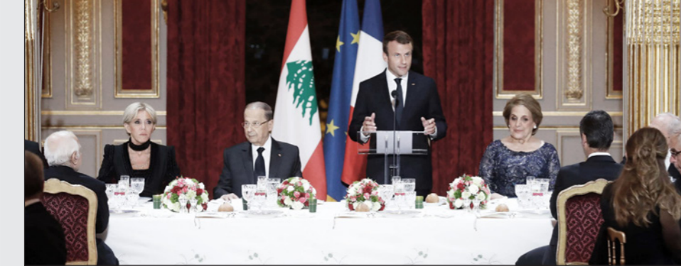
الرئيس الفرنسي إيمانويل ماكرون يلقي كلمة خلال عشاء أقيم تكريما للرئيس اللبناني ميشال عون

درجة الصليب الأكبر وهو أعلى وسام في الجمهورية الفرنسية. كذلك، منح الرئيس عون قرينة الرئيس الفرنسي السيدة بريجيت ماكرون وسام الاستحقاق اللبناني من درجة الوشاح الأكبر، فيما منح الرئيس ماكرون اللبنانية الأولى السيدة ناديا الشامي عون وسام الاستحقاق الفرنسي من درجة الصليب الأكبر، ووفقاً للتقليد المعتمد في زيارة الدولة، منح الرئيس اللبناني والفرنسي، أعضاء في الوفودين الرسمي أوسمة لبنانية للفرنسيين، وفرنسية للبنانيين.