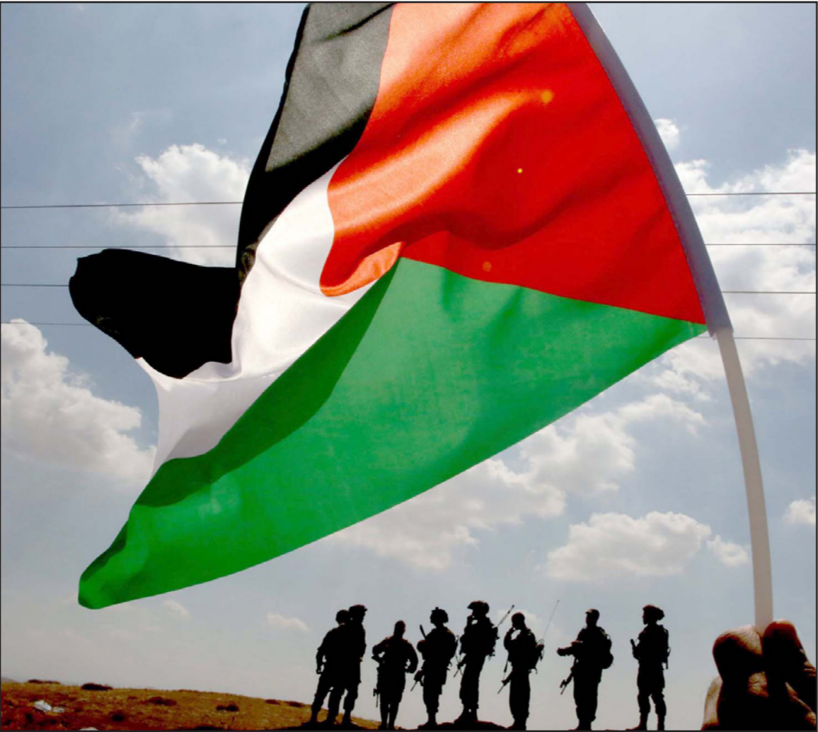
مظاهرون فلسطينيون يرفعون العلم خلال احتجاجات في قرية «طمون» قرب نابلس

وحاولت إسرائيل الآن تغيير معايير العضوية في التنظيم، لكن جهودها باءت بالفشل. وفي ضوء تمتع الفلسطينيين بتأييد كبير في الأمم المتحدة وفي غالبية المنظمات الدولية، ساد التقدير في إسرائيل بأن الإنتربول سيصادق على القرار رغم احتجاج إسرائيل.