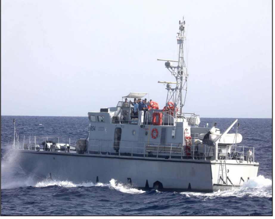
سفينة تابعة لخفر السواحل الليبية