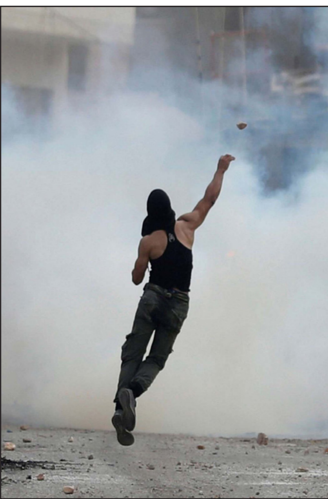
فلسطيني خلال اشتباكات مع قوات الاحتلال في الضفة الغربية

قررت تعطيل الدراسة حفاظا على سلامة الطلبة»، وأضاف سلطات الاحتلال تفرض عقابا جماعيا على سبعين ألف مواطن يسكنون في هذه القرى وعملت على إغلاق طرق فرعية ورئيسية تربط قريما بينها». وقال أفيخاي ادرعي المتحدث باسم الجيش الإسرائيلي إن قوات الجيش شنت حملة مداهمات واسعة في بدو وبيت سوريك خلال اليومين الماضيين. وأضاف في تغريدة على تويتر «قامت القوات بمسح هندسي لمنزل المخرب تمهيدا لهدمه وبالبحث عن