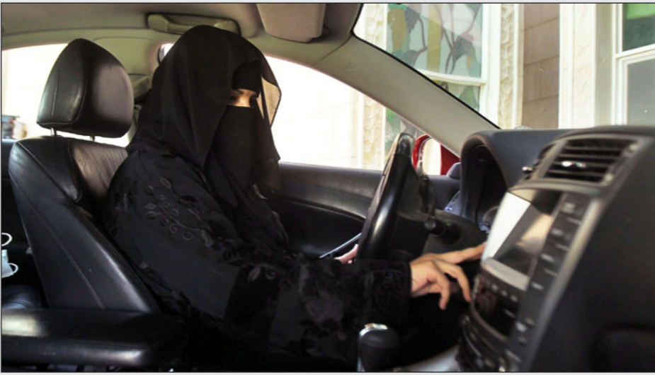
سعودية تستعد لقيادة سيارتها

موافقة المؤسسة الدينية عليه وحسب الأمر فإنه يتوافق مع متطلبات الشريعة. ففي الماضي عارض مشايخ الدين جلوس المرأة خلف مقود القيادة، وفي الأسبوع الماضي قال الشيخ سعد الحجري: إن المرأة لا تستحق القيادة لأنها «برع عقل»، وكان يعمل مسؤولاً للفتوى في منطقة عسير، جنوب البلاد وركزت خطبه على «شروط قيادة المرأة للسيارة»، وكان المفتي العام الراحل الشيخ عبد العزيز بن باز قد قال: إن «قيادة المرأة للسيارة يخالف التقاليد الإسلامية التي يتبناها المؤمنون السعوديون».