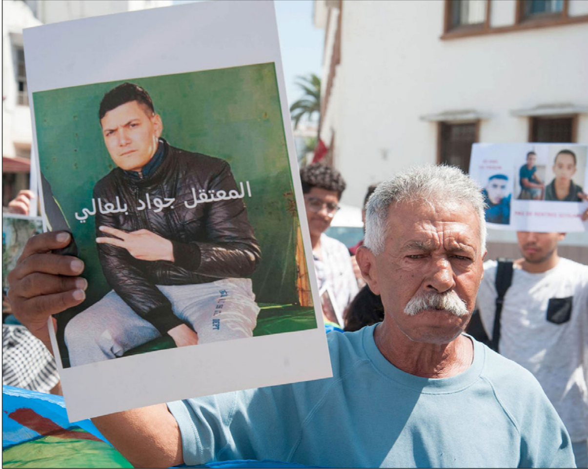
صورة ارشيفية لوقفة احتجاجية لعائلات حراك الريف

مرفوق بإعتصام أمام سجن عكاشة، جاء «بعد استفحال الانتهاكات التي تعرض لها معتقلو حراك الريف من إلتفاف لممتلكاتهم وتصويرهم عراة واستفزاز عائلاتهم أثناء الزيارة... ونظرا لوضعهم الصحي المتدهور جدا من جراء معركة الأبعاد الفارقة التي يخوضونها ومنهم من ضرب حتى عن الماء والسكر».