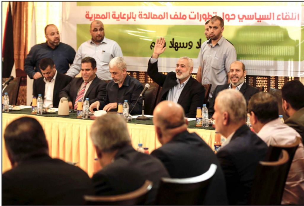
رئيس المكتب السياسي لحركة حماس اسماعيل هنية (وسط) خلال اجتماع مع قادة الحركة في غزة

غزة - «القدس العربي» من أشرف الهور: علمت «القدس العربي» أن قيادة حركة حماس ستستضيف الوفد الحكومي القادم إلى غزة الإثنين المقبل، في مستهل زيارته الهادفة إلى تسلم إدارة الوزارات بدلا من اللجنة الإدارية التي حلقتها من قبيل الحركة، والتي سيختلها عقد جلسة الحكومة الأسبوعية، في الوقت الذي أعلن فيه سامي خاطر عضو المكتب السياسي لحماس، استعداد حركته لـ «الشراكة في قراري السلم والحرب» بما في ذلك مسالة التفاوض، حال نفذت وطبقت اتفاقيات المصالحة. وفق الترتيبات القائمة حاليا، والتي شملت موعد قدوم الوفد الحكومي والترتيبات الأمنية لتلقي الوفد، ومكان إقامته، حيث سيقيم على فندقين كبيرين في مدينة غزة، فإسناد تلك الترتيبات تشمل استضافة قيادة حركة حماس الوفد الحكومي في مستهل الزيارة، التي ستدوم لمدة يومين متتاليين، تشمل عقد الحكومة جلساتها الأسبوعية. ومن المحتمل أن يكون اللقاء في منزل رئيس الأمنة لتلقي الوفد، ومكان إسماعيل هنية، على غرار الزيارة السابقة التي قامت بها الحكومة قبل ثلاث سنوات، في خطوة تريد من خلالها حركة حماس تأكيدها على المضى قدما في تطبيق تفاهات القاهرة الأخيرة، التي