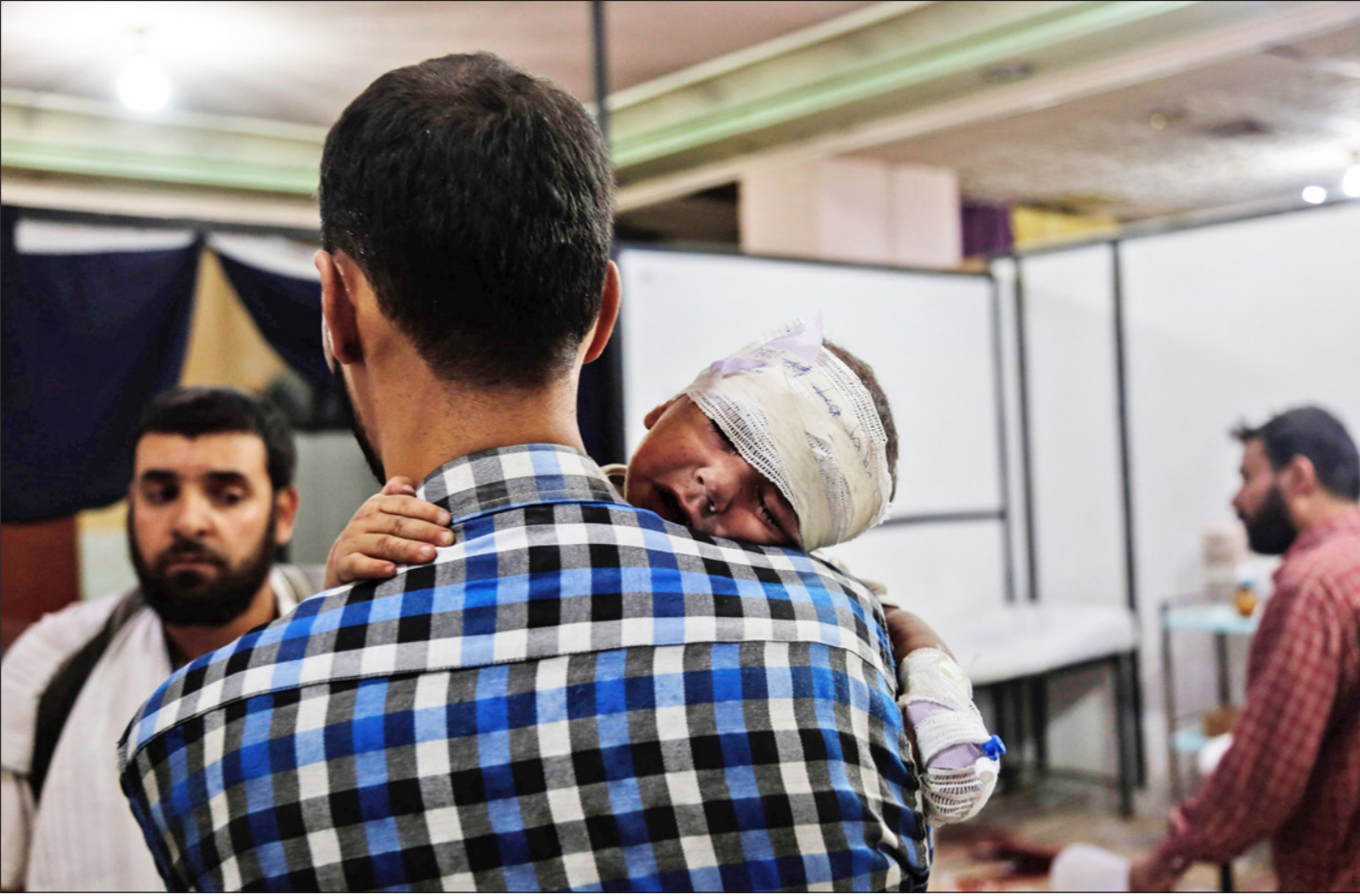
أب سوري يحاول إسعاف ابنه الذي جرح بقصف للنظام في دوما

العراق بأنهم حماة المواقع الشيعية المقدسة ويليقون بحماة الأضرحة على مواقع الكترونية تابعة للحرس الثوري. وقالت وسائل إعلام حكومية إن الزعيم الأعلى آية الله علي خامنئي أدي صلاة الجنازة على نعش حججى والتقى بأسرته. واستعاد الحرس الثوري جثمان حججى في إطار اتفاق بين تنظيم الدولة والجيش السوري وجماعة حزب الله اللبنانية.