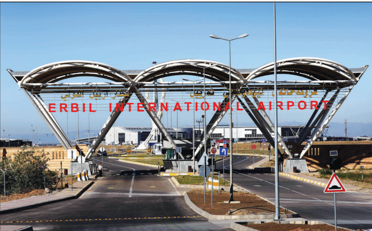
مطار أربيل ويبدو خاليا أمس من المسافرين بعد توقف الرحلات الجوية