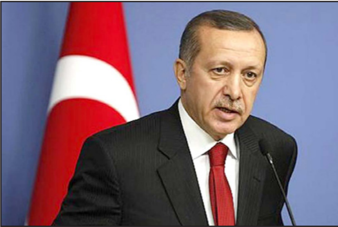
الرئيس التركي رجب طيب أردوغان

الأكراد في شمال العراق من العقوبات التي ستفرض عليها تركيا. كما قال إن إسرائيل وحزب العمال الكردستاني، هما العمان الوحيدان اللذان يدعمان استقلال كردستان، الأمر الذي يدل على عدم وجود شرعية دولية لهذه الخطوة. وأضاف: «عندما نرفض عليهم العقوبات ولا يتبقى لهم أي مصدر رزق، فليذهبوا الرؤى ما يمكن لإسرائيل تقديمه لهم، مؤكداً أن كل الخيارات مطروحة على الطاولة، في مسالة إحباط إعلان استقلال العراق الكردي في العراق، وأن الأمر لن يتوقف على عمليات عسكرية جوية وبرية، وكانت كردستان قد تعارضت تركيا وإيران هذا الاستفتاء بحدوثه، ومعارضة بغداد والتخوف الدولي من أن يفقد إلى عدم الاستقرار في المنطقة، ذلك تعارضت تركيا وإيران هذا الاستفتاء بحدوثه، خفية أن يشجع طموحات الأكراد الذين يعيشون في الدولتين، على الانفصال، وذلك رغم كون الاستفتاء غير ملزم وليس