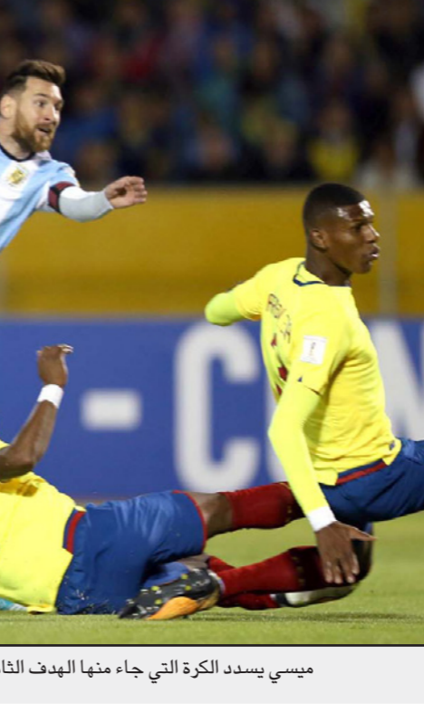
ميسي يسدد الكرة التي جاء منها الهدف الثاني للأرجنتين