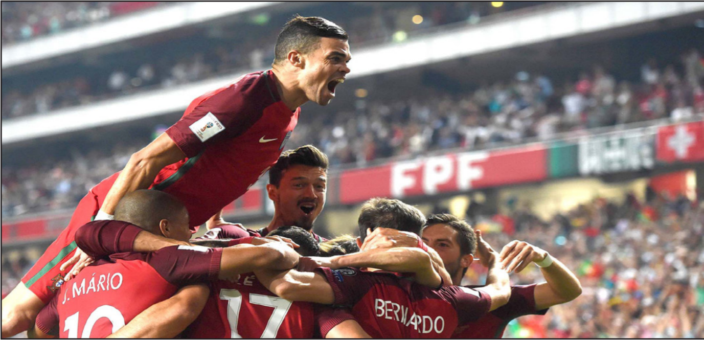
نجوم المنتخب البرتغالي يحتفلون عقب فوزهم على سويسرا وتأهلهم المباشر الى النهائيات

بازل في المباراة الأولى في سبتمبر/ أيلول من العام الماضي، ومضت قدما لتفوز بكافة المباريات التسع قبل مواجهة تشونو، بينما فازت البرتغال بكافة المباريات الثماني التي تلقت مواجهتها الأولى مع سويسرا. وبعيدا عن الخسارة بركلات الترجيح من تشيلي في كأس القارات في يونيو/ حزيران الماضي كانت هزيمة سويسرا الوحيدة للبرتغال في لقاء رسمي منذ تولى المدرب فرناندو سانتوس القيادة في سبتمبر/ أيلول 2014. وستخوض سويسرا الآن الملحق الذي سيقام على مباراتين في نوفمبر/ تشرين الثاني المقبل أمام وصيف بطل أحد المجموعات الأخرى بحثا عن مكان في روسيا. وسيتم سحب قرعة الملحق الأوروبي الثلاثاء المقبل. وكان رونالدو قريبا من تسجيل هدفه رقم 16 في مشوار