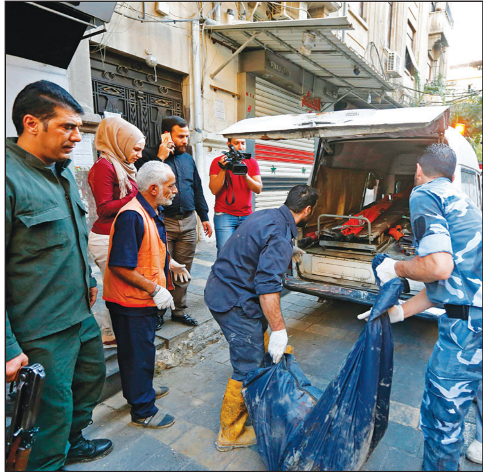
قوات أمن سورية تحمل بقايا انتحاري بعد هجوم على قسم للشرطة في وسط دمشق أمس

■ دمشق - بيروت - وكالات: قالت وسائل إعلام النظام السوري إن ثلاثة مهاجمين فجرُوا أنفسهم قرب مقر للشرطة في وسط العاصمة دمشق، أمس الأربعاء، في ثاني هجوم من نوعه يستهدف العاصمة هذا الشهر. ونقل التلفزيون النظام عن وزارة داخلية القول إن الانفجارات أسفرت عن مقتل شخصين وإصابة ستة آخرين. وأضاف التلفزيون نقلاً عن قائد الشرطة أن المهاجمين انتحاريين حاولوا اقتحام مركز قيادة الشرطة واشتباكاً مع الحراس قبل أن يفجروا الأحمرة الناسفة، في شارع خالد بن الوليد، لكن خارج المركز. ونشرت وسائل الإعلام أن الشرطة حاصرت المهاجم الثالث خلف مبنى المركز حيث فجر نفسه قرب مدخل سوق للملابس. وقال اللواء محمد خير إسماعيل قائد شرطة دمشق في تصريحات أمام مقر الشرطة «التحقيقات جارية في الحادثة والوضع عاد إلى طبيعته في شارع خالد بن الوليد». وأوردت وكالة «أمن» التابعة لتنظيم «الدولة الإسلامية» نبأ الهجوم دون أن تعلن مسؤولية التنظيم عنه. وأفيد في دمشق عن فرض قوات الأمن طوقاً مشدداً حول المكان المستهدف في شارع عادة ما يشهد اكتظاظاً، ويأتي هذا الهجوم بعد أقل من أسبوعين على تفجيرين انتحاريين استهدفاً قسماً للشرطة في حي الميدان الدمشقي، ما تسبب بمقتل 17 شخصاً بينهم 13 عنصراً من الشرطة، في اعتداء تيناً تنظيم «الدولة». ومنذ عام 2011، بقيت دمشق نسبياً بمنأى عن النزاع الدامي الذي تشهده البلاد، إلا أنها تتعرض على الدوام للإطلاق قذائف وصواريخ من مقاتلي الفصائل المعارضة المحصنين على أطراف العاصمة، كما تعرض مراراً لهجمات انتحارية.