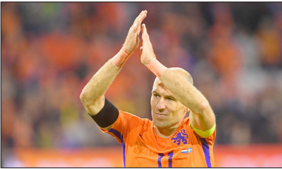
النجم روبن يودع الجماهير الهولندية عقب اعلانه اعتزال اللعب الدولي

وأخذ روبن (33 عاما) قرار اعتزاله الدولي وعدم استكمال المشوار مع منتخب بلاده. وجاء الإعلان في اليوم الذي سجل فيه هدفا في مرمر السويد في الجولة العاشرة والأخيرة للمجموعة الأولى، إلا أن الفوز بهدفين نظيفين لم يمكن هولندا من التأهل. وبدأ روبن مشواره مع المنتخب الهولندي عام 2003 حيث شارك في 96 لقاء سجل خلالها 37 هدفا. ولم يتمكن روبن خلال مشواره الدولي من الفوز بكأس العالم أو كأس الأمم الأوروبية. وحصل النجم الهولندي مع منتخب «الطواحين» على المركز الثاني في كأس العالم التي أقيمت في جنوب إفريقيا عام 2010. تلاها الفوز بالمركز الثالث في مونديال البرازيل الأخير عام 2014.