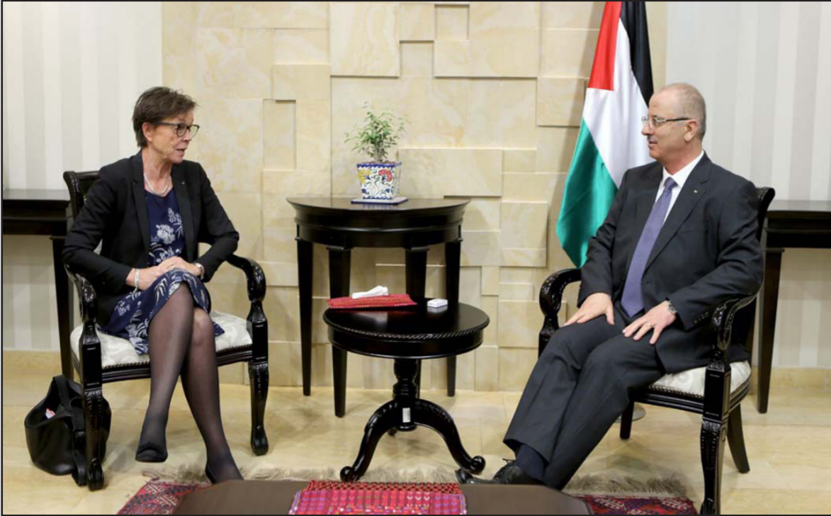
رامي الحمد لله رئيس الوزراء الفلسطيني لدى استقباله مع نائبة وزير خارجية السويد أنيكا سويدر

ورأت الوزارة في صمت الخارجية الأمريكية عن هذه التفوهات، إشارة سيئة في وقت لا يكف فيه منسوق عملية السلام جاريدي كوشنر عن وضع الاشتراطات على قياداتنا وشعبنا.