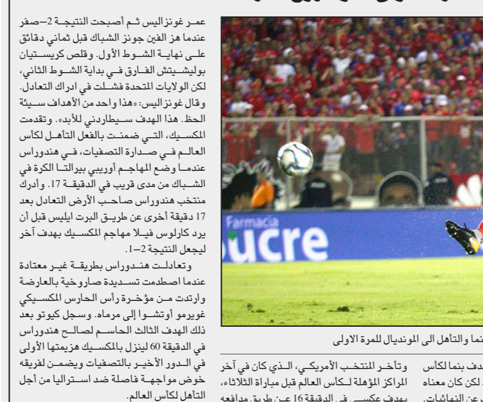
رومان تورييس يسدد الكرة التي جاء منها هدف الفوز لبلنما والتأهل الى المونديال للمرة الأولى