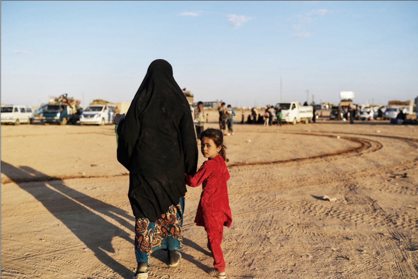
تازحون هرباً من القتال في دير الزور في اتجاه مستقبل مجهول

وأوضح الأسعد انه بذلك تكون المنطقة الشرقية مع البادية تحت سيطرتهم وتكون كل العابر تحت تصرفهم، وكذلك وجود الميادين في المنطقة الغربية من أغلب أبار