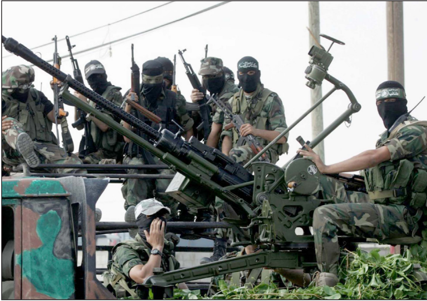
صورة أرشيفية لمقاتلين من كتائب القسام في غزة