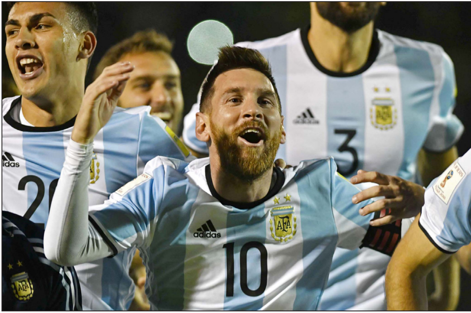
ميسي يحتفل مع زملائه في الفوز على الاكوادور والتأهل الى المونديال

■ عواصم - د ب أ: ارتدى النجم الأرجنتيني ليونيل ميسي ثوب الإنقاذ مجددا وسجل ثلاثة أهداف (هاتريك) يقوده منتخب بلاده إلى نهائيات كأس العالم بالفوز الشين 1/3 على مضيفة الإكوادوري في الجولة الأخيرة من تصفيات أمريكا الجنوبية. كما لحق أوروغواي وكولومبيا بركب المتأهلين إثر فوز الأول على نظيره البوليفي 2/4 وتعادل الثاني مع مضيفة البيرو في 1/1، وفازت البرازيل على تشيلي 3/0 وصفت باراغواي أمام ضيفتها فنزويلا صفرًا. وكان المنتخب البرازيلي حجز مقعد ه في النهائيات بعدما، فيما انتزعت أوروغواي وكولومبيا والأرجنتين مقاعدها في المونديال من خلال الجولة الثامنة عشرة الأخيرة، واحتل المنتخب التشيلي المركز السادس بفارق الأهداف فقط خلف نظيره البيرو في، لتظل فرصة بيرو قائمة في التأهل للمونديال من خلال الملحق العالمي الذي يلتقي فيه المنتخب النيوزيلندي بطل اتحاد أوقيانوسيا.