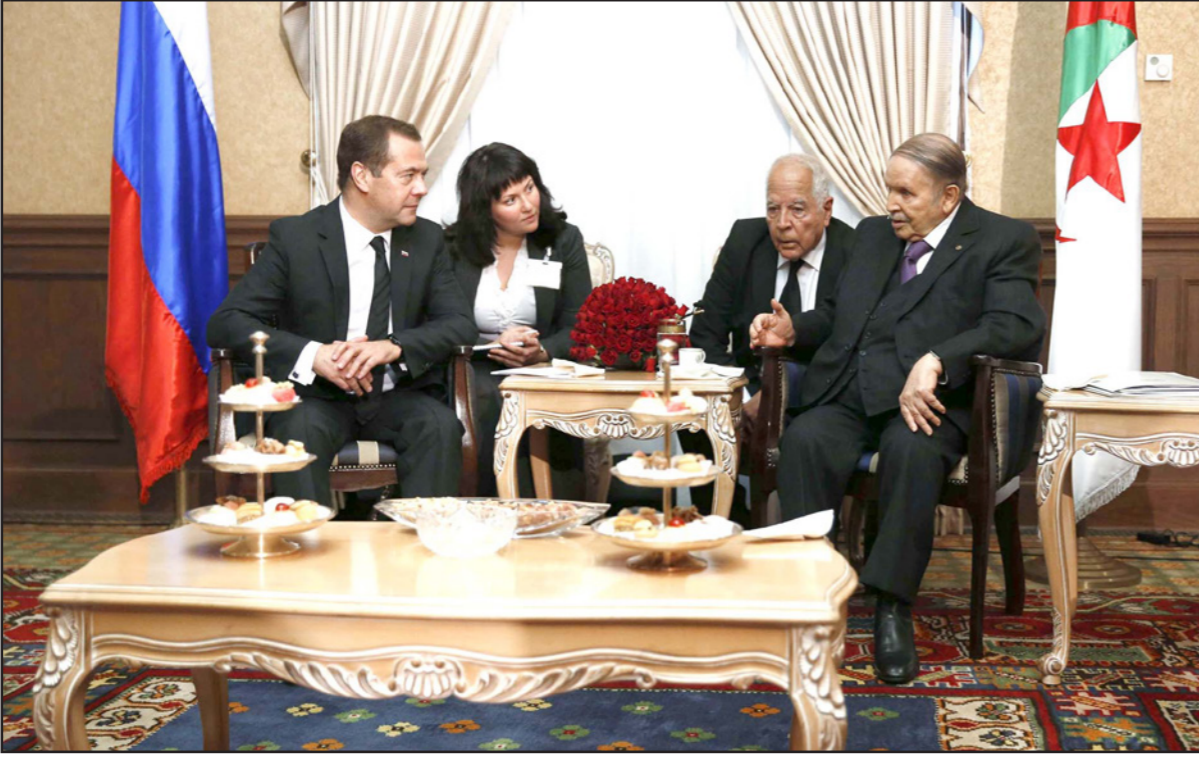
الرئيس الجزائري عبد العزيز بوتفليقة خلال استقباله رئيس الوزراء الروسي ديميتري ميدفيديف

أولاند راجع لأسباب خارجة عن نطاقه، وحتى الرئيس الفنزويلي نيكولاس مادورو الذي زار الجزائر وتوقف فيها «لأسباب تقنية» عدة مرات خلال الأيام الماضية لم يستقبل من طرف الرئيس الجزائري. وبظهوره في استقبال ميدفيديف، سيغلق الرئيس بوتفليقة، ولو مؤقتا، باب الحديث عن وضعه الصحي، خاصة وأنه عدم استقباله لمسؤولين أجانب زاروا الجزائر، طوال الأشهر الثمانية الماضية أمر استغلته المعارضة لتبرير موقفها الداعي إلى تطبيق المادة 102 من الدستور، التي تخص الآليات التي يجب اتباعها لعزل الرئيس لأسباب صحية، مؤكدة أن عدم استقباله لضيوف أجانب وعدم قيامه بزيارات إلى الخارج دليل على أن وضعه الصحي لا يمكنه من أداء مهامه المنصوص عليها دستوريا على أكمل وجه، فيما كانت الحكومات، وأحزاب الموالاة تؤكد أن الرئيس بخير، وأنه يعمل بشكل عادي، بدليل إشرافه على اجتماع لجلس الوزراء، معتبرة أن المعارضة تعمل على زعزعة استقرار البلاد ومؤسساتها، بعد أن فشلت في الوصول عن طريق الصدوق.