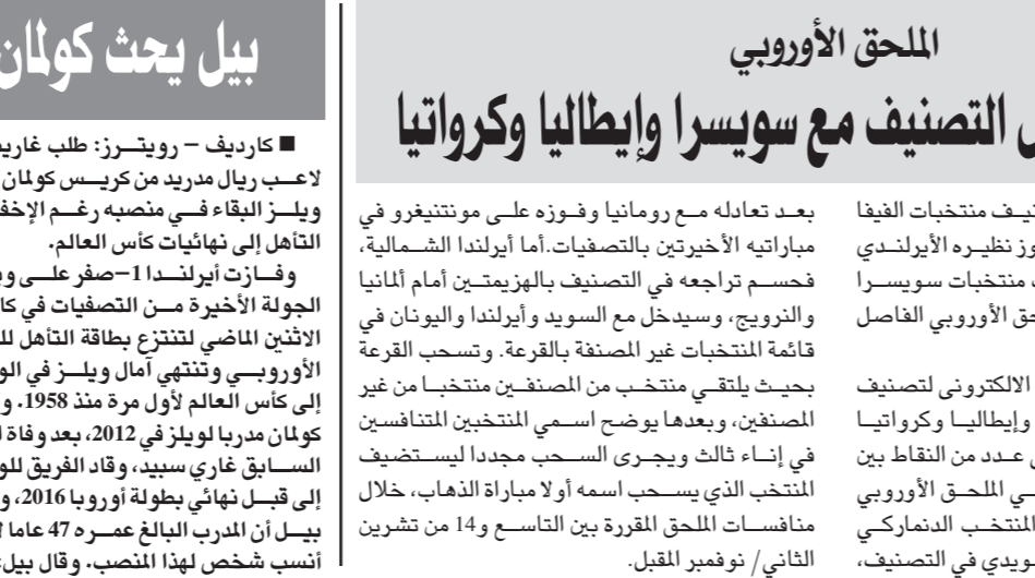
النجم روبن يودع الجماهير الهولندية عقب اعلانه اعتزال اللعب الدولي

■ كارديف - رويترز: طلب غارث بيل لاعب ريال مدريد من كريست كولمان مدرب ويلز البقاء في منصبه رغم الإخفاق في التأهل إلى نهائيات كأس العالم. وفسارت أيرلندا 1-0 صفر على ويلز في الجولة الأخيرة من التصفيات في كارديف الإثني الماضي لتنتزع بطاقة التأهل للملحق الأوروبي وتنتهي آمال ويلز في الوصول إلى كأس العالم لأول مرة منذ 1958. وأصبح كولمان مدربا لويلز في 2012، بعد وفاة المدرب السابق غاري سيد، وقاد الفريق للوصول إلى قبة نهائي بطولة أوروبا 2016. ويعتقد بيل أن المدرب البالغ عمره 47 عاما لا يزال أنسب شخص لهذا المنصب، وقال بيل: «بكل