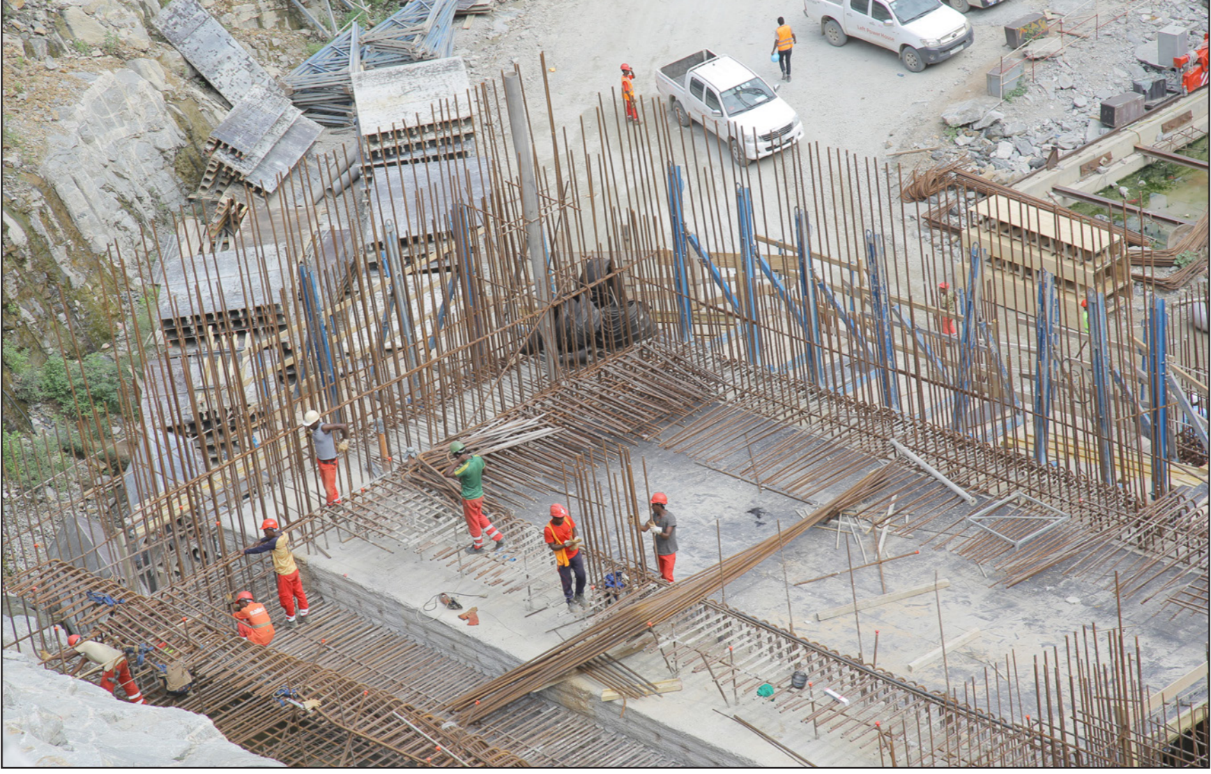
عملة بناء سد النهضة الإثيوبي في مراحلها الأخيرة