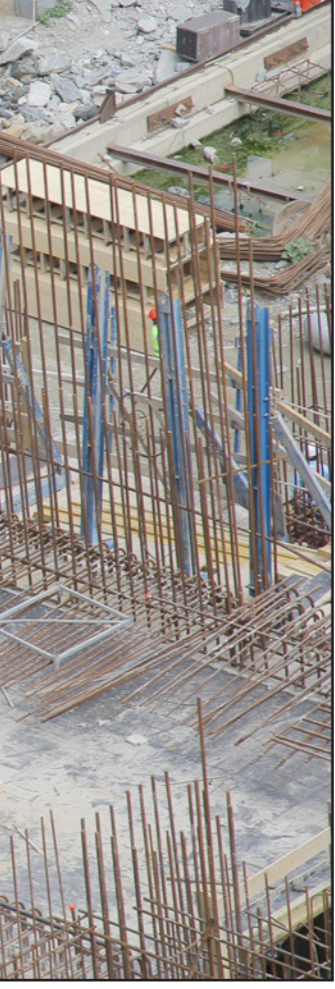
عملة بناء سد النهضة الإثيوبي في مراحلها الأخيرة

كذلك، دعا رئيس لجنة الشؤون الإفريقية في مجلس النواب، السيد فليفل، القيادة السياسية للتحرك على المستوى الدولي لحل أزمة سد النهضة، وإعداد ملف في تقديمه لمجلس الأمن الدولي، والمحكمة الجنائية الدولية؛ لوقف أعمال بناء السد، واتخاذ إجراءات ضد حكومة إثيوبيا، لتعنتها. وقال، في تصريح صحافي: أمس، إن «النظام السوداني والحكومة الإثيوبية،