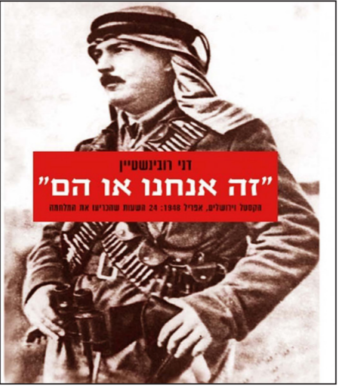
«זה אנחנו או הם» ד"ר חנוכי

وشملت الخطة التي أنجزت تحت إشراف رئيس بلدية الاحتلال في القدس نير بركات، تفجير وتدمير ستة مبان وعمارات سكنية، كل منها على الأقل مؤلف من ستة أو سبعة طوابق. ومن أوامر الخطة، أن الأجهزة الأمنية في الجيش والشرطة وجهاز «الشاباك»، تعزّم استخدام المتفجرات التي ستسبب الانفجار وانهايار جميع المباني. وتوقعت التقارير الإسرائيلية بعد الكشف عن الخطة أن يحدث الانفجار موجات واسعة من الارتدادات والاهتزازات، لذلك تقرر أن يتم إخلاء مئات السكان الذين يعيشون بالقرب من المباني قبيل البدء بعملية التفجير.