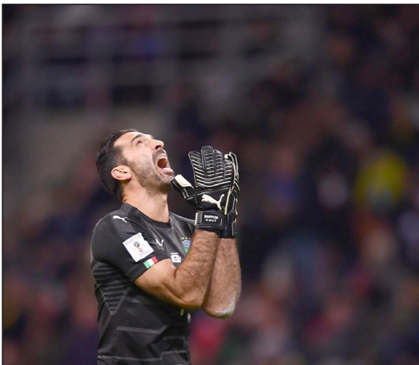
الأسطورة بوفون أنهى مسيرته مع المنتخب الإيطالي بخيبة كبيرة

روما - د ب أ: يجتمع الاتحاد الإيطالي لكرة القدم اليوم، بعد إخفاق منتخب البلاد في الوصول إلى كأس العالم 2018 لتحليل الوضع الراهن واتخاذ القرارات المناسبة. وقال كارلو تافيكيو: «دعوت لعقد اجتماع غدا بهدف تحليل الموقف بشكل مفصل واتخاذ قرارات بشأن المستقبل». وأضاف: «نشعر بحزن عميق وبخيبة أمل لعدم تأهلنا للمونديال، إنه إخفاق رياضي يحتاج إلى حل شامل. ويعييب المنتخب الإيطالي، بطل العالم أربع مرات، عن المونديال للمرة الأولى منذ 60 عاما إثر فشله في الفوز على السويد في الملحق الفاصل. وكشفت الصحف الإيطالية أن مدرب المنتخب، جانيبيرو فينتورا، سيرحل عن منصبه. واعتذر فينتورا، لاجماهير بلاده، لكنه في الوقت نفسه لم يشر إلى إمكانية رحيله عن منصبه. وقال: «ماذا عن المستقبل؟ سأحدث مع تافيكيو وسنصل إلى اتفاق». ورغم ذلك، تكهنت مختلف الصحف الإيطالية أن المدرب سيتقدم باستقالته.