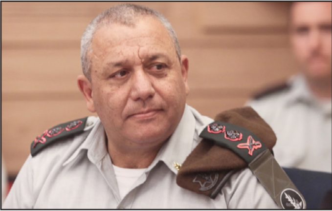
رئيس الأركان غادي آيزنكوت