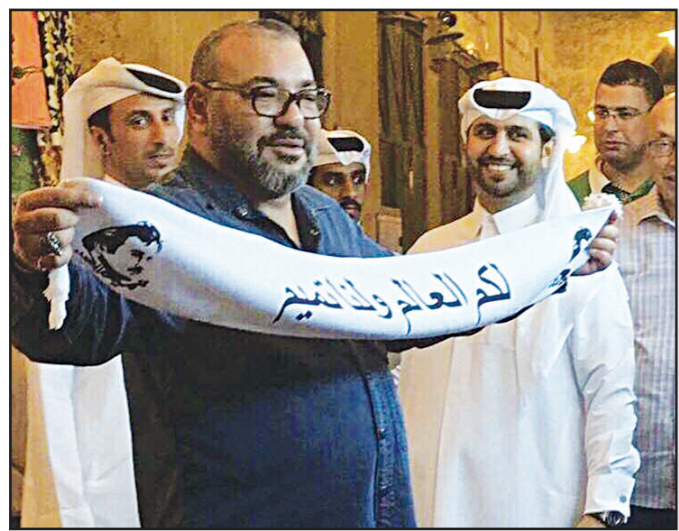
ملك المغرب محمد السادس خلال زيارته للدوحة

الدول سعت لإجهاد تنظيم بلاده لكأس العالم عام 2022. واستقبل أمير قطر، أمّس، الرئيس التركي رجب طيب أردوغان الذي زار الدوحة رفقة وفد على المستوى. وكان الأمير قد استقبل مساء الإثنين العاهل المغربي محمد السادس الذي تناقلت حسابات قطر عبر موقع «تويتر»، صورته وهو يرفع وشاحاً كتب عليه: «لكم العالم ولنا تميم». (تفاصيل ص 10)