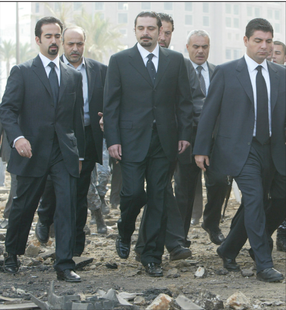
أرشيعة رئيس الوزراء اللبناني المستقيل سعد الحريري (وسط) وعلى يمينه شقيقه بهاء الحريري

إلى البلاد، وإذا قررت السعودية تجنيد أخواها في الخليج للانضمام إلى العقوبات فإن اقتصاد لبنان سيتلقى ضربة قاضية.