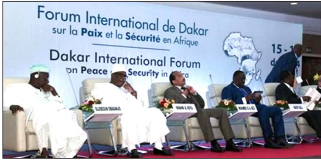
منتدى «داكار» الدولي السنوي للسلام

وفي هذا السياق، قال الرئيس المالي إبراهيم بوبكر كيتا، الذي يتولى الرئاسة الدولية لجموع دول الساحل: إن الإرهاب يزرع الخوف، لكننا لن نخاف، وستستمر في العمل من أجل التنمية. وأضاف كيتا، خلال كلمته أمام المنتدى، مخاطباً الجماعات المسلحة الناشطة في المنطقة: نحن لسنا برابرة، ولسنا هنا من أجل الأسلمة، وتوسع مجموعة دول