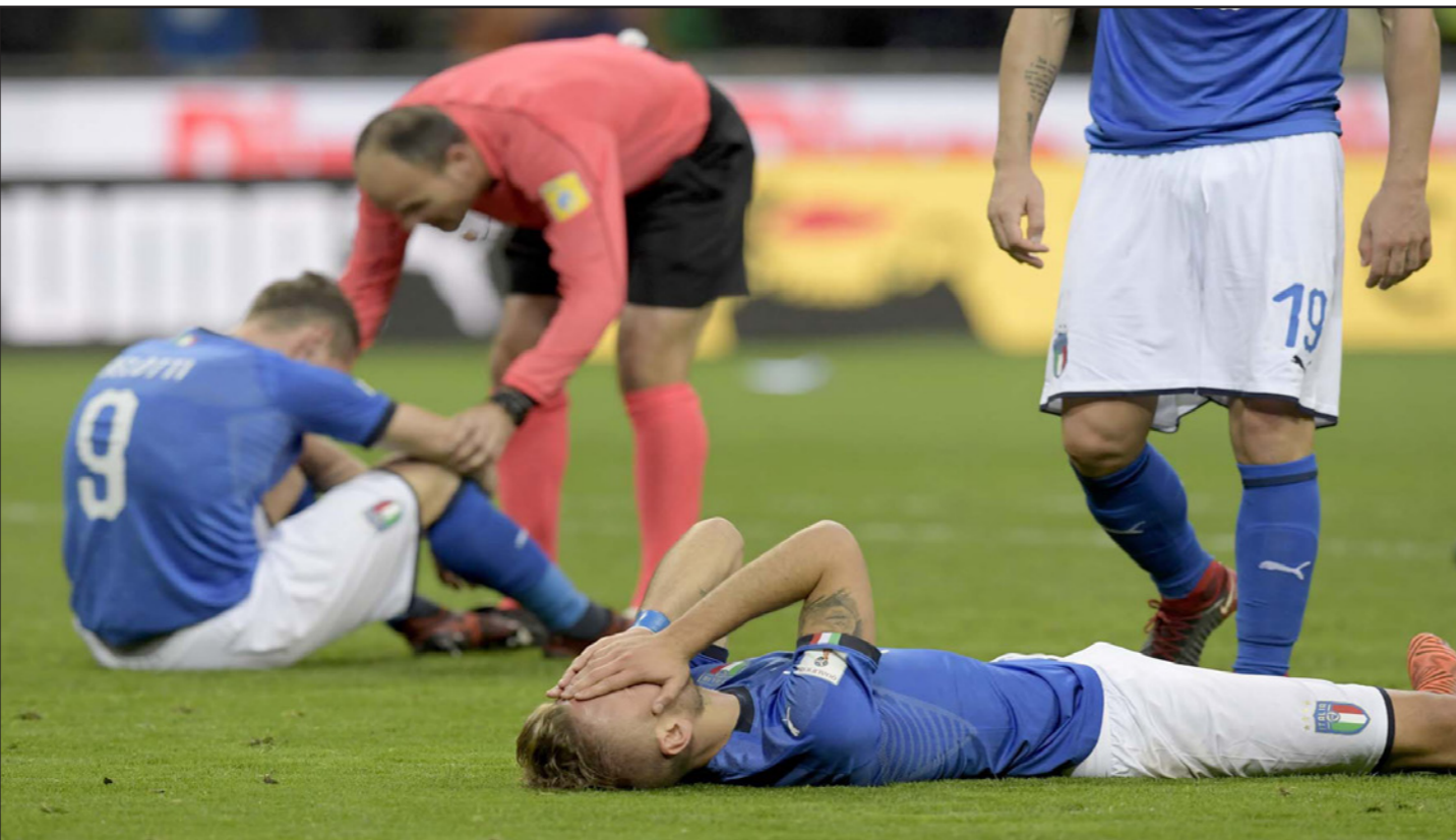
لاعب المنتخب الإيطالي متهارون بعد الاخفاق في الفوز على السويد والتأهل الى المونديال

روما - رويترز: أخفقت إيطاليا في بلوغ كأس العالم لأول مرة في 60 عاما بعد تعادلها بدون أهداف على أرضها مع السويد التي حجزت مكانها في نهائيات روسيا بالفوز 1-0 صفر في مجموع مبارياتي ملحق التصفيات.