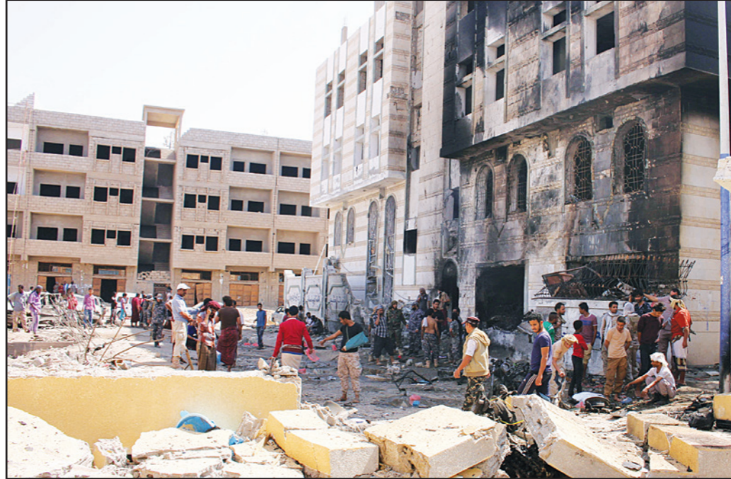
يمنيون يتفقدون موقعا تعرض لكصف قوات التحالف في صنعاء أمّس

في مطار صنعاء الدولي، أمام الرحلات، جراء غارتين شنتهما مقاتلات التحالف العربي على المطار. (تفاصيل ص 10 وراي القدس ص 23)