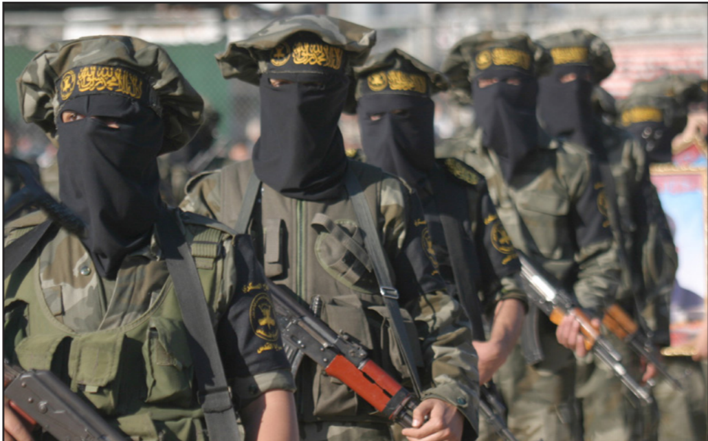
عرض عسكري لعناصر من الجهاد الإسلامي في غزة

■ تنزّل قيادة الجهاد الإسلامي بأمان في دمشق، بعيدة منقطعة عن الميدان، يصعب عليها فرض إمرتها على ليشطاتها في القطاع، وفحصا عن ذلك، أصبح ضبط التجسس ولا تؤدي إلى التصعيد حتى لو هاجمها الجهاد.