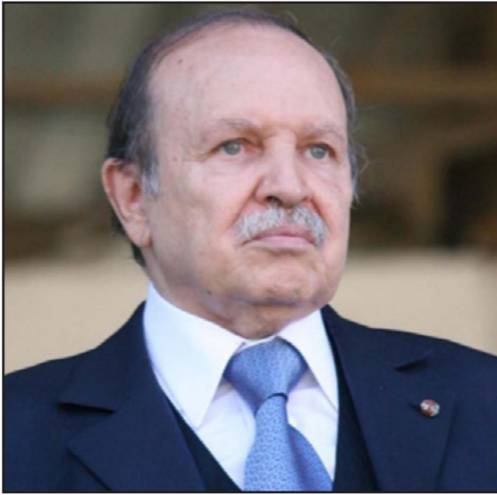
عبد العزيز بوتفليقة

الرئيس الفرنسي إيمانويل ماكرون يزور الجزائر الشهر المقبل!