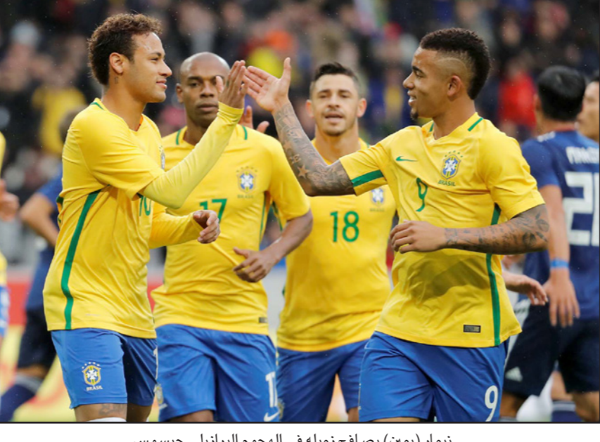
نيمار (يمين) يصافح زميله في الهجوم البرازيلي جيسوس

لندن - رويترز: قال داني ألفيس مدافع البرازيل إن مواطنه المهاجم غابرييل جيسوس يملك القوة الفنية والذهنية للسيسر على خطى رونالدو الفائز سابقا مع المنتخب بكأس العالم. ويبدأ جيسوس مشواره في إنكلترا بشكل رائع مع مانشستر سيتي، ويات المهاجم البالغ 20 عاما بشكل فنانا قويا مع نيمار، وساهما في التأهل بسهولة إلى نهائيات كأس العالم. وقال ألفيس قبل المباراة الودية أمام إنكلترا عن مقارنة زميله بالمهاجم الفائز ثلاث مرات بجائزة الفيفا لأفضل لاعب في العالم: «لم أكن أمرح عندما قلت إنه سيكون رونالدو الجديد». وأضاف: «إنه لاعب رائع وسيستحسن بشكل أكبر... لا يعانى من أي ضغط خلال ما حققه وأجزه... هو يفعل ما يجبه».