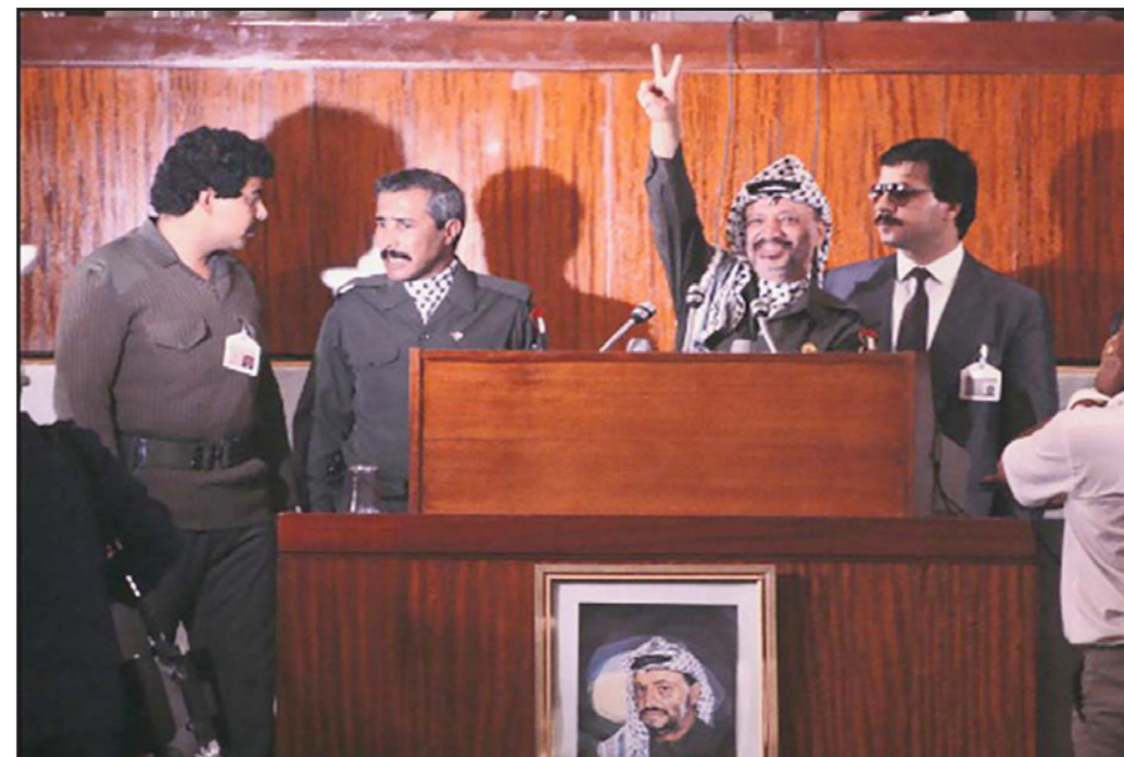
عرفات يرفع يده في إشارة النصر لدى إعلان وثيقة الاستقلال في دورة المجلس الوطني في الجزائر

وشمل الخطاب وقتها عروج الرئيس الراحل الذي صادفت ذكرى وفاته الـ13 قبل أيام، على المناسبة التي لحقت بالشعب الفلسطيني، جراء الاحتلال الإسرائيلي الذي سلب الأرض الفلسطينية من سكانها الأصليون، وإلى نضال الشعب الفلسطيني للحصول على الحرية والاستقلال. وأكد أن «دولة فلسطين هي للفلسطينيين أينما كانوا، وفيها يطورون هويتهم الوطنية والثقافية، ويمتعون بالمساواة الكاملة في الحقوق، تصان فيها معتقداتهم الدينية والسياسية وكرامتهم الإنسانية». وجاء أيضا في الخطاب الذي مثل «وثيقة الاستقلال» أن «دولة فلسطين دولة عربية هي جزء لا يتجزأ من الأمة العربية، من تراثها وحضارتها، ومن طموحها الحاضر إلى تحقيق أهدافها في التحرر والتطور والديمقراطية والوحدة». وأعلن الرئيس الراحل أن دولة فلسطين لتتزم بمبادئ الأمم المتحدة وأهدافها وبإعلان العالمي لحقوق الإنسان، والتزامها كذلك بمبادئ عدم التمييز وديمقراطية. ويحيي الشعب الفلسطيني هذه الذكرى في هذا العام في ظل تحركات سياسية تقومها الإدارة الأمريكية، لإعادة إطلاق مبادرة سياسية تقومها لوفيات سلام جديدة، بعد توقف دام لأكثر من ثلاث سنوات، حيث يعمل الجانب الفلسطيني حاليا، بعد حصوله على عضوية العديد من المؤسسات الدولية، على تجسيد قيام دولة فلسطينية كاملة السيادة تحظى باعتراف دولي كامل، على حدود 67 تكون القدس الشرقية عاصمة لها، رغم الاعتراض الأمريكي والإسرائيلي لهذه التحركات التي يقودها الرئيس محمود عباس، في مسعى منه لتجاوز «الفتوى» الأمريكي، الذي استخدم في وقت سابق لوقف تحقيق الحلم الفلسطيني.