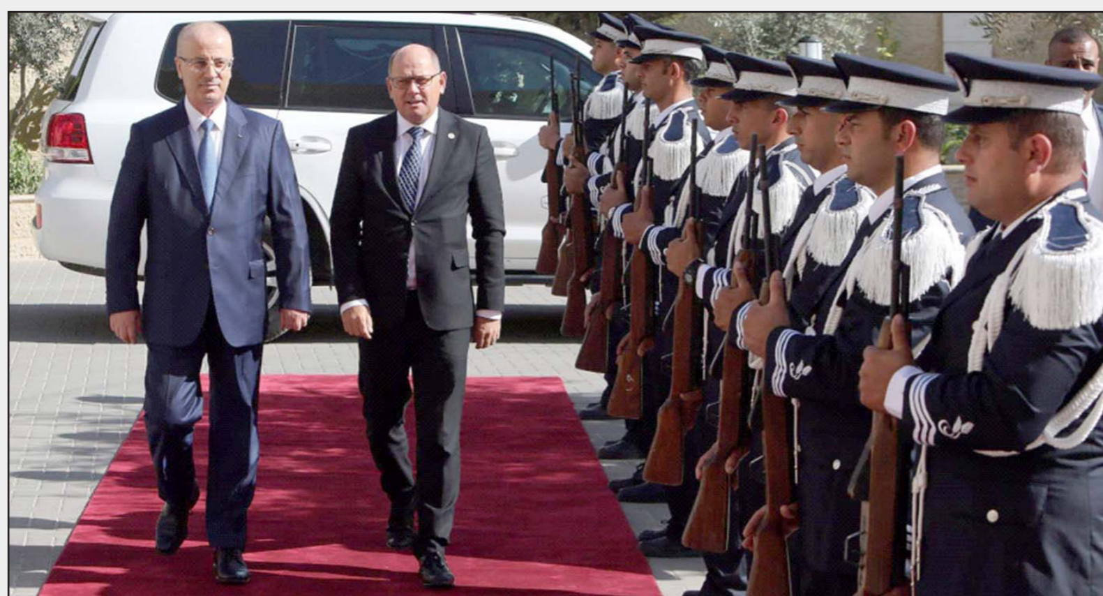
رامى الحمد الله يستعرض مع رئيس البرلمان السعودي إبراهيم آملين حرس الشرف في رام الله أمس

كشف الرياض وزير الخارجية الفلسطيني أن المملكة العربية السعودية لن تقدم على التطبيع مع إسرائيل بأي شكل كان قبل حل القضية الفلسطينية. وأعلن أن الملك سلمان أكد ذلك للرئيس الفلسطيني محمود عباس (أبو مازن) خلال إجتماعهما في الرياض الأسبوع الماضي، وأن المملكة تقدم كل الدعم وعلى المستويات كافة للفلسطينيين بغية الوصول إلى حل قائم على أساس الشرعية الدولية وقراراتها. جاءت هذه التصريحات خلال استقباله لرئيس البرلمان السعودي إبراهيم آملين في الوفد المرافق له، في مكتبه في مقر وزارة الخارجية في رام الله، حيث استعرض آخر مستجدات الأوضاع على الساحتين الفلسطينية والعربية، مشيرا إلى قمة الكويت التي عقدت مناقشة أوضاع أطفال فلسطين تحت الاحتلال الإسرائيلي، وامتعضه من المشاركة الأروبية الجوفلة التي جاءت كذلك بناء على طلب أحد الأطراف الأروبية، مبينا أن ما يقمعه الفلسطينيون حقا تقع على الأرض. كما قدم الملك شرحا مفصلا حول كل الجهود الدولية وعلى رأسها الأمريكية الهادفة لترح خطة سلام إقليمية، تضمن بناء السلام والتنسيق في مجال الأمن الذي يرمي لمحاربة الإرهاب وبعائه ومموليه، كما تناول المصالحة الفلسطينية وتطوراتها، مشددا على أن المصالحة هي خيار فلسطيني إستراتيجي تعمل القيادة الفلسطينية على إنجازه بشكل قوي وروشن كي يقود دقة العمل الوطني وتراكماته نحو الحرية والاستقلال وتقرير المصير وبناء مؤسسات الشعب الفلسطيني ونهضته، بما يتناسب ومؤهلاته ورسيدته التاريخي والحضاري. بدوره أكد الوفد البرلماني السعودي، دعم السويد للشعب الفلسطيني وقضيته، واستمرار الدعم السياسي والاقتصادي وفي المجالات كافة، في غضون ذلك أكد الحكومة الفلسطينية خلال