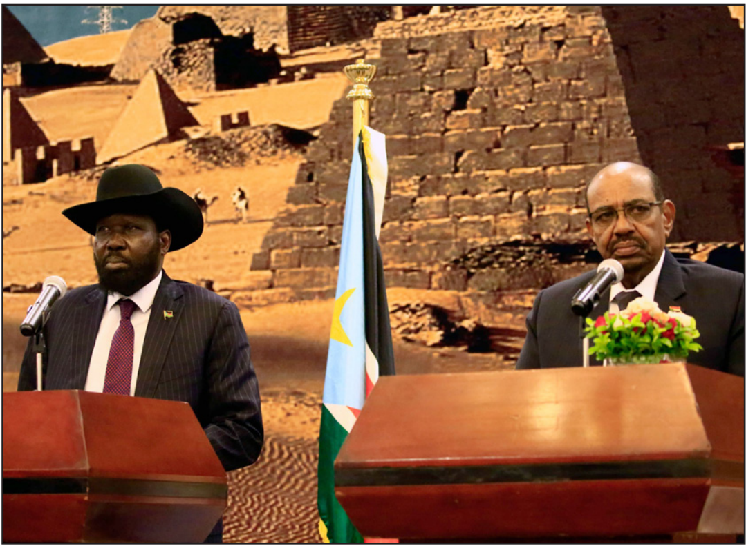
رئيسا السودان وجنوب السودان خلال مؤتمر صحافي في الخرطوم

وجددت الاتفاقات الموقعة بين البلدين في العاصمة الإثيوبية أديس أبابا، في 27 سبتمبر/أيلول 2012. ويؤمل أن توقف مباحثات الخرطوم سيرال اتصالات المتبادلة بين البلدين بدعم المعارضة المسلحة ضد الحكومتين، وتشارك الخرطوم في الوساطة الأفريقية لإحلال السلام في دولة جنوب السودان.