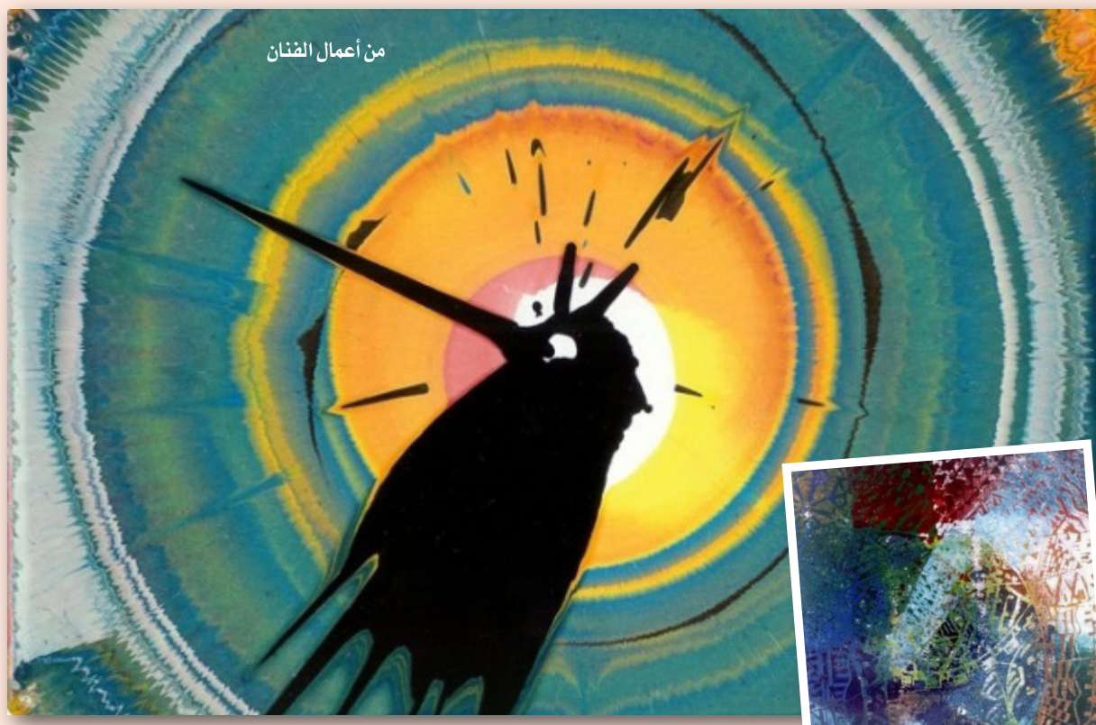
من أعمال الفنان

يحتاج إلى المزيد من الدقة والعرفنة التقنية الحقة، في نطاق عمليات التوزيع المختلفة للكلمات اللونية، وتنسيق الأشكال وتثبيت الرموز، إذ يصبح التأثير واضحاً على التناغم اللوني، وأيضاً على التحليل الطيفي للضوء، ثم