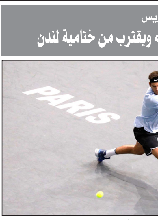
دل بوترو وانتصر واقترب من التأهل إلى البطولة الختامية

■ باريس - د ب أ: قطع الأرجنتيني، خوان مارتن دل بوترو، أولى خطواته نحو تحقيق حلمه بالتأهل إلى البطولة الختامية لوسم التنس بلندن (نهائي الدوري العالمي) بالتغلب على الهولندي روبن هاشه 5/7 و4/6، في دور الستة عشر من بطولة باريس للتنس. وستتبع دل بوترو، المصنف الرابع عالمياً سابقاً، حسم بطاقة تأهله إلى البطولة الختامية اليوم، إذا فاز في دور الثمانية، وجاءت النتائج الأخرى في البطولة لصالحه، ويشارك في البطولة الختامية، التي ستقام في العاصمة البريطانية لندن، المصنوفون الضامنة الأوائل بين 12 و19 تشرين الثاني/نوفمبر الجاري، وتأهل حتى الآن ستة لاعبين وهم رافايل نادال وروجه فيدرر والكسندر زفيريف ودومينيك تيم ومارين سيليتش وغريغور ديميتروف، فيما يتبقى المركزان الأخران لساغر فين، حيث ستحدد هوية صاحبيهما طبقاً لنتائج البطولة الباريسية، وصعد الإسباني فرناندو فيرنانديسكو لدور الثمانية أيضاً، حقق مفاجأة من العيار الثقيل بفوزه على النمسواوي دومينيك تيم، المصنف الخامس، 4/6 و4/6، وتأهل الصربي فيليب كراينوفيتش، بتغلبه على الفرنسي نيكولا ماهو 2/6 و6/3 و1/6، في حين اجتاز الأمريكي جون ايسنر، عقبة البلغاري غريغور ديميتروف 7/5 و6/7 في مباراة ماراثونية.