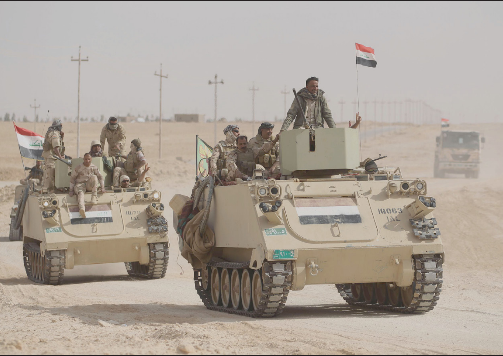
قوات عراقية في المناطق المتنازع عليها

وقال، في بيان «بعد انسحاب قوات البيشمركة من المناطق المتنازع عليها ودخول