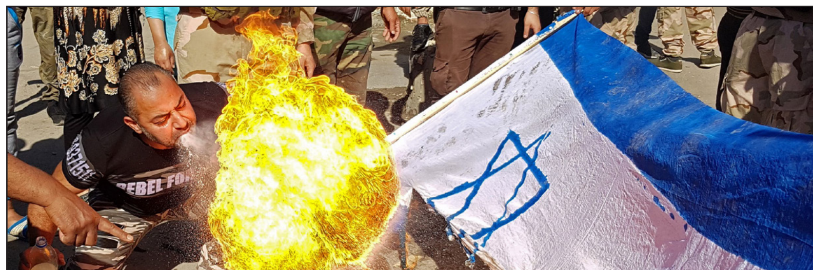
متظاهرون يحرقون العلم الإسرائيلي في عين الحلوة في لبنان