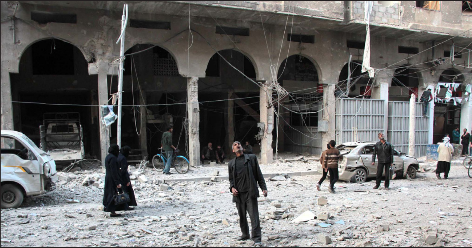
جانب من الدمار في ريف دمشق