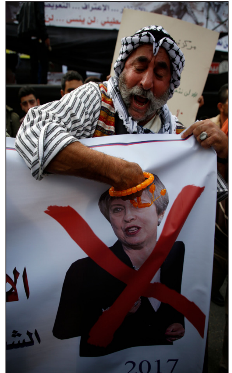
معلم فلسطيني غاضب على احتفال تيريزا ماي بالوعد المشؤوم