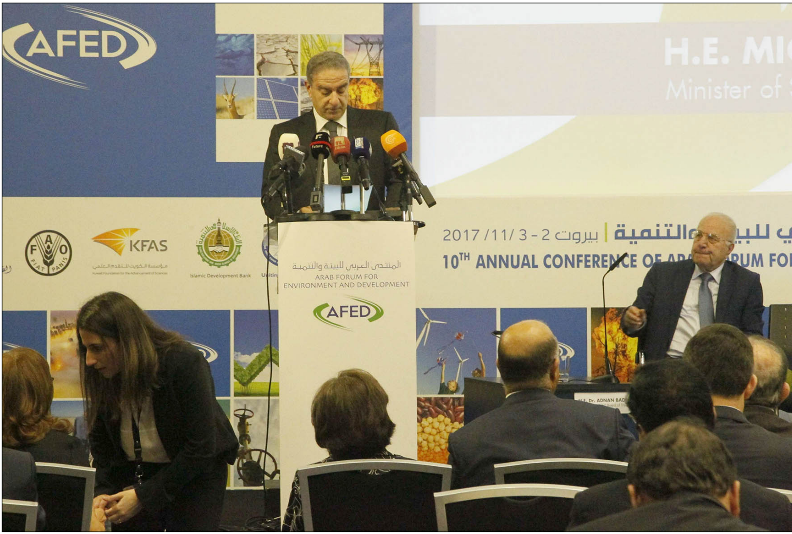
نجيب صعب يلقي كلمة لافتتاح في مؤتمر «أفد» في بيروت أمس

■ بيروت - الأناضول: حذر نجيب صعب، الأمين العام للمنتدى العربي للبيئة والتنمية «أفد»، أمس الخميس من أن الوضع البيئي العربي في تراجع مستمر. جاء ذلك على هامش انطلاق المؤتمر السنوي العاشر للمنتدى في بيروت، تحت رعاية رئيس الوزراء اللبناني سعد الحريري، وبمشاركة عدد من وزراء البيئة والخبراء البيئيين العرب. ويشهد المؤتمر، الذي يستمر يومين، إطلاق تقرير المنتدى عن وضع البيئة في الدول العربية، ونتائج استطلاع للرأي العام البيئي بعنوان «البيئة العربية في 10 سنين». قال أمين عام المنتدى، في تصريحات على هامش المؤتمر، إن «الوضع البيئي العربي في تراجع مستمر.. في حين تابعت البيئة العربية مسار التدهور، على مدى السنوات العشر الماضية، كان هناك تقدم بطيء على بعض الجبهات». غير أنه حذر من أن هذا التحسن «مهيد بالزوال، بسبب الصراعات والحروب وعدم الاستقرار والقصور في السياسة البيئية». لكن ينبغي أيضا إنشاء على جهود بذلتها بعض البلدان العربية نحو تحقيق الاستدامة. وقال إن العقد الماضي شهد انتقالا ملموسا للبلدان العربية نحو الاقتصاد الأخضر (غير الضار بالبيئة). فمن الصفرة تقريبا في اعتماد استراتيجية مستدامة، أدرجت 7 بلدان عناصر الاقتصاد الأخضر والاستدامة في خططها، منها السعودية والإمارات ولبنان والأردن. إلا أنه أشار إلى أن ذلك غير كاف. وعن المؤتمر، قال صعب إن موضوع المياه هو المحور الأساسي، فلا تزال ندرة المياه تتفاقم في المنطقة العربية، بسبب الموارد المحدودة للمياه العذبة المتجددة، وتدهور الجودة، والنمو السكاني، ونقص الأموال لتمويل البنية التحتية للمياه، ومضى قائلا «خلال السنوات العشر