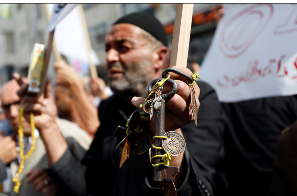
مئة عام وما زلنا نحمل مفاتيح بيوتنا السليبية