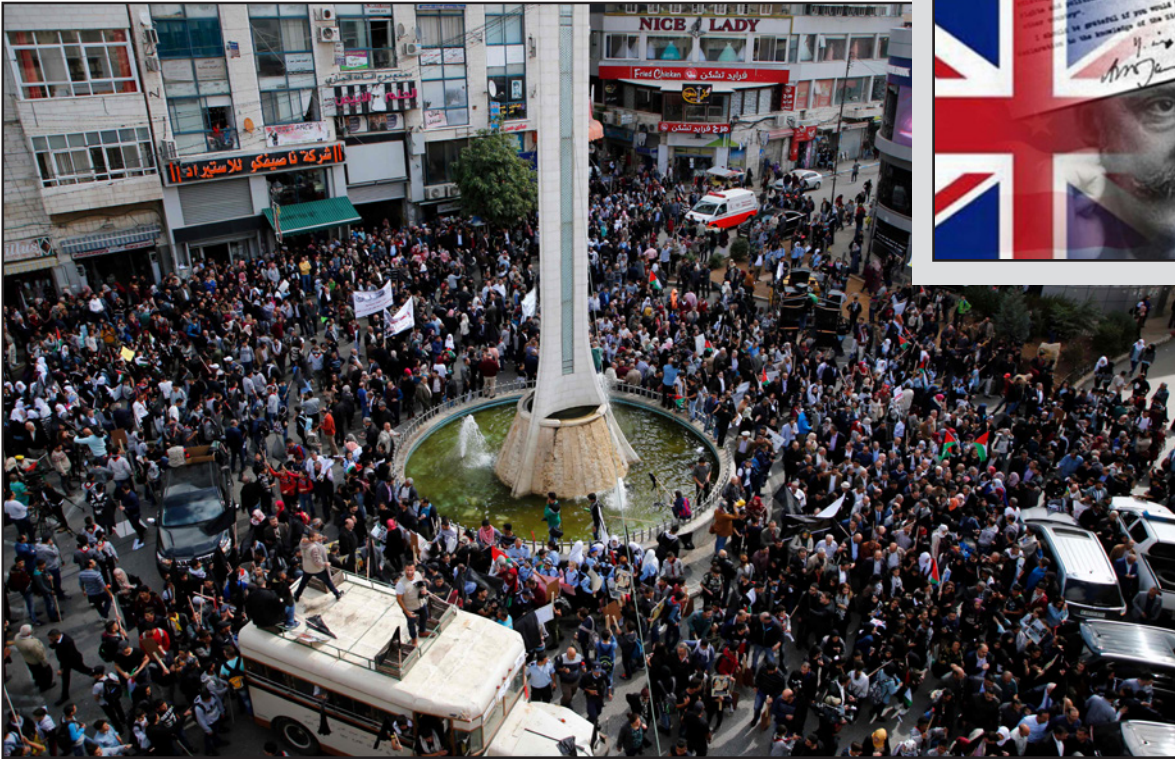
الجميع خرج في رام الله ليقول كفى للوعد المشؤوم