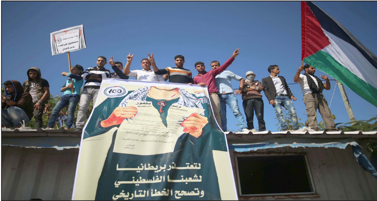
من احتجاجات غزة