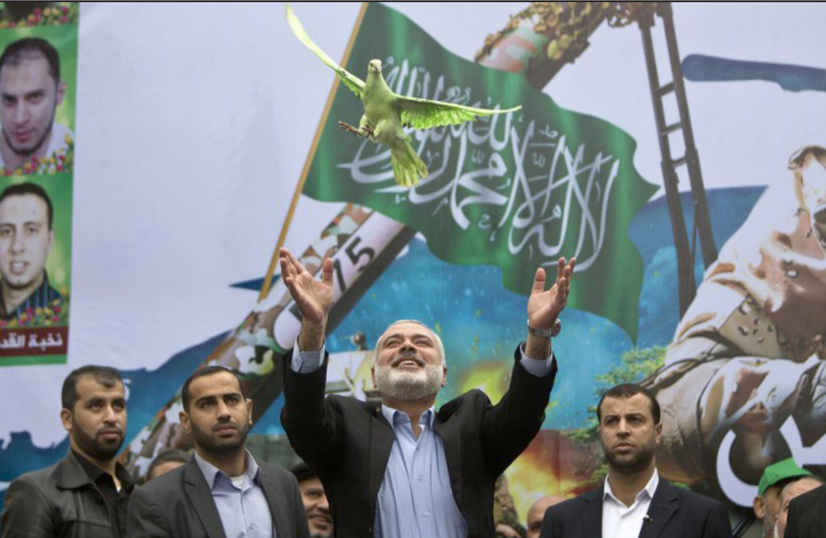
اسماعيل هنية يحتفل بذكرى انطلاق حركة حماس (أرشيفية)

الإقليمي على النفوذ في الساحة الفلسطينية. يتطلع دحلان للاستعانة بحماس كي يعود ليكون جزءاً من اللعبة السياسية الفلسطينية، وبالتالي، فإنه يعد بال مساعدة في حل الأزمة في غزة. من ناحية إسرائيل، ينبغي التساؤل هل يمكن للاتصالات بين حماس وإسماعيل هاني سارزن أن يكون تأثير سياسي وأمني في الضفة، بمعنى، هل الشراكة بين دحلان وحماس كفيلة بأن تخلق دافعا لحالات ضعفه حكم عباس من خلال أعمال الإخلال بالنظام والأزهاب – مثلما سبق أن حاولت حماس في الماضي بل لنجاح. حالياً، يبدو أن حافز حماس لتعزيز العلاقة مع دحلان هو مالي وليس أكثر من ذلك، مثلما ارتبطت حماس، بالتوازي، مع الجهد المصري لتحقيق المصالحة مع السلطة الفلسطينية. هذا هو الآخر، كما يبدو، في التفكير في المنفعة الاقتصادية التي يستشأ إذا ما عادت السلطة الفلسطينية لتحمل العبء الاقتصادي لإدارة القطاع.