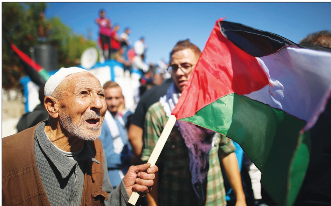
عجوز عرف بلفور فلسطين خلال احتجاجات جماهيرية في غزة ضد وعد بلفور