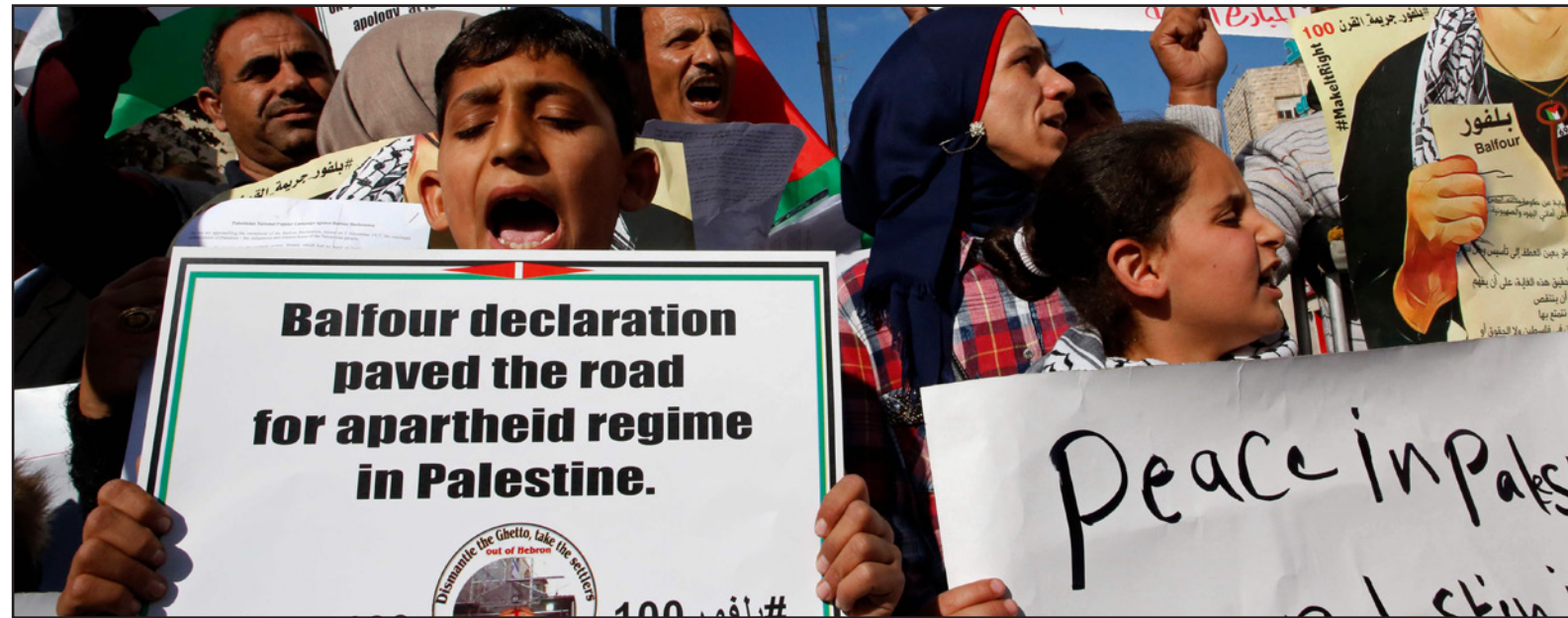
أهالي الخليل: «بلفور أسس التمييز العنصري في فلسطين»