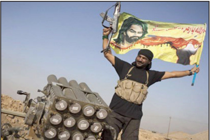
عنصر من الحشد الشعبي في كركوك

شهود عيان كانوا قد ذكروا لـ«القدس العربي» أن «قوة من ميليشيات الحشد الشيعي» حسب بيان لمكتبه، أن «الآلية التي جرى