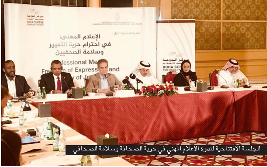
الجلسة الافتتاحية لندوة الإعلام المهني في حرية الصحافة وسلامة الصحفي

واكد بيورود أن «الصحافيين مسجونون لأن السلطة لا تريد لهم أن يتحدثوا»، مشدداً على أن