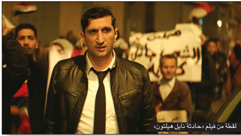
لقطة من فيلم «حادثة نايل هيلتون»

ويحكي فيلم «تدفق بشري» عن المأساة الإنسانية التي يعيشها العالم اليوم، حيث يسלט الضوء بالأرقام على وجود أكثر من 65 مليون شخص يجدون أنفسهم مضطرين إلى النزوح بسبب الحرب والجوع وتغير المناخ.. وهو أكبر نزوح إنساني منذ الحرب العالمية الثانية. الفيلم يصور مشاهد، تقشعر لها الأبدان، تقربنا من أزمة اللاجئين وتأثيرها العميق على المستوى الشخصي.. ويقدّم كذلك بؤر التوتر التي يعرفها المجتمع الإنساني، حيث تم التصوير في أكثر من 23 دولة وعلى مدى عام من الكوارث. كما يتناول الفيلم مجموعة من الحالات الإنسانية الملحة التي تمتد على مدى العالم وتشمل بلدانا مثل أفغانستان، بنغلاديش، فرنسا، اليونان، نائانيا، العراق، الأراضي المحتلة، إيطاليا، كينيا، المكسيك، تركيا، الأردن، سوريا.. ويحكي عن قرب