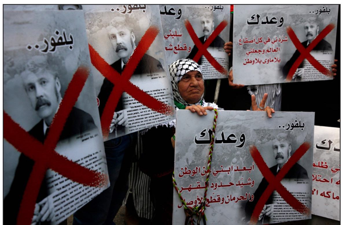
النساء في مظاهرة في مدينة نابلس يذكرن العالم بما صنعه بلفور بأبائهن