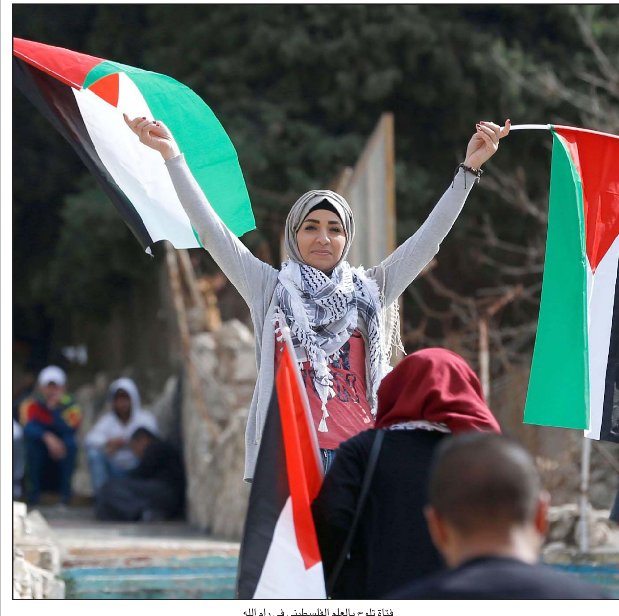
فتاة تلوح بالعلم الفلسطيني في رام الله

بمعنا «القضية الفلسطينية.. قرن بعد صدور وعد بلفور»، بمشاركة سياسيين وبرلمانيين تونسيين وسفراء دول أجنبية. وقال شعث إن القيادة الفلسطينية تدرس رفع القضية، إما أمام المحاكم البريطانية أو الأوروبية أو الدولية، وطلب التعويض عن آثاره. وأكد أن لجنة قانونية تدرس «بالتفصيل الإجراءات القانونية الممكنة لمقاواة الحكومة البريطانية إما في محاكم بريطانية