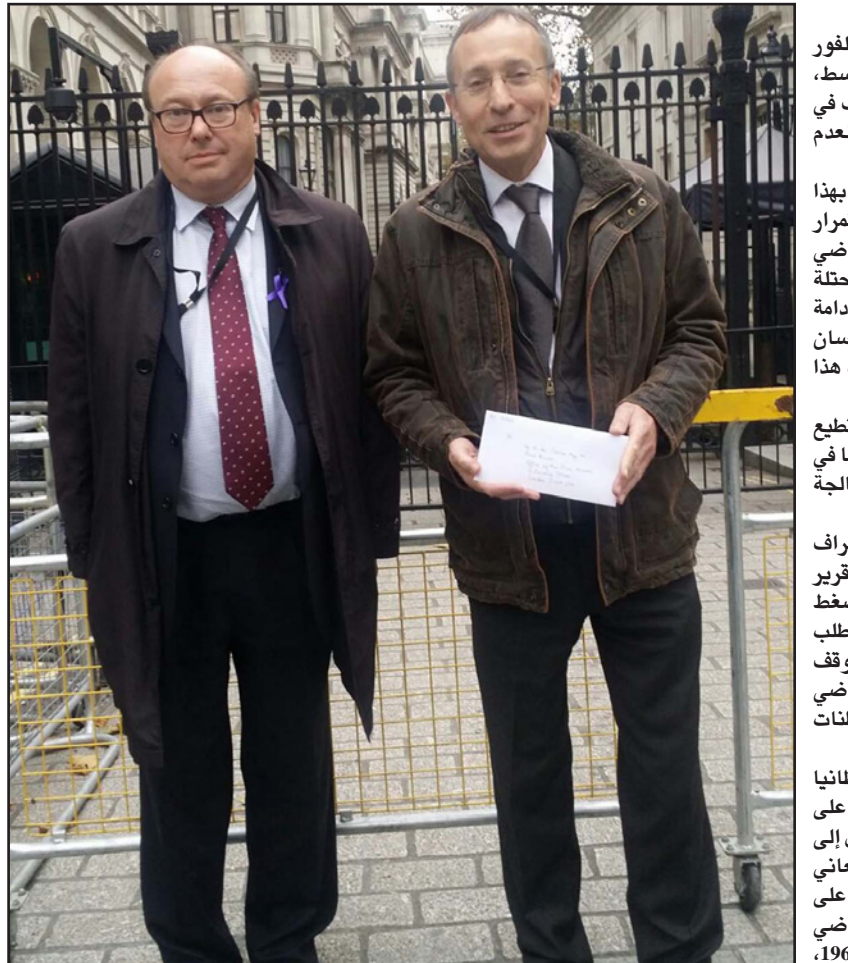
عضوا البرلمان البريطاني آندى سلوتر وغراهام مورس ينقلان رسالة الجاليات الفلسطينية في أوروبا إلى رئيسة الوزراء

عمان - رويترز: نظم أردنيون احتجاجاً أمام السفارة البريطانية في عمان، أمس، بمناسبة الذكرى المئوية لوعد بلفور الذي أيدت فيه بريطانيا إقامة وطن لليهود في الشرق الأوسط.