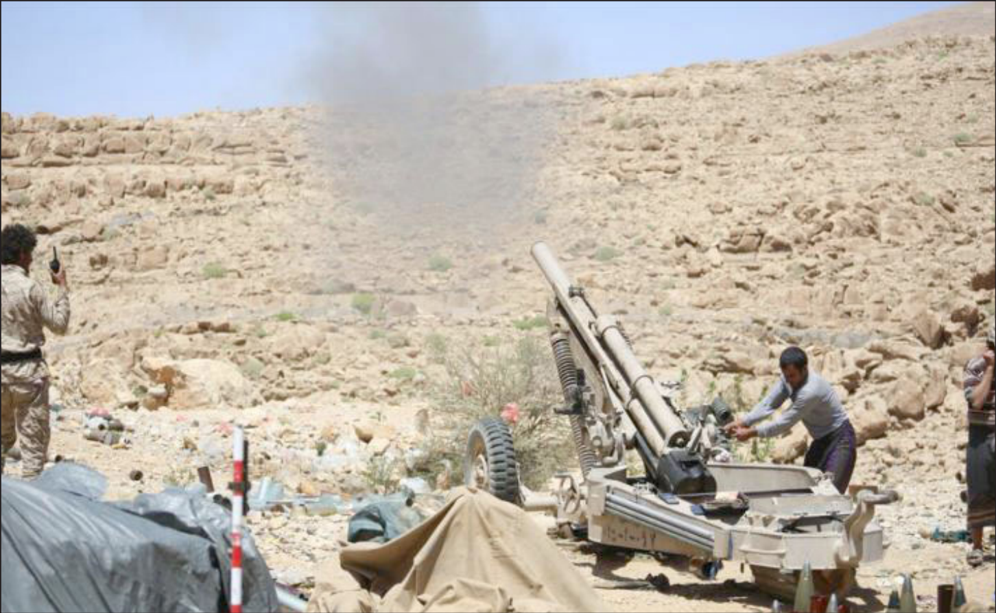
تقدم للقوات الحكومية في محيط العاصمة اليمنية صنعاء