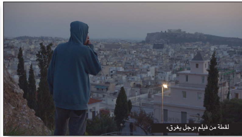
لقطة من فيلم «رجل يفرق»

وعرفت المسابقة الرسمية الخاصة بالأفلام القصيرة توقيع المخرج الفلسطيني مهدي فليفل