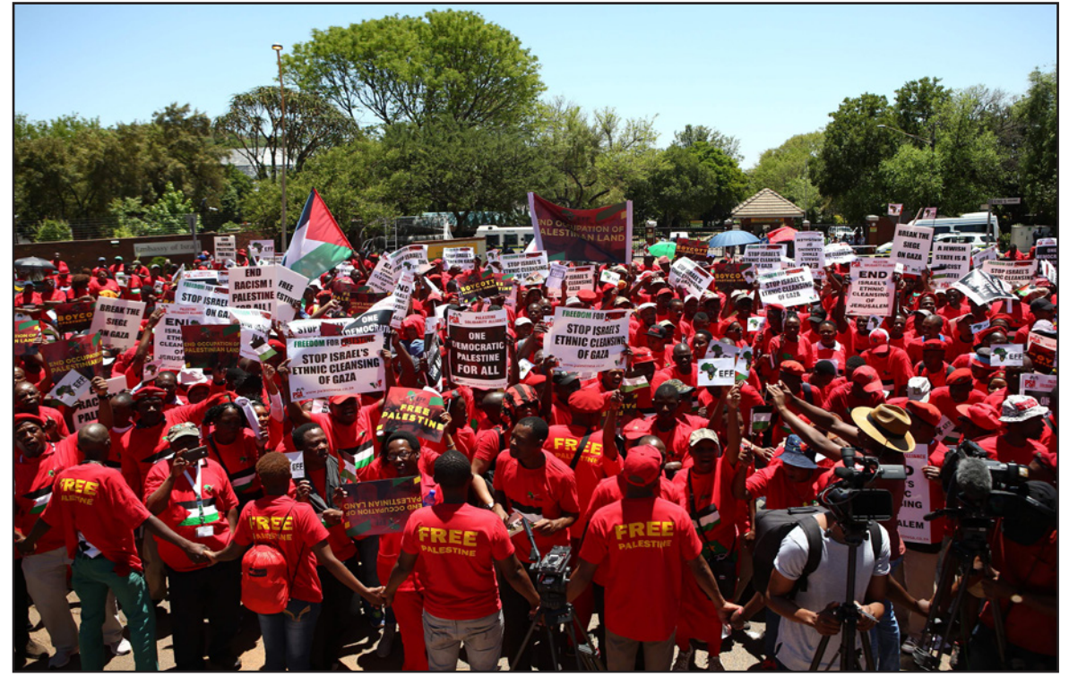
نشطاء من جنوب أفريقيا يتضامنون مع فلسطين ويطالبون بمقاطعة إسرائيل