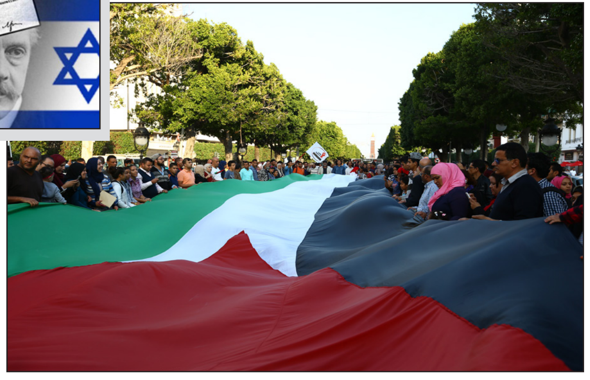
توانسة يحملون علما فلسطينيا ضخما تعبيراً عن رفضهم للوعد