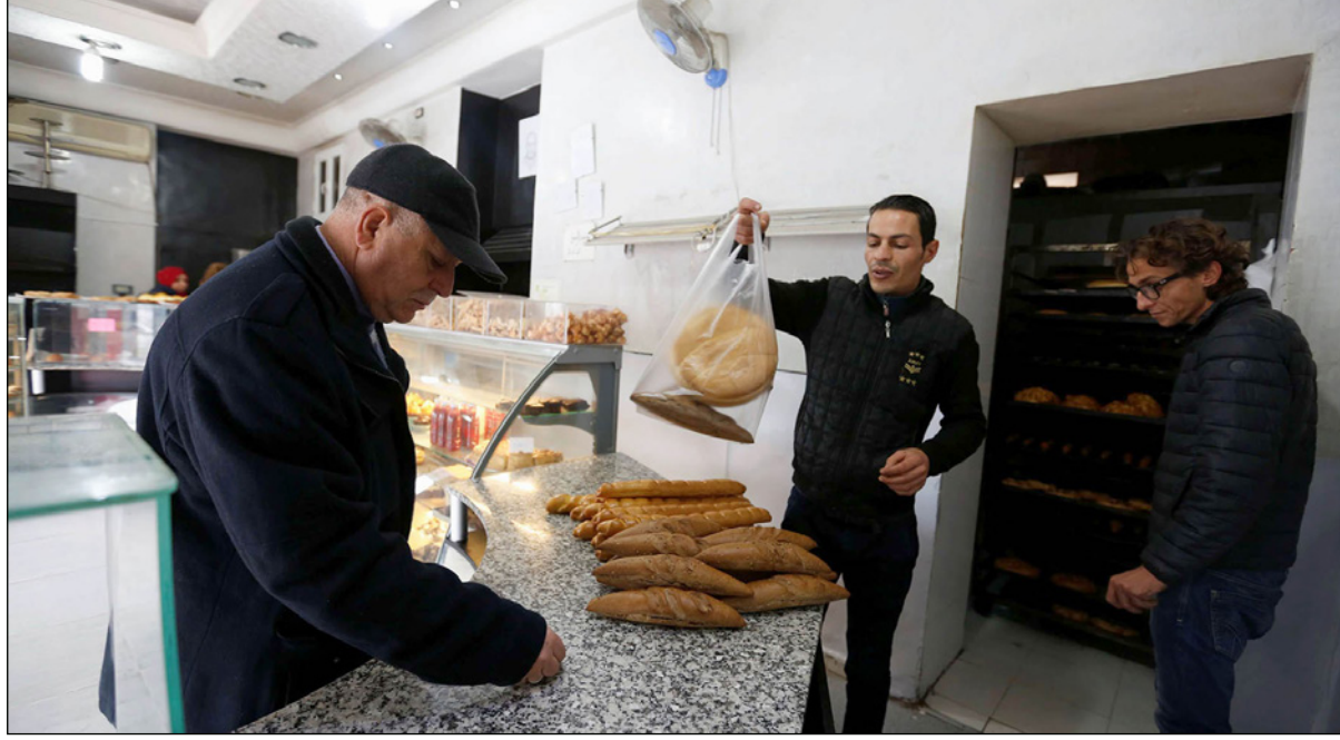
مخبز في تونس قد يصطر إلى رفع أسعاره إذا ألغى الخبز دعمها للحزب

■ تونس - رويترز: تستعد تونس لتدشين إصلاحات اقتصادية طال انتظارها للحد من عجز ميزانيتها الزمن، إلا أن هذه التدابير قد تؤدي إلى الإضرار بجهودها لجذب استثمارات، إذا فرضت ضرائب جديدة بدلا من خفض الإنفاق على القطاع العام المتضخم سعيا لتفادي اضطرابات اجتماعية.