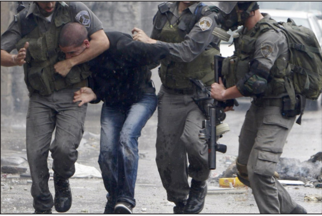
جانب من المواجهات بين الشرطة الإسرائيلية وشبان فلسطينيين في مخيم شعفاط

اختلافها، سواء حكومات العمل أو الليكود، مسؤولة عن اهمال احياء شرقي القدس. لقد حان الوقت لتغيير هذا الوضع، والحلل لا يمكن في اخراج عدد من الاحياء إلى خارج حدود القدس. الحل الحقيقي يتطلب استثمارات كبيرة خلال سنوات، لكنه هو الطريق الصحيح. في نفس الوقت يجب دعوة وزارة الداخلية إلى التوقف عن التناؤ في علاج العدد المتزايد من طالبي الجنسية الإسرائيلية في اوساط سكان شرقي القدس. هذا هو حقهم حسب القانون الإسرائيلي، ويجب أن لا نسمح لأي موظف بأن يزج أي منهم. كل هذه الخطوات إذا تم اتخاذها، ستحصل القدس إلى مدينة موحدة، مدينة لكل الإسرائيليين، اليهود والعرب بمتكهم التفاخر بها.