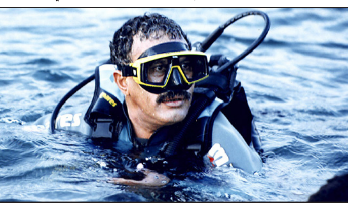
الرئيس السابق يمارس هوايته في الغطس