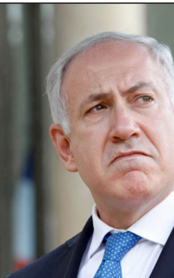
رئيس الوزراء الإسرائيلي بنيامين نتنياهو

ليست السنة 1992، ورغم ما م به المجتمع الإسرائيلي في 25 سنة الاخيرة، بما في ذلك نسغ التضامن، هبوط الثقة بالمؤسسات الرسمية، صعود التهمك والاعجاب بنزعة الاستماتع، ثمة شيء واحد بقي مواطنو إسرائيل حساسين له في العام 2017 أيضا: رائحة نتانئة المناورات ان الملاحقة الفزعة لقانون التوصيات هي التي أخرجت أول أس جمع بيت إسرائيل إلى الشوارع. كنت في المظاهرة. كان مكتظا. طاقات قوية. الكثير من الأهل مع الأطفال. طبقة وسطى كلاسيكية، مثلما في كل مجتمع ديمقراطي معافى يحمل على كتفيه الاحتجاجات الجوهرية. غياب الاقنات الحزبية لعب في صالح أصالة الاحتجاج. من سماع النائية ميراف بن آري (كلنا) في الصباح التالي، حين اعترفت بأن ترددها التصويت مع أم ضد القانون أقض مضجعها، فهم بان السياسيين لم يبقوا غير مبالين لعاصفة الشارع. رغم المحاولات للتقليل من أهمية وقوة المظاهرة، فان رئيس الوزراء باحاسيسه السياسية يفهم جيدا معناها. وصحيح حتى كتابة هذه السطور يبدو أنه تاجل التصويت على قانون التوصيات، بل وادعى رئيس الوزراء بأنه لا يحلل القانون عليه، ولكن مع القانون لو أنه يودنه، حسم الأمر: يخيل أن الانتخابات أقرب من أي وقت مضى. حتى لو لم يكن الشركاء الائتلافيون معنيين بالانتخابات، فان الشارع ورئيس الوزراء، لأسباب مضاربة، معنيون باجراء إعادة بدء