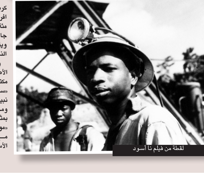
لقطة من فيلم أنا أسود