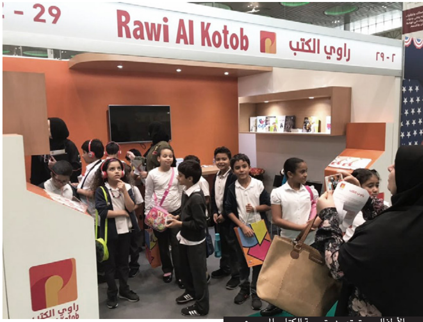
الأطفال يستمعون بتجربة الكتاب المسموع

إضافة إلى أن الكتاب المناسب يمثل هوية المشروع ومن جهة أخرى يحدد نوعية القراء الذين تستهدفهم.