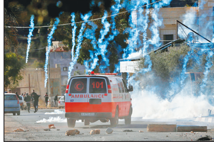
سيارة إسعاف فلسطينية تعبر شارعاً تحت قصف قنابل الغاز الإسرائيلية في قرية نصرة في قطاع غزة

خطة تسمح لإسرائيل بالاحتفاظ بمعظم المستوطنات التي يصنعها العالم بغير القانون، وتكون بلدة أبو ديس لا يمكن لأي زعيم فلسطيني القبول بها. وما كتشف من خطة بين سلمان ينجم مع ما تسرب من معلومات حول «صفحة القرن» التي تروج لها الإدارة الأمريكية. وتضمن هذه الخطة منح الفلسطينيين دولة لكن ليس على كل أراضي الضفة الغربية، وسيادة محدودة على مناطقهم، (تفاصيل ص 6)