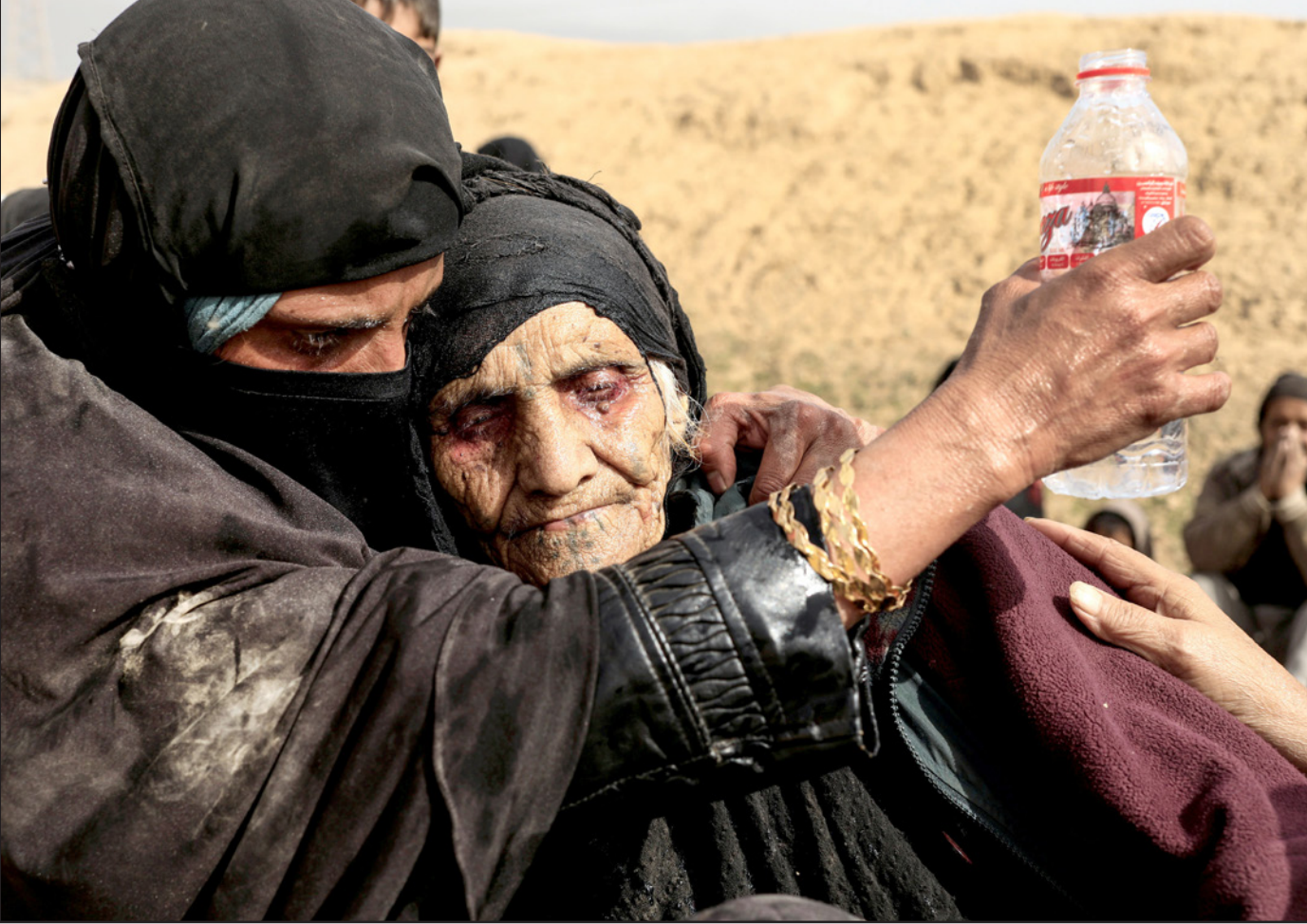
نازحتان عراقيتان خلال هروبهما من المعارك

العالمية، ولعدم توفر أجهزة سونار متطورة تساعد على تحديد أماكن العبوات ووجودها بدقة تمهيدا لإزالتها وتفكيكها، فضلا عن ذلك صعوبة العثور على الألغام في المناطق الصحراوية المفتوحة والمزروعة أسفل ركام المباني المدمرة».