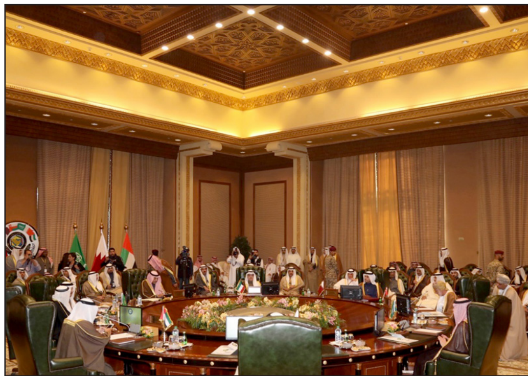
جانب من الاجتماع الوزاري الخليجي في الكويت

وفي الخامس من حزيران/يونيو 2017 قطعت السعودية ومصر والإمارات والبحرين علاقاتها الدبلوماسية مع قطر بعد اتهامها بدعم متطرفين اسلاميين والتقارب مع إيران. وفرضت الدول الاربعة حظرا