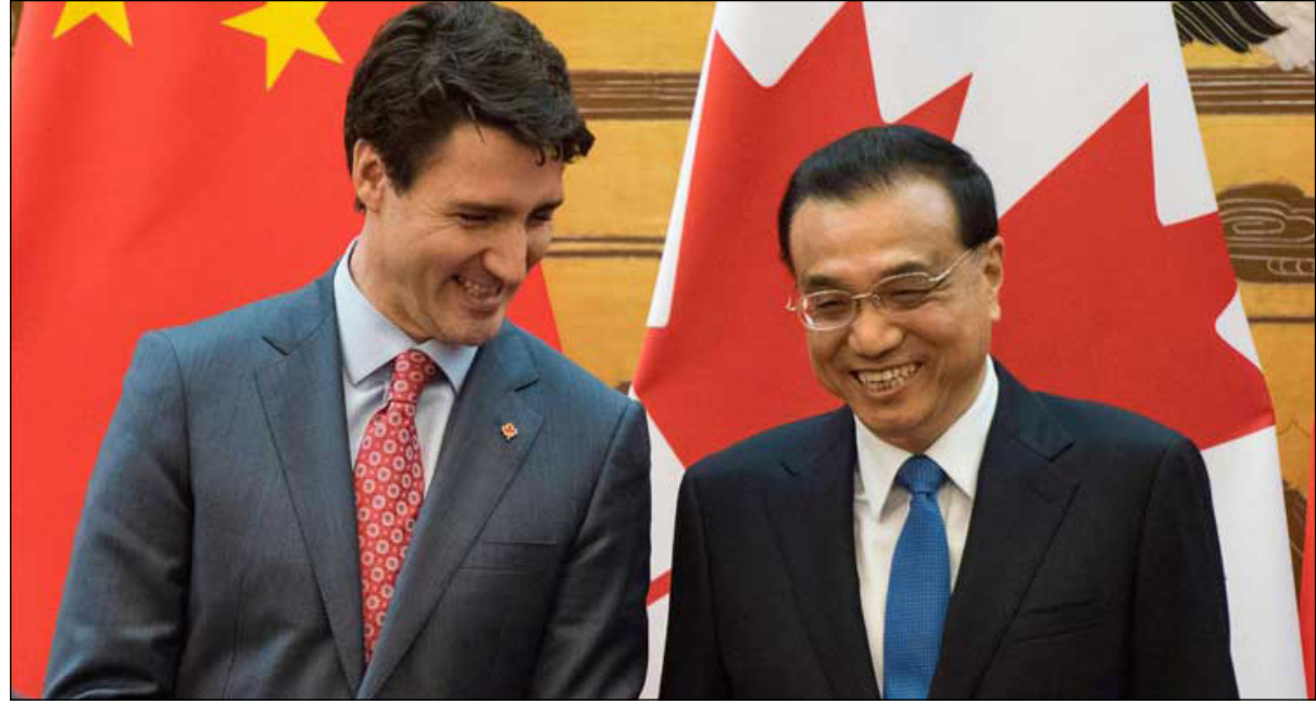
رئيسا وزراء الصين (يمين) وكندا

التواصل الاجتماعي المحلية على مظهره حيث وصفه أحد المعلقين بـ«أكثر زعيم اجنبي وسامة».