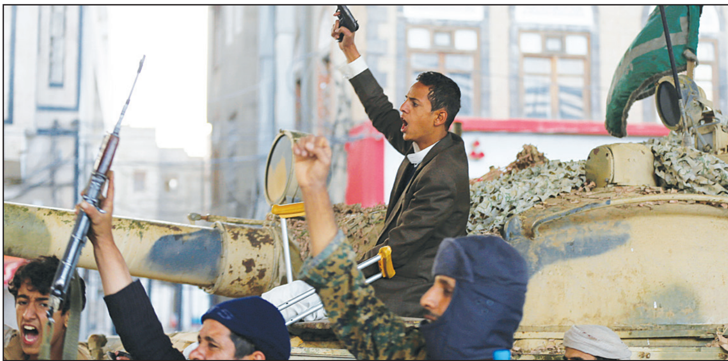
عناصر من الحوثيين يحتفلون في صنعاء بمقتل حليفهم السابق علي صالح أمس

تعرّ - «القدس العربي» من خالد الحمادي وكالات: