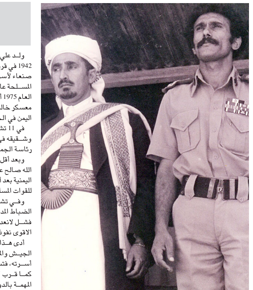
صالح في بداية حكمه مع الشيخ عبد الله الأحمر

منذ اجتياحها قبل ثلاثة أعوام والعاصمة عملياً تحت سيطرة الحوثيين تماماً، وهو ما كانت تكشف عنه حواجز التفقيش، نظراً لوجود شعاراتهم في تلك النقاط. فيما ظلت مبيعات من الجهة الجنوبية لصنعاء، وعلى رأسها منطقة «حدة» و«السبعين» و«الحي السياسي» و«شارع الجزائر»، خالية من تلك النقاط، ربما بناء على اتفاقات، كونها تضم منازل ومقرات تابعة لصالح وأفراد عائلته العسكريين. وخلال الساعات الماضية، بدت صنعاء منقسمة جغرافياً بطريقة تشبه ما جرى عام 2011، عند انطلاق الثورة الشيعية على الرئيس صالح آنذاك، حيث سيطرت القوات المؤيدة للثورة على الربع الشمالي من العاصمة، فيما ظلت الجهة الجنوبية في أيدي قوات الحرس الجمهوري الموالية لصالح. واندلعت شرارة المعركة بين الحليفين الحوثي وصالح في شارع الجزائر، بعد اتهامات حزب المؤتمر - بزعامة صالح،