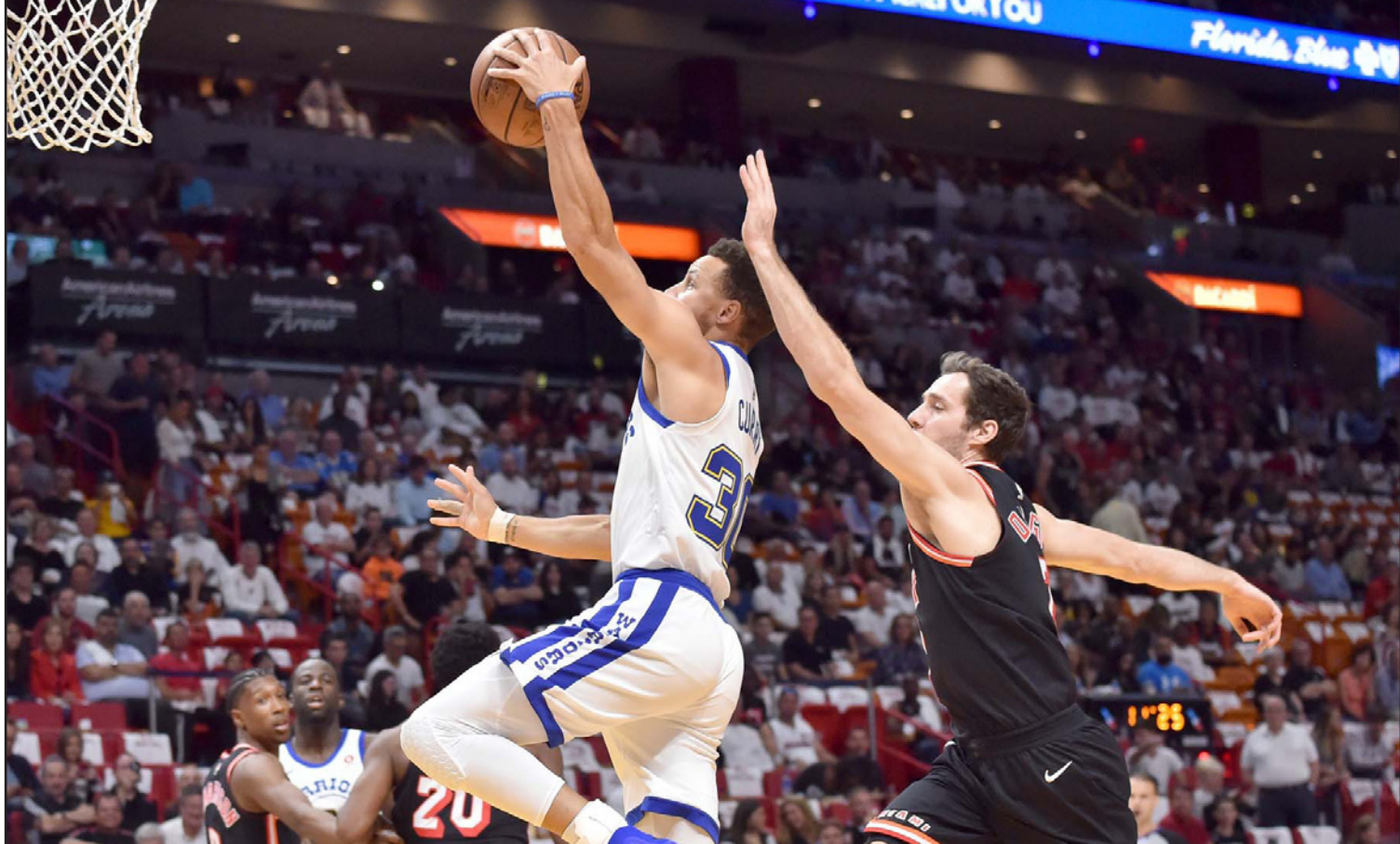
كاري نجم واريورز يتقدم باكرة للتسجيل في سلة ميامي رغم محاولات دراغيتش لنعه

بوينس آيريس - د ب أ: أكد بوكا جونيورز وسان لورنزو صدارتهما لبطولة الدوري الأرجنتيني لكرة القدم (سوبر ليغا) بعد فوزهما على كل من أرسنال وتيفري على الترتيب في المرحلة الحادية عشرة. وفي مباراة أخرى بالمرحلة ذاتها، سقط ريفر بليت 1/2 في اللقاء الذي حل فيه ضيفا على منافسه خيمناساديا لا بلاتا، ليتبعد عن المركز الأول بـ12 نقطة كاملة، وعلى ملعبه «لا بومونييرا»، فاز بوكا جونيورز على أرسنال بهدفين نظيفين سجلهما المهاجم الشاب غويدو فالاد في الدقيقة 34 بتصويبه بقدمه اليمنى