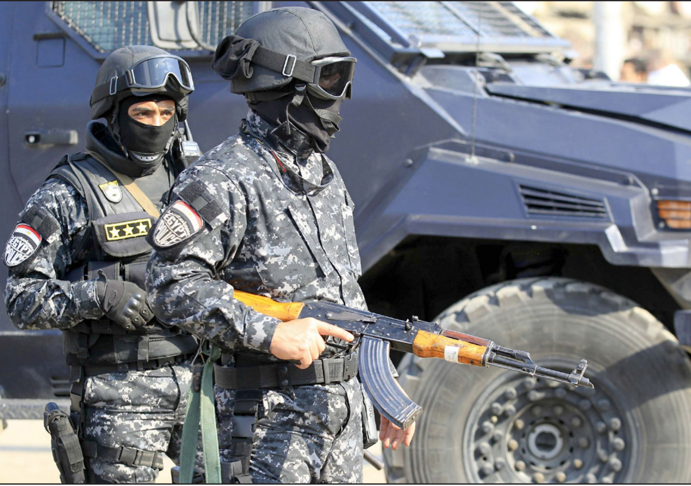
صورة أرشيفية لعناصر من الشرطة المصرية خلال إحدى المظاهرات

وأضاف «المنظومة العربية في مُجابهة الإرهاب واجتثاثه تحتاج إلى دعم وتحديث وتمكين، لتصبح أكثر قدرة على التعامل مع التهديدات الإرهابية في صورها المختلفة والمستجدة». وتابع أن «هذه التهديدات تُغيّر طبيعتها وتبدل أنواتها وأساليبها بشكل متسارع للتعامل مع الضغوط المفروضة عليها». وحسب أبو الغيط «يتعين على المنظومة العربية مواكبة هذه التحديات الجديدة، بل واستبقائها على كل المستويات: الأمنية والمالية والقضائية والإعلامية». ودعا مجلسي وزراء العدل والداخلية العرب «لإعادة عملها الهام بهدف تفعيل الآلية التنفيذية للاتفاقية العربية لمكافحة الإرهاب الموقعة عام 1998». وأعتبر أن «التصدي للمظاهرة الإرهابية بصورة شاملة يقتضي نهجا شاملا لا يستهدف فقط الجريمة الإرهابية، وإنما الفكر الذي يُهدد لها ويقف وراءها، من خلال حشد متضافر لكافة الجهود العربية المبذولة في مجال مواجهة الفكر الضال والمتطرف.. وبحيث تصب هذه الجهود في بوتقة واحدة، ويكون لها الأثر المطلوب في دحر خطب التطرف والعنف في كافة الدول العربية». وشدد على «التضامن مع مصر في معركتها مع الإرهاب، ووقوفها احتراما للشهداء الذين يسقطون من مصر، ومن كافة البلدان العربية المخترقة في هذه المعركة الشريفة من أجل تخليص بلادنا من هذه الآفة الخطيرة التي تمثل التهديد الأكبر لاجتماعنا في المرحلة الحالية».