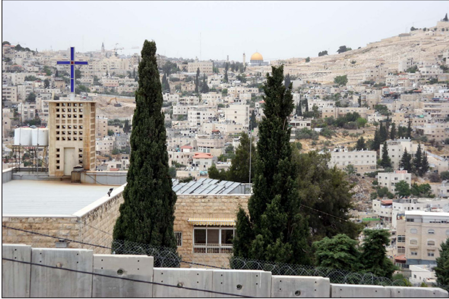
مشهد عام لبلدة أبو ديس وتظهر فيه من على بعد قمة الصخرة في البلدة القديمة من القدس