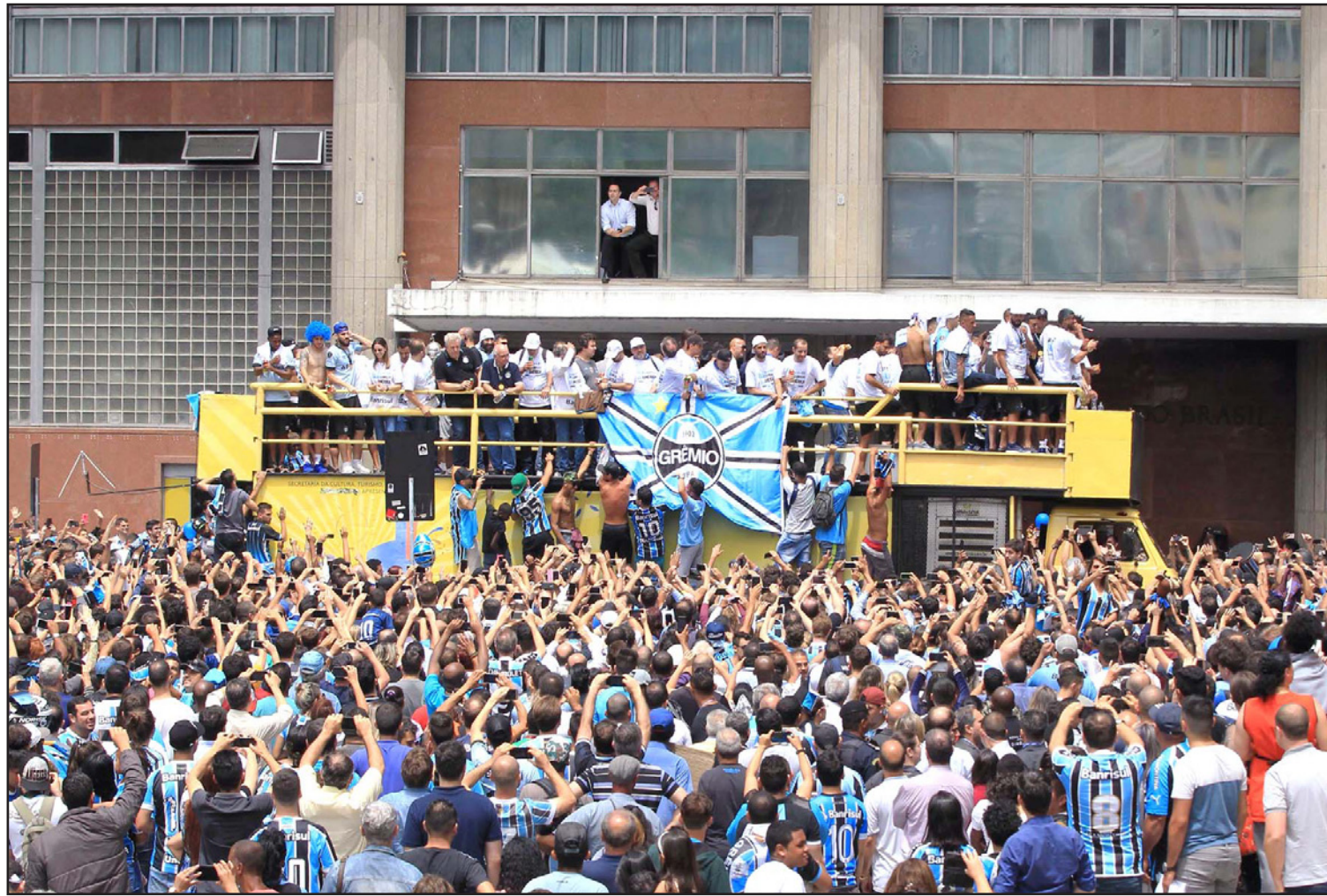
جماهير غريميو البرازيلي تساند فريقها بقوة دأشما ملتما احتفلت بغوزه بكأس ليبرتادوريس

ابوظبي - رويترز: من المفترض أن يتوجه ريال مدريد إلى الإمارات بهدف تحقيق إنجاز لا سابق له بالتتويج بلقب كأس العالم للأندية لكرة القدم للمرة الثانية على التوالي لكنه في الواقع سيضغل تفكيره بمباراة القعة ضد غريمه برشلونة بعد العودة مباشرة إلى إسبانيا.