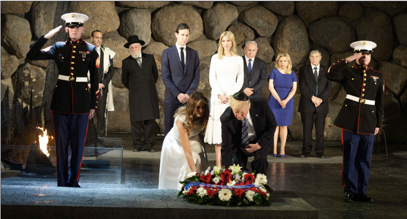
الرئيس الأمريكي دونالد ترامب وزوجته ميلانيا وابنته إيفانكا وزوجها كوشنر لدى زيارتهم متحفًا يخلد «ضحايا النازية» في القدس الغربية

وأضاف «الرئيس هو الذي سيقوم باتخاذ القرار، وهو الشخص الذي سيخبركم كل أنباء»، ورد حاييم سابان، المبادرير الإسرائيلي الذي يدير الحوار السنوي بين الولايات المتحدة والمسؤولين الإسرائيليين إنه سيصل بكوشنر الخميس للحصول على إجابة، أي بعد يوم من الخطاب المرتقب لترامب فرد كوشنر «تسام». وابتعد كوشنر عن الأضواء في الوقت الذي كان فيه المحقق الخاص روبرت مولر يحقق في إمكانية علاقته بالتهديد الروسي في انتخابات عام 2016، ولم يستطع سابان -الذي يعتبر من المترعين الكبار للحزب الديمقراطي-