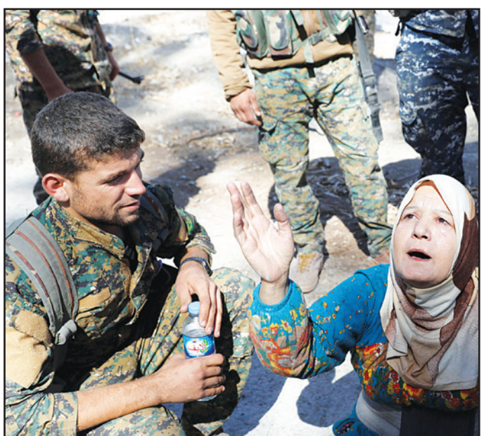
سورية ترفع يديها للسماة بعد خروجها من مدينة كانت تحت سيطرة تنظيم «الدولة»

■ موسكو - د ب أ: أكد الرئيس الروسي، فلاديمير بوتين، أن جميع أراضي سوريا تقريبا، بما في ذلك حيث يقطن المسيحيون، تم تحريرها من الإرهابيين. وقال خلال اجتماع مع رؤساء وفود الكنائس الأرثوذكسية المحلية أمس الإثنين «التحرير من الكنائس والأديرة تم ونهيا وتدميرها. الوضع في البلاد يتغير بشكل تدريجي، القوات السورية بدعم من العسكريين الروس حرروا جميع أراضي البلاد من الإرهابيين، بما في ذلك المناطق التي يعيش فيها المسيحيون»، حسب وكالة سيوتنيك.