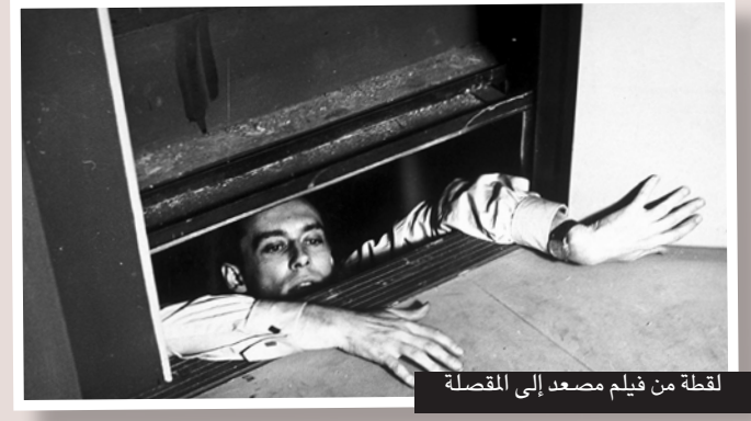
لقطة من فيلم مصعد إلى المقصلة

وتعرض أفلام المهرجان بلغتها الأصلية وترجمتها إنكليزية، وقد اصدرت مكتبة الإسكندرية في إطار برنامج «سينما الأحد»، الذي يشرف عليه أحمد نبيل، كتاباً للتعريف بأهداف المهرجان ومحاضراته وتكريماته وأفلامه ليكون بمثابة دليل للدورة الثالثة، من تنظيم «موقع سينما إيزيس»، وبالتعاون مع «المعهد الفرنسي» و «مكتبة الإسكندرية».