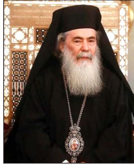
ثيوفيلوس بطريرك الأرثوذكس

وأقر الاجتماع السذي عقد في رام الله «اعتبار تسريب الأراضي والعقارات الوقفية وغير الوقفية للاحتلال عملاً خيائياً لا يمكن تبريره، ويجب التعاطي معه على هذا