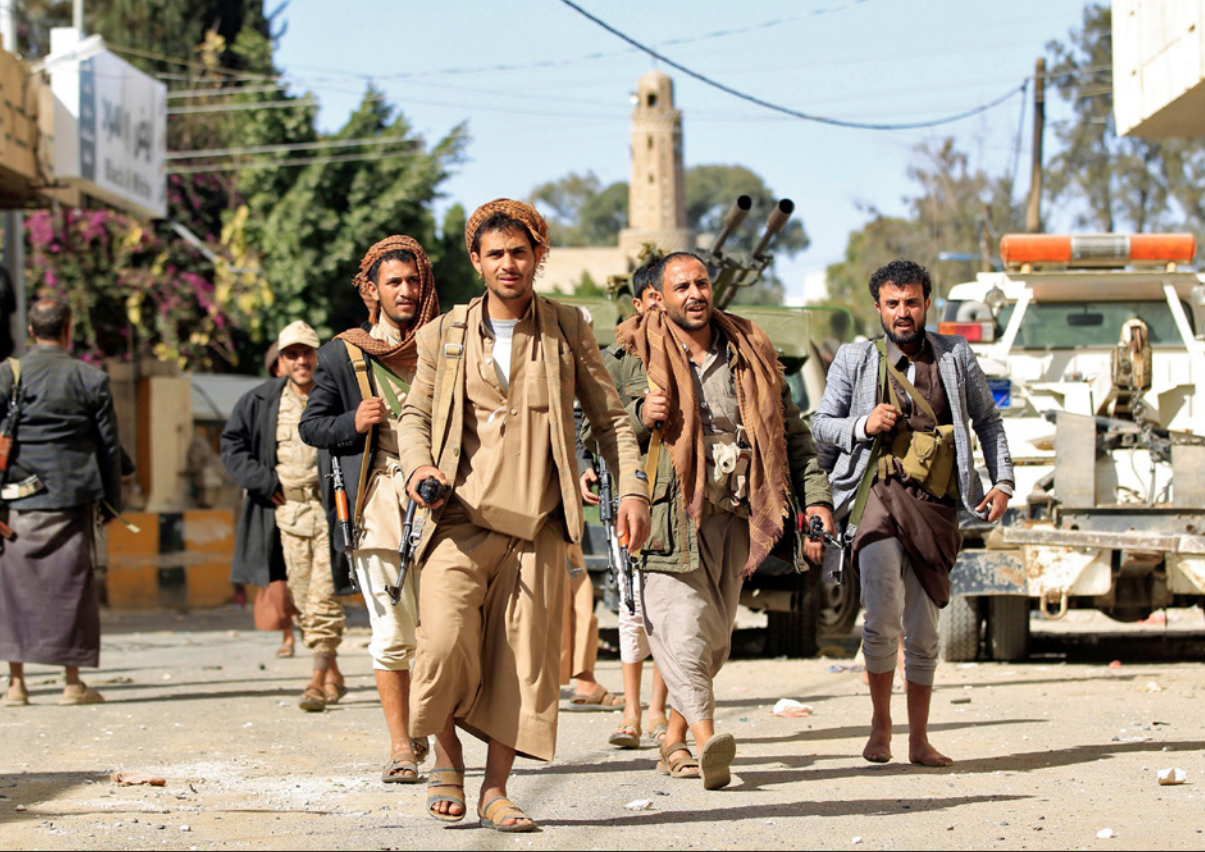
عناصر من جماعة الحوثي ينتشرون في العاصمة صنعاء

بنينويوك، وردا على أسئلة الصحافيين بشأن تحقق الأمم المتحدة من مقتل الرئيس اليمني السابق علي عبد الله صالح قال المتحدث الرسمي «تمت إحاطتنا بمقتل الرئيس السابق علي عبد الله صالح وعدد من زملائه».