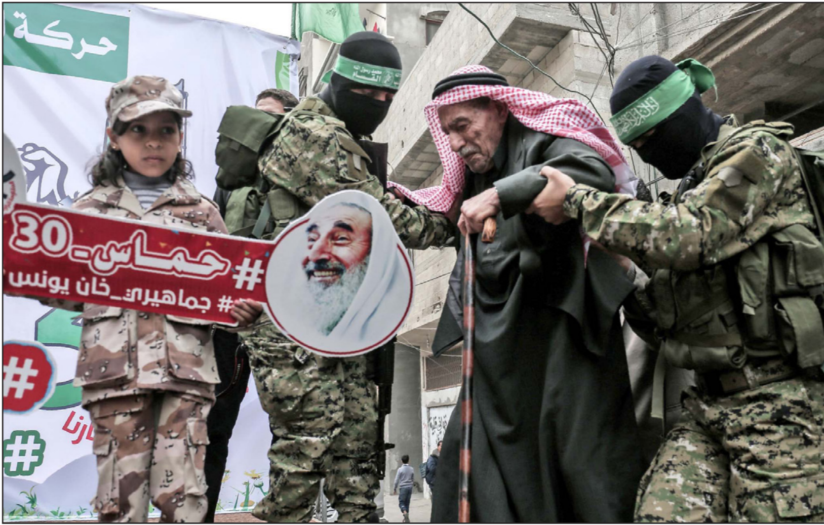
كاتب عز الدين القسام في استعراض عسكري إحياء للذكرى الثلاثين لانطلاقه حماس أمس

التمكين إلى العاشر من الشهر الحالي بدلا من مطلع الشهر. وتأتي زيارة الحكومة لغزة قبل أربعة أيام فقط من انقضاء المهلة التي حددت لانتهاء عملية التمكين، وهناك إشارات إلى إمكانية نجاح الحكومة في هذا الأمر، من خلال التوافق على كثير من المسائل العالقة مع حركة حماس، وفي مقدمتها «ملف