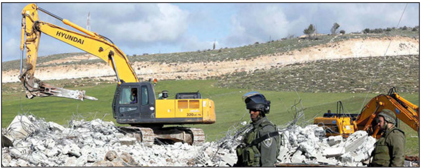
جرافات تدك أرض فلسطينية بعد مصادرتها

وكان مندلبليت قد بحث في الشهر الماضي، إلى المحكمة العليا، وجهة نظر شديدة ضد القانون. وكان قد رفض تمييز دولة الاحتلال في هذه القضية بسبب معارضته للقانون، فاستجرت الدولة خدمات محام خاص، هو هرنيل أرنون، وتقدم مصادر في مكتب المستشار القانوني للحكومة أنه سيتم إلغاء هذا القانون، ولكن مكتب المستشار يعمل على إعداد خطة بديلة تسمح بتشريع مئات آلاف بيوت المستوطنين