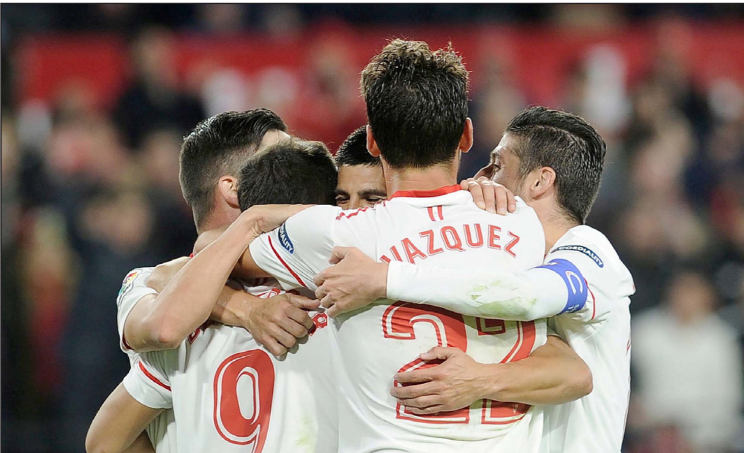
لاعبو اشبيلية يمتنون تكرار احتفالهم الليلية بتأهلهم الى الدور الثاني