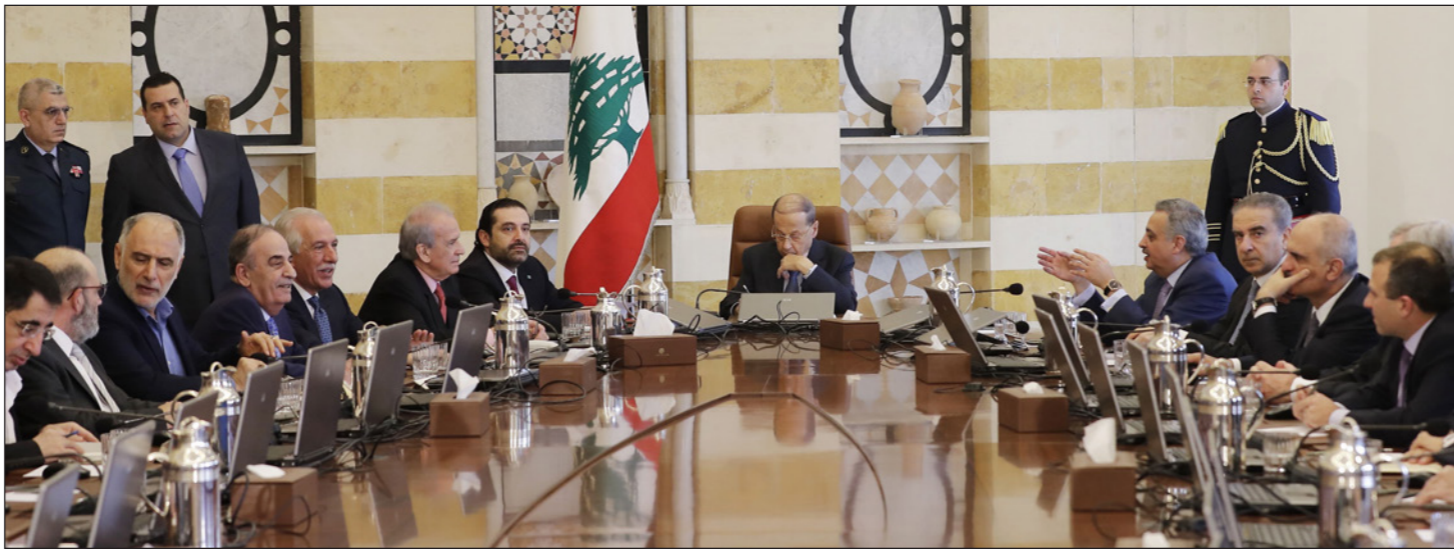
عون والحريري والوزراء أثناء انعقاد مجلس الوزراء في قصر بعبدا في بيروت امس

التي قام بها مع جميع الأطراف وعدد من قادة دول العالم، وقال إن موقفنا في الأزمة الأخيرة انطلق من عدم قبولنا بأن تيسر أي سلطة في العالم كرامتنا لاننا نعتبر ان لا وطن صغيراً ولا وطن كبيراً بل لكل يجب أن يكون متساوية في العزة والكرامة واعتبر ان موقف لبنان كان موقف مواجهة ما حصل مع تركيا والوزراء ووحدة اللبنانيين تبقى الاساس لحماية الاستقرار في البلاد.» وشكر الحريري لرئيس الجمهورية ادارته الحكيمه لازمة الأخيرة والجهود التي شاركت فيها مكونات الحكومة لحماية الدول، وحثّ لمن قبل ان يضحى احد باستقرار البلاد مهما كانت الظروف وحماية لبنان تبقى فوق كل اعتبار، والموضوع ليس موضوع سعد الحريري بل مصلحة لبنان والمسألة ليست صحة سعد الحريري بل استقرار لبنان ووحده وسمعته وكلنا في السيفية نفسها فإذا غرقت تغرق كلنا وإذا توحدنا نمر العواصف الكبيرة التي تضرب المنطقة وتكون قد نجونا وعلينا أن نكون مع بعض لحماية استقرار لبنان.» وفي وقت يترقب العديد من الأصدقاء على مدى التزام حزب الله بالنأي بالنفس، أعلن وزير التربية والتعليم العالي مروان حمادة داخل مجلس الوزراء «أن الحرص