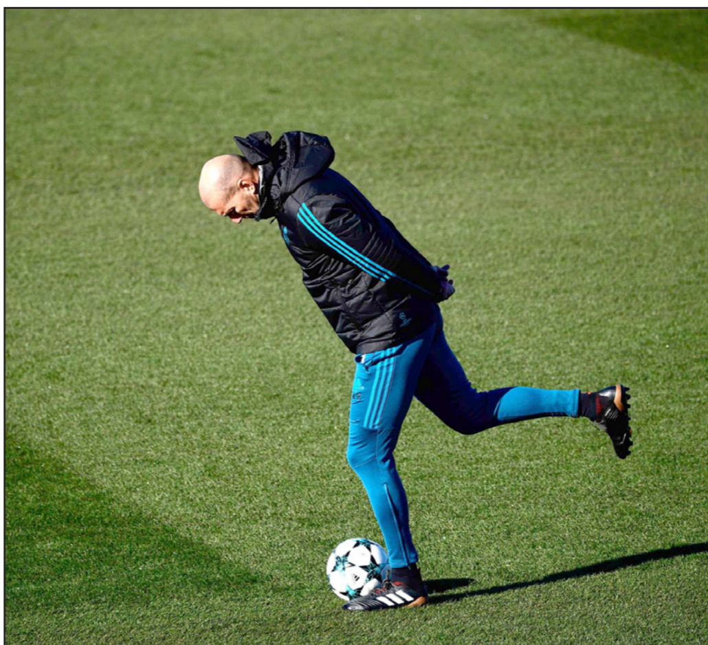
زيدان خلال حصة تدريبية لريال مدريد