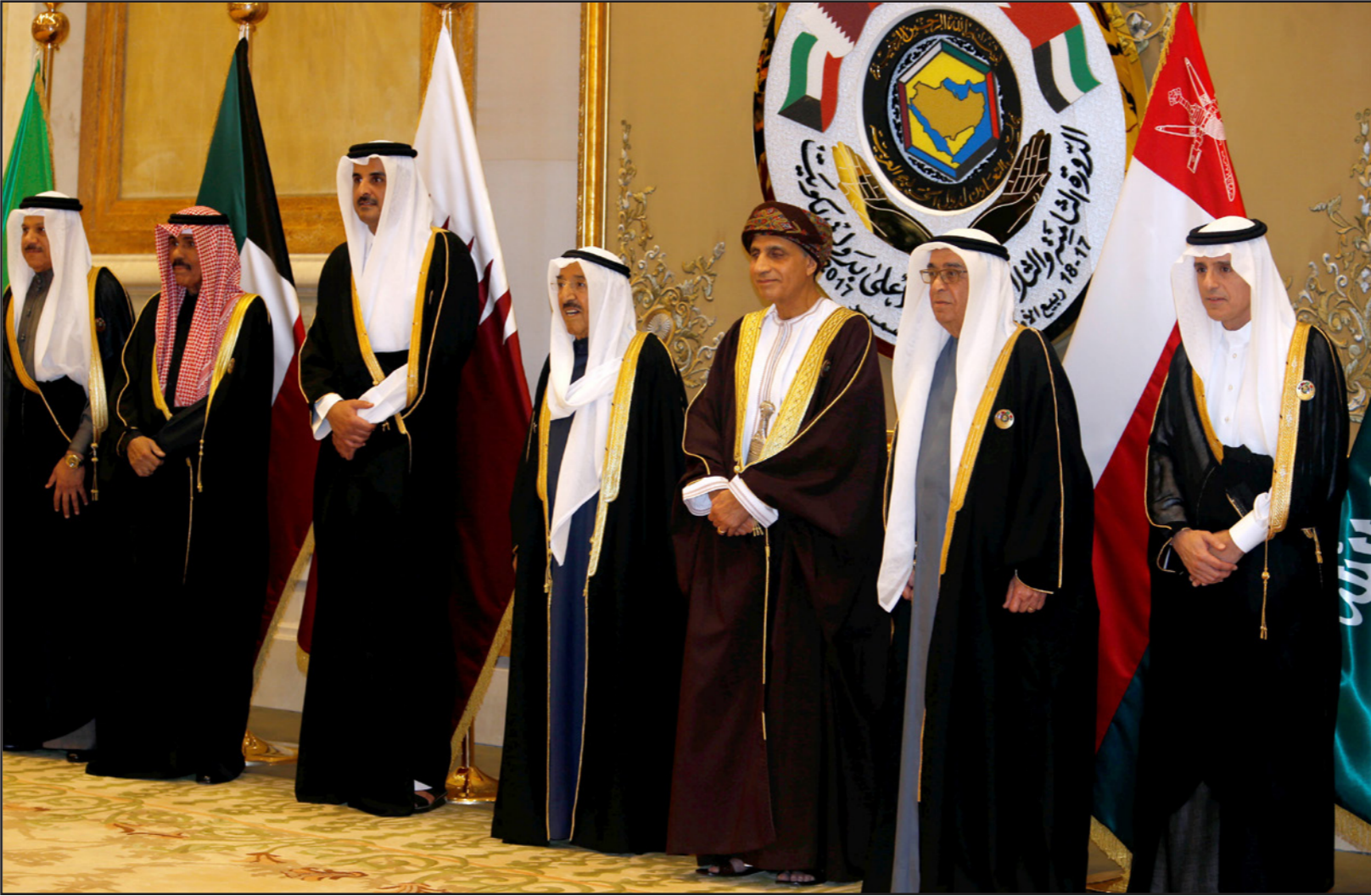
صورة تذكارية للمشاركين في قمة الكويت