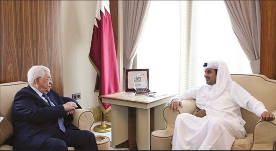
أمير قطر في لقاء سابق مع الرئيس محمود عباس