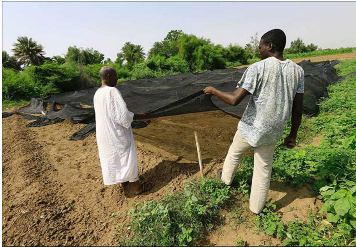
مزارعان يغلريان بذور اشغال في مزرعة تجريبية لشركة زراعية صينية شمال الخرطوم

■ الخرطوم - الأناضول: كشف نائب رئيس الوزراء السوداني، مبارك الفاضل المهدي، عن مفاوضات سودانية تركية لتخصيص مساحة مليون فدان في بلاده، تستفيد منها تركيا في مشروع زراعي استراتيجي. وقال المهدي، الذي يشغل أيضا منصب وزير الاستثمار، في مقابلة «أيدت الرئاسة التركية رغبتها في إقامة أكبر المشاريع الزراعية الاستراتيجية في السودان.. هناك تأخر في المشروع لأسباب فنية تتعلق بتحديد مكان الأرض». وأوضح أن السلطات السودانية خصصت المساحات المطلوبة في مناطق متعددة، لكن الحكومة التركية أبدت رغبتها في أن يكون المشروع على رقعة زراعية واحدة. وأشار إلى أن وزارة الزراعة تسعى الآن لتوفير المساحة المطلوبة، لتمكين أنقرة من إقامة استثمار زراعي مؤسسي، يضاف للمشاريع التركية الناجحة المملوكة للأفراد. ويمتلك السودان مقومات زراعية هي الأكبر في المنطقة العربية، بواقع 175 مليون فدان صالحة للزراعة، إلى جانب مساحة غابية تقدر بحوالي 52 مليون فدان، كما تمتلك 102 مليون رأس من الماشية، فضلا عن مطبخ مطري سنوي يزيد عن 400 مليار متر مكعب. وتساهم الزراعة، التي يعمل بها ملايين السودانيين، بـ 48 في المئة من الناتج المحلي الإجمالي للبلاد. وشدد نائب رئيس الوزراء السوداني على أهمية الاستثمار الوطني الذي تعتمد عليه الدولة في زيادة دخلها، مؤكدا في الوقت ذاته أن تدفق الاستثمارات الأجنبية إلى السودان يتطلب بلدا مستقرا، وسياسة اقتصادية تعالج أضرار الأوضاع الأمنية، وتضع حدا للأجندة الحزبية الضيقة التي صاحبت سياساته الخارجية، وشوّهت سمعته. يذكر أنه سبق تخصيص مليون فدان من أخصب الأراضي الزراعية لصالح السعودية ضمن مشروع خزان «ستيت» في ولاية