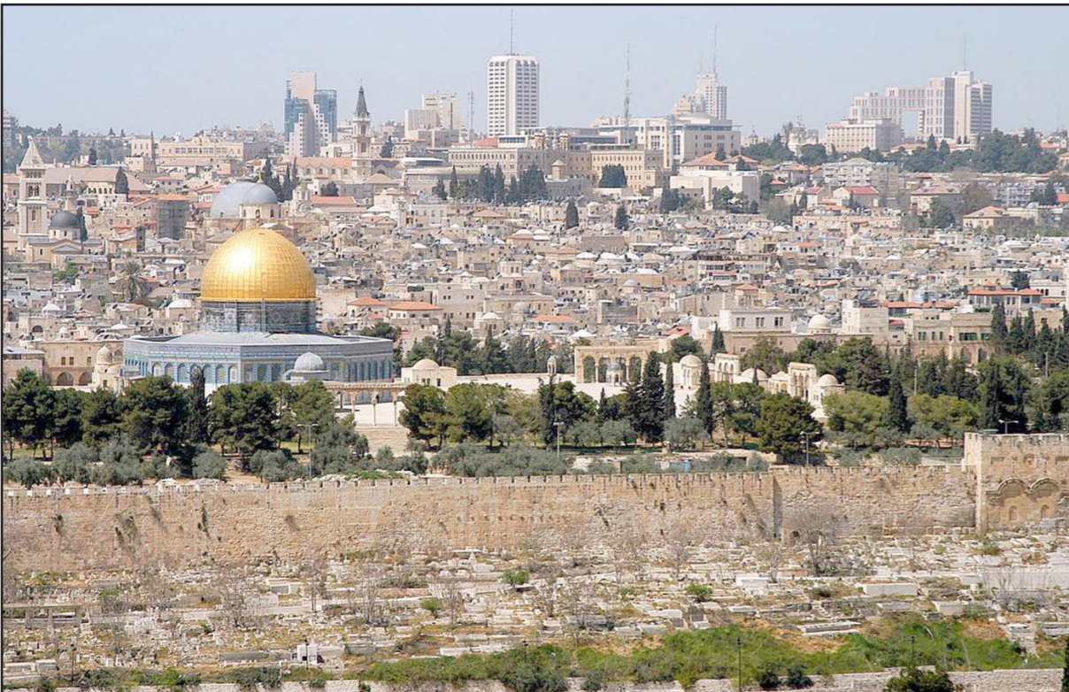
منظر عام لمدينة القدس

« نوايا ترامب لن تثير أي أصداء في العالم العربي؛ دول الخليج تتعجل تطبيع علاقاتها مع إسرائيل... ومصر منسغلة بمحاربة التطرف الإسلامي»