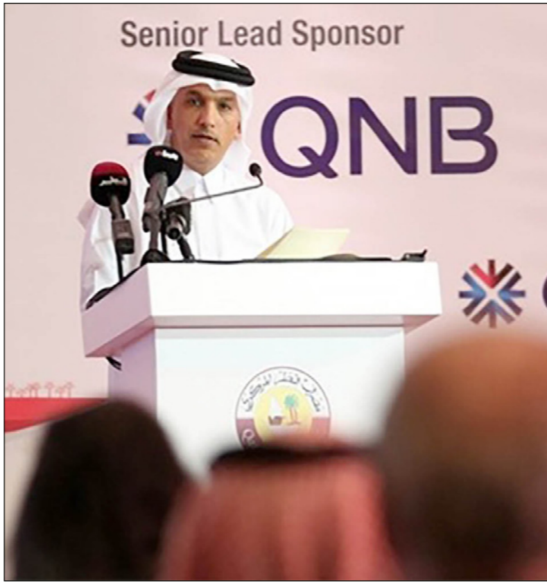
وزير مالية قطر يتحدث أمام مؤتمر يورو مني في الدوحة أمس

وسنوات حتى ينسأه الناس، ولا اعتقد أنهم سينسون»، واصفا الأشهر الأخيرة بأنها كانت «اختبار تحمل» لقطر ماليا وسعسكريا