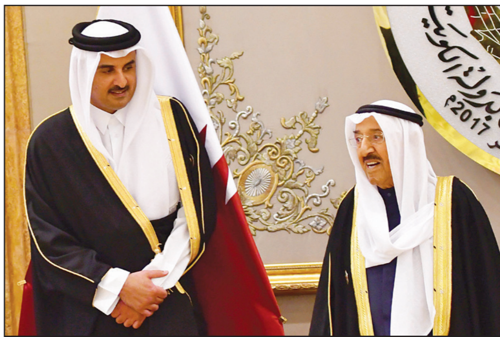
أميرا قطر والكويت خلال اجتماعات القمة أمس