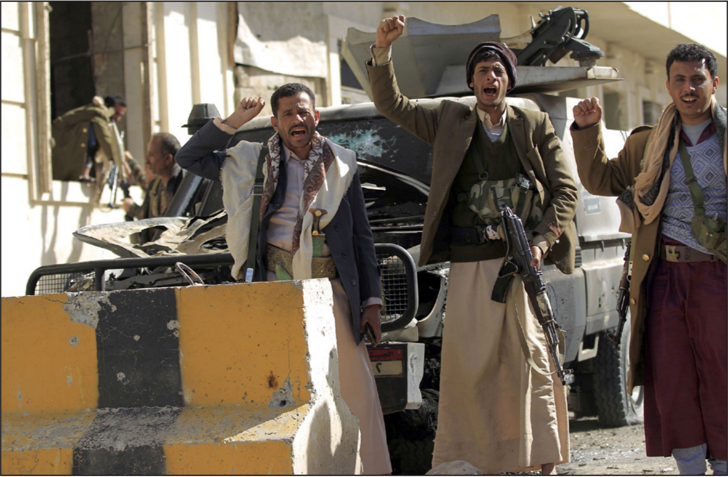
مقاتلون حوثيون يهتفون بعد مقتل صالح

وأشار إلى أن الاستفادة الوحيدة لحزب المؤتمر في أن غياب صالح من المشهد سوف يتيح له فرصة إعادة بناء نفسه كحزب سياسي حقيقي بعد أن ظل حزباً تابعاً لصالح على مدى تاريخه.