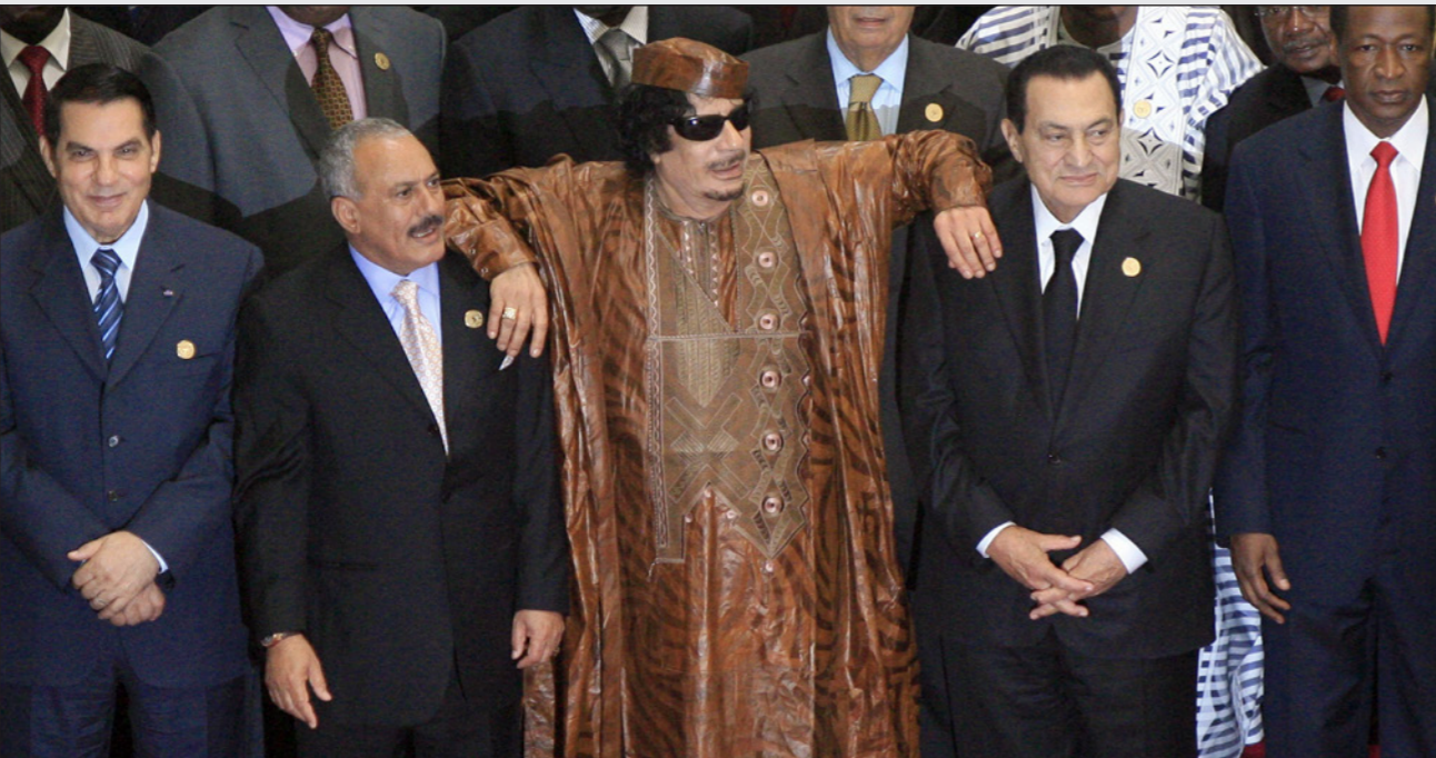
الرؤساء العرب الذين اطاحت بهم ثورات الربيع العربي حسني مبارك - القذافي - علي عبد الله صالح وزين العابدين بن علي