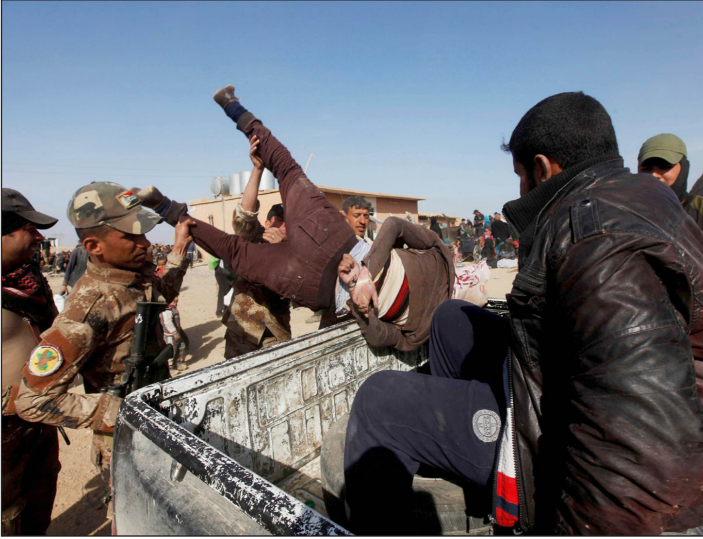
عناصر من الجيش العراقي لحظة إلقاء القبض على أحد المشتبه به من عناصر تنظيم «الدولة»

في الموأزة، قالت منظمة «هيومن رايتس واتش» إن السلطات القضائية الاتحادية والكرديّة في العراق تنتهك حقوق المشتبه بانتمائهم لتنظيم «الدولة الإسلامية» من خلال إخضاعهم لمحاكمات معيبة واحتجازهم بشكل تعسفي في أوضاع قاسية. ويعتقد أن تفجير الحافلة التي أعلنها التنظيم عقب هزيمته في العراق وسوريا جرى أسر واعتقال آلاف يشتبه بانتمائهم له وتقديمهم للمحاكمة. وحسب المنظمة المعنية بمراقبة أوضاع حقوق الإنسان،