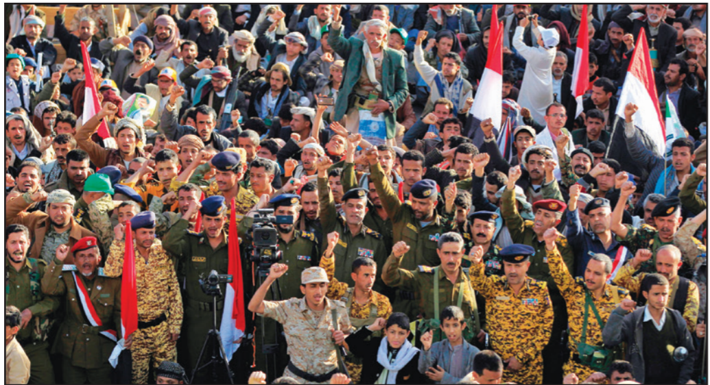
انصار الحوثيين خلال تظاهرة احتفال بمقتل الرئيس اليمني السابق علي عبد الله صالح في صنعاء أمس

الحوثيين بالقوة. ونفى أحمد علي الرويات التي نشرتها جماعة الحوثي حول كيفية مقتل والده، وقال إن والده «استشهد» في منزله في صنعاء «حاملًا سلاحه ومع رفاقه»، وكشف أن الرواية الحوثية غير صحيحة، والتي قالت إن صالح قتل وهو في طريقه إلى بلدة سحان التي يندر منها، أثناء محاولته اللجوء إليها. وفي تغريدة لافته نفى حسين العزي القيادي في حركة الحوثيين وفاة القيادي المؤتمري ياسر العواضي، الذي أعلن عن مقتله الإثنين. وقال العزي إن العواضي «بخير» وإنه لم يكن من «الخونة»، الأمر الذي أثار شكوكا حول دور العواضي في المعركة. وفي السياق، أفاد موقع «أمد نيوز» القريب من التيار الإصلاحي الإيراني، أنه تم اتخاذ قرار اغتيال الرئيس اليمني السابق علي عبد الله صالح بالتنسيق مع جهاز الاستخبارات التابع للحرس الثوري الإيراني. وأضاف في خبر له أمس، أن العملية تمت قبل ست عشرة ساعة من إعلان الخبر من قبل الحوثيين. وكانت الرواية الحوثية عن مقتل صالح قوبلت بشكوك واسع من قبل خبراء في الطب الجنائي وخبراء عسكريين وروايات شهود عيان. (تفاصيل ص 8)