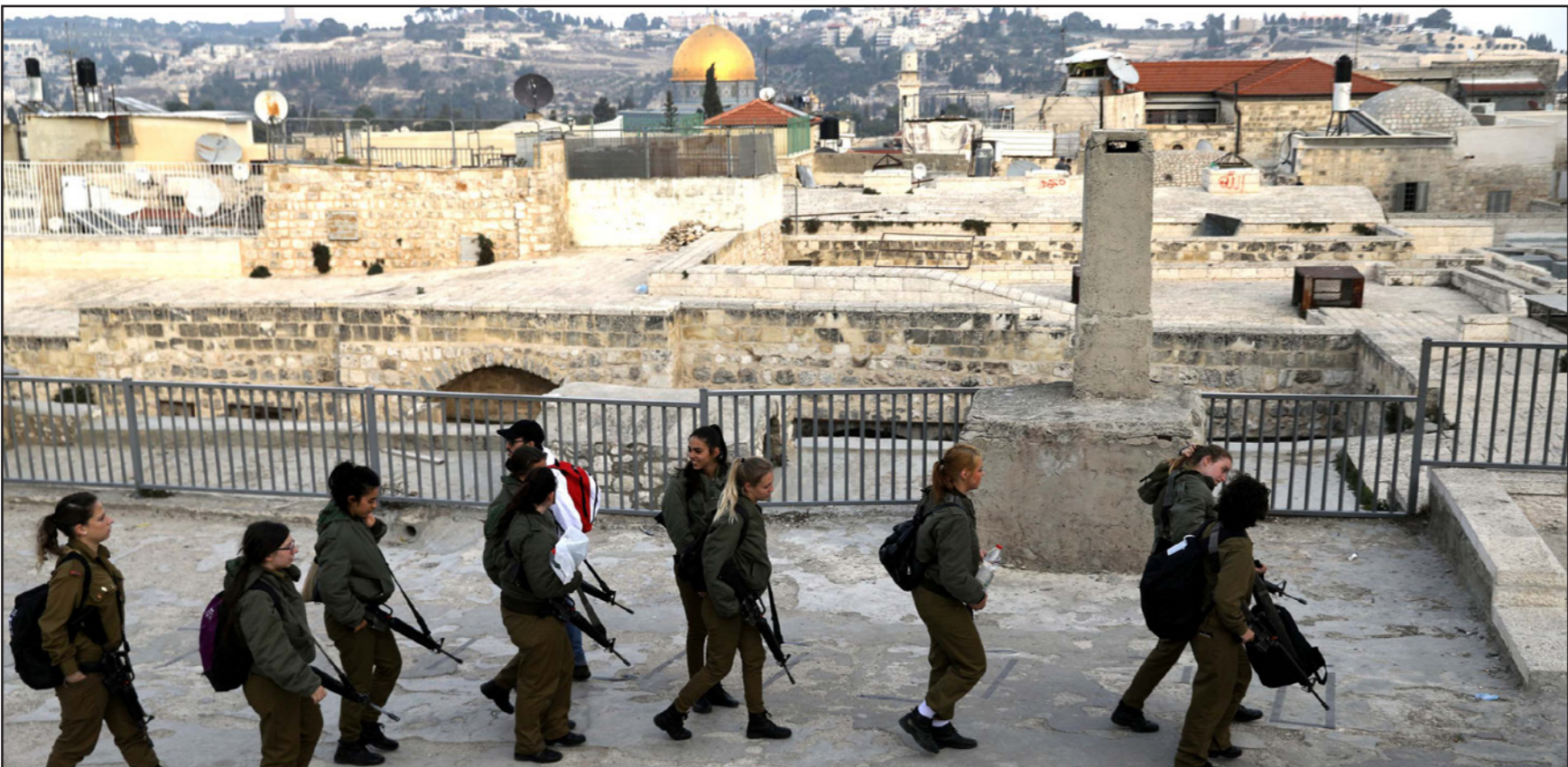
قوات إسرائيلية تنتشر في أزة القدس

ويوضح المصدر أن الرئيس عباس (أبو مازن) رفض ذلك، وأوضح أنه لم يتدخل في الحرب الدائرة في سوريا وأن منظمة التحرير الفلسطينية أخطأت حينما تدخلت في الشؤون الأردنية قبل 1970 وفي موضوع الكويت والعراق عام 1991 ، باعتبار أن القضية الفلسطينية تقتضي عدم اتخاذ مواقف كهذه. وأن مصلحة المخيمات الفلسطينية تتطلب عدم التدخل في الشؤون اللبنانية الداخلية. وتابع «أشار موقع الرئيس عباس حفيظة الجانب العربي والقدس المحتلة، الملكي وسط توتر و غضب، ولاحقا وفي الليلة نفسها تم استدعاء الرئيس عباس مجددا ومارسوا ضغوطا جديدة عليه وأسعدوه تهديدا مبطنا خفيفا بأن موقفه هذا سيدفعهم لتحويل ملف المخيمات