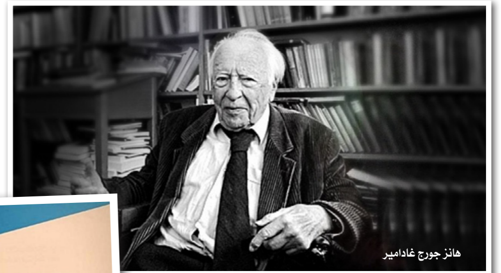
هانز جورج غادامير