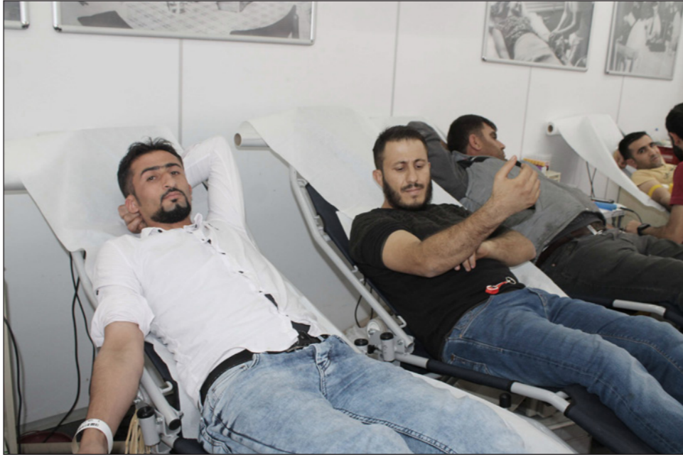
سوريون يتبرعون بالدم للهلل الأحمر التركي في قضاء سيلويي

وفيما يتعلق باللاجئين السوريين في تركيا، يجري التعامل مع ملفات تجنيسهم تحت بند «الاستئذان» حيث ركز كبار المسؤولين الأتراك في السابق على أن منح الجنسية للسوريين سيكون بالمرجة الأولى للكفالات والتعميم والحاصل على إذن عمل رسمي في البلاد. وحسب ما استقصد «القدس العربي» للعديد من تجارب اللاجئين السوريين فإن ما جرى خلال الأشهر الماضية كان باليتين مختلفتين، بحيث تم جزء مهم من عمليات التجنيس