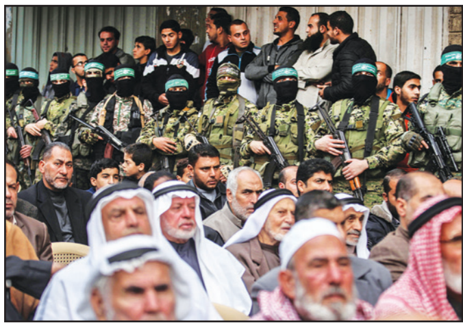
فلسطينيون يراقبون مقاتلين من كتائب عز الدين القسام، النزاع العسكري لحركة «حماس» في غزة أمس