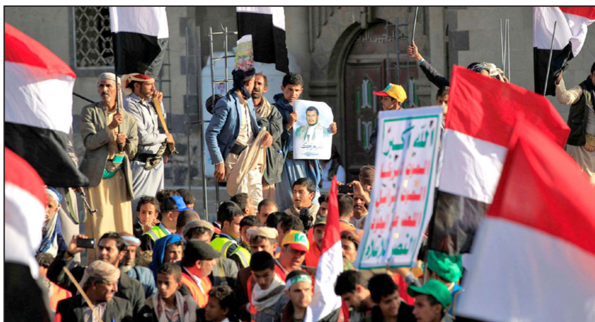
جانب من تظاهرة للحوثيين في صنعاء عقب مقتل صالح