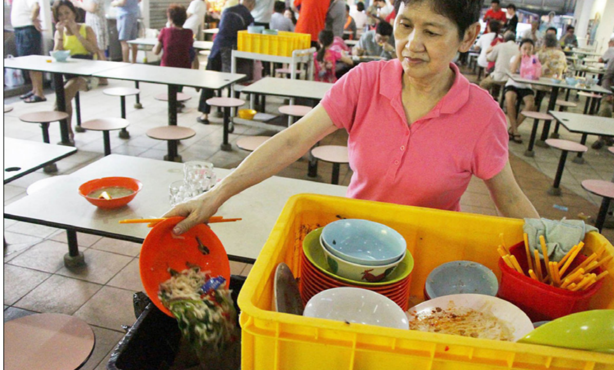
عاملة في مطعم في سغاforeة تلقي في سلة المهملات بقايا طعام

■ سغاforeة - د ب آ: يتخلف عامل قمامة كبير في السن المائدة في واحد من بين العديد من أسواق المأكولات التي يقيمه الباعة الجائلون في الهواء الطلق في مختلف أنحاء سغاforeة، ويدفع الرجل أمامه عربة صغيرة مكدسة بالأطباق غير النظيفة التي مازالت تحتوي على بقايا الطعام. ويبدو أن أحد الزبائن قد طلب لتوه وجبة طعام ثم انصرف دون أن ينتهي منها، حيث مازالت قطع الدجاج باقيا على حالها لم يمسهما أحد وكذلك شرائح الخضروات المقلية وصفي كومة من الأرز. وربما يكون ترك وجبة غداء دون الانتهاء منها أمرا معتادا لا يلفت إليه أحد، ولكن إذا ضربنا عدد هذه الوجبات في تعداد سكان سغاforeة الذي يربو على عدة ملايين، فإن الأمر عندئذ قد يبدو مشكلة جديدة بالاهتمام. وتعكس الدراسات الإحصائية نتائج مؤسسة في هذا الصدد، حيث تم إهدار 791 ألف طن من الأطعمة في سغاforeة في عام 2016، بما يوازي طبقين من الأرز يوميا لكل مواطن في البلاد، حسبما تكشف بيانات الوكالة الوطنية للبيئة في سغاforeة.