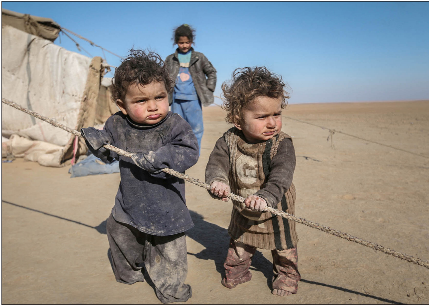
أطفال لاجئون في الصحراء شمال سوريا

مرتبطين باتفاقية تجارة حرة واسعة النطاق، وكاستثناء من القواعد الاعتيادية، قد تطلب تركيا السماح لها بدعم صادرات المنتجين السوريين أو تشجيع استهلاك سلعهم داخل تركيا أو قد تطلب من دول أخرى الرسوم الجمركية على الواردات من تلك السلع، ويطلب مشروع القرار الوزراي بالاعتراف بأن أزمة اللاجئين السوريين والهجرة «مسائل تتطلب تقاسم المسؤولية»، ويطلبهم مشروع القرار بالاعتور على سبل تحسين الأوضاع المعيشية للنازحين السوريين عبر سياسات مختارة سيكون لها تأثير مستمر، تهدف إلى زيادة مشاركة النازحين السوريين في الحياة الاجتماعية والاقتصادية وتوفير فرص العمل في الدول المضيفة».