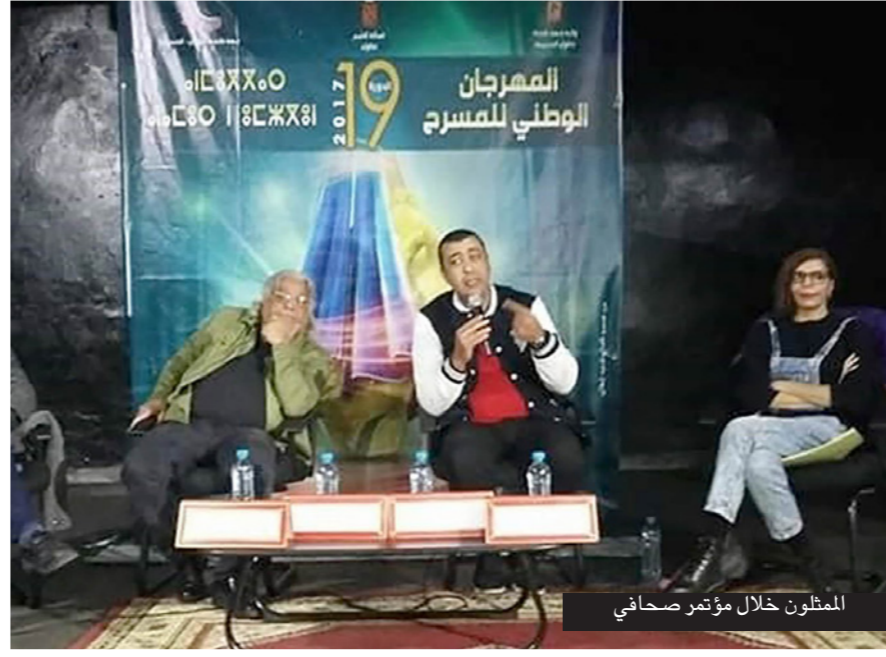
الممثلون خلال مؤتمر صحفي