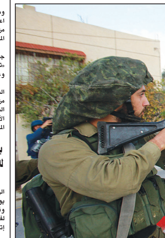
فلسطينيون يتحدون قوات الاحتلال الإسرائيلي أثناء احتجاجات لنصرة القدس في بلدة النافورة قرب مدينة نابلس