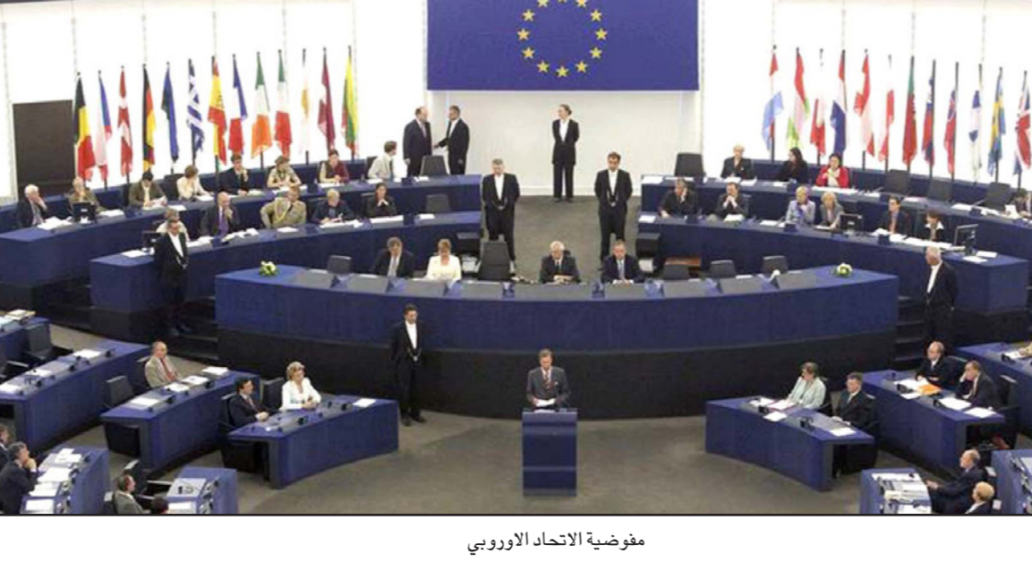
مفوضية الاتحاد الأوروبي