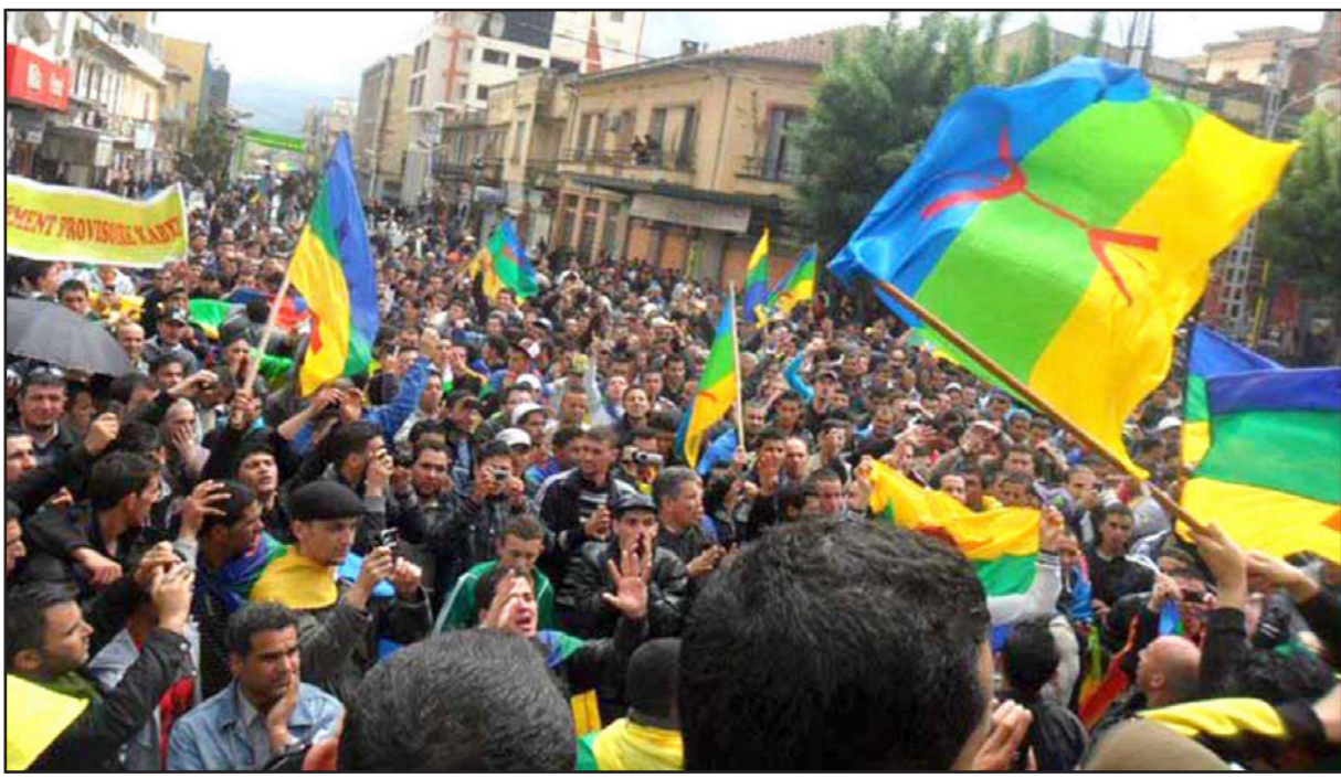
جانب من مظاهرات أمازيغية في منطقة القبائل في الجزائر