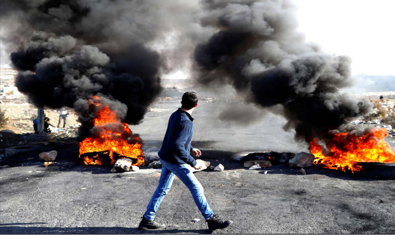
إحدى نقاط المواجهة بين المتطهين الفلسطينيين وقوات الاحتلال في بيت ايل شمال الضفة الغربية أمس