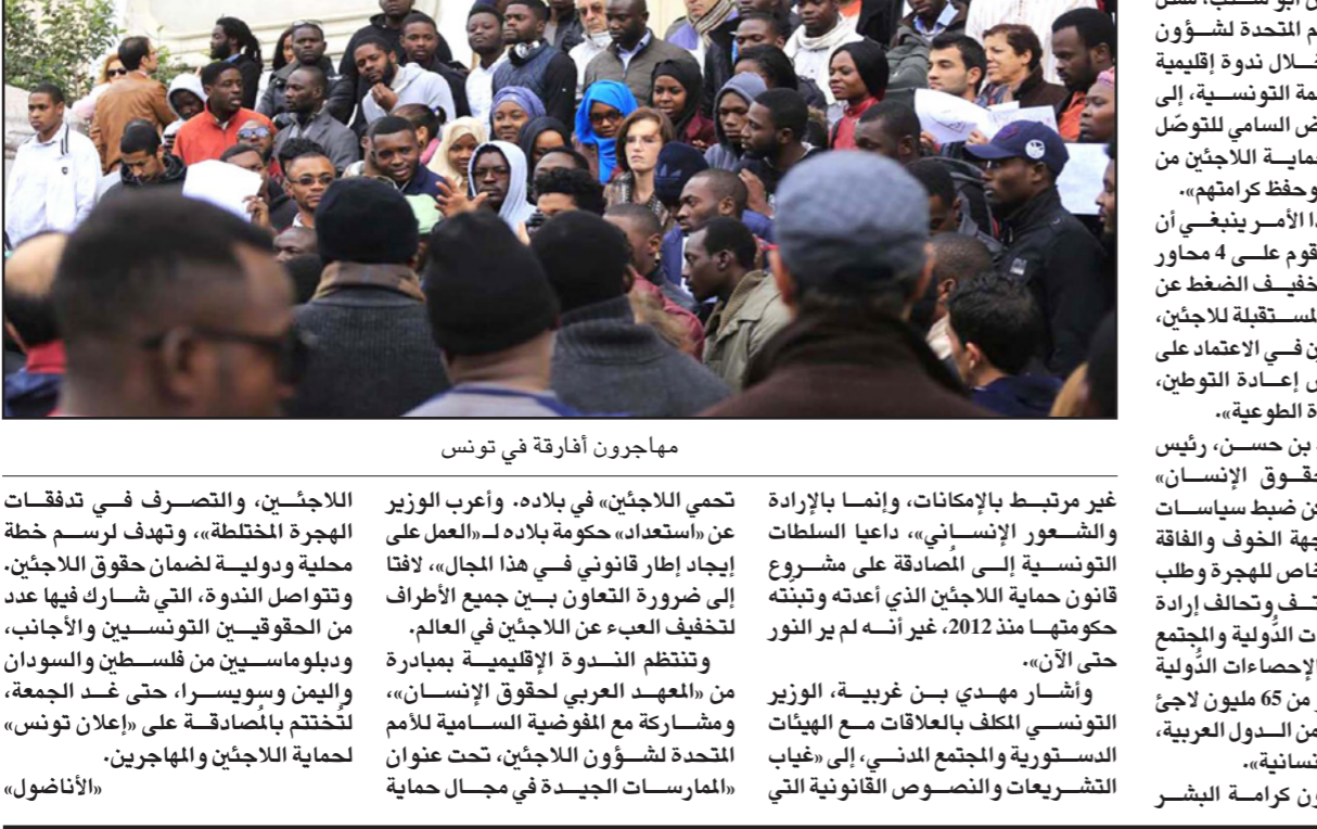
مهاجرون أفارقة في تونس