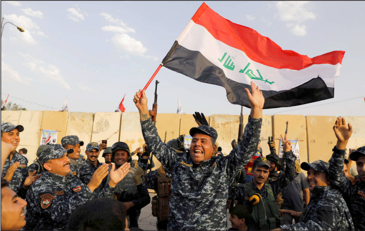
عناصر من الجيش العراقي يحتفلون بالانتصار على تنظيم «الدولة»

رغم أن العدد الأكبر من سكانها ما زال في مخيمات اللجوء، جرى احتفال في مدينة الموصل بعيد «النصر» على تنظيم «الدولة الإسلامية» الذي اتخذ من ثاني مدن العراق عاصمة له على امتداد ثلاث سنوات. وأعلن رئيس الوزراء العراقي، حيدر العبادي، في التاسع من الشهر الجاري النصر على التنظيم بعد استعادة السيطرة على كامل الأراضي التي سيطروا منذ 2014. ونظمت قيادة عمليات نيوى استعراضاً عسكرياً بمشاركة كافة القوات الأمنية المتنوعة في ساحة الاحتفالات في الساحل الايسر، الجانب الشرقي لمدينة الموصل، الواقعة في شمال العراق. وزينت الشوارع المحيطة بالاعلام العراقية والبلونات الملونة، فيما اصطف الجنود والعربات في بداية الشارع منذ الصباح الباكر. ونظم الاحتفال بعد أربعة أيام من إقامة «استعراض يوم النصر» في بغداد. وقال قائد شرطة نيوى اللواء الركن، واثق الحمداني: «هذا الاستعراض يعد الأول من نوعه وفي حجمه وتنظيمه الذي تشهده الموصل بعد تحريرها». وأضاف «شارك فيه الآلاف من أفراد القوات الأمنية والحشد الشعبي، ومئات العجلات والمركبات والآليات العسكرية والمدنية». وأوضح أن هذا الاستعراض له أهمية ورمزية كبيرة بعد الانتصار على الإرهاب في الموصل ككل، كافة، وهو رسالة للعالم اجمع أن الموصل استعادت عافيتها ورجعت إلى حضن العراق.