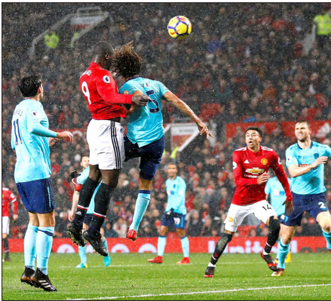
نجم مانشستر يونايتد روميلو لوكاكو (9) يسجل هدف فريقه بضربة رأسية

■ مانشستر - رويترز: استعاد مانشستر يونايتد البعيد عن مستواه قذرا من التوازن عقب الخسارة في لقاء القمة أمام جاره مانشستر سيتي ليحقق فوزا باهتا 1-0 صفر على بورنموث في الدوري الانكليزي الممتاز لكرة القدم على استاد اولد ترافورد الاربعاء الماضي. وكان هدف روميلو لوكاكو التاسع في الدوري الانكليزي الممتاز هذا الموسم، والذي جاء من ضربة رأس في الدقيقة 25 عند القائم البعيد اثر تمريرة عرضية من خوان ماتا، كافيًا لنجح يونايتد صاحب المركز الثاني الانتصار لكن الفضل يعود أيضا للحارس ديفيد دي خيا في حصد الثلاث نقاط. وابعد الحارس الاسباني محاولات من تشارلي وليامز