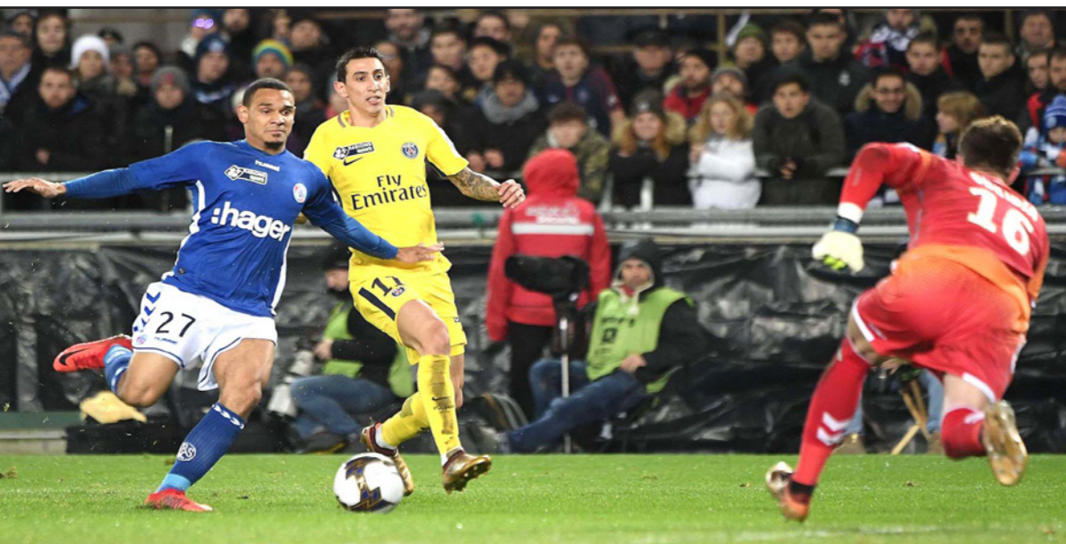
نجم سان جيرمان أنخل دي ماريا (وسط) يحاول التسديد في مرمى ستراسبورج

■ برلين - رويترز: أحرز روبرت ليفاندوفسكي متصدرا قائمة هدافي دوري الدرجة الأولى الألماني لكرة القدم هدفه 15 هذا الموسم في المسابقة ليقود بايرن ميونخ المتوثر للفوز 1 - صفر على كولونيا متذيل الترتيب الاربعاء الماضي والابتعاد بتسع نقاط في الصدارة. وفي يوم أصبح فيه فرانك ريبري أكثر اللاعبين الأجانب مشاركا مع بايرن برصيد 3666 مباراة في كل الليولات عانى بطل ألمانيا للوصول إلى مستواه المعهود لكنه فعل ما يكفي ليرتفع رصيده إلى 38 نقطة. ويتقدم بايرن بتسع نقاط عن شالكه