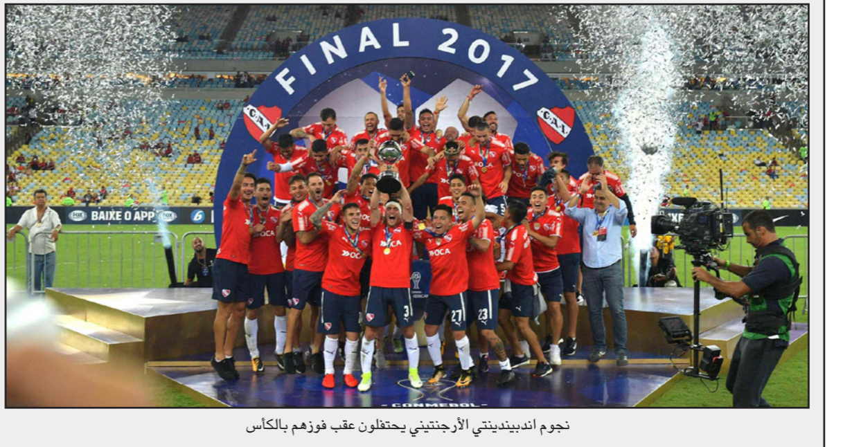
نجم انديبيندينتي الأرجنتيني يحتفلون عقب فوزهم بالكأس