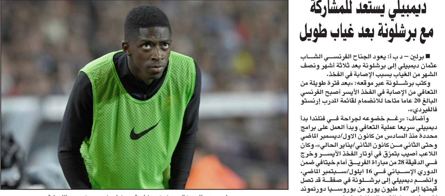
ديمبيلي يستعد للعودة الى صفوف برشلونة بعد غياب شهر عدة بسبب الاصابة

برشلونة - د ب أ: أغلق فيكتور بالديش، الحارس السابق لبرشلونة حساباته الرسمية على مواقع التواصل الإجتماعي، وهو ما فسره وسائل الإعلام بأن الحارس السابق اعتزل الحياة العامة. واستنادا على ما قاله بالديش في وقت سابق بأنه عندما يترك كرة القدم سيسعى إلى التوراري بعيدا عن الأضواء. ورغم أنه لم يعلن هذا بشكل رسمي، اعتزل بالديش (35 عاما) في منتصف 2017، عندما فسح عقده مع ميدلزبره الإنجليزي في نهاية الموسم الماضي. وقام الحارس السابق لبرشلونة والمنتخب الإسباني بمسح جميع الصور الموجودة على حسابه على «انستغرام» بعد يوم واحد من قيامه بنشر رسالة