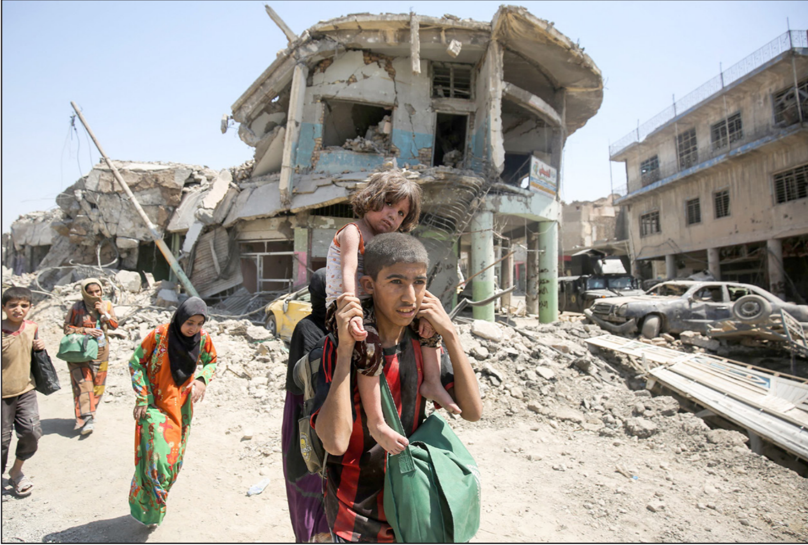
نازحون عراقيون من الموصل