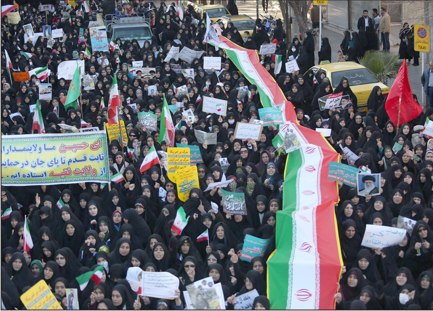
مظاهرات مؤيدة للنظام في إيران أمس

داخل أوساط رجال الدين والأمن الاحتجاجات بعد أن لجأ الإيرانيون إلى مواقع التواصل الاجتماعي للتعبير عن غضبهم. ويتراكم الغضب منذ الشهر الماضي. وشارك آلاف الإيرانيين بالكتابة باستخدام وسم (هاشتاغ) «أنا مستاء» الذي أعربوا من خلاله عن استيائهم من روحاني الذي انتخب على أساس وعود بمعالجة البطالة والسماح بحريات اجتماعية أكبر.