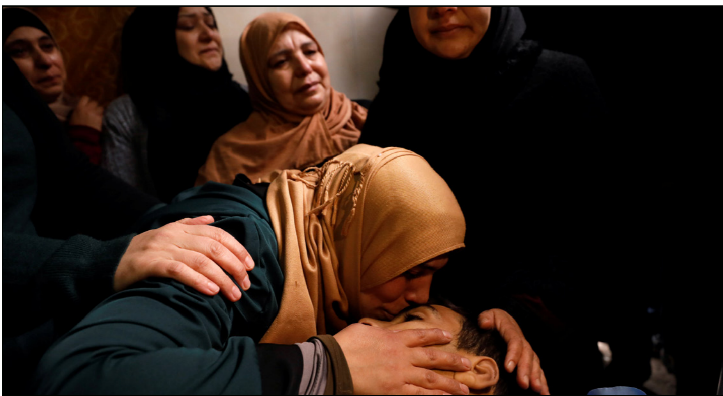
سيدة فلسطينية تطيع قبلة الوداع على جبين ابنها الشهيد

وأضاف «ستوجه إلى محكمة العدل الدولية لاستصدار فتوى حول المكانة القانونية للأسرى وفق القانون الدولي وسوف نستخدّم كل الأدوات القانونية للدفاع عن شرعية نضال المعتقلين وصدقهم القانوني والشرعي، ولن نخضع للقوانين العنصرية الإسرائيلية، وسوف نستمر في حماية أسرنا وعائلاتهم ضحايا الاحتلال الإسرائيلي وإرهاب دولة إسرائيل المنظم».