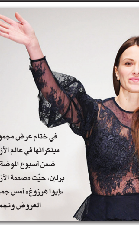
في ختام عرض مجموعة ميكرتها في عالم الأزياء ضمن أسبوع الموضة في برلين، حيث مصممة الأزياء «ايوا هرزوغ» أمس جمهور العروص ونجماته

وقد أبلغت السلطات الدنماركية بالوضع من جانب الشرطة الأوروبية «يوربول»، ونشرت هذه الوثائق عبر الشبكة الاجتماعية بين 2015 وخريف عام 2017 وتم تشاركها من نحو 800 فتى و200 فتاة تراوحت أعمار غالبيتهم بين 15 عاما و20. وأعلنت الشرطة أنها بدأت ملاحقات لجميع هؤلاء.