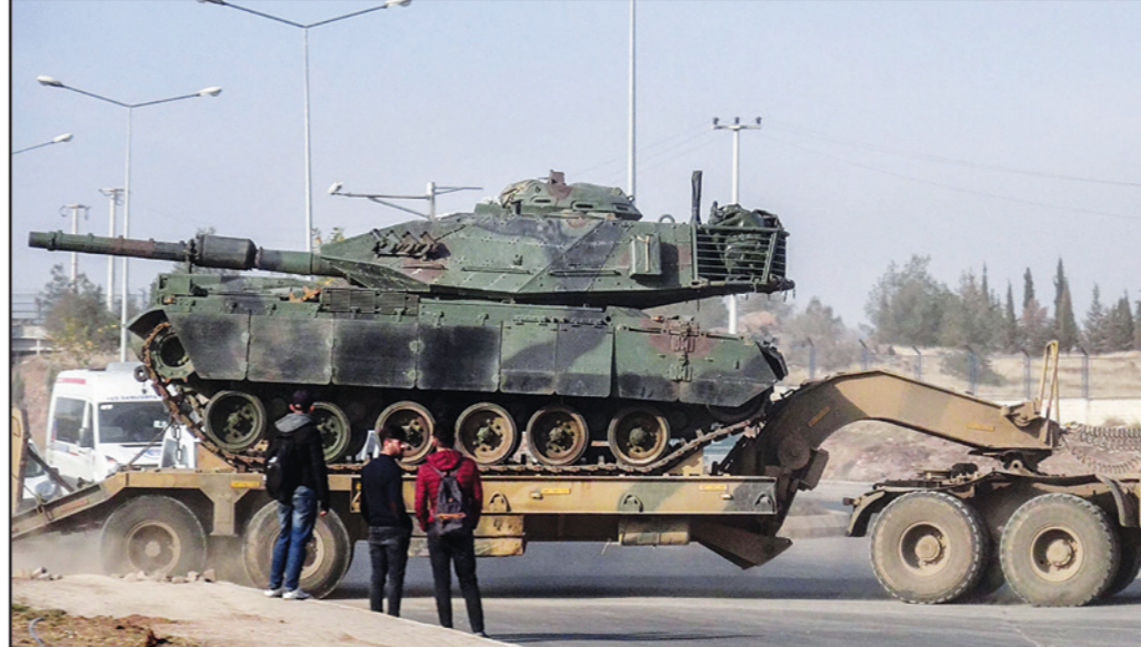
عربة تحمل دبابة تركية متجهة إلى الحدود السورية أمس