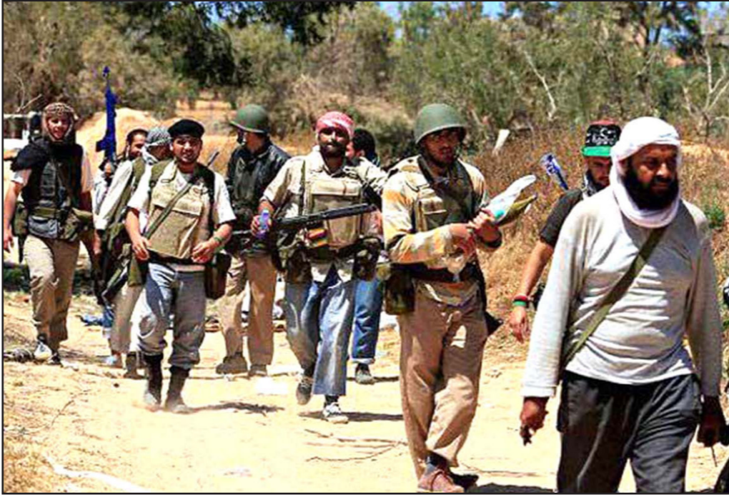
عناصر من الجماعات المتطرفة في المغرب العربي

أثارت دعوة بعض رجال الدين السلطات التونسية لتصنيف «الجبهة الشعبية» (أكبر كتلة يسارية معارض) تنظيمًا إرهابيًا في إثر اتهامها بـ«التورط» في أعمال الفوضى والتخريب، جدلاً كبيراً في البلاد، حيث أكد أحد الدعاة في استطلاع الرأي نشره على صفحته في موقع «فيس بوك» إن 75 من مئة من التونسيين يوافقون على هذا المقترح، وهو ما دعا نشطاء يساريين إلى تنظيم استطلاعات جديدة حول تصنيفه شخصية «إرهابية»، فيما اتهمه أحد الإعلاميين إلى التورط في شبكات التسفير لبؤر التوتر. وكان الشيخ رضا الجوّادي نشر استطلاعاً للرأي حول تصنيف «الجبهة الشعبية» منظمة إرهابية، حيث بيّن الاستطلاع الذي شارك فيه أكثر من ثلاثة آلاف شخص أن 75 من مئة من التونسيين يؤيدون هذا الأمر. استطلاع الجوّادي جاء بعد دعوة