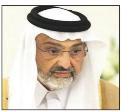
الشيخ عبد الله آل ثاني