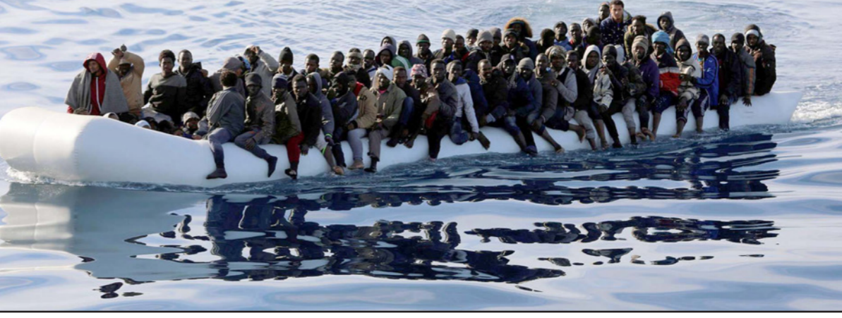
مهاجرون غير شرعيين في قارب مطاطي قرب السواحل الليبية

البحرية طرابلس وعلى ظهره 352 مهاجراً غير شرعي من جنسيات أفريقية مختلفة، بينهم 65 امرأة و 11 طفلاً.