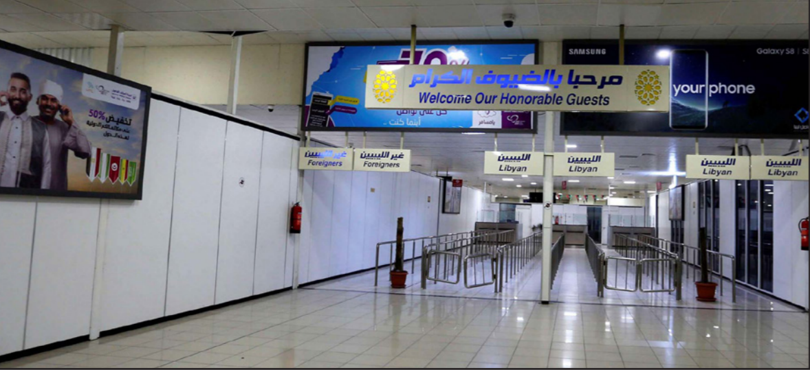
أحد صالات مطار معيتيقة الدولي في العاصمة الليبية طرابلس وقد خلا من المسافرين