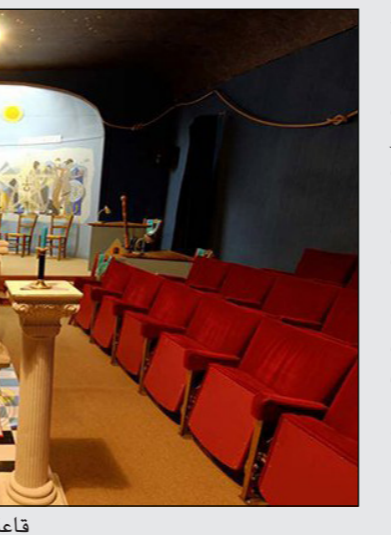
قاعة محفل ماسوني