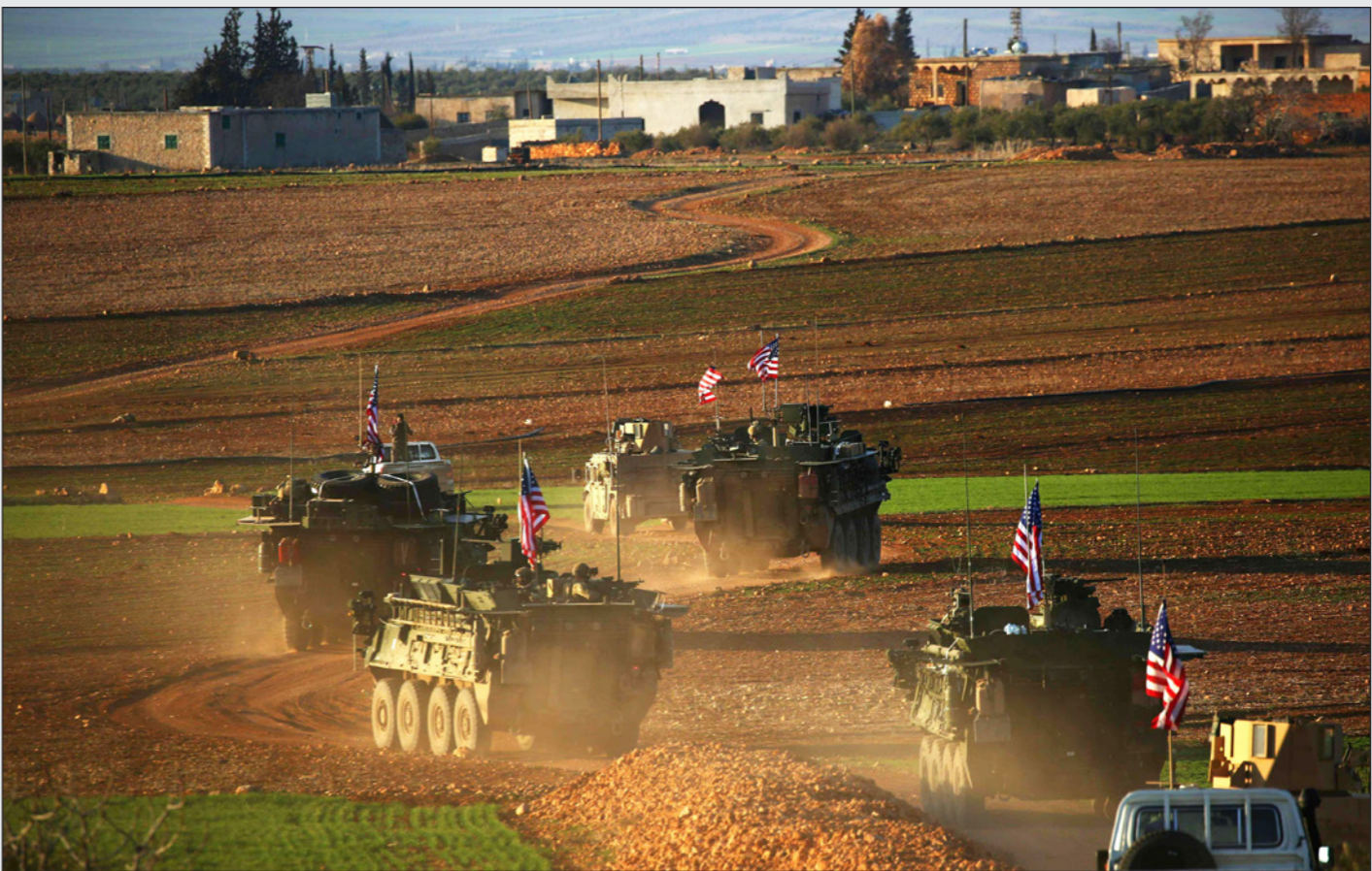
مدرعات تابعة للجيش الأمريكي على أطراف مدينة متنج شمالي سوريا

لندن – «القدس العربي» من إبراهيم درويش: تعتبر تصريحات وزير الخارجية الأمريكي ريكس تيلرسون عن الوجود الأمريكي في سوريا الأولى التي تصدر عن مسؤول بارز في إدارة الرئيس دونالد ترامب. وقال الوزير الأمريكي إن وجود القوات مفتوح لمنع عودة تنظيم الدولة والتأكد من عدم سيطرة إيران أو نظام بشار الأسد على المناطق التي طرد منها التنظيم في العام الماضي. وأكد تيلرسون أن بقاء القوات الأمريكية في المناطق الكردية يعني عدم تكرار الإدارة الأخطاء التي ارتكبتها الإدارة الماضية عندما سحبت القوات من العراق عام 2011. والأخطاء التي ارتكبت بعد إطاحة النائو بالرئيس الليبي معمر القذافي.