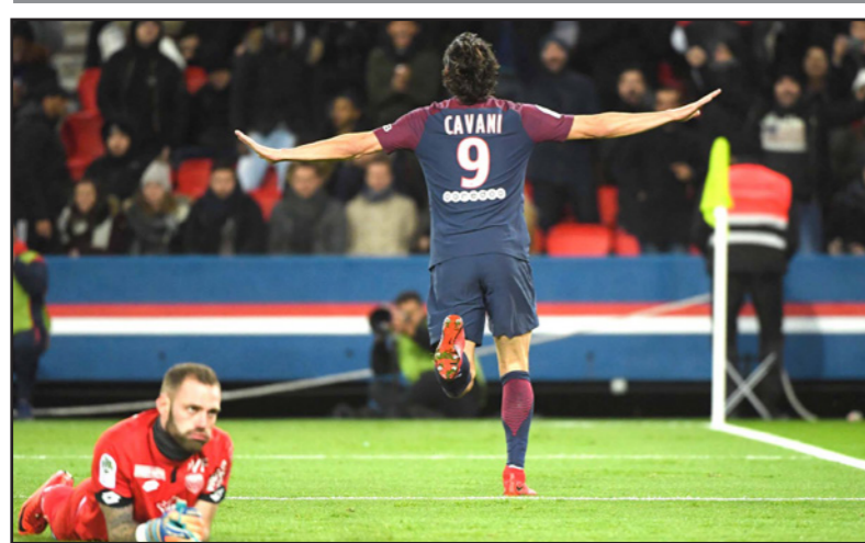
كافاني يحتفل بهدفه الذي عماله به الرقم القياسي لهدافي سان جيرمان

باريس - رويترز: هز نيمار الشباك أربع مرات وتنافس ادينسون كافاني صدارة هدافي باريس سان جيرمان عبر التاريخ في الفوز الكبير 8-صفر على ديجون في الدوري الفرنسي. ورفع نيمار العائد من الإصابة رصيده إلى 15 هدفا هذا الموسم وأضاف أنجيل دي ماريا هدفيك والبديل كيليان مبابي هدفا، وأحرز كافاني هدفا مع سان جيرمان بجمع المسابقات ليعدل رقم زلاتان إبراهيموفيتش الذي لعب للفريق من 2012 وحتى 2016. ويملك سان جيرمان 56 نقطة في 21 مباراة مقبما بفارق 11 نقطة عن ليلون الثاني الذي انتصر 2-صفر على غانغون، ووضع دي ماريا سان جيرمان في المقدمة في الدقيقة الرابعة بتسديدة من عند حدود منطقة الجزاء بعد تمريرة من جوفاني لوسيلسو، وأضاف اللاعب الأرجنتيني الهدف الثاني 11 دقيقة بعد ذلك من مدى قريب، وساءت الأمور أكثر للفريق الضيف بعدما حول كافاني تمريرة عرضية من دي ماريا بضربة رأس داخل الشباك ليجعل