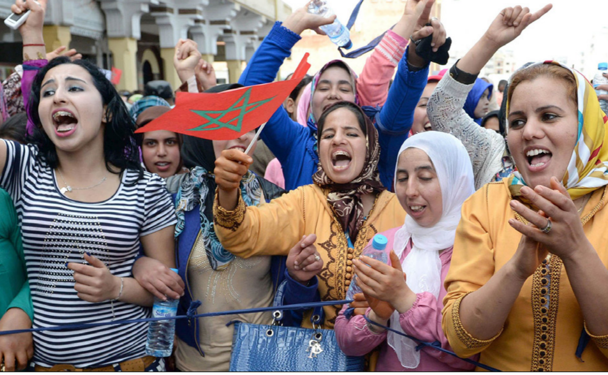
وقفة احتجاجية تطالب بالمساواة بين المرأة والرجل

والتنمية، فيما نالت دعماً من الأحزاب اليسارية وجمعيات الحركة النسائية، لكنها بينت وجود تباين كبير في الآراء في المجتمع المغربي حول المساواة في الإرث. وأوضح المرشد أن المغرب لا يُعارض الحقوق والحريات وفق المنظمة الدولية؛ لكن نولا، من بينها المغرب، لديها التحفظ عليها لكي تحافظ على ما هو أصيل وأساسى ومركزي في مجتمعاتها لكي لا تؤدي إلى تغييرات كبيرة تنتج عنها اضطرابات وقال «نحن في المغرب لدينا وضع متقدم بالنسبة للاتحاد الأوروبي؛ لكننا نسنا دعوا فيه، ونحن لا نشغل بمناطق التطبيق التشريعي بل التقارب التشريعي». وأضاف «إذا كان أصدقاؤنا في الاتحاد الأوروبي يريدون أن نتحمل واجبات العضوية في الاتحاد فليفضلوا علينا بحقوق العضوية لكي نقوم بإنجاز كل هذه الواجبات التي توجد لدينا»، وخطب سفيراء الدول الأوروبية «أنتم وصلتم إلى مجتمع الرفاه عكسنا نحن، ما زلنا نعيش في أفريقيا الفقيرة في بعض المناطق ونعاني من الأمية ونسعى إلى توفير الصحة والتعليم». وقال الوزير المغربي «حقوق الإنسان في أفريقيا حاليا هي توفير الصحة والتعليم ومحاربة الفقر والبطالة والافتقار إلى التعليم». ودعا الاتحاد الأوروبي إلى عدم دفع المغرب إلى السير بسرعة أكبر لكي لا يتجاوز طاقته ويسقط، واحترام الظروف والقدرة المتوفرة لدى الملكة، وتطرق