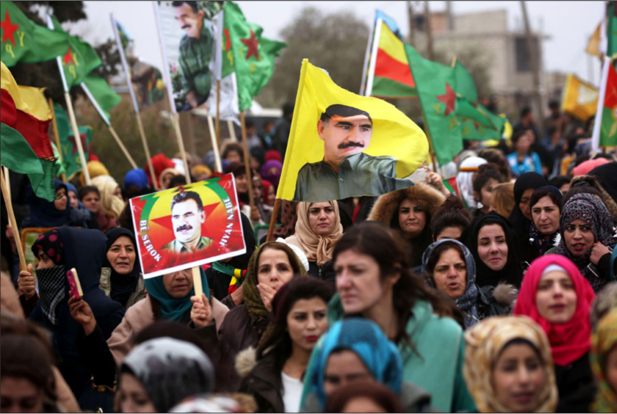
أكراد سوريون يحملون لوحات لقائد حزب العمال الكردستاني عبد الله أوجلان أثناء مسيرة احتجاجية لدعم عفرين

امية ودولية، حيث أرسلت المبادرة إلى الاتحاد الأوروبي والولايات المتحدة الأمريكية. جبهة أصدرت ميليشيا «الجبهة الشعبية لتحرير لواء إسكندرون»، الذي يرأسها القيادي التركي معراج أورال أمس الخميس، بياناً، أعلنت خلاله دعمها الكامل للقوات سوريا الديمقراطية التي تعرف اختصاراً بـ«قسد» والوقوف ضد الجيش التركي في العمليات العسكرية في مدينة عفرين شمال سوريا، وذكر البيان «تؤكد كما قلنا أننا نؤيد سوريا مع حزب العمال الكردستاني عبر تاريخنا النضالي ضد الصهيونية الإسرائيلية والفاشية التركية، سنستمر في مواصلة هذا النضال ضد العقيدة الإرهابية، وتؤكد أن عفرين ليست وحدها».