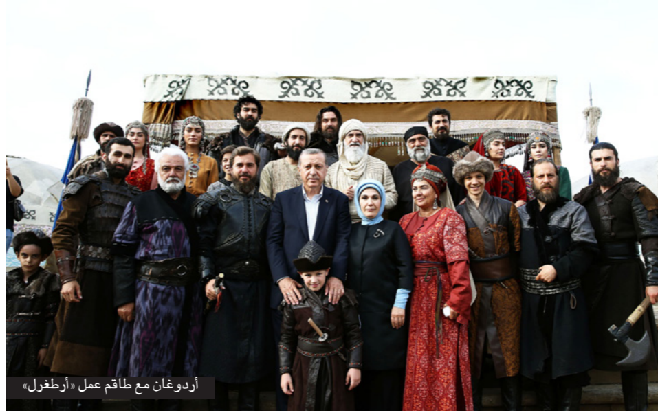
أردوغان مع طاقم عمل «أرطغرل»

ويستعرض المسلسل نزاع المغول والروم على المنطقة، حيث كان المسلمون يعانون الكثير من المشاكل في القرن الثالث عشر خاصة ضعف الخلافة العباسية، وكان العالم الإسلامي بانتظار قائد بطل، ليظهر أرطغرل متحدياً كل الظروف.