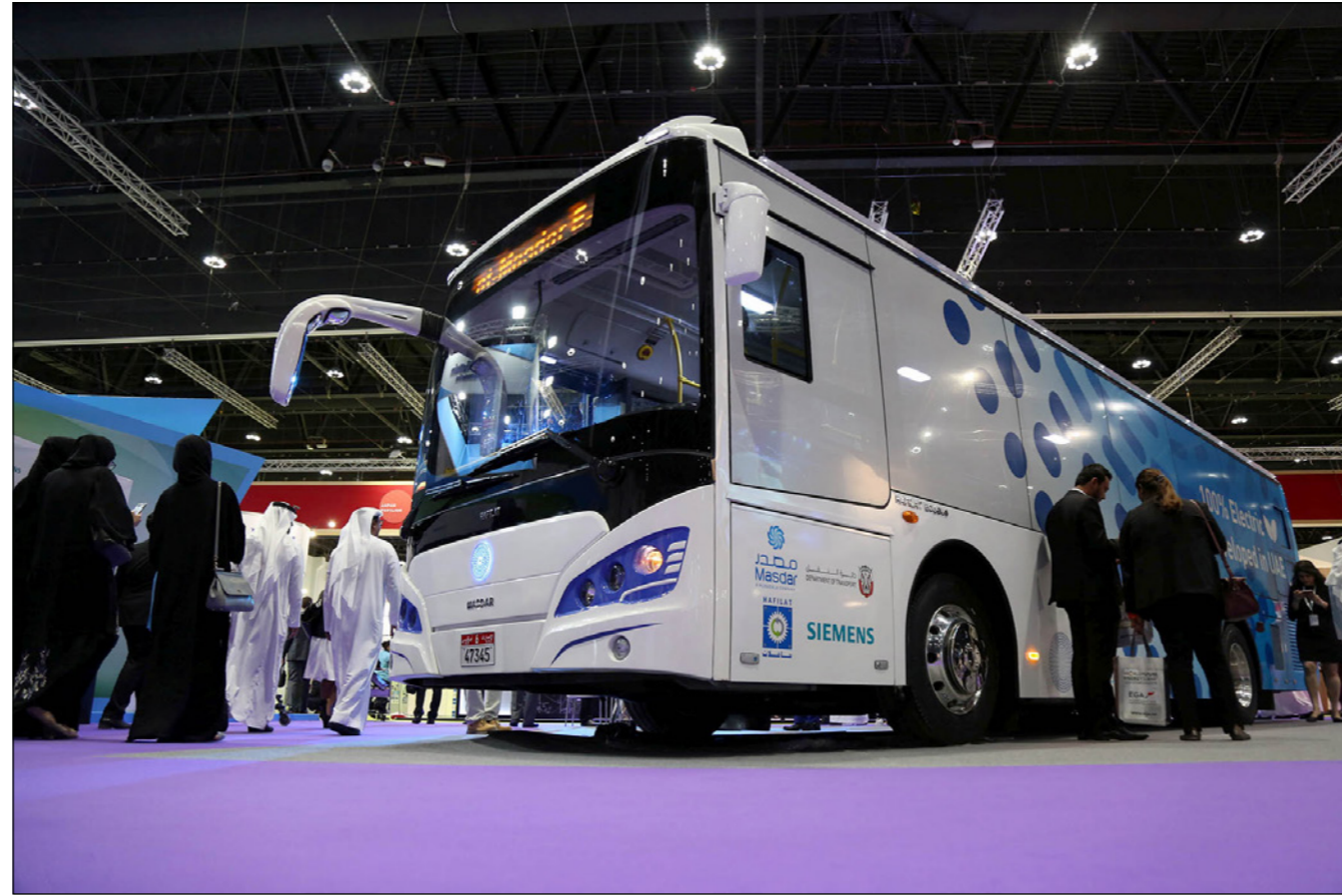
زوار ينظرون إلى الحافلة الكهربائية التي عرضتها «مصدر» في معرض عن الاستدامة البيئية جرى على هامش قمة الطاقة المتجددة في أبوظبي