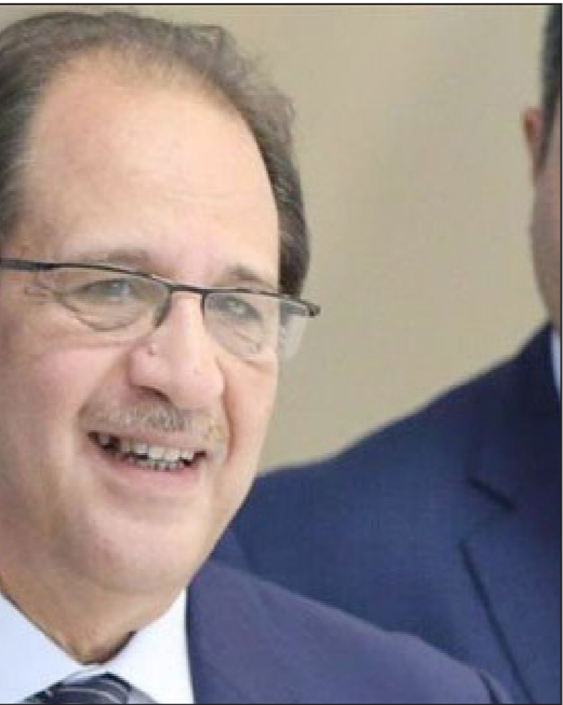
اللواء عباس كامل

وذكر في شهادته أنه أثناء الفحص وعمل اللجنة تبين عدم وجود دفاتر لتسجيل أي مكاتبات واردة من الجهات السيادية إبان فترة تولي المتهم الأول محمد مرسي رئاسة الجمهورية، وقال وقتها: «الثابت لسدي عمل اللجنة أن كل المكاتبات الخاصة بالمخابرات العامة والداخلية كانت ترد بطريقة مغلقة، لكني لم أجد تلك المظاريف لتتم معرفة أرقام الصادر والوارد لها، وما ثبت بالدفاتر خلال تولي مرسي الرئاسة المكاتبات العادية المتداولة بين الرئاسة