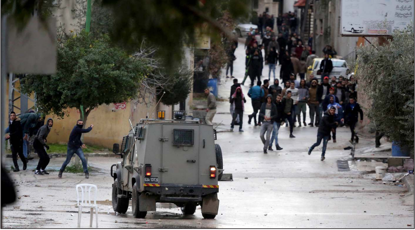
شباب فلسطيني خلال المواجهات مع قوات الاحتلال في منطقة جنين أمس