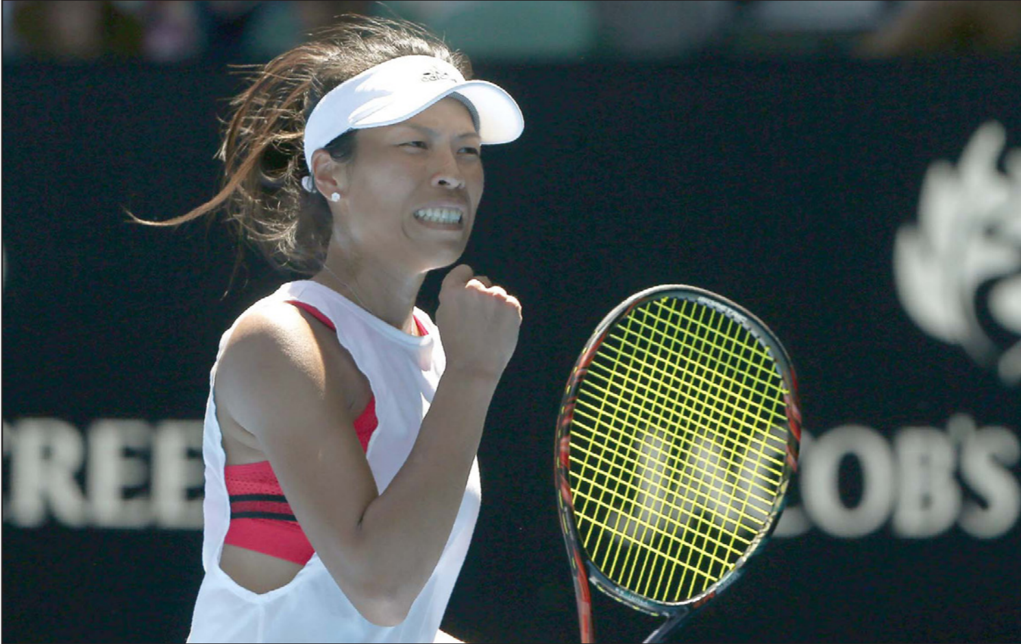
التايوانية سوي تحتفل عقب تحقيق أبرز مفاجآت البطولة حتى الآن