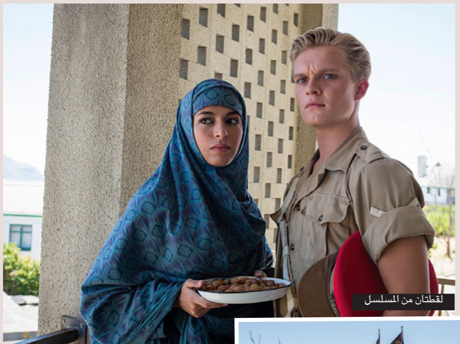
لقطة من المسلسل

ونادراً ما كان موضوع سقوط الامبراطورية البريطانية وظهر القومية العربية يبدو ساحراً كما هو الحال في «المخفر الأخير»، وفقاً للعديد من النقاد في الولايات المتحدة، ولكن الدراما نجحت في جذب جمهور هائل بطريقة مستفزة جداً عبر المشاهد الخلابية لقصة الزوجة الخائنة ونسائي الضباط وقصة الحب من شابة عربية ميمية وضابط بريطاني هناك جمال وحشي للمناظر الطبيعية الصحراوية على الرغم من تصوير المسلسل في جنوب أفريقيا وهناك اتصال خفي بين الشخصيات والجغرافيا ربما تعود إلى كاتب بيترو موفات هو بالفعل ابن لضابط عاش في عدن.