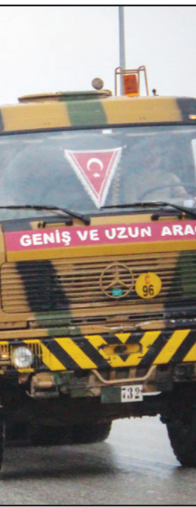
عربات عسكرية تركية متوجهة إلى الحدود السورية أمس

في مسعى للحصول على الضوء الأخضر الروسي للقيام بـ «عملية عفرين»، زار رئيسها الجيش والاستخبارات التركية موسكو، بينما كشفت وسائل إعلام تركية عن أن أنقرة طلبت رسمياً من روسيا تعطيل عمل منظومة الدفاع الصاروخي والجوي إي 400 في سوريا، وأصدرت قيادة الأركان التركية أمراً بوضع القوات العسكرية المنتشرة في محيط مدينة عفرين في حالة التأهب القصوى. وواصل الجيش التركي استخدام تعزيزاته العسكرية وآلياته الثقيلة إلى القرى والبلدات المحيطة بمدينة عفرين شمال غربي حلب، وكان آخرها وصول ناقلات جند وعربات مدرعة ووحدات من القوات الخاصة التركية.