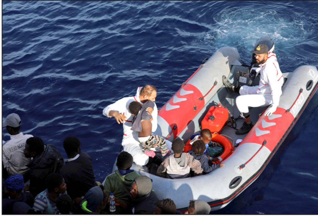
عناصر من خفر السواحل الليبية خلال عمليات إنقاذ

باريس - أ ف ب - أكد مدير منظمة هيومن رايتس ووتش كينيث روث الذي يدافع بلا كلل عن حقوق الإنسان منذ ثلاثين عاماً، أن على أوروبا ألا تجازف ولو بشكل غير مباشر، في طرد لاجئين إلى ليبيا حيث يلقون معاملة «فظيعة». ولم تفاجئ الصور القاسية التي عرضتها شبكة «سي إن إن» في تشرين الثاني/نوفمبر الماضي لبيع أفارقة بعيداً بالقرب من العاصمة الليبية، هذا الأميركي البالغ من العمر 62 عاماً الذي امتد نشاط منظمته التي تثير خشية بقدم ما تلقى من احترام، إلى تسعين بلداً. وقال في مقر المنظمة الباريسي في مناسبة نشر التقرير حول وضع حقوق الإنسان في العالم عام 2018 الخميس إن «هيومن رايتس ووتش كانت تنقل ذلك منذ فترة طويلة، الطريقة التي يعامل بها اللاجئون في ليبيا فظيعة». وأضاف «نجعم باستمرار شهادات على عمل قسري واستغلال جنسي وتعذيب». وتابع روث مدينة السفن الأوروبية «لا تطرد الناس إلى ليبيا»