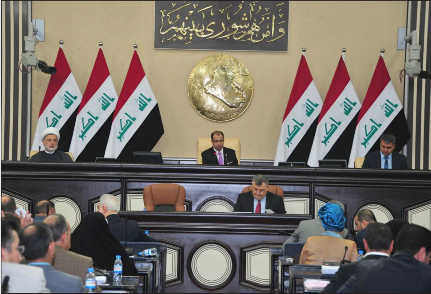
مجلس النواب العراقي

نظمها الانتخابية وموظفيها وعملياتها، بثلاثة طرق. ووفقا للبيان، فإن الطرق الثلاثة تتعلق بـتمكين العراقيين الناخبين داخلها من التصويت من خلال التركيز على تسجيل الناخبين وضمان فعالية أنظمة التصويت الإلكتروني، إضافة إلى تحسين القدرة الإدارية الانتخابية على مستوى المحافظات لدعم عملية التصويت في المناطق الحرة مؤخرا، فضلا عن مساعدة مجلس المفوضين الجديد في المفوضية العليا المستقلة للانتخابات ايار 2018، خطة تشغيلية سليمة للانتخابات ايار 2018. واعتبرت الولايات المتحدة الأمريكية دعم المؤسسات الديمقراطية العراقية هو «جزء أساسي من التزام الولايات المتحدة المستمر بعراق اتحادى ديمقراطى مزدهر وموحد»، مشيرة إلى أنه «من خلال ممارسة حقه الدستوري في التصويت، سيظهر العراقيون التزامهم بالحوكمة من خلال العمليات السلمية بدلا من العنف». على حدّ البيان.