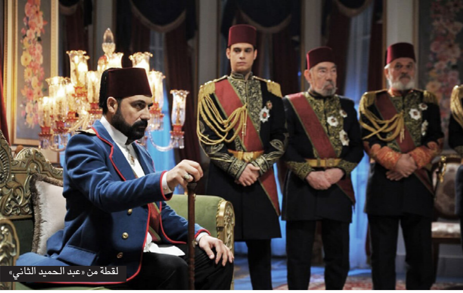
لقطة من «عبد الحميد الثاني»