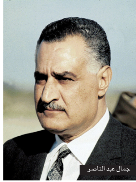
جمال عبد الناصر

ساعد الرئيس جمال عبد الناصر أيضاً الثورة في