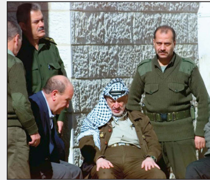
الرئيس الراحل ياسر عرفات

كانت طائرات من طراز «أف 15»، و«أف 16»، على أهية الاستعداد. قائد الأركان يحاول بنفضه اغتيال عرفات، ويروي بيرغمان انه خلال تسعة أسابيع، من تشرين الثاني/ نوفمبر 1982 وحتى مطلع كانون الثاني/ يناير 1983، تم استنفار الطائرات الحربية خمس مرات على الأقل، وذلك بهدف قصف الطائرات التي يقترض أنها تقل عرفات، ولكن كان يتم إلغاء المهمة بعد انطلاق الطائرات العسكرية، ويكشف بيرغمان أن رئيس الأركان وقتها إيتان قرر التصرف بفرده وبشكل غير معقول ومجنون»، واستدعى رئيس قسم العمليات في سلاح الجو أبيعام سيلج، وطلب منه أن يعلق به فوق بيروت، وسيجيز أنظمة الأسلحة بنفسه ويسقط القنبلة التي ستقتل