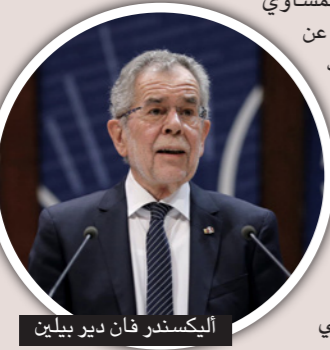
البيكسندر فان دير بيلين

وأدان رئيس حزب الحرية هابتست - كريستيان شتراخ ما أسماه «أغنية مؤثرة للاشمزاز ومناهضة للسامية حقاً».