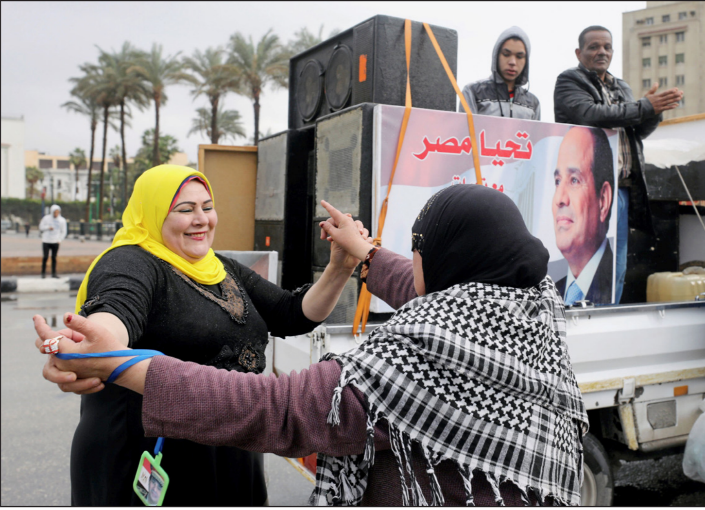
مصريتان يشاركان في حملة الرئيس عبد الفتاح السيسي