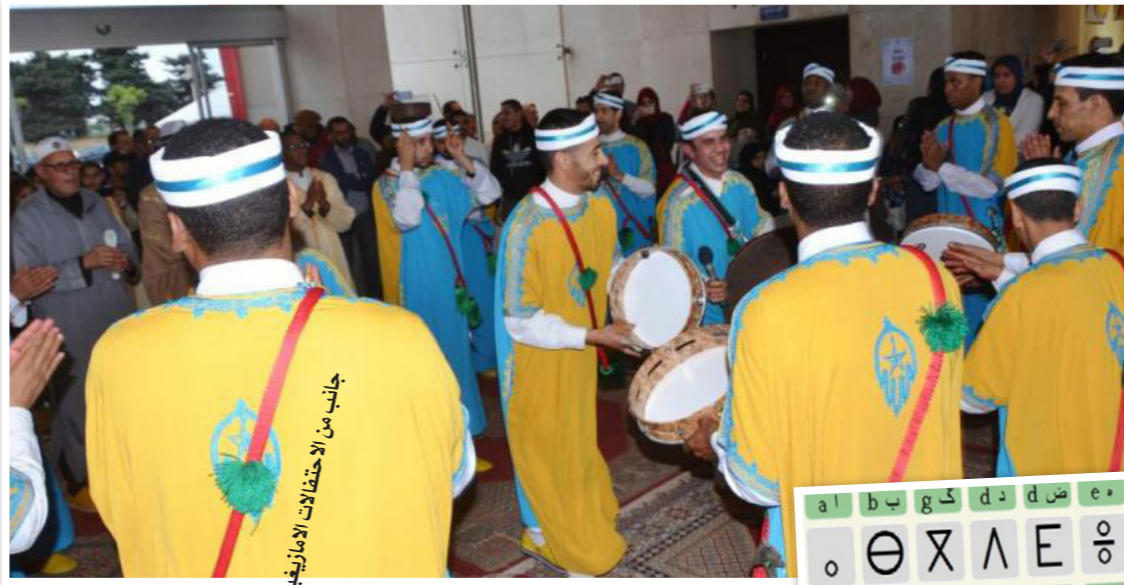
جانب من الاحتفالات الأمازيغية

مقتع توافق عليه كل الفصائل الأمازيغية، وخير مثال على ذلك الجدول القائم اليوم في موضوع الحروف التي يجب أن تكتب بها هذه اللغة، بين مطالب كتابتها بالحرف الأصلي والحرف اللاتيني والحرف العربي، وبينما اختار قسم من أمازيغ القبائل المتأثرين بالثقافة الفرنسية في الجزائر كتابتها بالحرف اللاتيني، فإن قسما معتبرا من أمازيغ بني مزاب المحافظين في جنوب الجزائر، ما انفك يكتبها بالحرف العربي، ومن غير شك لن يقبل هيمنة حروف أجنبية لا تمت لتاريخه وثقافته بصلة، ولا فرض قبائل أخرى قراراتها عليه، وبينما يستمر هذا الجدل في الجزائر، فإن اختيار بلدان أخرى مثل المغرب وليبيا قد وقع على حروف تيفيناغ وهي الأبجدية الأصلية التي اختارها الأجداد الأمازيغ ولم يسعوا لتغييرها.