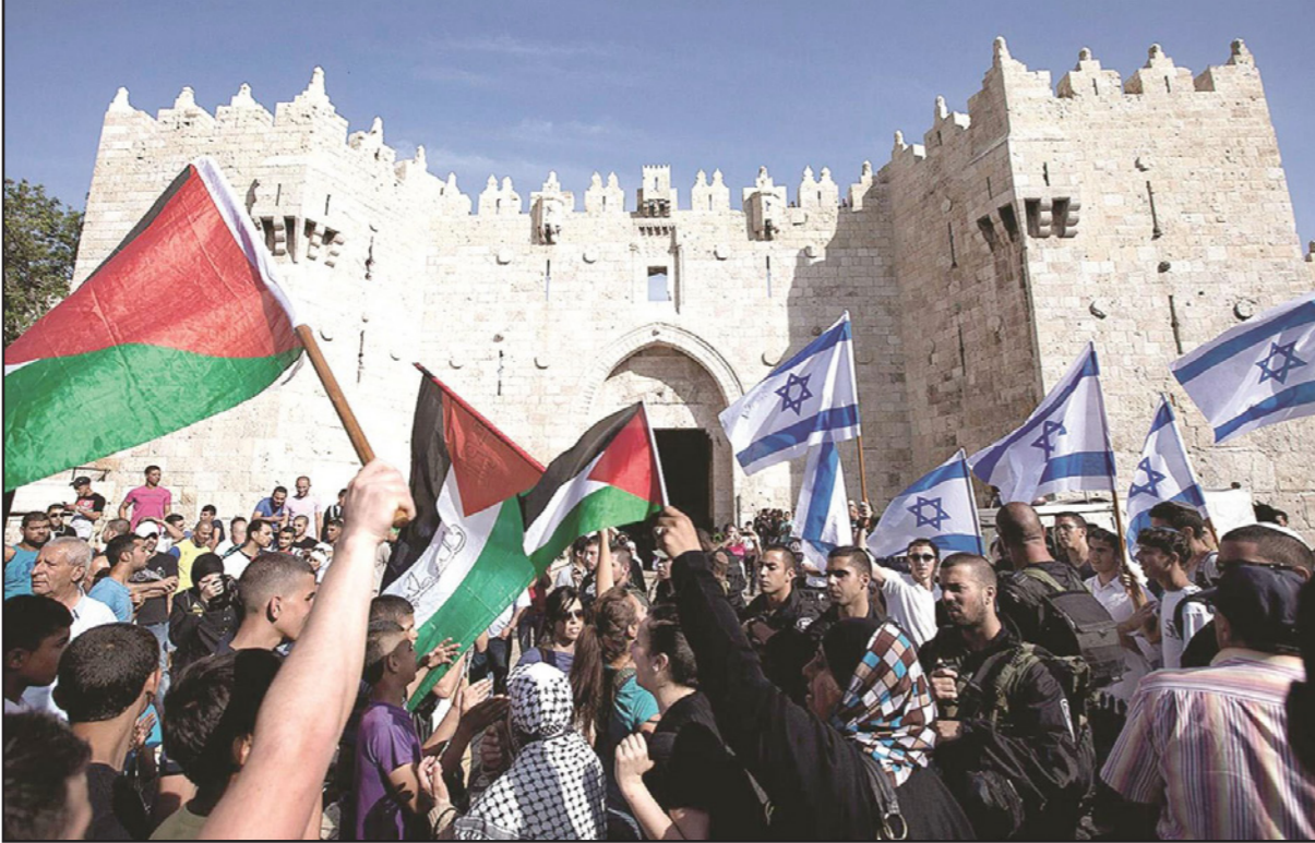
مواجهات بين فلسطينيين واسرائيليين حول قيام الدولتين

كيف سيستجيب ذلك لحركة القطار في اتجاهين قال «أنا فقط أقترح»، هذا الشخص كان يوشطف هركابي الذي كتب عن سقوط متسادا وحذر من أن «حجم الحلم الكبير، الذي يشترط تحققه هو واقعيته التي تكمن في أنه برغم أن الحلم يريد التسامح على الواقع، أرجله دائما مغرسة في هذا الواقع، هذا هو الفرق بين الحلم والخيال الذي يحلق على أجنحة الوهم».