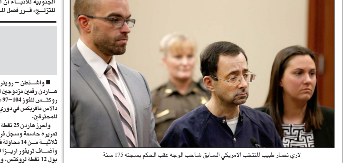
لاري نصار طبيب المنتخب الأمريكي السابق شاحب الوجه عقب الحكم بسجنه 175 سنة

■ واشنطن - د ب أ: أشاد الاتحاد الأمريكي للجيمباز بالحكم بالسجن بحق الطبيب في الاتحاد لاري نصار، الذي اعترف بالتحرش جنسيا بالعديد من الرياضيات بذريعة العلاج الطبي. كان قاض في محكمة بولاية ميشيغان الأمريكية، حكم الأربعاء، على نصار الطبيب السابق في الفريق الأمريكي الأولمبي للجيمباز بالسجن 175 عاما بسبب تحرشه