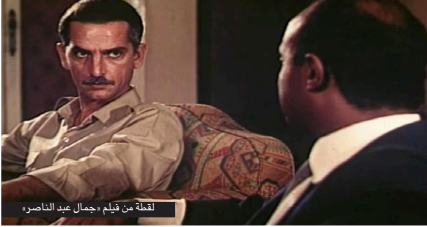
لقطة من فيلم «جمال عبد الناصر»

تلك قررت إدارة مهرجان الإسكندرية السينمائي لدول البحر المتوسط برئاسة الناقد السينمائي الأمير أباطة، الاحتفال بمئوية ميلاد الزعيم جمال عبد الناصر، وذلك من خلال فعاليات الدورة الرابعة والثلاثين للمهرجان، والتي تقام في الفترة من 3 إلى 10 أكتوبر/ تشرين المقبل.