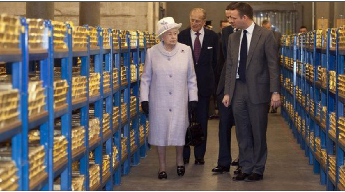
الملكة إليزابيث وزوجها يصغيان إلى شرح من أحد مسؤولي بنك إنكلترا المركزي عن مخزونه من الذهب (صورة من الأرشيف)

المستبعد جداً أن يصل مجدداً إلى هذا المستوى في المستقبل. بصرف النظر عن حالة الاقتصاد «الحلي». وقالت أيضاً «في الحقيقة، يتحول المجتمع الصيني من التعامل مع حلي الذهب بصفقتها من