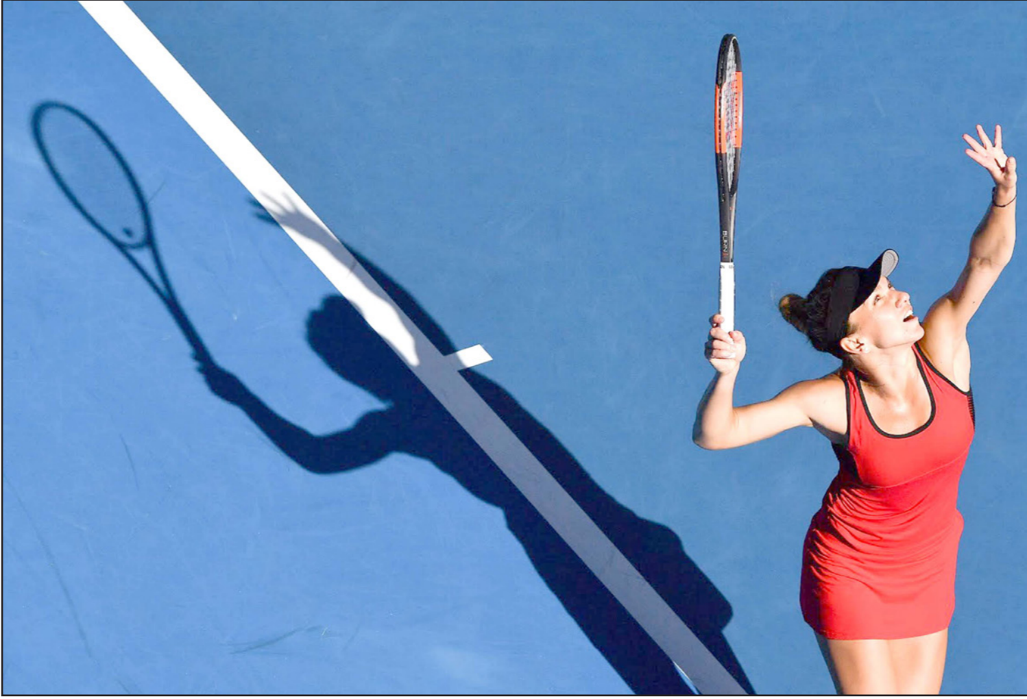
هاليب تألقت أمام كيربر ونجحت في التأهل إلى المباراة النهائية

■ مليون - د ب أ: تغلب مارين سيليتش على كيلبي ايدموند 6/2، 6/7 (4/7)، 6/2، ليحجز مقعده في المباراة النهائية لبطولة أستراليا المفتوحة للتنس. ويلعب روجيه فيدرر، الفائز بالبطولة خمس مرات، مع الكوري تشونغ هيون اليوم في المباراة الثانية للدور قبل النهائي على أن يلتقي الفائز منهما مع سيليتش في المباراة النهائية الأحد.