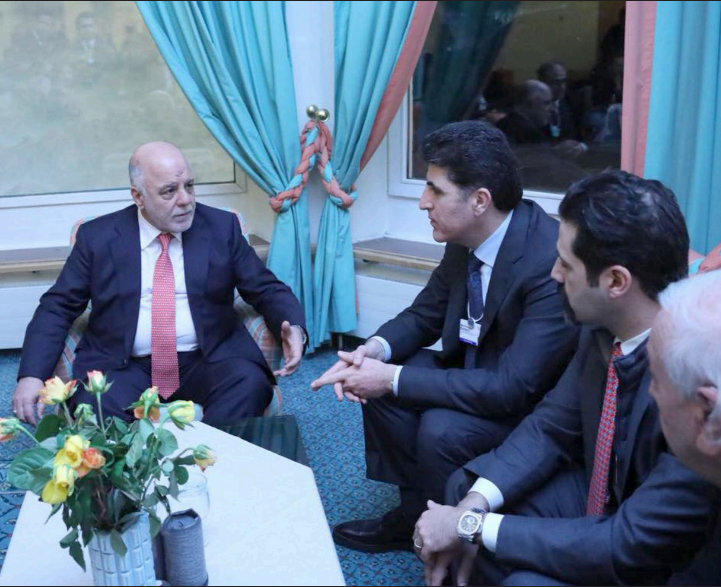
العبادي خلال لقائه بارزاني أمس في دافوس