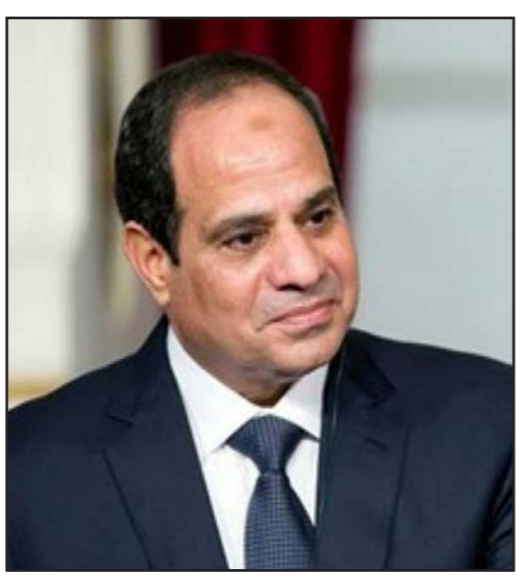
الرئيس عبد الفتاح السيسي.

لكن أعتقد أنه علينا قيام ثورات في منزلنا ضد أنفسنا وبناتنا وعائلتنا حتى نصلح ما بيننا وبين الله، وليس مع حكائنا لأن ما نعيشه هو نتيجة أعمالنا وابتعادنا عن الدين». وعادة ما تثير آراء ابن حسن، الذي يتابعه الآلاف على مواقع التواصل الاجتماعي، جدلاً كبيراً في تونس، حيث دعا في وقت سابق إلى وقف الصح إلى مئة زبديعة أن عوانده تذهب للولايات المتحدة، واقترح أيضا استمرار التظاهرات في إيران في دعوة الإيرانيين إلى «العبودية الصحيحة» على المذهب السني، كما اتهم الإمارات بدعم الاحتجاجات ضد ارتفاع الأسعار في بلاد.