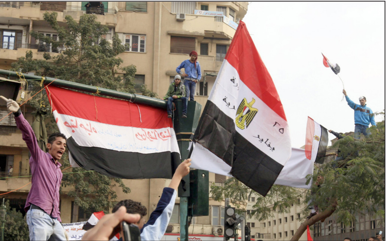
صورة أرشيفية لمظاهرات 25 يناير في مصر