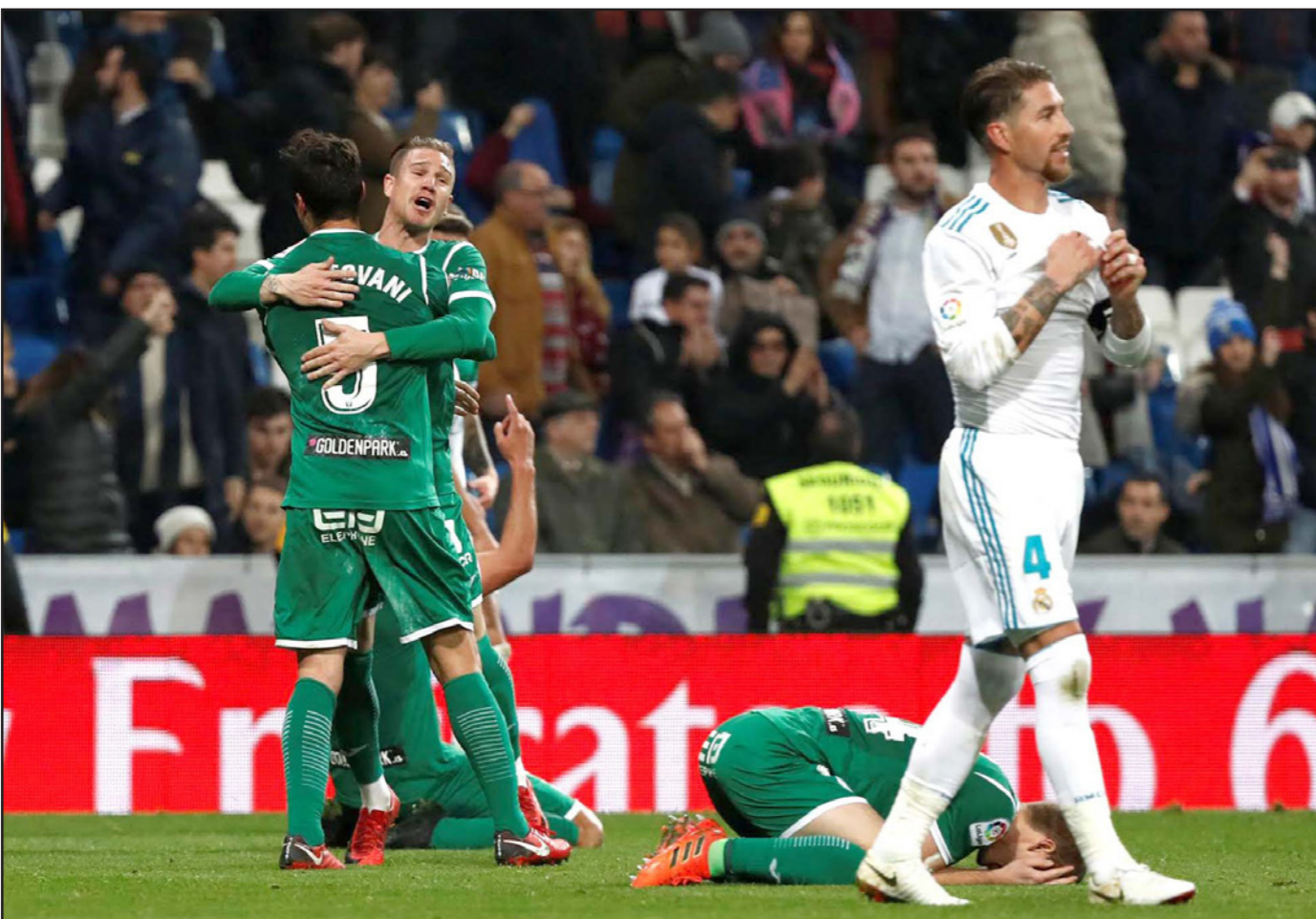
فرحة لاعبي ليفانيس بعد الفوز الملائح وصدمة على وجه مدافع الريال راموس

ويوني بيريز، بليكا للصحة الإسبانية، استخدام ورقة رونالدو للضغط على إدارة النادي الباريسي، بإقحام اللاعب البرتغالي في صفقة تبادلية مقابل الحصول على خدمات نيمار، وأكدت "أس" من خلال مصادر مقربة من رونالدو أن الأخير يدرك نوايا بيريز وأن مسألة الدفع به في صفقة تبادلية أمر لا يروق له على الإطلاق، ما زاد من دوافعه للرحيل عن ريال مدريد.