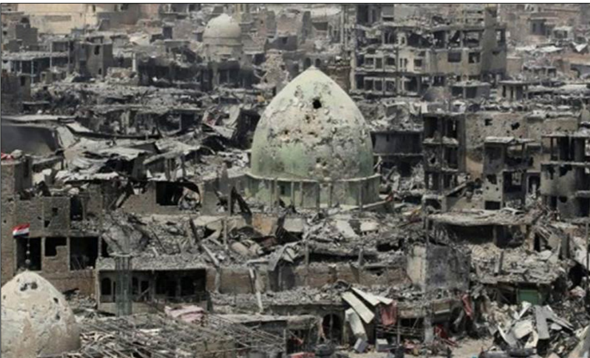
مشهد بانورامي لجانب من الدمار الذي لحق بالموصل

مع مسؤولين من نظيرتها العراقية. وهذا الاجتماع هو الثاني الذي يعقد بين البلدين، للتباحث بشأن إمكانية الربط الكهربائي بين الكويت ودول مجلس التعاون الخليجي من جانب، والعراق من جانب آخر.