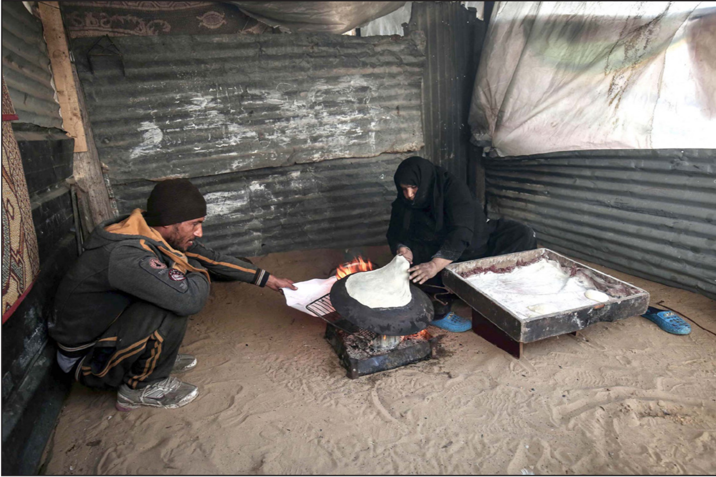
الأوضاع في غزة تزداد سوءا يوما بعد يوم وتهدد بالانفجار