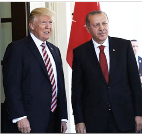
الرئيسان التركي والأمريكي لدى زيارة سابقة لواشنطن