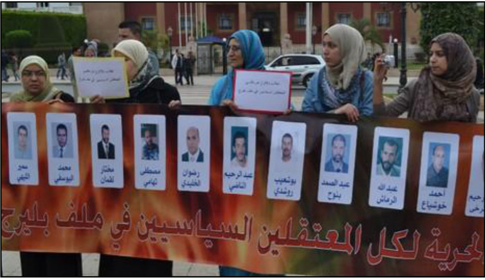
وقفة احتجاجية للمطالبة بإطلاق سراح المعتقلين السياسيين