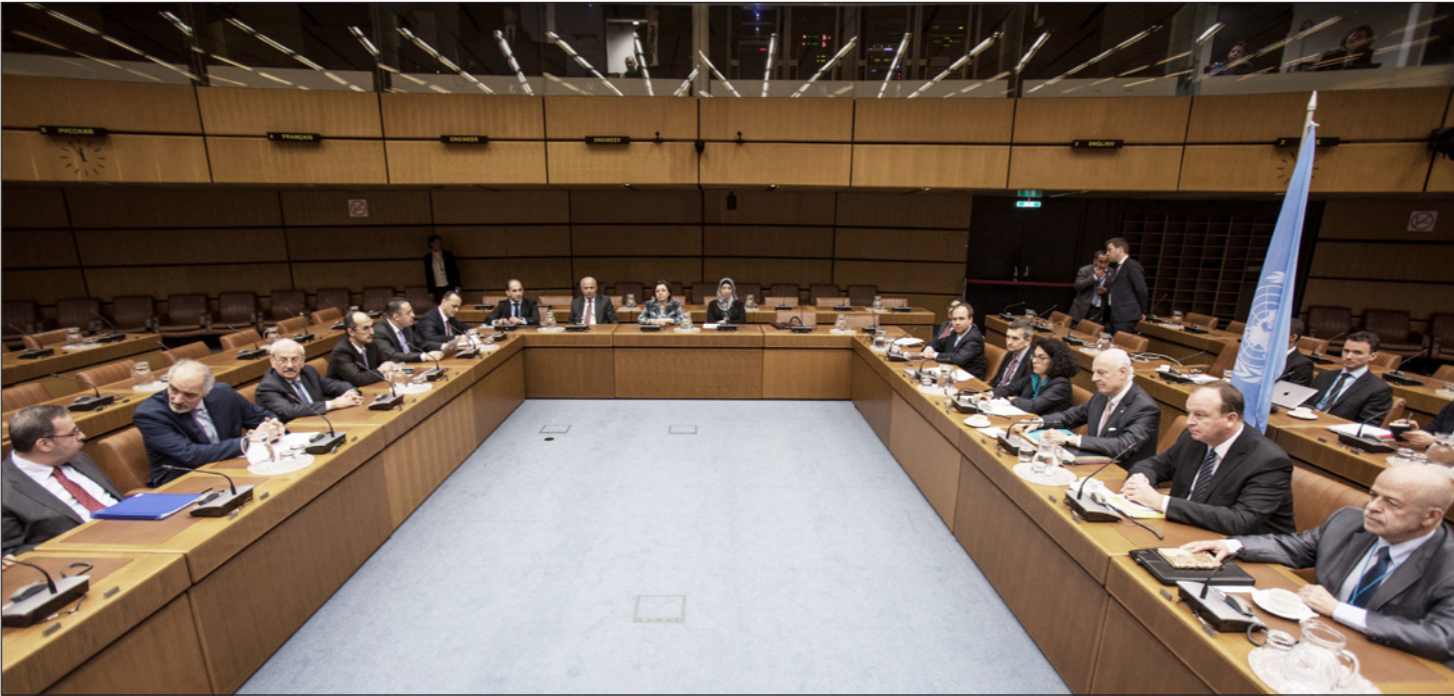
جانب من اجتماعات دي مستورا مع وفد النظام السوري في فيينا

■ فيينا – موسكو – وكالات: تزامناً مع عمليات عسكرية واسعة في عدد من المناطق في سوريا حيث تشن تركيا من جهة هجوماً على مدينة عفرين التي يسيطر عليها الأكراد بينما تشن القوات الحكومية هجوماً في محافظة ادلب (شمال غربي سوريا) والغوطة الشرقية المتاخمة للعاصمة، التقى المبعوث الدولي ستافان دي ميستورا أمس وفد النظام السوري برئاسة بشار الجعفري ووفد هيئة التفاوض برئاسة نصر الحريري كلا على حدة في إطار جولة جديدة من مفاوضات تستمر يومين في فيينا برعاية الأمم المتحدة وذلك قبل ايام من انعقاد محادثات أخرى في روسيا. واستمر اجتماع المبعوث الخاص مع الوفد الحكومي نحو ساعتين من دون أن تشرع أي معلومات عنه، كما لم يدل رئيس الوفد بأي تصريح لدى وصوله. وأكد المتحدث باسم الهيئة يحيى العريضي لدى وصوله مقر الأمم المتحدة تمسك المعارضة بالقرار 2254 واصفاً هذه الجولة بأنها «امتحان حقيقي للالتزام جميع الأطراف بتطبيق القرار الدولي». وأوضح انه «شيء أساسي بالنسبة لنا لاننا نريد سوريا ديمقراطية حرة لكل اهلها وان يعودوا اليها آمنين».