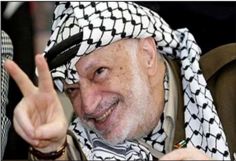
الراحل ياسر عرفات

أجبتة أنه لا يمكن وأن هناك الكثير من الناس. رافول أجايني: «دعك من هذا - أنا أخذ المسؤولية، على» لم تكن مستعدا لهذا، رافول لم يعلمني ما هي أخلاق الحرب. في مرحلة متأخرة أكثر بلغني رئيس الأركان نفسه في الإطلاع ليس من صلاحياتي إن كان سيكون أقتصم لا، أنا نعلي فقط أن أبلغ إذا كان الهدف ناجحا من ناحية استخبارية. من هذه النقطة فلاحا، كونه لا يمكن إزالة المسؤولية عن قائد يقدر في الميدان، في كل مرة علمنا فيها بأن القصف سيستبب بقتل جماعي للمدنيين أبنا هنا «لا يوجد نضح استخباري»، في الحرب حين أراد شارون جدل قتل عرفات، أمر بإسقاط طائرات طار فيها الزعيم الفلسطيني، قررت مجموعة ضابط في سلاح الجو بأن هذا ببساطة لن يعمل، ويروي سيليف بوقاي: «ذهب إلى رافول وقلت له: أيتها القائد نحن لا نعتزم عمل هذا، لن يحصل ولن يكون. أنهم إن هنا توجد سيطرة زائدة من وزير الدفاع. أحد لا يتجرأ على الوقوف ضده، وعليه فنحن ببساطة نستعمل هذا معتذرا قنيا، نظير رافول أي صامتا ولم يقل