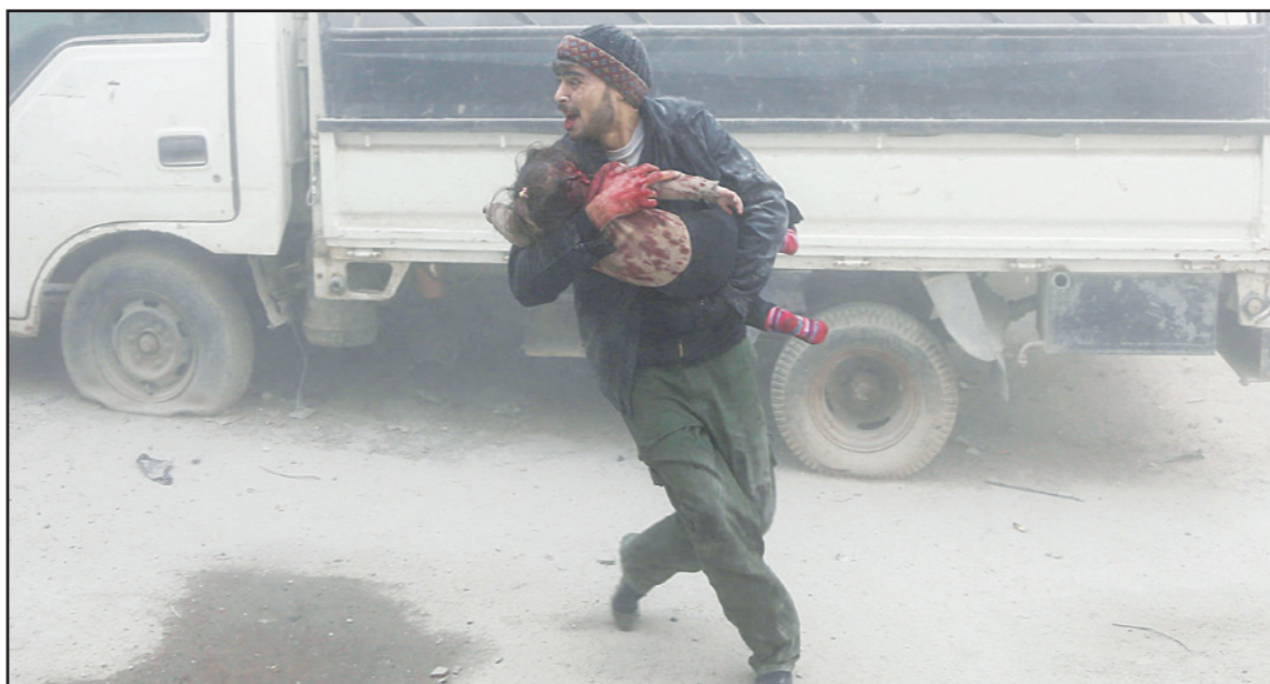
رجل يحمل طفلا ويهرب من موقع قصفته طائرات النظام السوري في بلدة سقيا قرب دمشق أمس

وبخصوص مقتل الطيار الروسي وتسليم جثته، وبعد إعلان هيئة تحرير الشام - عن أن جثة الطيار الروسي تم «سلبها» من أحد الفصائل الثورية، وسلمت لروسيا، ثارت ردود فعل غاضبة لدى ناشطين سوريين، ودفعت بتساؤلات حول الكيفية التي تمت بها هذه العملية، التي قال الجانب الروسي إنها تمت بمساعدة وتعاون من تركيا. «القدس العربي» تحدثت إلى مصدر مقرب من هيئة تحرير الشام، فأكد أن من قام بتسليم جثمان الطيار هو «فيلق الشام» المقرب من تركيا.