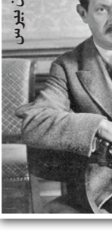
ت. س. إليوت

تبوأ مفهوم التفكير، التحطيم، (التحطيم) أولويته في التفكير البوليديري استنادا لما بيته بولدبر من جهود متواصلة في الوقوف أمام طبيعة الخيلة وطبيعة نشاطها. إن المخيلة في مفهومه تقوم على تفكيك الكليات الواحدة، أي تقوم على تفكيك العالم كبناء كلي على ملحق بابنية أخرى، أو خاتمة وهيمة وغير وهيمة، إن كانت أو مخلوقة وهو يرى ضمن هذه الكلية أن هناك (الكاروكوز) أي العالم الكبير، فالخيلة تستوعب هذا العالم الكبير ثم تعمل على تفكيكه بمعانية نفسية لنتم عملية ذلك كان جديدة مع إنشاء مختلفة ومنظمة وأيضا بمعانية نفسية البركيزة في مواجهة العالم بعني لدى بولدبر، إن إطلاق ذلك الخيال لتكمل أبحاثها وأجوابها، لتجريد الأشياء من شبياتها ولحسو الوعي الواقع، والتحكم بالذلات الكلية والوصول إلى علم الكتابة الحرضم بهاء الذهن والصور المركبة.