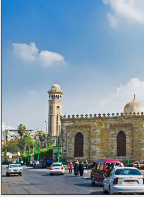
جامع الأزهر في القاهرة

كانت بطريقة غير مناسبة ليس النسخة النهائية لتقرير دائرة الجمارك وحماية الحدود وبالتالي لا تعكس موقفها في هذا الموضوع، وأضاف في رسالة إلكترونية: «وأنهم من ذلك أن المسودة الأولية التي في حوزتكم ليست تحت المراجعة الداخلية ولكن الكشف عنها في الوقت الحالي ليس مناسباً ولا تعكس عدداً من التعليقات الجوهرية والمراجعات والتي تم وضعها على الوثيقة ونتيجة للمراجعات الداخلية والخارجية التي تقوم بها الدائرة».