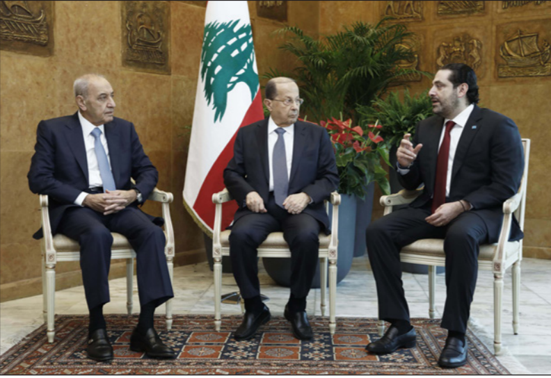
الرؤساء الثلاثة من اليمين الحريري وعون وبري

وأضاف بيان الرئاسة «اتفق المجتمعون على ضرورة تفعيل عمل المؤسسات الدستورية كافة ولاسيما منها مجلس النواب ومجلس الوزراء،