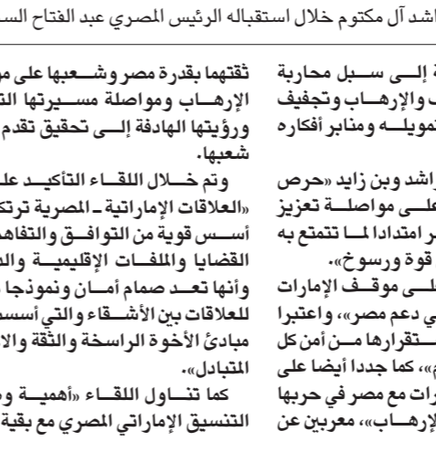
الشيخ محمد بن راشد آل مكتوم خلال استقباله الرئيس المصري عبد الفتاح السيسي

التي تهدد الأمن والاستقرار ودعم التنمية والبناء والتطوير فيها، وضرورة تعزيز جهود العمل العربي المشترك، بما يحقق مصالح الشعوب العربية ومواجهة مساعي التدخل في شؤونها الداخلية التي تستهدف أمنها واستقرارها ومقراتها». وشددوا على أهمية التعاون وتضافر جهود المجتمع الدولي والعربية في الحفاظ على الأمن والاستقرار ودعم التنمية والبناء والتطوير فيها، وضرورة تعزيز جهود العمل العربي المشترك، بما يحقق مصالح الشعوب العربية ومواجهة مساعي التدخل في شؤونها الداخلية التي تستهدف أمنها واستقرارها ومقراتها». وشددوا على أهمية التعاون وتضافر جهود المجتمع الدولي والعربية في الحفاظ على الأمن والاستقرار ودعم التنمية والبناء والتطوير فيها، وضرورة تعزيز جهود العمل العربي المشترك، بما يحقق مصالح الشعوب العربية ومواجهة مساعي التدخل في شؤونها الداخلية التي تستهدف أمنها واستقرارها ومقراتها».