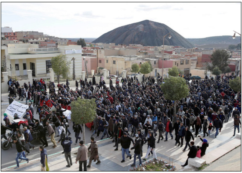
جانب من نشطاء حراك جرادة المغربية