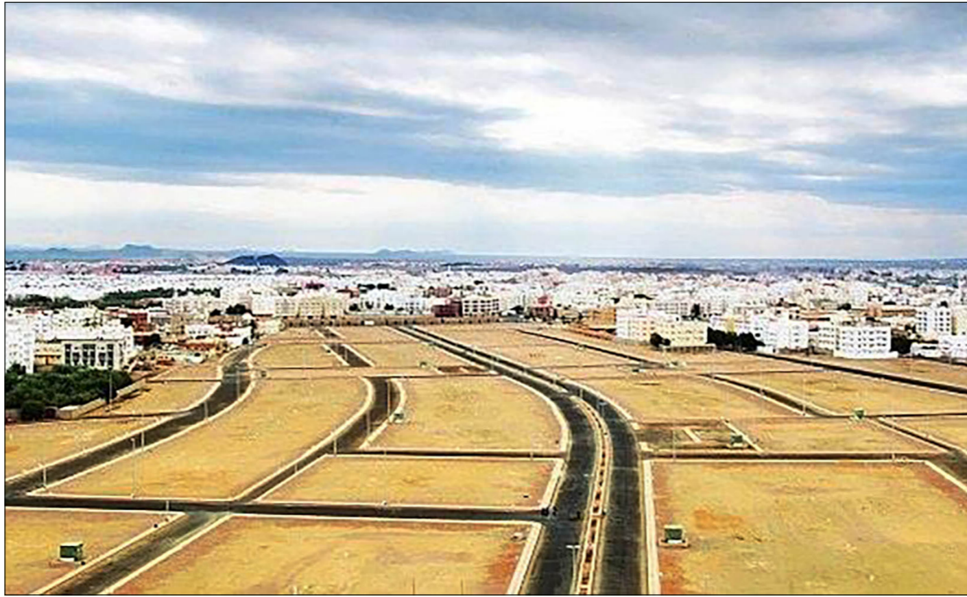
الأراضي غير مستغلة قرب الرياض رغم انه مسموح البناء فيها

الرياض – الأناضول: قال ماجد الحقييل، وزير الإسكان السعودي، أمس الثلاثاء ان المملكة ترغب في توسيع سوق الرهن العقاري إلى 502 مليار ريال (134 مليار دولار) بحلول 2020.