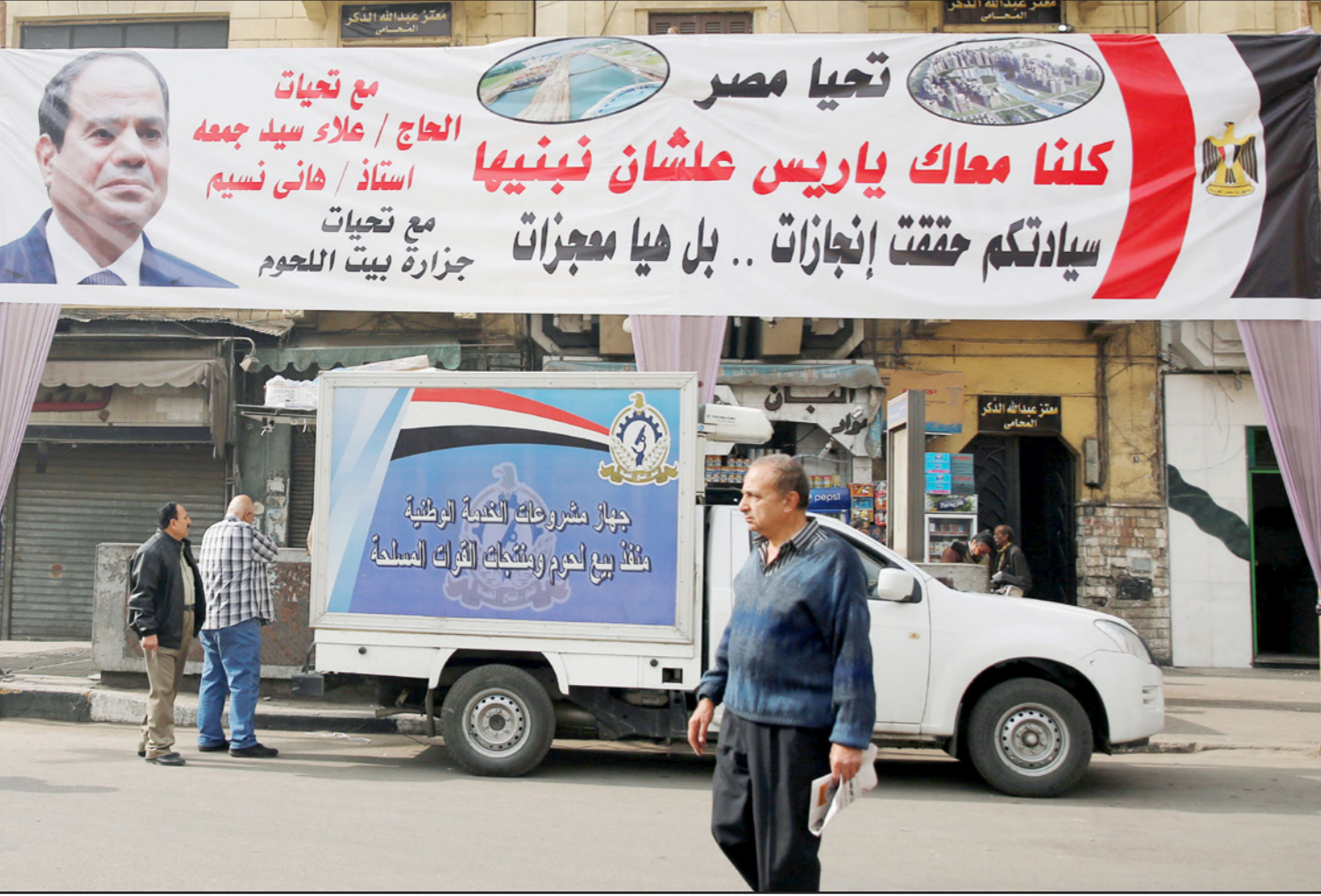
لافتة مؤيدة للسياسي في أحد شوارع القاهرة

في منزله بمحافظة كفر الشيخ في دلتا مصر. والنهري و 22 من أعضاء الحزب في المحافظة، اتهمتهم الأجهزة الأمنية بإثارة الرأي العام ونشر تغريدات على الفيسبوك تضر بالأمم القومي في ما يخص قضية جزيرتي تيران وصنافير، اللتين تسلمتهما السعودية بناء على اتفاقية إعادة ترسيم الحدود البحرية بين البلدين، وحددت محكمة أمن دولة طوارئ جلستي 10 و 11 شباط/فبراير الجاري لنظر القضية المتهم فيها أعضاء تيار الكرامة.