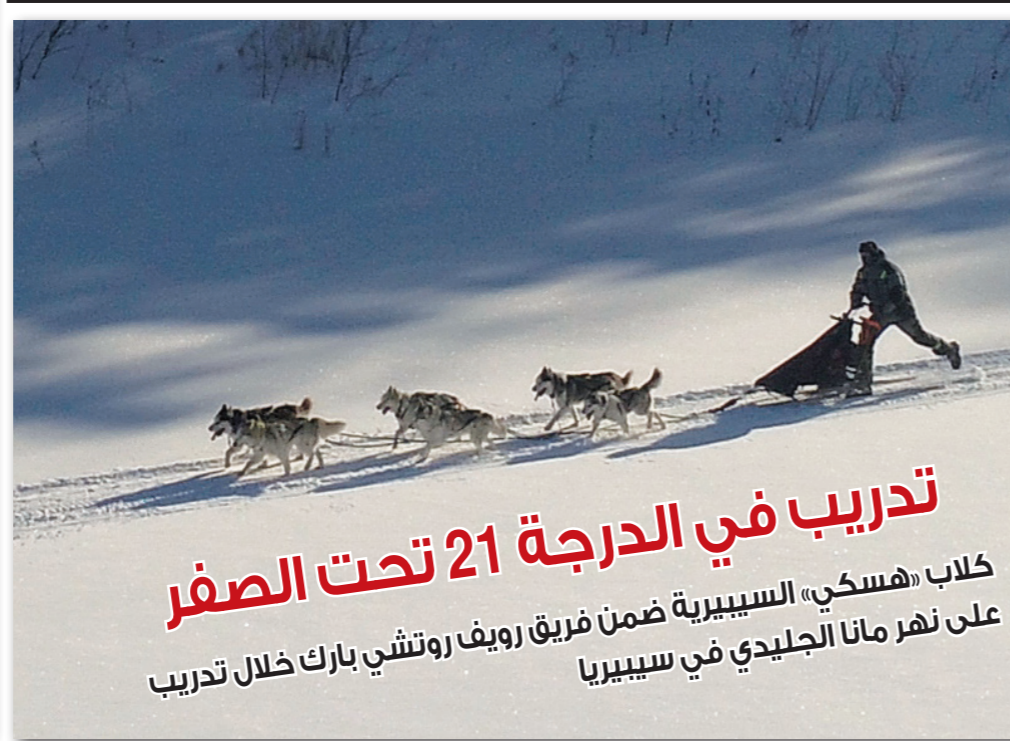
تدريب في الدرجة 21 تحت الصفر على نهر مانا الجليدي في سيبيريا

■ برلين - د ب أ: تستعزم الكتلة البرلمانية لحزب اليسار الألماني إنهاء الحظر المفروض على تعاطي القنب من خلال طرح مبادرة في البرلمان بدعم من نواب أحزاب أخرى إلى جانب نواب الحزب. وفي تصريح لوكالة الأنباء الألمانية (د.ب.أ) أمس الثلاثاء قال يان كورته، القائم بأعمال الكتلة البرلمانية للحزب في البرلمان الاتحادي، إن الحزب يسعى لإنهاء تجريم تعاطي الحشيش، الحشيش من القنب، ومراقبة انتشاره وتحسين حماية الصحة والشباب. وكان الاتحاد الألماني للضباط الجنائين قد لفت الانتظار مؤخراً من خلال الإعلان عن طلب إلغاء حظر القنب، وقال كورته إن الاتحاد محق تماماً في هذا الطلب «فمكافحة تعاطي القنب من خلال التضييق على متعاطيه قد فشلت» ورأى كورته أن متعاطي القنب بحاجة للتوعية وأن مدمنيه بحاجة للمساعدة. وتنصح النائب اليساري باستغلال الأغلبية البرلمانية الحالية بسبب عدم تشكيل الائتلاف الحكومي الموسع بين التحالف المسيحي الديمقراطي بزعامته المستشارة أنجيلا ميركل والحزب الاشتراكي الديمقراطي لإلغاء تجريم تعاطي القنب. وأعلن كورته أنه سيتقدم باقتراح لبقية الكتل البرلمانية لتقديم طلب مشترك بهذا الشأن. واقتراح النائب اليساري أن يسمح القانون بحيازة كميات ضئيلة من الحشيش للاستخدام الشخصي وقال إن البرلمان وأوروغواي وغيرها من الدول تفعل ذلك بالفعل. كما طالب كورته بعزل مفضضة الحكومة الحالية لمكافحة المخدرات، مارلينه مولر «بصرف النظر عن شكل الحكومة القادمة»، وبر ذلك بما رأه انتهاك مولر، العضو بالحزب المسيحي الاجتماعي، سياسة رجعية في مكافحة المخدرات.