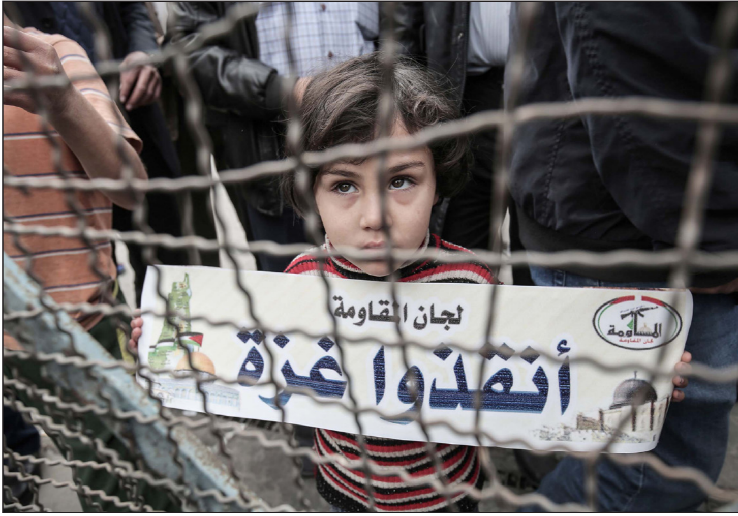
وقفة احتجاجية في غزة ضد الأوضاع المعيشية الصعبة