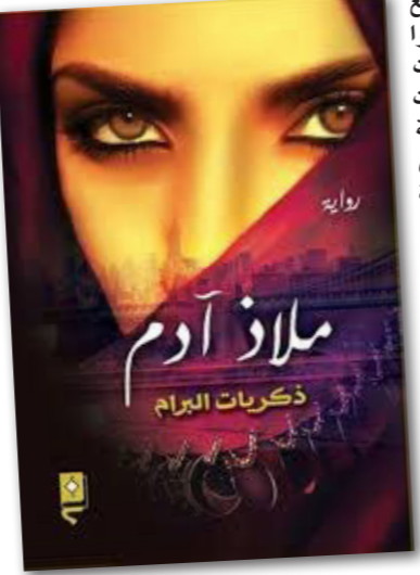
رواية ملاذ آدم ذكريات البرام

هنا تظهر جرة الرواية في محاولة الكشف عن قضايا مجتمعية وإنسانية يُفضل كثيرون السكوت عنها، ويعتبر بعضهم مجرد الاقتراب منها بمثابة من يلقى بنفسه في التهلكة، كاشفة عن رؤية رجال كثيرين للمرأة، وكيف أنهم لا يرون فيها سوى جسد مفر ومشاعر مثيره، نحن هنا برفقة امرأة لا تريد رجلا عاديا يشاركها حياتها، بل تريد رجلا يعصف بها ويسبقها، يعزف على أوتارها متمكنا