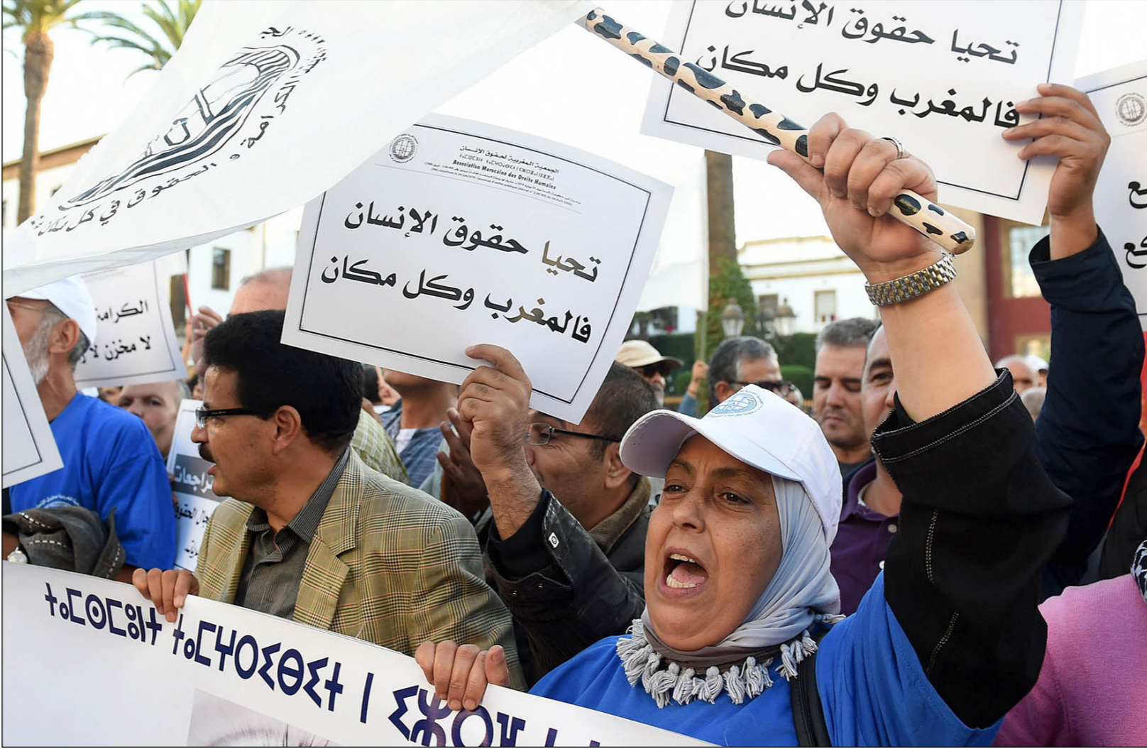
تظاهرة دعماً لحقوق الإنسان في المغرب