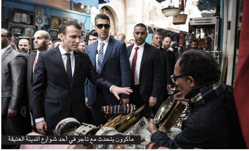
ماكرون يتحدث مع تاجر في أحد شوارع المدينة العتيقة

أنشئ هذا المهرجان في العام 2006، وكان يقام أولاً في منتجع يايولو للرياضات الشتوية على بعد بضعة