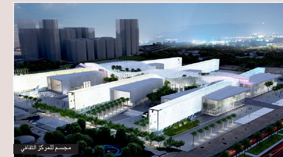
مجمع للمركز الثقافي

كما يضم المركز متحفا للعلوم العربية الإسلامية مليء بالمعرضات وشاشات المس التفاعلية والأفلام والمعالجات الخطيبية. وقال إسحاق إن الجزء الرئيسي من متحف العلوم العربية والإسلامية عبارة عن مساحة عالية تحتوي على