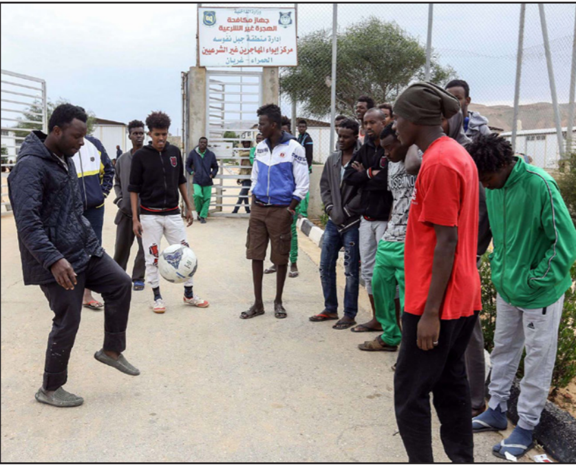
مركز لإيواء المهاجرين الغير شرعيين في ليبيا

المصالح الفصليية في تمنراست لضمان ترحيلهم إلى بلدهم في ظروف حسنة. وحسب مسؤول في الهلال الأحمر الجزائري فقد تم تخصيص 35 حافلة وخمس شاحنات لنقل الأمتعة ومرافقة من فرق الحماية المدنية وممطي قطاع التضامن الوطني ومصالح الأمنتي إلى جانب توفير تغطية صحية كاملة للمرحلين إلى غاية وصولهم إلى أغاديس (شمال النيجر) كما أضاف ذات المصدر. وبلغ عدد المرشحين منذ انطلاق العملية في كانون الأول/ديسمبر 2014 إلى الآن أكثر من 28 ألف نيجيري من مركز الاستقبال في تمنراست وهي العملية