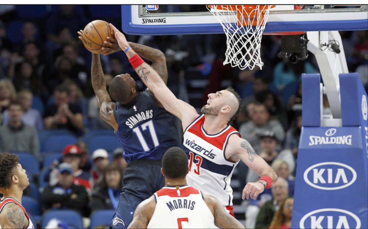
لاعب ويزاردز غواتر يحاول منع لايبسز سيمونز من التسجيل في السلة

عقب انتزاعها لقبها الحادي والعشرين قبل توليها بطولة سانت بطرسبرغ، إثر تلقيها في النهائي على الفرنسية كريستينا ملادينوفيتش 6/1 و2/6. وبعد هذا اللقب الأول لها منذ مشاركتها في بطولة برمنغهام في حزيران/ يونيو الماضي، ووضعها الفوز في المركز الخامس بين اللاعبات الحاليات من حيث عدد الألقاب التي تم حصدتها. وتمكنت كفيئوفا (27 عاماً) في طردها إلى النهائي، من الفوز على عدد من الأسماء الكبيرة مثل إيلينا فسنيينا وإيلينا أوستابينكو، المصنفة السادسة عالمياً، وجوليا جورجيس، واضطرت كفيئوفا العام الماضي للغياب عن بطولة دبي، بعدما نجت من هجوم بالسلاح الأبيض عليها في كانون الأول/ ديسمبر 2016، سبب لها عدة جروح عميقة في زراعها الأيسر التي تلعب بها، وكادت تهدد مسيرتها الحافلة