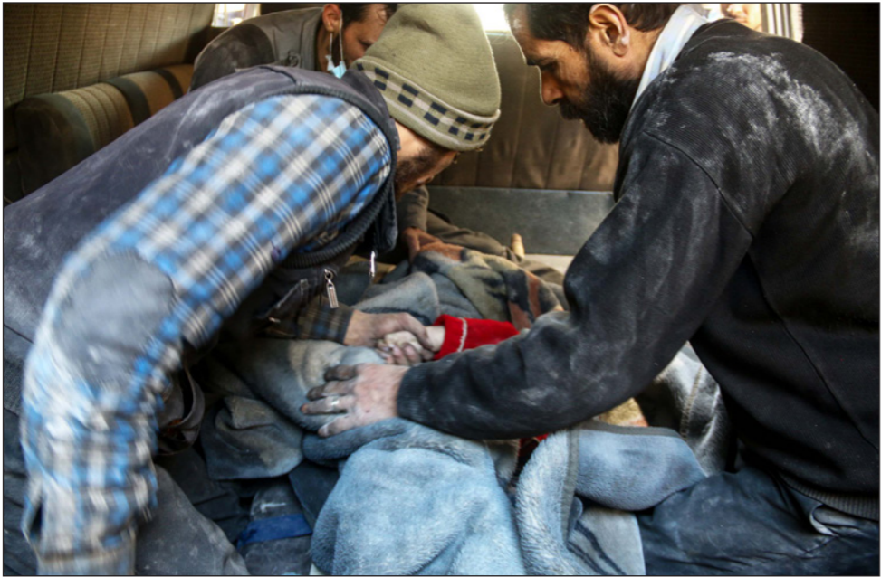
صدمة وهلع على وجوه أهالي الغوطة بعد سقوط العشرات بقصف غير مسبوق

هيئة تحرير الشام وجعلها عرضة لضربات في ريف ادلب وفي مناطق متفرقة من ريفي حلب وحماة. وأعلنت وزارة الدفاع الروسية أن استخباراتها نجحت بمساعدة من نظيرتها في تركيا، الذي تم استعادة جثمان الطيار الروسي رومان فيليبوف إلى روسيا، الذي قتل قبل أيام في ريف ادلب، وسيدفن الرائد، بحسب القناة المركزية لقاعدة حميميم الروسية، في فورونج غدا وذلك بناء على طلب والده وعائلته.