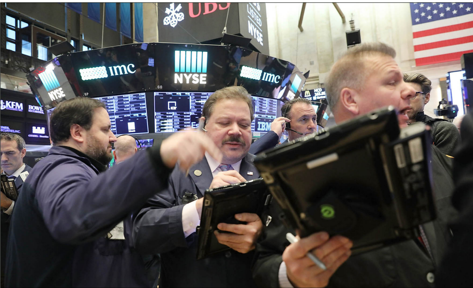
متعاملون في بورصة نيويورك

البيت الأبيض كانت موضوعية بشكل مفاجئ وغير معتاد، حيث أكد أن سياسة الرئيس تركز بالدرجة الأولى على البيانات الاقتصادية الأساسية بعيدة المدى «والتي لا تزال قوية بشكل غير معتاد»، حسبما قالت المتحدثة باسم البيت الأبيض سارة ساندرز.