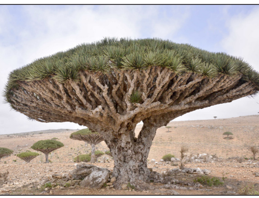
شجرة دراسينا التين في جزيرة سقطرى

وذكرت الوكالة أن هادي شدد على ضرورة «إيقاف كافة التصرفات المخالفة ومنها التصرفات بإراضي المنقطة الحرة حتى تنتهي اللجنة التي وجه فخامته بتشكيلها برئاسة رئيس الهيئة للوقوف على الاختلالات واتخاذ الإجراءات