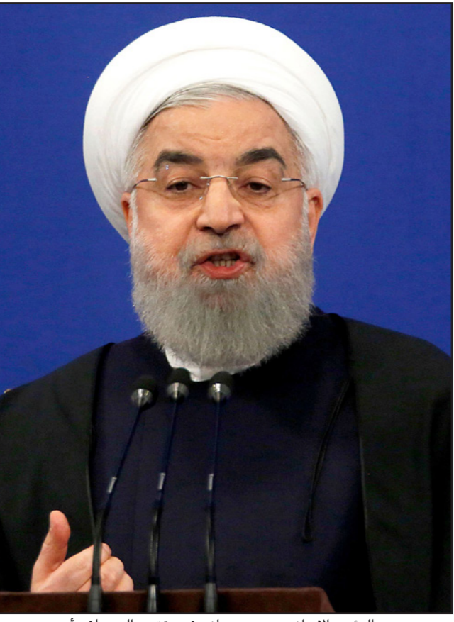
الرئيس الإيراني حسن روحاني في مؤتمره الصحفي أمس

وأدان تواجد القوات الأمريكية في سوريا، قائلا «فهم لديهم أهداف غير صحيحة في المنطقة ويسعون وراء تقسيم سوريا». وحول سياسة أمريكا القائمة على احتواء إيران في المنطقة والعلاقات الثنائية بين طهران وواشنطن، أوضح أن حل مشاكل المنطقة يتم عبر دولها، وأن إيران لا ترفض التحدث مع البلدان الأخرى من خارج المنطقة، وأنها قالت على السواء إنها ترفض تدخل القوى الأجنبية في شؤون المنطقة. وأكد الرئيس الإيراني أن مفتاح علاقات بلاده مع الولايات المتحدة بيد واشنطن، إذ على الأمريكيين التحلي عن ممارساتهم وضغوطهم وتهديداتهم وحظرهم، وفي مثل هذه الحالة ستتغير الأجواء من ذاتها وفي إطار يمكن التفكير للمستقبل. وأوضح أن إيران تعمل على امتلاك أي سلاح للدفاع عن البلاد سواء كانت طائرات أو صواريخ أو غواصات أو أي شيء يحتاج لهذا الغرض.