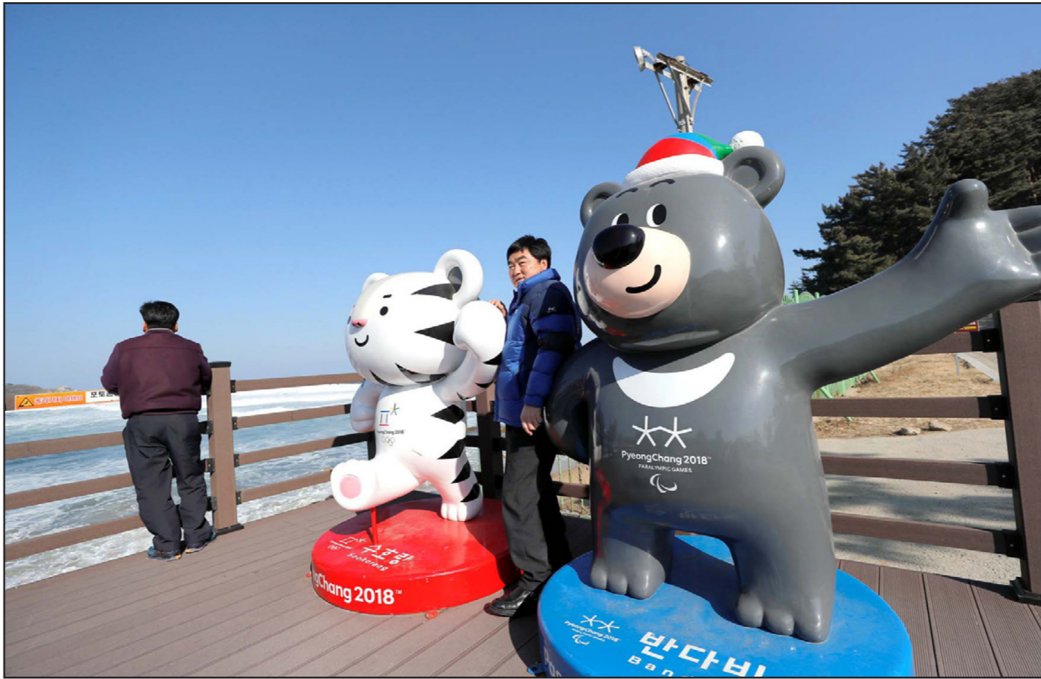
تعويدتا البطولة سوهورانغ (يسار) وباندامبي جذبتا العديد من الزوار