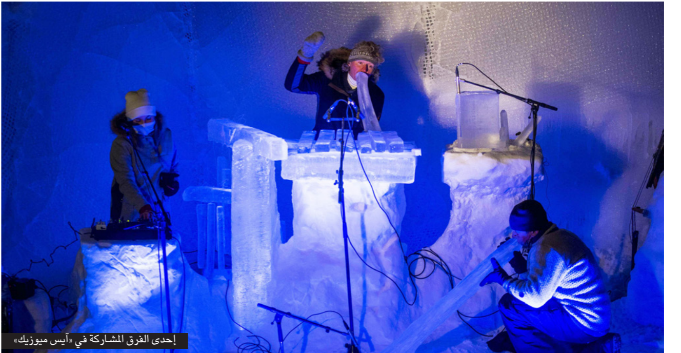
إحدى الفرق المشاركة في «أيس ميوزك»