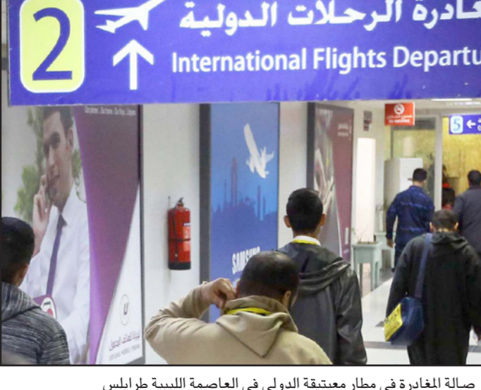
صالة المغادرة في مطار معيتيقة الدولي في العاصمة الليبية طرابلس