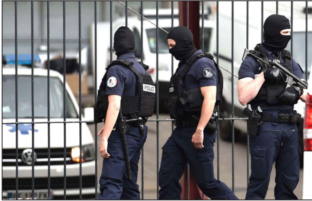
قوات أمن جزائرية

فرقت الشرطة الجزائرية أمس اعتصاما نظمه التكتل النقابي المستقل الذي يضم 12 نقابة، وذلك على مستوى ثانوية الإدريسي في العاصمة، وقامت بتوقيف عدد من منظمي الاعتصام، كما انتشرت قوات الأمن في معظم المحاور والنقاط المهمة في قلب العاصمة، خوفا من أي تنظيم أي احتجاج. وكان التكتل النقابي الذي يضم 12 نقابة مستقلة تمثل عدة قطاعات قد نظم اعتصاما أمام مقر ثانوية الإدريسي بساحة أول مايو في العاصمة، في إطار الإضراب الذي أعلنته عنه هذه النقابات، احتجاجا على عدم استجابة الوزارات المعنية للمطالب المرفوعة في قطاعات التعليم والصحة والتوظيف العمومي. وتفاجأ المحتجون بتدخل قوات الأمن التي تدخلت لفض الاعتصام بالقوة، بعد أن اعتقدوا أن السلطات ستتساهل معهم مثلما فعلت مع الأطباء المقيمين قبل يومين، والذين