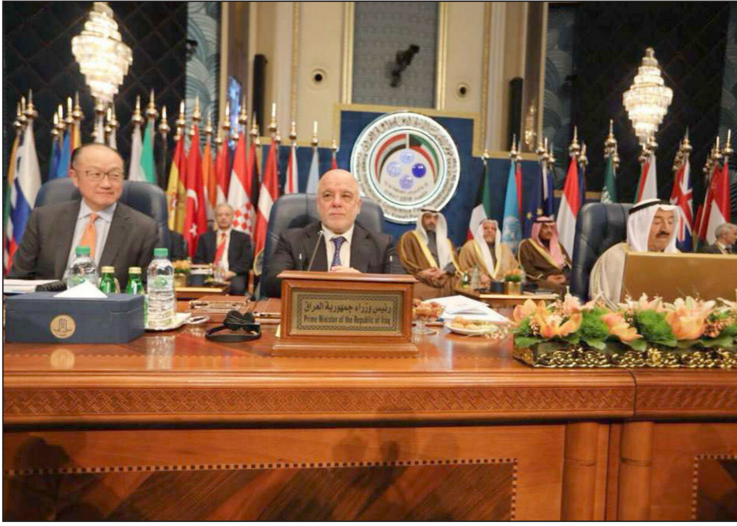
أمير الكويت يلقي الكلمة الختامية لمؤتمر المانحين والتي يمينه رئيس الوزراء العراقي

العراقي يؤكد للمستثمرين السير في عملية «القضاء على الفساد» و«البيروقراطية»