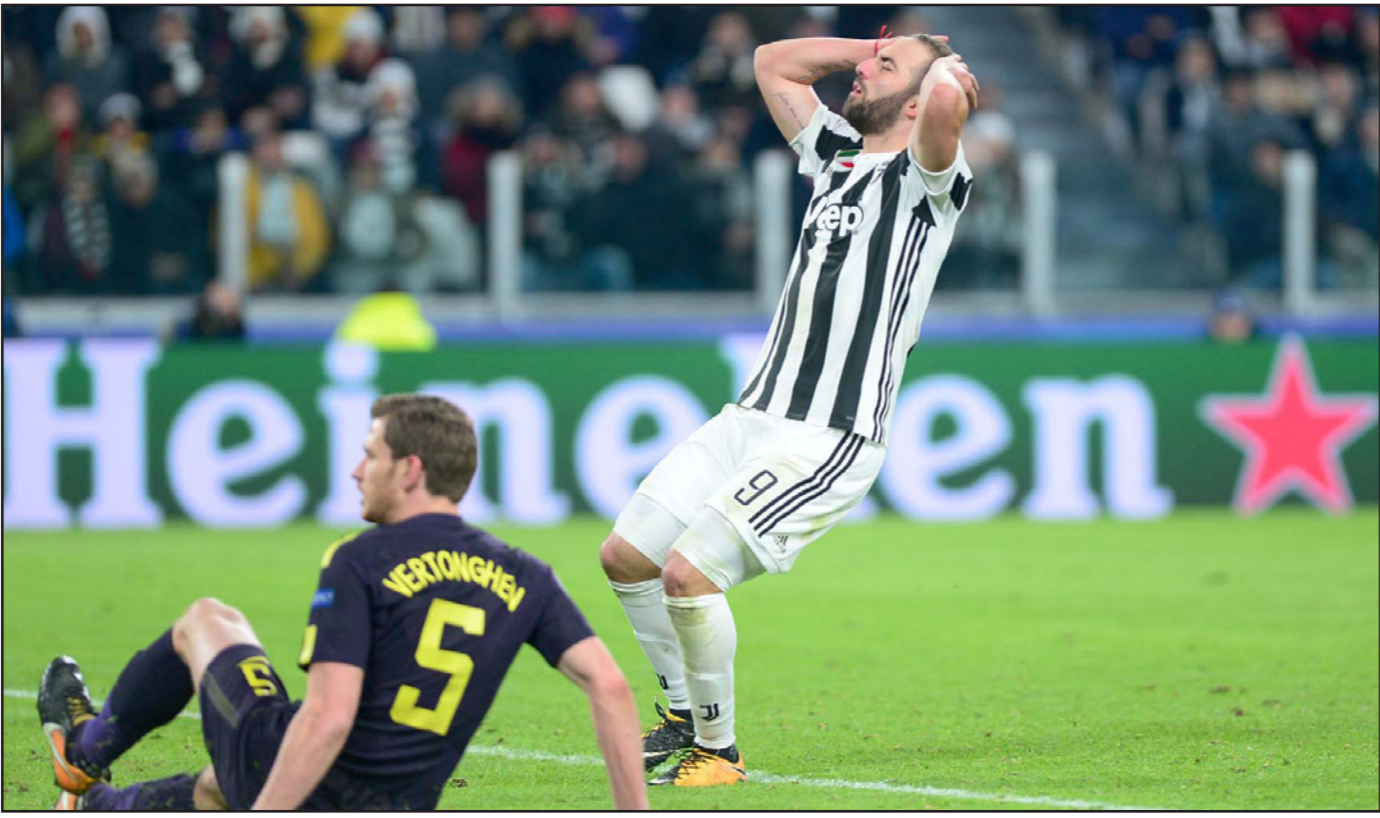
مهاجم يوفنتوس هيجواين (9) يتحسر على اضعاء ركلة جزاء وعدم تعزيز تقدم فريقه

توريو - رويترز: تعافى توتنهام بعد استقباله هذين في أول تسع دقائق ليتعادل خارج أرضه 2-2 مع يوفنتوس في ذهاب دور الستة عشر في دوري أبطال أوروبا. واقتتح غونزالو هيجواين التسجيل ليوفنتوس بعد دقيقتين ثم ضاعف التقدم من نقطة الجزاء، لكن الفريق الزائر بد بطريفة رائعة. وقلص هاري كاين الفارق في الدقيقة 35 لتهتز شبكات يوفنتوس لأول مرة في 2018 قبل أن يسد هيجواين ركلة جزاء عندما سدده في العارضة قبل نهاية الشوط الأول ليضع على نفسه فرصة الثلاثية. وحصل توتنهام على مكافأة على محاولاته عندما أدرك كريستيان إريكسن التعادل من ركلة حرة في الدقيقة 71، ما يعزز فرص الفريق اللندني في بلوغ دور الثمانية على حساب وصيف بطول الموسم الماضي حين يخوض لقاء الإياب في استاد ويمبلي. ودخل توتنهام المباراة وهو مليء بالثقة بعد فوزه بصدارة مجموعة ضمت ريال مدريد حامل اللقب، لكنه عانى من عشر دقائق مريعة في بداية المباراة، وتقدم يوفنتوس، الذي لم يخسر في آخر 26 مباراة على أرضه في أوروبا، في الدقيقة الثانية عندما وصلت تمريرة ذكية من ميرالم بيانيتش من ركلة حرة إلى هيجواين الذي سدده بقدمه اليمنى في شبكات الحارس هوغو لوريس. ولم يمرر توتنهام بالكاد كرتين متتاليتين عندما وجد نفسه متأخراً بهدف آخر في الدقيقة السابعة من ركلة جزاء، وتدخل بن ديفيز بشكل متهور على فيديريكو برنارديسكي ولم يجد