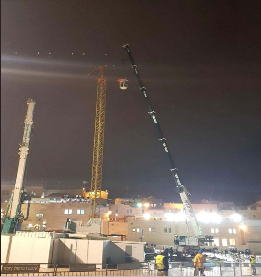
معدات إسرائيلية تمهيد لبناء المجمع التلمودي على أطراف ساحة البراق

كثيرا من ممتلكات أهل القرية، بعد أن خطوا «عبارات عنصرية» على الجدران، منها «الموت للعرب». وأكدت قيادة القوى الوطنية والإسلامية، على أهمية استكمال تشكيل «لجان الحراسة» في المناطق المهددة من المستوطنين، الذين قالت إنهم يعيثون فسادا في الأراضي المحتلة، من خلال الاعتداء على المدنيين، وكذلك من أجل التصدي للاقتحامات اليومية للمسجد الأقصى، تحت حماية جيش الاحتلال. وشدت القوى في بيان لها على أن سياسة التصعيد من قبل جيش الاحتلال والمستوطنين ستتخط على صخرة صمود ووحدة شعبنا المتمسك بحقوقه وثورته». ووجدت الدعوة كذلك لـ «المشاركة الفاعلة» غدا في «يوم غضب شعبي وجماهيري» في كل الأراضي الفلسطينية المحتلة، وفي كل مخيمات اللجوء والشتات وفي العديد من العواصم العربية