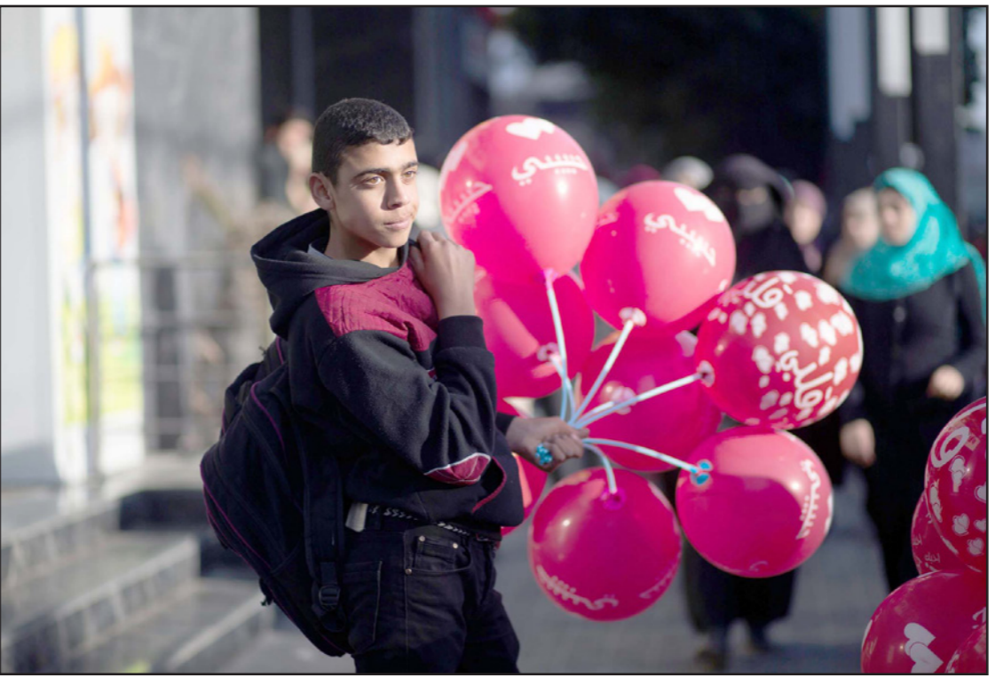
شاب في غزة يحاول بيع بالونات في عيد الحب