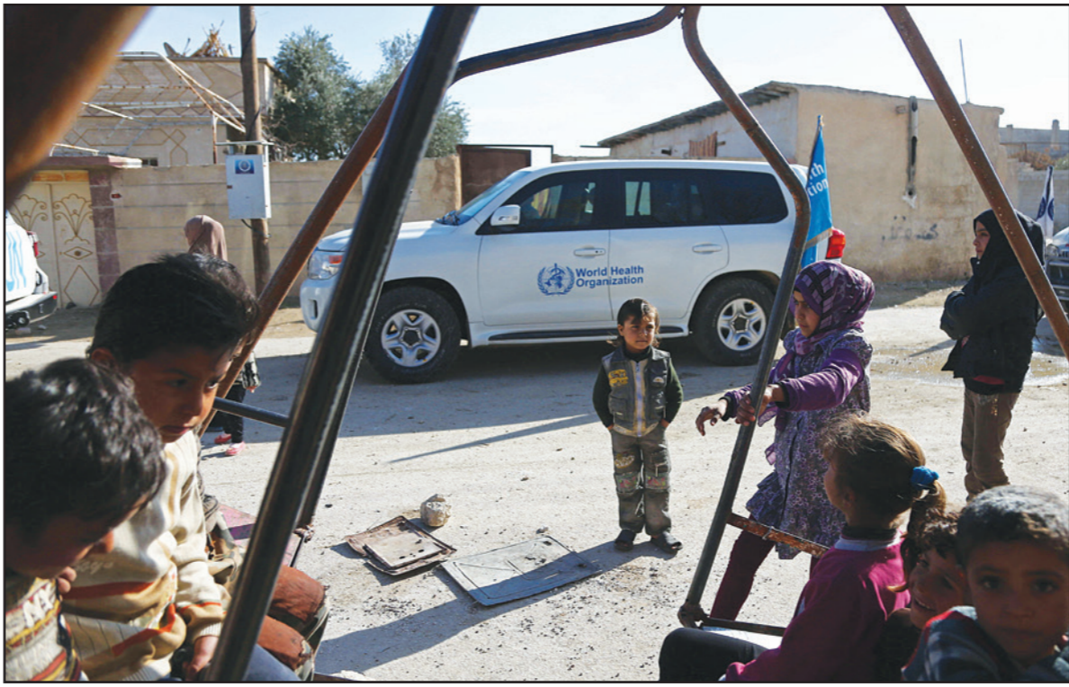
أطفال سوريون يلعبون أمام مقر مساعدات الأمم المتحدة في الغوطة الشرقية