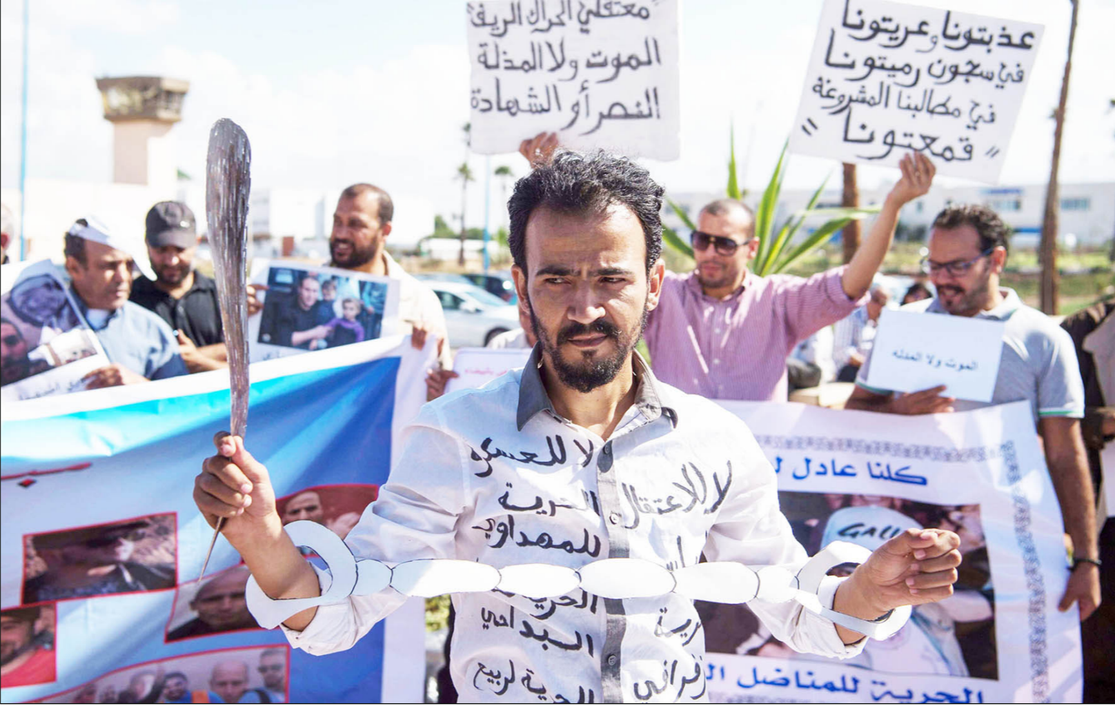
صورة ارشيفية للتضامن مع معتقلي حراك الريف

قدم له رئيس الجلسة وعدا بالنظر في المنازلة. وطلبت هيئة الدفاع من النيابة العامة تقديم خلاصات التحريات التي سبق ووعدها مطلعها في جلسة يوم الاثنين بمتابعتها، وهو ما استجاب له حاكم الوردي الذي قال ردا على سؤال محامي المتهمين بأن «المحجوزات لا تحترم القانون، مضيضا أن قرار إدارة السجن يستمد مشروعيته من القانون المنظم للسجون.