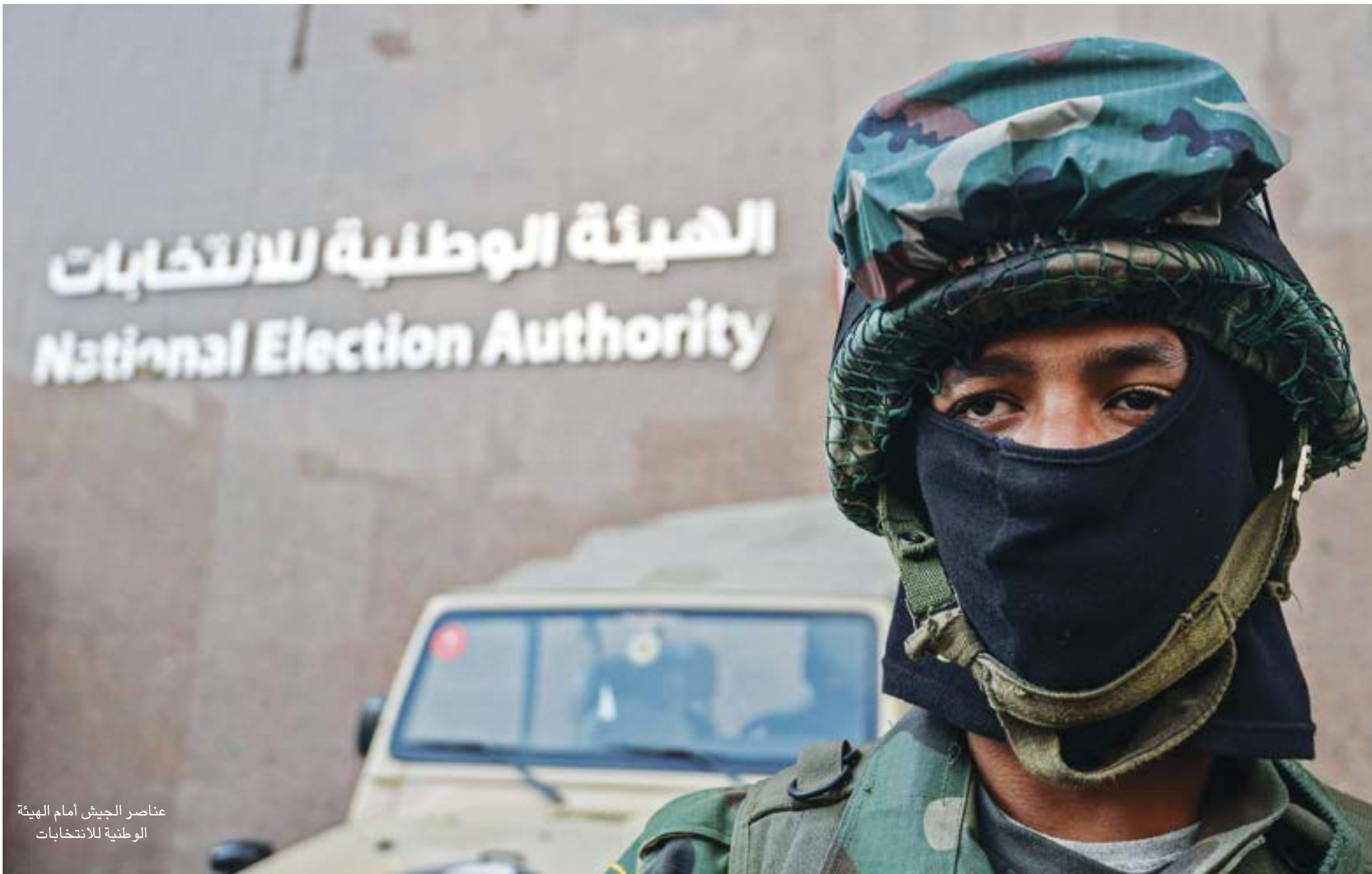
عناصر الجيش أمام الهيئة الوطنية للانتخابات

الدولة المصرية والأجيال المقبلة سياسيات الإقراض الحالية، وفسرت في الأرض المصرية، وصادر الحريات العامة، ومارس سياسات التمييز ضد المواطنين على أساس الدين والجنس والوضع الاقتصادي، وفشل في مواجهة الإرهاب حتى وصلت العمليات الإرهابية إلى كل مكان في مصر، وبتنا ندفع ثمنه بشكل يومي من أرواح المواطنين والجنود والضباط».