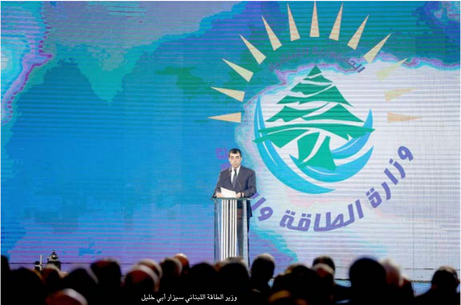
وزير الطاقة اللبناني سيزار أبي خليل

المساحة المتنازع عليها بمحاذاة هذا الخط من الجهتين اللبنانية والإسرائيلية، خارج عمليات التنقيب إلى حين حسم الترسيم النهائي، على أن يتم البدء بعملية الاستثمار في بقية المناطق غير المتنازع عليها وفق إطار التفاهم أو الاتفاق على الخط الأزرق البحري المتوافق عليه من الطرفين. إلا أن لبنان لا يبدو بصدد التخلي عن حقوقه الكاملة أو التفريط بأي شبر من حدوده البحرية خصوصا بعد التوقيع الرسمي لاتفاقيتي النفط والغاز وتحضير برامج الاستكشاف تمهيدا لحفر الآبار.