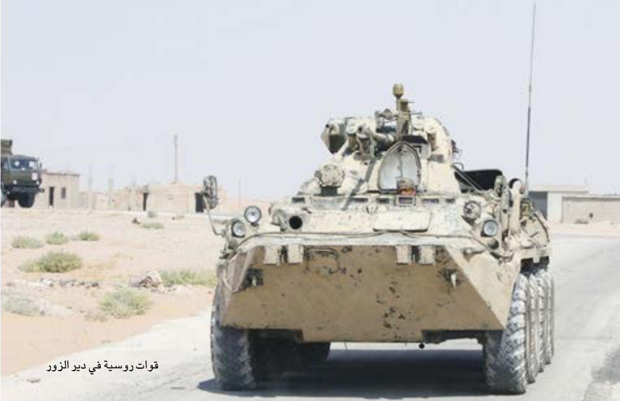
قوات روسية في دير الزور

النظام من هذا الهجوم أنه محاولة للاستيلاء على حقل خشام النفطي الذي سيطرت عليه «قسده» نهاية أيلول/ سبتمبر الماضي. وتأتي العملية في سياق الانتقاد الروسي لشريعة التواجد الأمريكي في سوريا والذي اعتبرت موسكو مزمرا أن تدخل القوة الأمريكية لصالحها، إلا أن ذلك سيغير أسئلة جديدة وشكوكا عن الالتزام الأمريكي في المناطق التي تسيطر عليها «قسد» غرب نهر الفرات، وتحديدا منبج وتل رفعت، بعد أن تخلت عن مساندة حليفها في منطقة نفوذ خاصة بها وبلحفاها. هجوم قوات النظام شرق النهر يفسر بأنه محاولة رصد ردة الفعل الأمريكية، ويأتي كاختبار ليس للعلاقة مع أمريكا ودهما، وإنما «قامت قوات سوريا الديمقراطية بمدعومة بقوات التحالف بالرد خصوصا مع توتر العلاقة والغضب