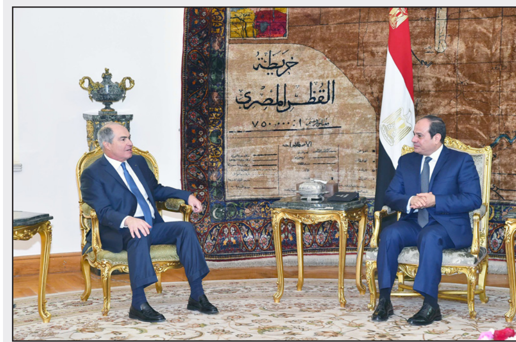
الرئيس المصري عبد الفتاح السيسي خلال لقائه رئيس الوزراء الأردني هاني المنفي في القاهرة أمس

أكد الرئيس المصري عبد الفتاح السيسي، أمس الثلاثاء، خصوصية العلاقات التي تربط بلاده مع الأردن، لاسيما في ظل الظروف والتحديات التي تواجه المنطقة. جاء ذلك عقب استقبال السيسي رئيس الوزراء الأردني هاني المنفي، حسبما أفاد المتحدث باسم الرئاسة المصرية بسام راضي. وقال المتحدث، في بيان إن «رئيس الوزراء الأردني أكد قوة ومثانة العلاقات التي تجمع البلدين وحرص الأردن على تعزيزها في مختلف المجالات، ومشيروا إلى الاهتمام باستمرار التنسيق مع مصر بشأن مختلف القضايا ذات الاهتمام المشترك، خاصة في ظل أهمية ومحورية الدور المصري في المنطقة، وبما يساهم في مواجهة التحديات المشتركة التي تمر بها الأمة العربية ووفق العلاقات الاستراتيجية المتميزة بين البلدين». وأضاف أن «الرئيس المصري أشار إلى أهمية مواصلة التنسيق المكثف بين الجانبين على كافة المستويات، مؤكدا حرص مصر على مواصلة العمل على تطوير التعاون المشترك بين البلدين، بما يساهم في تحقيق