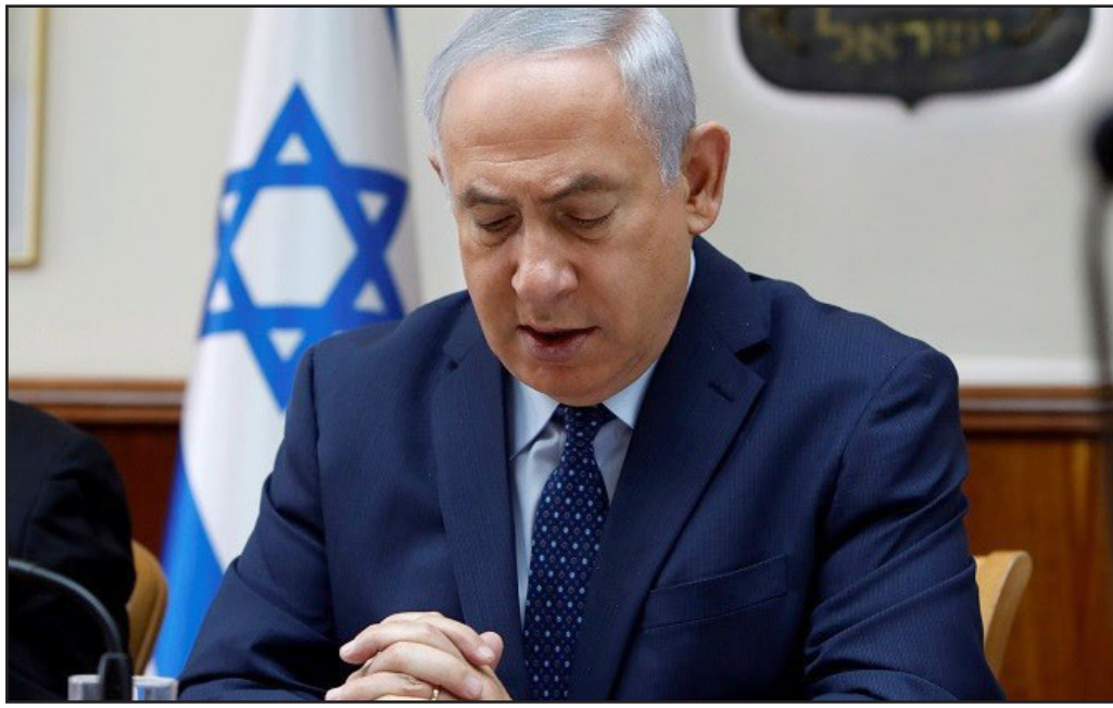
رئيس الوزراء الإسرائيلي بنيامين نتنياهو

وهذه على تأييد القانون بالقراءات الثلاثة، الثالث، تعهد علني من افيغدور ليبرمان باجراء هذه العملية.