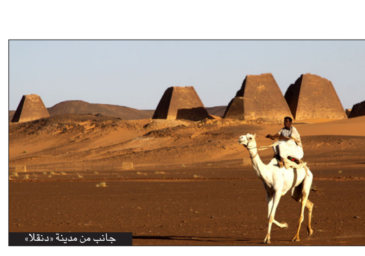
جانب من مدينة «دنقلا»

الخرطوم - من حسام بدوي: انطلقت في مدينة «دنقلا»، شمالي السودان، فعاليات عاصمة الثقافة السودانية للعام 2018-2020. وشهد مسرح مهيرة في المدينة ليلية ثقافية بمناسبة تدشين الفعاليات، عروضاً فنية وتراثية، إلى جانب فقرات غنائية ورقصات تعكس التنوع العرقي والثقافي للسودان. وقال وزير التعاون الدولي إدريس سليمان، خلال الفعالية، إن «الثقافة تعتبر مشروع السودان الوطني الأساسي». وأضاف «الثقافة تعمل على تعزيز مسسات الوحدة الوطنية وتسهم في معالجة قضايا الوطن السياسية والاقتصادية والاجتماعية». و يوجد في المدينة عدد من المعالم الأثرية التي تعود إلى عهد الحضارة الروية (2500 ق.م). وشهدت دنقلا إقامة مظلة الفترة المسيحية بين الأعوام (800 ق.م، حتى 350). كما يوجد فيها مسجد عبدالله بن أبي السرح الذي يعد