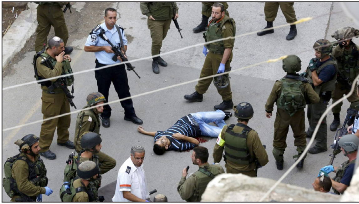
عناصر من الجيش والشرطة الإسرائيلية يحيطون بشهيد فلسطيني عقب إطلاق النار عليه

■ لقد حان الوقت لقول الحقيقة، حتى لو كانت قاسية ومرة. نحن شعب يكاؤون بيكون ويولولون منذ أيام دير ياسين وحتى الآن ويتهمون اليهود، كفى. لا توجد إبادة شعب. لا توجد جرائم حرب. لا يوجد قمع. أنا لا أصقح اليهود الذين يسئون «نحط الصمت» أو «بتسيلم»، فهم وكلاء للمؤسسة الصهيونية وهدفهم هو البث للأغيا: كم هي اسرائيل دولة ديمقراطية وجميلة. هي فيلا في الغاية. الجيش الاسرائيلي هو الجيش الأكثر أخلاقية في العالم، جيش على كفتك. انساني. له قيم انسانية. طهارة السلاح. ليس مثل جيوش الشعوب العربية. ليس مثل جيش فرنسا في الجزائر أو جيش الولايات المتحدة في فيتنام. «بتسيلم» تحتج على إغلاق المناطق، رغم أن الاغلاق هو من أجل الشعب الفلسطيني، من أجل أن يبقى مغروصا في أرضه وأن لا يهاجر أبناؤه إلى الغرب ويتحولون إلى لاجئين ويتهمون دولة اسرائيل. «نحط الصمت» يضحكون كل حادثة ويتحدثون عن القتل والاعدام، هذا كذب. نحن مسلمون، تؤمن بالله والباقر، ومكتوب في كتابنا القدس متى سويول كل مسلم ومتى سموت، وما هو سبب موته. عندما ياتي ملك الموت فلبسنا باني شيء. لا توجد رشوة ولا جمالية. الجيش الاسرائيلي لا يقتل ولا يقوم باعدام العرب، الله هو المسؤول عن الموت. جنود الجيش الاسرائيلي يتعمون معروفوا مع كل فلسطيني قتل أو اعدم. لأن عائلته ستحصل على عدية شهوية محترمة من ابو مازن، وهو يتحول إلى شهيد يدخل مباشرة