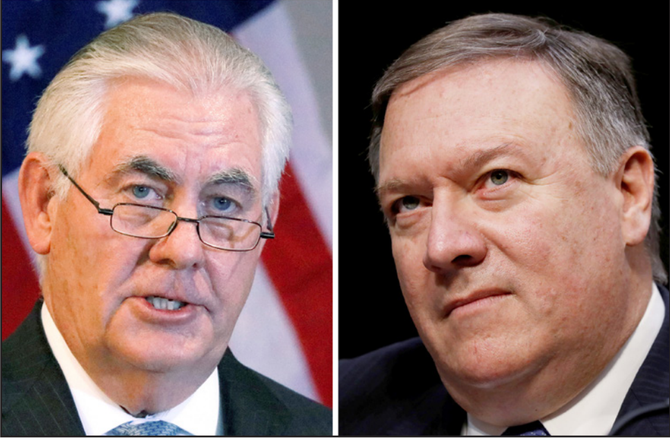
وزير الخارجية الأمريكي المقال ريك تيلرسون (يسار) والجديد مايك مومبيو