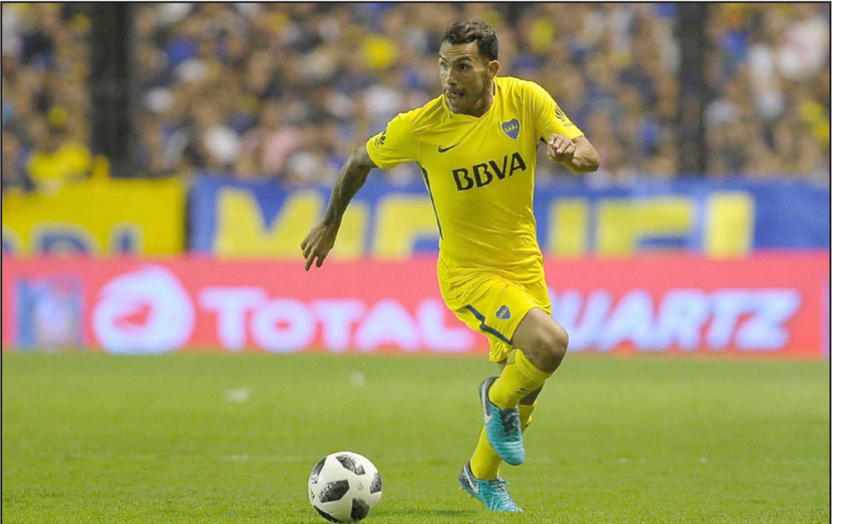
تجم بوكا تيفيز يتطلع إلى لقاء القمة الليلة ضد ريفر بلايت

اوسكار هاريسون، رئيس اتحاد باراغواي لكرة القدم، الأسبوع الماضي أن جميع المدربين الستة الموجودين في القائمة من طراز رفيع. وأضاف هاريسون: «سيكون لدينا مدرب، وسيكون مهما على مستوى كبير، نشعر بالبهود، سيكون لدينا مربيا للمنتخبنا». وتابع: «سكون حذرين، وستستغل هذا الوقت بأفضل طريقة». وبالإضافة إلى مباراة أمريكا الودية، تلقت باراغواي مع اليابان في ودية أخرى بالنمسا في 12 حزيران/يونيو المقبل، وخوض المنتخب الياباني مونديال روسيا ويلعب في المجموعة الثامنة بجانب بولندا والنمغال وكولومبيا.