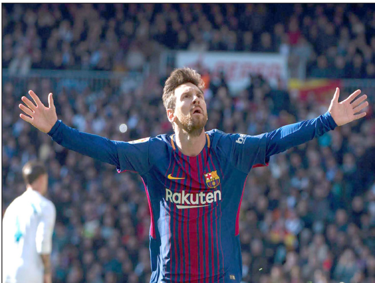
ميسي يعود إلى صفوف برشلونة بعد اجازة أبوة قصيرة

وفي مباراة اليوم الثانية، تبدو المنافسة شبه معدومة بين بايرن ميونيخ الألماني حامل اللقب 5 مرات، ومضيفه بشكتاش الذي أصبح أول فريق تركي يتصدر مجموعته في الدور الأول، لخسارة الأخير ذهابا صفر-5، عندما خاض 75 دقيقة بعشرة لاعبين أثر طرد قلب دفاعه الكرواتي دوموغوي فيدا. ولم ينجح أي فريق في تاريخ المسابقات الأوروبية في قلب تأخره ذهابا بخماسية، بينما نجحت أربعة أندية بقلب تأخرها بأربعة أهداف، آخرها برشلونة الموسم الماضي أمام باريس سان جيرمان الفرنسي في ثمن نهائي دوري الأبطال (صفر-4 و4-1). ويقدم البايرن موسما رائعا، فبات على بعد فوزين من لقب سادس تواليا في الوندسليغا، لينضم مدربه يوب هاتيكس أمثال الفريق البافاري في تحقيق الثلاثية التاريخية (الدوري والكأس المحليان) ومسابقة دوري أبطال أوروبا منذ عودته لاستلام دفة تدريبه في تشرين الأول/ أكتوبر الماضي خلفا للبرازيلي كارلو انشيلوتي المقال من منصبه عقب الخسارة المذلة أمام باريس سان جيرمان الفرنسي صفر-3 في دور المجموعات لدوري الأبطال، وكان المدرب المخضرم قد أتبعه عن التدريب منذ عام 2013 بعدما قاد بايرن إلى ثلاثة تاريخية، علما أنها كانت آخر الأربعة يحرز النادي لقب المسابقة الأوروبية الأم.