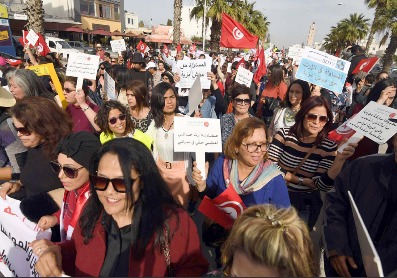
جانبا من مظاهرة لتونسيات للمطالبة بالمساواة في الميراث

تونس - «القدس العربي» من حسن سلمان: أثارت المظاهرات الأخيرة التي نظمتها سياسيون وحقوقيون تونسيون للمطالبة بالمساواة في الميراث بين الرجل والمرأة، جدلا كبيرا داخل تونس وخارجها، حيث اعتبرت هيئات دينية عربية أن هذه الدعوات التي قالت إنها صادرة عن أقلية تونسية «متأثرة بالغرب»، وتجهل أحكام الإسلام، وتهدف إلى تغيير هوية المجتمع المسلم، فيما اعتبر أحد رجال الدين أنها تعتبر بمثابة «حرب على الله والدين». وكانت عشرات المنظمات المدنية نظمت السبت الماضي تظاهرة في العاصمة التونسية، شارك فيها مئات السياسيين والحقوقيين، وطالبت بتفعيل مبدأ المساواة في الميراث بين الرجل والمرأة. وأصدرت «جمعية العلماء المسلمين الجزائريين» بياناً بعنوان «بلاد الزيتونة والطاهر بن عاشور إلى أين؟»، نشرت على صفحتها في موقع «فيسبوك»، وتساءلت فيه «ماذا يحدث في تونس؟ عجب ما يجري في بلد العلم والعلماء في بلد الزيتونة وبلد الشيخ الطاهر بن عاشور (تونس الشقيقة) هذه الأيام، إذ أن أقلية مستغربة جاهلة بأحكام الله عزوجل تريد أن تغير نصاً قرآنياً في الميراث بحجة المساواة بين الرجل والمرأة، متناسية أن الإسلام هو من كرم المرأة، ولكن ما يؤسف له أنها هذه الأقلية