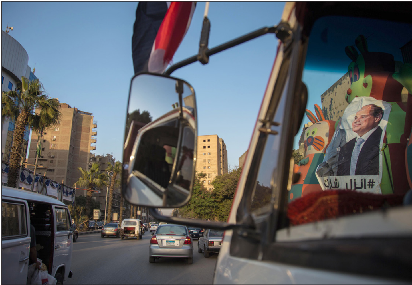
من حملات تأييد السيسي في الانتخابات

وتبدو نتيجة الانتخابات الرئاسية شبه محسومة لصالح السيسي، الذي يسعى إلى فترة رئاسية ثانية من أربع سنوات، في مواجهة رئيس حزب الغد (ليبرالي) موسى مصطفى موسى، الذي أعلن قبيل أيام من ترشحه تأييد السيسي. وتقلب على الرئاسيات الهوء، وسط عشرات من الحملات لحملة السيسي، في أغلب محافظات البلاد، دون حضور الأخير لأي منها حتى الآن. وتولى السيسي رئاسة البلاد في 8 يونيو/حزيران 2014، وامتدت ولايته الأولى 4 سنوات.