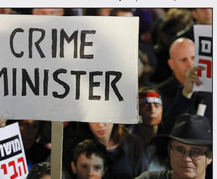
إسرائيليون يتظاهرون ضد فساد نتنياهو في تل ابيب

■ الانتخابات المبكرة التي يفرضها نتنياهو الآن على شركائه ستفرق قبل أي شيء حزبي «كلنا» و«البيت اليهودي». على كلحون وبينيت تجنيد احزاب المعارضة، وربما أيضاً الاحزاب الحريدية لحكومة انتقالية بديلة. يترأسها شخص لسن يتنافس على هذا المنصب في الانتخابات القادمة. هكذا يعمون رئيس الحكومة من استقبال ترامب في السفارة القدس، وابقاء البند على الزناد في مواضيع الامن والمناطق واحتلال شاشنة التلفاز من دون توقف مع اعلانات رسمية حسب الحاجة. هكذا يتفاوض والعقلائي، الذي استخدم صناديق الاقتراع للتلمس من سلطة القانون.