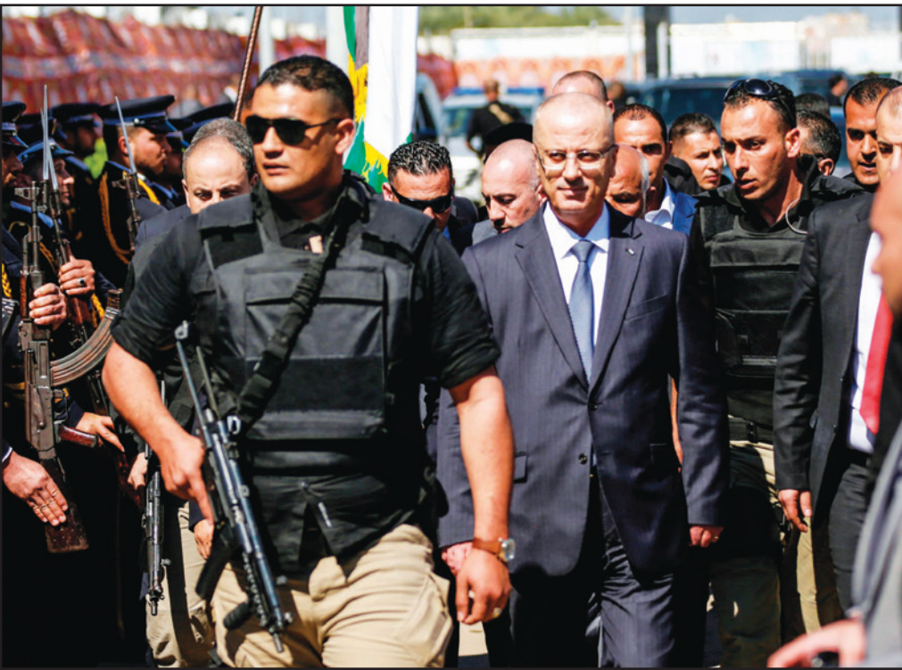
رئيس الوزراء الفلسطيني رامى الحمد الله وسط حراسه يتلقى تحية عسكرية من قوات شرطة حماس في غزة أمس

الله، و«أكمل: «ما جرى لا يمثل الوطنية الفلسطينية ولا يمثل قطاع غزة والشعب الفلسطيني، هذا عمل جبان»، وقال: «ما جرى يؤكد ضرورة أن يكون هناك سلطة واحدة وسلاح واحد، ومطلب أي حكومة هو تسليم ملف الأمن الداخلي لها»، واختتم: «نطلب من حماس تسليم الأمن الداخلي للحكومة الفلسطينية، ولن يكون هناك تواجد فعلي للحكومة بدون أمن». وسارعت الفصائل الفلسطينية إلى التنديد بالعملية، وطالبت الأجهزة الأمنية بملاحقة الجناة وتقديمهم بشكل عاجل للعدالة، واتخاذ كل الإجراءات التي تحول دون تكرار هكذا اعتداءات. وشددت على أن استهداف الموكب على خطورته «يجب ألا يؤدي إلى انعكاسات سلبية على جهود تحقيق المصالحة». وأدانته حماس «جريمة» استهداف الموكب، وقال الناطق باسمها فوزي بروه «إن هذه الجريمة جزء لا يتجزأ من محاولات العيب بأمن قطاع غزة، وضرب أي جهود لتحقيق الوحدة والمصالحة، وأفضا ما وصفها بـ«الانتهاكات الجاهزة»، من الرئاسة الفلسطينية لحركته التي قال إنها «تحقق أهداف المجرمين»، وأضاف «من استهدف موكب الحمد الله، هي الأيدي التي اغتالت الشهيد مازن فقها وحاولت اغتيال اللواء توفيق أبو نعيم»، مطالباً الجهات الأمنية ووزارة الداخلية بـ«فتح تحقيق فوري وعاجل» لكشف الملابس ومحاسبة المرتكبين. يذكر أن أجهزة أمن حماس تمكنت من اعتقال مشبهين عقب التفجير.