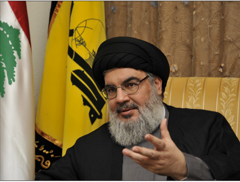
حسن نصر الله

مرهونة بوجود الجمهورية الإسلامية والشعب الإيراني، وفي فترة عام 2009 ذهب إلى إيران، والتقى القادة (قادة الثورة الخضراء)، وقلت لهم إن جميع أعداء إيران سعداء، وجميع الشيعة في العالم مزعجون مما حدث». وأظهر نصر الله عداوة للرئيس المصري محمد مرسي، وقال للإيرانيين في لبنان: «أنا لم أؤمن بمرسي قبل انتخابه؛ لأنه كان سنيًا للغاية، وأرأينا موقفه خلال زيارته إلى طهران (في إشارة إلى خطاب مرسي الداعم للثورة السورية في طهران، وترضية عن الخلفاء الراشدين)، الشعب ثار ضد مرسي، وسقط بعد مرور عام واحد من حكمه، وأنا شخصياً كنت سعيداً جداً بسقوطه، وفي اليوم التالي من سقوط مرسي، تم الاتصال بي من قبل مسؤول في طهران، وقال إن لدينا اجتماعاً مع خامنئي حول سقوط مرسي، وطلبوا أن يسمعوا رأيي بما حدث، وعبرت لهم عن سعادي، وقلت لهم: انقلوا سعادي بسقوط مرسي المرشد خامنئي في اجتماعكم».