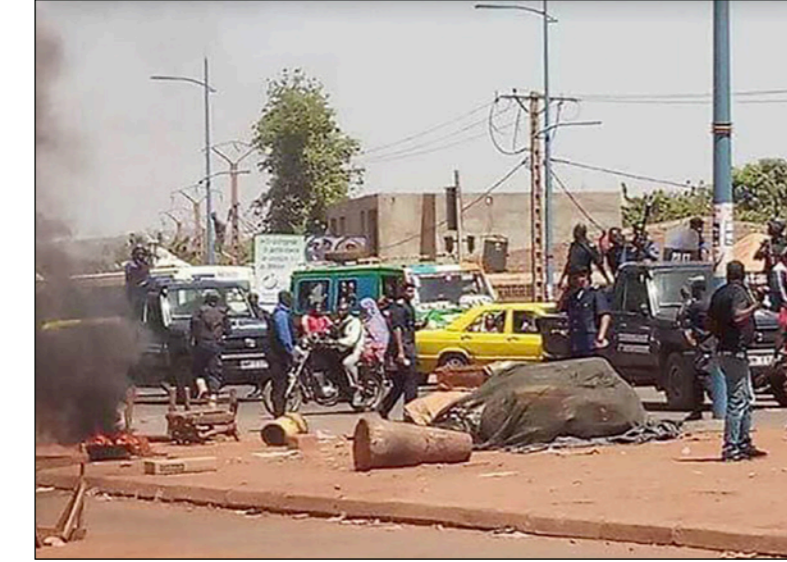
السفارة الجزائرية في العاصمة المالية باماكو