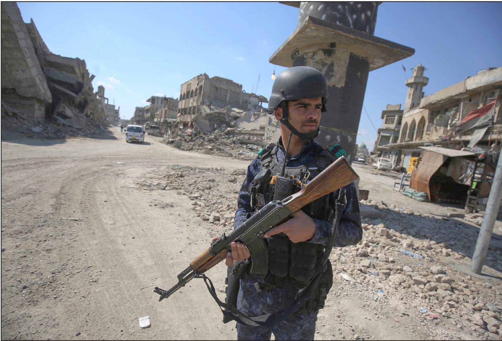
جندي عراقي في الموصل

ألف جثة تعود لمدنيين سقطوا ضحايا خلال التحرير. إلى ذلك، أعلن الجيش التركي أمس الخميس، أن سلاح الجو التركي دمر ثمانية أهداف لمنظمة «حزب العمال الكردستاني» شمالي العراق. ونقلت وكالة «الأناسول» التركية للأنباء عن بيان لرئاسة أركان الجيش أن الغارات وقعت أمس واستهدفت مواقع في منطقتي هاسكورك وزاب في شمال العراق.