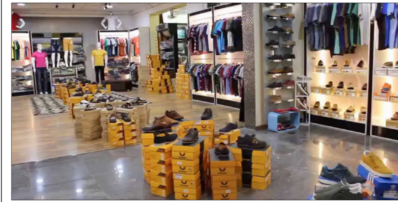
متجر للملابس والأحذية الرجالية التركية في عمان

عمان - الأناضول: اضطرت الحكومة الأردنية مؤخرا إلى الإعلان عن وقف اتفاقية التجارة الحرة مع تركيا، في محاولة منها لإعادة الثقة إلى القطاع الصناعي المحلي. وتعد تركيا من أبرز أربع شركاء تجاريين للأردن، الذي كان يستورد منها سلعا غذائية وملابس وأجهزة ومعدات كهربائية، ولوازم لوجستية. وتسبب القرار الذي صدر الإثنين الماضي في جدل بين مؤيد ومعارض لقرار الحكومة وقف العمل باتفاقية إقامة منطقة تجارة حرة بين الأردن وتركيا. ووبرت الحكومة وقف العمل باتفاقية بالتحديثات التي تواجه القطاع الصناعي، جزاء إغلاق المنافذ الحدودية مع الدول المجاورة، وانحسار الأسواق التصديرية التقليدية أمام الصادرات الوطنية. وجرى توقيع الاتفاقية بين البلدين في ديسمبر/كانون أول 2009، ودخلت حيز النفاذ في مارس/آذار 2011. وحسبما تقول الحكومة الأردنية، فإن القرار الأخير يهدف إلى تجنب مزيد من الآثار السلبية التي لحقت بالقطاع الصناعي، في ضوء المنافسة غير المتكافئة التي يتعرض لها من البضائع التركية التي تحظى بدعم من الحكومة. وقال مصدران وصناعيون أن القرار يحمي مصالحهم وانتاجهم من المنافسة القوية والمنتجات التركية التي تعد جودتها عالية وأسعارها تنافسية. إلا أن القطاع التجاري وأسواق التجزئة يرون في القرار غير ذلك، ويقولون أنه سيترك أثرا سلبيا على استثمارات قائمة على أساس هذه الاتفاقية. ووفق إحصائيات رسمية، بلغت الصادرات الأردنية إلى تركيا العام الماضي نحو 66 مليون دينار (93 مليون دولار)، في حين أن الواردات بلغت 484 مليون دينار (682.1 مليون دولار).