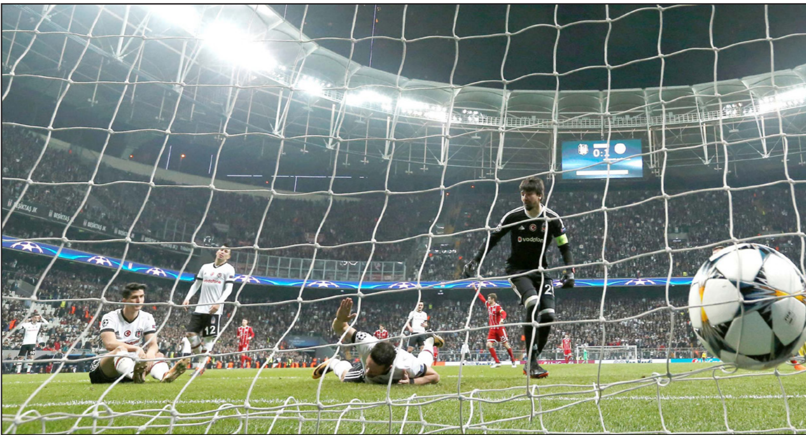
مدافع بشكتاش غونول (وسط) يتحسس على وضع الكرة بالخطأ في شبكته مسجلا الهدف الثاني للبايرن

وقال فيردناند، الذي يعمل معلقا لشبكة «بي تي»، أن ميسي نشرت مواقع رياضية مقطعا مصورا للاعب الإنكليزي السابق ريو فيردناند، وهو منفعل بحماس كبير بعد تسجيل الأرجنتيني ليونيل ميسي، نجم برشلونة، أحد هدفيه في مرمى تشلسي.