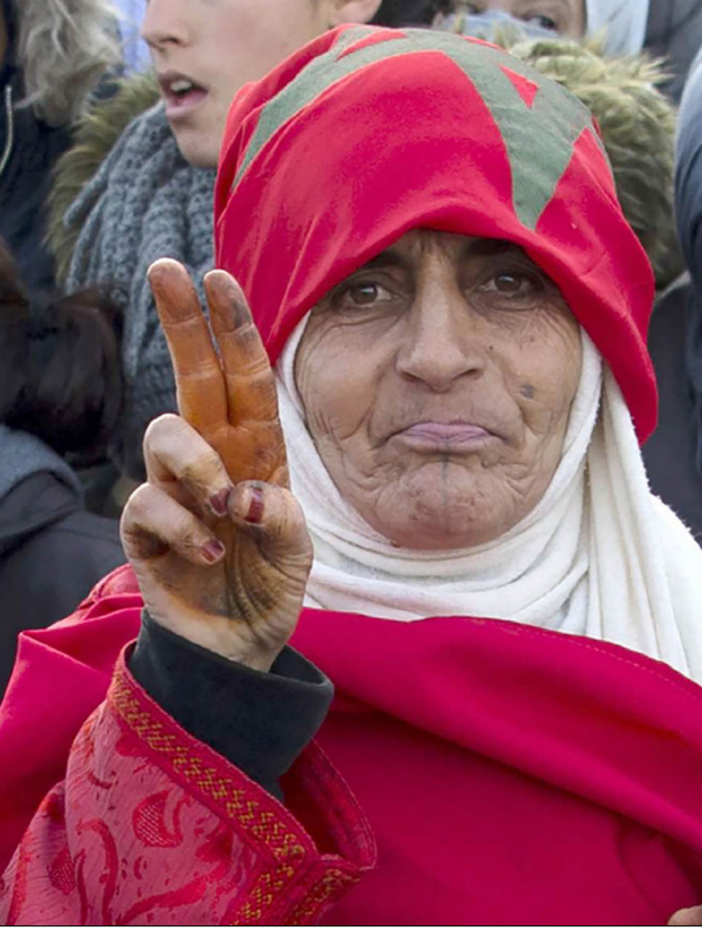
صورة ارشيفية لمدينة مغربية في تظاهرات مدينة جرادة

وان «غالبية المعطوبين من القوات العمومية» وأن «المصابين من المحتجين تجنبوا الذهاب للمستشفى خوفا من اعتقالهم من قبل الأمن.» وقالت وزارة الداخلية في بلاغ أرسلته لـ«القدس العربي» انه بالرغم من القرار الصادر يوم الثلاثاء 13 آذار/ مارس الجاري، عن السلطات المحلية لإقليم جرادة، بشأن منع تنظيم جميع الأشكال الاحتجاجية غير المرخصة، حاولت مجموعات من الأشخاص، اليوم (أول من أمس الأربعاء) في تحد لقرار المنع هذا، تنظيم اعتصام في محيط الأبار المهجورة على مقربة من ثانوية القفح، عند خلاله بعض العناصر المتلمذة، في خطوة تصعيدية، إلى استقزاز القوات العمومية ومهاجمتها بالحجارة، مما اضطر معه هذه القوات، بالتنسيق مع النيابة العامة المختصة، إلى التدخل لفض هذا الشكل الاحتجاجي.