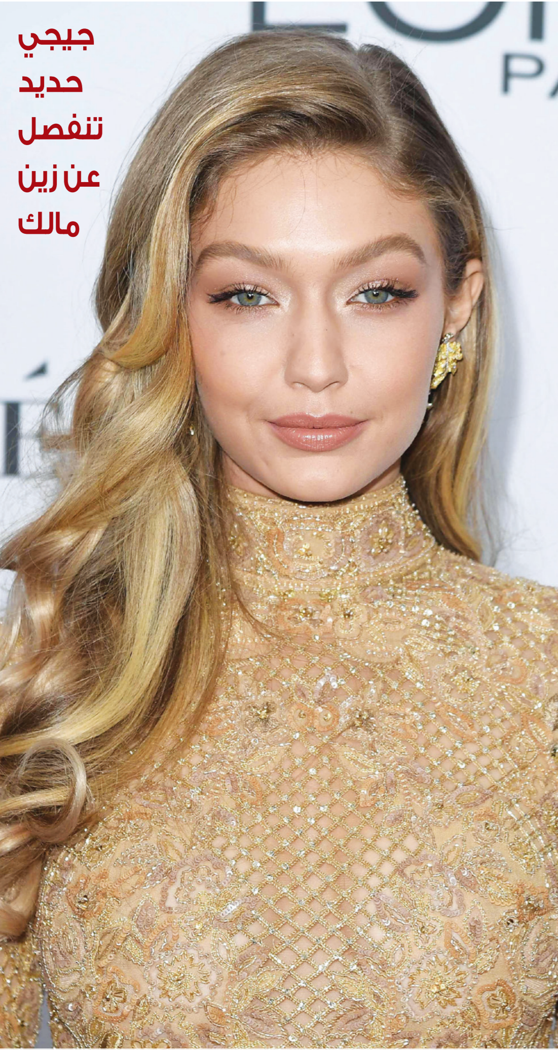
بعد ارتباط دام أكثر من عامين، قررت عارضة الأزياء الفلسطينية الأمريكية جيجي حديد، والمغني المصري الأمريكي زين مالك، إعلان انفصالهما بشكل نهائي، وقال أن اتخاذ هذا القرار كان صعباً للغاية، وأنها سيستمران كصديقين.

● يتردد إن المحامية اللبنانية أمل علم الدين، زوجة النجم الأمريكي جورج كلوني، قامت بتعريف النجمة الأمريكية أنجلينا جولي على رجل أعمال بريطاني خلال زيارتها للمملكة المتحدة العام الماضي وأنجلينا تنوي الزواج منه لتستقر في لندن في نهاية المطاف.