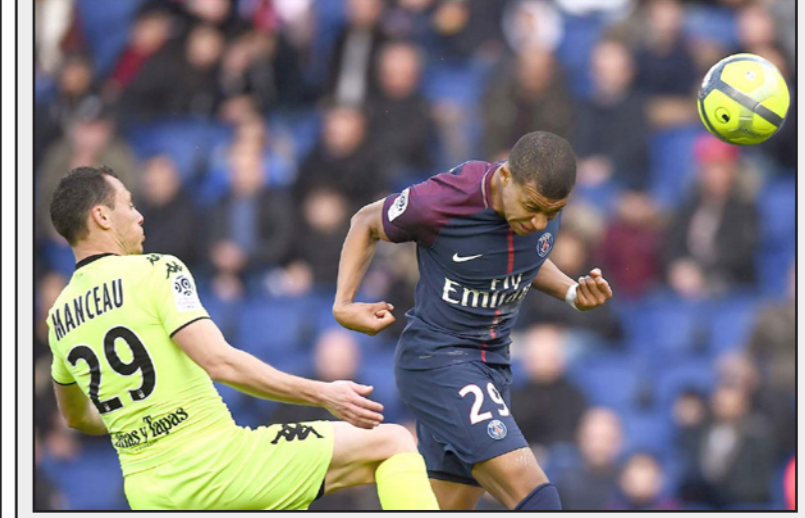
صاحب هدفي سان جيرمان مبابي يسدد كرة برأسه على مرمى انجيه

وسجل لاعب الوسط موتا على بطاقة حمراء مباشرة في الدقيقة 16 بعدما داس على صدر رومان توماس، لكن مبابي افتتح التسجيل بافعل، ثم ضاعف مهاجم فرنسا النتيجة في الشوط الأول ليرفع سان جيرمان رصيده إلى 80 نقطة من 30 مباراة، ويحتل انجيه، الذي قلص الفارق عن طريق كارل توكو إيكامي في الشوط