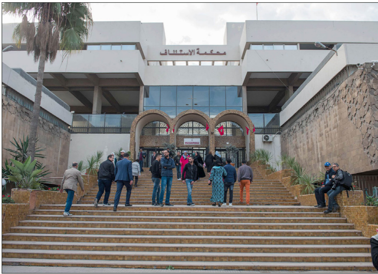
محكمة الدار البيضاء

محضر الشرطة القضائية، الذي يؤكد أن البحث والتحري جريا في إطار مقتضيات البحث التمهيدي. وقال ان الوكيل العام للملك، خلال دواته الصحافية، يوم الثلاثاء لم يستطع تقديم جواب مقنع وأضح حوله «ما إذا كان قرار المتابعة بناء على حالة تلبس، هو خلاصة البحث التمهيدي أو لا»، بل إنّه «فقدى الوقوف عند هذه النقطة، وظهور كانه يفتادى الوقوف عندها، وبالتالي، فقد وضع قراره موضع جدل وسط الرأي العام.»