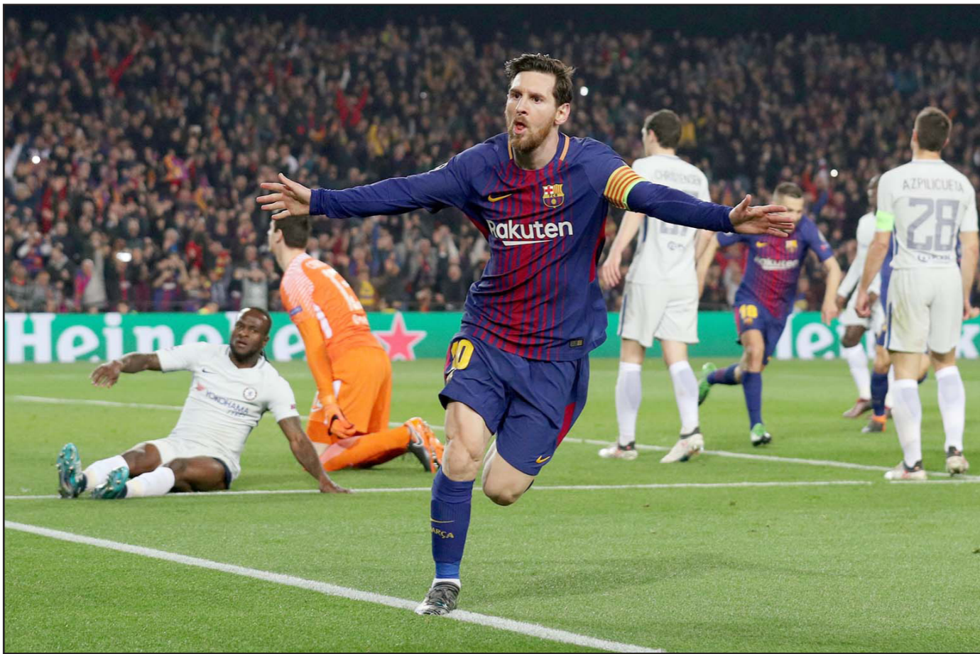
ميسي يحتفل بتسجيل الهدف الثالث لبرشلونة في مرمى تشلسي

في الهجوم. لكن خطأ من سيسك فابريغاس في منتصف الملعب منح ميسي فرصة الانطلاق في هجمة مرتدة بعد 20 دقيقة وترك المهاجم الأرجنتيني دفاع تشلسي في أزمة، إذ هيا الكرة إلى ديمبيلي الذي سدده في المرمى.