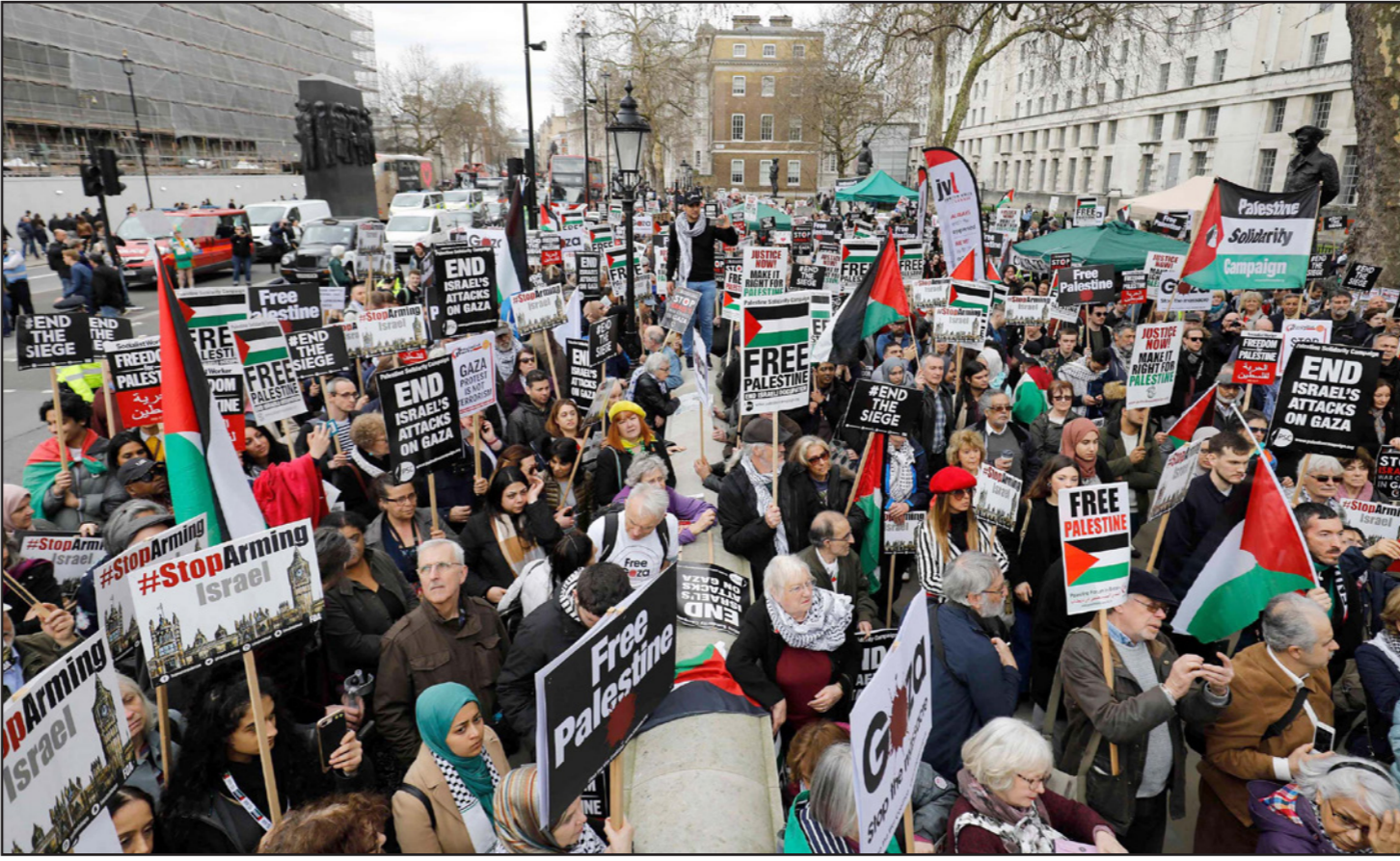
جانب من تظاهرة في العاصمة البريطانية لندن تندد بعمليات الإعدام الميدانية التي تنفذها قوات الاحتلال الإسرائيلي في قطاع غزة

ووقعت تقارير إسرائيلية أن فلسطينياً وصل إلى تلك المنطقة، وحاول مهاجمة إسرائيليين بأداة حادة قبل استهدافه بالرصاص، فأصيب بجراح بالغة الخطورة. وواصلت قوات الاحتلال حملات المداومة والتفتيش التي طالت مناطق متفرقة في الضفة الغربية، انتهت باعتقال