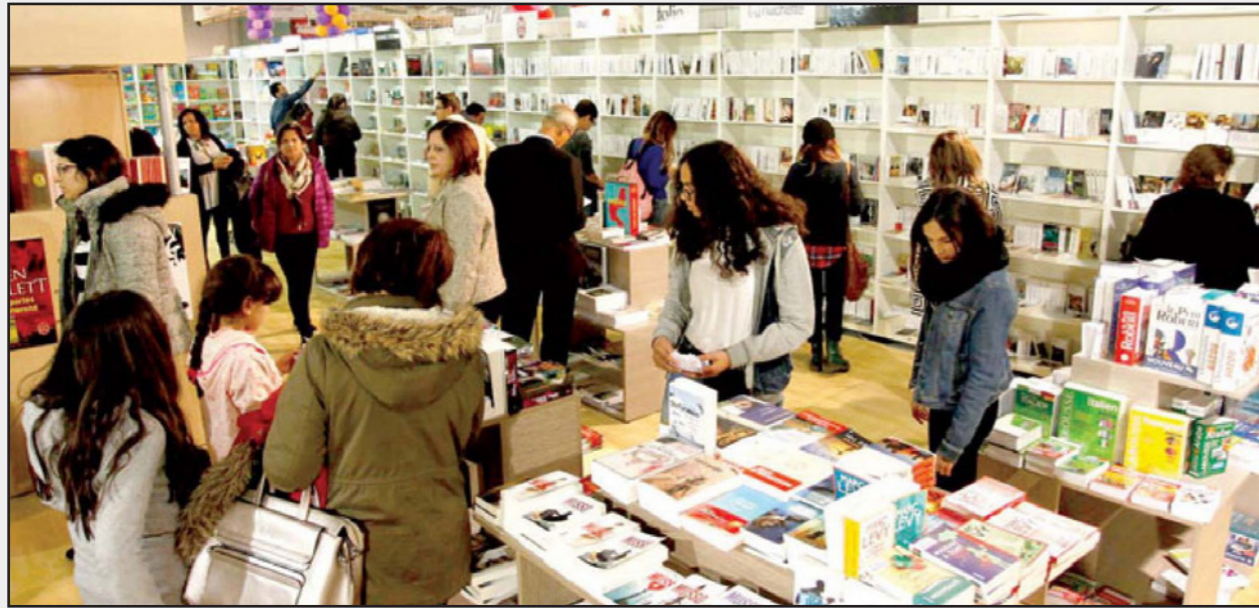
معرض الكتاب في تونس