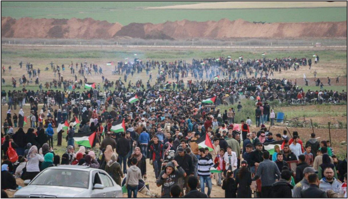
جانب من حشود مسيرة العودة الجمعة الماضية

ليس أجوف أقل منه. في الوقت الذي أمام كل هذه المنجحة بصعوبة يكون تثاروب فقط. في هذه المرة لا توجد صواريخ قسام، ولا توجد سكاكين وحتى لا توجد مقصات. ليس هناك إرهاب سوى «إرهاب الاطارات» وسيستثنون أي ضيقة. هذه الفاهيم الفظيعة من إنتاج «إسرائيل اليوم». في هذه المرة الاحتجاج غير عنيف، ورغم ذلك لا تراه إسرائيل. فهي لا ترى بياض عيون من قاموا به، لا تراهم كيشتر، ولا ترى باسهم، ولا ترى مرارة مصريهم. في الكارثة الطبيعية القادمة ذات يوم ستترسل إسرائيل بعنة مساعدا والجمع سيذويون من رحمتها اليهودية والإنسانية، ولكن لا أحد يستطيع أن ينكر الجلطة التي أغلقت شريان القلب، الجلطة التي تمنع تزويد الإنسانية والرحمة للقلب الذي أغلق بشكل نهائي.