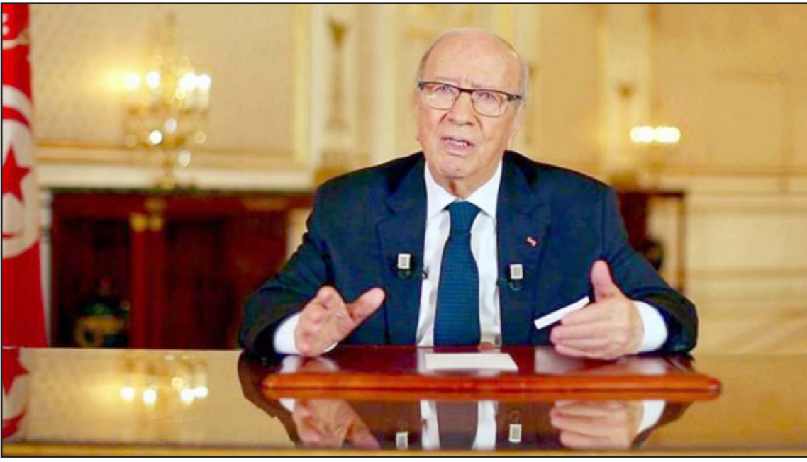
الرئيس التونسي الباجي قائد السبسي