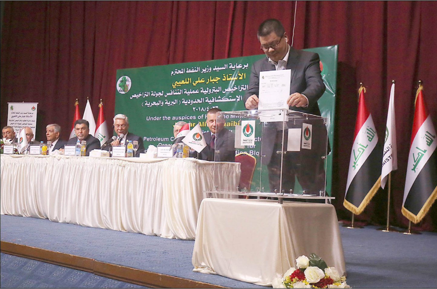
مسؤول في وزارة النفط العراقية يدخل رسالة عرض من شركة نفطية في صندوق زجاجي في بداية جولة ترسية عقود تطوير الحقول النفطية في بغداد أمس

بغداد - رويترز: فشل العراق أمس الخميس في اجتذاب استثمارات من شركات نفط كبرى في عطاء ترسية عقود لاستكشاف والتطوير للنفط والغاز، مع عدم تقديم أي عروض من شركات نفطية كبرى وتقديم «إيني» الإيطالية لعرض واحد فقط.