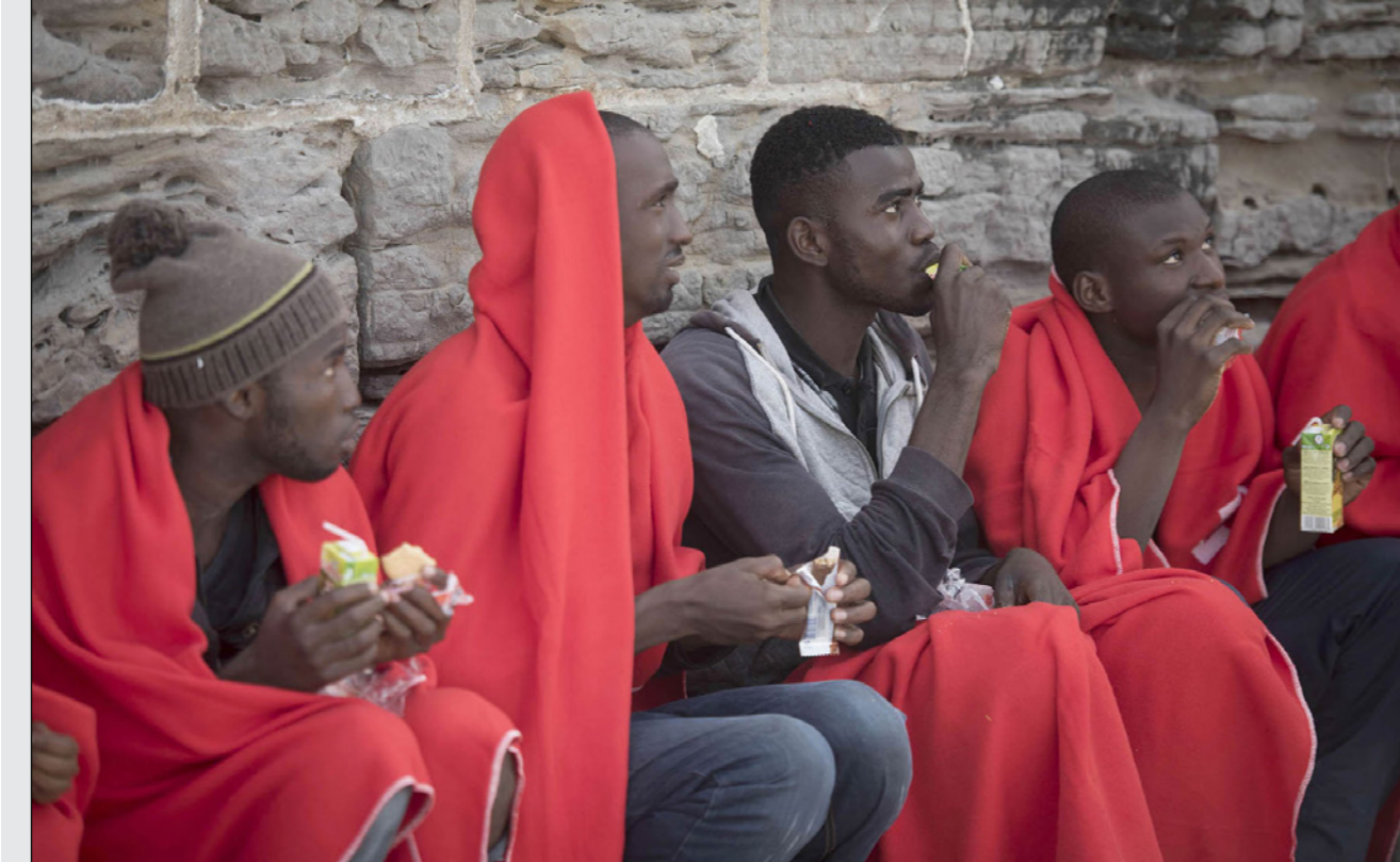
صورة أرشيفية لمهاجرين في سواحل إسبانيا

وبدأ المهاجرون الذين يتجنبون ليبيا الفارقة في القوس، على استخدام الطريق إلى إسبانيا الذي يمر بالمغرب. وذكرت المنظمة الدولية للهجرة أن أكثر من 22 ألفاً و400 شخص وصلوا إلى إسبانيا عبر البحر في 2017 ولقي 223 حتفهم. ومنذ بداية السنة، وصل حوالي 3800 مهاجر إلى إسبانيا عبر البحر، ولقي 181 على الأقل حتفهم أثناء العبور.