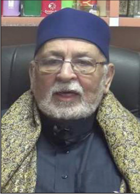
الشيخ علاء ابو الازايم