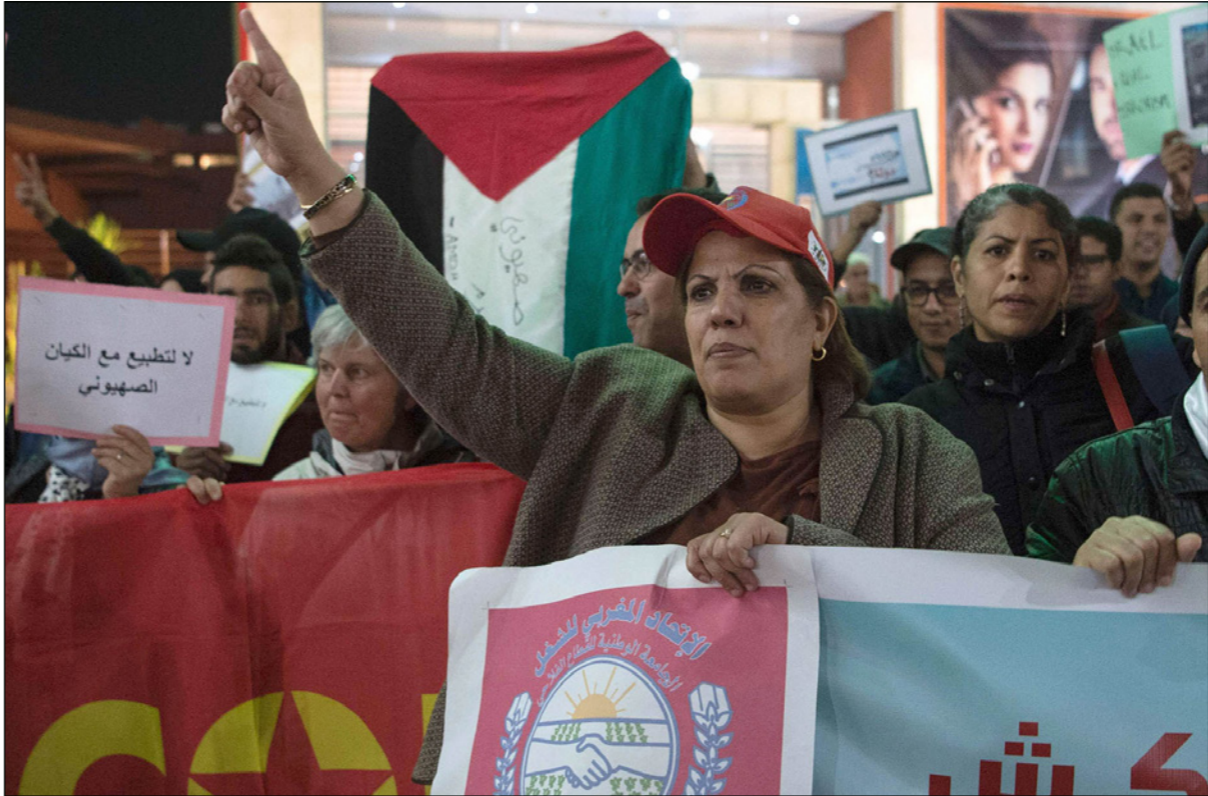
ناشطون مغاربة يتظاهرون مع فلسطين

قال ناشطون مغاربة في مجال مناهضة التطبيع مع الكيان الصهيوني أن التساهل إزاء مختلف مظاهر التطبيع وأصحابها، سبب رئيسي، ومشجع على المتماهي في ذلك إلى مستوى التجرؤ على القيام بخطوات واختراقات خطيرة من قبيل «التأطير الإيديولوجي الصهيوني، والتدريب على الأسلحة...»، التي من شأنها تهديد أمن الوطن، ووحدته الترابية، وتماسكه المجتمعي. وجاء موقف الناشطين بعد اجتماع على خلفية ملف المعهد «لغا الإسرائيلي»، لتكوين الحراس الخاصين، الذي ينشط في نواحي مدينة مكناس، عقد يوم الثلاثاء الماضي بالرباط شاركت فيه حركة التوحيد والإصلاح، الذراع الدعوي لحزب العدالة والتنمية المغربي (الحزب الرئيسي في الحكومة) وأعضاء من مكتبها التنفيذي من جهة، ومسؤولي مجموعة العمل الوطنية من أجل فلسطين، والمرصد المغربي لمناهضة التطبيع، وذلك في إطار سلسلة اللقاءات التي تعدها مجموعة العمل، والمرصد من قيادات الهيئات المدنية، والفعاليات العمومية، والحركات الإسلامية، والأحزاب السياسية، على اختلاف اتجاهاتها، والهيئات النقابية والحقوقية مسجلة خطوة هذا الملف، وما يشكله من تطور نوعي يشمل في الانتقال من التطبيع الصهيوني الذي يعرفه عدد من الحالات إلى تهديد أمن الوطن واستقراره. ودعا المشاركون في الاجتماع في بلاغ أرسل ل«القدس العربي» المؤسسات الدستورية الوطنية التي خول لها القانون السهر على أمن الوطن، والمواطنين إلى التحرك «الفوري» للوقوف على حقيقة ما يجري واختيار الرأي العام الوطني بذلك، وكذا الإسهام في توعية المواطنين