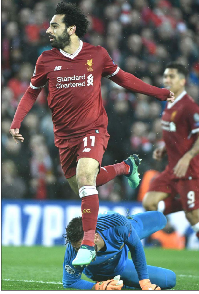
صلاح أصبح حديث العالم الكروي ويات يقارن بميسي ورونالدو

■ لندن - د ب أ: تأكد غياب لاعب وسط ليفربول اليكس أوكسليد تشامبرلين عن الفريق الأحمر حتى نهاية الموسم الحالي، كما سيفقد المنتخب الإنجليزي لخدماته في نهائيات كأس العالم.