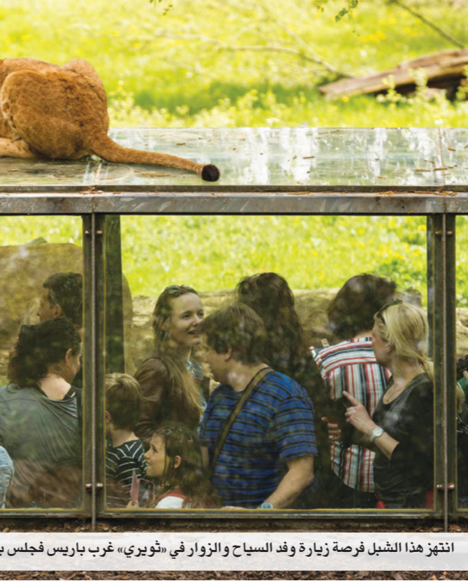
انتظر هذا الشبل فرصة زيارة وفد السياح والزوار في «ثوري» غرب باريس فجلس بارتياح فوق سقف المركز الذي يشاهدون من خلف زجاجه معالم هذه الحديقة وحيواناتها!