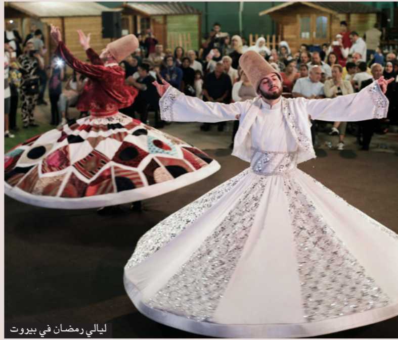
ليالي رمضان في بيروت

شوية يتذكرون ان هي مدينة شرق أو سطية شعبية، فهذا الحل الوحيد لحثي شعبها يرجعوا يعيشوها، وحتى هذا الحل الوحيد للاقتصاد». وفي طرابلس قال لبناني من أهل المدينة