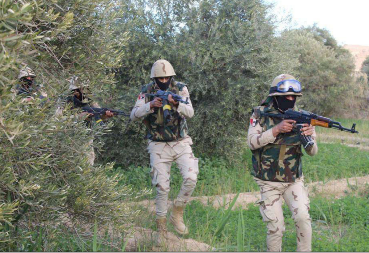
عناصر من الجيش المصري في سيناء

وأشار إلى «قيام القوات المسلحة بتوفير كافة السلع الأساسية والاحتياجات الإدارية والطبية للمواطنين في مناطق العمليات (...). وتأمين وصول الشاحنات المحملة بالمواد الغذائية للأهالي».