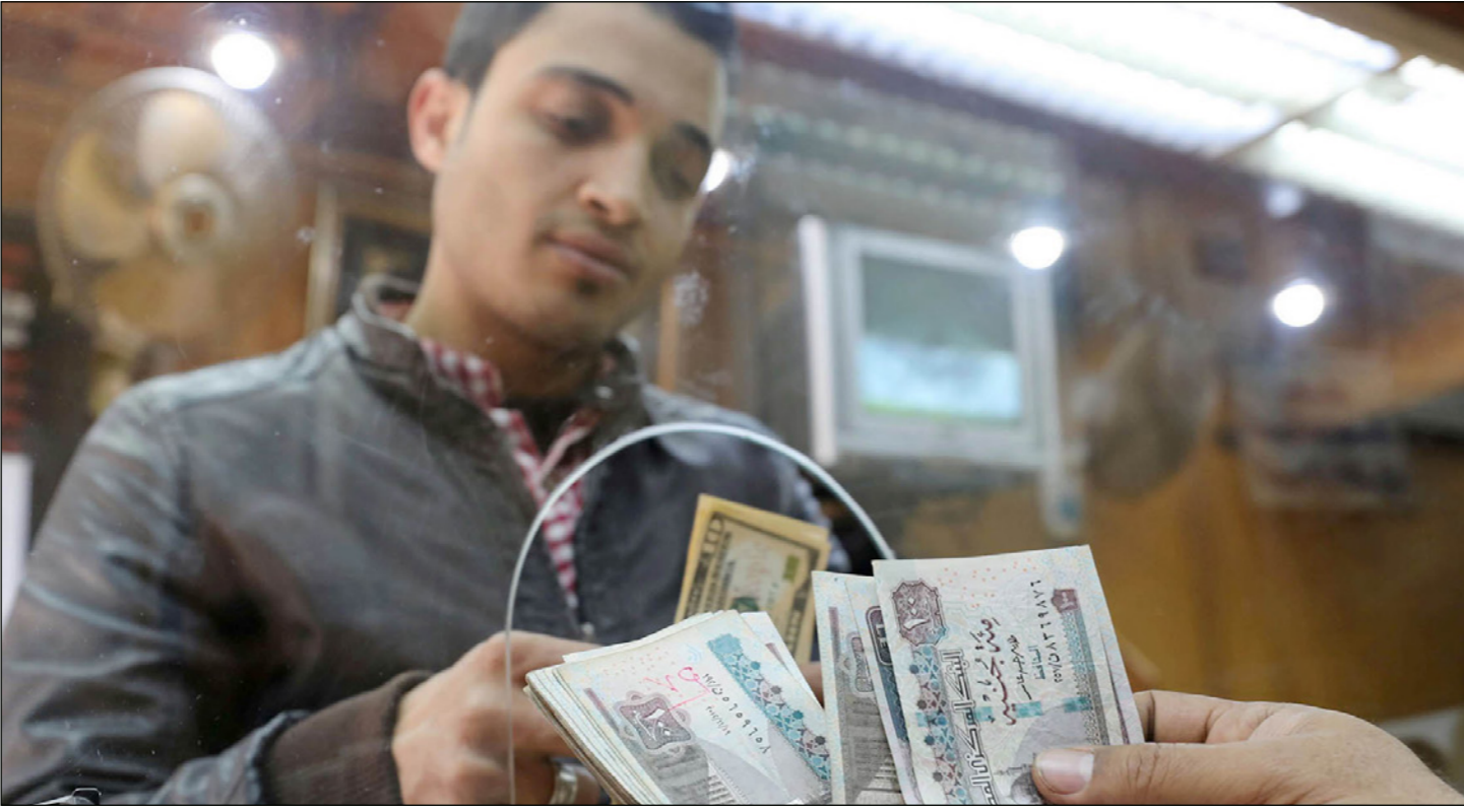
زبون في محل صرافة يبدل جنيته بـدولارات

قرض صندوق النقد الدولي» بعد إجراء المراجعة الثالثة لآداء الاقتصاد. وفي رأي شلبي فإن مصر تحتاج في فترة استلام قروض الصندوق أو طرح سندات دولية في الخارج إلى أن يكون الدولار مرتفعاً، وعلى العكس فيما يتعلق بمواعيد السداد. وأوضح أن ارتفاع الدولار حالياً ليس مؤشراً على نقص السيولة اللازمة في مصر، وإنما يعود إلى إقبال المستثمرين على الدولار عالمياً بالإضافة خروج مستثمرين أجانب من سوق الدين الحكومي. وتشير تقديرات رسمية إلى خروج نحو 5 مليارات دولار