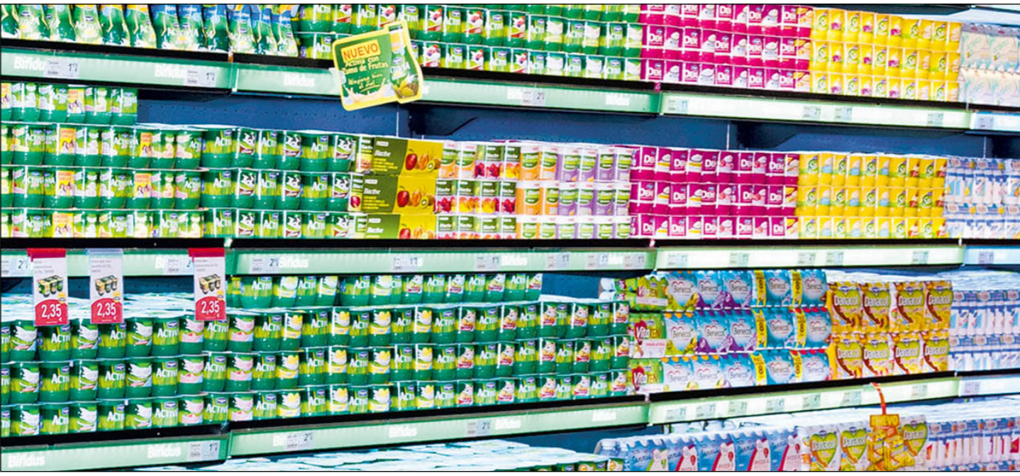
رؤف منتجات الألبان بعضها لـ«دانون» في سوبرماركت في الرباط

وفي الأسبوع الماضي قال مجلس الوزراء الإماراتي، الذي يرأسه الشيخ محمد بن راشد آل مكتوم، أنه سيسمح بالملكية الأجنبية الكاملة لبعض الشركات التي مقرها الإمارات، ارتفاعاً من الحد الأقصى الحالي البالغ 49 في المئة، ومنح تأشيرات إقامة طويلة الأمد بما يصل إلى عشر سنوات للمستثمرين الأجانب وبعض المتخصصين. واطلق هذا ارتفاعاً قصير الأمد في سوق دبي للأسهم،