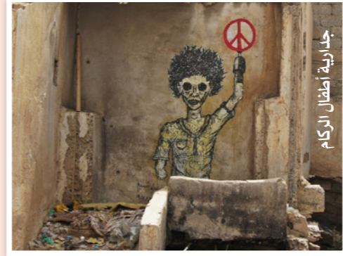
جدارية أطفال الركام