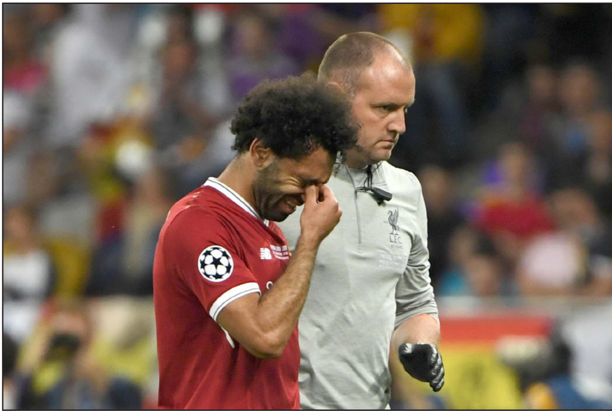
طبيب ليفربول يوزن برفاق التمام صلاح إلى غرفة الملابس وبعدها إلى المستشفى

برلين - د ب أ: كشف روبن بونز، أخصائي العلاج الطبيعي بِنادي ليفربول، تفاصيل الدقائق الـ60 التالية على إصابة النجم المصري محمد صلاح في نهائي دوري أبطال أوروبا بين ريال مدريد ليفربول السبت الماضي.