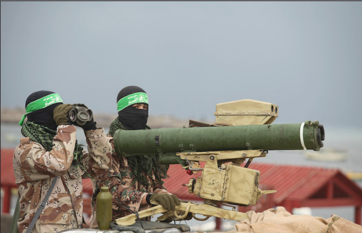
مقاتلان من حماس في غزة

يتوقع أن يتجدد في اللحظة التي ستصل فيها أعمال الجيش الإسرائيلي لإعادة إصلاح الجدار الحدودي إلى المقاطع المختلف عليها في رأس الناقورة وقرب مسغاف عام، نتجها هو عاد وهدد أمس بالعمل ضد جهود انتاج السلاح في لبنان، وفي الضفة يتوقع أن يظهر مرة أخرى التوتر حول مبادرة ترامب أو زيادة خطورة الوضع الصحي لرئيس السلطة الفلسطينية محمود عباس، وفي القطاع مطلوب تسهيل حقيقي في الوضع الاقتصادي والاجتماعي من أجل استقرار الوضع على طول الحدود مع إسرائيل.