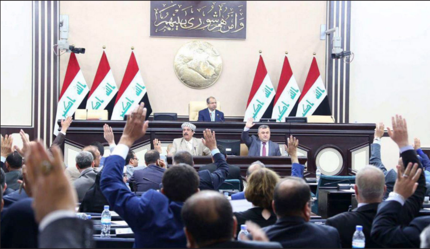
أعضاء في البرلمان العراقي يصوتون لإلغاء الانتخابات في الخارج

فيما أشار إلى تحفظه على نصاب الجلسة، وقال، في بيان: «في الوقت الذي نعلن فيه تأييدنا المطلق لأي قرار يصدر من جهة تشريعية أو قضائية أو تنفيذية يهدف إلى معالجة الخروقات والشبهات التي تشابت العملية الانتخابية الأخيرة، وضرورة النظر في جميع الطعون والشكوك التي يطرحها الأشخاص أو الكتل أو المنظمات فإننا نحث هذه الجهات بأخذ الطرق الدستورية والقانونية». وأضاف: «ليس ممن المعقول أن يتعرض على شبهة وشبهية، واليوم (امس الأول)، لم يكن النصاب مكتمل ولم يتعدى الحضور الـ 140 نائبا، وهذا منافي للنظام الداخلي والقواعد العامة في اتخاذ القرارات وأن لا نترك مجال الطعن والتشكيك في تلك القرارات».