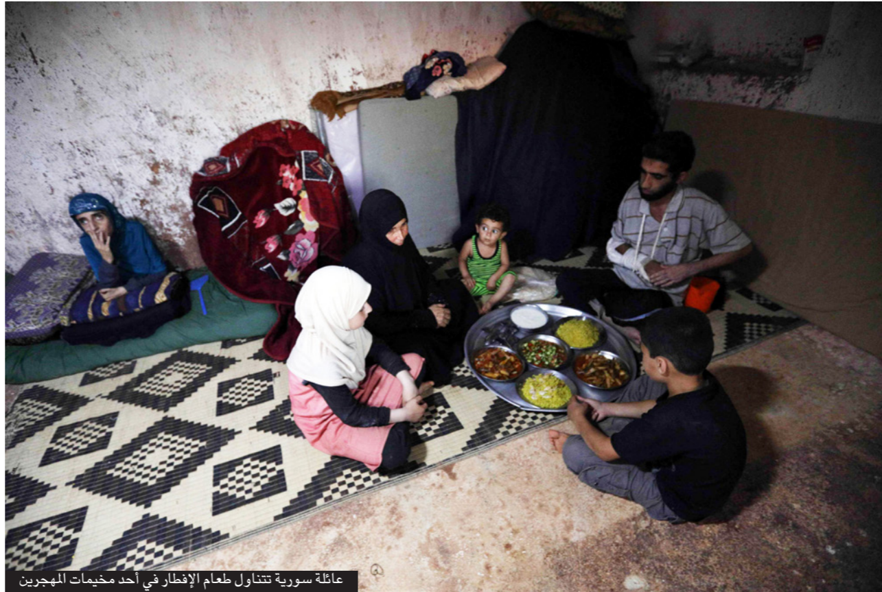
عائلة سورية تتناول طعام الإفطار في أحد مخيمات المهجرين