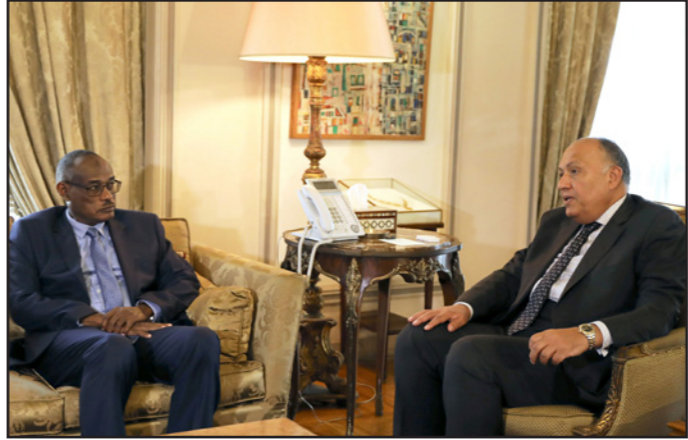
وزير الخارجية المصري خلال لقائه نظيره السوداني في القاهرة أمس