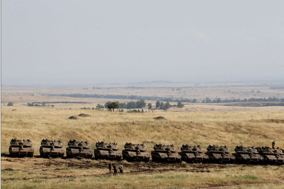
تعزيزات إسرائيلية على الحدود في منطقة الجولان المحتل

العسكرية كافة قبل نهاية العام الحالي لئلا تتنقل لهندسة الحل السياسي وفق رؤيتها وهنا الكلام عن المناطق المتفق عليها في استانة فقط. اما عودة سيطرة النظام على المناطق المنسحبة منها الميليشيات الحليفة، فلا توجد خيارات أخرى لدى الروس سوى عودة جيش الاسد واقناع الأمريكان والإسرائيليين بذلك على ان تكون هذه القوات مشغولة اي قوات حفظ نظام أقصى ما يمتلك عناصرها بنداقت تسهم في ارباب المواطن السوري.