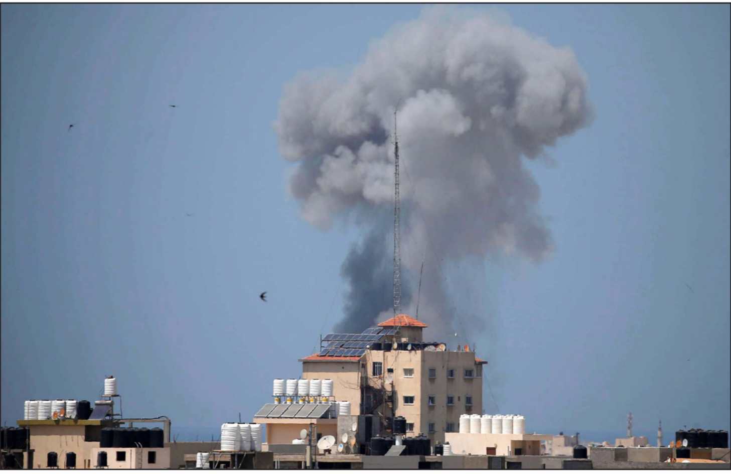
الدخان يتصاعد من أحد البنايات جراء القصف الإسرائيلي على غزة

الصنع أطلقت من القطاع، تجاه عدة بلدات إسرائيلية قريبة من الحدود، سكان قطاع غزة في ساعة مبكرة من صباح أمس. وكانت إسرائيل هاجمت بعد لحظات من عملية إطلاق الصواريخ عدة مواقع ونقاط رصد للمقاومة قريبة من مناطق الحدود الشرقية بقذائف المدفعية. وتعود أسباب هذه الموجة من التوتر إلى اليومين الماضيين، حيث قصفت المدفعية الإسرائيلية نقاط رصد للمقاومة يومي الأحد والإثنين، تعود لنشطاء حركتي حماس والجهاد، ما أدى إلى استشهاد أربعة نشطاء وإصابة خامس بجراح، حيث كان من بين الشهداء ثلاثة يتبعون حركة الجهاد سقطوا في القصف الأول، فيما استشهد ناشط من حماس في القصف الثاني. يشنر إلى أن إسرائيل أعلنت ليل الإثنين عن تعرض بلدة سديروت، الواقعة قرب الحدود الشمالية لقطاع غزة، لعملية إطلاق نار من سلاح ثقيل، أدى للتسبب بأضرار مادية في مباني البلدة.