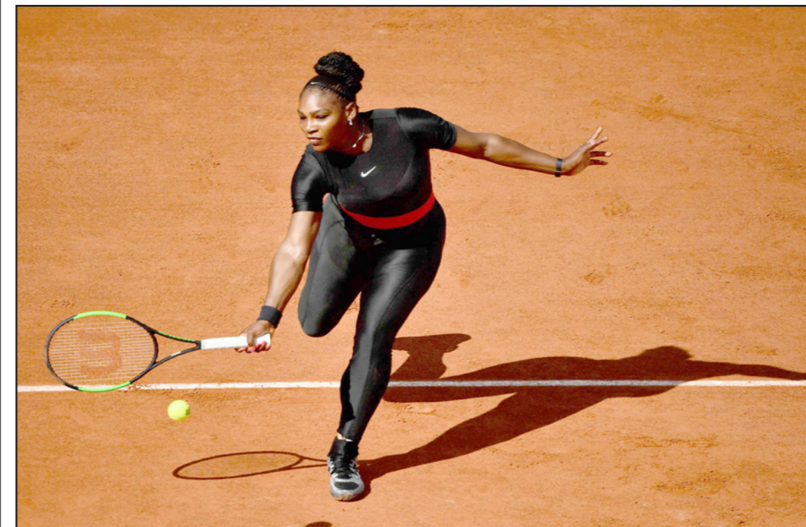
سيرينا عادت إلى ملاعب الفرانك سلام بسفرة سوداء وعرض جيد

هدات الأجواء العاصفة في باريس لاستقبال الأم الجديدة سيرينا وليامز التي عادت إلى منافسات البطولات الأربع الكبرى بشكل رائع أس بالعودة للدور الثاني في فرنسا المفتوحة للتنس. وقدمت كريستينا بليسكوفا، التي توجت مع سيرينا بلقب ويمبلدون في 2010 عندما فازت اللاعب التشيكية بلقب الناشئات بينما فازت اللاعب الأمريكية بفردي السيدات، عرضاً جيداً لكن كانت هناك نجمة واحدة فقط، وخطفت سيرينا، التي ارتدت سترة رياضية سوداء ضيقة غطت جسمها بالكامل، وأثار جماهير رولان غاروس من البداية لتنهى المباراة لصالحها 6-7 و4-6. وكانت آخر مرة ظهرت فيها سيرينا في بطولة من الأربع الكبرى في استراليا المفتوحة 2017 عندما فازت بلقب بينما كانت حامل في ألبانها اليكسيس أولبيا، لكنها بدت نشيطة جداً اليوم بعد أن أنجبت طفلتها في سبتمبر/أيلول الماضي لتقسو على منافستها المصنفة 70 عالمياً. وخضت غاروسين موعوروزا بداية صعبة في فرنسا المفتوحة ونجحت في التغلب على سبيلانا كوزنتسوا 6-7 و6-2 في مباراة عطلها الأمطار، بين بطلتين سابقتين، لتبلغ الدور الثاني من البطولة، وخسرت موعوروزا، المصنفة الثالثة