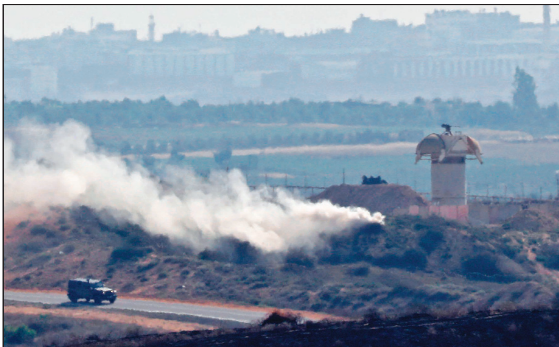
عربة إسرائيلية قرب الحدود مع غزة فيما دخان يتصاعد قرب موقع عسكري

ورغم مسؤولية إسرائيل عن تصاعد التوتر على الحدود مع غزة، وعن جولة ترانسق النار الجديدة، فقد هدد ساستها برود قاسية، ودعا بعضهم لاحتلال القطاع، ودعا آخرون لاغتيال قادة المقاومة، فيما علت أصوات إسرائيلية لشكوى من فقدان الشعور بالأمن ومطالبه الحكومة بإيجاد «حلول جذرية»، وهدد رئيس حكومة الاحتلال، بنيامين نتنياهو، أمس، بإصاف لقطاع غزة، بدعوى الرد على إطلاق قذائف هاون باتجاه المستوطنات المحيطة بقطاع غزة، وقال إن إسرائيل تنظر بخضرة إلى إطلاق النار باتجاه المستوطنات المحيطة بقطاع غزة، وهدد بأن «الجيش سوف يرد بقوة كبيرة على هذه الهجمات».