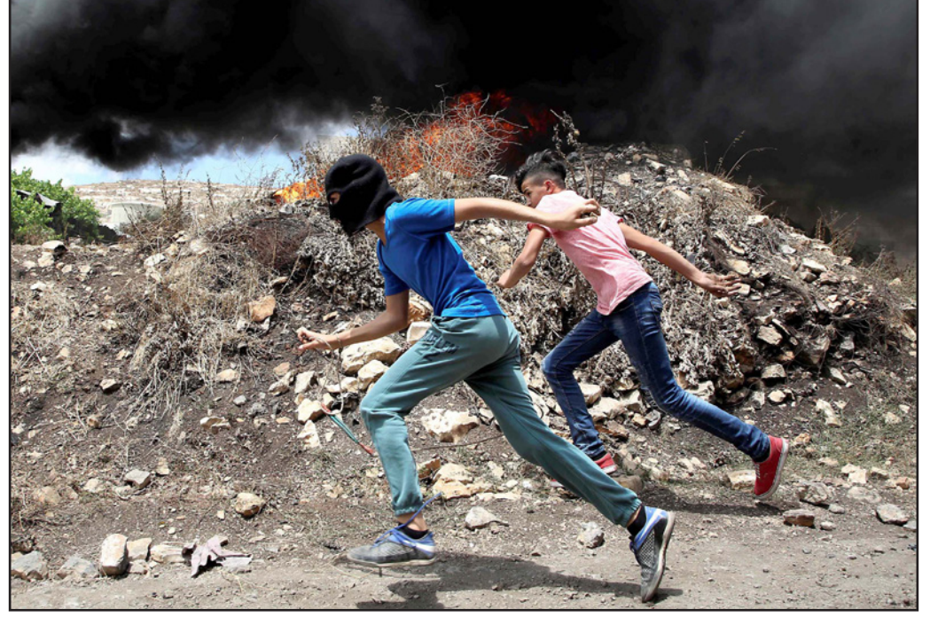
صور من المواجهات مع جنود الاحتلال في الضفة الغربية