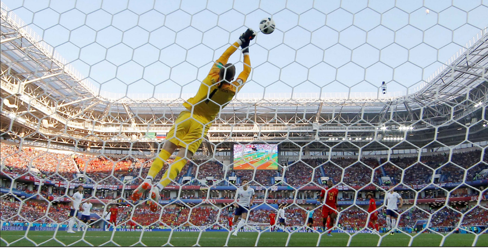
حارس انكلترا بيكفورد يتقدم مرامه من هدف محقق امام بلجيكا