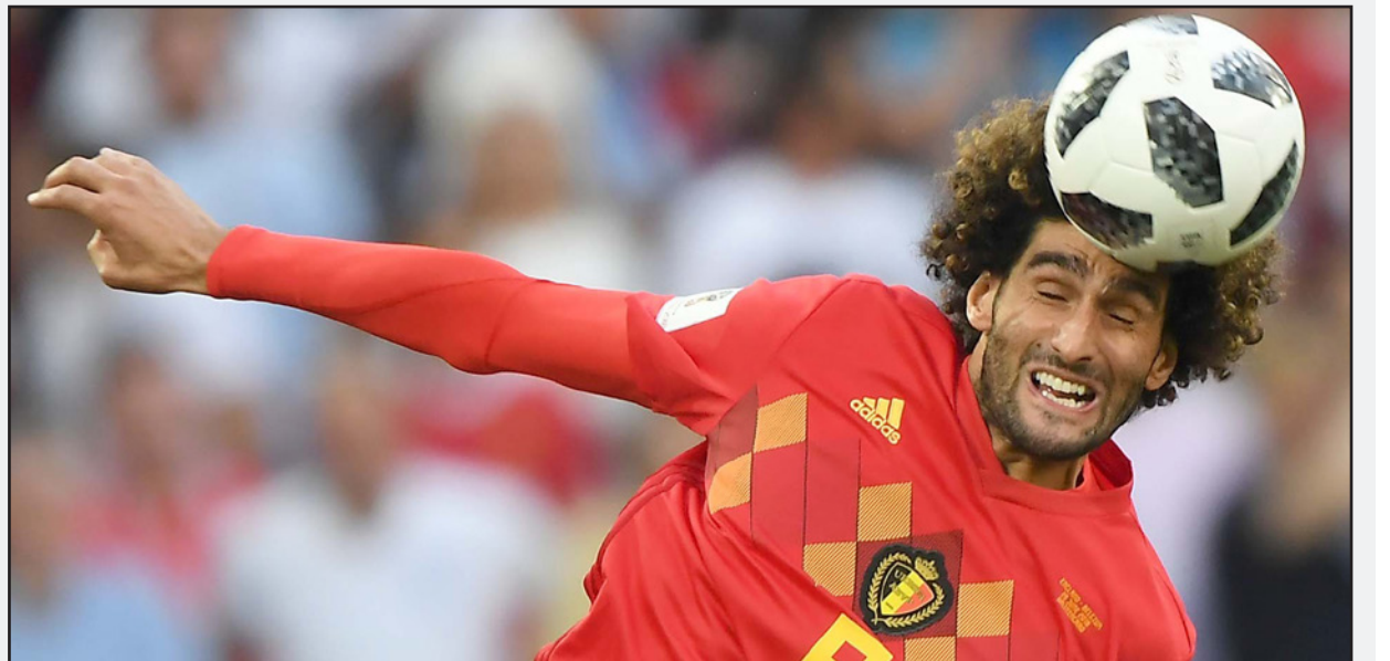
فيلايني مدد عقده مع مانشستر يونايتد لعامين

لندن - رويترز: سيبدأ أوجر فيدر المدافع عن اللقب سعيه لاجراء لقبه التاسع في بطولة ويمبلدون للتنس بمواجهة الصربي دوسان لايفيتش المصنف 57 عالميا في الدور الأول. ووقع اللاعب السويسري البالغ من العمر 36 عاما، المصنف الأول في البطولة، في الجانب نفسه من القرعة مع الكرواتي المتألق مارين شيليتش المصنف الثالث وصيف البطول العام الماضي.