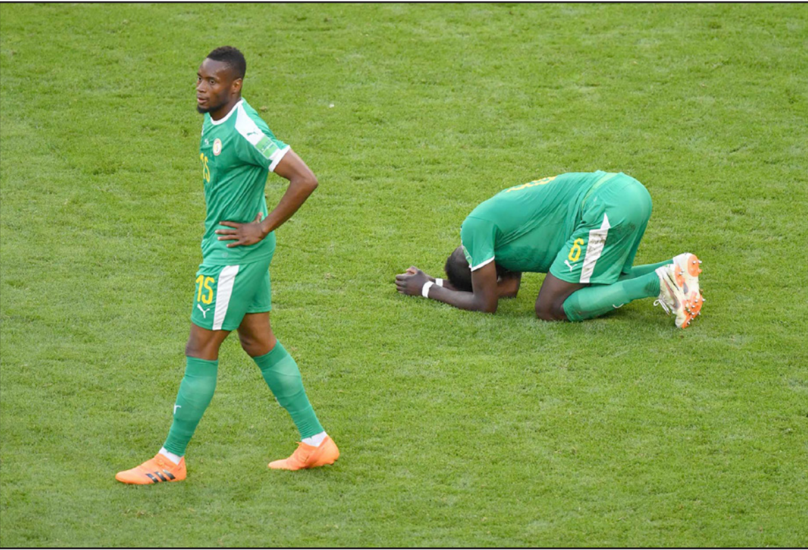
خيبة نجوم السنغال بعد الخروج لتفقد أفريقي أي مقعد في الدور الثاني

الجماهير: شهدت الاستادات المستضيفة لمباريات كأس العالم حضورا جماهيريا كبيرا، كما شهدت مختلف المدن المستضيفة، فعاليات احتفالية جماهيرية، ولفت مشجعو بعض المنتخبات، وعلى رأسهم اليابان والسنغال، الأنظار من خلال السلوك الحضاري، حيث تولوا تنظيف المدرجات التي تواجدوا بها، بمجرد سماع صافرة النهاية، كما أن البطولة الحالية لا تزال تمثل احتفالية كروية هائلة خالية من أي أحداث عنف كبيرة.