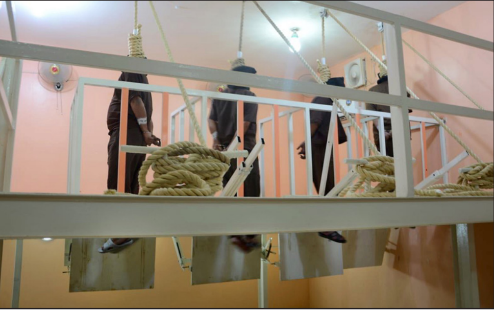
صور نشرتها وزارة العدل لعناصر من تنظيم «الدولة» في انتظار صدور حكم الإعدام (يمين) وبعد إعدامهم (يسار)