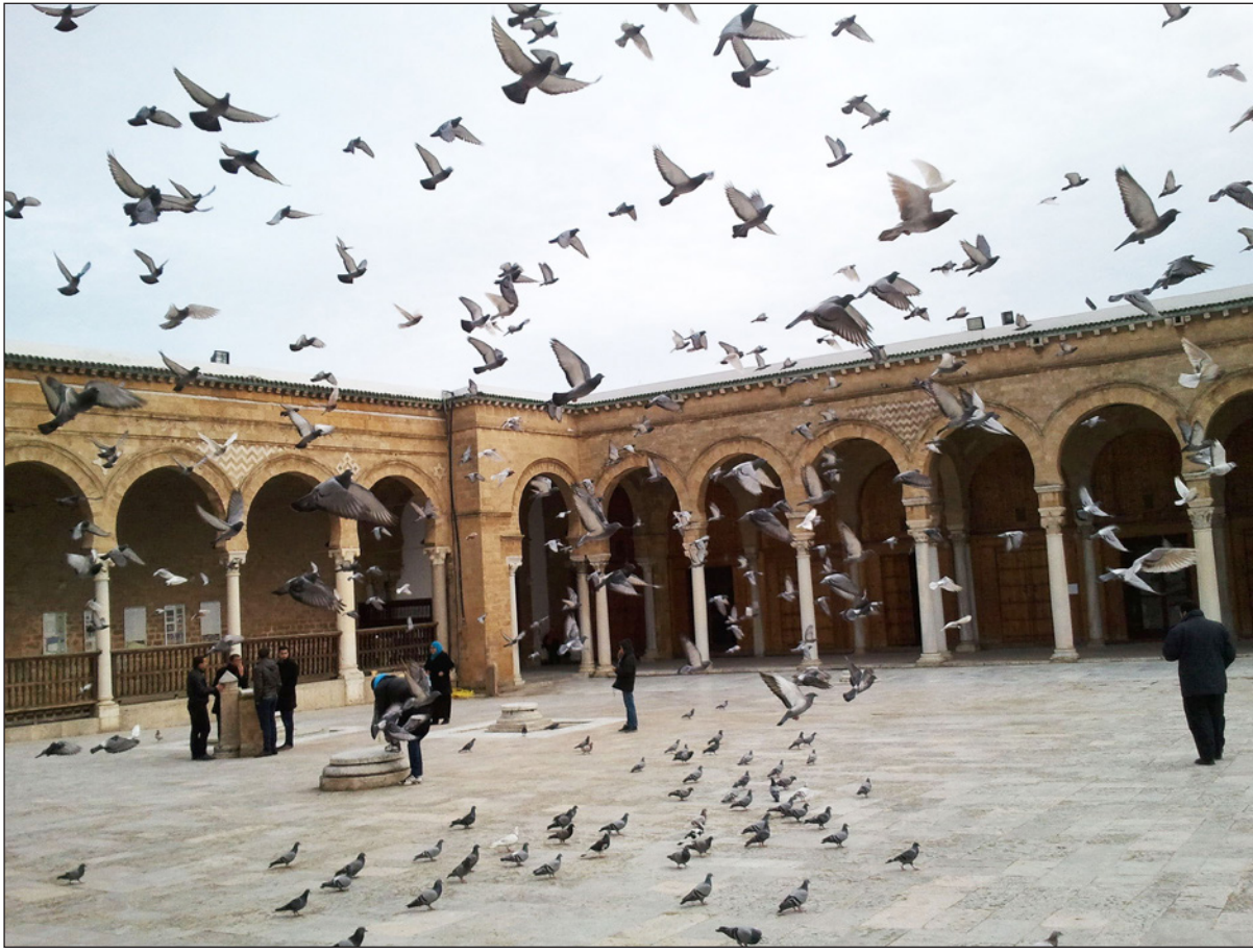
فناء جامع الزيتونة

وأضاف: «الاجتهاد الذي يتلادم مع حاجات الواقع وتطورات هو الحوار العرفي التراثي المنهجي المتكافئ بين أهل الضبط العلمي وسالكى درب المعرفة من الباحثين والمجتهدين في تحصيل العلوم ومنهج الاستقراء والتحليل والاستنباط من مختلف الاختصاصات والمدارس وليس