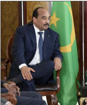
الرئيس محمد ولد عبد العزيز مستقبلاً نظيره الفرنسي إمانويل ماكرون

افتتاحيتها للتعليل على زيارة ماكرون مقلدة من شأنها عكس ما يقوم به الإعلام الحكومي الذي يعتبرها زيارة تاريخية. وأكدت «القدم» في مقالها الافتتاحي «أن ماكرون ليس قادماً إلى موريتانيا بصفة خاصة، فهو جاء إلى نواكشوط مارا بها في طريقه إلى نيجريا، وهذا ما يجعل الزيارة عادية وليست وراءها شبكات منظمة وتهدف وأضفت الصحفية «ماكرون سبق أن زار الجزائر والغرب والسنغال والنيجر والتشاد، وهذه أول زيارة لرئيس فرنسي إلى موريتانيا منذ 1997، فلم تحظ موريتانيا لا بزيارة ساركوزي الذي شرع للجنرال عزيز لقلابه العسكري عام 2008 ولا بزيارة فرانسوا أولاند، فما هي أهمية الزيارة إذن؟» وتساءلت الصحفية «بدلاً من انشغال ماكرون بأمور أخرى، الأيشغل بقياس ما يدعيه ولد عبد العزيز من نجاح أمني؟ فإذا كان سيويج ولد عبد العزيز على بطنه في الوفاء بالزاماته في نشر قوة الساحل العسكرية المشتركة، فمن واجبه كذلك أن يساعد الشعب الموريتاني في حل مشاكله الأمنية اليومية؟»