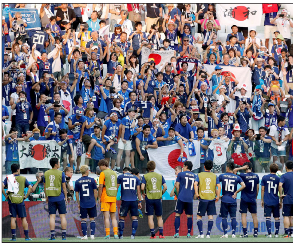
الجمهير اليابانية تحيي منتخبها عقب إنجاز التأهل في صورة أسعدت المنظمين

صفر/1 بعدما اطمأن للتلها بهذه النتيجة والتفوق على السنغال بقائمة اللعب النظيف، قال سميت: «الاحترام واللعب النظيف جزء من اللعبة»، وعن الانتقادات التي أثيرت بشأن المباراة بين المنتخبين الفرنسي والدنماركي يوم الثلاثاء الماضي، وتكررت بشأن مباراة اليابان مع بولندا بسبب اللعب السلبي بعد الاطمئنان للتأهل من خلال نتيجة معينة، قال سميت إنها «حالات منعزلة»، وقال إنه من الصعب إجراء قرعة دور الـ 16، بعد انتهاء فعاليات دور المجموعات من أجل منع الفرق من اللعب على نتائج معينة في الجولة الثالثة الأخيرة من مباريات المجموعة بهدف مواجهة منافس أكثر سهولة في الدور الثاني، وأوضح: «نعتقد أن كل فريق يرغب في الفوز»، موقفاً أن كرة القدم لعبة تنافسية للمشجعين الذين يدفعون ثمن التذاكر لمشاهدتها، أعتقد أننا رأينا هذا»، وأكد سميت أن الاستادات كانت ممتلئة بنسبة حضور بلغت 98 في المئة خلال 48 مباراة أقيمت في دور المجموعات، وأن إجمالي عدد الحضور الجماهيري خلال هذه المباريات بلغ نحو 2.2 مليون مشجع وأن مناطق احتفالات المشجعين الرسمية المنتشرة في المدن 11 الضيقة للبطولة شهدت زيارة نحو خمسة ملايين مشجع حتى الآن، وأشار إلى أن 130 مليون مشجع على تواصل مع البطولة من خلال التطبيقات وأن وسائل التواصل الاجتماعي للبطولة شهدت متابعيه من 120 مليون مشجع، ووصف سميت البطولة بأنها حتى الآن «مهرجان لكرة القدم»، مشيراً إلى أن مباراة واحدة فقط انتهت بالتعادل السلبي فيما شهدت 47 مباراة هز الشباك وأن 27 هدفاً من 122 هدفاً التي سجلت في البطولة حتى الآن جاءت في آخر عشر دقائق من المباراة وذلك بنسبة تبلغ 22 بالمئة من إجمالي عدد الأهداف حتى الآن.