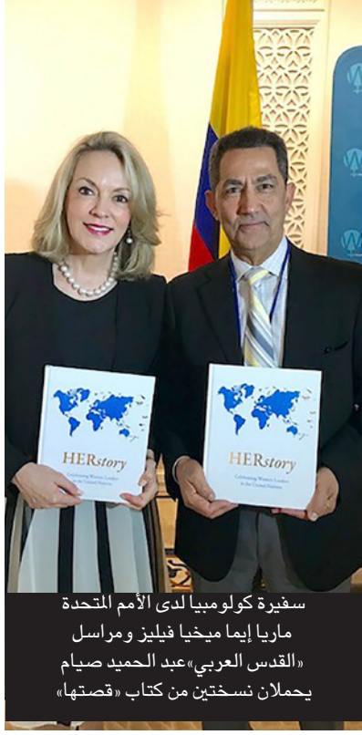
سفيرة كولومبيا لدى الأمم المتحدة ماريا إيميا فيليز وفيليز وفيليز «القدس العربي» عبد الحميد صيام يحملان نسختين من كتاب «قصتها».

دباجة ميثاق الأمم المتحدة والفصل الثامن من الميثاق والذي أشار بوضوح إلى مسألة المساواة بين النساء والرجال. هذا جهد كبير ولكن لن يتوقف هنا. وحول ما حققته المرأة بعد كل هذه السنوات من تقدم مناصب رفيعة في المنظومة الدولية قالت السفيرة الكولمبية «إنها سعيدة بالإنجازات التي حققتها المرأة. لقد انضمت 150 دولة للجنة الاستشارية حول المساواة بين الجنسين في المنظمة الدولية والتي اقترحتها كولومبيا. وتسعى اللجنة لتمكين المرأة وتقديم اقتراحات للأمين العام حول تعيين المزيد من النساء في المنظمة الدولية. وأنا أفر بان الأمين العام غوتيريش إنسان متفهم جدا لمسألة المساواة وهو نصير فعلي للمرأة وقد حقق المساواة بين الجنسين في المناصب الرفيعة في إدارته ووعد بالمزيد. ونحن سعداء بهذه الإنجازات».