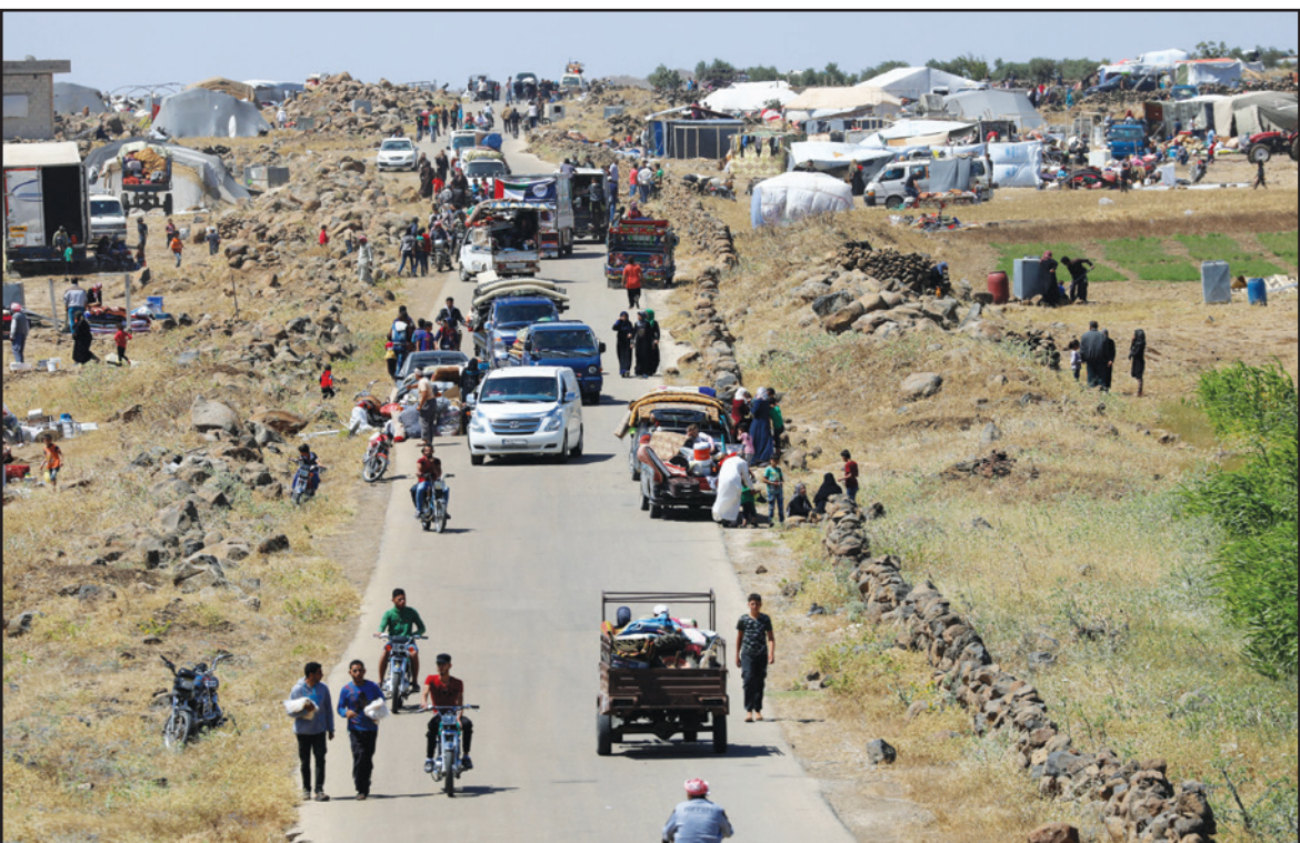
ناحون من درعا يصلون إلى القنطرة على حدود الجولان السوري الذي تحتله إسرائيل