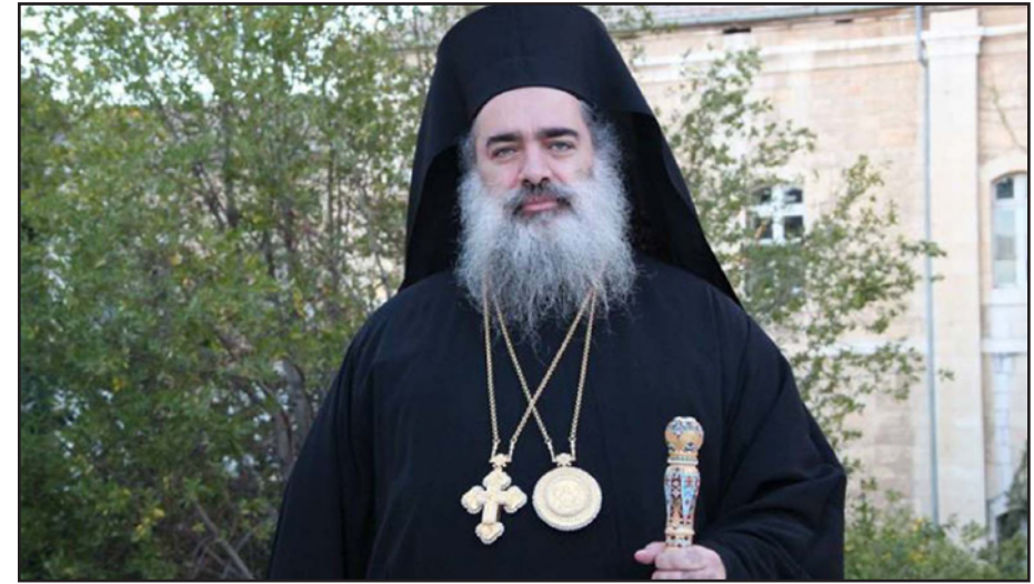
المطران عطا الله حنا

خلال استقباله وفدا آخر من فلسطيني الداخل إلى أن المؤتمرات التي تعقد من أجل القدس كثيرة وينفق عليها الملايين، «كان من الأفضل أن ترسل استشفيات المدينة ومدارسها ومؤسساتها دعما لمحمود شعبنا»، وتابع «لا ننكر أهمية عقد المؤتمرات التي تدافع عن القدس ولا نقلل من أهمية أي بيان أو كلمة تقال بحق القدس، ولكن الوضع الذي وصلت إليه المدينة المقدسة اليوم يحتاج إلى ما هو أكثر من ذلك».