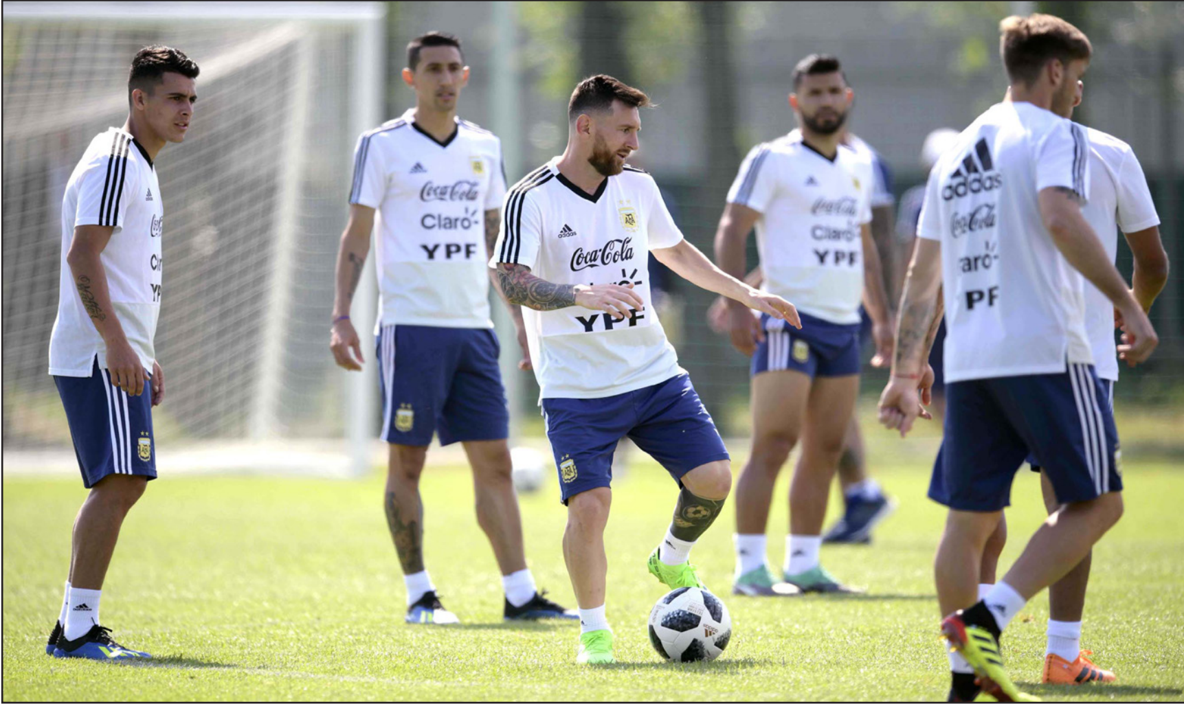
ميسي يتوسط زملاءه في التدريبات الأخيرة للمنتخب الأرجنتيني

ويتطلع إلى تقديم عروض أفضل لحو ذكرياته السنية في مشاركته السابقتين بالmondial، عندما طرد في نسختي 2010 و2014، لكن مهمة رونالدو وسواريز لن تكون سهلة، حيث سيكون البرتغالي مطالباً بالتغلب على رقابة دييغو غودين، في حين سيكون سواريز في مواجهة الصخرة الدفاعية بيببي.