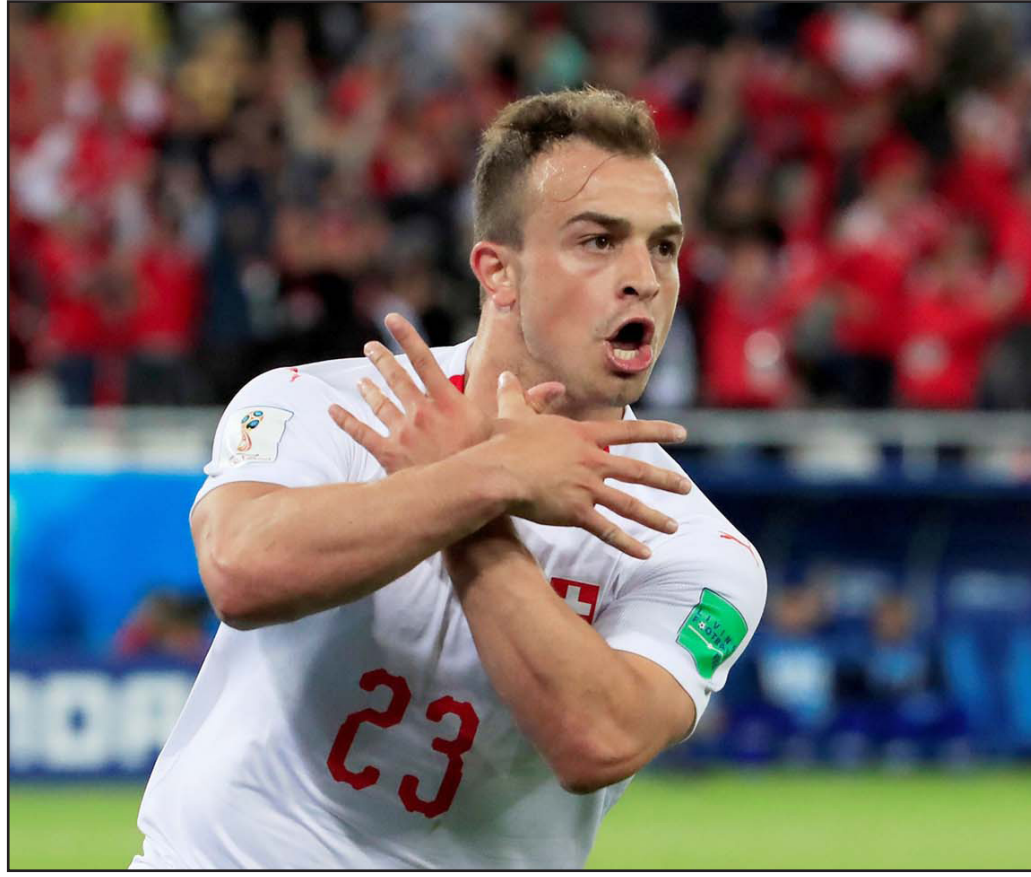
النجم السويسري شاكيري قام بحركة اعتبرت من النقاط المظلمة في البطولة

المنتخبات العربية: خرجت جميع المنتخبات العربية الأربعة التي تأهلت إلى النهائيات، حيث ودعت تونس