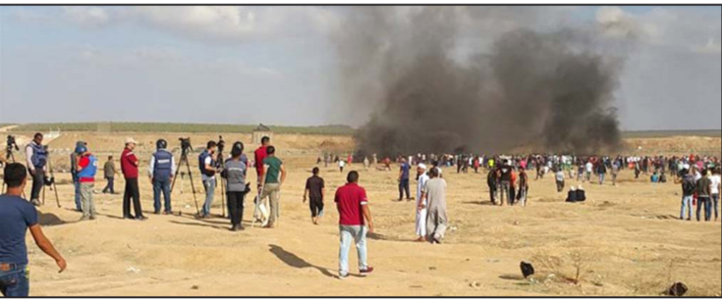
صور من التحضيرات لجمعة «من غزة إلى الضفة» وحده دم ومصير مشترك، على حدود غزة الشرقية

من غزة، سقط على بعد 40 كيلومترا من القطاع داخل إسرائيل، وهي مسافة لم تسجل من قبل في المسافة التي يقطعها البالون الحارق، الذي اعتيد على السقوط في مناطق «غلاف غزة».