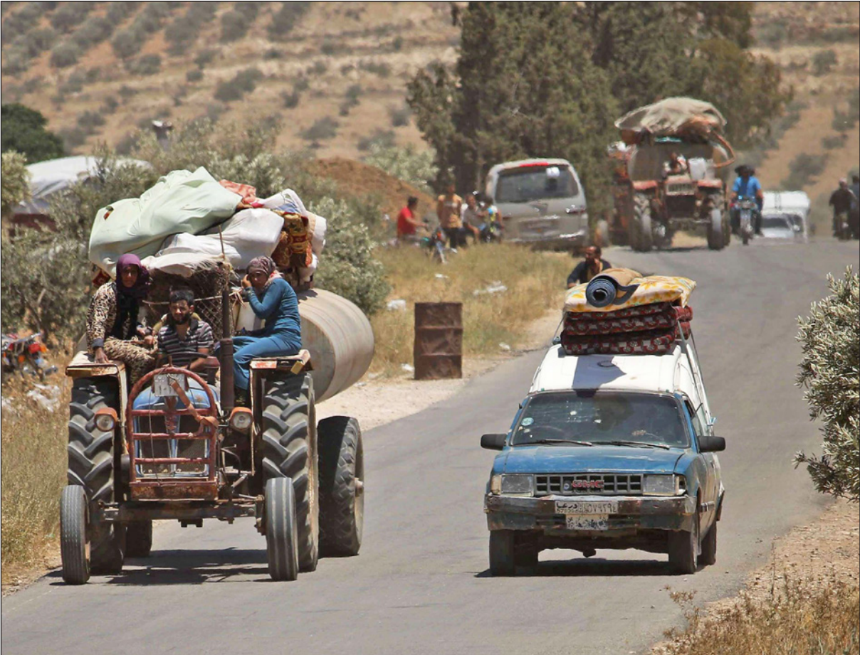
نازحو درعا في طريقهم إلى الحدود الأردنية الملقة

بالحرب والعلاقات العشائرية والاجتماعية متشابكة وتاريخية وكل القيادات الأساسية في شمال الأردن تضغط على الدولة والحكومة في عمان لفتح الحدود على القل للجرحي والنساء والأطفال. التعقيد في هذا الجانب وصل إلى مستويات غير مسبوقة خصوصا أن الحديث عن أهالي وعشائر منقلبة نفوذ أردني تاريخي وبالتالي المجازفة بصمود سياسة إغلاق الحدود تعني في النتيجة في حال استمرار الأزمة ووقوع ضحايا إنتاج مشكلة كبيرة تهدد النفوذ الأردني القديم في وسط أهالي غرب درعا وبادية الشمال حصريا حيث علاقات قديمة وصلات قري وساحة مناورة للأمن الأردني طوال عقود وهي نقاط يعرفها تماما النظام السوري. لذلك تبدو خيارات الأردن معقدة خصوصا وان جهات متعددة في الشارع الداخلي بدأت تضغط لفتح الحدود عبر حملتين على وسائل التواصل الأولى باسم «افتحوا الحدود» والثانية باسم «بنقسم الخبزة بالنص».