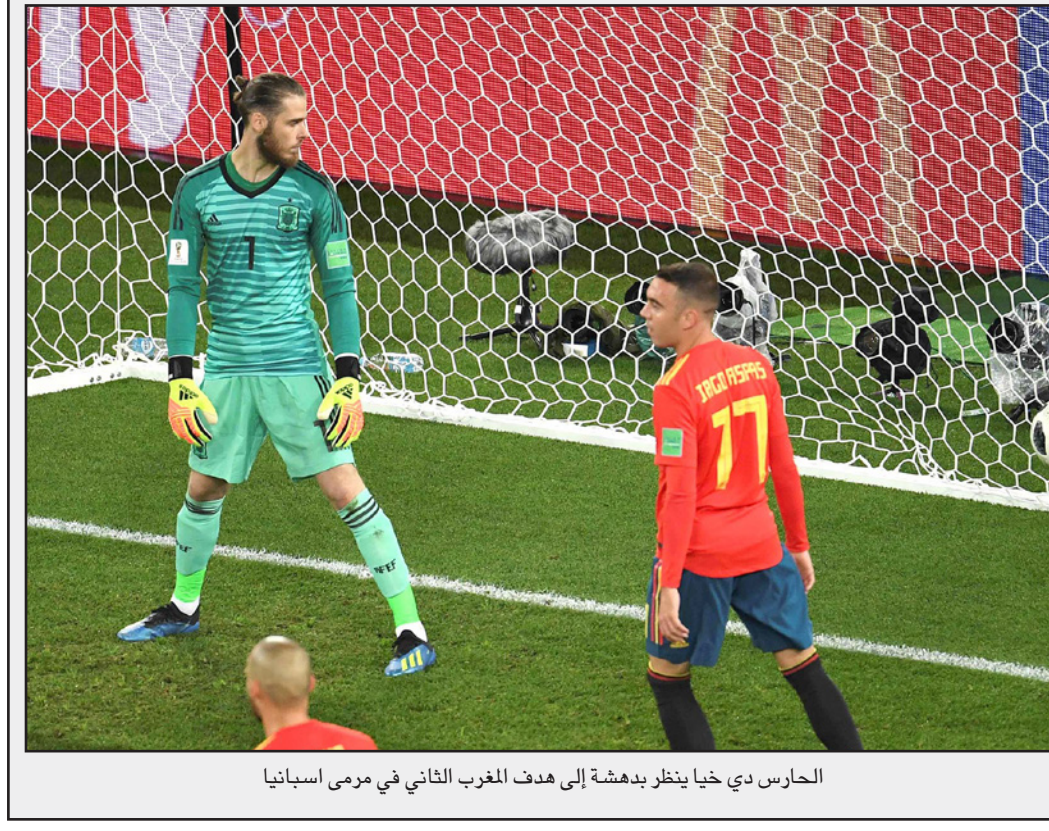
الحارس دي خيا ينظر بهدوء إلى هدف المغرب الثاني في مرمى اسبانيا

كأس سنغال. وقال سيبسيه: «إنه قانون كرة القدم... لم نتأهل لأننا حصلنا على بطاقات صفراء أكثر من اليابانيين ولكنني أقتدر بلاعبين فريقي». ثاني منتخب أفريقي يتجه في هذا بعد الكاميرون في مونديال 1990 وقبل أن يكرر المنتخب الغاني هذا الإنجاز في مونديال 2010. وانتهت مشاركة المنتخب السنغالي في مونديال 2002 بالهزيمة صفرًا/1 أمام نظيره التركي في الوقت الإضافي. ومع وجود سيبسيه مدربا هذه المرة، استهل المنتخب السنغالي مسيرته في المونديال الروسي بالفوز 1/2 على بولندا، ثم فرط مرتين في تقدمه على المنتخب الياباني وتعادل معه 2/2 قبل أن يخسر صفرًا/1 أمام كولومبيا بعدما عانى من الضغوط الشديدة حيث كان بحاجة إلى نقطة التعادل فقط. وقال سيبسيه: «إنه أمر