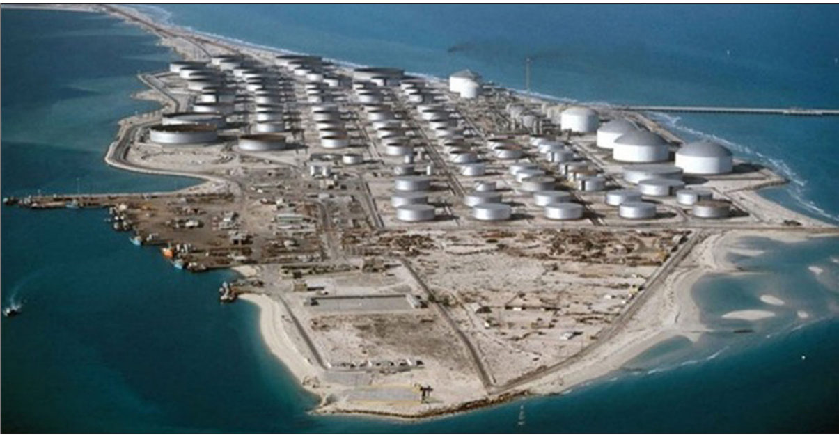
خزانات نفط في ميناء تنورة السعودي

من «أوبك» ستكون أعلى في يونيو على الرغم من انخفاض الصادرات الإيرانية وتعطل إمدادات ليبيا، وفقا للمنتج الأولية للمشح. وقال مصدر في القطاع يرصد إنتاج المملكة النفطية «الرقم السعودي ليونيو سيكون مرتفعا جدا... مرتفعا بشكل مفاجئ». والتحرك السعودي مؤشرا واضح على أن المملكة تريد كبح جماح أسعار النفط الذي بلغ 80 دولارا للبرميل هذا العام لأول مرة منذ 2014، مما دفع مستهلكين مثل الولايات المتحدة إلى الإعراب عن قلقهم والمطالبة بتعويض النقص في إنتاج النفط قويا، ويتوقع محللو القطاع أن يزيد مصادر إن زيادة الإمدادات السعودية أثارت غضب إيران وأن حجم الزيادة فاجأ أعضاء آخرين في المنظمة. وكان وزير الطاقة السعودي خالد الفالح قد قال يوم السبت الماضي ان المملكة ستزيد الإنتاج ودرول أخرى عطشى للطاقة مثل الهند.