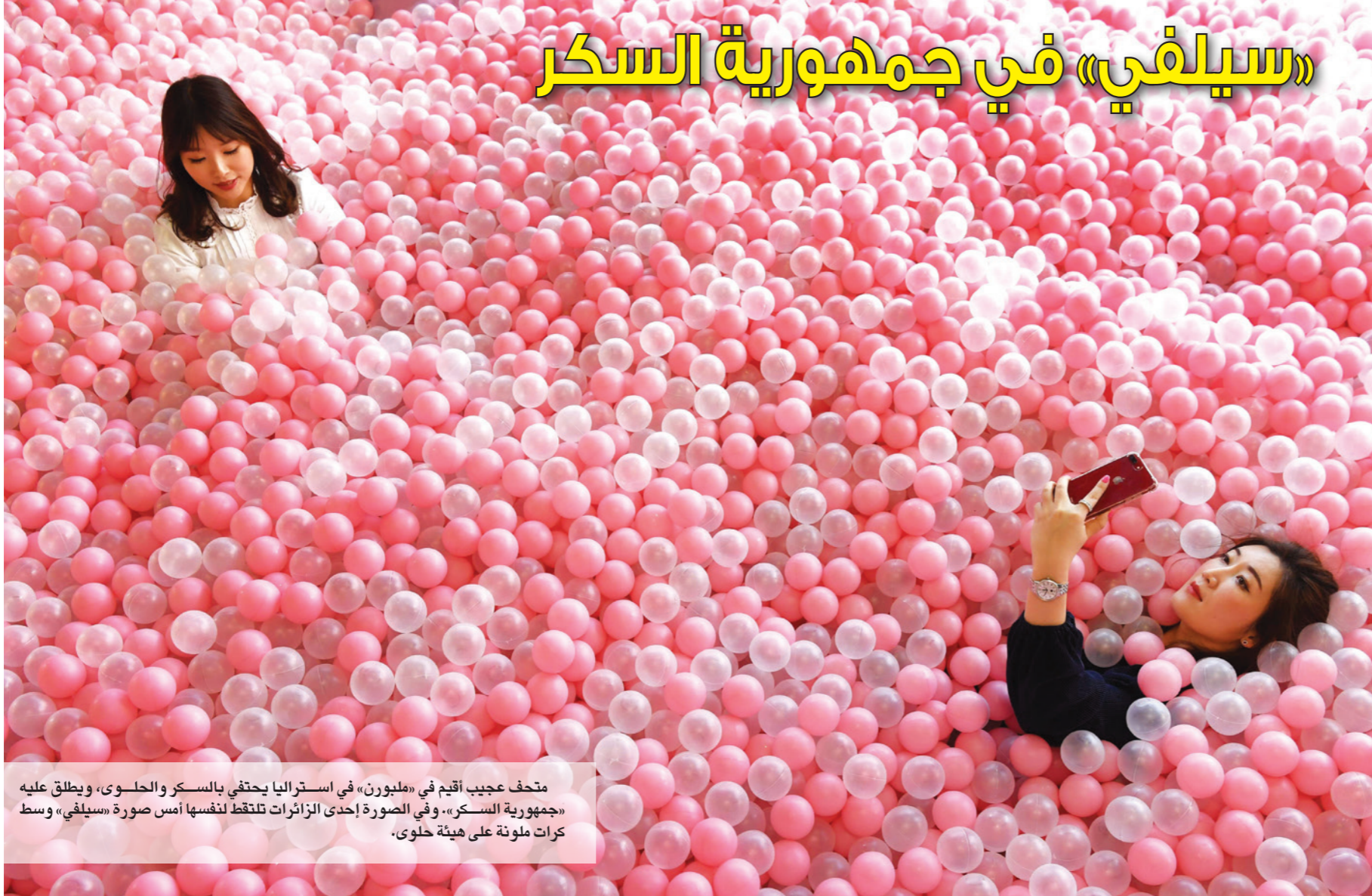
متحف عجيب أقيم في «مبلورن» في استراليا يحتفي بالسكر والحلوى، ويطلق عليه «جمهورية السكر». وفي الصورة إحدى الزائرات تلتقط لنفسها أمس صورة «سيلفي» وسط كرات ملونة على هيئة حلوى.

العالمية، وضمت القائمة ثلاثة فنانين عرب آخرين هم المصري تامر حسني والليبنانية إليسا والمغربي عبد الحفيظ الدوزي. ● أحييت المطربة الليبنانية نجوى كرم، حفلة تكريمية لثلاث رئيس مجلس النواب اللبناني إيلي فرزلي، في منطقة شتورة في البقاع. حضرتها شخصيات سياسية واجتماعية وفنية. ● حصل فريد العلي، المستشار الفني، رئيس مركز الكويت للفنون الإسلامية في المسجد الكبير في وزارة الأوقاف، على الدكتوراه الفخرية من المركز الثقافي الألماني الدولي (IGCC) كتقدير رفيع المستوى لما بذله لنشر روح التسامح والعدل والقيم الإنسانية والثقافية والعلمية.