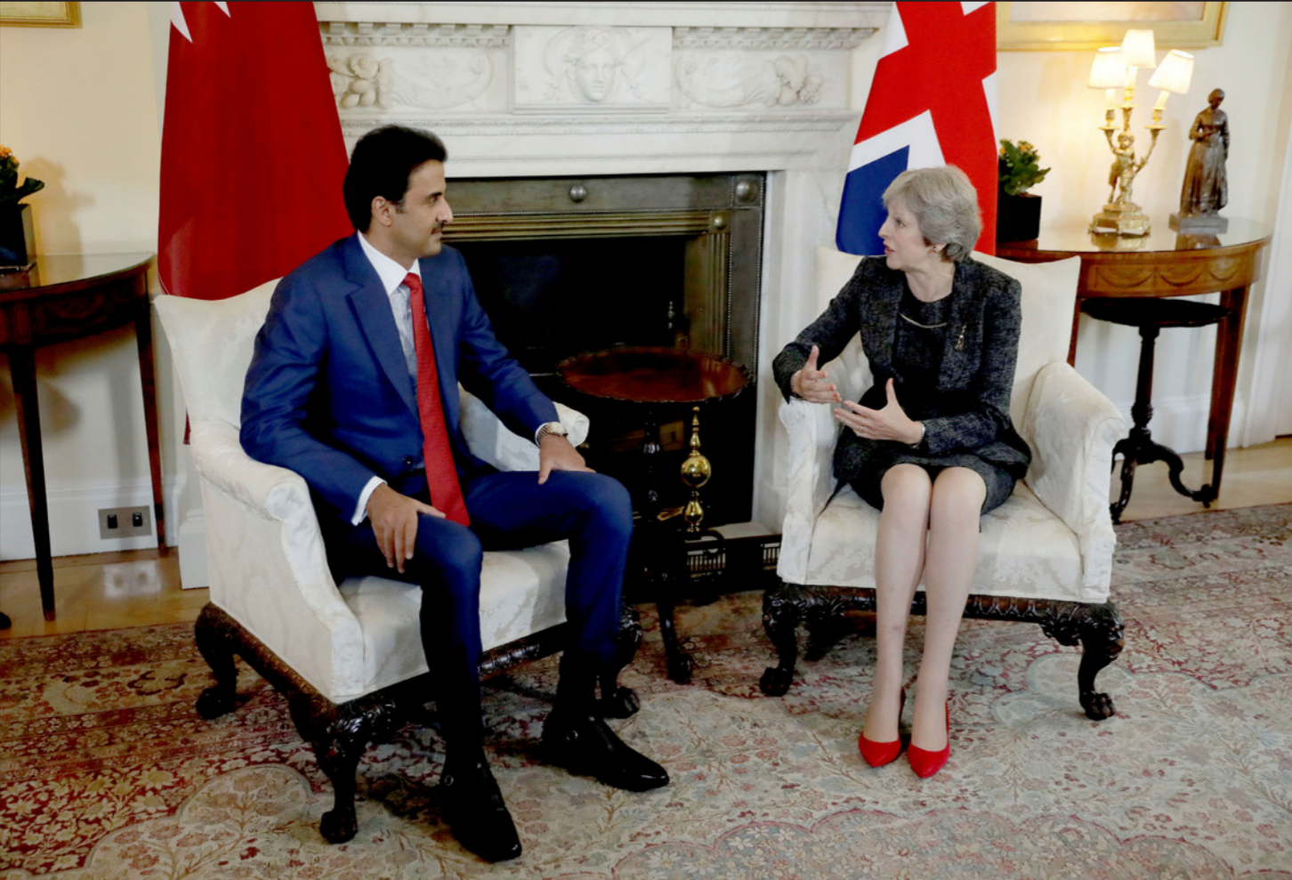
أمير قطر الشيخ تميم بن حمد آل ثاني ورئيسة وزراء بريطانيا تريزا ماي خلال لقائهما في لندن أمس

بريطانيا ضد الثورات العربية، لقمع انتشار الديمقراطية التي تقري من منظمة «سي بي ونش» - في مقابلة مع قناة القطر. كما يلتقي الأمير تميم، خلال الزيارة عدداً من الوزراء وسياسيين وصحافيين، وذلك في إطار حملتها المناهضة والصحافي اليكس داسار مورغان - وهو أحد معدي