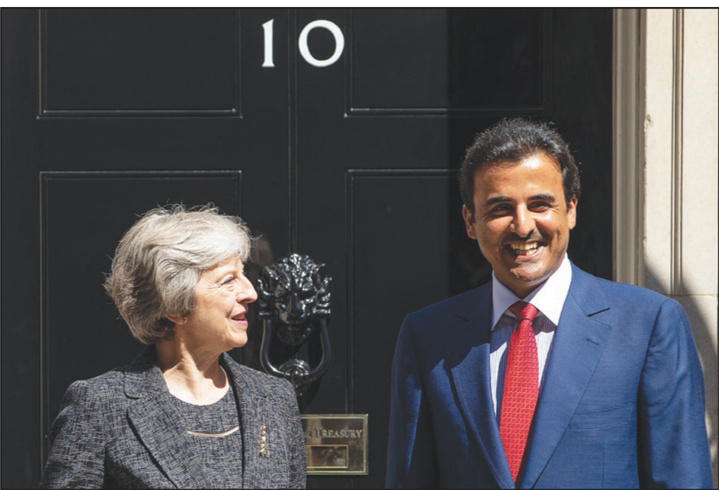
رئيس الوزراء البريطانية تيريزا ماي لدى استقبالها أمير قطر الشيخ تميم بن حمد آل ثاني