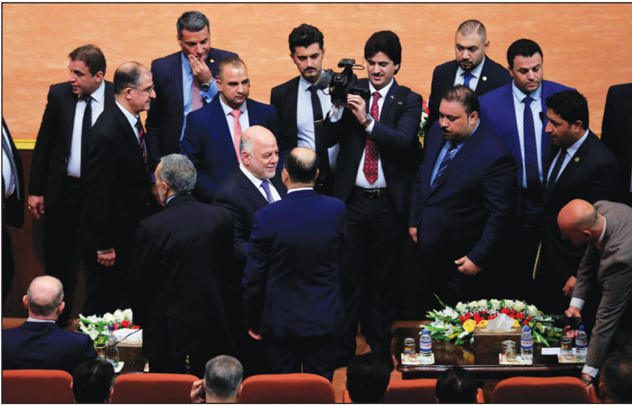
رئيس الوزراء العراقي حيدر العبادي خلال جلسة البرلمان أمس لاختيار الكتلة الكبرى التي ستشكل الحكومة

ويبدو أن زيني وجذب الحورين، قرر رئيس السن اللجوء إلى المحكمة الاتحادية للبت بطلب تحالف الصدر - العبادي من جهة، والمالكي والعامري من جهة ثانية، واعتبار واحد منها الكتلة البرلمانية الأكبر. ويعتمد تحديد «الكتلة الكبرى» على موقف الأكراد، الذين لم يعلنوا الانضمام إلى أي من الفريقين حتى اللحظة، إضافة إلى احتمالية اقتناع النواب بالتفصل بين الحورين، حسب مراقبي.