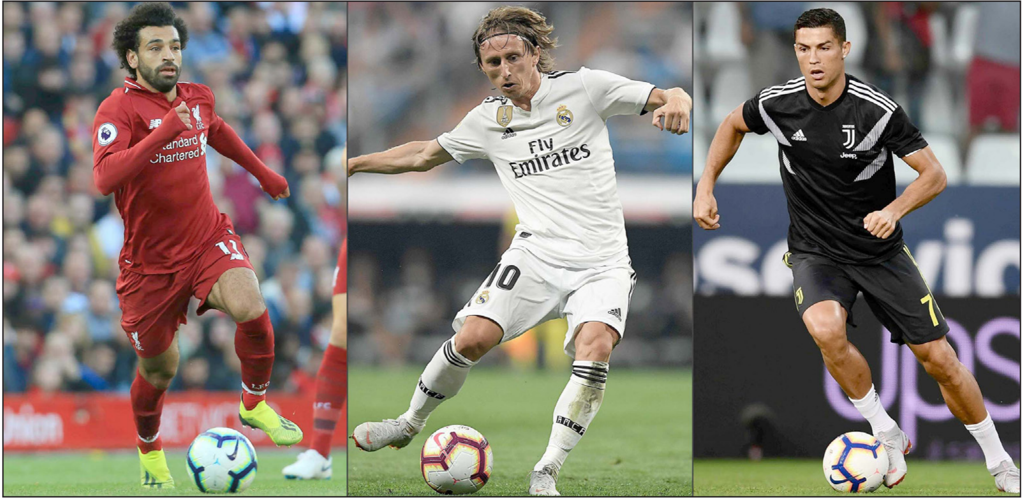
مودريتش يتوسط صلاح ورونالدو المرشحين الثلاثة لجائزة الأفضل في العالم

■ لندن - د ب أ: أعلن الاتحاد الدولي لكرة القدم (فيفا) عن القائمة النهائية للمرشحين الثلاثة لنيل جائزة التي يمنحها لأفضل لاعب في العالم (ذا بيسست) والتي وضعت البرتغالي كريستيانو رونالدو والكرواتي لوكا مودريتش والصربي محمد صلاح.