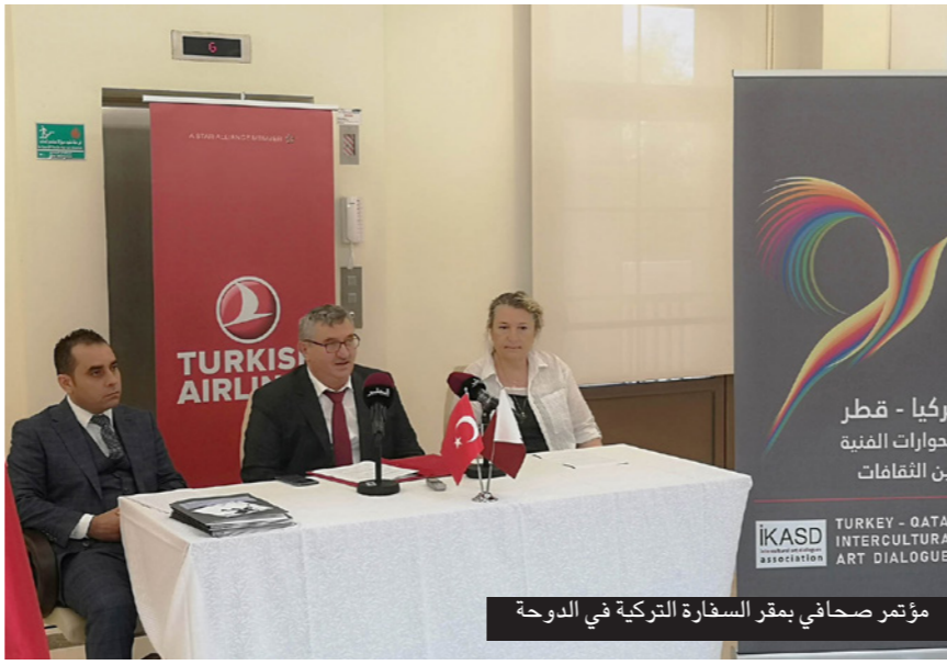
مؤتمر صحفي بمقر السفارة التركية في الدوحة