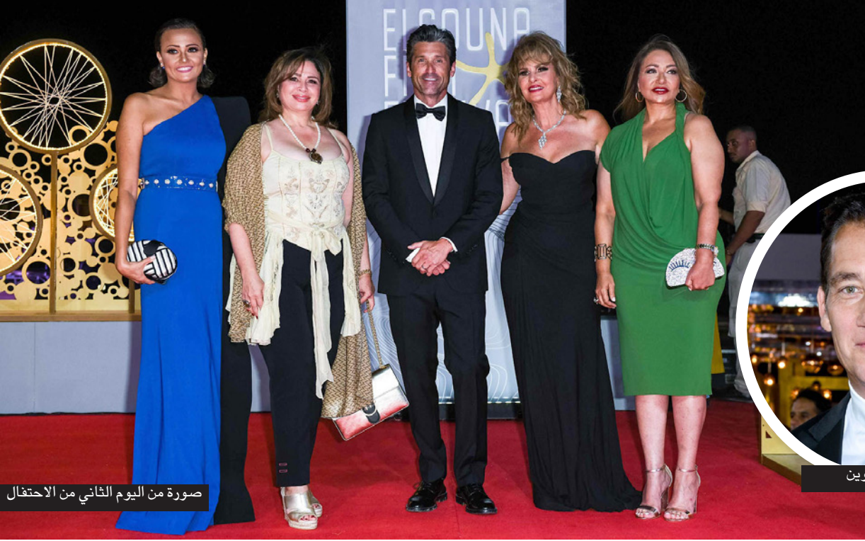
صورة من اليوم الثاني من الاحتفال

السؤال الأولي للفيلم: كيف يعيش السوري البسيط تحت الحرب؟ تحول هلا مع العرض: كيف يقدر سوري يسافر ويزور بلد عربي، إذا فريق الفيلم كله ما قدر يكون هون؟ ويتمنى حتى لو ما كنا سوى الآن إن الفيلم يؤثر بكم والنقاش حول الفيلم نقدر نكملة سوا بمكان ثاني وزمان ثاني، اليوم غيبنا عن العرض هو لحاله بيان عن الوضع السوري!