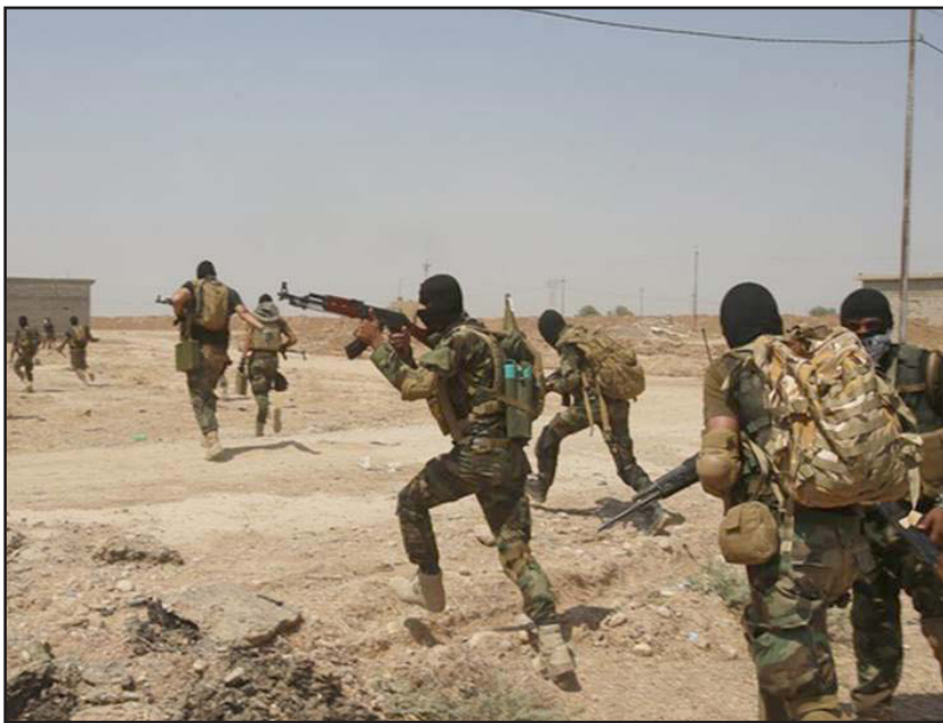
جانب من عمليات التطهير التي يقوم بها الجيش العراقي

وأضاف أن «المدانين كانوا يتسلمون كغالة مالية من التنظيم إضافة