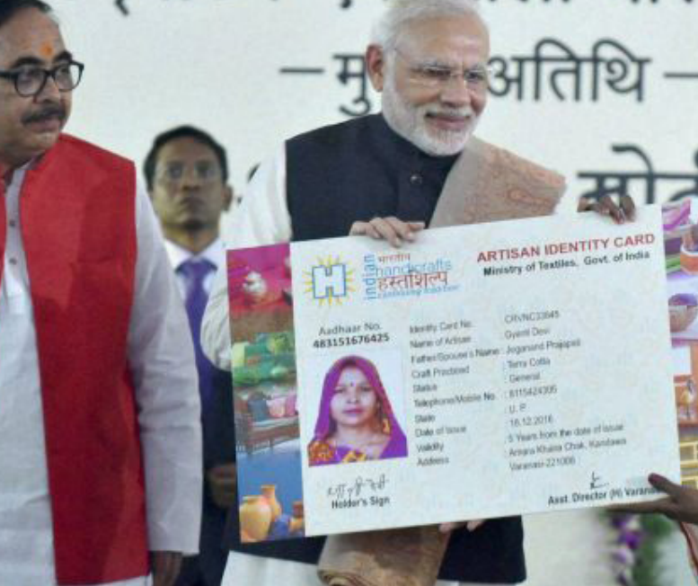
مودي يقدم لربة عائلة بطاقة مكرمة للتأمين الصحي

من الأزمات ما يكن له صدى في البورصة. ويرى الصناع أن البنية التحتية من قوانين وإصلاحات وتنظيمات رغم أهميتها والجهد الذي بذل فيها لا تكفي وحدها، وأن ما تحتاجه البورصة الكويتية هو الثقة. ويقول أن إعادة الثقة في بورصة الكويت هي مسؤولية الحكومة ممثلة في هيئاتها المعنية بوزارتها وأجهزتها المختلفة، وعلى رأسها الهيئة العامة للاستثمار، وغيرها من المؤسسات التي ينبغي أن تعمل بشكل متكامل لإعادة هذه الثقة لبورصة ليس فقط على المستوى الخارجي وإنما على المستوى المحلي والإقليمي أيضا. وطالب الهيئة العامة للاستثمار ليس فقط بالاستثمار في أسهم البورصة، وإنما على خلق منتجات جديدة والمساهمة فيها، ودعم المستثمرين المحليين في أفكارهم ومبادراتهم