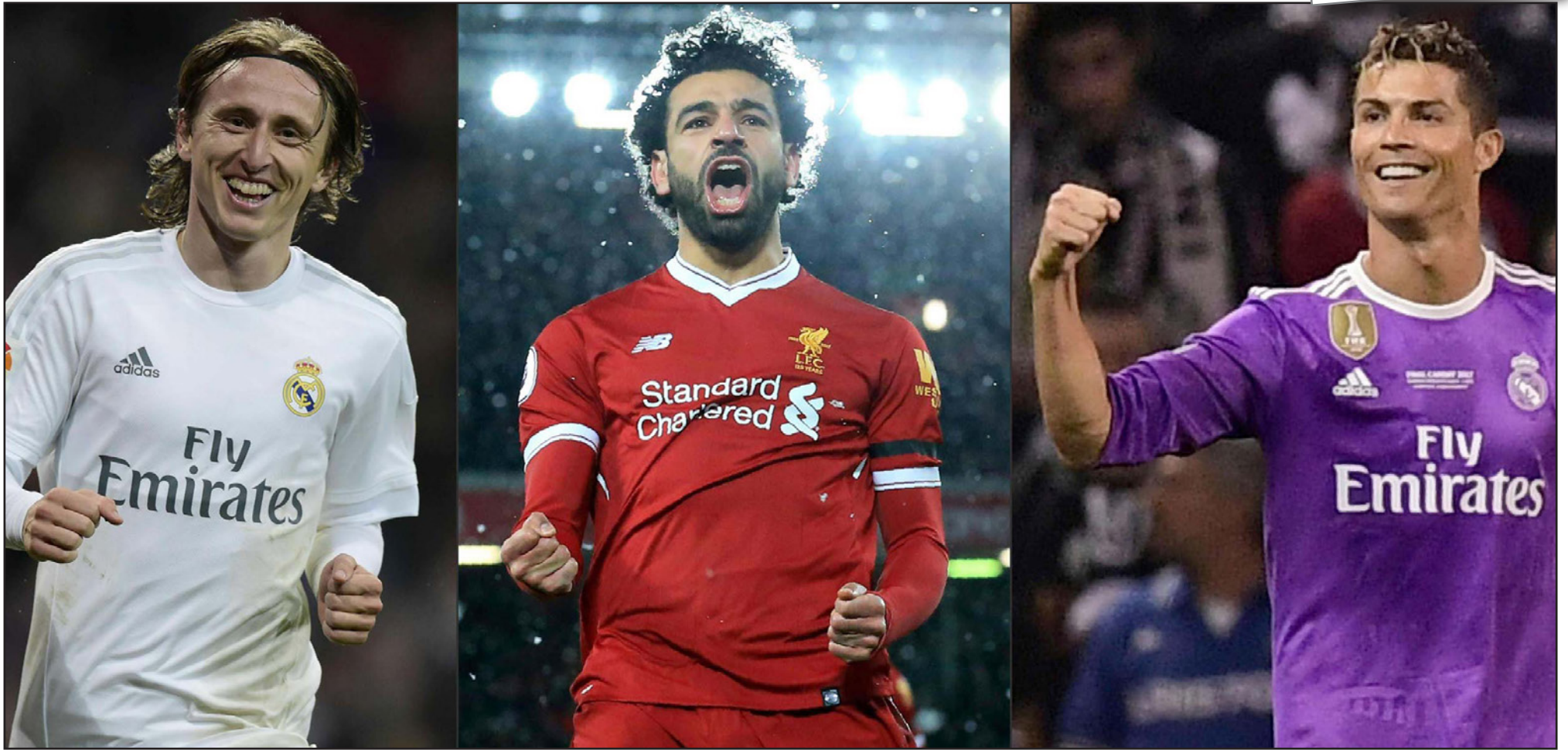
صلاح يتوسط مودريتش (يسار) ورونالدو المرشحين لجائزة الأفضل في العالم

■ لندن - د ب أ: يحلم النجم الكرواتي لوكا مودريتش بالتفوق مجدداً على البرتغالي كريستيانو رونالدو والمصري محمد صلاح وحظف جائزة «دي بيست» التي يقدمها الاتحاد الدولي لكرة القدم (فيفا) إلى أفضل لاعب في العالم. ويقدم السويسري جاني إنفانتينو رئيس الفيفا جائزة «دي بيست» إلى اللاعب الأفضل في العالم خلال حفل جوائز الفيفا الذي يقام اليوم في العاصمة البريطانية لندن. وهذه الجائزة الثانية التي يتنافس عليها اللقبين مودريتش ورونالدو وصالح في 2018، حيث حسم مودريتش الصراع على لقب أفضل لاعب في أوروبا وانتزع الجائزة الشهر الماضي. ولعب مودريتش ورونالدو دوراً بارزاً في فوز ريال مدريد بدوري أبطال أوروبا الموسم الماضي ليكون اللقب الثالث على التوالي للريال في ثلاثة مواسم متتالية بالبطولة، ويرفع الفريق رصيده إلى 13 لقباً (رقم قياسي) في دوري الأبطال. كما لعب مودريتش دوراً بارزاً وكان القوة الدافعة الهائلة خلف بلوغ المنتخب الكرواتي المباراة النهائية لكأس العالم 2018. ونال مودريتش المكافأة على دوره البارز في البطولة وأحرز جائزة الكرة الذهبية لأفضل لاعب في مونديال 2018. ولهاذا، أصبح مودريتش المرشح الأبرز لجائزة الفيفا من وجهة نظر الحارس الألماني السابق أوليفر كان، الذي قال: «المنتخب الكرواتي