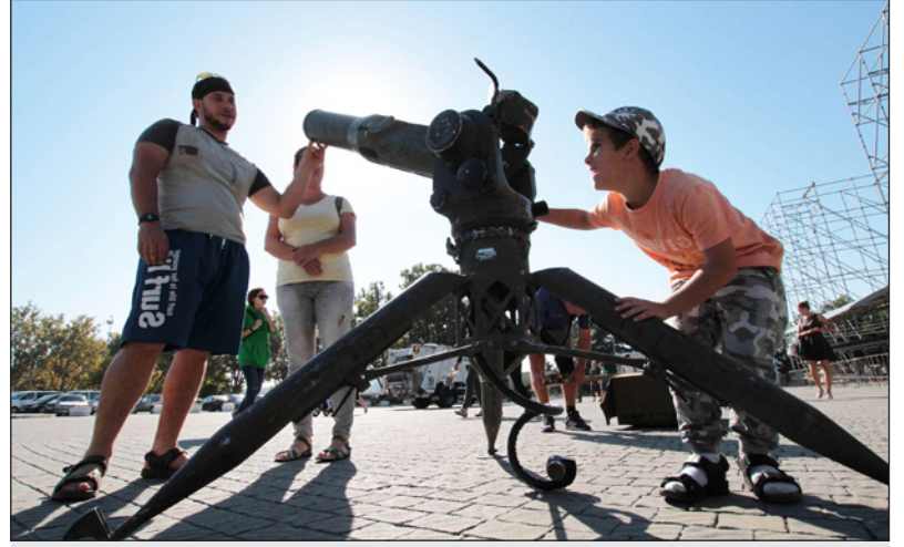
قائد عرض في أحد معارض روسي على البحر الأسود كان أخذ من المعارضة السورية المسلحة

■ لندن - «القدس العربي»: أعلن المتحدث الرسمي باسم وزارة الدفاع الروسية حسب موقع «سبوتنيك» الروسي، اللواء إيغور كوناشينكوف، أنه يجري تنظيم معرض للأسلحة التي يستخدمها المسلحون المعارضون في سوريا، في المنتدى الدولي «أرميا - 2018» (الجيش - 2018).