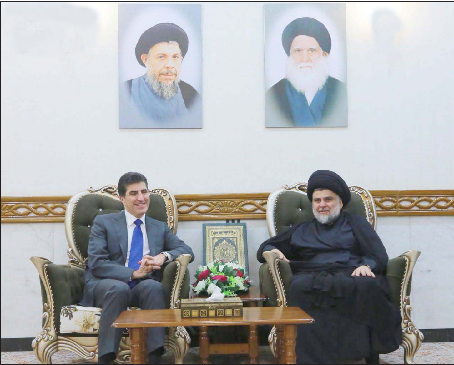
مقتدى الصدر خلال لقائه نيجيرفان بارزاني في النجف أمس

وقال في مؤتمر صحفي عقب لقائه الصدر، «إننا بحثنا مع الصدر تشكيل الحكومة والتوافقات بين الكتل خصوصا رئاسة الوزراء»، مؤكدا سعيه لتقريب وجهات النظر بين الفرقاء».