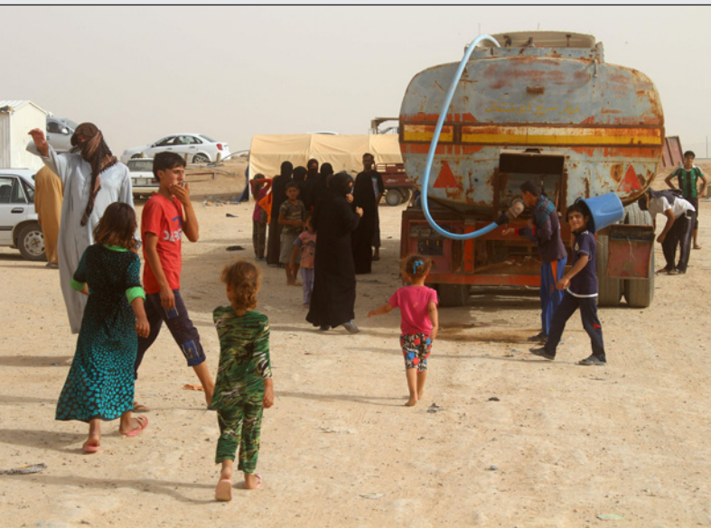
عراقيون ينتظرون تسلم المياه في مخيم يعاني من نقص في المياه والغذاء