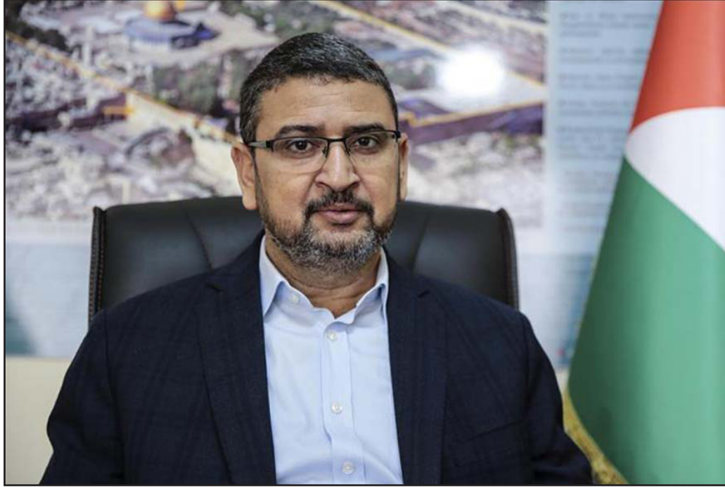
سامي أبو زهري

توقف تطبيق اتفاق 12 أكتوبر/ تشرين الأول الماضي، في مارس/ آذار بعد حادثة تفجير موكب رئيس الحكومة ومدير المخابرات الفلسطينية، لدى دخولهما إلى قطاع غزة.