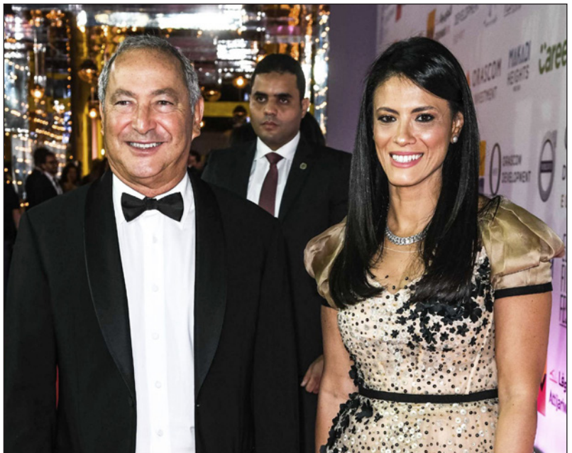
وزيرة السياحة رانيا المشاط ورجل الأعمال سميح ساويرس في حفل افتتاح مهرجان «الجونة»

■ الجونة (مصر) - رويترز: قالت وزيرة السياحة المصرية، رانيا المشاط، إن الوزارة تستعد لإطلاق برنامج إصلاح هيكلية لقطاع السياحة خلال شهر أكتوبر/تشرين الأول، كما أنها تضع استراتيجيات جديدة للترويج لمصر في الخارج تعتمد على الرموز الثقافية والفنية، إلى المقاصد السياحية.