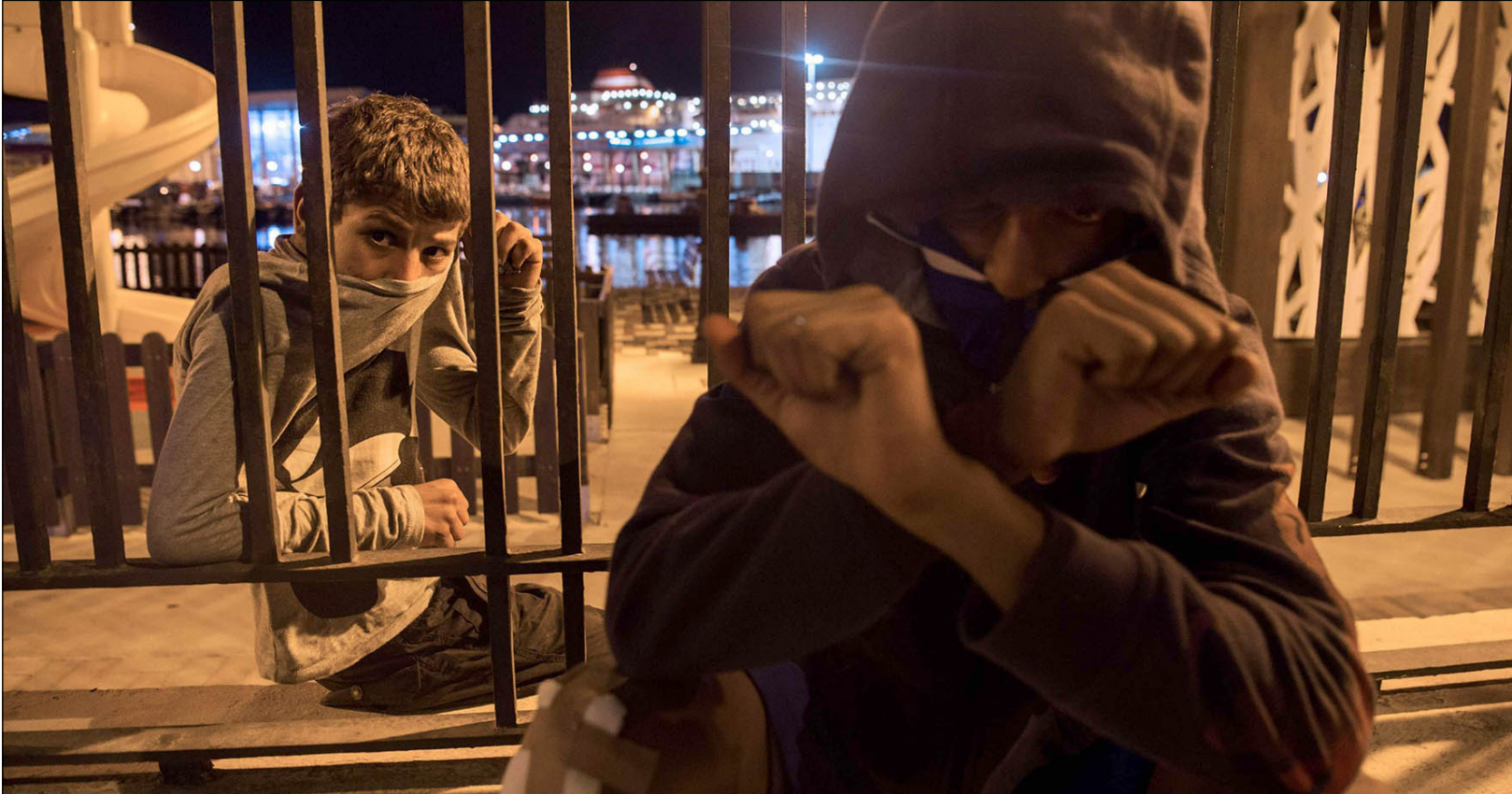
مغاربة يجلسون أمام الميناء في مدينة مليبية الإسبانية