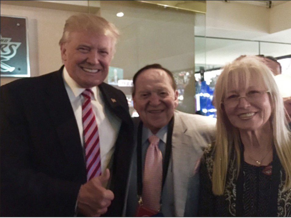
أدليسون وزوجته مع ترامب

وقدم أدليسون دعوى قضائية ضد عدد من الصحافيين الذين كتبوا منهم صحافي دفع للأفلاس في وقت كانت ابنته تعاني من سرطان الدماغ. ونظرا لثروة أدليسون الهائلة والتي تضعه من بين كبار الأثرياء في العالم فإن ترامب يستمع لنصائحه. وتنتقل الصحيفة عن مورتنو كلابن، صديق الملياردير والمؤيد لإسرائيل قوله إن أدليسون السعيد جدا اتصل به من سيارته بعد لقائه مع الرئيس المنتخب الذي وعد بتعلي السفارة. وقال له: «مورت لقد جئت من برج ترامب ووعدي بتنازل ترامب بخلق السفارة إلى القدس في ولايته الأولى». ودعم الخطة المخطط الإسرائيلي السابق ستيفن باتون حيث كانت الخطة الإعلان عنها في يوم تنصيب ترامب. وذهبوا بعيداً في التخطيط حيث ناقشوا وقت غروب الشمس بداية السيت اليهودي حتى يكون أشخاص مثل أدليسون حاضرين الإعلان. ولكن المسؤولين في الخارجية والوزارات الأخرى حذروا الرئيس من أن الخطوة ستؤدي لتظاهرات في العالم العربي.