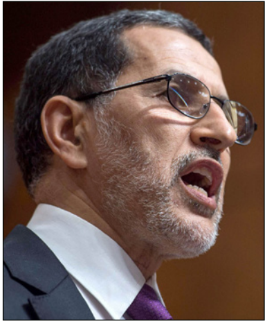
سعد الدين العثماني

وقال رئيس الحكومة، في 28 تموز/ يوليو الماضي، أن الفساد يلتهم ما بين 5 إلى 7 في المئة من الناتج المحلي الإجمالي. وبلغ إجمالي الناتج المحلي للاقتصاد المغربي، 982.2 مليار درهم (97.4 مليار دولار) عام 2015، مقارنة مع 923.6 مليار