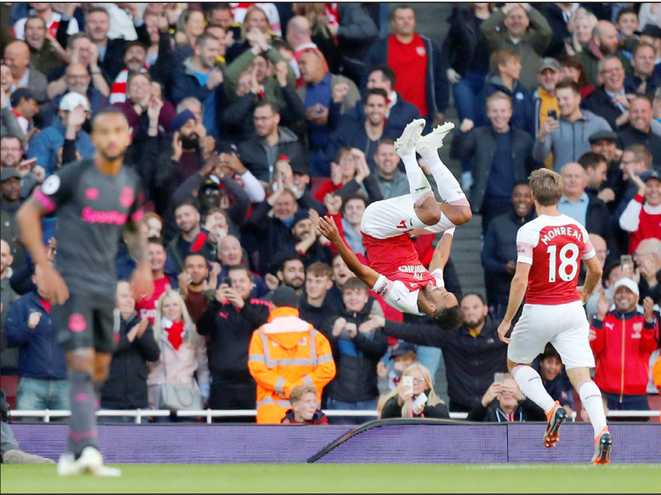
أوباماينغ يحتفل بطريقته المعتادة بعد تسجيل الهدف الثاني لأرسنال