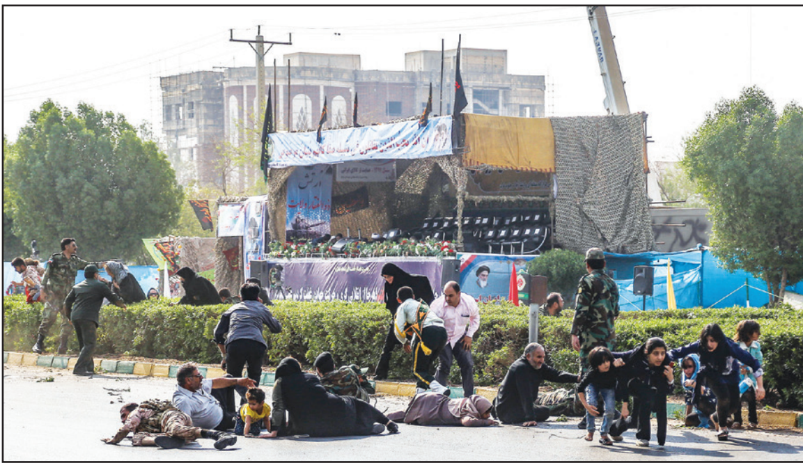
إيرانيون يهرون أثناء الهجوم المسلح على عرض عسكري في مدينة الأحواز

نشرت وكالة أعمق التابعة لتنظيم «الدولة الإسلامية»، تسجيلًا مصورا لثلاثة رجال داخل مركبة قالت إنهم كانوا في طريقهم لتنفيذ الهجوم على العرض العسكري في إيران. ووفقا للتسجيل المصور الذي نشر بعد الهجوم على الحرس الثوري في مدينة الأحواز الإيرانية أمس السبت، تحدث رجلان باللغة العربية عن الجهاد بينما تحدث الثالث بالفارسية قائلا إنهم سيستهدفون قوات الحرس الثوري الإيراني. وهددت جريدة مكتب المرشد الأعلى الإيراني، علي خامنئي، الملكة العربية السعودية بـ«رد منزل»، على خلفية الهجوم الذي استهدف عرضا عسكريا أقيم في إقليم الأحواز العربي، بمناسبة ذكرى حرب الـ 8 سنوات بين إيران والعراق، فيما اتهم الرئيس الإيراني حسن روحاني بعض الدول الخليجية المدعومة من أمريكا بتقديم الدعم المالي والعسكري للأحوازيين.