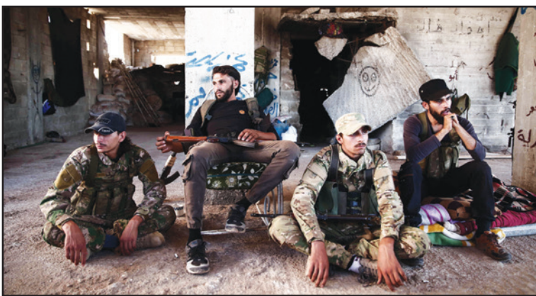
مقاتلون من جماعة نور الدين الزنكي في موقع تسيطر عليه المعارضة السورية في حلب أمس

الجيش الروسي تلقى اتصالاً من القيادة الإسرائيلية في الساعة 18، 39 بتوقيت غرينتش تحذر فيه من أن إسرائيل ستضرب في «شمال سوريا»، حيث كانت طائرة إيل-20 روسية للاستطلاع ترافق منطقة خلف التصعيد في ادلب، وأضاف أن روسيا طلبت من طائرتها العودة إلى القاعدة، لكن بعد دقيقة من الاتصال الإسرائيلي ضربت الطائرات الإسرائيلية هدفا في اللاذقية في غرب سوريا، وأشار كوناشيوكوف إلى أن «المعلومات المضللة للضابط الإسرائيلي في ما يتعلق بموقع الضربات جعل من المستحيل إرشاد طائرة إيل-20 إلى مكان آمن»، وقال كوناشيوكوف إن أفعال الطيارين الإسرائيليين «تعكس إما عدم احترامهم، وإما إهمالهم الإجرامي على أقل تقدير»، مؤكدا أن سلاح الجو الإسرائيلي مسؤول بشكل كامل عن إسقاط الطائرة. وبعد 24 ساعة من إعلان تنظيم «حراس الدين» المايح لتنظيم القاعدة، رفضه لاتفاق بوتين - اردوغان في سوتشي الروسية حول التسوية وضوء مدينة ادلب، داعيا إلى بدء عمليات عسكرية في المنطقة، وفي ما يعتبر رسالة ملهمة له بسبب رفضه الاتفاق، أعلن «حراس الدين» عصر أمس، مقتل القائد العسكري لدهي الملقب «سيف»، برصاص مجهولين بالقرب من بلدة كسفر، في جبل الزاوية في ريف ادلب الجنوبي، (تفاصيل ص4)