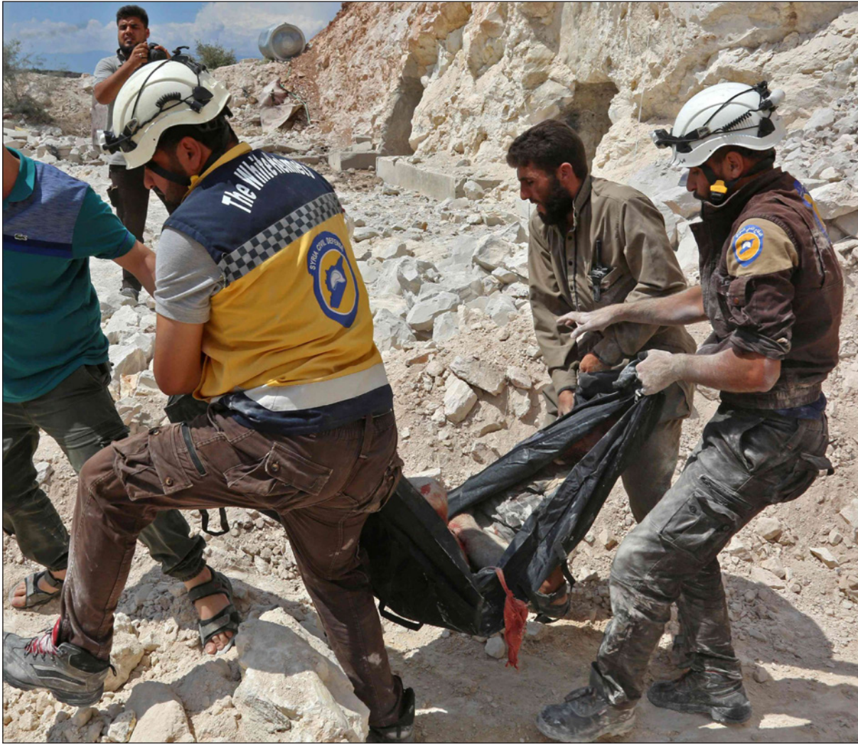
عناصر من الخوذ البيض ينشلون جثة رجل من بين انقاض مبنى ضصفه النظام وحلغاؤه في ادلب

«السؤال عما كان يدبر الخلية المركزية لإدارة الأزمة والجواب بشكل قاطع هو الأسد». و«حتى ولم يكن يجلس الأسد في القاعات فنحن نعرف أنه تلقى تقارير ووقع على التوصيات». وخلافاً للتقارير التي تحدثت عن شقيقه ماهر الأسد الذي اعتبرته المسؤول الحقيقي عن إدارة شؤون البلاد فإن الوثائق تكشف عن أن «الأسد ليس مجرّد رمز بل لديه سلطة فعلية وقانونية يقوم بعمارستها». ويقول وايلي: «الجميع يتحدّثون عن ماهر ولكننا لم نعرّض على شيء يثنّسناه وبالمقارنة لدينا الكثير عن الأسد. إنه مثل إدانة سلوبودان (ميلوسوفيتش) الذي كان من الصعب السيطرة عليه».