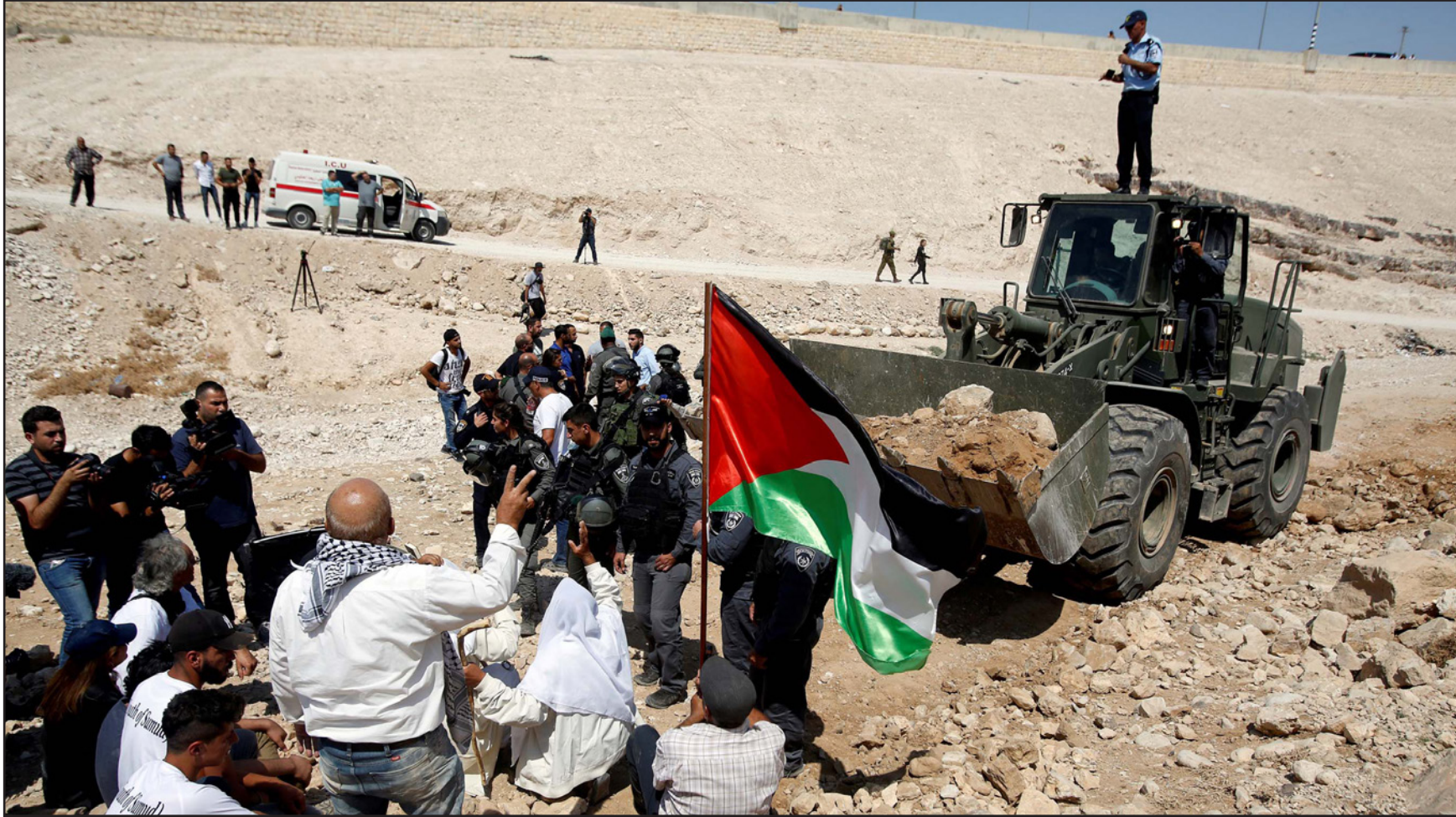
أهالي الخان الأحمر والتضامنون معهم يعترضون طرقت قوات الاحتلال التي تعمل على هدمه