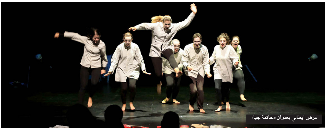
عرض إيطالي بعنوان «خاتمة جيا»

الذي ينظم المهرجان تحت إشراف وزارة الشؤون الثقافية، بمبادرة فنانة قادرة على 400 ألف دينار (144.5 ألف دولار). والعرض العرائسي الإيطالي «خاتمة جيا» يروي قصة شخص متمسك بأحلام وردية ولدت معه منذ نشأته. إلا أنه يتخلى عنها بسبب العالم المعثر الذي يعيش فيه والمليء بمشاعر الغربة والوحدة والحزن. وسبق حفل الافتتاح الرسمي، عرض فرجوي (استعراضى) انطلق مساء أمس أمام مدينة الثقافة بمشاركة 150 دمية مختلفة الأحجام وصحية 6 فرق