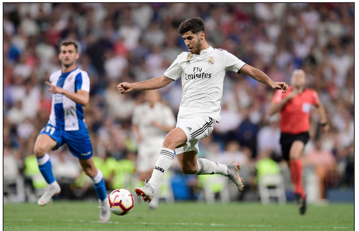
أسينسيو تالّق وسجل الهدف الوحيد في انتصار ريال مدريد

في دوري أبطال أوروبا على روما الأربعاء الماضي، أدخل لوبيتيغي تغييرات على تشكيلته قبل مواجهة إسبانيول السادس في الترتيب عقب بدايته الجيدة هذا الموسم، وأراح المدرب غاريت بيل ومارسيلو وتوني كروس، ومنح فرصة للدفاع الفارو أديروزولا للظهور لأول مرة بديلا لداني كاربخال المصاب، واستحوذ الريال على الكرة لكن إسبانيول شكل تهديدا دائما في الهجمات المرتدة. وسدد بابلو بياتي بعيدا عن الرمي الفريق الزائر واستطاع تيبو كورتوا ابعاد محاولة من هرنان بيريز. وانتزع أصحاب الأرض التقدم قبل نهاية الشوط الأول بأربع دقائق بعد تسديدة لوكا مودريتش التي غيرت اتجاهها بشكل كبير لكنها وصلت لأسينسيو الذي سجل أول أهدافه في الدوري هذا الموسم. واضطر مهاجم الريال لانتظار اللجوء لتقنية حكم الفيديو المساعد لآيات انه غير متسل قبل ان يحتفل بالهدف، وراوغ إغليسياس مهاجم إسبانيول سيرجيو راموس قائد الريال مع بداية الشوط الثاني ولعب الكرة من فوق الحارس كورتوا لكن تسديده ارتدت من العارضة. وتماسك الريال رغم ضغط إسبانيول لينتزع الصدارة قبل ان يستضيف برشلونة منافسه جيرونا في وقت متأخر أمس. واندى انتصار أتلتيكو المريح على خيتافي لتخفيف الضغط عقب بداية مهتزة للموسم جمع فيها خمس نقاط من أول أربع مباريات، وتسبب الجناح الفرنسي ليمار في هدف السيق