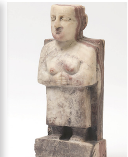
تمثال من جنوب الجزيرة العربية

الباشا وهلين الخال وشاكر حسن السعيد ومحمود العبيدي وضياع العزاوي وعمر أنسي وشفيق عبود وبوبل غراوغسيان ومصطفى فروخ بالإضافة إلى مجموعة من أعمال صليبا النويهي الفنية النادرة. ومن أبرز ما يتضمنه المتحف مجموعة فريدة من نوعها من الرقميات المسارية (قطع خزفية صغيرة) يرجع تاريخها إلى الفترة ما بين 2330 و540 قبل الميلاد. وتروي هذه الرقميات حكايات ملحمية وتوفر دلائل على النظم الاقتصادية الأخرى لمعلومات عن المجتمعات العرقية وخرائط المدن القديمة.