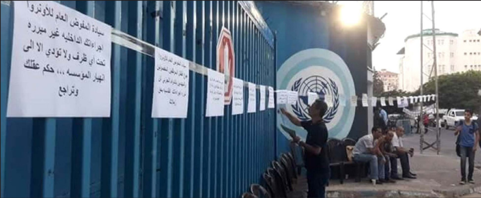
اتحاد موظفي «الأونروا» في قطاع غزة يغلّقون أبوابها احتجاجاً على قرارها بتفويض عدد من الموظفين

مع الخطط الإسرائيلية. وتعاني هذه المنظمة حالياً من عجز مالي يفوق الـ 200 مليون دولار، وتؤكد أن ما لديها من أموال لا يكفي سوى إلا لنهاية الشهر الحالي، وتعقد أعمالاً على مؤتمر للمانحين سيبدأ على هامش اجتماع الجمعية العامة للأمم المتحدة التي تعقد حالياً في نيويورك.