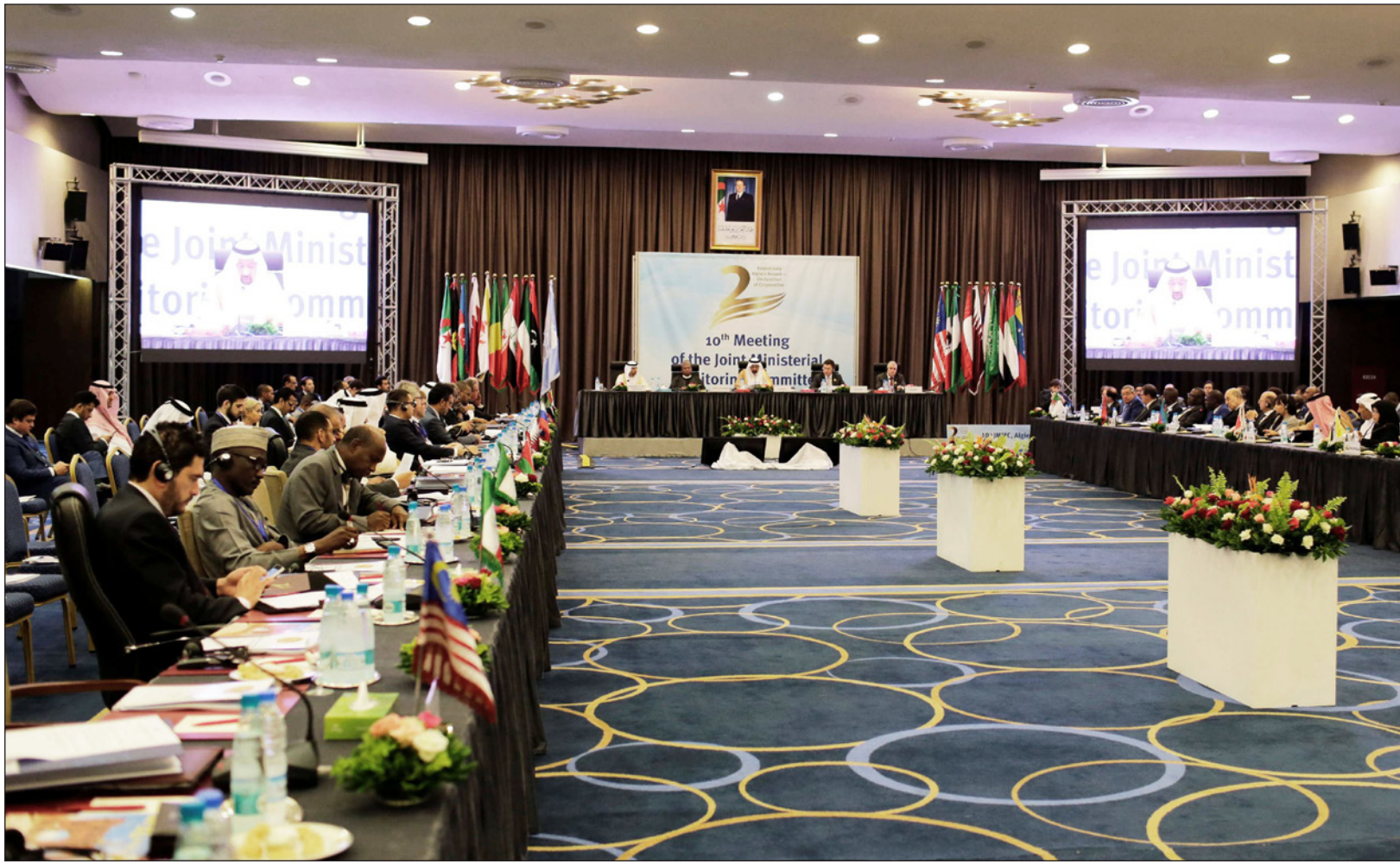
الجلسة الافتتاحية للجنة المتابعة الوزارية لمنظمة «أوبك» في الجزائر العاصمة أمس

■ الجزائر - وكالات: استبعدت السعودية، أكبر منتج في منظمة الدول المصدرة للنفط «أوبك»، وروسيا أكبر المنتجين الحلفاء لها، أي زيادة إضافية فورية في إنتاج الخام، في رفض فعلي لدعوات الرئيس الأمريكي دونالد ترامب إلى التحرك لتهدة السوق.