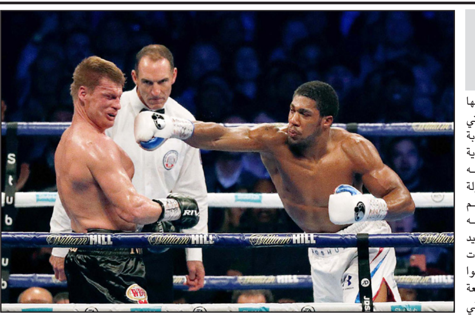
جوشوا يسدد لكمة قوية إلى وجه الروسي بوفتكين

■ الدوحة - د ب أ: لقت السد ضيفه الريان درسا قاسياً في فنون كرة القدم وتغلب عليه بخماسية نظيفة في الجولة السادسة من الدوري القطري. وسجل أهداف السد بغداد بونجاح (هدفين) في الدقيقتين 11 و70 وعبدالكريم الحاج في الدقيقة 31 وأكرم عفيف في الدقيقة 59 ووو يونغ في الدقيقة 79. ورفع السد رصيده إلى 13 نقطة ليحتل الصدارة، ليحافظ على سجله خالياً من الهزائم في