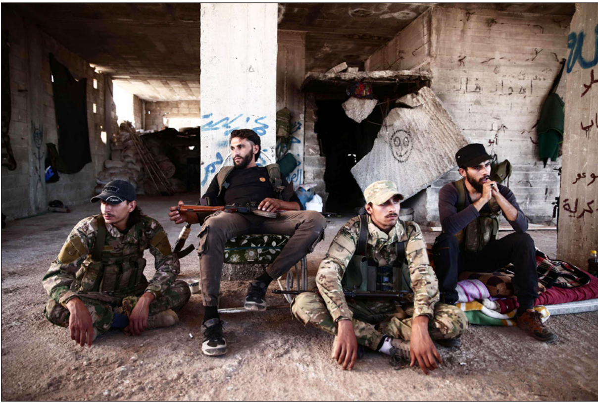
مقاتلون من نورالدين الزنكي في ريف حلب

الاتفاق، ستحتل منطقة خفض التصعيد الرابعة إلى منطقة استقرار مؤقتة ومنها إلى منطقة وقف شامل لإطلاق النار، وسيؤدي ذلك إلى وضع الآليات اللازمة لتفعيل الطريق الدولي حلب بين حلب ودمشق (M-5) والطريق الدولي بين حلب واللاذقية (M-4). كما ستقوم تركيا بتعزيز نقاط المراقبة لديها وتنسيق دوريات مشتركة مع روسيا في المنطقة العازلة.