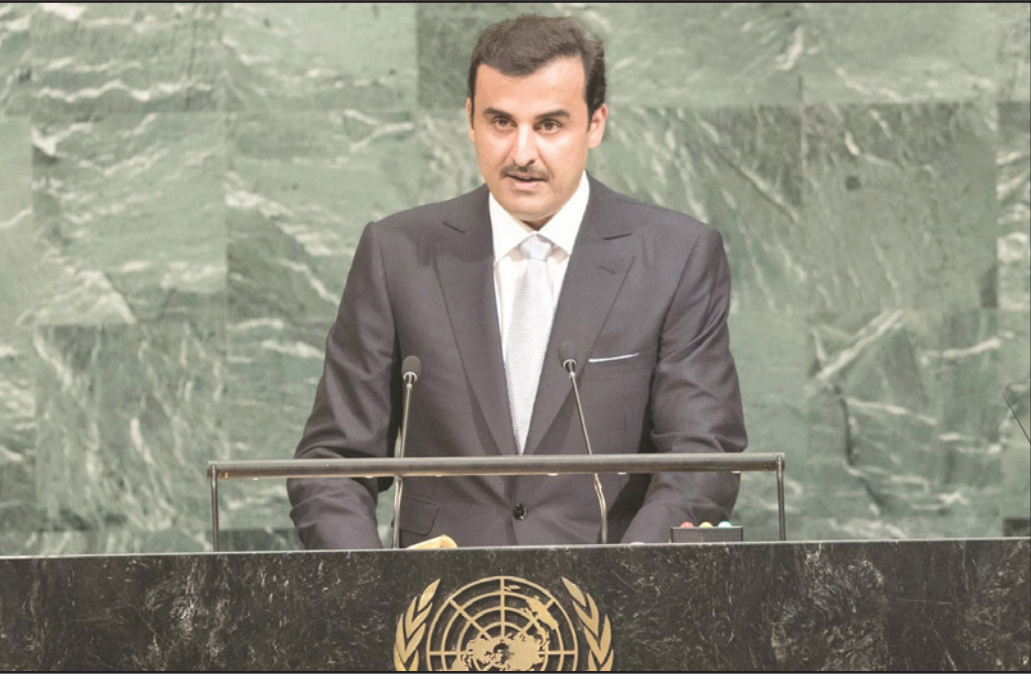
أمير قطر الشيخ تميم بن حمد آل ثاني يلقي كلمة بلاده في اجتماعات سابقة للجمعية العامة للأمم المتحدة