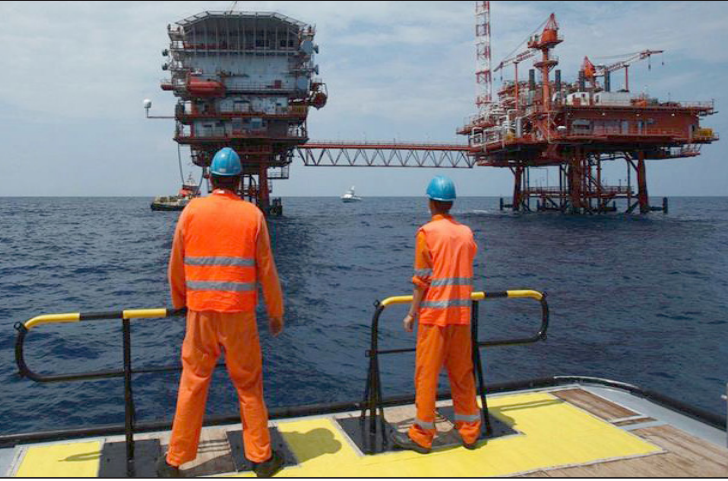
من المتوقع ان تسدد مصر قيمة إحدى الغرامات من الغاز الطبيعي