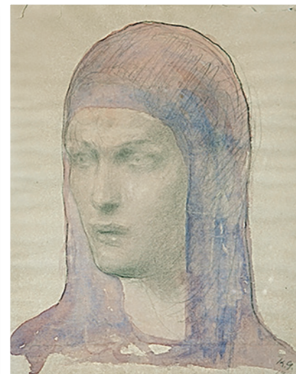
عمل لجبران خليل جبران

وبين حنايا المتحف ترتفع لوحات وتماثيل وتتوزع تشكيلة غنية من الأواني الأثرية جُمعت من العراق وسوريا واليمن وغيرها من الدول في امتداد للحدود العربية، وبعض هذه الأثرينات والنقوش والمخطوطات يعود تاريخها إلى عام 2330 قبل الميلاد. وقال جواد عدرا، مؤسس المتحف إن المتحف يضم نحو 300 قطعة أثرية تعود إلى القرنين السابع والخامس قبل الميلاد ويستضيف نقوشا عمرها ثلاثة آلاف عام وأخرى تعود إلى ستة آلاف عام. وأضاف عدرا أن المتحف يقع على مساحة 1600 متر وسيسمتر أغنية من الأواني الأثرية جُمعت من العراق قبل إضافة معروضات جديدة. وعن الدافع الذي جعله يؤسس متحفا في هذا الزمن قال عدرا «كثيرون قالوا إني أقوم بعمل هو ضرب من الجنون... على العكس هو ضرب من العقل والحكمة. وأنا أشعرت (نابو) إله الحكمة، ومن الحكمة أن تؤسس هذا المتحف ونقول إننا نعيش عصر الجنون لاسيما في لبنان».