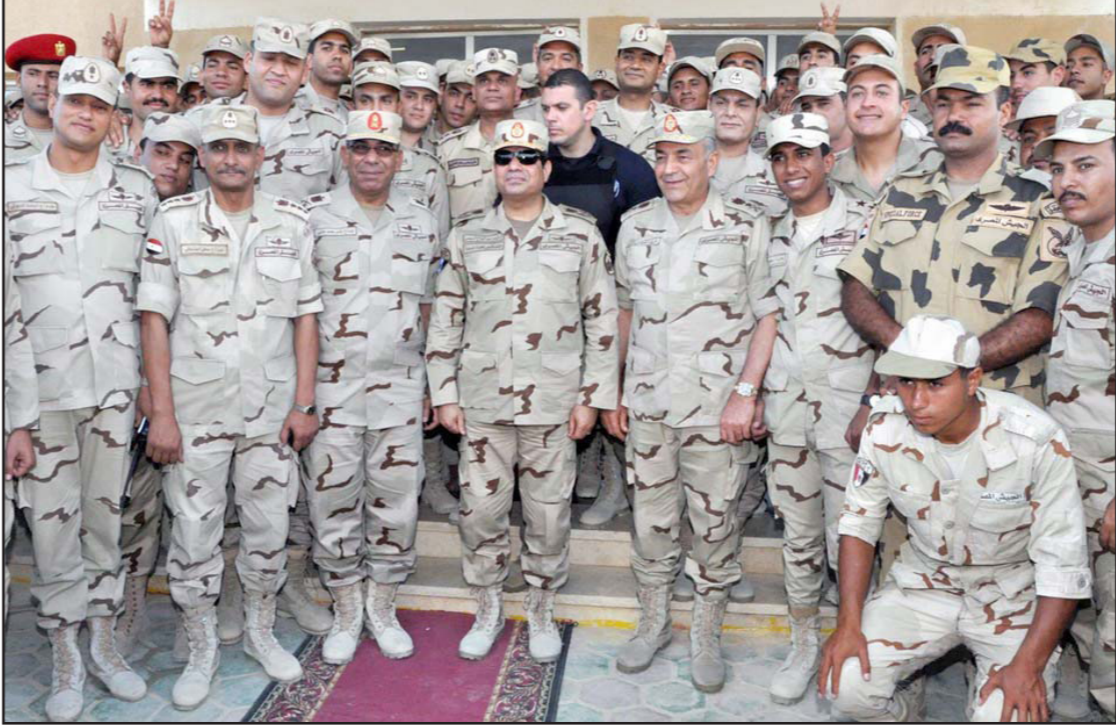
الرئيس السيسي يتوسط عناصر من الجيش المصري

هزيل لذلك نطالب بمعاش استثنائي آخر نظرا لأن صناعه الإسمنت صناعة خطيرة وتضر بصحة العامل وربما لن يتمكن من العمل لسنواته المتبقية حتى الستين لكسب عيشه.. وأكد النشطاء على «ضرورة إشراك القيادات العمالية كلها داخل النقشاة في عملية التفاوض بدون تهديد وترهيب من أي جهة نظرا لأنه في آخر انتخابات نقابية تم منع