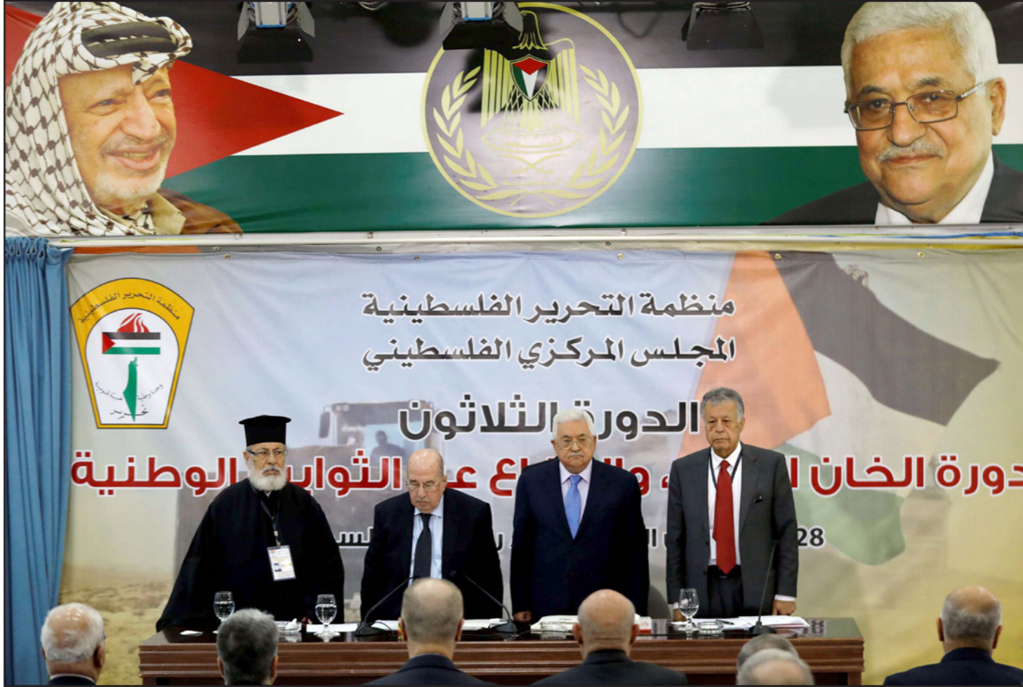
من افتتاح جلسة المجلس المركزي في رام الله أمس