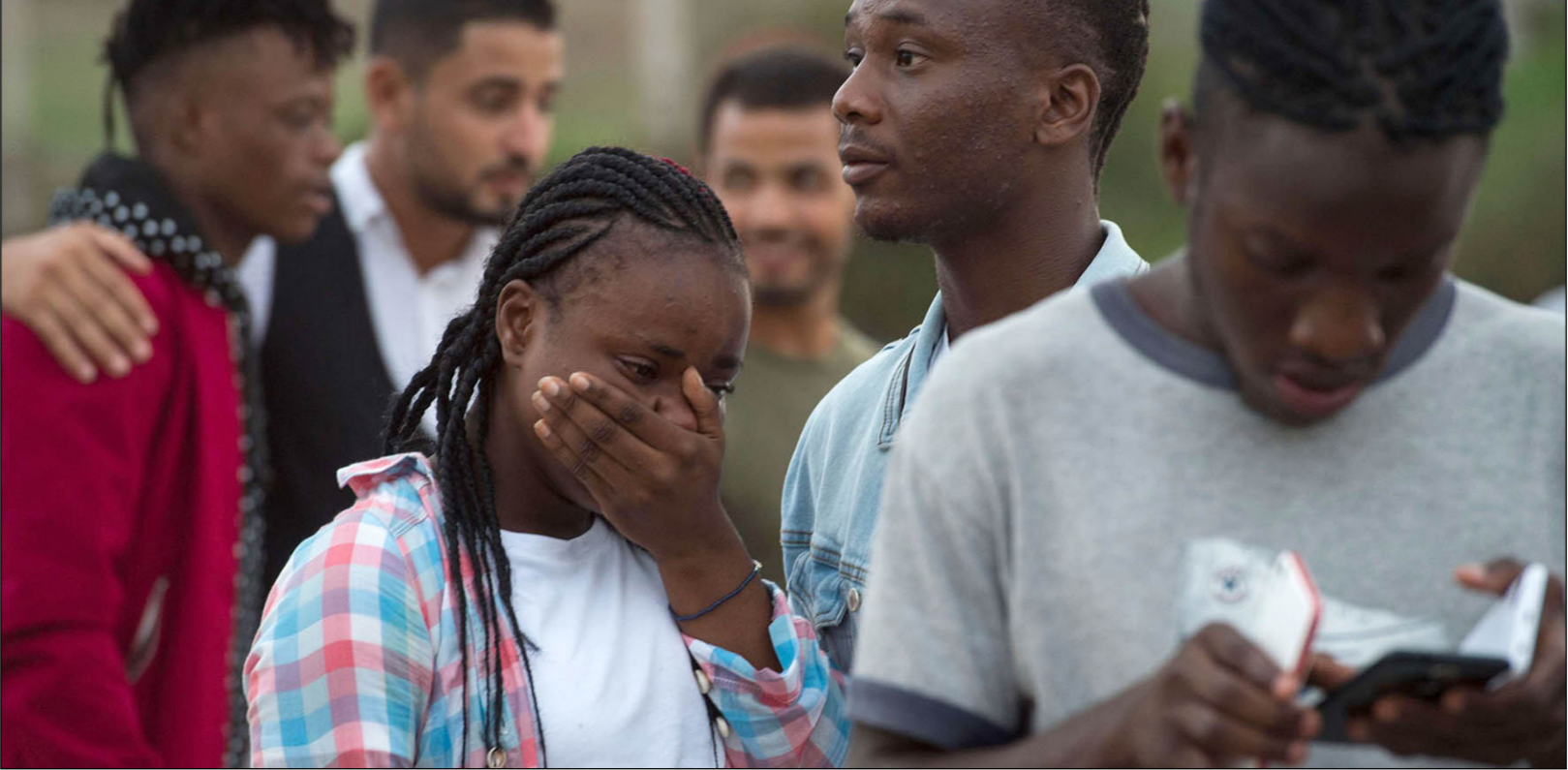
مهاجرة أفريقية أثناء مغادرتها مركزاً للاجئين في طريقها إلى ملقا الإسبانية

بأسلاك شائكة، ونددت منظمات حقوقية إسبانية بقرار إعادة تسليم 50 مهاجراً إفريقياً من أصل 209، للسلطات الأمنية المغربية كانوا اقتحموا السياج الحديدي المحيط بتغر مليلية، وقالت إن المغرب ليس بلداً آمناً، كونه ينتهك مبادئ حقوق الإنسان وحقوق المرشحين للهجرة غير النظامية».