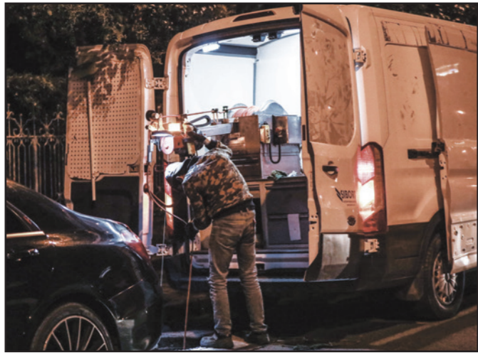
عمال يقومون بالتحقق من شبكة الصرف الصحي للقنصلية السعودية في إسطنبول أمس

في مقتل الصحافي السعودي جمال خاشقجي، وقال ماتيس إنه التقى الجبير خلال مؤتمر في البحرين، السبت، ويحثا مقتل خاشقجي، وأضاف قائلا لمجموعة صغيرة من الصحافيين المرافقين في رحلته لبراغ «نحننا الأمر، عما تعلمون تحدثنا عن الشيء ونفسه وهو الحاجة إلى تحقيق شفاف وشامل وكامل» (تفاصيل ص 10 و رأي القدس ص 23)