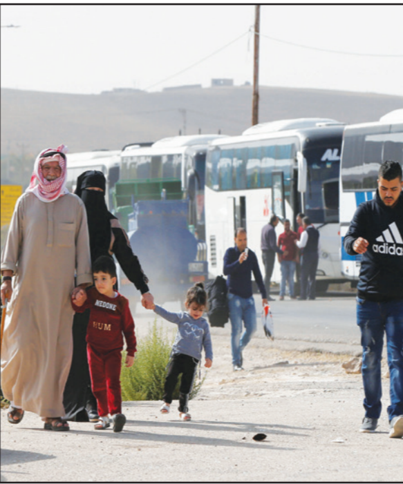
مسافرون إلى سوريا من الأردن عند معبر جابر الحدودي أمس (تفاصيل ص 4)

منبج، ورفض التصريح عن اسمه، لـ «القدس العربي» إن «تركيا تفكر بشن هجوم على تل أبيب وليس على منبج في المرحلة الراهنة»، واستند القيادي في المجلس العسكري التابع لـ «قسد» إلى ما قال أنها «معطيات عدة تشير إلى عمل عسكري يستهدف مدينة تل أبيب، يبدو قريبا جدا بعد تصريحات الرئيس التركي الأخيرة بنقل المعرفة إلى شرقي الفرات، وما تلى الأخيرة من حركة عسكرية واسعة شملت تعزيزات عسكرية تركية كبيرة مقابل البوابة الحدودية لمنبج تل أبيب الحدودي».