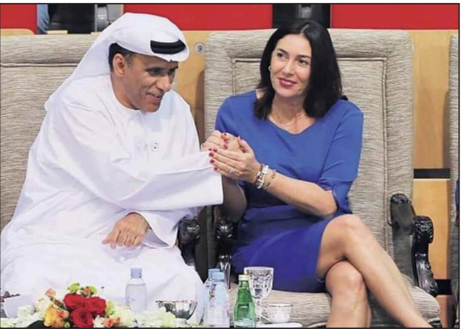
رئيس جمعية رياضة الجودو الإماراتي يصافح بحرارة وزيرة الرياضة والثقافة الإسرائيلية بعد فوز فريقها أمس