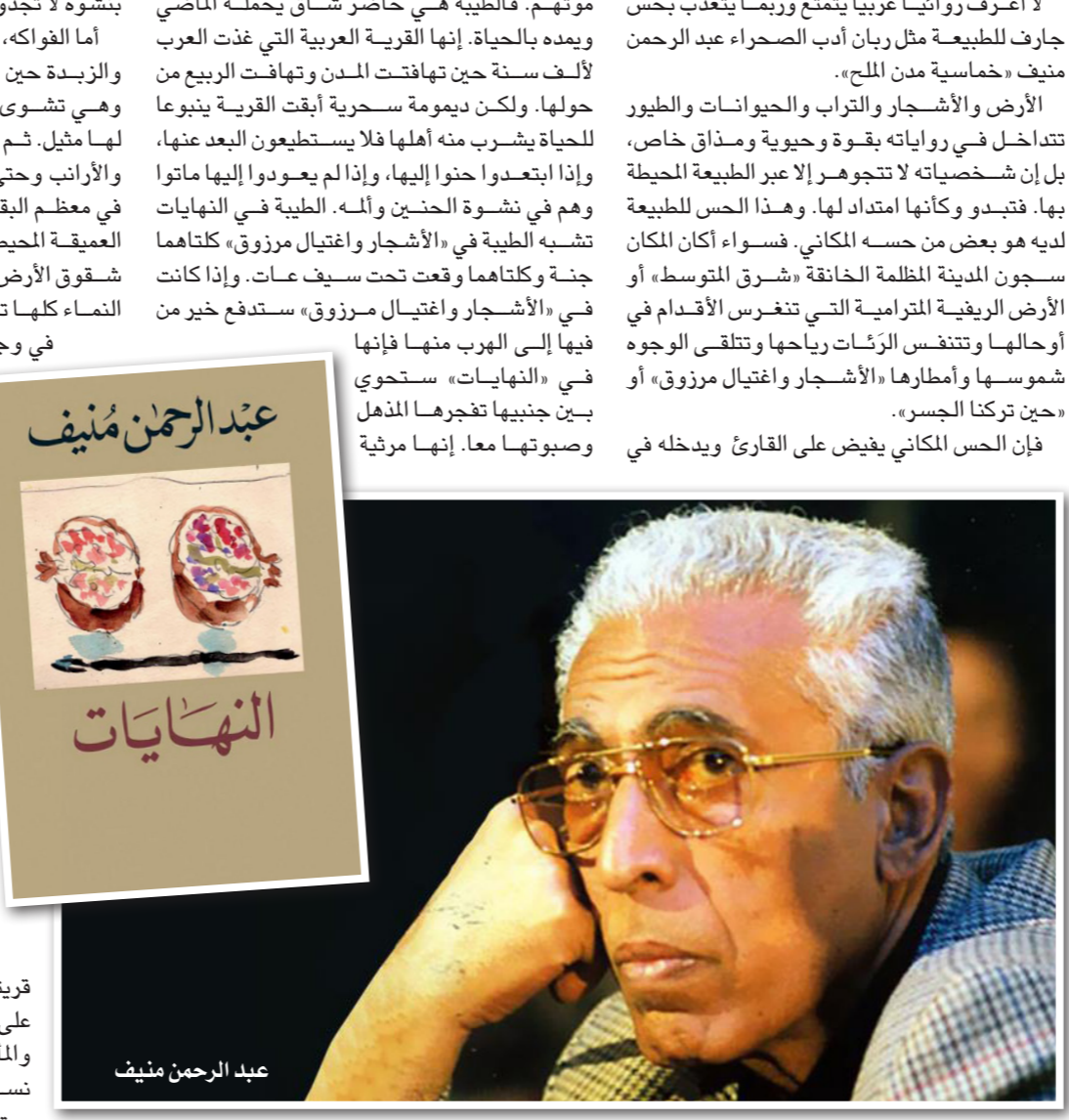
عبد الرحمن منيف

موتهم. فالطبية هي حاضر شاق يحمل الماضي ويمده بالحياة. إنها القرية العربية التي غدت العرب لألف سنة حين تهافتت المدن وتهافت الربيع من حولها. ولكن ديمومة سحرية أقيمت القرية ينبوعا للحياة يشرب منه أهلها فلا يستطيعون البعد عنها، وإذا ابتعدوا حنوا إليها، وإذا لم يعودوا إليها ماتوا وهم في نشوة الحنين والمه. الطبية في النهايات تشبه الطبية في «الأشجار واغتيال مرزوق» كلتاهما جنة وكلتاهما وقعت تحت سيف عات. وإذا كانت في «الأشجار واغتيال مرزوق» ستدفع خبير من فيها إلى الهرب منها فإنها في «النهايات» ستجوي مستوحى بين جنبها تجرهم المذمل وصوبتها معا. إنها مرتبة