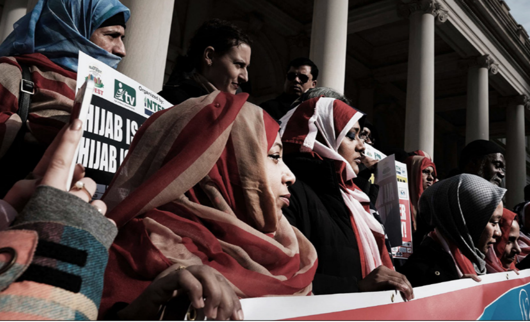
مسلمات خلال إحدى التظاهرات في أمريكا

تدافع عدد كبير من الناخبين المسلمين والعرب إلى صناديق الاقتراع في الانتخابات النصفية في حين شهد المشهد السياسي الأمريكي زيادة غير متوقعة في عدد المرشحين المسلمين الأمريكيين في الانتخابات النصفية، التي ينظر إليها على أنها اختبار لسياسات الرئيس الأمريكي، دونالد ترامب المثيرة للجدل من المواقف المعادية للهجرة إلى الأجنحة السياسية الخارجية، وتنافس ما يقارب من 100 مرشح مسلم، أي ستة أضعاف مما كانوا عليه في انتخابات عام 2016، على مقاعد مهمة في وقت ازداد فيه الخوف من الإسلام بشكل كبير في ظل رئاسة ترامب، التي دعت إلى حظر السفر من بعض الدول الإسلامية للولايات المتحدة.