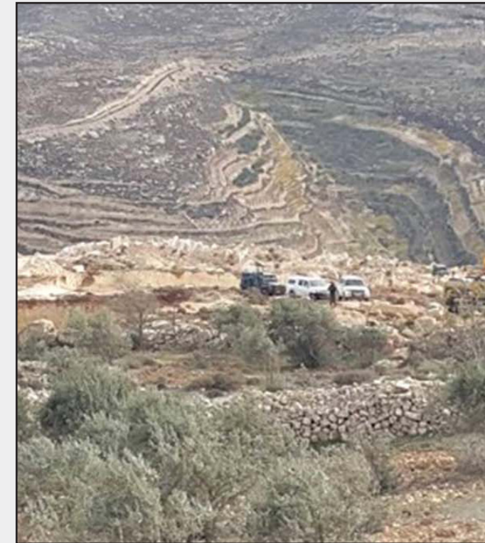
أراضي فلسطينية استولت عليها قوات الاحتلال

وشن جيش الاحتلال فجر أمس حملة مدممات واعتقالات طالت 17 فلسطينياً في الضفة الغربية والقدس. وقالت مصادر محلية إن من بين الأسرى 4 صبية مقدسين، حيث جرى اعتقالهم بعد اقتحام منازلهم في بلدة سلوان جنوب المسجد الأقصى، وحي جبل الزيتون بالطور وسقط مدينة العاصمة المحتلة، و5 أسرى محررين من جنين. وفي رام الله اعتقل الاحتلال شاباً بعد مدممة منزله في بلدة سلواد شرق رام الله، كما صادر مبلغاً مالياً. وأفادت مصادر محلية أنه وأثناء عمليات المداومة والتفتيش التي كان يجريها جيش الاحتلال في منازل الفلسطينيين في كل من قلقيلية وجنين اندلعت مواجهات مع الشبان، ما أدى إلى إصابة عدد منهم بحالات اختناق نتيجة الغاز المسيل للدموع. في تلك الأثناء استولت سلطات الاحتلال الإسرائيلي أمس على 155 دونماً من أراضي قرية اللبن الغربي في محافظة رام الله والبيرة. وقالت مصادر محلية في القرية إن سلطات الاحتلال وزعت قراراً يقضي بالاستيلاء على ثلاث قطع من الأراضي تعود لمواطنين في القرية بهدف شق طريق التقافي لمستوطنة «بيت زرة» المقامة على أراضي اللبن الغربي. وليس بعيداً عن المكان منعت قوات الاحتلال الإسرائيلي، صباح أمس، طلبة إحدى المدارس في قرية اللبن الشرقية، من التوجه إلى مقاعد الدراسة. وأفادت مصادر محلية بوجود مئذنة لقوات الاحتلال على مدخل القرية، الذين أجبروا الطلبة على العودة بعد أن منعهم من الوصول إلى مدرستهم الواقعة على الطريق