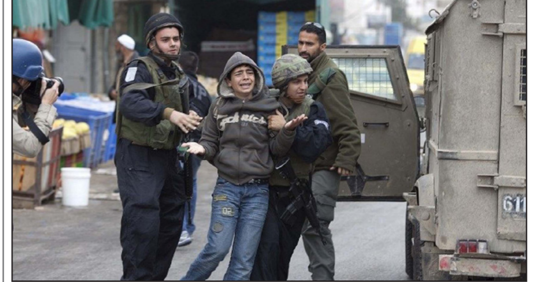
صورة أرشيفية لجنود الاحتلال وهم يعتقلون صبياً فلسطينياً

وتفتيش وقمع بحق الأسرى الأطفال في قسيميا 3 و4، وقامت بالاعتداء عليهم، من غرفهم وتخريب أغراضهم الشخصية. وأكدت أن إدارة السجن تواصل منذ أسبوعين حرمان الأسرى القاصرين من أدوات الطبخ وتحضير الطعام، إضافة إلى حرمانهم من التواصل مع العالم الخارجي. وأشارت الهيئة إلى أن عدداً كبيراً من هؤلاء الأسرى الأطفال محرومون من زيارة الأهل، وآخرين من لقاء المحامين. وحذرت الهيئة من الهجمة الشرسة التي تنفذها «وحدات القمع الإسرائيلية» بأوامر من جهاز المخابرات العامة