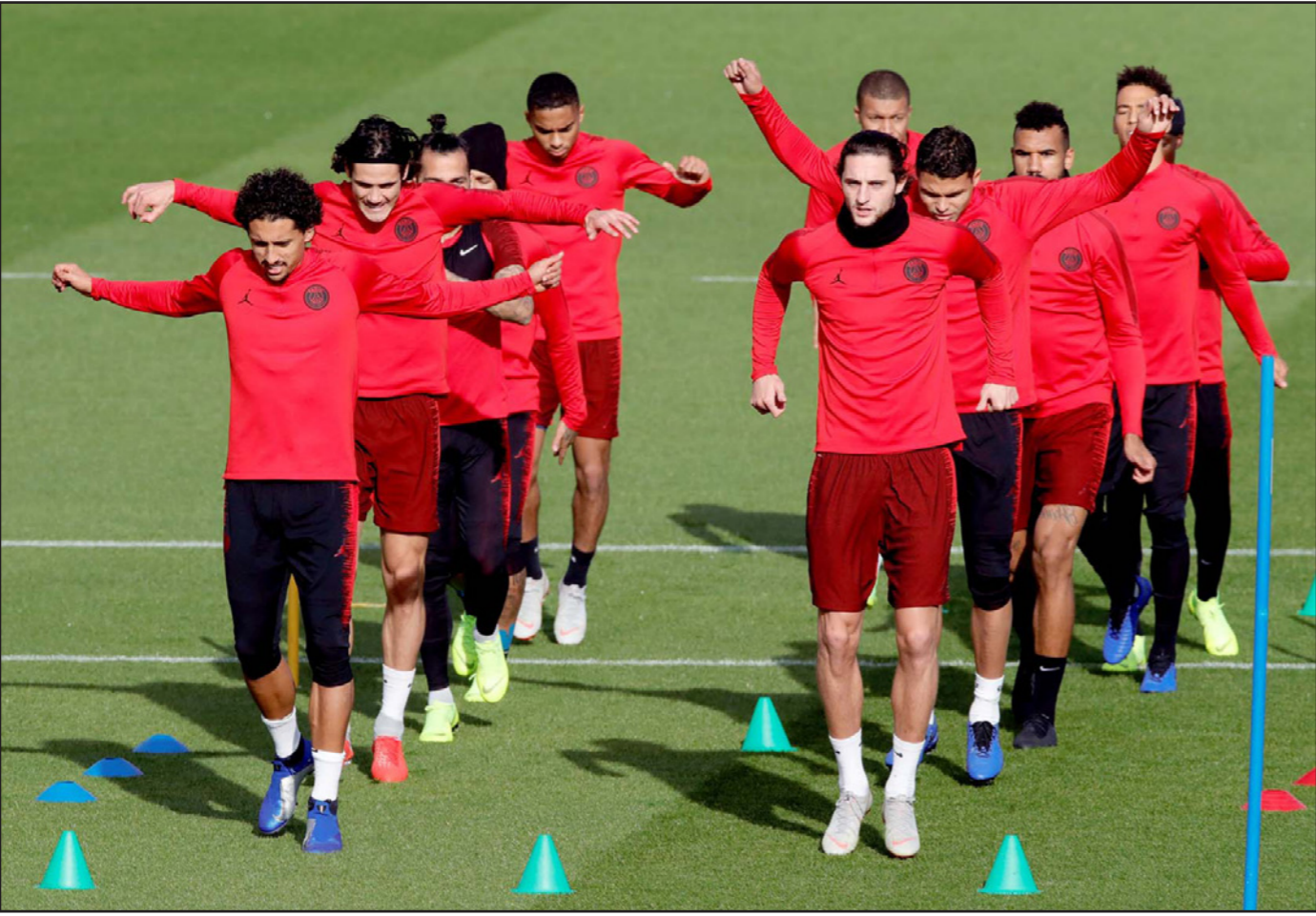
لاعب باريس سان جيرمان يخوضون الحصة التدريبية الأخيرة قبل اللقاء الحاسم أمام نابولي الليلة

الثاني بالفوز في مباراة اليوم لكن بشرط أن يخسر هوفنهايم الألماني مباراته أمام ضيفه ليون الفرنسي. وفي المجموعة الرابعة، يحل لوكوموتيف موسكو ضيفا على بورتو البرتغالي بينما يستضيف شاكه غالمه سراي.