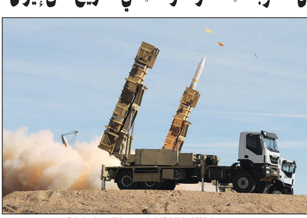
صورة وزعتها وكالة الأنباء الخلية لناورات تضمنت إطلاق صواريخ إيرانية

لندن - «القدس العربي»: أعلنت الولايات المتحدة الأمريكية فرض الحزمة الثانية من العقوبات على إيران، وتشمل أكثر من 700 كيان وشخصية إيرانية، لإجبار طهران على التخلي عن برنامجها النووي والصاروخي، ولتقليص نفوذها الإقليمي في المنطقة.