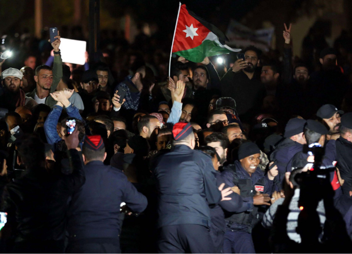
تصادم حراك «معناش» مع القوى الأمنية

وتطرف، في الشعارات والهتافات التي تعدي على المرجعيات. السلطات أيضاً منعت تقليداً غربياً يقضي بـ «النوم في الشارع» لإرباك الجميع، كما قمع أي محاولة لتمديد ولاية الحراك في مناطق جغرافية مفتوحة وغير محصورة. تلك باختصار قواعد الحراك الشعبي الجديدة التي قائلها ضمناً، وبكل اللهجات المحلية، المؤسسة الأمنية وهي تعيد صياغة معادلة المسوح وغير المسوح في التظاهر والاحتجاج، خصوصاً في قلب العاصمة عمان. نفر قليل من الناشطاء التقطت الرسالة وتعامل معها، والأغلبية انقسمت إلى مجموعتين: الأولى تلمظ ضد حكومة الرزاز وتتهمها وتذكرها بالخشونة والعسف الأمني في فرض مشاريع مثل «النهضة الوطنية».