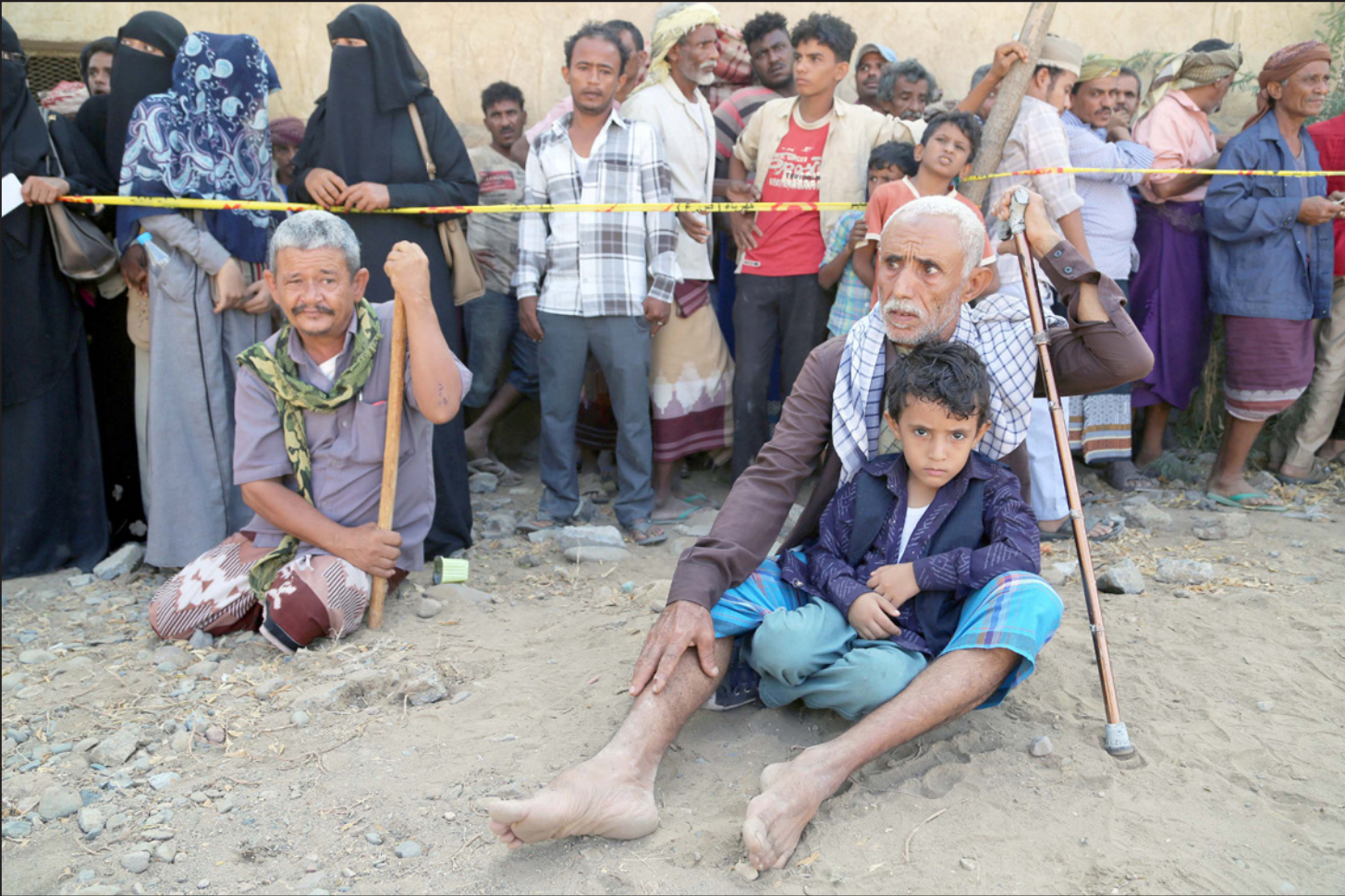
يمنيون ينتظرون المساعدات الإنسانية