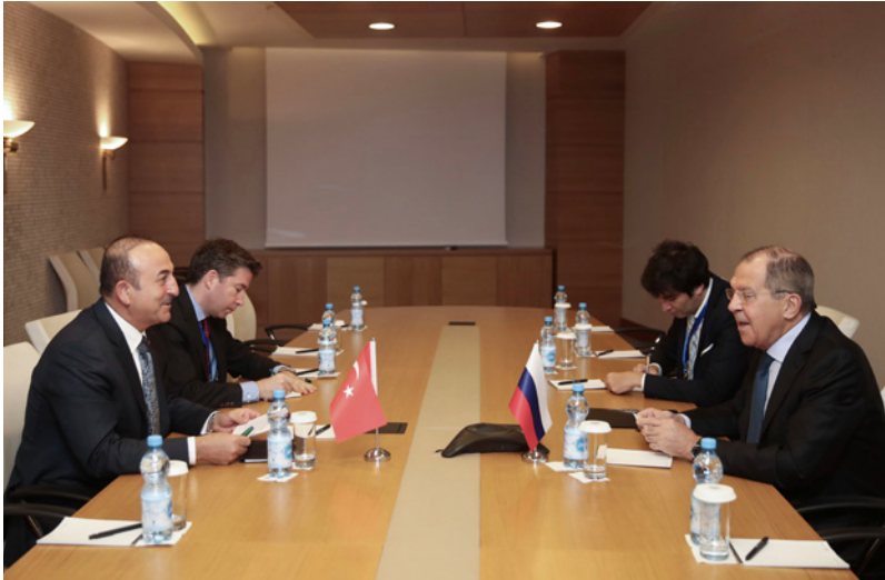
اجتماع مولود تشاوش أوغلو مع نظيره الروسي سيرغي لافروف أمس