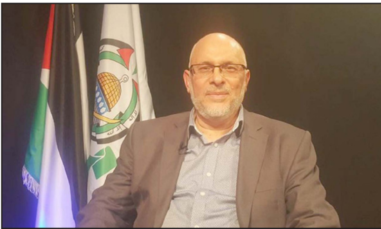
رئيس حماس في الخارج ماهر صلاح

ويحذر من أن ذلك «كلف لثما بجولة عنف في غلاف غزة مرة كل أربع سنوات أو موجات «إرهاب» دورية في الضفة، فالهم عدم الحسم، وعدم ضم السفينة، وعدم العودة إلى طاولة المفاوضات بأي حال». وبلهجة لا تخلو من السخرية يقول محرر «معاريف» بن كسبيت أيضا إنه «عندما بدأ نتنياهو بالاستسقاء بالظهر الزائف كوزير للأمن، والتخطية الإعلامية لحوادثه، واللباس غير الرسمي، والصور برفقة مقاتلي كوماندوز كانوا عارضو أزياء، والتصريحات القتالية والى جانبته جنراتا، كل