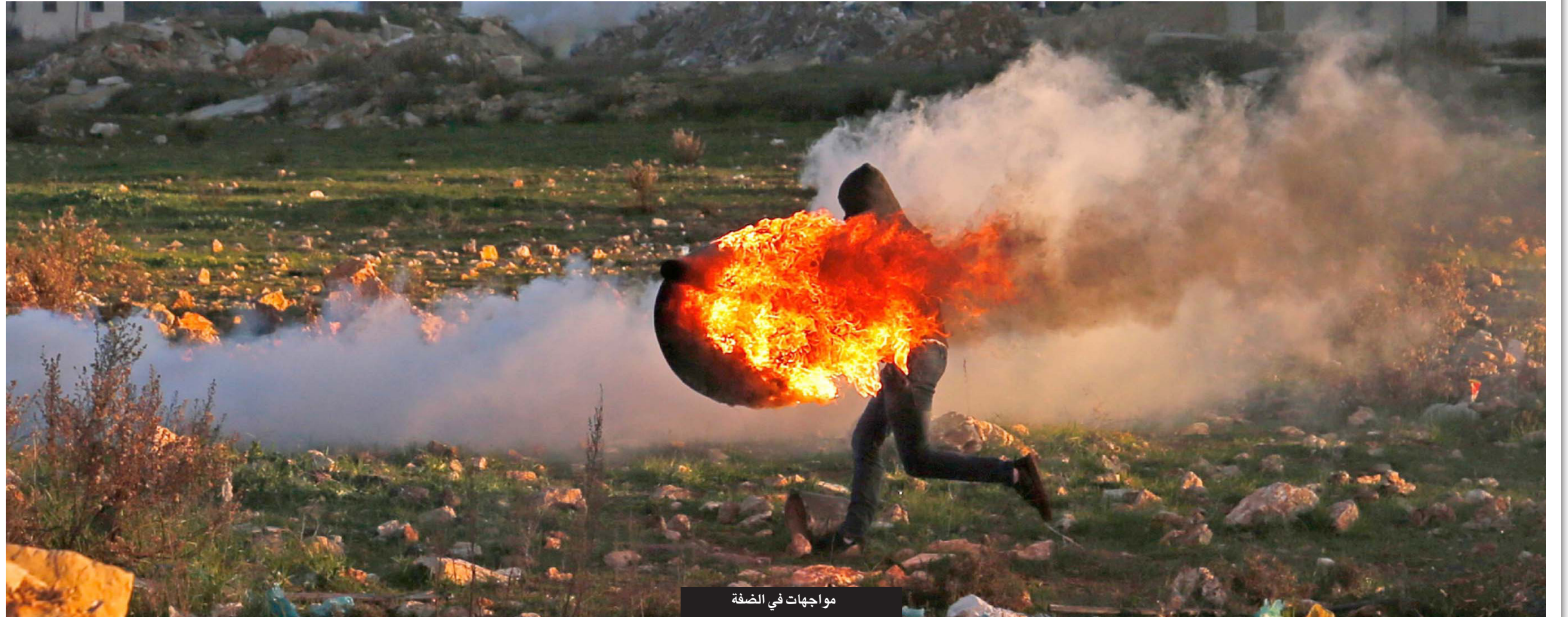
مواجهات في الضفة