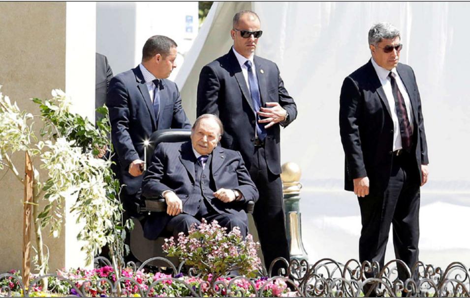
مرافقو بوتفليقة يجرون الكرسي المتحرك

أطراف جديدة تدعو إلى ما يسمى الاستمرارية، فضلاً عن ظهور أطراف تدعو صراحة إلى تأجيل الانتخابات الرئاسية التي من المقرر إجراؤها في الربع المقبل، وأخرى لا تجد حرجا في التأجيل، والغريب هو أن هذا الرأي عبرت عنه أحزاب تنتمي إلى التحالف الرئاسي ومحسوبة على الموالاة، الأکید أن هناك حالة من الضبابية تسبب على المشهد، فقيل حوالى أربعة أشهر على موعد الانتخابات الرئاسية وقيل أيام من استدعاء الهيئة الناخبة لا شيء يظهر في الأفق، ومن الصعب القول إن كانت الانتخابات ستجرى في موعدها المحدد، ومن الصعب كذلك التأكيد على أن الرئيس بوتفليقة سيترشح إلى ولاية رئاسية خامسة، الجميع يشعر أن هناك شيئا يطبع في الكواليس، وأن هناك صراعات صامتة وأخرى تأخذ أشكال تصفية حسابات، لكن ليس من السهل معرفة ما هو هذا الشيء، لأنه حتى سيناريو تأجيل الانتخابات أو تمديد الولاية الحالية للرئيس بوتفليقة صعب التحقيق قانونيا ودستوريا، إلا إذا تم التعامل مع الأمر بشريعة أو ضرورة الأمر الواقع بعيدا عن القانون والدستور.