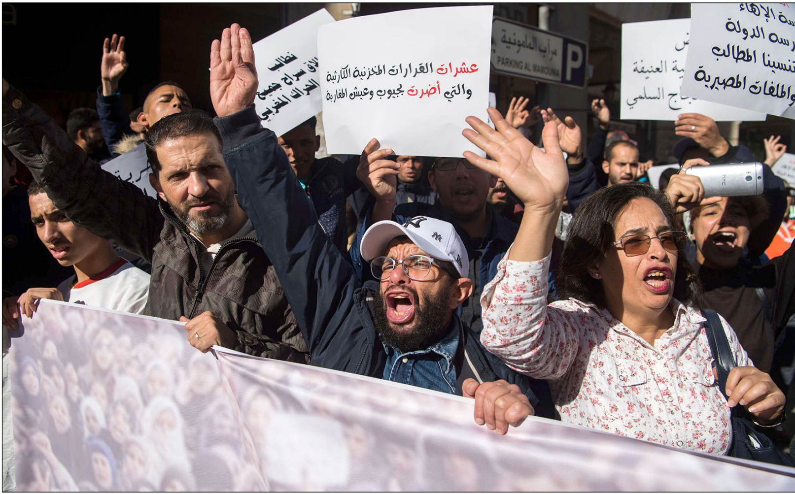
جانب من مظاهرة حقوقية في المغرب

مشيراً إلى أن أخطر ما في الأمر في تطبيق هذه التوصيات هو أن الدستور المغربي ينص على تنفيذ التوصيات الوجيهة، كان هناك توصيات وجيهة وغير وجيهة، ومشدداً على أن هذه الالتزامات صادقة عليها الملك ويجب أن تنفذ. ونقل موقع «اليوم 24»، عن بوغنيور، أن الدولة مطالبة بالاعتذار العلني لضحايا الانتهاكات الجسيمة، والمصادقة على نظام روما الأساسي للمحكمة الجنائية الدولية، بالإضافة إلى الكشف عن ضحايا الاختفاء القسري.