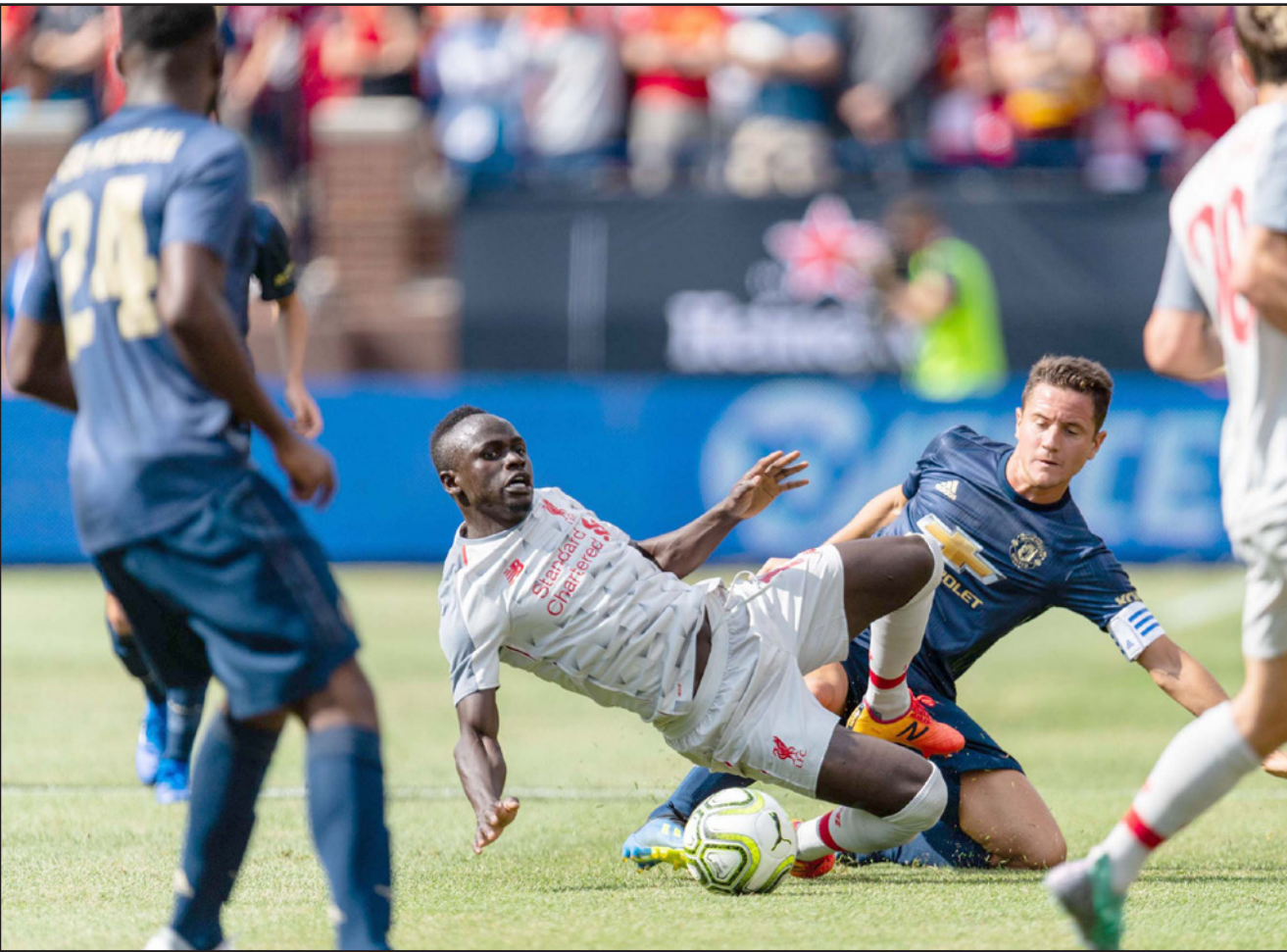
صراع ليفربول ومانشستر يونايتد سيحدث في كلاسيكو الكرة الانكليزية