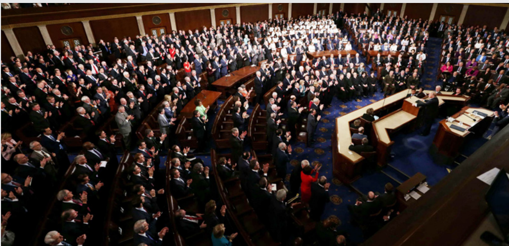
ترامب في كلمة له في الكونغرس

واشنطن لكنهم ضيعوها - وهي فرصة ضائعة قد يندمن عليها عندما يبدا الكونغرس ومجلس النواب بقيادة ديمقراطية عمله ومضمونة فقد كان لدى السعوديين فرصة لكسب حسن نية