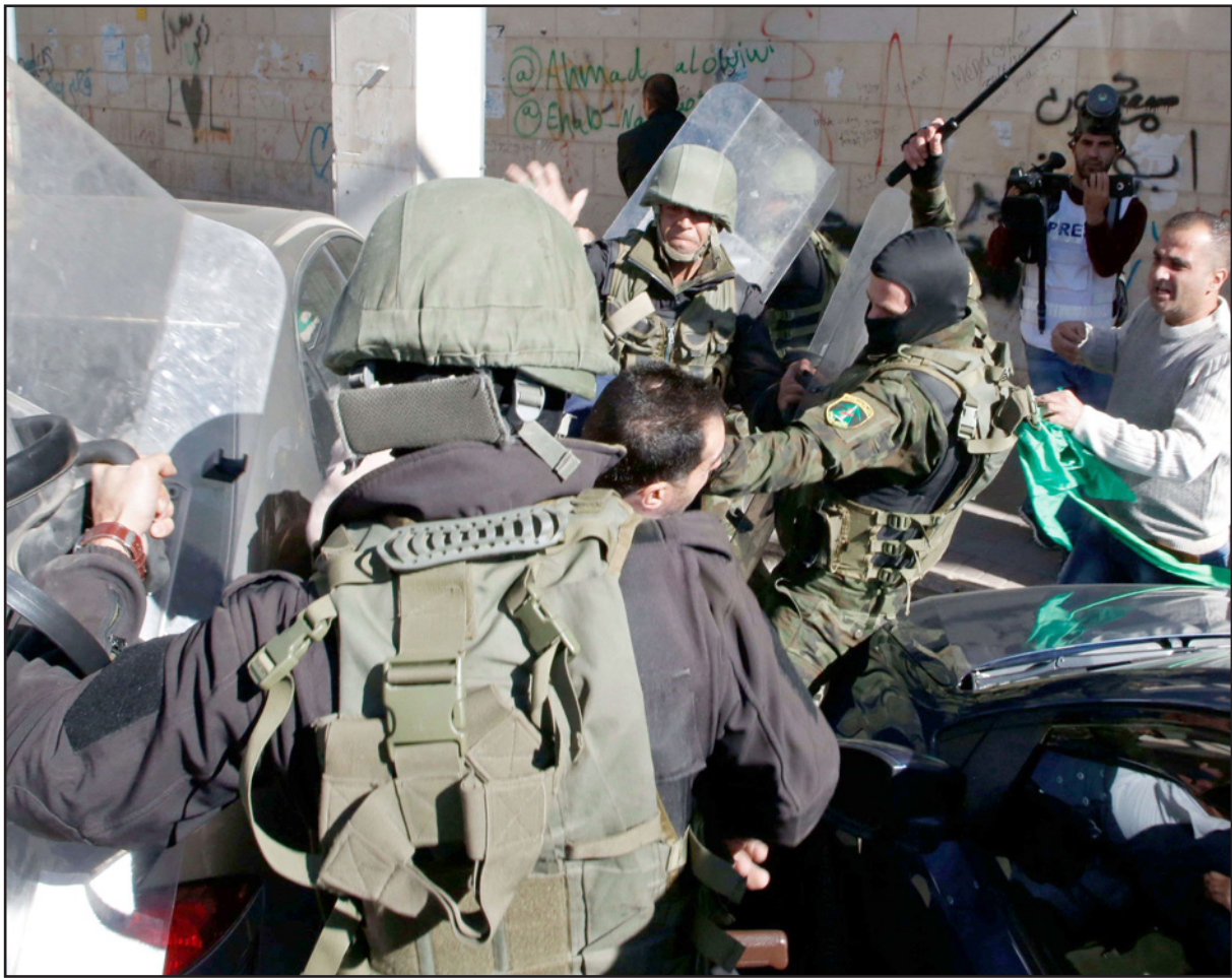
مواجهات بين الشرطة الفلسطينية ومؤيدي حماس في الخليل

سليمان، في قاعة قبة القس في حرس الثورة، سيلقي صلاحه في العام 2019. إسرائيل يجب أن تفتخر أن إيران ستحاول العمل ضدها في جبهة أخرى، في هذه الأثناء يبدو أن ذلك سيحدث في لبنان، بالأساس حول مصنع التخصيب. إذا فكرت طهران في المستقبل لديها سبب للقيام بعمل بصورة هجومية ضد إسرائيل بسبب الجهود الأمريكية ضد المشروع النووي والصاروخى لها أو لأسباب أخرى – يصعب لمقاومة هذا صفوف حزب الله إغفاء من المشاركة، فلما غلقت على مواجهات مع إسرائيل في سوريا هذه السنة، على ضوء المبادرات التي استثمرتها إيران في لبنان، سيأتي يوم يحل فيه الأمريكيون من رئيس حزب الله، حسن نصر الله، في يقدم لهم عوائد أكثر على أموالهم. مصدر كبير في جهاز الأمن قسرو مؤخرًا في لقاء مع نظرائه الأوروبيين أنه «سيكون من الصعب الحفاظ على الهدوء في لبنان لسنة أخرى. نحن سنحاول تحديد الأنفاق وإخراجها من العادلة، لكن مشروع «التدقيق» في مشكلة بالنسبة لنا». وأشار المصدر إلى أن «إيران تحاول وضع صواريخ في العراق وفي سوريا، إضافة إلى الصواريخ التي روثتها لحزب الله في لبنان والمنظمات الفلسطينية في غزة، بالنسبة لنا هذا كبير جدًا، يجب على الإسرائيليين أن يخرجوا كلياً من سوريا، لا يكفي إبعادهم 60 - 80 كم عن الحدود مع إسرائيل».