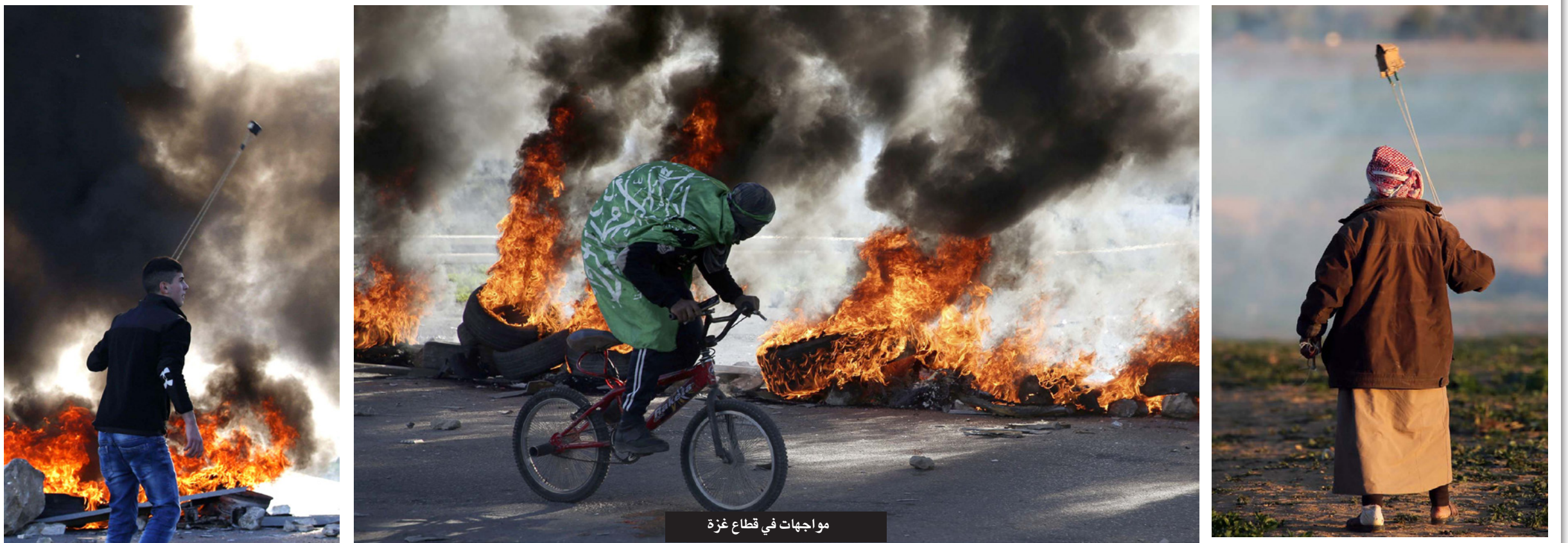
مواجهات في قطاع غزة