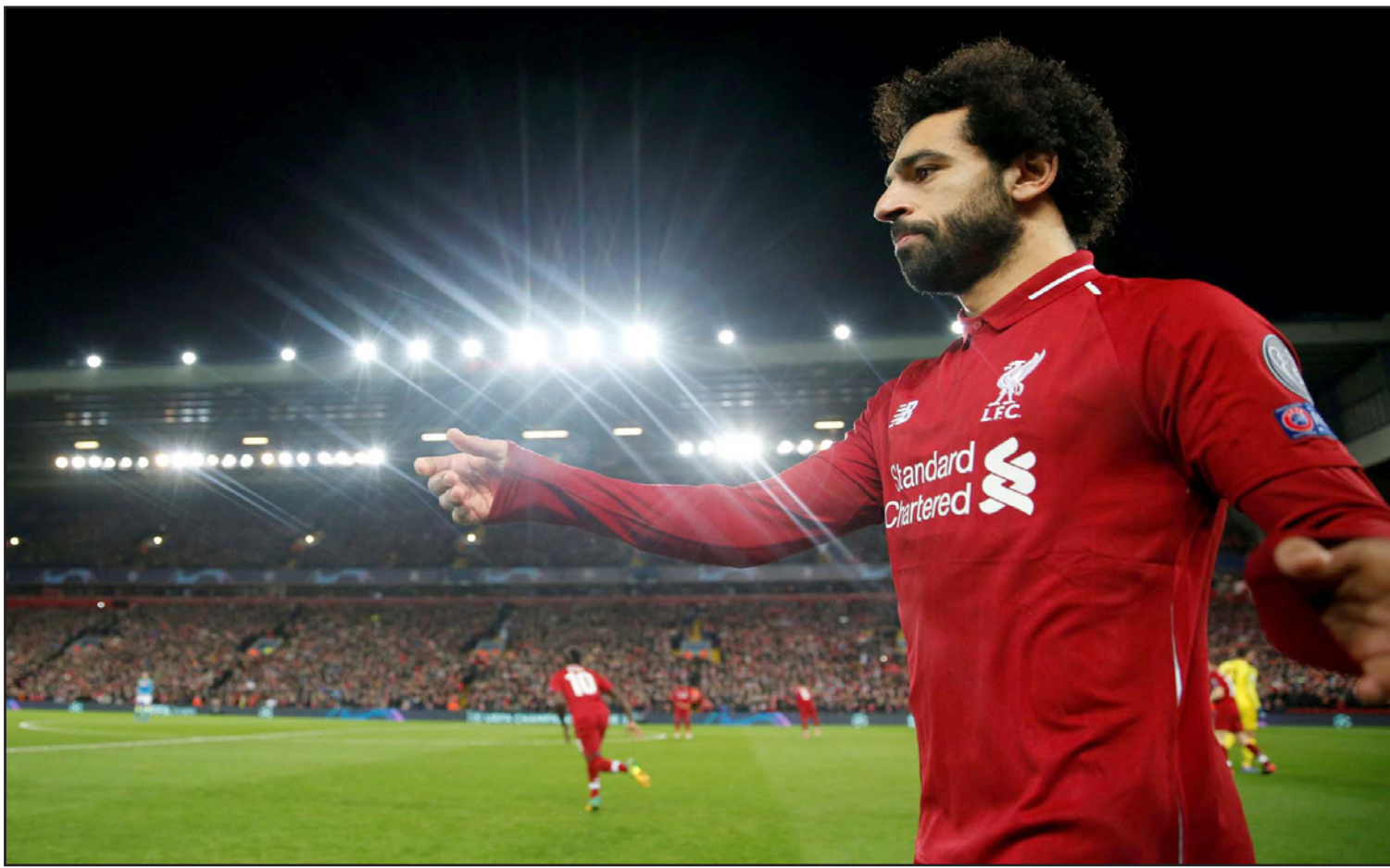
صلاح توج أفضل لاعب للسنة الثانية على التوالي باختيار «بي بي سي»

■ لندن - د ب أ: حقق النجم الدولي المصري محمد صلاح لاعب ليفربول الإنكليزي، إنجازاً جديداً يضاف إلى مسيرته الحافلة بالجوائز والألقاب الفردية، عقب فوزه بجائزة هيئة الإذاعة البريطانية (بي بي سي) كأفضل لاعب أفريقي لعام 2018.