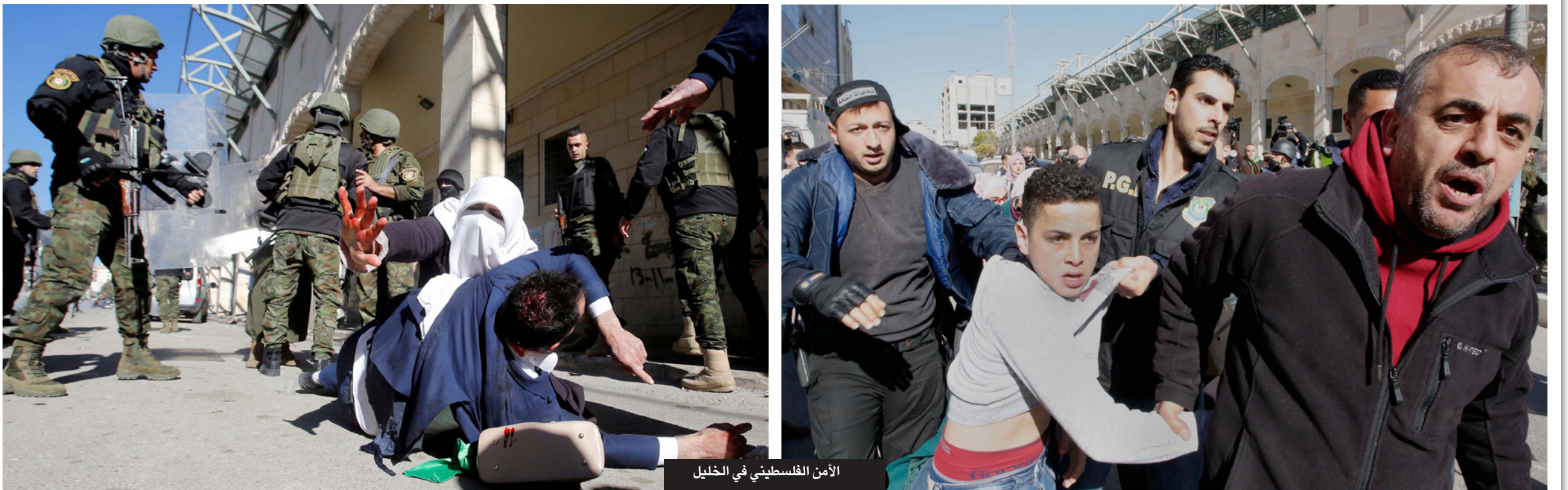
الأمن الفلسطيني في الخليل