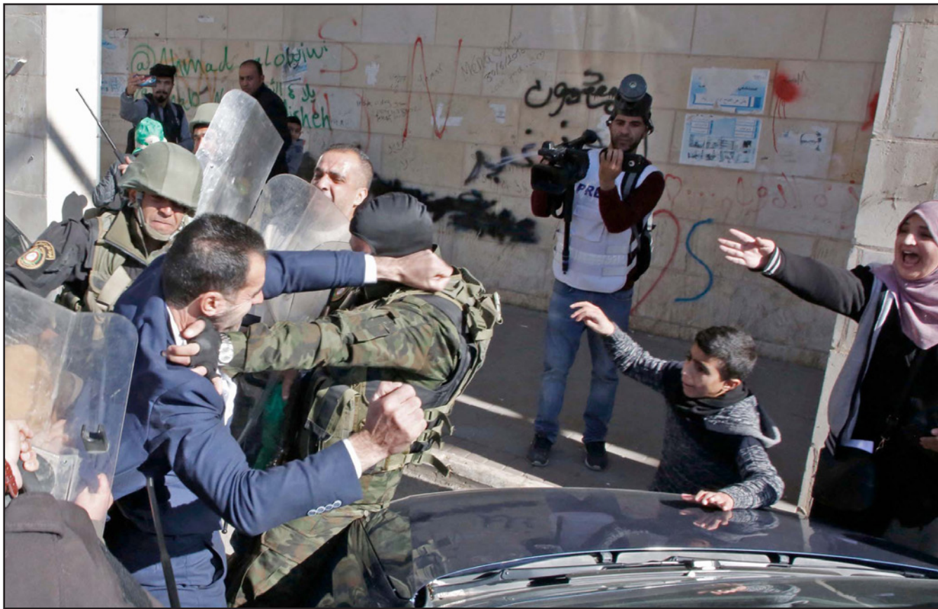
الأمن الفلسطيني يتعامل بعنف مع متظاهرين في الخليل في ذكرى انطلاق حماس

■ غزة - د ب أ: قمع رجال أمن السلطة الفلسطينية تظاهرات نظمها مؤيدو حماس أمس الجمعة في الضفة الغربية، بمناسبة الذكرى السنوية 31 لانطلاقة الحركة.