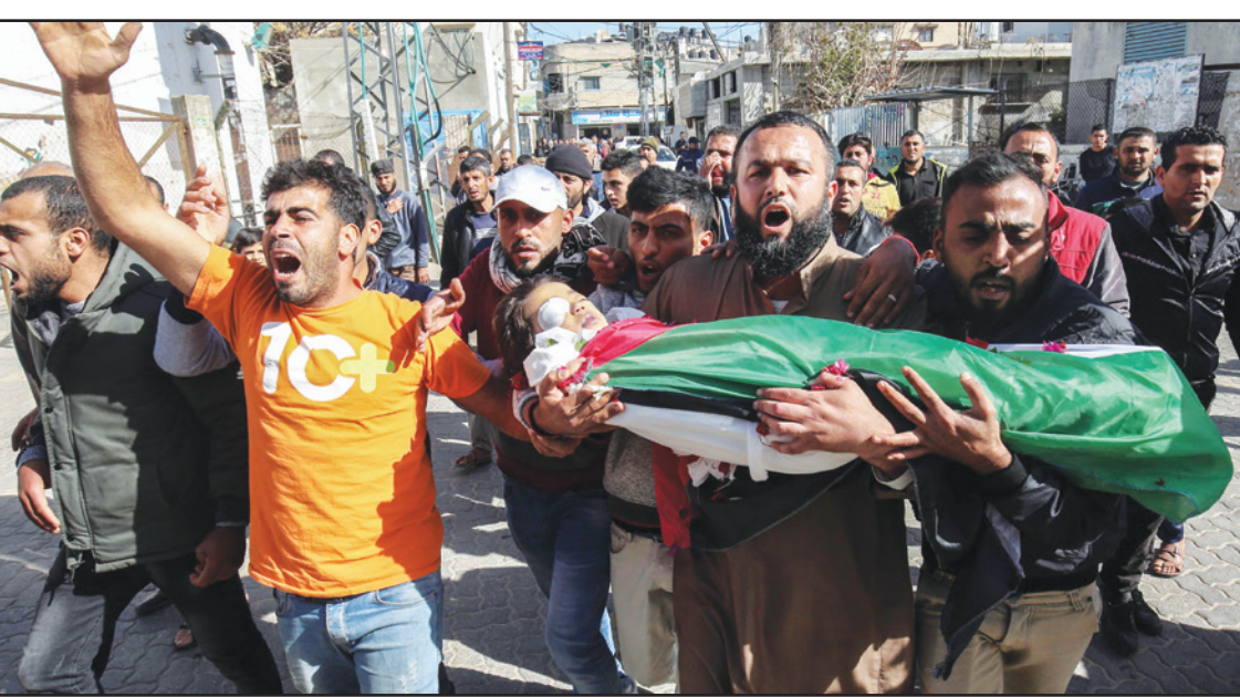
فلسطينيون يحملون صبيبا أصابته قوات الاحتلال الإسرائيلي في خان يونس جنوب غزة أمس

رام الله - غزة - «القدس العربي» من أشرف الهور: تتسابق سلطات ساسية إسرائيلية في حملات الترهيب ضد الفلسطينيين والعدوات للانتقام منهم ومن قاداتهم، فقال عضو الكنيست أورن حازان (ليكود) إنه ينبغي تصفية الرئيس محمود عباس ونائبه محمود العالول. حزان وهو نائب رئيس الكنيست، الذي كان يتحدث للجنة الإسرائيلية الأولى، حمل على قيادة السلطة الفلسطينية، داعيا للزيت من القوة من أجل وقف «الإرهاب» واستعادة إسرائيل قوة الردع.