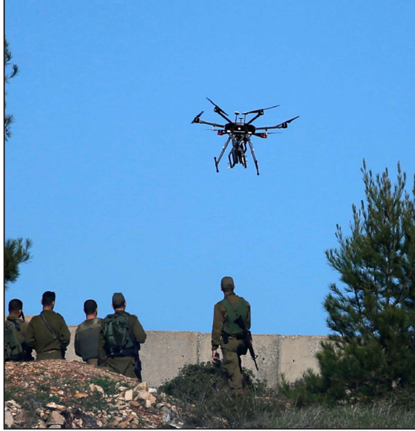
طائرة من غير طيار تطلق قنابل غاز

وكان وفد أممي مصري قنداز مدينة رام الله مساء أول من أمس الخميس، وعقد اجتماعاً مع الرئيس عباس وكبار مساعديه، ونقل إليه رسالة من الرئيس عبد الفتاح السيسي ورئيس جهاز المخابرات اللواء عباس كامل، وأكد قيام مصر ببذل كافة الجهود لدعم الاستقرار والهدوء في المناطق الفلسطينية كافة.