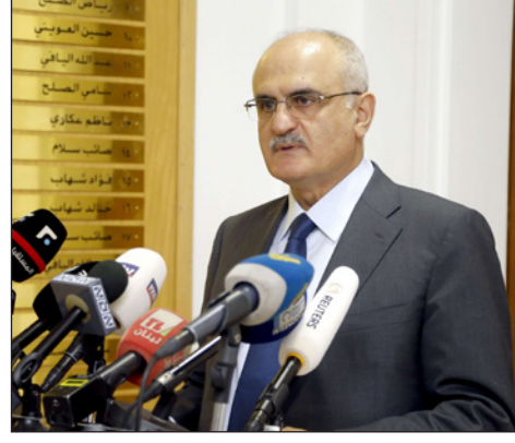
وزير المالية اللبناني علي حسن خليل

■ بيروت – رويترز: قال رياض سلامة، حاكم (محافظ) مصرف لبنان المركزي في مقابلة أمس إن البنك سيستعد لعملياته المالية في 2019، مضيفاً أن ارتفاع أسعار الفائدة العالمية يمثل مبعث قلق لصانعي السياسات في البلد المقل بالديون. وواجه لبنان، الذي يعاني من ثالث أعلى نسبة في العالم للديون إلى الناتج المحلي الإجمالي ومن ركود اقتصادي، ضغوطاً متزايدة في الأشهر القليلة الماضية وسيط مازق سياسي يمنع تشكيل حكومة منذ الانتخابات التي أجريت قبل حوالي سبعة أشهر. وعلى مدى الأشهر الثلاثة المنقضية، نفذ البنك المركزي صفياً متنوعاً من الهندسة والعمليات المالية لدعم احتياطياته والحفاظ على استقرار سعر العملة الوطنية (الليرة). وقال سلامة «العمليات المالية الحالية التي تجريها كبنك مركزي كافية لتحقيق أهداف البنك المركزي من حيث جذب أصول مسالمة»، مضيفاً أن البنك سيواصل تفحص الصيغة في 2019، وأضاف «إذا نظرت إلى الاثني عشر شهرا المنقضية، وعلى الرغم من جميع التحديات والاضطراب، فإن ميزانيتنا العمومية كانت مستقرة...»