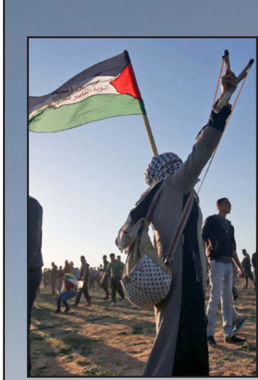
مواجهات قطاع غزة

وذكرت تقارير صحافية إسرائيلية، أن نتنياهو أبلغ حماس عبر وسيط، بأن إسرائيل ستعمل ضد الحركة، في حال استمرارها بتنفيذ العمليات الأمنية في الضفة الغربية. ونقلت