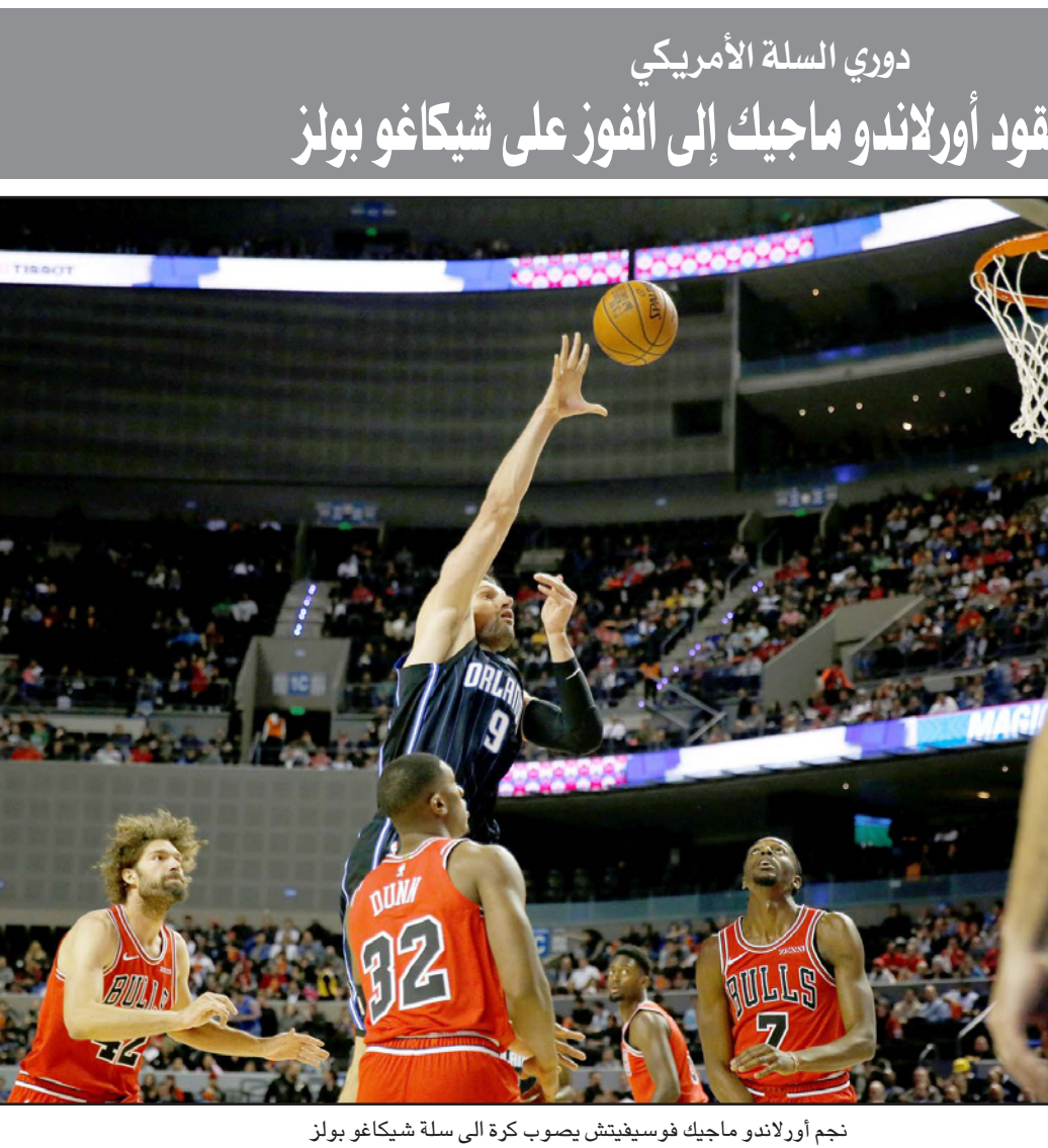
نجم أورلاندو ماجيك فوسيفيتش يصبو كرة إلى سلة شيكاغو بولز

■ لندن - رويترز: تواجه مساعي لندن لوصلة استضافة البطولة الختامية لوسم تنس الرجال بعد عام 2020 منافسة من أربع مدن أخرى. وقال اتحاد اللاعبين المحترفين إن مدن مانشستر وستغافورة وطوكيو وتورينو ستخضع للتقييم بجانب لندن في المرحلة الأخيرة من عملية التقدم لاستضافة البطولة في الفترة من 2021 إلى 2025، ويستضيف استاد «أو تو» البطولة منذ 2009، لكن رغم شعبية الملعب بين الجماهير واللاعبين، فإن اتحاد اللاعبين المحترفين أعلن في أغسطس/آب أنها دعت مدن مستضيفة محتملة لتقديم عروض. وقال كريست كيرمود الرئيس التنفيذي لاتحاد اللاعبين المحترفين في بيان «مستوى الاهتمام الذي تلقيناه من كافة أنحاء العالم خلال عملية التقدم بالعروض يعكس الإرث الذي لهذه البطولة الغريدة». وأبدت أكثر من 40 مدينة حول العالم اهتماماً باستضافة البطولة وفق اتحاد اللاعبين المحترفين، وسيتم إعلان العرض الفائز في مارس/آذار من العام المقبل. وحظيت البطولة بمجموعة مختلفة من الأسماء والمدن المستضيفة منذ انطلاقها في طوكيو عام 1970، بما في ذلك فترة استمرت 13 عاماً في نيويورك وست سنوات في فرانكفورت إضافة لقطرات أخرى في هانوفر ولشبونة وسيدني وهيوستن وشنغهاي. وتضم البطولة أفضل ثمانية لاعبين في التصنيف العالمي وقدمت جائزة مالية قيمتها 8.5 مليون دولار هذا العام، حين حقق الكسندر زفيريف فوزاً مفاجئاً على نوناف ديوكوفيتش في النهائي ليجرز للبطء.