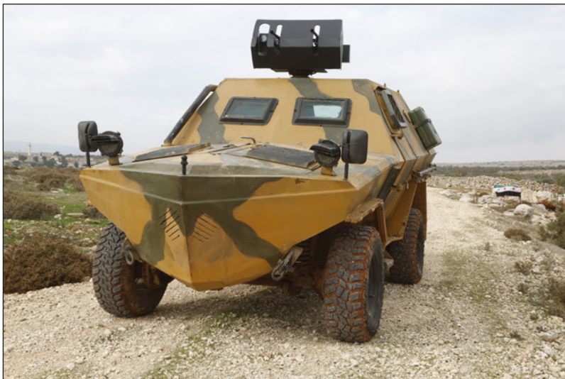
مصفحة من صنع المعارضة

إدلب – الأناضول: تمكنت المعارضة السورية من تصنيع عربة مصفحة جديدة لمواجهة أي هجوم محتمل للنظام بشار الأسد على منطقة إدلب لخض التصعيد شمالي سوريا، وفق قيادات بالمعارضة، والعربة المصفحة الجديدة بإمكاناتها المحلية تشبه في شكلها وتصميمها عربة «كوبرا» التركية، حسب المصدر ذاته.