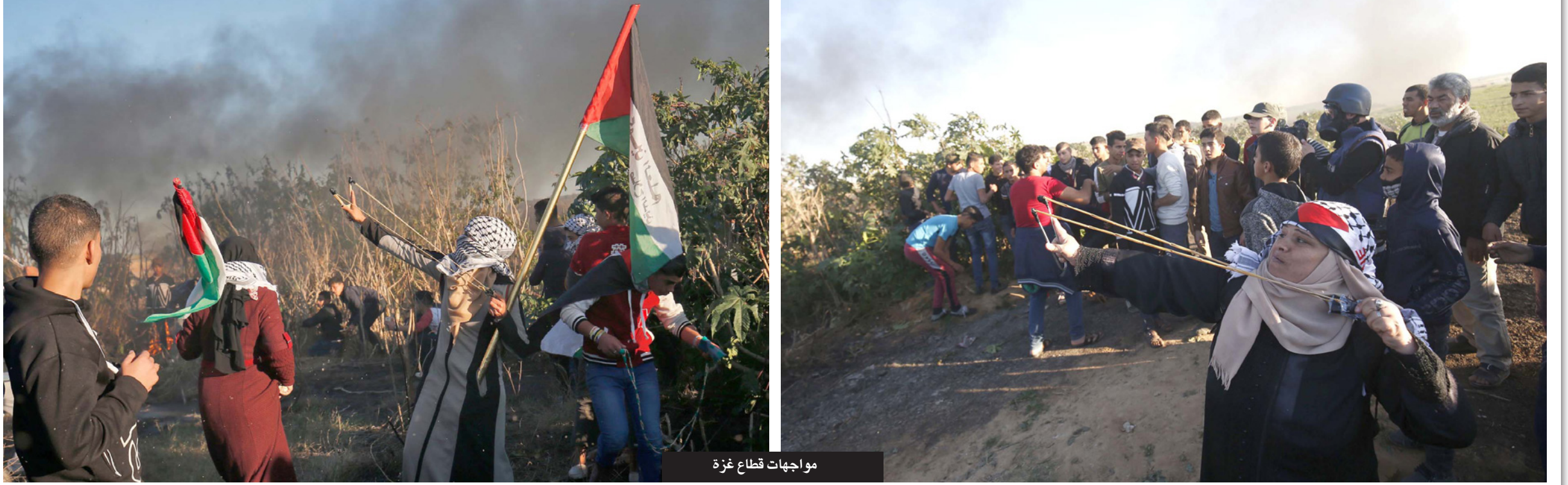
مواجهات قطاع غزة