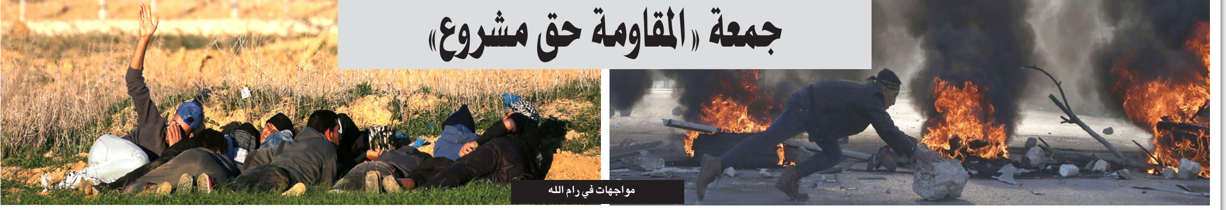
مواجهات في رام الله