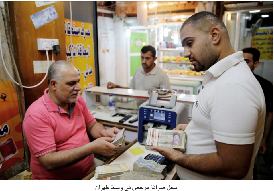
محل صرافة مخصص في وسط طهران

وقال مهرداد عمادي، الاقتصادي الإيراني الذي يرأس قسم تحليلات مخاطر النفط لدى «بيتاماتريكس» للاستشارات في لندن، إن طهران سمحت عمداً (جزئياً على الأقل) في انخفاض قيمة الريال في وقت سابق من العام الجاري بهدف تلبية احتياجات مالية. وقال إن السلطات تمكنت من بيع الدولارات التي جنحتها من صادرات النفط بسعر صرف شديد الارتفاع، لتجمع سيولة لإعادة تزويد البنوك وصناديق التقاعد المرتبطة بالحكومة برأسمال. وأضاف أنه مع الانتهاء من تلك الممارسة حالياً، فهم يعيدون الريال مجدداً إلى المستويات التي يعتقدون أنها مريحة. على الرغم من ذلك، يظل الريال منخفضاً 59 في المئة دون قيمته التي بلغت 42 ألفاً و890 ريالاً للدولار في نهاية العام الماضي. ويقول عمادي إن العملة قد تتعرض لضغوط جديدة تدفعها للانخفاض في 2019، بناء على أثر العقوبات ومستويات سعر النفط. وفي مارس/آذار، أشار صندوق النقد الدولي في تقديراته إلى أن إيران حققت فائضاً في ميزان المعاملات الجارية ولديها إجمالي احتياطيات رسمية تزيد عن 100 مليار دولار. وتشير تلك الأرقام إلى أن طهران ربما يكون لديها احتياطيات كافية للدفاع عن الريال بشكل مريح. لكن صندوق قال أيضاً إن طهران تواجه صعوبة في استخدام بعض احتياطياتها، إذ إن علاقاتها مع البنوك الأجنبية مقيدة بسبب تهديد العقوبات. وأضاف أن العقوبات قد تؤدي إلى خفض فائض ميزان المعاملات الجارية بقوة.