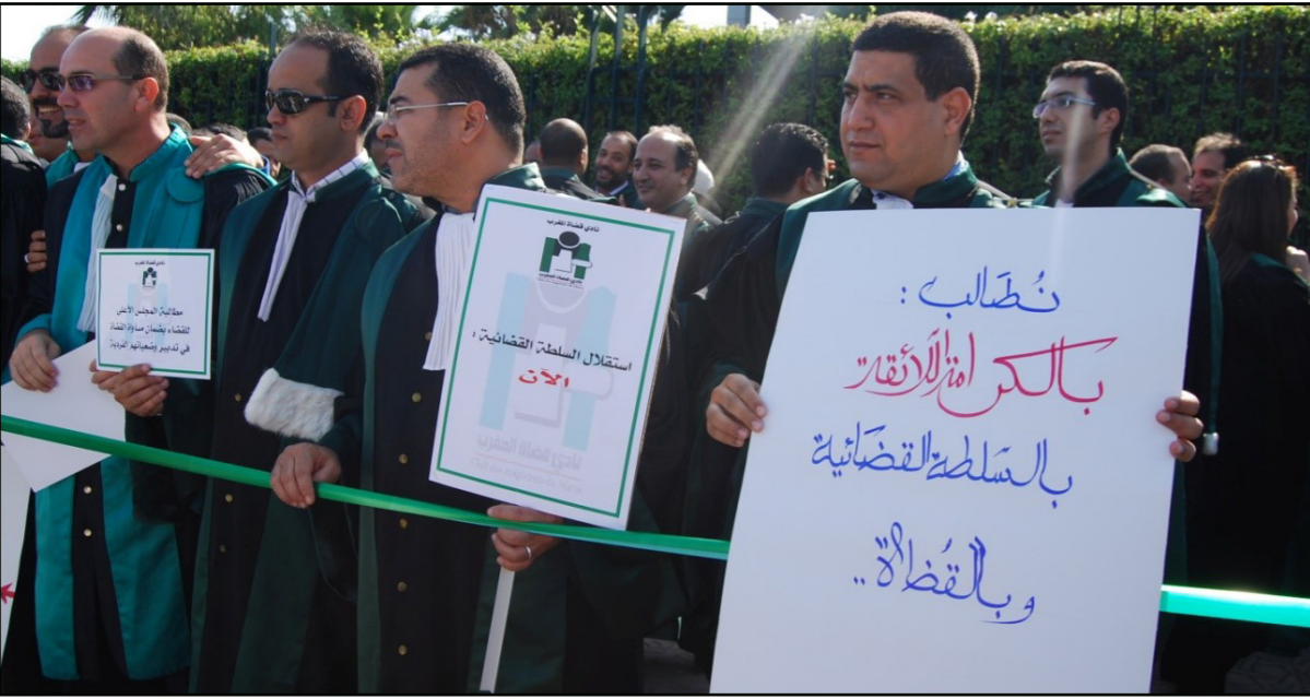
صورة أرشيفية من احتجاجات القضاة في تونس

عدداً من القضاة اكتشفوا أنه سيتم الاستماع إليهم في قضايا لا تهم العدالة الانتقالية، وفي المحاكم الحدودية التي تكون بعيدة عن الأمن، مضيفاً: «إن أمكن المحاكم ضرورة لا بد من أخذها بعين الاعتبار والتعامل معها بجدية تامة وتنفيذها في أقرب وقت. وكانت نقابة القضاة التونسيين أصدرت في