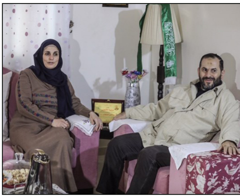
الاسير المحرر وزوجته في منزلها