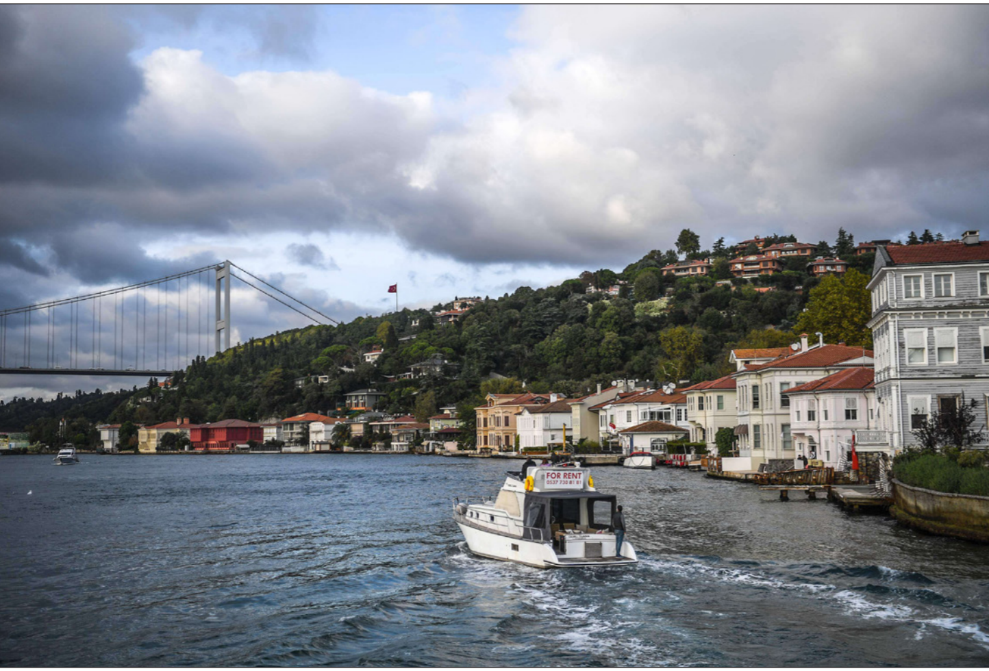
مئات من المنازل الفخمة التي بنيت لجذب السياح الأجانب لا تزال فارغة

■ مودورنو (تركيا) أف ب: في عمق إحدى المحافظات بشمال غرب تركيا ما يشبه السراب. مئات المنازل الفخمة الترابضة في صفوف تطلوها قبب تذكر بالصور الفرنسية أو قصور ديزني ولكنها خالية من السياح، وتلك القصور التي بنيت لجذب السياح الأجانب لا تزال فارغة.