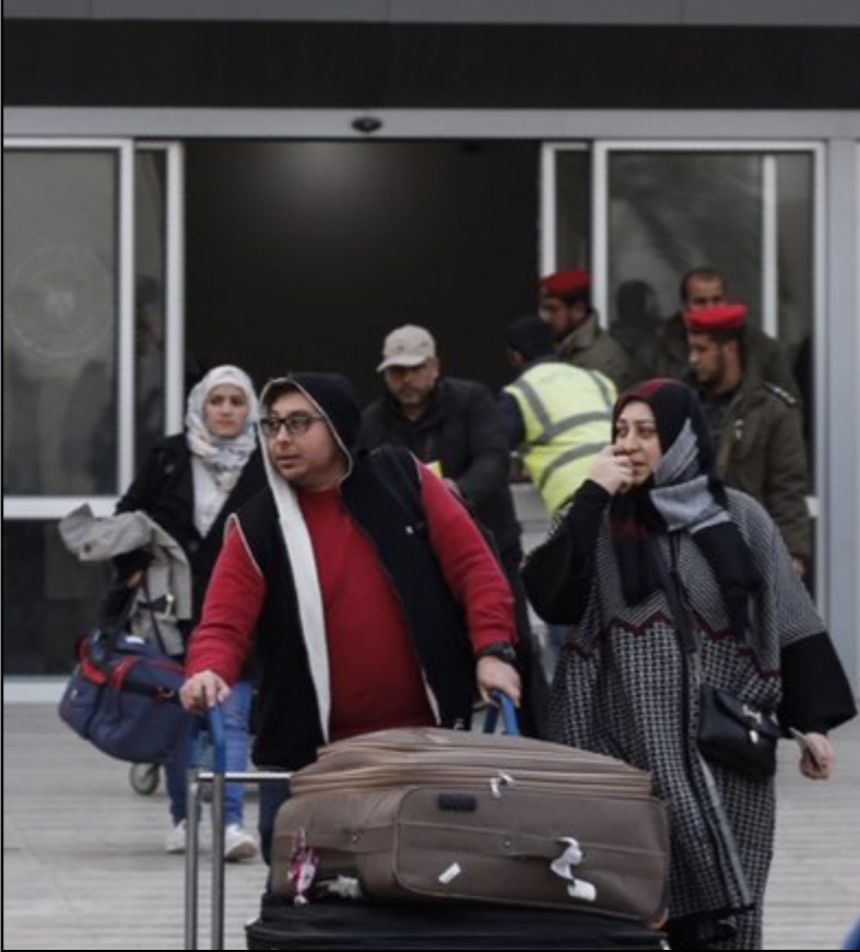
الخروج من معبر رفح

العاملين على معبري كرم أبو سالم التجاري، ومعبر بيت حانون «إيرز»، عقب عملية سحب موظفي معبر رفح. وكانت الهيئة العامة للمعابر، وكذلك الحكومة الفلسطينية، قد أعلنت سابقاً أن قرار سحب الموظفين يعود لمارس حركة حماس خلال الأيام الماضية، واستدعاء عدد منهم واعتقال آخرين والتكثيف بهم. وفي السياق طالب المركز الفلسطيني لحقوق الإنسان السلطة الفلسطينية بالتراجع عن سحب موظفيها من المعبر، لافتة إلى أن العملية تهدد مصالح أهالي قطاع غزة، وتمثل «انتهاكاً لحقهم في التنقل والحركة المكفولة قانوناً»، كما عبر عن خشية من «التدابير الخطيرة» التي قد يخلفها القرار خاصة على الرضى الذين لا تتوفر إمكانية علاجهم في قطاع غزة، وطلبة الجامعات خارج قطاع غزة، وأصحاب الإقامات، وغيرهم، ودعا كذلك السلطة الفلسطينية وحركة حماس لـ «تجنب سكان قطاع غزة آتون الصراع والمناكفات السياسية الداخلية».