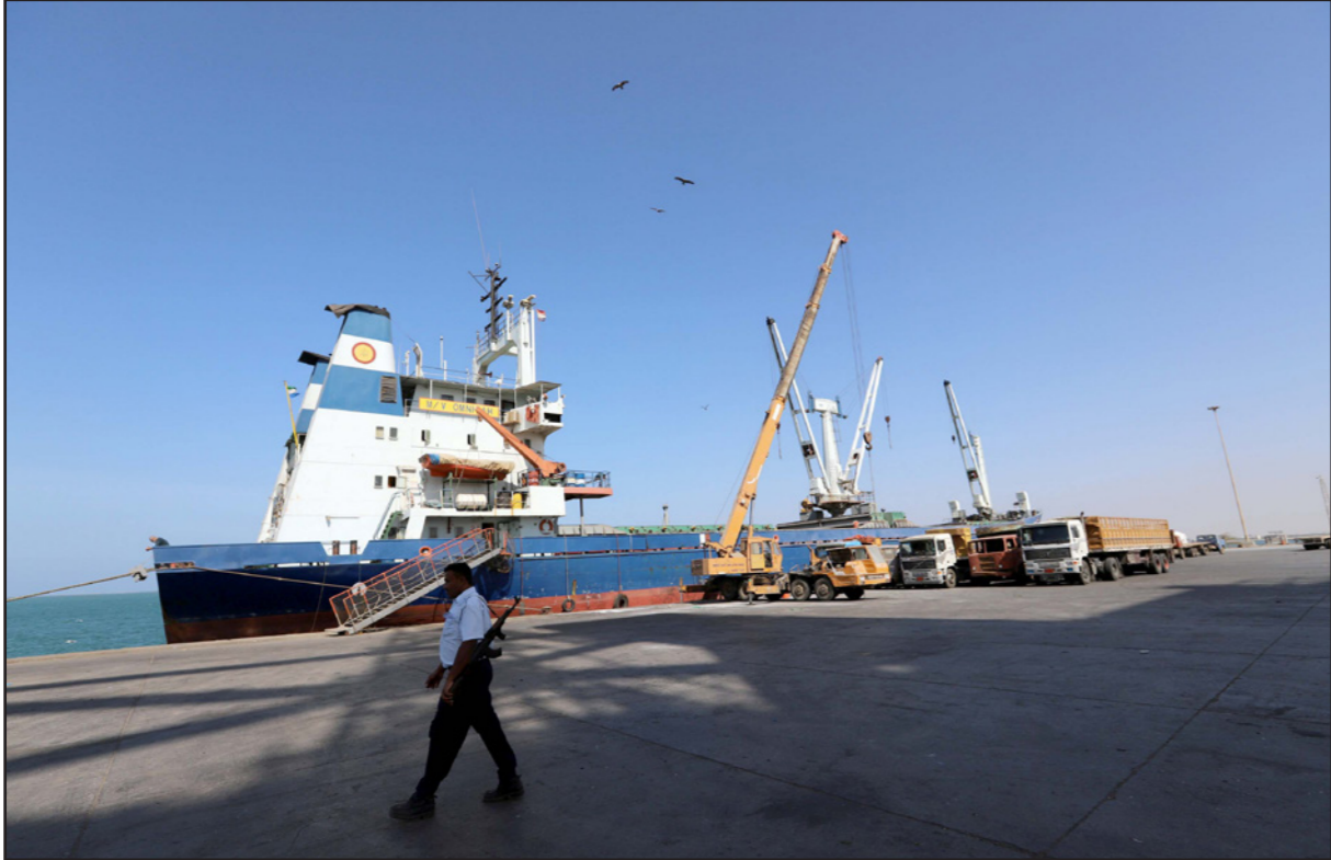
ميناء الحديد اليمني

لاتخاذ قرار بحلول 20 يناير كانون الثاني، عندما ينتهي أجل تفويض فريق المراقبة المؤقت ومدته 30 يوما. وقال دبلوماسي «لا أعتقد أن دولة سترسل مراقبين قبل الانسحاب الكامل للقوات».