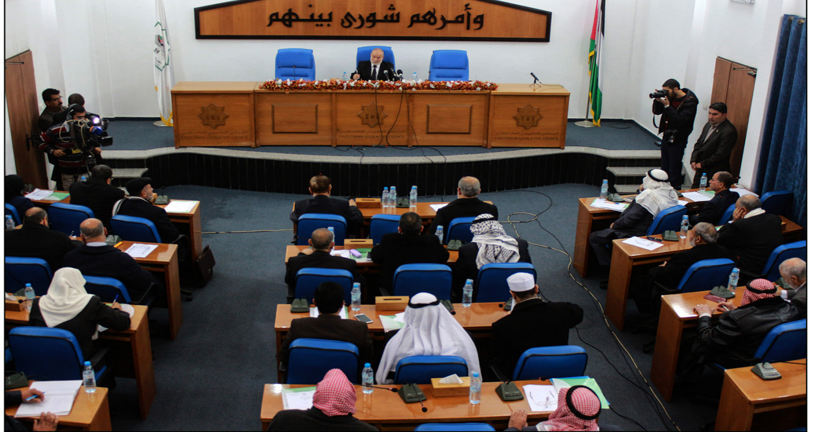
جلسة للمجلس التشريعي في غزة

وتواصل توقف عمل معبر رفح لليوم الثاني على التوالي، باتجاه طريق المغادرة، فيما سمحت السلطات المصرية فقط بعودة المسافرين من قطاع غزة، عقب قرار الهيئة العامة للشؤون المدنية سحب موظفي السلطة من المعبر. وكانت طواقم من وزارة الداخلية في غزة التي تديرها حركة حماس، قد تسلمت ليل الأحد الماضي عقب انسحاب موظفي السلطة بسبب الخلافات القائمة، مهمة الإشراف على المعبر الفاصل عن مصر، المنفذ الوحيد للغزيين بعد فرض الحصار الإسرائيلي على القطاع، ومن شأن استمرار عملية الإغلاق هذه أن تؤثر سلباً على المدنيين، خاصة أصحاب الحالات الإنسانية والمرضى والطلبة. يشير إلى أن السلطة الفلسطينية تسلمت مطلع شهر نوفمبر/ تشرين الثاني 2017، مهمة الإشراف على معبر قطاع غزة، بموجب اتفاق لتفويض المهام للموقع يوم 12 أكتوبر 2017، الذي لم يكتمل تطبيق باقي بنوده بعد. وأبقت السلطة الفلسطينية على موظفيها