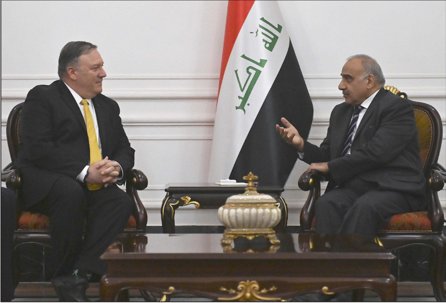
رئيس الوزراء العراقي عبد المهدي خلال لقائه وزير الخارجية الأمريكي مايك بومبيو في بغداد أمس

نال ثقة مجلس النواب بتاريخ الثامن من أيلول / سبتمبر 2014، كانت القوات الأمريكية متواجدة في العراق قبل استلامه مسؤولية رئاسة الوزراء بأكثر من شهرين». وأكد أن «العبادي هو الذي جعلها قوات متعددة وليست قوات أمريكية فقط»، داعياً «القوى السياسية إلى الالتزام بالمصداقية والابتعاد عن تضليل الرأي العام». وتابع: «العبادي كان وما زال حريصاً على استقلال العراق وسيادته»، موضحاً أن «جميع الخطوات التي اتخذها كانت تصب في مصلحة وحدة واستقلال وسيادة العراق، ولن نتال من اصراره ومواقفه الوطنية محاولات الأقعاء والتشويه والتضليل التي تمارسها نخب غير مسؤولة». في المقابل، رد ائتلاف «دولة القانون»، بزعامة نوري المالكي، على بيان ائتلاف «النصر» بشأن التواجد الأمريكي في العراق، معتبراً أنه يمثل «محاولة للتهدد من مسؤولية» استعداداً للحكومة السابقة للقوات الأمريكية ومنحها قواعد ثابتة وصلاحيات التحرك «دون الرجوع إلى السلطات العراقية». وجاء في بيان لائتلاف دولة القانون، «يعرب ائتلاف دولة القانون عن أسفه لما تضمنه بيان ائتلاف النصر من مغالطات وادعاءات حول تواجد القوات الأمريكية في العراق عام 2014». وأضاف أن «ما ورد في بيان النصر من تهم ومغالطات يمثل محاولة للتهدد من مسؤولية استخدام حكومة (رئيس الوزراء السابق) العبادي للقوات الأمريكية ومنحها قواعد ثابتة على الأراضي العراقية وصلاحيات التحرك على الأرض وسماء العراق دون الرجوع إلى السلطات العراقية، ويعد هذا مخالفة صريحة لبنود اتفاقية الإطار الاستراتيجي المبرمة مع الولايات المتحدة الأمريكية والتي أفضت إلى خروج القوات الأجنبية من العراق عام 2011».