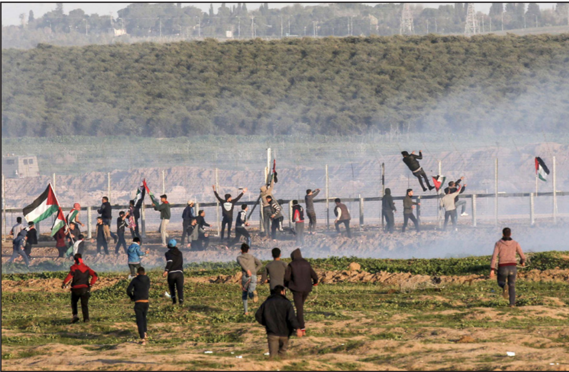
فلسطينيون يظهرون على الحدود الإسرائيلية مع غزة

فيتننا نراه في غلاف غزة: هنا طائرة تحمل عشرات البالونات وعبوة ناسفة، هناك قذيفة هاون، آلاف المتظاهرين يواصلون الركن نحو الجدار لاقحامه وإلقاء العيون، إن سنستحسن حالة القدس، وسيستغير رئيس الأركان بأخر، وفي إسرائيل سيرزون سيبقي كما هو: يضعضع.