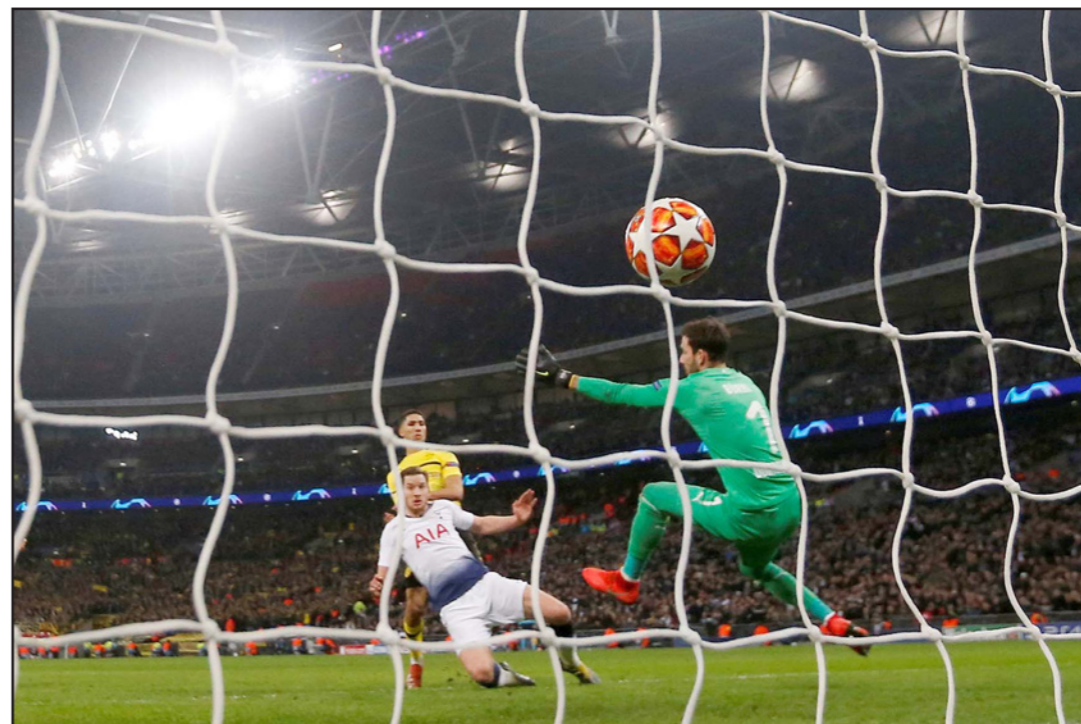
لحظة تسجيل فيرتونخ الهدف الثاني لتوتنهام في مرمى دورتموند

■ لندن - رويترز: سجل المدافع يان فرتونخ هدفا وصنع آخر لزميله سون هيوينغ مين ليتفوق توتنهام 3-صفر على بوروسيا دورتموند باسناد «ويمبلي» ويحصل على أفضلية واضحة عقب ذهاب دور ال16 بدوري أبطال أوروبا. وبدا توتنهام غير متأثر بغياب القائد هاري كاين ويبلي الذي سبب الإصابة. إذ أحرز أهدافه بعد أداء قوي في الشوط الثاني لسيطر على مواجهة ويترك الفريق الألماني على شفا الخروج من البطولة. وحرز المدافع البلجيكي هدفة الأول في دوري الأبطال بتسديدة مباشرة متتقة في الدقيقة 83، بعدما صنع هدف التقدم لهاجم كوريا الجنوبية سون في الدقيقة 47. وأكل البديل فرناندو بوريتي ثالثة توتنهام في الدقيقة 86. وهذا الهدف التاسع للكوري سون في 11 مباراة ضد دورتموند، إذ سبق