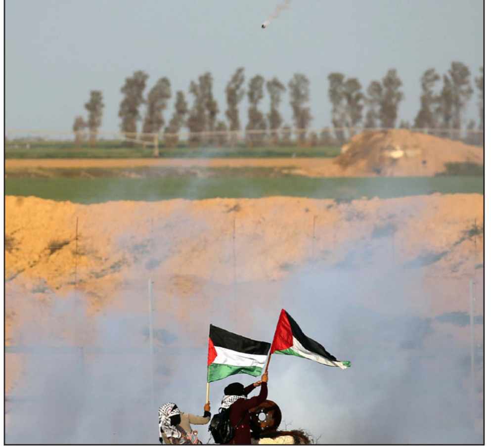
المواجهات مع قوات الاحتلال شرق قطاع غزة يوم الجمعة الماضي