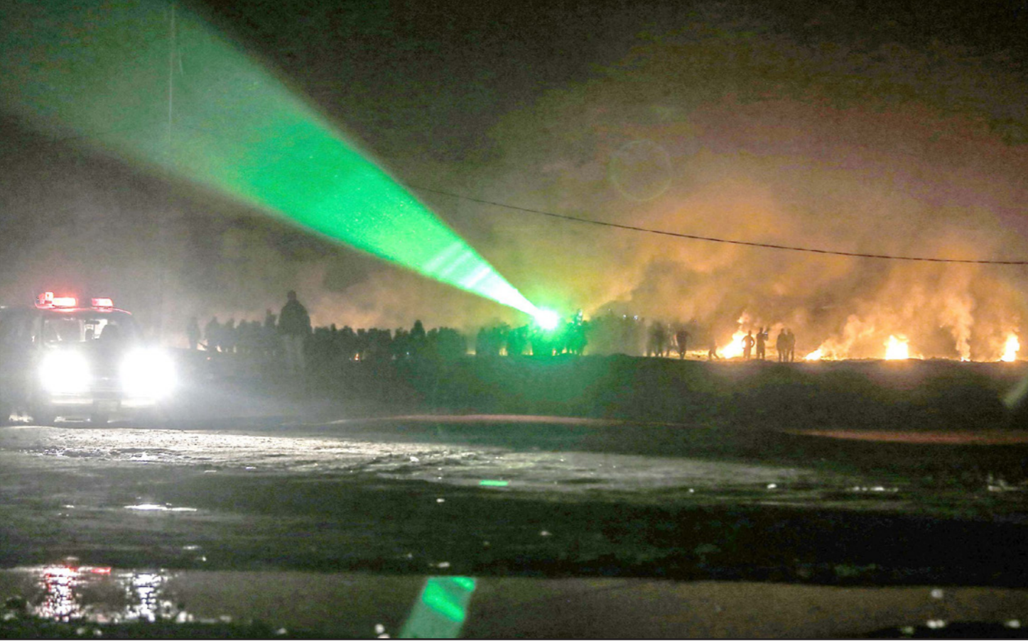
وحدة الاريك الليلي توجه أشعة الليزر نحو جنود الاحتلال