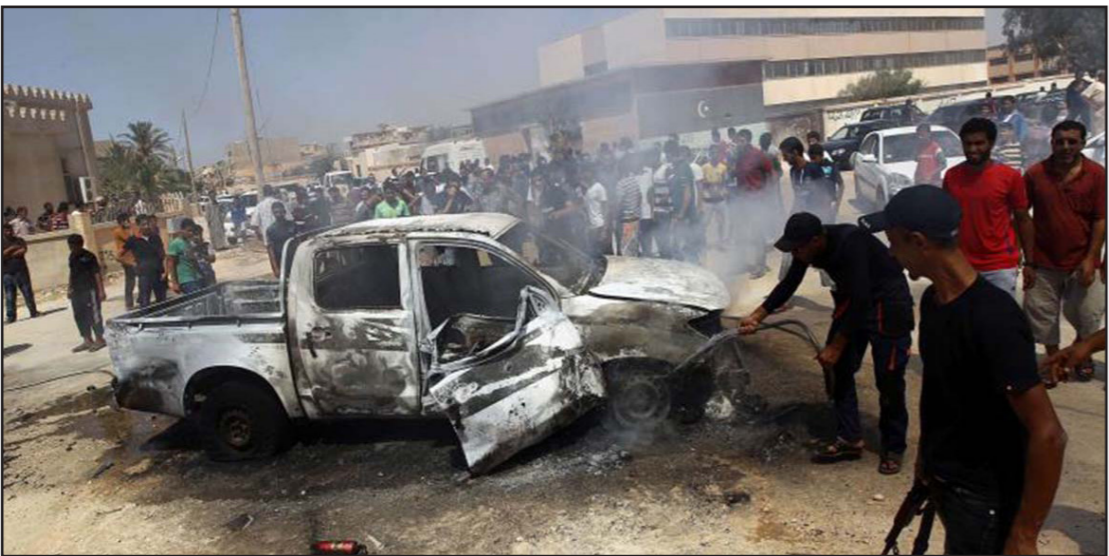
مواطنون ليبيا يحاولون إطفاء النار من سيارة تم تعجيرها عقب هجوم إرهابي

ومنذ سقوط نظام العقيد معمر القذافي ومقتله في 2011، غرقت ليبيا في فوضى أمنية وسياسية تتنازع السلطة فيها مجموعتان مسلحة وقوى سياسية متناحرة. وتتنازع السلطة السياسية في ليبيا حكومتان: حكومة الوفاق الوطني المدعومة من المجتمع الدولي ومقرها طرابلس، وحكومة موازية في الشرق يدعمها برلمان منتخب. واستغلت حركات إسلامية جهادية هذه الفوضى للمتمركز في ليبيا وخصوصاً في سرت في شمال البلاد قبل طردها من هذه المدينة الساحلية في 2016 في أيدي قوات من الية لحكومة الوفاق.