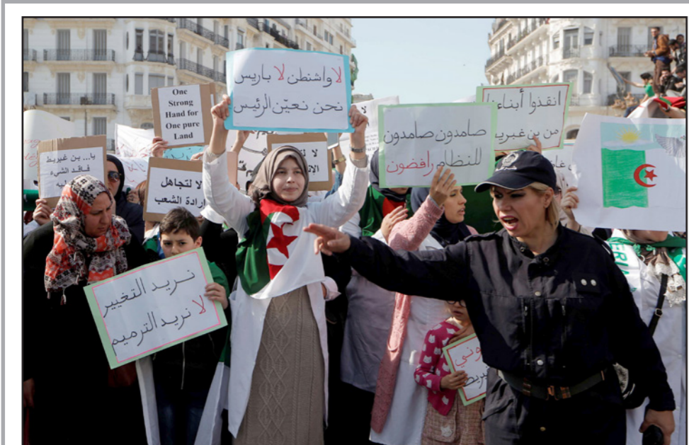
تظاهرة في الجزائر العاصمة تطالب بالتغيير

في الجزائر وإنهاء الحرب الأهلية التي قتل فيها 200 ألف شخص تقريبا. يمكننا أن ننسب قرار انسحابه من المنافسة له أن الجمهور لا يوافق عليه لولاية خامسة، وليس فقط بسبب وضعه الصحي المتدهور.