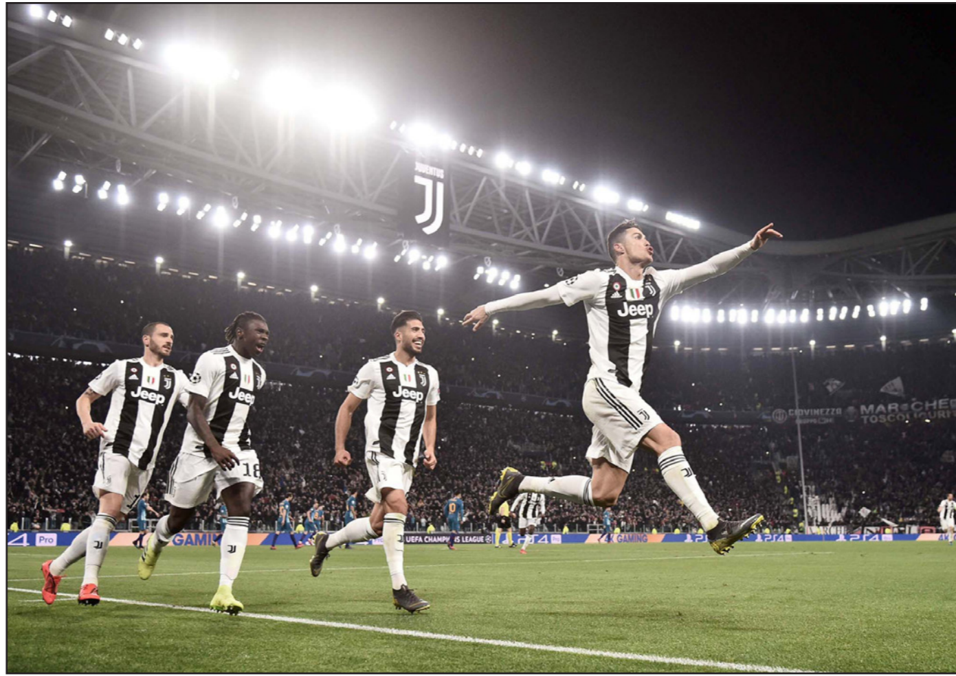
رونالدو يتقدم زملاءه خلال احتفالاته بتسجيل الهدف الثالث ليوفنتوس في مرمى أتلتيكو