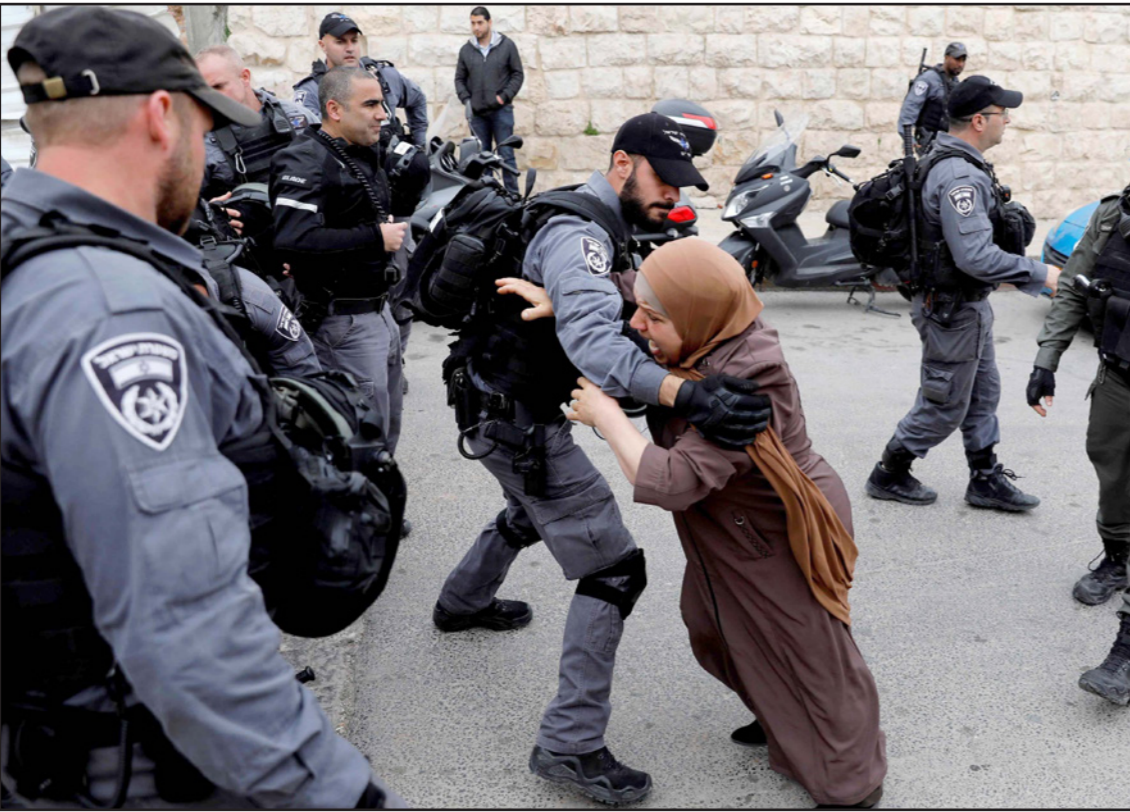
مواجهات بين الفلسطينيين وجنود الاحتلال في محيط المسجد الأقصى