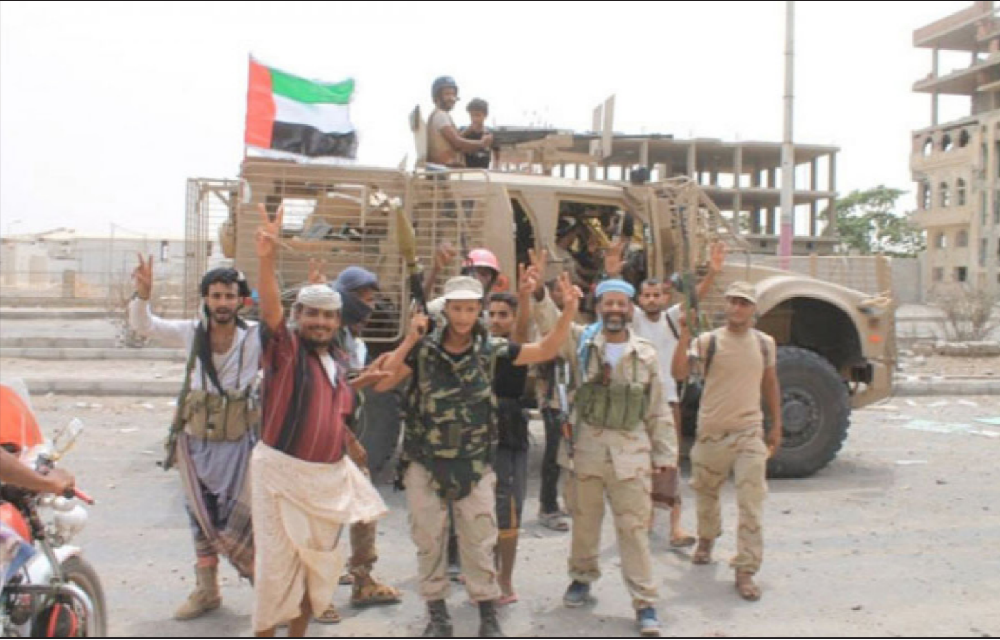
أرشيفية لميليشيات تابعة للإمارات في اليمن

أثماناً بأهضة ومضاعة ويغطي على الجرائم والجرائم الحقيقين ويساعدهم على الإفلات من العقاب. وأكد الحزب أنه يحتفظ بحقه في مقاضاة كل المتورطين في تعز تشويه صورته، وتلقيق التهم الكيدية له، بغرض «تصميم جرائم أخلاقية تال من مجتمعنا وقيمه، وتحول أعراض الناس وحقوقهم إلى مواد هابطة للدعاية السياسية الرخيصة».