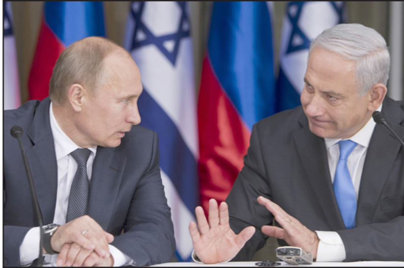
لقاء سابق لرئيس الوزراء الإسرائيلي نتناهاه والرئيس الروسي بوتين

تتشغل وسائل الإعلام الإسرائيلية في الانتخابات والتخمينات القمائية، لدرجة أنها بالكاد غطت اللقاء الهام لرئيس الوزراء نتناهاه مع الرئيس بوتين الذي انعقد مؤخرا في موسكو. تناول اللقاء التشاؤم المتفجع لإيران في سوريا على خلفية حقيقة أن تثبيت الوجود الروسي في المنطقة أصبح حقيقة ثابتة، إلى جانب الوجود الأمريكي الأخذ في الاعتبار.