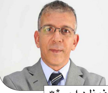
حفيف دراجي *