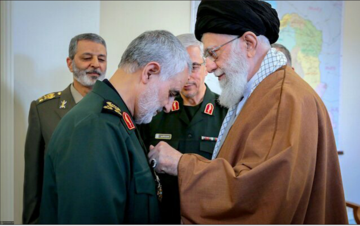
المرشد الأعلى الإيراني آية الله علي خامنئي لدى تقليده قاسم سليماني الوسام

بها وقد استقالته. ورفض روحاني في النهاية الاستقالة، ولكن بعد مطالب أصوات قوية مثل سليماني بعودته. وأرسل إلى العراق للتحضير لزيارة الرئيس روحاني. ونقلت قناة الفرات المحلية قوله إنه تلقى دعوة من الرئيس الأسد لزيارة دمشق والتي سيقوم بها في المستقبل القريب.