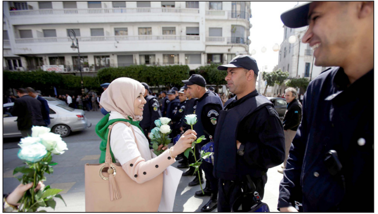
متظاهرة جزائرية تقدم ورود لقات الأمن