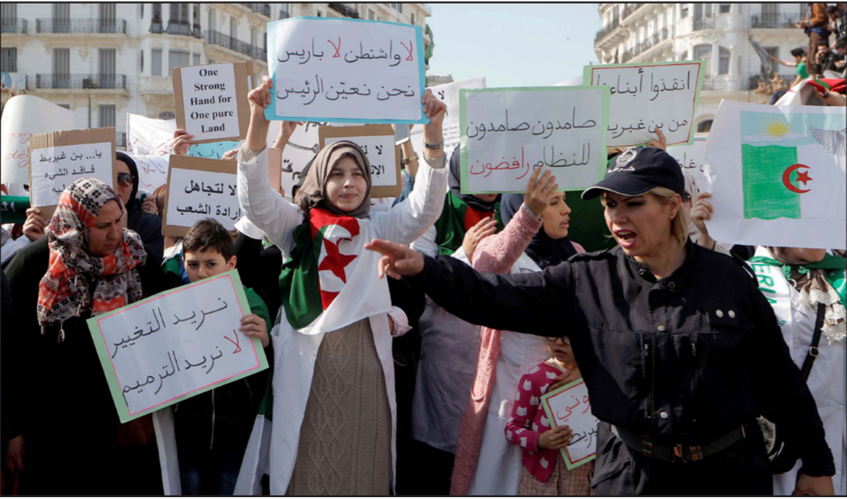
متظاهرات جزائريات يرفعن شعارات تشجب تعنت السلطة وتندد بالتمديد وتطالب بالتغيير