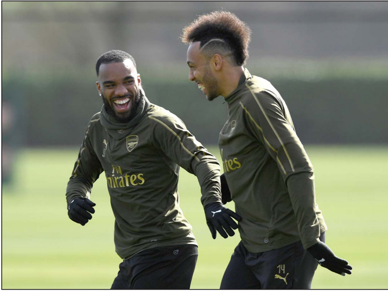
مهاجما أرسنال المتألقان أوباميانغ (يمين) ولاكازيت يتبادلان الضحك قبل لقاء رين الحاسم الليلي