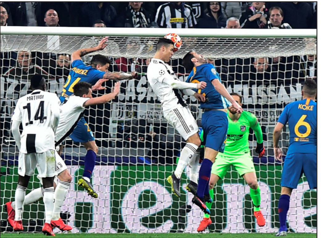
رونالدو يقفز أعلى من الجميع ليسدد كرة برأسه جاء منها الهدف الثاني ليوفنتوس في مرمى أتلتيكو

■ روما - د ب أ: رغم أنها ليست المرة الأولى التي يحرز فيها ثلاثة أهداف (هاتريك) أو التي يثير فيها الجدل بتصريح أو إيماءة غريبة، فرض هاتريك اللاعب البرتغالي كريستيانو رونالدو في شبك أتلتيكو مدريد والإيماءة البيضة للاعب، نفسها بقوة على وسائل الإعلام والصحف الإيطالية الصادرة أمس.