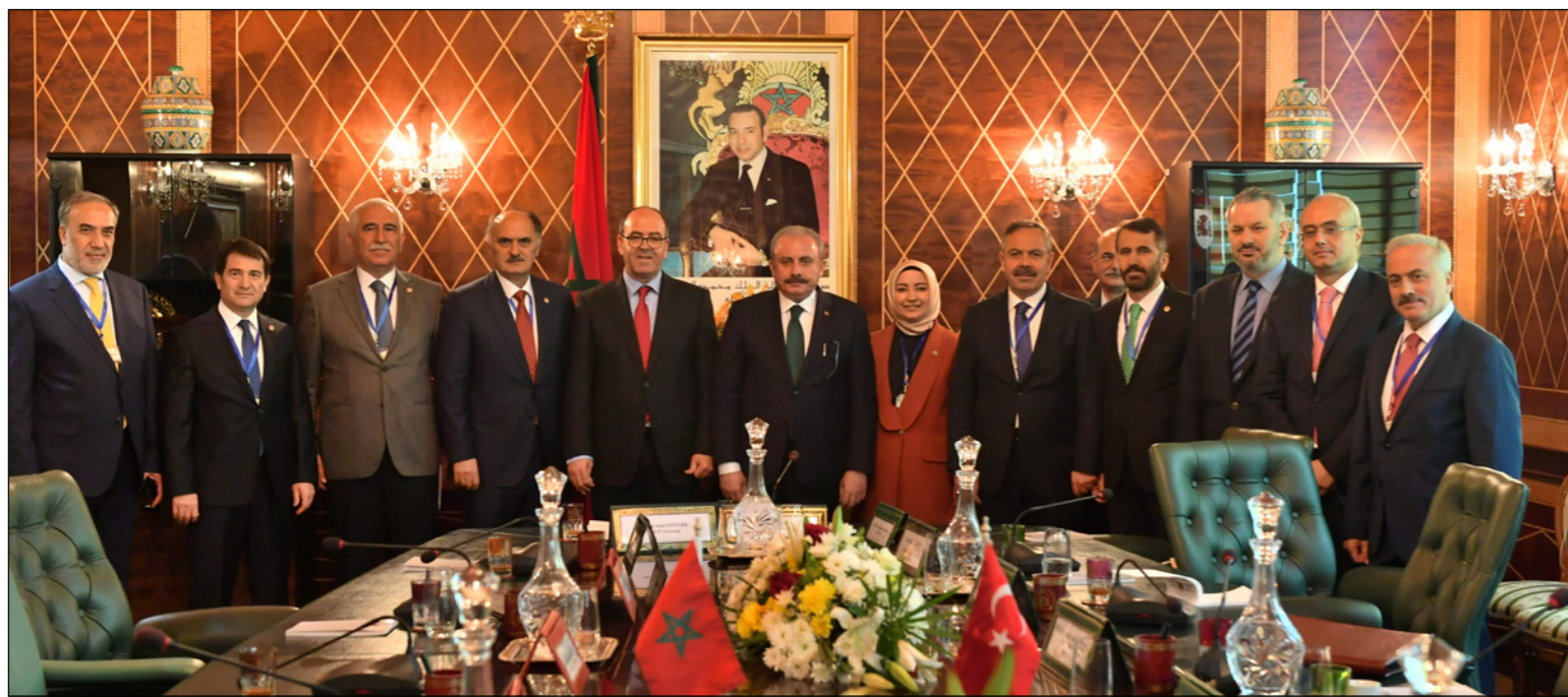
صورة جماعية لمؤتمر صحفي يشمل تركيا والمغرب لتطوير العلاقات بينهما

الرباط - من خالد مجدوب: انطلقت، مساء الأربعاء، فعاليات المؤتمر الـ14 لاتحاد مجالس دول منظمة التعاون الإسلامي في العاصمة المغربية الرباط، بمشاركة رئيس البرلمان التركي مصطفى شنطوب.