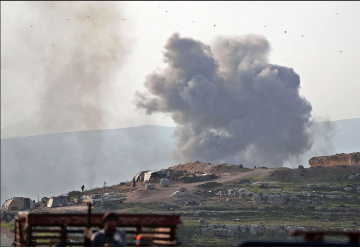
أعمدة دخان إثر غارات روسية على إدلب