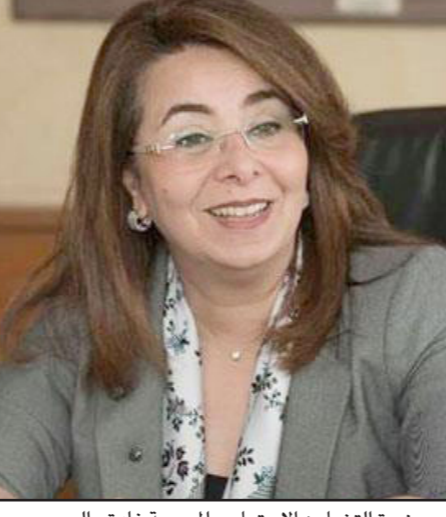
وزيرة التضامن الاجتماعي المصرية غادة والي

القائمون على عدد من الكيانات والانتلافات حملة تحت عنوان «حسبنا الله ونعم الوكيل» تجاوب معها العديد من المواطنين المتضررين. وحذر عدد من الناشطين في مجال الدفاع عن أصحاب المعاشات، من نقل المواجهة مع الحكومة إلى الشارع. عضو البرلمان السابق، رئيس اتحاد أصحاب المعاشات، البديري فرغلي قال له «القدس العربي» إن «الأغلبية ستقاتل من أجل الحصول على حقوقها التي كفلها الدستور»، متابعا أن «ثقة أصحاب المعاشات في القضاء بلا حدود». وحذر من «استهلاك الوقت في محاولة للانقضاض على حقوق الأغلبية التي نالها عبر صراع دام سنوات طويلة في ساحات المحاكم». وذكر به «المسؤولية الجناحية التي تقع على عاتق كل من يقف في وجه تنفيذ الأحكام القضائية». ورفع مواطنون غاضبون على أحد مقاهي العاصمة، لافتة «الدفع أو الحبس» وعليها صورة لوالى. وسخر بيان وقع عليه عدد من المواطنين من قانون صدر من قبل ووافق عليه البرلمان