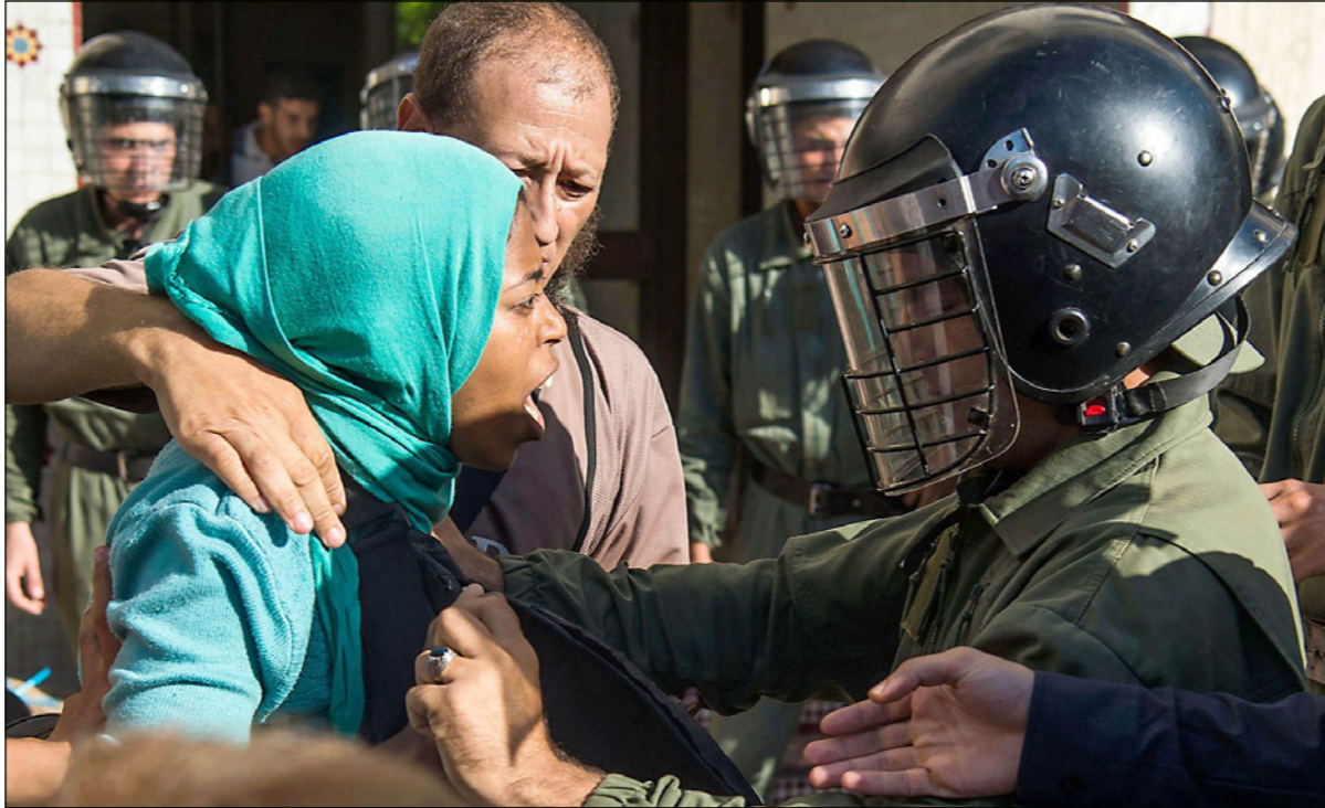
إمرأة مغربية في إحدى المظاهرات

وربطت البوحسيني نجاح المشروع الديمقراطي والنموذج التنموي بإشراك النساء في الحياة السياسية، وقالت: «المساواة منذ دستور 1992، لكن الترجمة الفعلية لهذا المبدأ لم تتم، لأن البرلمان ظل توكوريا مائة في المائة إلى غاية مطلع تسعينيات القرن الماضي، إذ تمكنت امرأتان من دخول البرلمان».