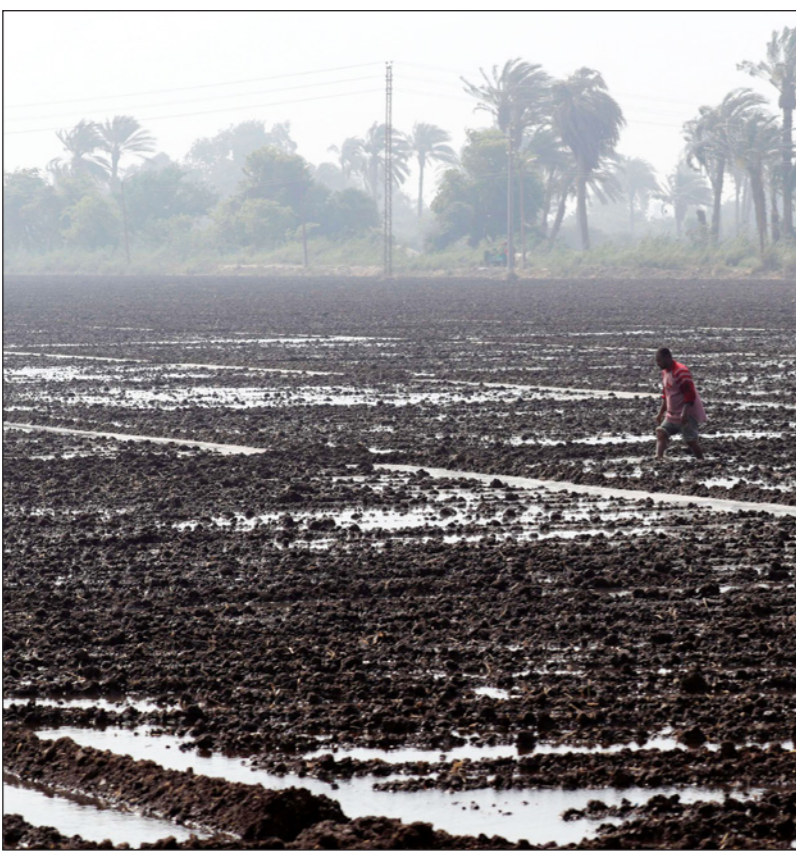
مزارع يعمل في حقل أرز في ضواحي القاهرة

القاهرة - رويترز: قالت وزارة الزراعة المصرية أمس الأربعاء أنها سمحت بزراعة 1.1 مليون فدان من الأرز في موسم 2019، ارتفاعا من 800 ألف فدان العام الماضي لتقليل فاتورة واردات البلاد. وبدأت مصر استيراد الأرز في عام 2018 لتوفير استهلاك المياه، بعدما اعتادت في السابق أن تملك فائضا منها. ورفعت القاهرة العام الماضي غرامات زراعة الأرز بشكل غير قانوني وأصدرت قرارا يسمح بزراعة 724 ألف فدان فقط بهذا المحصول، وزادت المساحة المزروعة بنحو 100 ألف فدان لاحقا. ويعشل هذا انخفاضا حادا عن المساحة المخصصة بشكل رسمي لزراعة الأرز البالغة 1.1 مليون فدان في عام 2017، و1.8 مليون فدان يعتقد تجار الحبوب أنها كانت تزرع فعليا في ذلك العام. وقال أحمد إبراهيم، المستشار الإعلامي لوزير الزراعة «زيادة المساحة لتقليل فاتورة استيراد الأرز من الخارج ووثبات أسعاره»، وخفضت مصر مساحة زراعة الأرز سعيا للحفاظ على موارد مياه النيل الحيوية، في الوقت الذي تشديد فيه إثيوبيا سدا تبلغ تكلفته أربعة مليارات دولار، عند منابع نهر النيل وتخسب القاهرة من أنه قد يهدد ما لديها من مخزون مائي. وكانت الهيئة العامة للسبع للتعمير المصرية، المشتري الحكومي للحبوب، طرحت ثلاث مناقصات شراء دولة منذ العام الماضي.