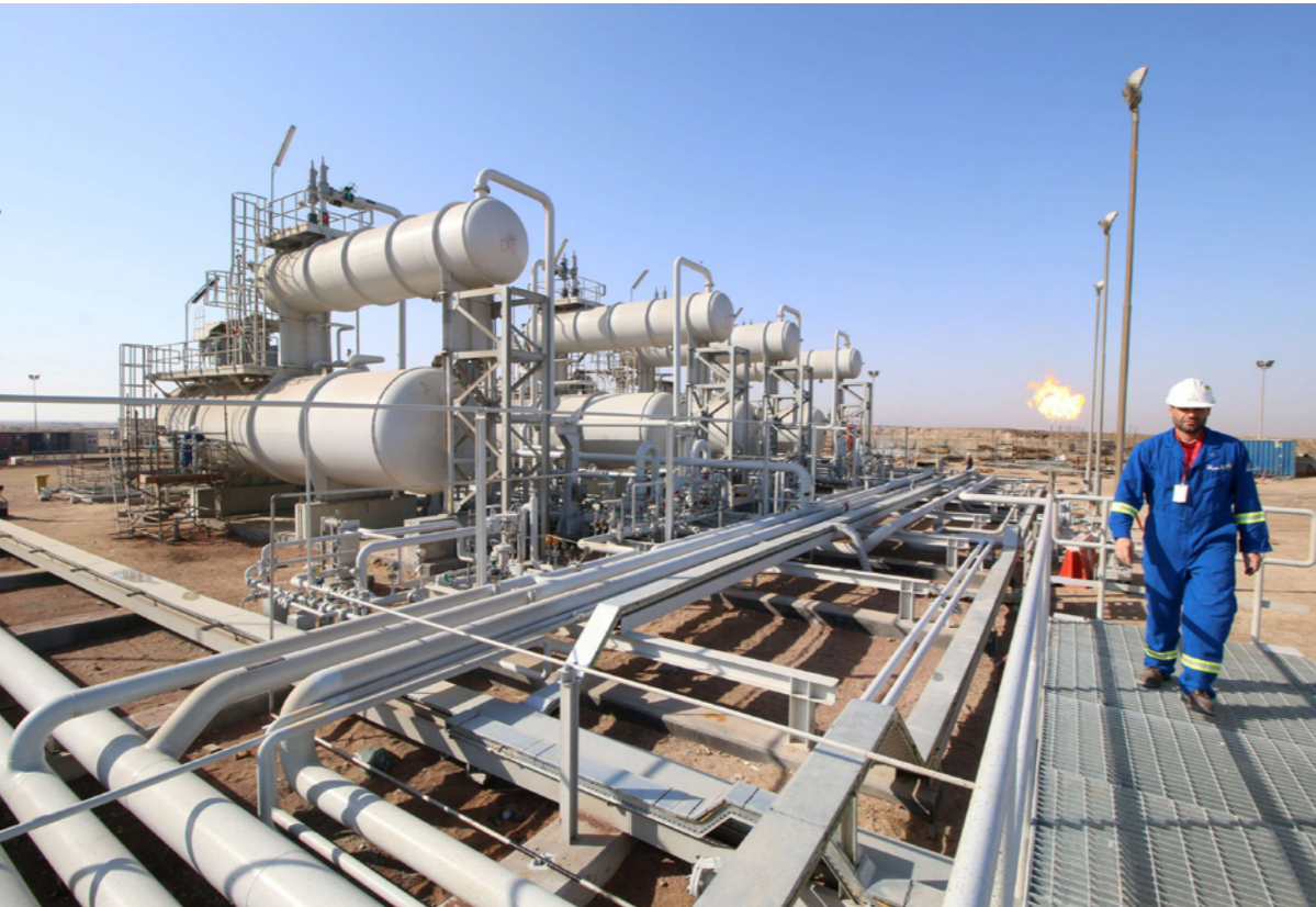
عامل صيانة في حقل الرميطة النفطي في البصرة

المعني بتجارة النفط. وتعتقد شركة تسويق النفط الحكومية أن بمقدورها تنفيذ عملياتها للتجارة حاضرة وحدها في الوقت الحالي. وقال المصدر «نحتاج إلى إعادة تقييم ما اكتسبناه وكيفية توظيفه في نشاطنا. بدأنا بالفعل بالزادات الفورية المعلن عنها». ويعد أن حُجِّمت عمليات إعادة بيع نفطها، تتبّع «سومو» خامها بأحجام كبيرة على نحو متزايد عبر مزادات، بهدف الحصول على أرباح إضافية استقادت منها شركات تجارة في السابق.