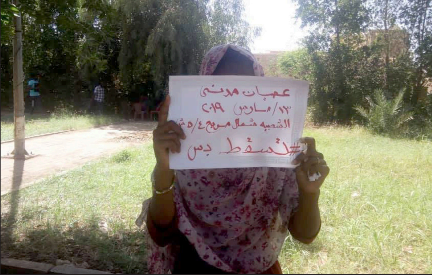
سودانية تحمل ملصقا تطالب فيه بالعصيان المدني وأسقاط نظام البشير