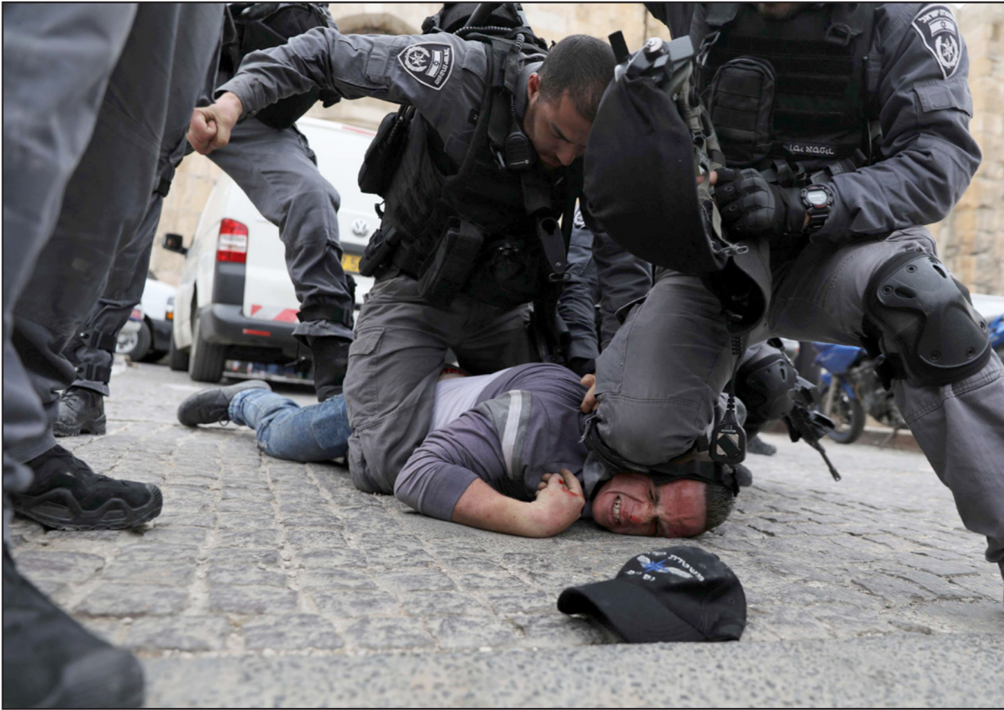
عناصر من الشرطة الإسرائيلية يستخدمون القوة ضد فلسطيني خلال مواجهات بالقرب من الحرم

العمل دون إزعاج في منطقة دمشق. الآن يتضح أنهم لم يعملوا حتى من أجل وقف نشاطات حزب الله التي تتم قرب الحدود مع إسرائيل.