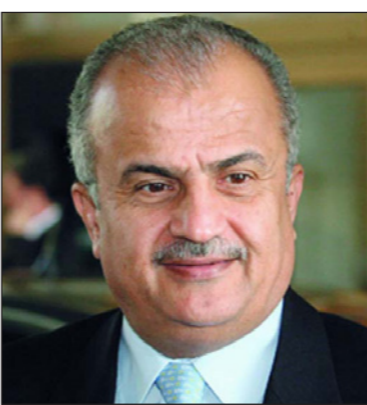
عبد الإله الخطيب

على المستوى الدولي. وفي حال اتخذ القرار ضمن هذا السيناريو التحليلي يصبح الخطيب مرشحاً قوياً لخلافة الرزاز، لكن القرار المركزي ينبغي أن يجازف بمنحه صلاحيات واسعة من العقاد بسبب خبرته العميقة وقوة شخصيته، وأيضاً بسبب القدرة على التفاهم، ولو جزئياً، على ملف الولاية العامة مع الرجل الخبير في هندسة العلاقة مع المؤسسات الشريكة. في المقابل، ثمة عملية مضادة تحاول إبعاد ترشيح الخطيب وتقترب تكليف شخصية محلية برئاسة حكومة انتقالية وتطرح أسماء، من بينها وزير العدل الحالي بسام التلهوني، ونائب رئيس الوزراء الأسبق المخضرم الدكتور