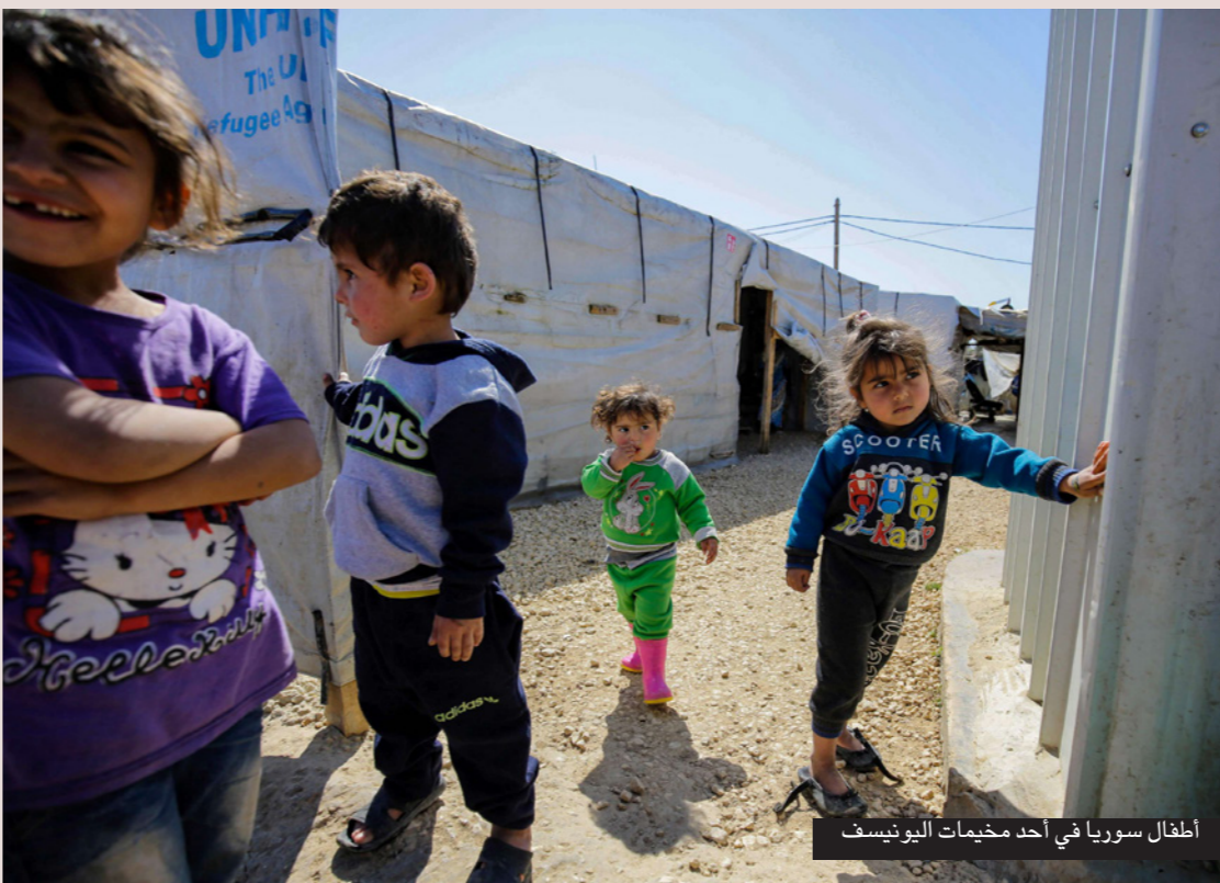
أطفال سوريا في أحد مخيمات اليونسيف