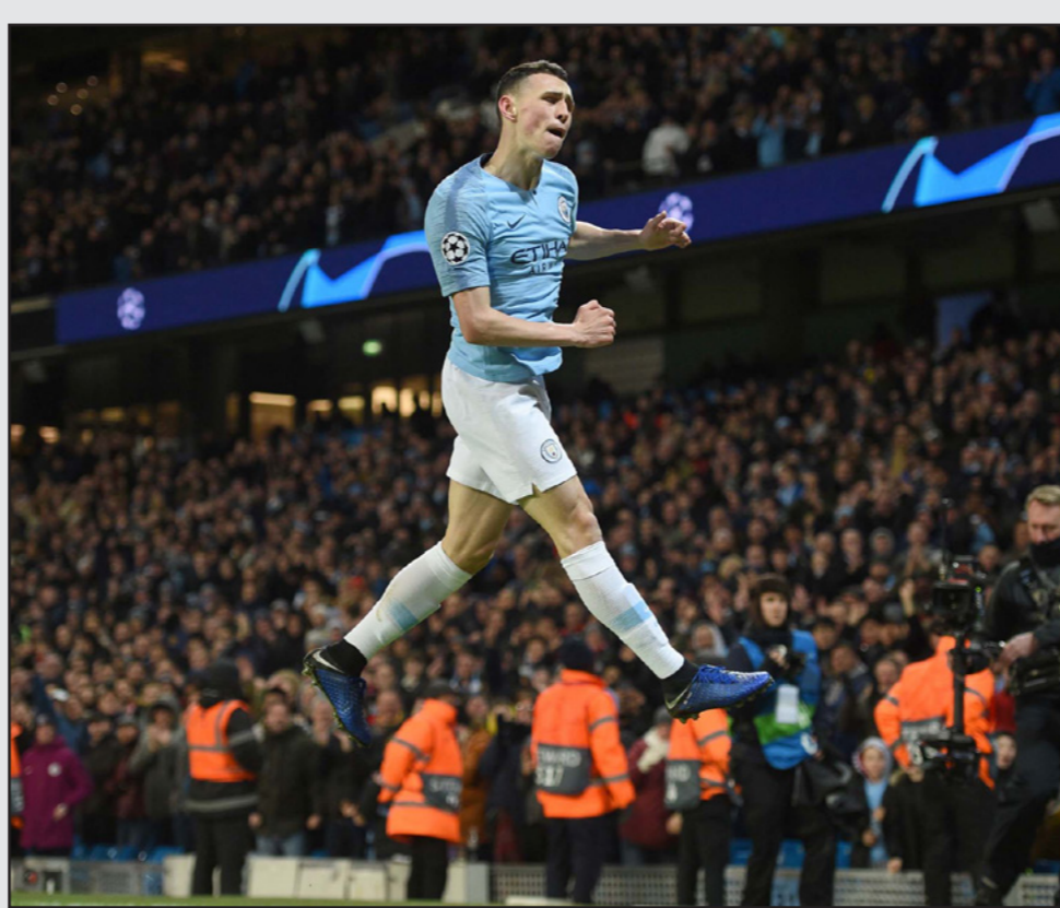
فون نجم السيتي الصاعد يحتفل بتسجيل الهدف السابع لفريقه في مرمى شالكة