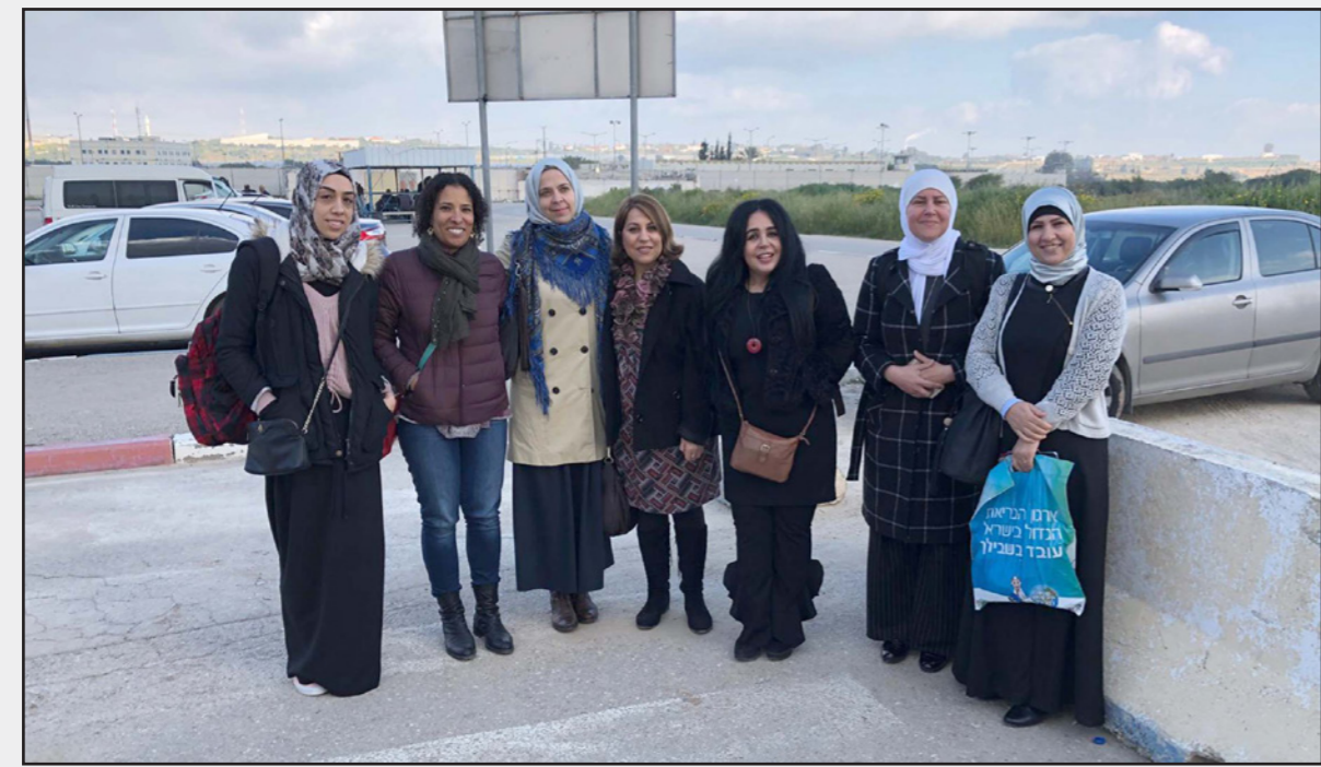
وفد الطبيبات الفلسطينيات الذي شارك في تقديم مساعدات طبية لأهالي غزة

وقال جميل عليان، القيادي في حركة الجهاد الإسلامي، إن «مسيرات الهدوء» مستتصلة، وإن الفصائل مستمرة بها حتى كسر الحصار. وأكد في سياق