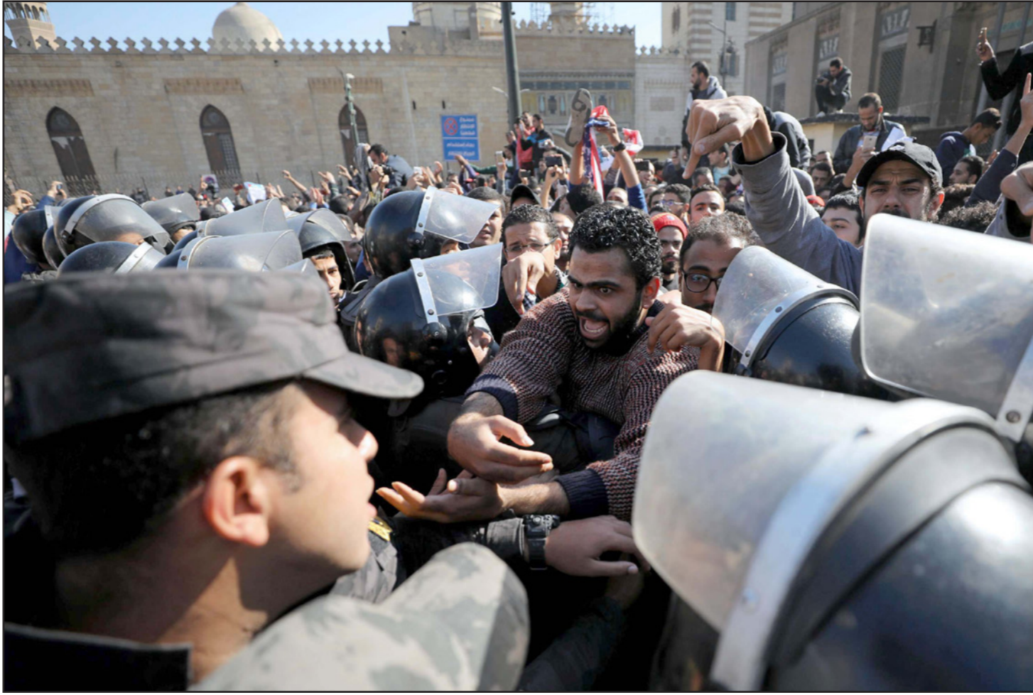
عناصر من الشرطة المصرية تلقي القبض على أحد المشتبه فيهم