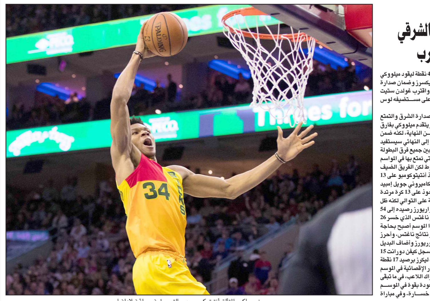
نجم باكس المتعلق أنتيتوكومو يهيم بالتسجيل في سلة فيلادلفيا