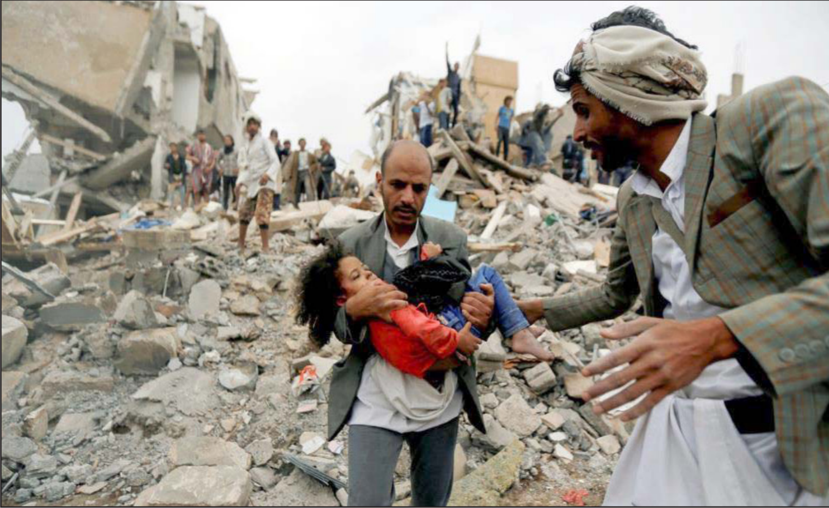
الأطفال والمدنيون يشكلون غالبية ضحايا الحرب الدائرة في اليمن

عكس الصفقات الحكومية، يقول التقرير، يصعب الحصول على البيانات المتعلقة بالصفقات التجارية مع الشركات الخاصة، إذ لا تذكر إلا الخطوط العامة، كما أنه لا تنتشر إلا بعد مرور فترة طويلة على أخبار الكونغرس بها، إنه من دون الأسلحة الأمريكية، يقول الخبراء إن مقدرة التحالف الذي يقاوم في اليمن على الاستمرار بحربه ستقل بشدة.