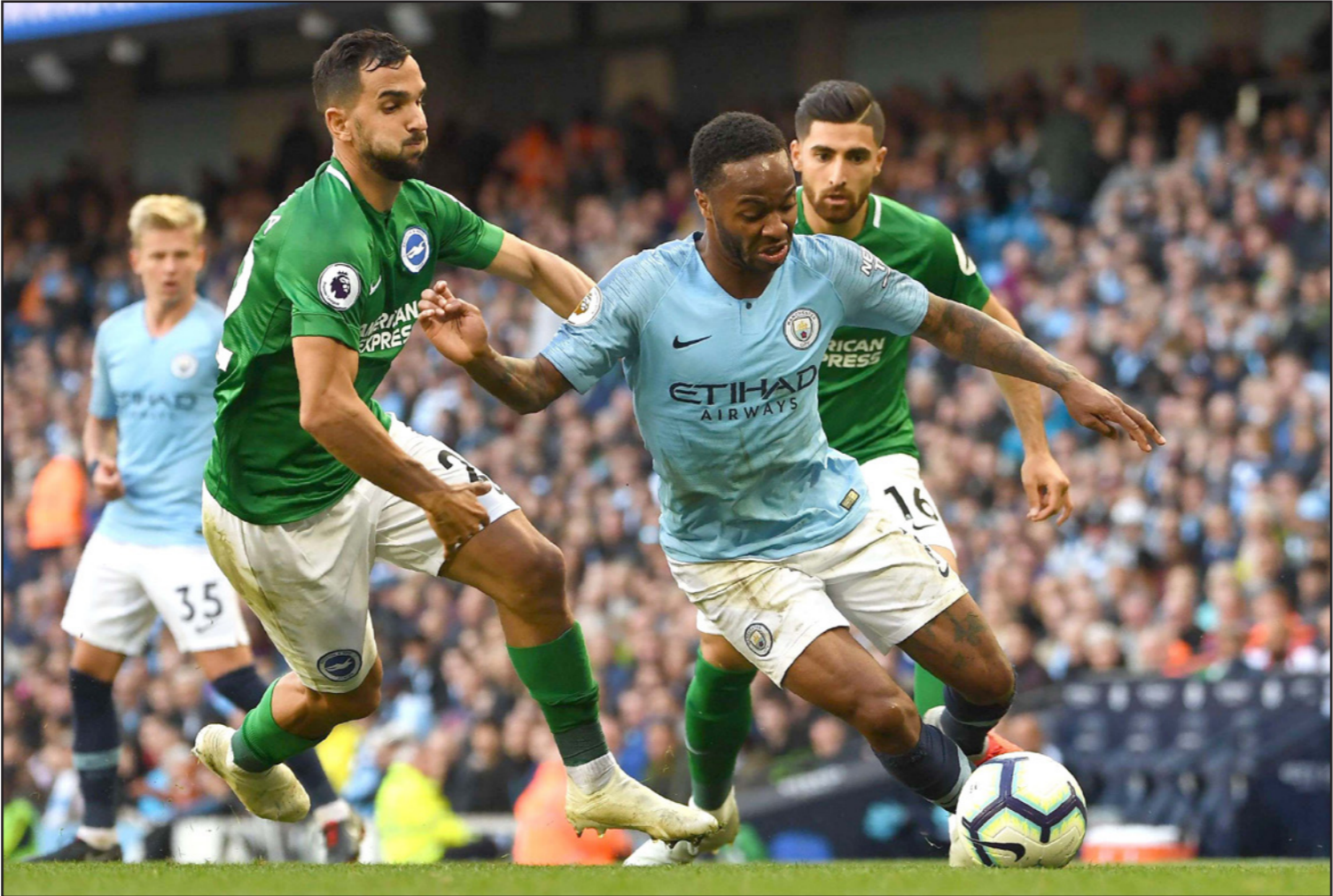
صراع مانشستر سيتي وبرايوتون يتجدد وينتقل من الدوري الى مسابقة الكاس

وفي مواجهة الأخرى، يلتقي فريقان لم يحققا النجاح في هذه المسابقة منذ سنوات طويلة، وسبق لولفرهامتون التاهل للمربع الذهبي 14 مرة، لكن آخرها كان في 1998، كما توج باللقب أربع مرات، آخرها في 1960. علما أن الفريق توج بعد هذا التاريخ بكأس الأندية المحترفة مرتين. ويخوض ولفرهامتون المباراة بمعنويات مرتفعة بعد الفوز على مانشستر يونايتد 1/2 منتصف الأسبوع وهي النتيجة التي فاز بها على يوناييتد في دور الثمانية لكأس فولهام في الدوري منتصف الأسبوع.