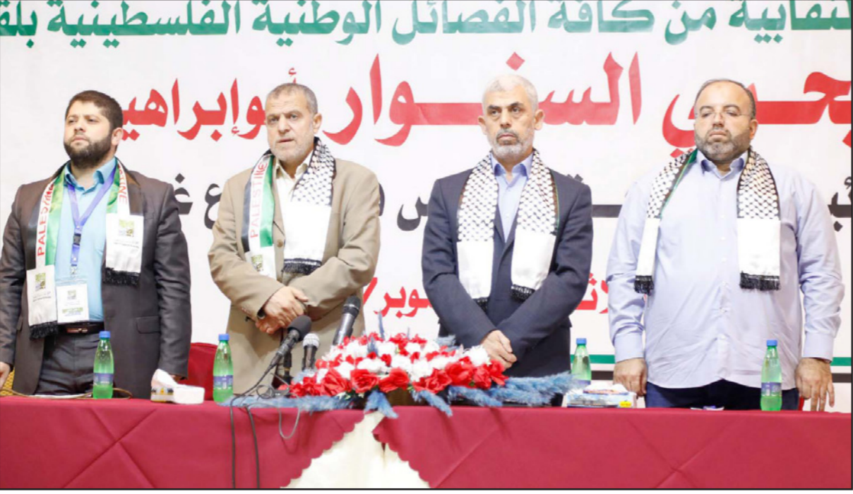
رئيس حركة حماس في قطاع غزة يحيى السنوار (الثاني من اليمين) وبعض عناصر الحركة

مبادرة ترامب تذكر بخطة أخرى تم نسيانها عرضتها إدارة ريغان في منتصف الثمانينيات، في حينه كان الحديث يدور عن 1.5 مليار دولار لخطة لخمس سننات من أجل تحسين ظروف الحياة في المناطق، والتي تضمنت ضمن أمور أخرى تطوير بنىة المياه. الأمريكيون قاموا بضح ربع مليار دولار إلى المناطق قبل التخلي عن الخطة بسبب جهود مضادة مارسها قيادة المفدى لـ م.ت.ف، والنهاية معروفة: بعد سنتين، في كانون الأول 1987 اندلعت الانتفاضة الأولى.