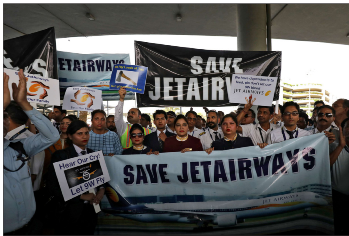
مستخدمون في «جت إيروايز» يتظاهرون مطالبين بإبقاء الشركة

■ مومباي/نيودلهي - رويترز: قال صدراعن مطلعان أن شركة الطيران الهندية المتعثرة «جت إيروايز» ستضطر إلى الإغلاق بحلول اليوم الأربعاء إذا لم تحصل على تمويل طارئ من مقرضيه.