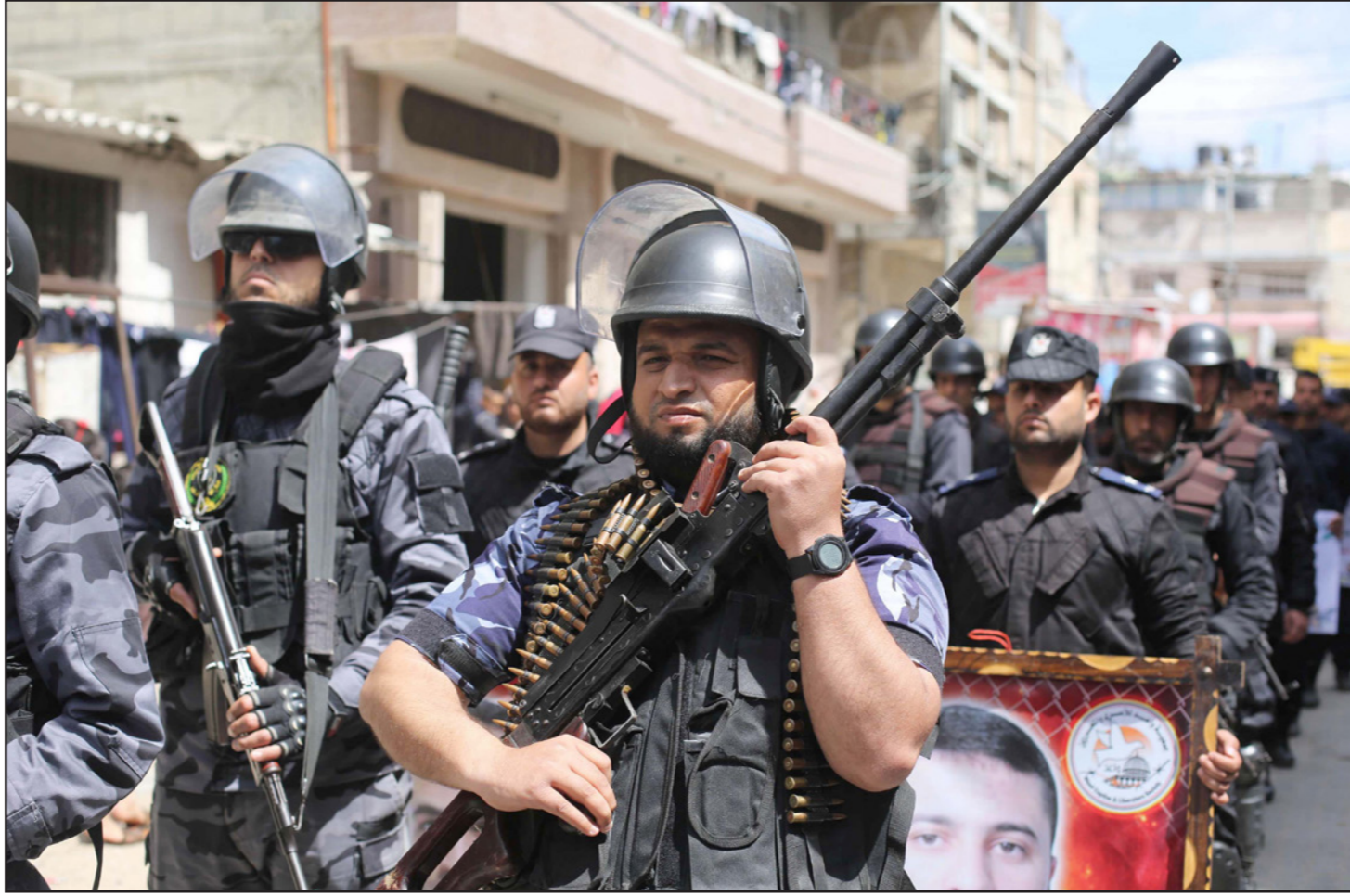
عرض عسكري في غزة في يوم الأسير الفلسطيني

وقفت في وجه سياسات العزل الانفرادي، والتضييق، والتكثيف الوحشي، الذي يمارسه الاحتلال، ورغم القيد والتضييق إلا أنهم يحققون انتصارات متتالية، كان آخرها الانتصار على إدارة السجون يوم أول من أمس، ورضوخها للمطالبهم.