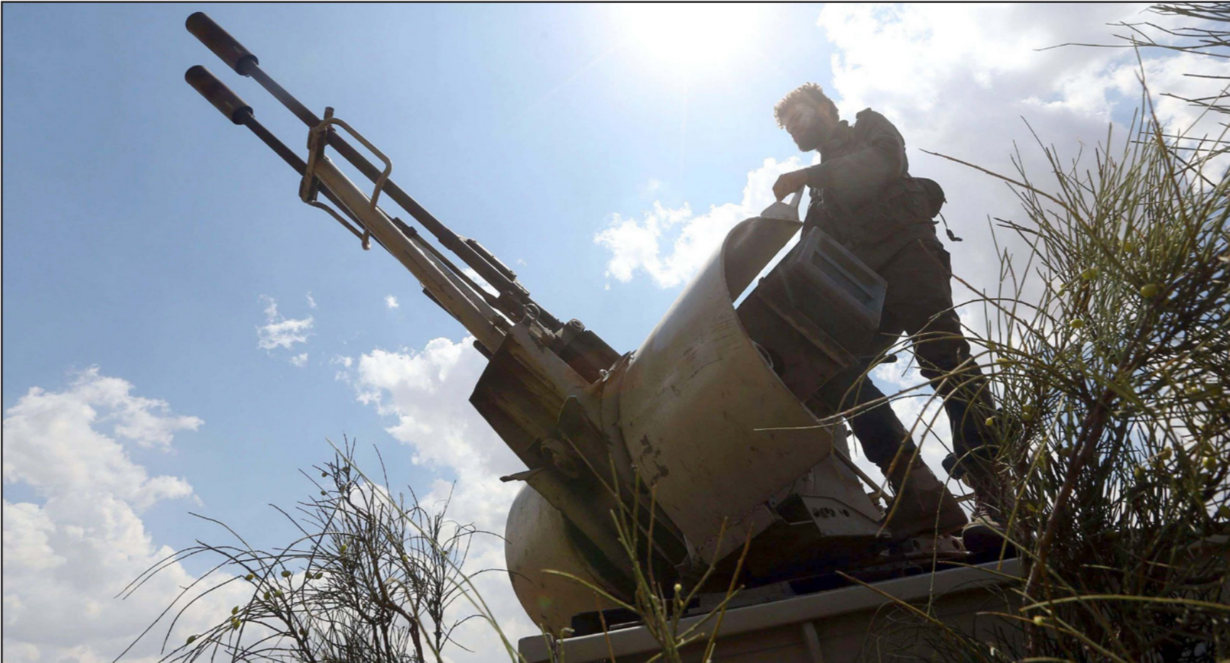
عنصر من القوات الليبية يتأهب لإطلاق قذيفة خلال اشتباكات مع القوات التابعة للجنرال حفتر في مدينة العزيزية