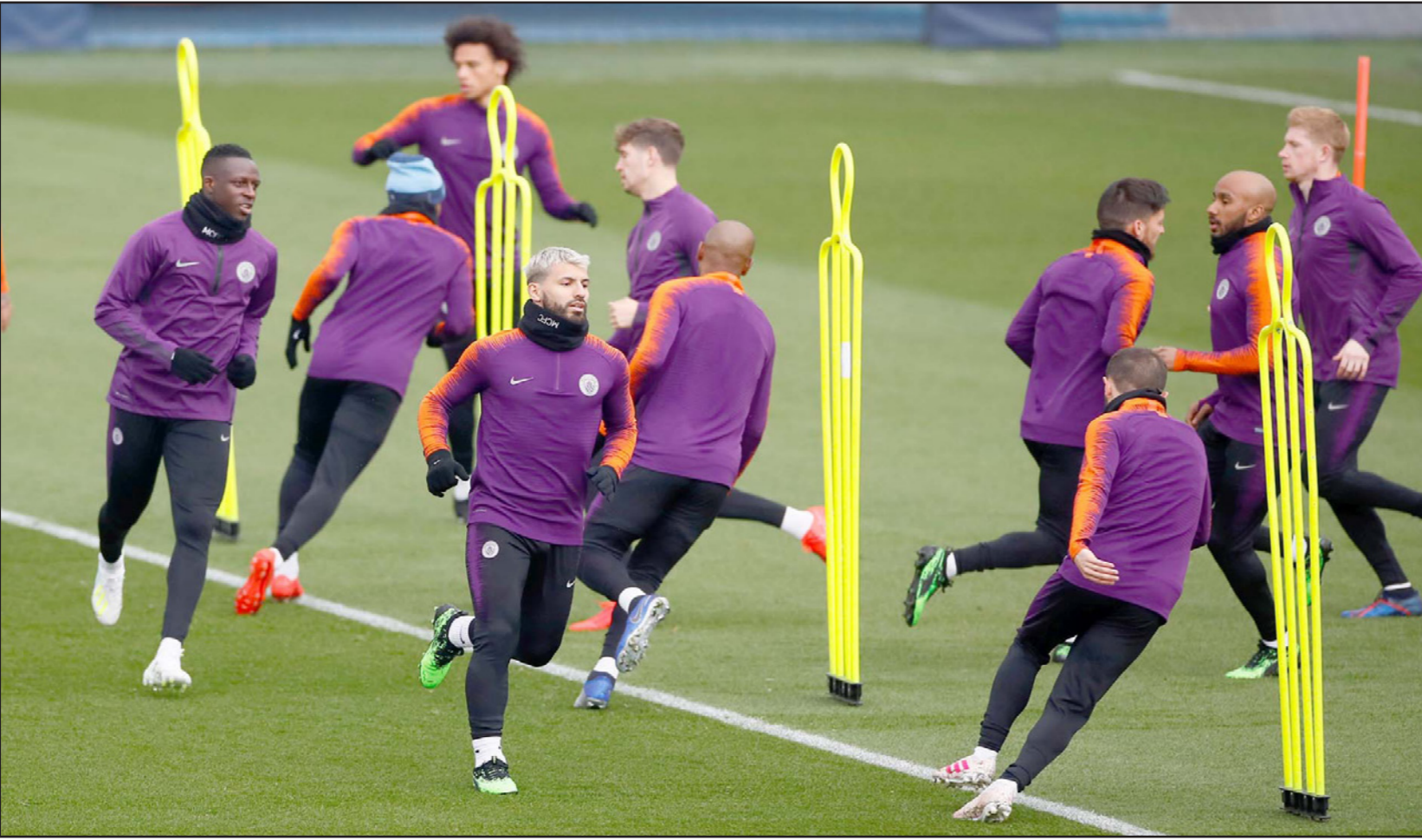
لاعبو مانشستر سيتي يخوضون الحصة التدريبية الأخيرة قبل لقاء توتنهام الليلة

■ لندن - د ب أ: يتطلع مانشستر سيتي الإنكليزي إلى تحقيق أقصى استفادة من عاملي الأرض والجمهور عندما يستضيف مواطنه توتنهام اليوم في إياب دور الثمانية لدوري أبطال أوروبا، بعدما انتهت مباراة الذهاب بينهما بغزو توتنهام 1/ صفر. وربما يكون السلاح الأبرز لدى السيتي في مباراة اليوم، طموحه لتحقيق إنجاز غير مسبوق، حيث لا يزال الفريق الذي يدرسه المدرب جوسيب غوارديولا بإمكانه إنهاء الموسم متوجاً بأربعة ألقاب، ولا شك في أن السيتي سيخوض المباراة بثقة كبيرة على ملعب «الاتحاد» الذي شهد نجاحه في تحقيق 24 انتصاراً خلال 26 مباراة على أرضه خلال هذا الموسم في كل المسابقات، وأبدى النجم الجزائري رياض محرز جناح السيتي تفاؤلاً في إزاء فرص الفريق في مواصلة المشوار بالبطولة الأوروبية، حيث صرح قائلاً عقب مباراة الذهاب أمام توتنهام: «نؤذي بشكل رائع على ملعبنا. سنستفيد كل ما لدينا وأشعر بأننا قادرين على الفوز». وأضاف: «لن نخفف رؤوسنا أبداً (لن نستسلم). لا يزال يتحتم علينا الفوز بالمباراة على ملعبنا». وتوج السيتي بالفعل بكأس رابطة المحترفين الإنكليزية ووصل إلى نهائي كأس الاتحاد الإنكليزي، إلى جانب منافسته بقوة مع ليفربول على لقب الدوري الممتاز هذا الموسم. وارتفع سقف طموحات جماهير السيتي حيث تأمل في إنهاء الموسم بأربعة ألقاب، رغم أن غوارديولا اعتبر أن هذا الأمر «مستحيل». ومع ذلك، بعد التتويج الأوروبي هدفا مهما طال انتظاره بالنسبة للسيتي، وتشكل مباراة اليوم