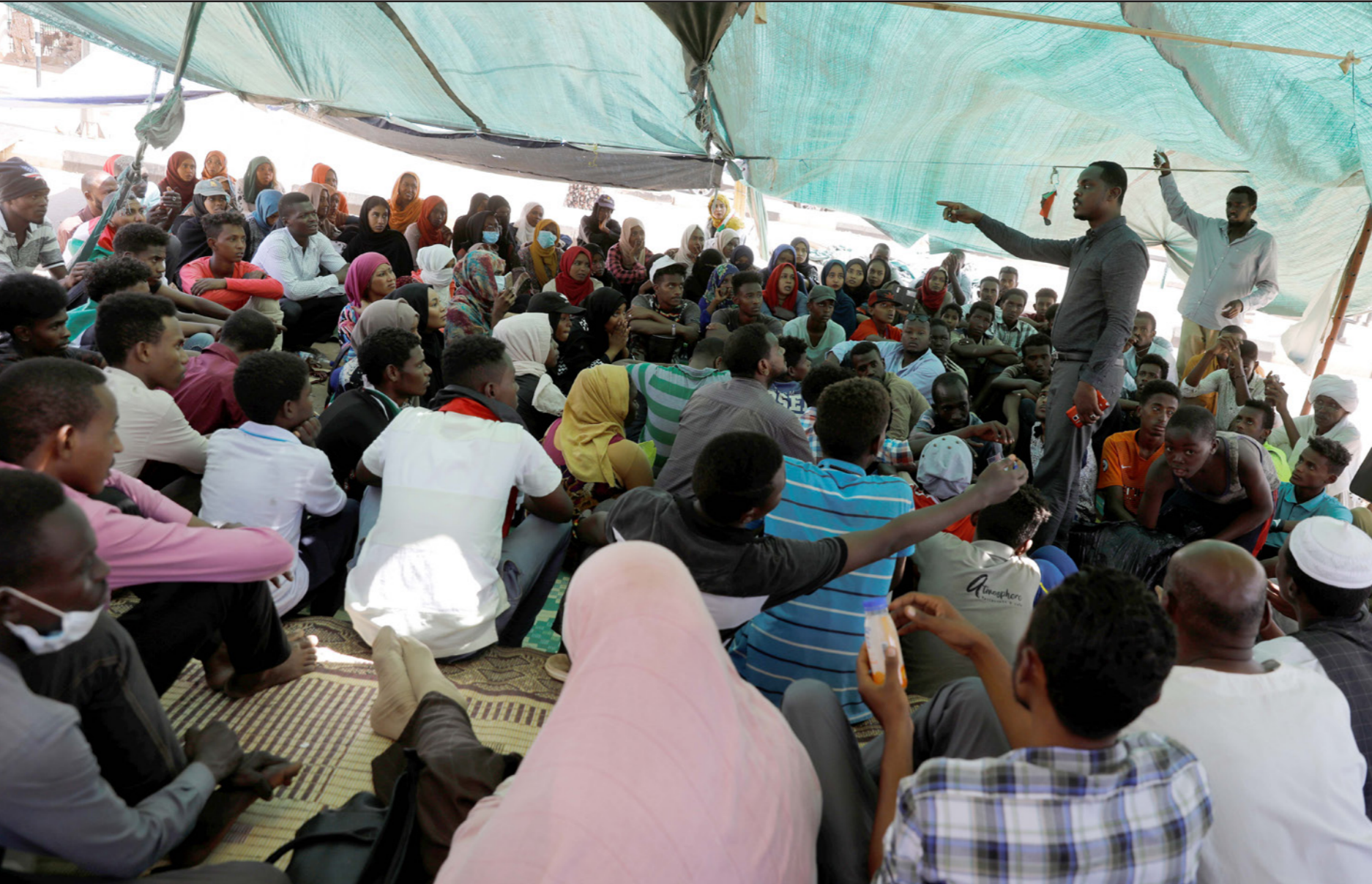
متظاهرون سودانيون داخل إحدى خيم الاعتصام في الخرطوم