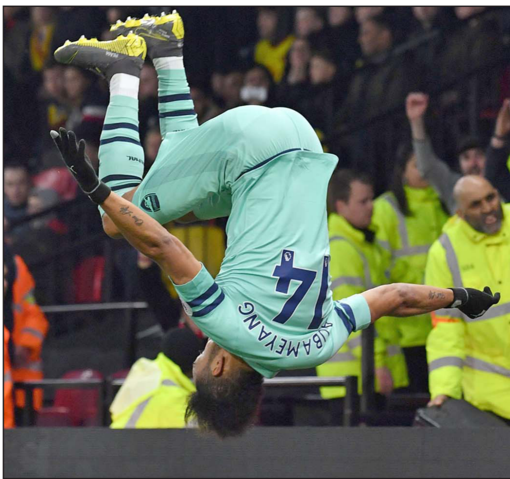
أوباميانغ يحتفل بشفليته المعتادة بعد تسجيل هدف الفوز لأرسنال في مرمى واتفورد