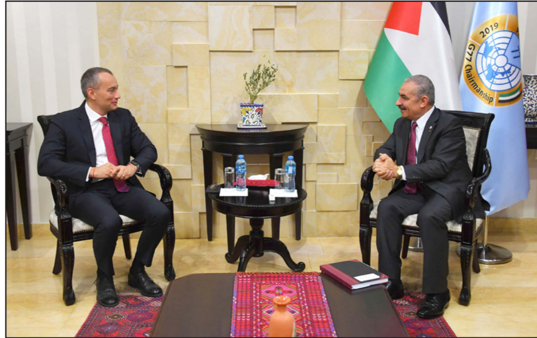
اشّية لدى استقبال الممثل الأممي ميلادينوف

من جانبه، هنا ميلادينوف اشّية على توليه رئاسة الحكومة، وأكد جاهزية الأمم المتحدة ومؤسساتها لتقديم الدعم لحكومته في مهماتها المقبلة.