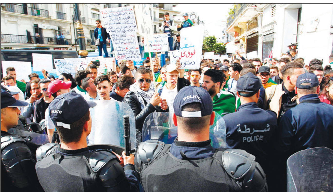
طلاب جزائريون خلال مظاهرة في العاصمة الجزائر أمس

الجزائر - «القدس العربي»: بعد الرئيس عبد العزيز بوتفليقة الذي اضطر للاستقالة تحت ضغط الشارع قدم رمز آخر من رموز النظام، الطبيب بلعيز، استقالته من رئاسة المجلس الدستوري الذي يلعب دورا أساسيا في تنظيم الانتخابات الرئاسية في تموز/يوليو. وأبلغ بلعيز أعضاء المجلس أنه «قدم لرئيس الدولة (عبد القادر بن صالح) استقالته من منصبه». ومباشرة بعد إعلان الاستقالة بدأ الطلاب المظاهرات والمجموعون في وسط العاصمة ترديد شعار «مازال بن صالح» ويقصدون ما زلنا ننتظر استقالة الرئيس الانتقالي بن صالح. هذه التظاهرات الجزائرية أسس أن الرئيس المؤقت قام بتعيين كمال فنيش رئيسا جديدا للمجلس الدستوري. وقال الفريق أحمد قايده صالح قائد أركان الجيش الجزائري، إن مرافقة الجيش للشعب خيار لا رجعة فيه، مشيرا إلى أن كل الأفاق تبقى مفتوحة من أجل إيجاد حل للأزمة في أقرب الأجل، وضرورة انتهاج أسلوب الحكمة والصبر، بالنظر إلى صعوبة وخصوصية الوضع الذي تعيشه البلاد ويعتبر وضعها خاصة ومعقد، يتطلب تضامنا جهود كل المواطنين المخلصين للخروج منه بسلام. واعتبر في خطاب لقاء في اليوم الثاني من زيارته إلى الناحية العسكرية الرابعة، أن كل الأفاق الممكنة تبقى مفتوحة في سبيل التغلب على مختلف الصعوبات وإيجاد حل للأزمة في أقرب الأوقات، معتبرا أن الوضع لا يحتمل المزيد من التأجيل، لأن الوقت يدهاننا، وأن الجيش يعتبر نفسه مجددا على الدوام، إلى جانب كل المخلصين، لخدمة شعبه ووطنه، وفاء منه للمعهد الذي قطعته على نفسه في تحقيق مطالب الشعب وطموحاته المشروعة في بناء دولة قوية، آمنة ومستقرة، دولة يجد فيها كل مواطن مكانه الطبيعي وأماله المستحقة.