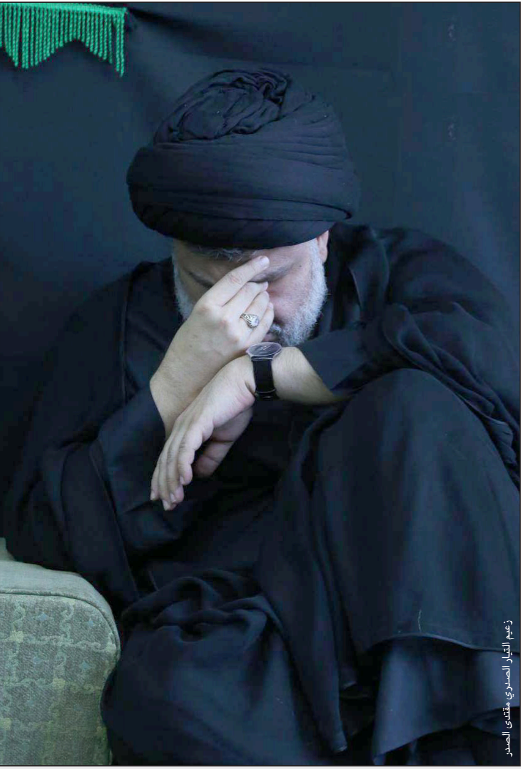
زعيمة التيار الصدري مقتدى الصدر

بخوض «حرب ثانية» بعد نجاح الحرب الأولى المتعملة بحاربية الإرهاب. في هذا الشأن أيضاً، عزا السفير البريطاني لدى العراق، جون ويلكس، تردي الاقتصاد العراقي إلى عدة عوامل أبرزها الفساد والبيروقراطية وقوانين الاستثمار. وقال في مقطع فيديو نشرته السفارة في صفحته على «فيسبوك»، أمس، إن «العراق مع كل الإمكانيات من الموارد الطبيعية والبشرية فإن بيئة الأعمال حسب المعايير الدولية هي أفضل في أفغانستان بالمقارنة مع العراق وحتى نيجيريا، مع كل تحدياتها ومشاكلها فإنها تستفيد من كل برميل للنفط أكثر من العراق بثلاثة أضعاف ونصف يعني مزيد من القيمة الاقتصادية للثروة الوطنية». وبين أن «هذا الأمر غير مقبول لسلك العراقيين ولكل أصدقاء العراق بما في ذلك المملكة المتحدة، ونريد مساعدة العراق في إدخال الإصلاحات الضرورية وتنفيذ المشاريع الآن»، وزاد: «لتوضيح للشعب العراقي فإن الشراكة بين العراق وشركائه الرئيسيين في الاقتصاد وفي الأعمال والتجارة والاستثمار تؤدي إلى نتائج إيجابية ملموسة على الأرض». يأتي تصريح السفير البريطاني في ظل زيارته للعراق بشكل واضح وكبير، مجدداً رغبة الحكومة البريطانية بتعزيز علاقاتها مع العراق وزيادة الاستثمارات بشكل أكبر، وتقديم الخبرات في المجالات المالية والقانونية وخلق فرص العمل».