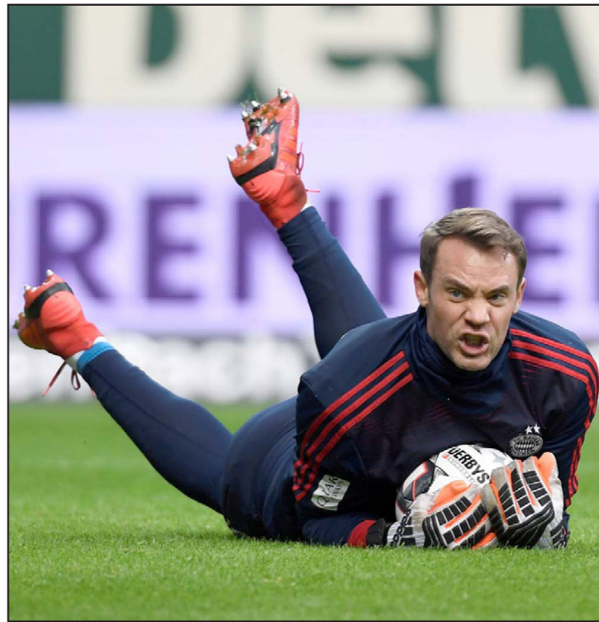
نوير مستاء من عودة الإصابات لطرادته خلال الموسم الجاري

■ ميونيخ (ألمانيا) - د ب أ: دعا مانويل نوير نجم حراسة مرمى بايرن ميونيخ، وسائل الإعلام للحضور إلى ملعب تدريب الفريق، حيث يسعد مؤتمراً صحفياً اليوم الأربعاء، عقب إصابته خلال مباراة الفريق البافاري أمام فورتونا دوسلدورف الأحد في الدوري الألماني. وكان نوير (33 عاماً) غادر الملعب خلال المباراة التي انتهت بفوز البايرن 1/4، بسبب إصابة في ريلة الساق (عضلة السمانة)، وأعلن النادي البافاري أنه من المتوقع أن يغيب الحارس لمدة أسبوعين. واستبعد نوير بذلك من المشاركة في مباراة البايرن المقبلة أمام ضيفه فيردر برين السبيت المقبل وكذلك المباراة التالية للبايرن أمام بريمن، على ملعب الأخير، في الدور قبل النهائي ببطولة الكأس، بعدها بأربعة أيام. وكتب نوير عبر وسائل التواصل الاجتماعي: «أشعر بالتحفاؤل إزاء عودتي لحراسة المرمى مجدداً قبل نهاية الموسم». ويتصدر البايرن بفارق نقطة واحدة أمام غريمه بوروسيا دورتموند، قبل خمس مراحل من نهاية السابغة هذا الموسم.