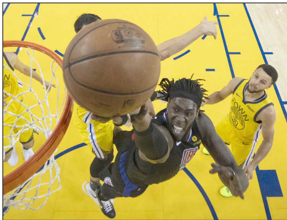
نجم كليبرز هاريلن يهدر تقدمه بفارق 31 نقطة ويخسر أمام وايريوز خلال الفوز الراح

■ واشنطن - رويترز: أهدر غولدن ستيت وايريوز حامل اللقب، تقدمه بفارق 31 نقطة ليخسر 135-131 أمام لوس أنجليس كليبرز في المباراة الثانية بالمرحلة الأولى من الأدوار الإقصائية لدوري السلة الأمريكي للمحترفين. وأردك كليبرز التعادل 1-1 في السلسلة التي تحسم على أساس الأفضل في سبع مباريات، وتقام المباراة الثالثة مساء الخميس في لوس أنجليس.