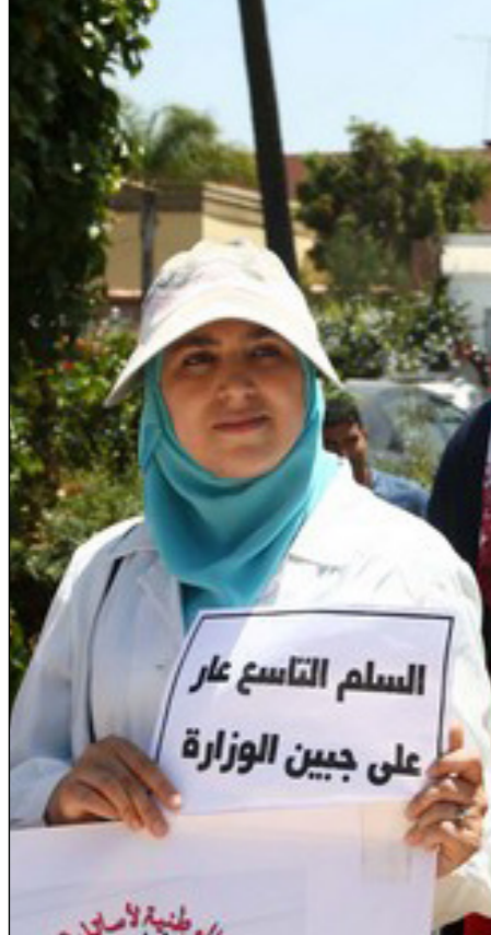
جانب من وقفة احتجاجية للمعلمين

نداءات تعليمية مغربية تحشد لإضراب وطني وتحمل الحكومة مسؤولية احتقان أوضاع التعليم