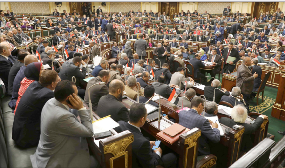
البرلمان المصري خلال جلسة التصويت على التعديلات أمس

وأعلنت «استمرار رفض الانقلاب العسكري، وكل ما ترتب عليه من إجراءات باطلة، وتأكيد أن تلك التعديلات لا تمنح المخلطين أية شرعية، فما بُني على باطل فهو باطل، وإعادة حقوق اختيار الشعب، ومواصلة المقاومة السلمية للانقلاب العسكري وطمعته الخائنة الفاسدة حتى إسقاط ذلك الانقلاب، وبمسئولية التي الشعب المختلفة وتحقيق أهداف ثورة الخامس والعشرين من يناير 2011، والتعاون في ذلك مع كل المخلصين من أبناء الوطن».