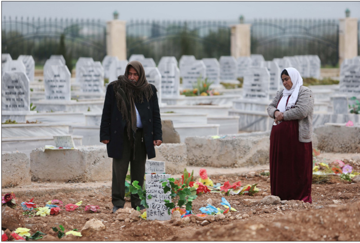
والدان يزوران قبر ابنتهما التي قتلت أثناء المعارك شرق الفرات

وتوقع الدسوقي في «أن المنطقة الآمنة التي تريدها تركيا لن تبصر النور قريباً» مستنداً على نتائج «خارطة طريق منبج» بين الجانبين التركي