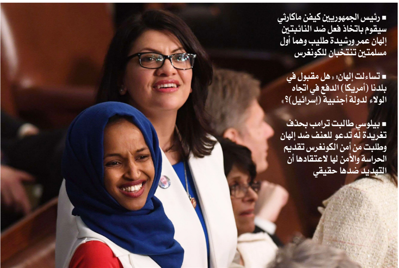
إهانة عمر (في الواجهة) ورشيدة طليب

■ رئيس الجمهوريين كيفن مكارثي سيقوم باتخاذ فعل ضد الناخبين إهانة عمر ورشيدة طليب وهما أول مسلمتين تنتخبان للكونغرس