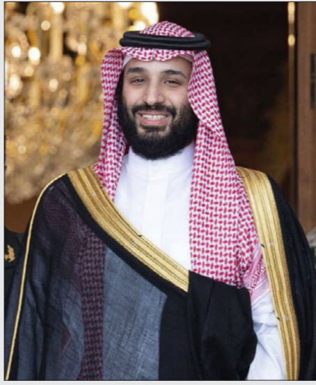
محمد بن سلمان

وتضيف أن التدخل العربية وروسيا قامت عمداً بتخريب الجهد الدولي الذي حظي بدعم الاتحاد الأوروبي والاتحاد الإفريقي والولايات المتحدة بالإضافة للأمين العام للأمم المتحدة أنطونيو غوتيريش. وتعترف الصحيفة أن حفتر حصل على