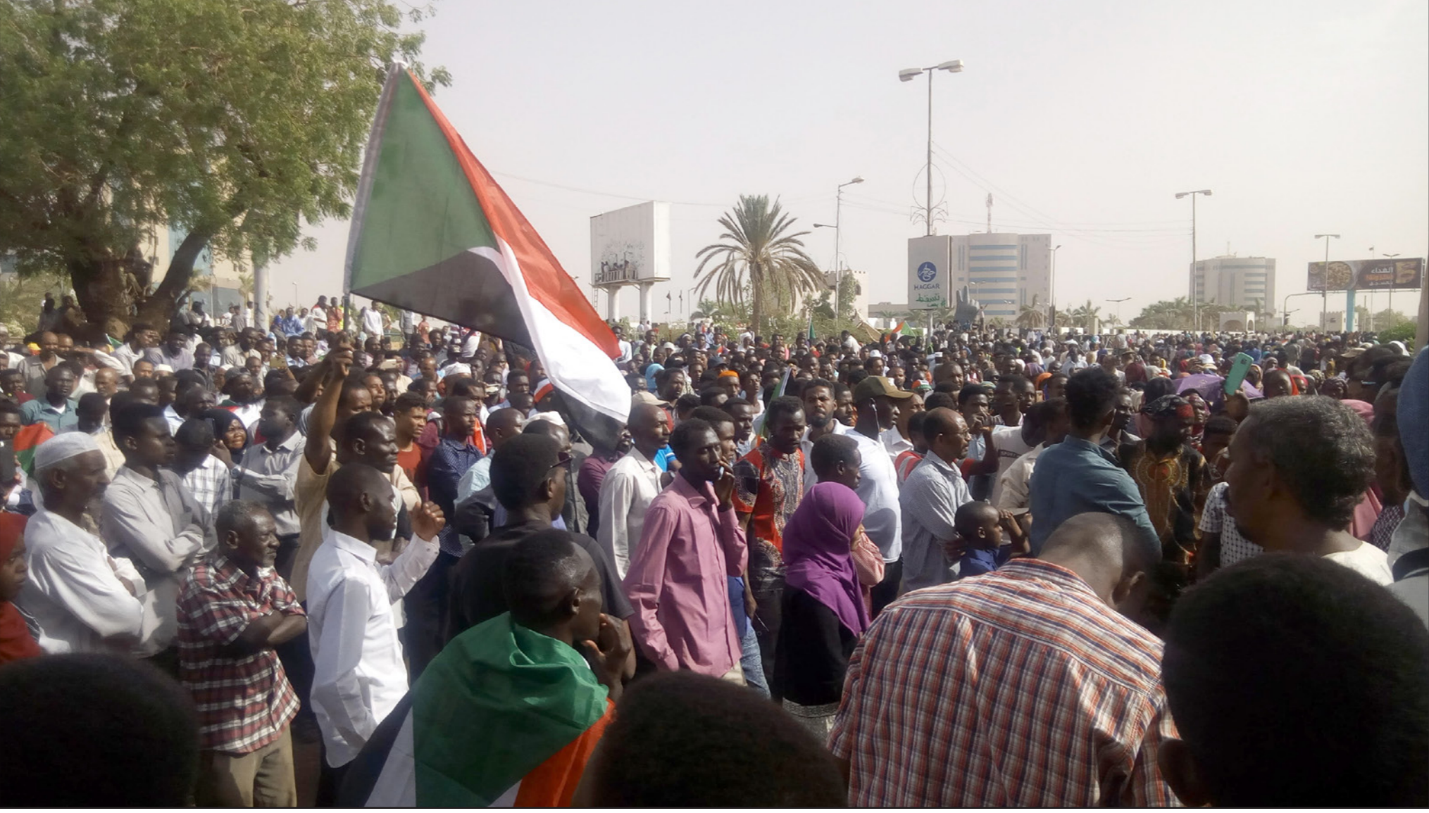
سودانيون يعصمون أمام وزارة الدفاع في الخرطوم