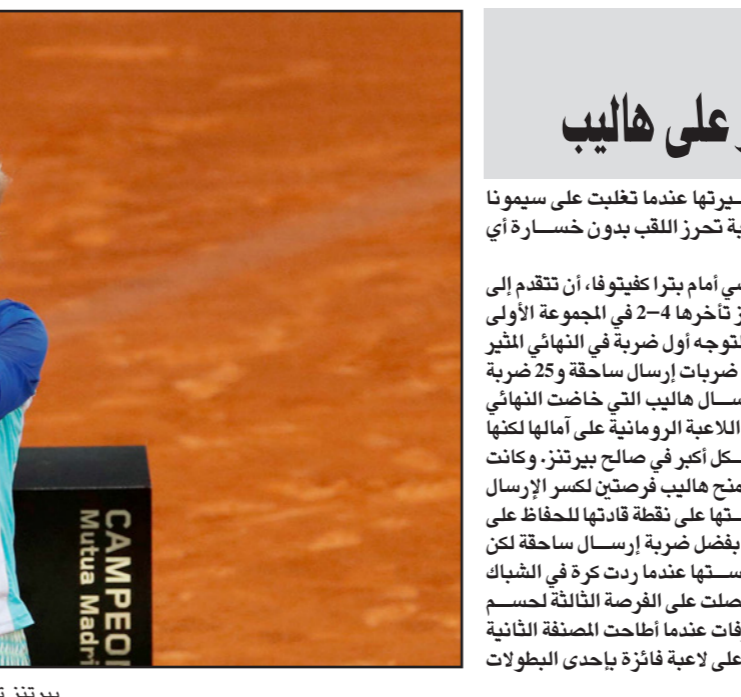
بيرتنز ترفع كأس البطولة إلى جانب وصيفتها هاليب