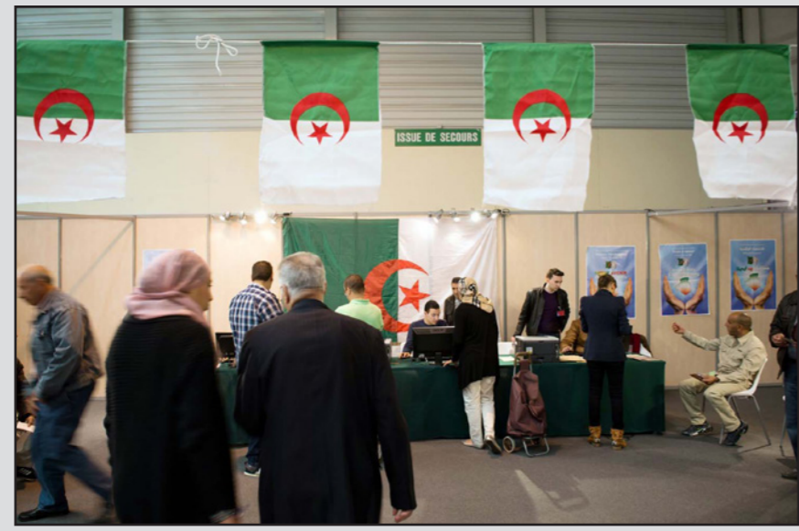
مركز انتخابات في الجزائر

إلى نتائج فظيعة، وستضع الجيش قبالة شعب متضامن ومتحد، وفي هذه الحالة لن تكون هناك مبررات لفرض إجراءات استثنائية.