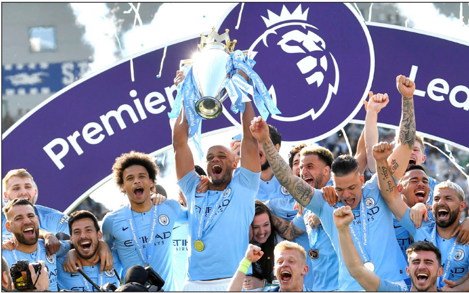
كومياني قائد مانشستر سيتي يرفع اللقب الى جانب زملائه نجوم الفريق