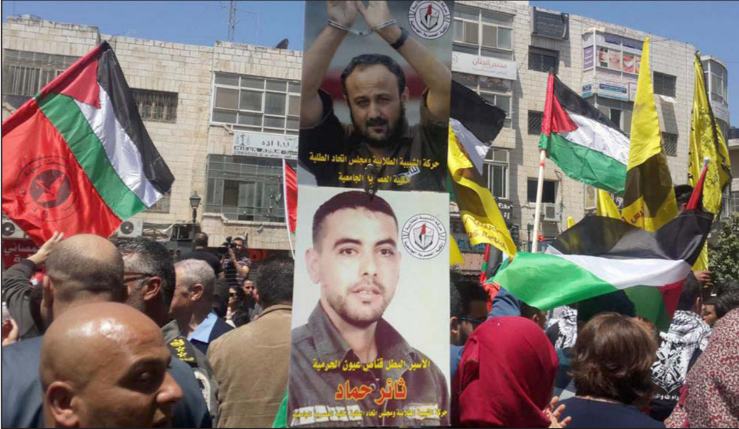
مظاهرات لأهالي السجناء الفلسطينيين احتجاجاً على الأوضاع المزمنة داخل سجون الاحتلال

مصلحة السجون ردت على ذلك على أنه بخصوص الظروف الصحية ومشكلة الحشرات «الملاحظات عولجت في كل السجون ومنشآت الاعتقال، العلاج الجاري تم عن طريق المبيدات والرش والدهان، في صيف 2018 تم تشكيل لجنة في مصلحة السجون قامت بعمل شامل بهدف فحص ظروف المعيشة، وفي أعقاب توصياتها خصصت ميزانية محددة من الأقسام التي يتم فيها اعتقال السجناء لزيادة عدد حول التقييد كوسيلة للتصدي، مصلحة السجون قالت إن التوجهات في هذا الموضوع تمت معالجتها وتحديثها، وأنه «في أعقاب التفتيش في سجن شكما أصدر توجيه شامل يمنع التقييد على جانبي الرأس»، وحول الاحتفاظ ورد: «ظروف معيشة السجناء والمعتقلين تم دمجها في خطة بقرار من الحكومة، وحتى 30 نيسان في كل وحدات مصلحة السجون فإن مساحة المعيشة المخصصة للسجناء هي 3 أمتار، مصلحة السجون واصلت تطبيق قرار المحكمة العليا وبدأت بالرحلة الثانية من القرار من أجل الوصول إلى مساحة معيشة تبلغ 4.5 متر مربع.