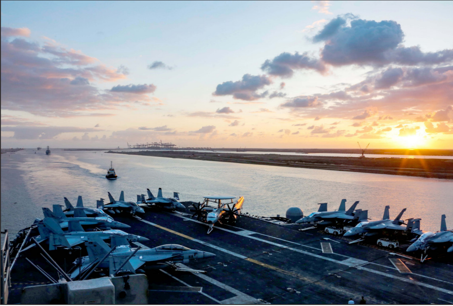
حاملة الطائرات الأمريكية أبراهام لينكولن خلال عبورها قناة السويس

معتبراً مواقف السياسة الأوروبية كتكتسب القيمة إذا انطوت على نتائج عملية، ورداً على سؤال حول الترسانة الصاروخية الإيرانية، واصفاً إياها بأنها دفاعية واستراتيجية وذات طبيعة ردعية في مواجهة التهديدات بالمنطقة، مؤكداً في الوقت ذاته على أنها غير قابلة للتفاوض، مشيراً إلى أن فرنسا لا تتفاوض مع أحد حول أسلحتها الاستراتيجية كذلك، ونوه إلى أن قرار مجلس الأمن 2231 لا يضع قيوداً حول إنتاج واختبار الأسلحة التي لا تصنع لحمل الرؤوس النووية.