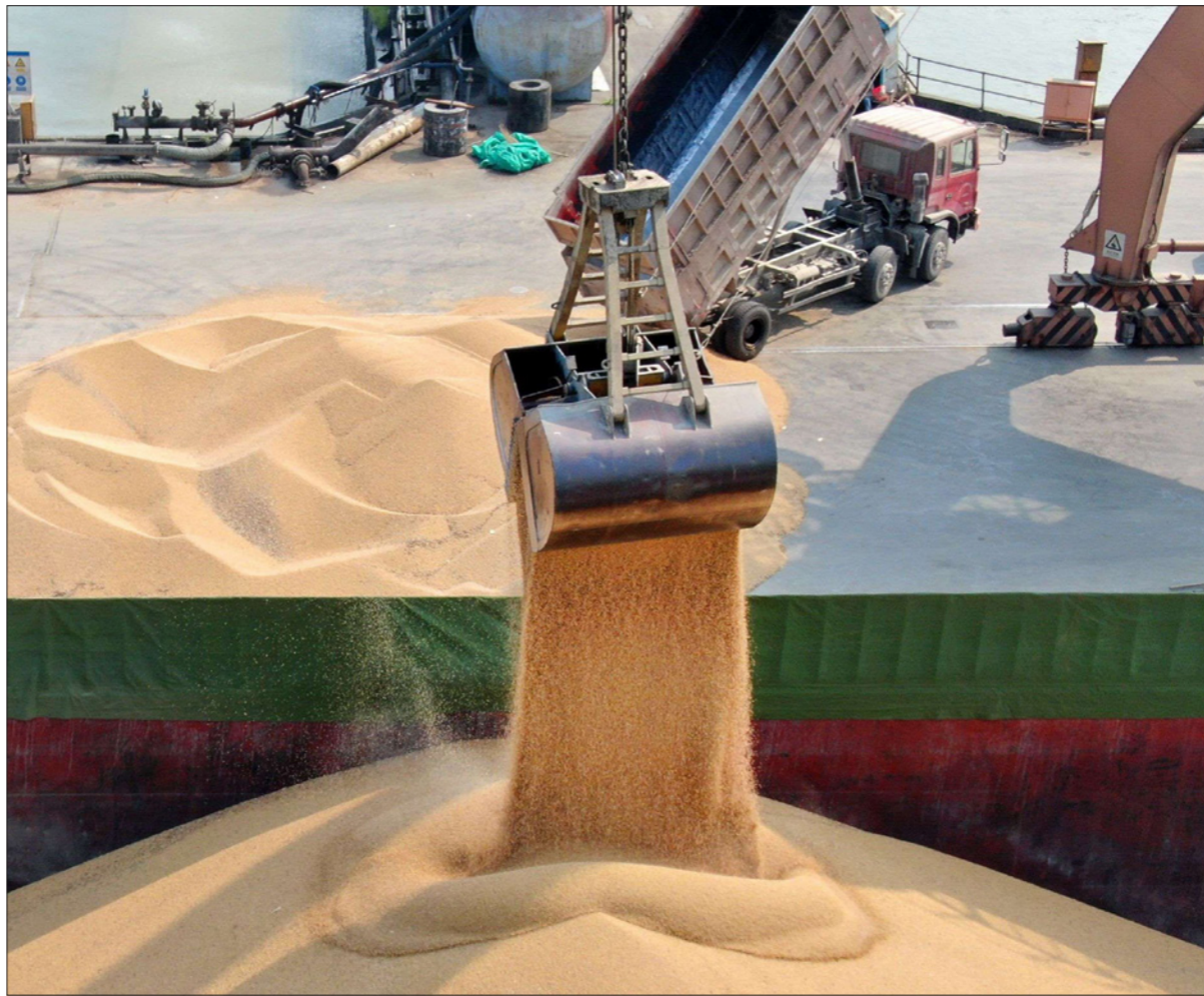
فول الصويا المستورد من أوكرانيا يصل إلى ميناء تانغتنغ الصيني حيث تبحث بكين عن مصادر غير أمريكا لاستيراد المنتجات الزراعية

ويبلغ معدل إنتاج حقول شركة نفط ميسان حالياً 630 ألف برميل يوميا ومن المنتظر رفع معدلات الإنتاج إلى 700 ألف برميل يوميا في نهاية العام الحالي وإلى 750 ألف برميل يوميا العام المقبل.