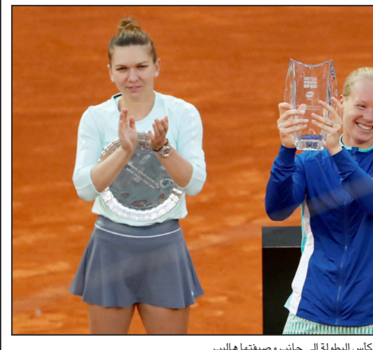
بيرتنز ترفع كأس البطولة إلى جانب وصيفتها هاليب