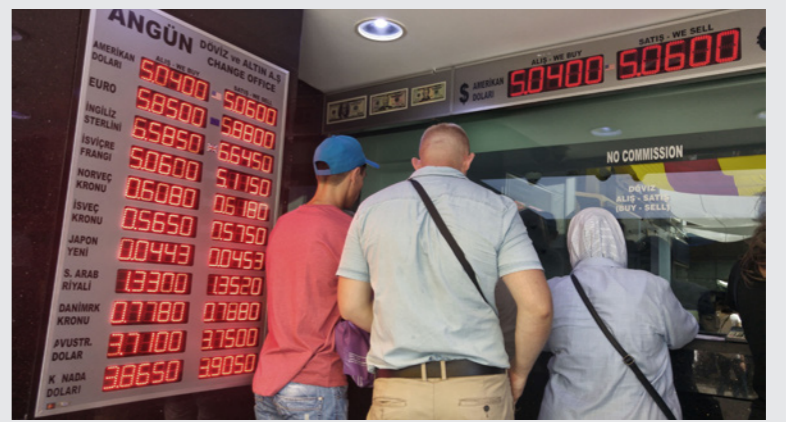
زبائن في أحد محال الصيرفة في اسطنبول

اسطنبول - رويترز: قال وزير المالية التركي براءت البيروق أمس الأحد إنه يأمل في أن يتغلب الاقتصاد التركي على أزمة العملة التي تشيبت العام الماضي عبر ضلّين فقط من الانكماش. وفي حديثه لقناة (سي. إن. إن. ترك)، أشار الوزير إلى أداء تركيا خلال الأزمة المالية العالمية في 2008 حينما انكمش الاقتصاد أربعة فصول متتالية، «أمل أن تتجاوز تركيا هذه الفترة بضلّين من الانكماش، وباقل تأثير سلبي». كان الاقتصاد التركي انكمش ثلاثة في المئة على أساس سنوي في الربع الأخير من 2018، بعدما تسببت أزمة العملة في خسارة الليرة نحو 30 في المئة من قيمتها العام الماضي، ويتوقع خبراء اقتصاديون انكماشاً لربعين آخرين على أساس سنوي، وفقدت الليرة نحو 15 في المئة