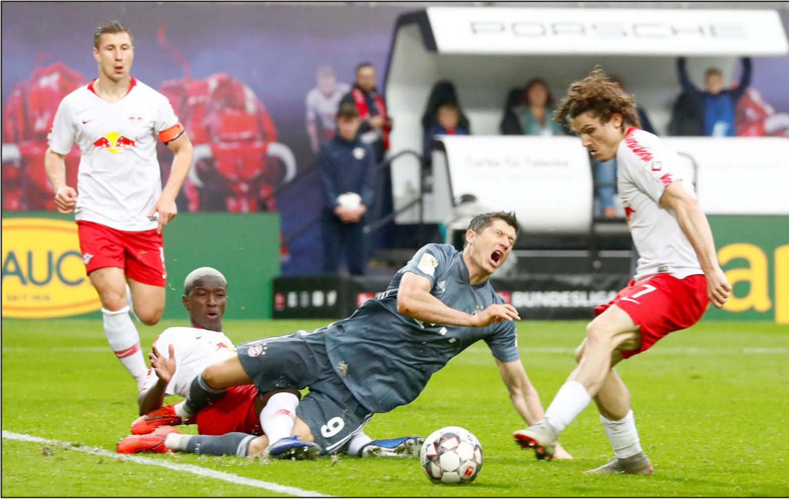
هايدرا مدافع لايبزيغ يعيق مهاجم البايرن ليغاندوسكي خلال اللقاء السليبي

برلين - د ب أ: مع استمرار المنافسة على لقب الدوري الألماني، بين بايرن ميونخ وبوروسيا دورتموند للجولة الأخيرة السبت المقبل، أعاد هذا الموسم للذهاب أعوام 1978 و2000 و2009.