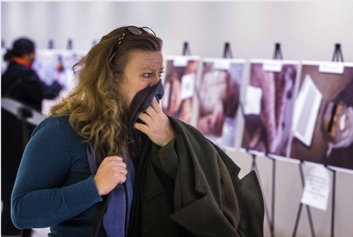
زائرة معرض في لندن تبدو عليها الصدمة لدى رؤيتها صوراً للمصور السوري «قيصر» الذي وثق الطريقة الوحشية التي يستخدمها النظام ضد المعارضين له

2016 شكك الأسد بصحة كل المعلومات التي قدمها الناجون وعائلات المفقودين، وعندما سئل عن حالات بعينها قال الأسد «هل تحدثين عن اتهامات أمام حقائقي»، واقترح أن العائلات كذب عندما قالت إنها شاهدت قوات الأمن تجر أعزاهما، وقال إن الانتهاك أخطاء لا يمكن تجنبها في الحرب «تحدث هنا وفي كل العالم وأي مكان» و«لكنها ليست سياسة»، وتقول الصحفية إنها قابلت على مدى السنوات الماضية الناجين من المعتقلات وأطلعت على كم هائلين من الوثائق والمذكرات وفحصت مئات الصفحات من شهادات شهود قدمت لمنظمات حقوق الإنسان وكانت قادرة والحالة هذه على رسم صورة عن نظام