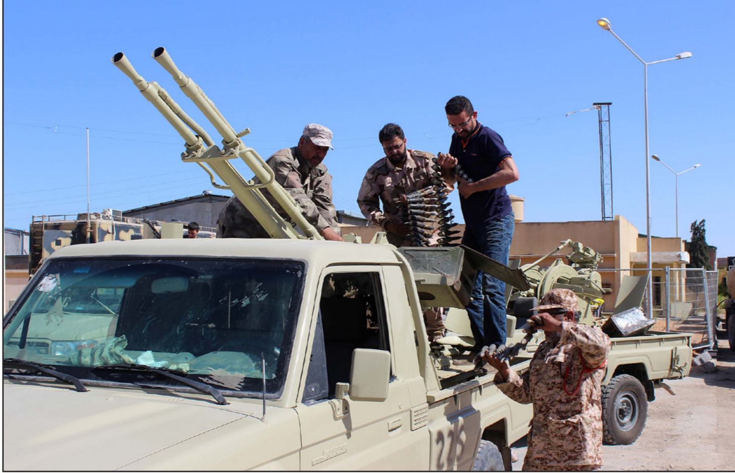
قوات تابعة لحكومة الوفاق الليبية

الضعيف، وكشفت صحيفة «واشنطن بوست» الأمريكية في تقرير، الأحد، إنه بعد أسابيع على هزيمة «داعش» المتقهقر، يعتقد أن آلاف المقاتلين التونسيين وأفراد أسرهم محتجزون في سوريا والعراق وفي ليبيا، حيث يسعى أقرباء هؤلاء لإعادتهم إلى تونس، لكن السلطات الحكومية ترفض خوفاً من انتقال إرهابي «داعش» إلى البلاد، ووزع بسذور التطرف في المستقبل، ونقل التقرير عن مبررات المسؤولين التونسيين أنهم يواجهون عواقب في إعادة هؤلاء إلى ديارهم بسبب الوجود الدبلوماسي الضعيف لتونس في ليبيا وسوريا. ومع هذا، فإنه مع مواجهة تونس اضطرابات اجتماعية والجماعات المسلحة على أراضيها، إلا أنه لا توجد إرادة سياسية تذكر لإعادة الأسر. وسافر ما لا يقل عن 5000 تونسي إلى سوريا والعراق وليبيا للقتال، إذ كان هذا العدد كبيراً مقارنة مع عناصر من جنسيات أخرى، غير أن السلطات التونسية زعم أن العدد أقل من ذلك، حيث تشير إلى أنه بلغ الـ3000. ومع هذا، فإنه يعتبر كبيراً. وحسب «واشنطن بوست»، لا يزال عدد كبير من هؤلاء النساء والأطفال محتجزين في سجون داخل سورية والعراق وليبيا، ففي معظم الحالات يكون الأطفال دون سن 6 سنوات، وكثير منهم قد ولدوا في كنف «داعش» المهزوم، وبالتالي فهم يفتقرون الآن إلى جوازات سفر وشهادات ميلاد معترف بها دولياً.