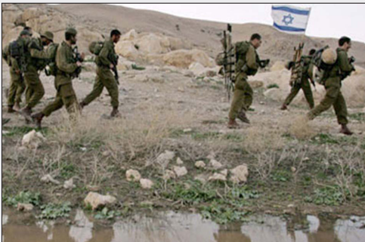
عناصر من الجيش الإسرائيلي في غور الأردن

يزيد الجيش الإسرائيلي التدريبات، في خدمة المستوطنات وبروح القائد الأعلى سوتريتش.