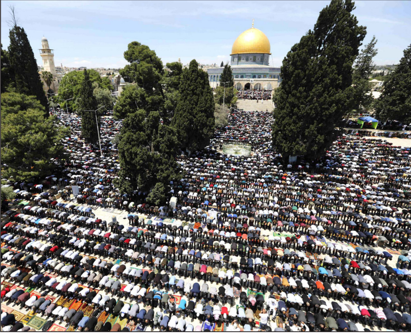
مئات آلاف المصلين الفلسطينيين يؤدون صلاة الجمعة الماضية

الاعتكاف، بعد أداء الآلاف صلاتي العشاء والتراويح.