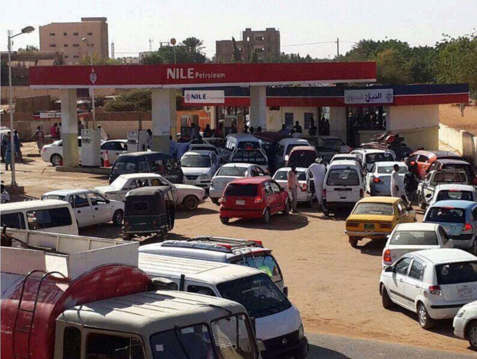
طوابير السيارات أمام محطة وقود في الخرطوم أحد مظاهر الأزمة الاقتصادية

ويضيف أن الفساد هو العامل الأكبر في الوضع الحالي إضافة لعدم ترتيب الأولويات من إدارة حكومة البشير السابقة الأمر الذي خلق أزمات خانقة في الدقيق والوقود والسيولة النقدية وتراجع سعر العملة المحلية أمام الدولار مما أدى لارتفاع جنوني في الأسعار. ويرى أن الاستقرار السياسي هو العمل الأول في انتعاش الاقتصاد والانتعاش من الأزمات، مشيراً إلى الإمكانيات الهائلة التي يتمتع بها السودان في مجال الذهب والمعادن الأخرى، إضافة للمجال الزراعي الذي يمثل المخرج الأول وكذلك السياحة والاستثمار الخارجي.