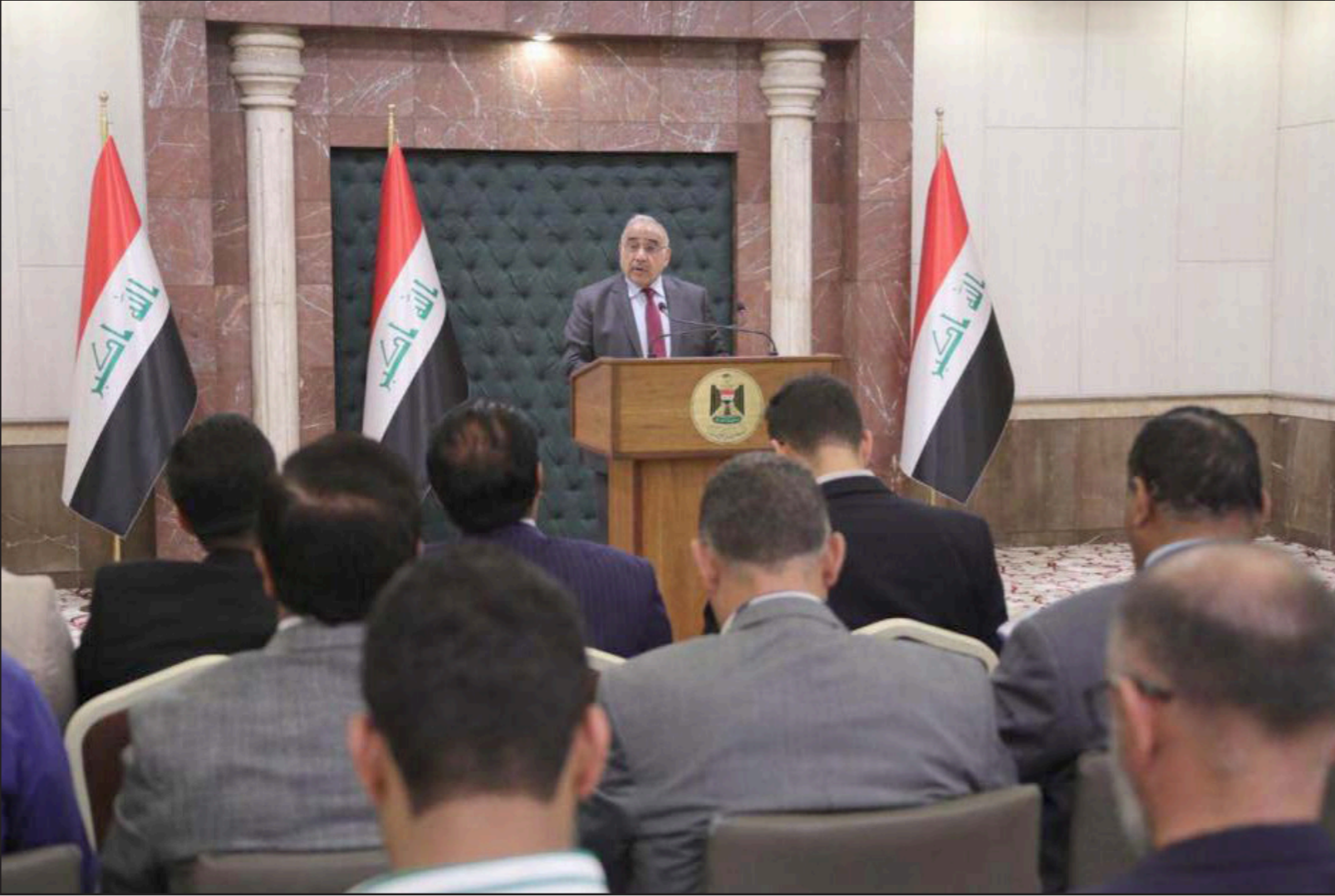
رئيس الوزراء العراقي عادل عبد المهدي خلال مؤتمر صحفي

الدولة بحاجة إلى مراجعة جادة لتحقيق ثورة ادارية حقيقية». وبين أن «المعيار الحقيقي لنجاح البرنامج الخدمي الذي تقدمت به الحكومة هو الانطباع الشعبي والنخبوي عن تنفيذ هذا البرنامج»، وحثهم أن «يجب عدم الاكتفاء بتشكيل المجلس الأعلى لمكافحة الفساد وإنما لا بد من إقناع الشعب بأن هنالك خطة واضحة وملموسة لمكافحة الفساد عن طريق العالجة الفعلية لظواهر الفساد التي لازالت تتفاقم باستمرار».