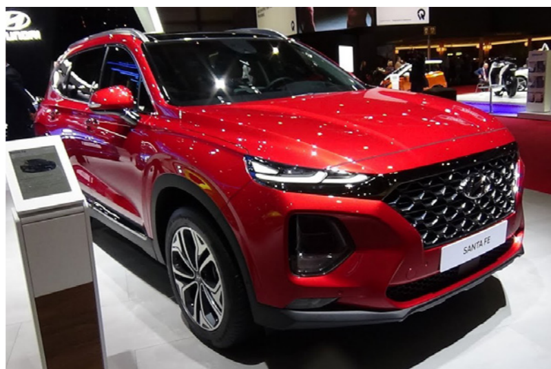
سيارة «هيونداي» في معرض في جنيف

قوله إن الاستدعاء، الذي سيبدأ في 28 حزيران/ يونيو، يشمل أكثر من 10 طرازات بينها «بيتل» و«غولف» و«شبروكو» و«أودي» و«ساجيتار». وقد تؤدي وحدات التحكم المعيبة في صندوق