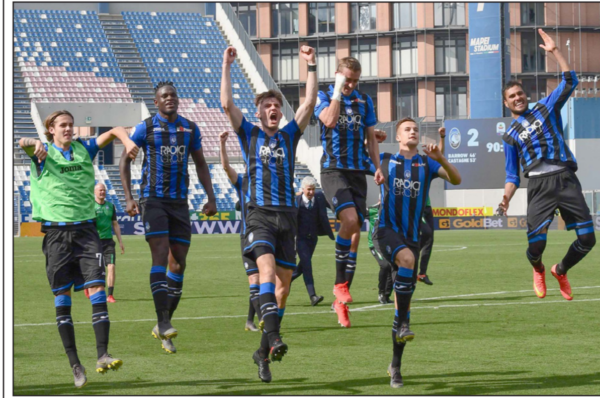
لاعبو أتالانتا يحيون جماهيرهم بعد انتصار جديد يقربهم من التاهل الى دوري الأبطال

روما - د ب أ: تقدم أتالانتا مؤقتا إلى المركز الثالث بالدوري الإيطالي بفضل الفوز على ضيفه جنوي 1/2 في المرحلة السادسة والثلاثين، وفاز لاسيو على ضيفه كالياري 1/2 وميلان على ضيفه فيورنتينا 1/صفر.