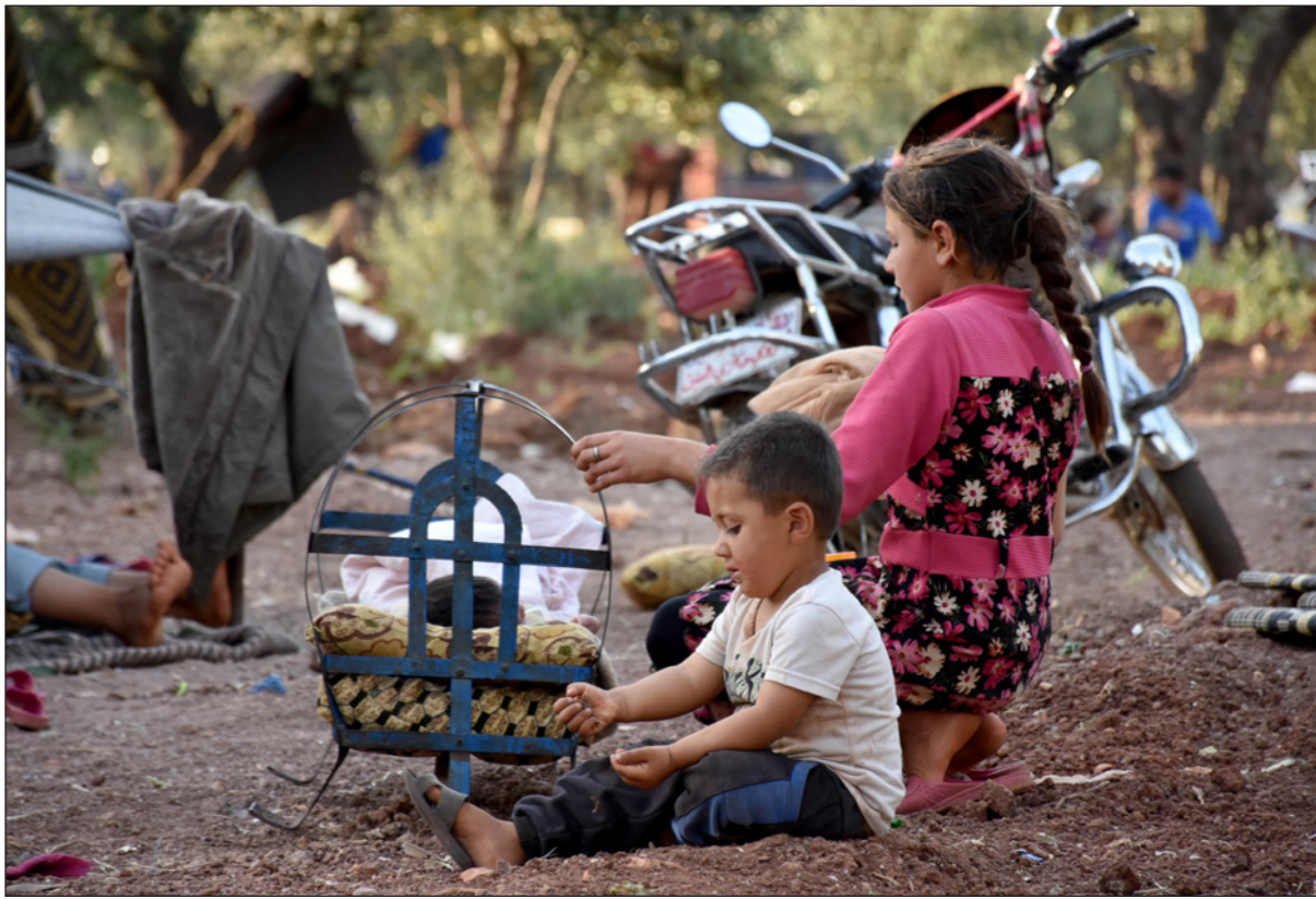
لاجئون سوريون في الغراء وتحت شجر الزيتون على الحدود مع تركيا

لكن الموقف التركي، حسب ما يقول هو «موقف يتيم وتركيا تصارع ليوحدها القوي والمصالح الدولية ساعية إلى تضييد المنطقة خطر المجزرة والكارثة الإنسانية ورغم ذلك فهي لم تتدخل عن إدلب كما يروج البعض، فهي لو تخلت عن اتفاق سوتشي لكانت النتيجة اجتياح ادلب بالكامل».