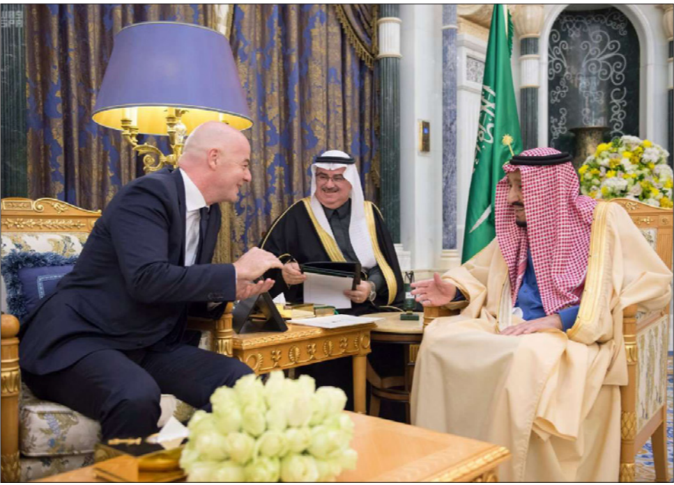
الملك سلمان مستقبلا جيانني إنفانتينو رئيس الاتحاد الدولي لكرة القدم في الرياض

السعودية في نيسان/إبريل عن إعدام 37 سعودياً، معظمهم من الأقلية الشيعية، وربما لم يحصلوا على محاكمات عادلة. ومن بينهم ثلاثة كانوا قاصرين وقت اعتقالهم. وتقول إن العلاقات المثلية تعتبر جريمة في السعودية ويعاقب مرتكبها بالقتل والجلد. ولا يوجد في البلد صحافة حرة، وهي مطلب جوهرى لأي دولة تريد استضافة مباريات كأس العالم. وفي تشرين الأول/أكتوبر العام الماضي قام عملاء سعوديون بقتل وتقطيع المساهم في «واشنطن بوست» جمال خاشقجي بسبب انتقاده للحكومة السعودية. ولا تزال السعودية حتى الآن تفرض نظام وصاية الرجل على المرأة، وهي مضطرة للحصول على موافقة الرجل في السفر والزواج وحتى الحصول على جواز سفر. وسجنت السلطات السعودية عددا من المدافعات عن حقوق المرأة وتعرض بعضهن للتعذيب. وتم تقديم عشر منهن للمحاكمة بتهم تتعلق بنشاطاتهن السياسية. ولم تسمح السعودية حتى عام 2018 للمرأة بحضور مباريات كرة القدم. وتم رفع الحظر لكنها لا تستطيع دخول الملعب بدون مرافق لها، حسبما أوردت تقارير. وتقول الكاتبة إن المعايير الجديدة للفيفا لـ48 فريقاً لكأس العالم عام 2026 تم منحها «لناقصة متحدة» من الولايات المتحدة والمكسيك وكندا حيث طالب مستعدون لتقديم صورة عن مخاطر حقوق الإنسان واقتراح استراتيجيات لمعالجتها. وتقول إن على الفيفا التشاور حول كأس العالم مع أصحاب المصلحة المهمين