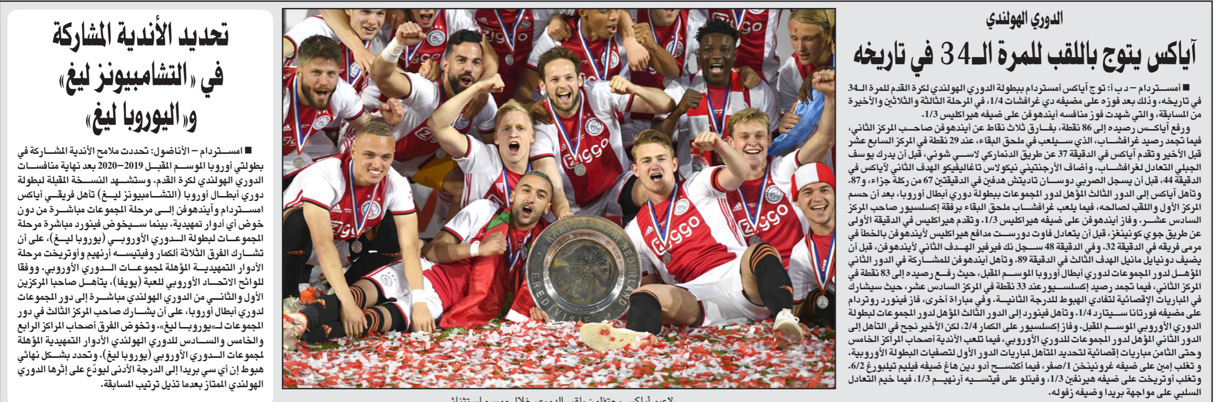
لاعبو آياكس يحتفلون بلقب الدوري خلال موسم استثنائي