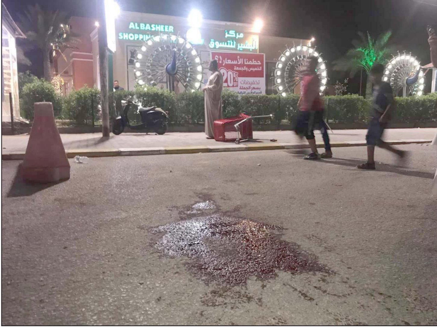
احتحام المتظاهرين لمركز البشير للتسوق حيث تبادر بقعة دماء بعد إطلاق حراس الأمن النار عليهم

وأقدم المحتجون الغاضبون على إحراق المركز التجاري (مول) وإحراق أضرار مادية بالغة في المبنى. وسرعان ما تطورت الأحداث هناك، حتى أقدم أفراد من الشركة الأمنية لقمع حركة التظاهر، بإطلاق النار في الهواء لتفريق جموع المحتجين، الأمر الذي وقع 4 قتلى و47 جرحيا في صفوف المتظاهرين، وفقا لبيان أوردته مستشفى الحكيم في المحافظة. وسارعت خلية الإعلام الأمني (كومية)، إلى التأكيد أمس الخميس، أن القوات الأمنية تمكنت من القبض على 5 من الذين أطلقوا النار على المتظاهرين في النجف، حيث