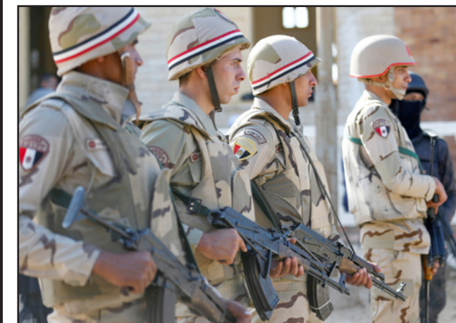
عناصر من الجيش المصري

القتلى لدى الجانبين. وفي التاسع من شباط/ فبراير 2018 بدأ الجيش المصري بالتعاون مع الشرطة عملية عسكرية شاملة في سيناء التي يتركز في شمالها الفرع المصري لتنظيم «الدولة الإسلامية» (ولاية سيناء) المسؤول عن شن عدد كبير من الاعتداءات الدامية ضد قوات الأمن والمدنيين. وأُسفرت هذه العملية حتى الآن عن مقتل نحو 650 من «التكفيريين»، كما يسميهم الجيش المصري، ونحو 45 عسكرياً، حسب الأرقام التي أعلنتها الجيش.