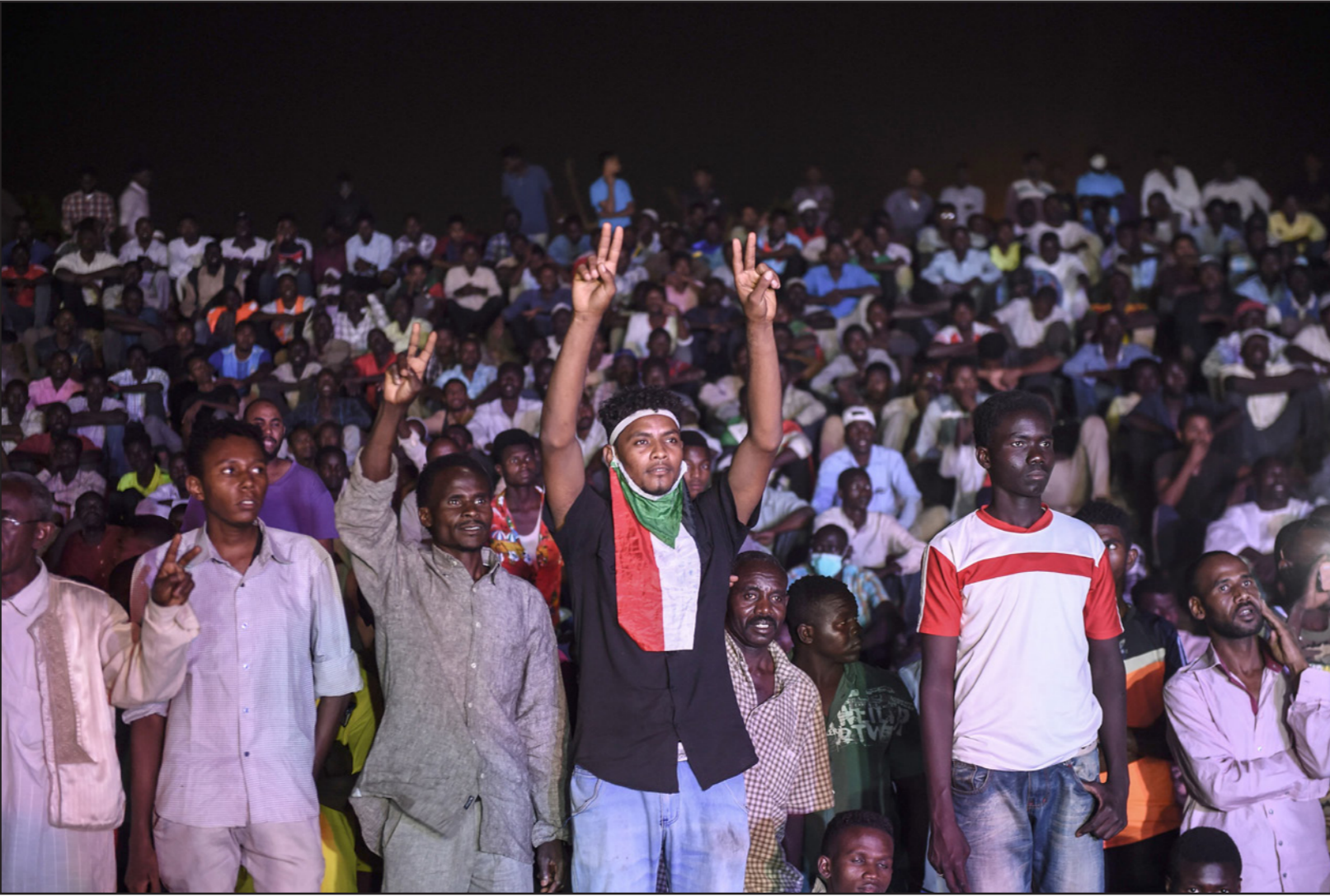
سودانيون معتصمون أمام وزارة الدفاع في الخرطوم

وانفجرت حركة السير والمرور في الشوارع (خارج نطاق الاعتصام) والتي كانت مغلقة بالمباريس، ولوحظ انتشار أمسي كثيف لقوات الدعم السريع والشرطة في القطاعات الرئيسية، ومنذ الإثنين، سقط ستة قتلى و14 جريحاً، بعضهم بالرصاص، في هجومين استهدفاً معتصمين خلال محاولتين لإزالة حواجز في شوارع في محيط الاعتصام.