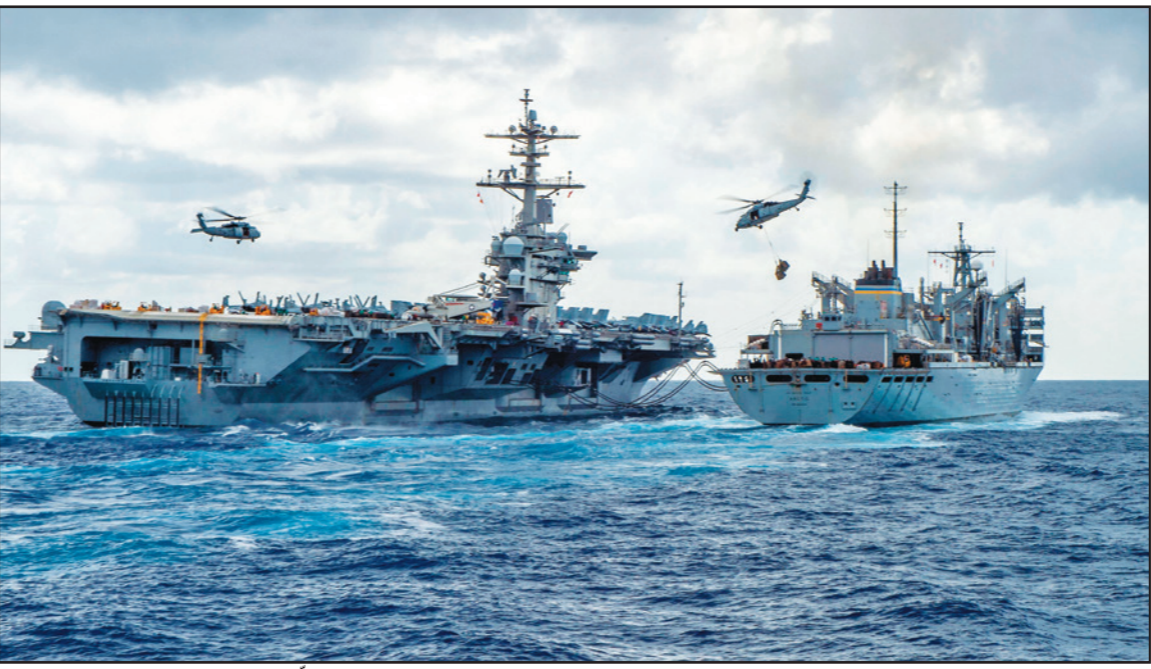
حاملة الطائرات أبراهام لنكولن في تدريب مع سفينة مقاتلة فيما طائرة هليكوبتر «سي هوك» تحلق في الخليج العربي أمس

يؤكد على أنها ليست سوى أداة لتنفيذ أجندة إيران». وأكد الأمير خالد أن «ما يقوم الحوثي بتهنيذه من أعمال إرهابية بأوامر عليا من طهران، يضعون به حبل المشنقة على الجهود السياسية الحالية»، إلى ذلك، قال وزير الدولة السعودي للشؤون الخارجية، عادل الجبير، في تغريدة، إن الحوثيين «جزء لا يتجزأ من قوات الحرس الثوري الإيراني ويتعمرون بأوامره». (تفاصيل ص 10)