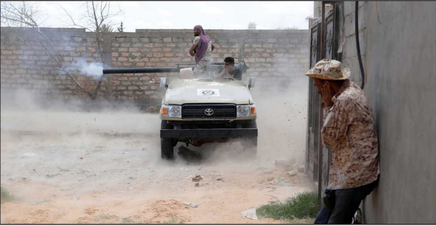
عناصر من القوات الحكومية الليبية خلال اشتباكات مع قوات الجنرال حفر قرب العاصمة طرابلس