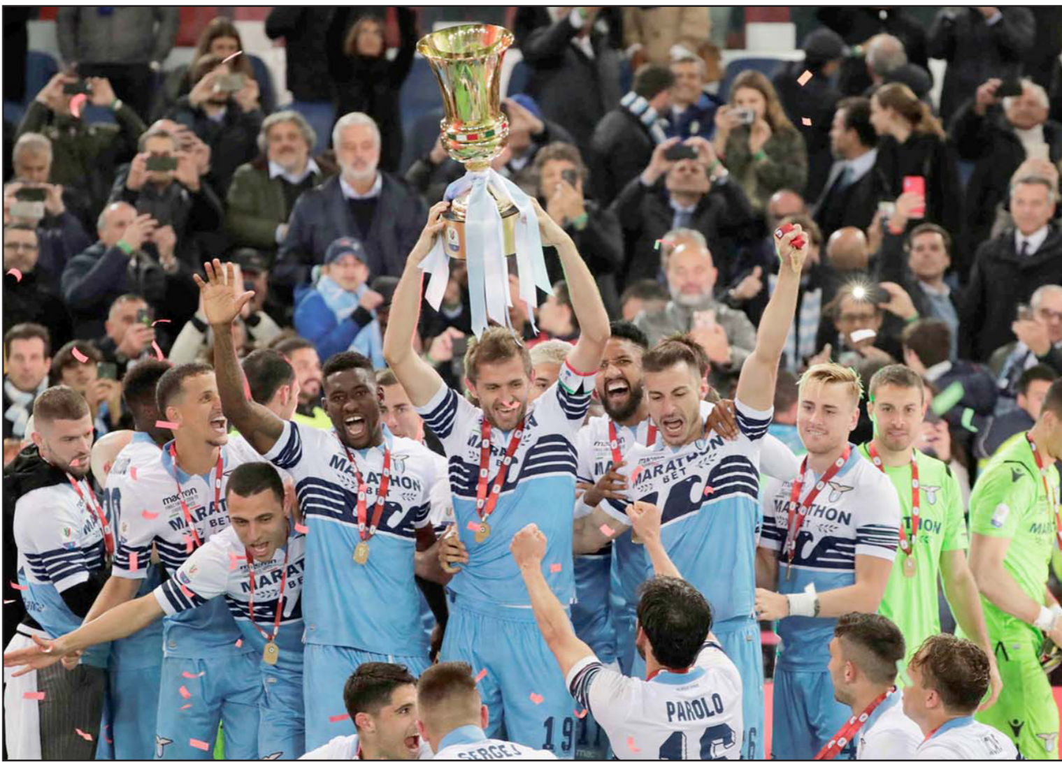
لاعبو لاتسيو يحتفلون بلقب الكأس السابع في تاريخهم عقب الفوز على أتلانتا