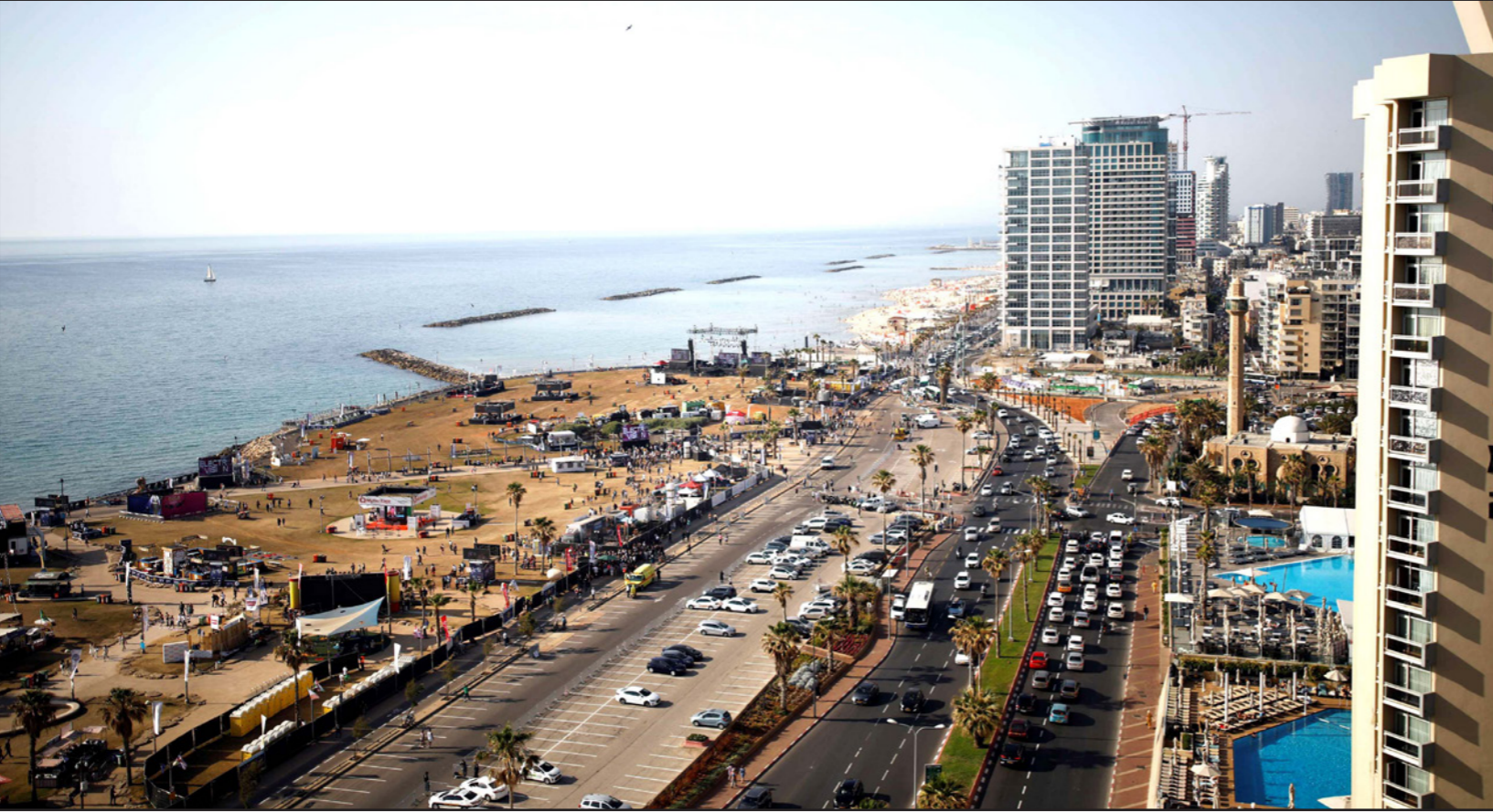
جانب من تل أبيب التي تشهد مسابقة «اليوروفيجن»