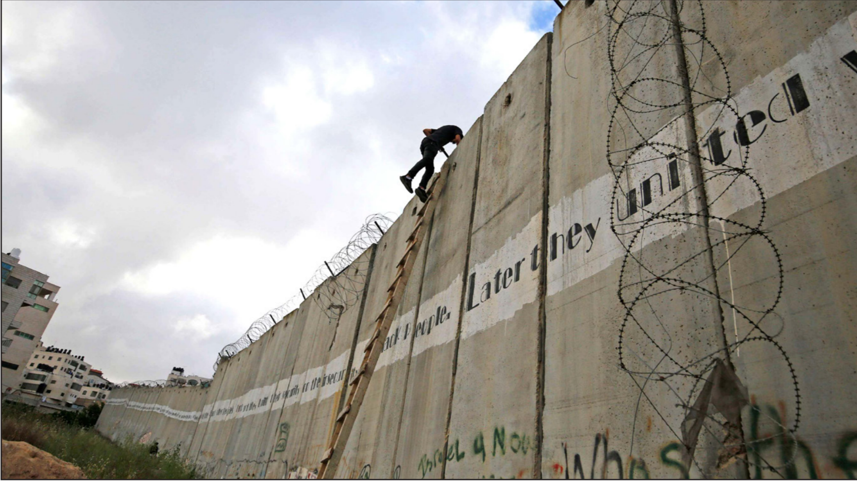
شاب فلسطيني يتسلق الجدار الفاصل في القدس من أجل الوصول إلى الأقصى