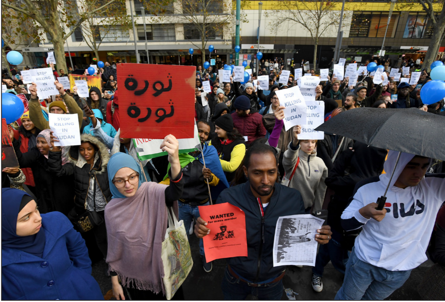
تظاهرة مؤيدة للثورة السودانية في مليونر في أستراليا

■ الخرطوم - الأناضول: منذ منتصف الأسبوع الماضي، تتواصل الاحتجاجات في كثير من مدن وقرى السودان، بالتزامن مع وقفات احتجاجية للعاملين في مؤسسات حكومية وخاصة وجامعات وشركات، استجابة لدعوات من قوى «إعلان الحرية والتغيير»، قائدة الحراك الشعبي. تلك هي بداية ما باتت تعرف بـ«الموجة الثالثة للثورة السودانية»، وتهدف إلى الضغط على المجلس العسكري الانتقالي لتسليم السلطة إلى المدنيين، وكذلك محاكمة المسؤولين عن فض اعتصام الخرطوم، في 3 يونيو/ حزيران الجاري.