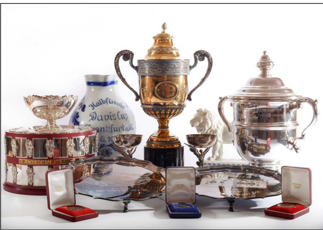
جوائز وكؤوس معروضة للبيع في المزاد تعود لمكيتها إلى بىكر

لندن - أف ب: بيعت اعتبارا من أمس الجوائز والتذكارات الشخصية لنجم التنس الألماني بوريس بىكر في المزاد العلني على الانترنت من دار المزادات البريطانية وايلز هاردي، لسداد جزئي لديون بطل ويمبلدون 3 مرات والذي أشهر إفلاسه قبل عامين. وتشمل الجوائز والتذكارات 82 قطعة لأصغر متوج في تاريخ البطولة الإنكليزية، ثلاث البطولات الأربع الكبرى، عندما نال لقبها في سن السابعة عشرة، وتضم الميداليات والكؤوس والمضارب والساعات والصور الفوتوغرافية. وأوضحت دار المزادات العلنية وايلز هاردي على موقعها إن عملية البيع ستنتهي في 11 تموز/يوليو. ومن بين القطع المعروضة في المزاد نسخة من كأس التحدي التي منحت إلى بىكر من الاتحاد الألماني عقب تتويجه بلقب ويمبلدون عامي 1985 و1986، وميدالية الوصيف في البطولة الإنكليزية لعام 1990 عندما خسر أمام السويدي شتيغمان إيدبرغ، ونسخة طبق الأصل من كأس الغضبية لبطولة الولايات المتحدة، آخر بطولات الأربع الكبرى، التي صممتها دار «تيغمان» الأميركية الشهيرة للمجوهرات، والتي نالها على حساب الأميركي إيفان لندن عام 1989. وكان بطل ويمبلدون الإنكليزية 3 مرات (تزوج بها أيضا عام 1989) الذي تلاحق بعدها سلطات المملكة المتحدة بسبب تراكم الديون، أشهر إفلاسه عام 2017. وفي حزيران/يونيو الماضي ادعى أنه يخفي بوضع ديون ماسي وحصانة تقدم بها للقضاء البريطاني، ما أدى إلى وقف الدعوى والحؤول دون البيع في المزاد العلني. لجواشزه ونكرياته الشخصية التي من المقترض أن يسدد بها جزئيا ديونه. وادعى المحامي طوني بيسويتريك الذي عين للإشراف على إفلاس بىكر وتوزيع أصوله لدائنيه، أن الأخير كتب في رسالة أنه «ليس لديه خيار سوى التخلي عن طلب الحصانة الدبلوماسية»، وأقر البطل السابق الذي لم يكن حاضرا ولا ممثلا في الجلسة،