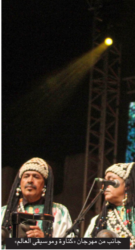
جانب من مهرجان «كناوة و موسيقى العالم»

ويستمد المهرجان سحره أيضا من جاذبية الأسوار التاريخية للمدينة وقصبتها المظلة على البحر، والتي صورت فيها مشاهد من مسلسل «صراع العروش» الشهير. ويتراقص الآلاف من جمهور المهرجان على إقامات عازفي مجموعات كناوة خلال العروض التي تقام ليلا، في أجواء تجتمع فيها الحركة بالسكينة، على غرار أجواء الرقصات الصوفية.