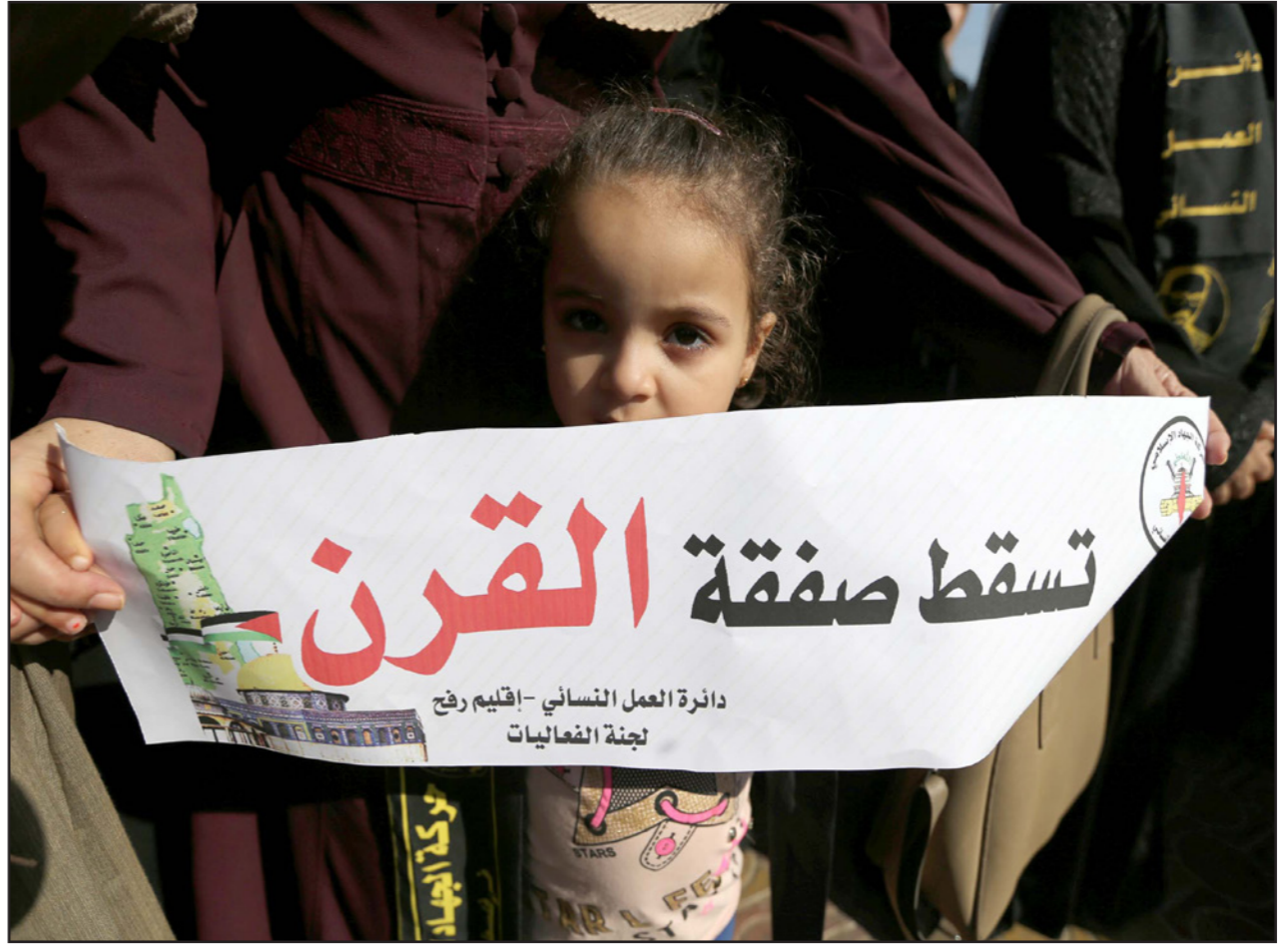
طفلة فلسطينية تحمل بافلة ضد صفقة القرن ومظاهرون في رام الله يساؤون بين مخططات ترامب وبين وعد بلهور المشروم