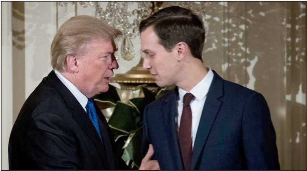
الرئيس الأمريكي ترامب وعديله كوشنر وصفة القرن

بعد تلك المقدمة إلى إسرائيل. لقد كانت مصر بحاجة إلى المساعدة الاقتصادية الأمريكية، ولكن لا ينبغي الاستنتاج من ذلك بشأن المسائل الاقتصادية هي التي أدت إلى حل النزاع؛ كان هذا هو الانسحاب الإسرائيلي الكامل من شبه جزيرة سيناء. فقد أعلن الرئيس المصري السادات بأن مصر «لن تتنازل عن ذرة رمل واحدة» من أراضيها، وهكذا كتب في مقال السلام الذي وقع في البيت الأبيض سنة 1979. وحتى بعد أربعة عقود من السلام فإن التجارة والتعاون الاقتصادي بين الدولتين هامشية، وقاعدة العلاقات بينهما هي التعاون الأمني والدور الأمريكي في تنفيذ الاتفاق (القوة متعددة الجنسيات في سيناء والمساعدة الأمنية). اتفاق أوسلو والاتفاق الانتقالي مع الفلسطينيين (1993، 1995) تميزاً هما أيضاً بالانتماء بمسائل اقتصادية عديدة، ولكن مثل الاتفاق مع مصر، وقف هذان الاتفاقان في ظل المسائل الجوهرية للنزاع. انسحاب الجيش الإسرائيلي