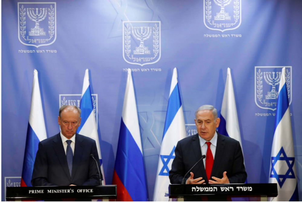
نتنياهو ومستشار الأمن القومي الروسي نيكولاي باتروشييف خلال مؤتمر صحافي في القدس

تشير التقديرات إلى أن الميليشيات المدعومة من إيران عزفت عن الدخول في معركة إدلب، ربما لأنها لا ترى أن إعادة السيطرة عليها، مهمة من الناحية الإستراتيجية، أو لا ترغب في إفساد العلاقات مع تركيا (وحاجتها إليها لمواجهة عقوبات مشددة على تصدير النفط)، أو كلا الأمرين. وقد تحمل العبء الأكبر في معارك ريفي حماة وإدلب قوات النظام والمليشيات الموالية للروس، لكن ربما ذهب بعض المراقبين بعيداً في تقدير الوضع والموقف، فإيران تشن، منذ سنوات، حرباً في سوريا للدفاع عن نظام الأسد وما تحققت من وراء هذا، وأن حصيلة القتلى المدنيين جراء التدخل الحربي الإيراني لا تقل كثيراً عن حصيلة النظام، ولا يمكنها التغطية على جرائمها هناك. ويرى مراقبون أن روسيا لا تستغني عن إيران في سوريا، وليس هذا قاصراً على حشد القوات البرية في المعارك، فأهميتها تتجاوز موازين القوى على الأرض إلى إدارة الصراع في المنطقة، بما يحفظ لموسكو حضوراً متزايداً ومؤثراً تسترجع فيه بعض أمجادها في التوسع والتنفوذ. فروسيا تواجه أمريكا بإيران، وتربط بها خطوط اللعبة وتحقق بها التوازن الإقليمي، حتى بدأ أن واشنطن استسلمت لموسكو في سوريا، على الأقل لبعض الوقت. ثم إن الولايات المتحدة لا تتحرك ولا تفكر مثل روسيا، كما يرى أرون شتاين، مدير برنامج الشرق الأوسط في معهد أبحاث السياسة الخارجية، فحلفاء موسكو (وتركيا أدهم) يعولون