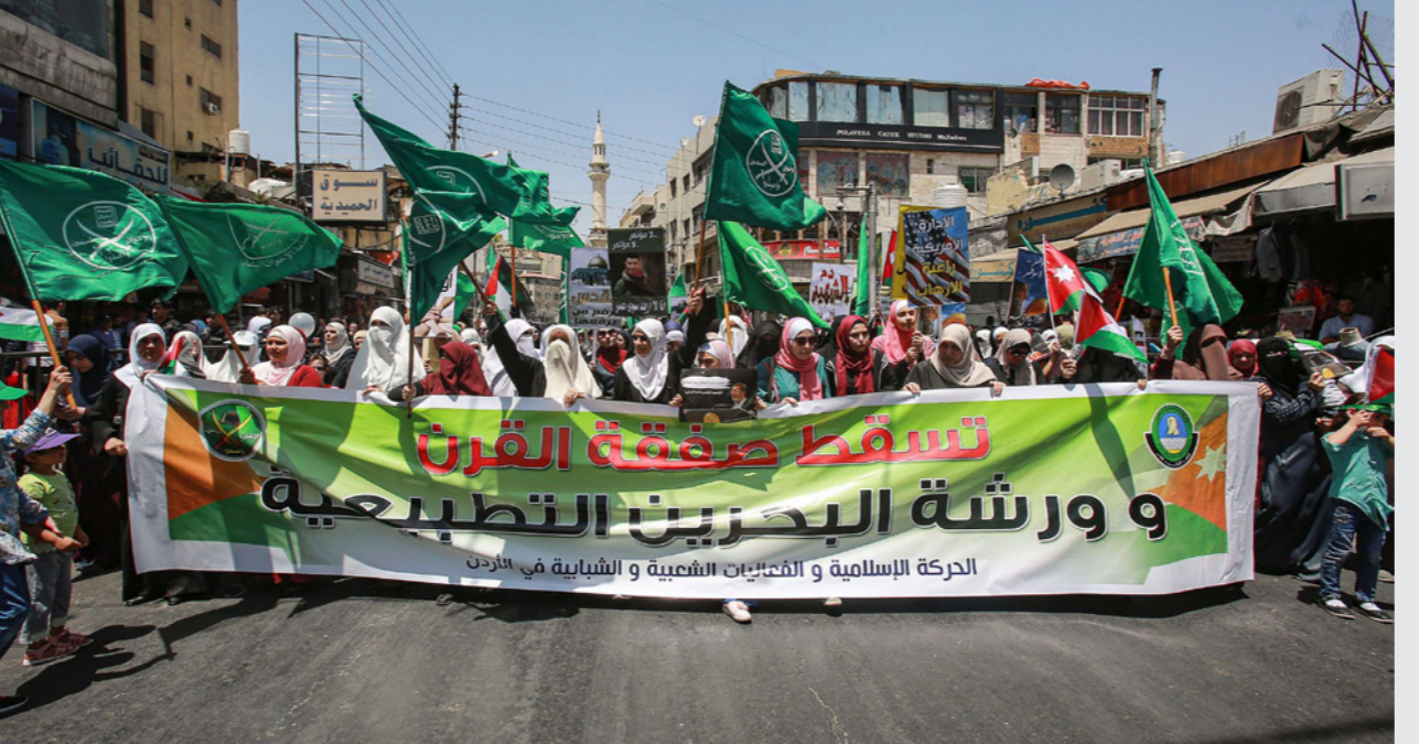
أردنيون في مظاهرة تندد بتسريبات «صفقة القرن»، وترفض الإغراءات المادية