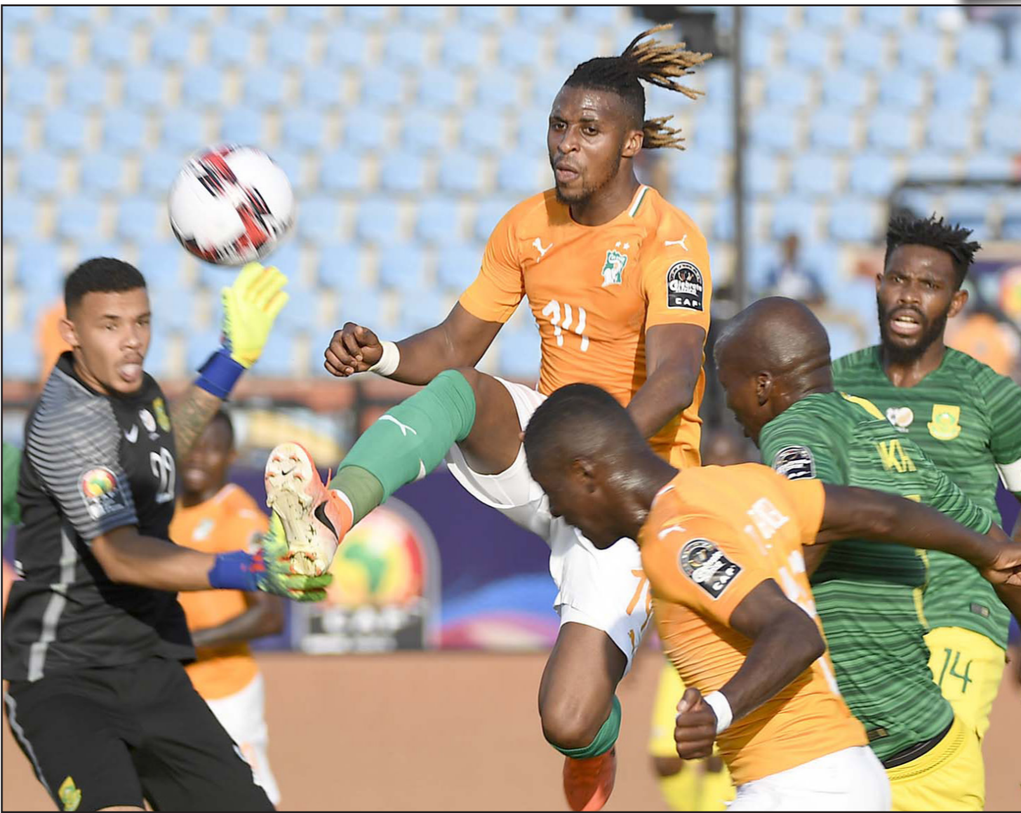
صاحب هدف الفوز كودجيا (14) يصارع على الكرة