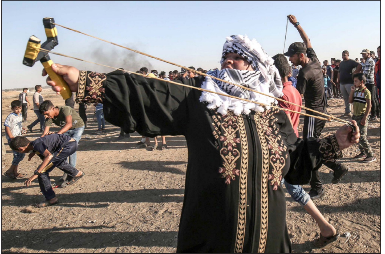
صور من مواجهات الجمعة الماضية على حدود غزة الشرقية