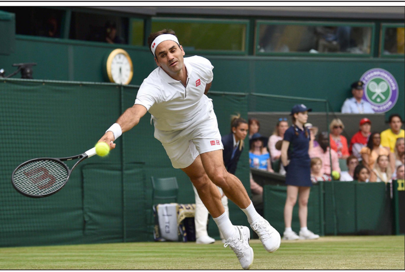
فيدرر تألق خلال انتصاره السهل على بوي

أهداف المباراة في الشوط الأول حيث تقدمت السويد بهدفين عن طريق كوسوفاري اسلاني وصوفيا ياكوبسون في الدقيقتين 11 و 22 ثم ردت فرانسيسكا كيربي بهدف لإنكلترا في الدقيقة 31. وشارك منتخب السويد في المربع الذهبي للمرة الرابعة في تاريخه بعدما حل ثالثا في نسخة 1991 وثنانيا في نسخة 2003 وثالثا في نسخة 2011. أما منتخب إنكلترا فوصل للمربع الذهبي للمرة الثانية في تاريخه بعدما حصد المركز الثالث في 2015. وبدأ منتخب السويد مشواره في البطولة بالفوز على تشيلي 2/0 ثم الفوز على تايلند 1/5 قبل الخسارة أمام أمريكا صفر/2، ثم فاز الفريق في دور الستة عشر على كندا 1/ صفر ثم على ألمانيا 1/2 في دور الثمانية، لكنه خسر في المربع الذهبي على يد هولندا بهدف دون رد. واستهل منتخب إنكلترا مشواره في البطولة بالفوز على اسكتلندا 1/2 ثم الفوز على الأرجنتين 1/ صفر وعلى اليابان 2/ صفر، ثم تغلب على الكامبيرون 3/ صفر في دور الستة عشر وعلى النرويج بالنتيجة نفسها في دور الثمانية، لكنه خسر في الدور قبل النهائي أمام أمريكا 2/1.