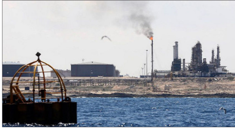
جانب من ميناء سوسة القديم