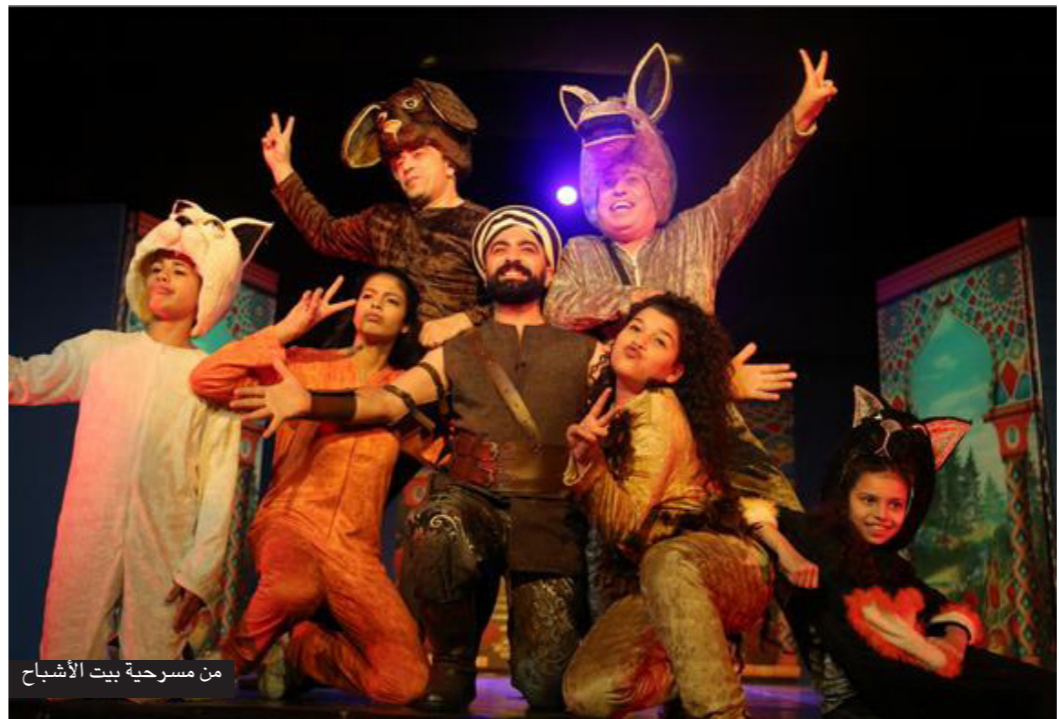
من مسرحية بيت الأشباح

يعرض البيت الفني للمسرح المصري، اليوم الاثني عشر عددا من العروض على خشبات مسارحه المختلفة، والتي تتناول العديد من الموضوعات، والتي تحاكي الوضع الراهن وتطرح عددا من القضايا والمشكلات على المستوى الاجتماعي، وكذلك لبث عدة رسائل.