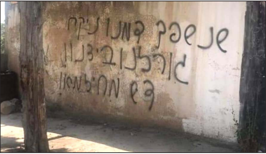
المستوطنون يخطون بالعربية شعارات معادية للعرب على جدران بيوت الفلسطينيين

إلى ذلك اعتقلت قوات الاحتلال شاباً من قرية برقين جنوب جنين شمال الضفة، أثناء عبوره على حاجز زعترة العسكري القريبة من مدينة نابلس، خلال عودته إلى منزله. كذلك سلمت شاباً من بلدة بيت فجار جنوب بيت لحم، بلاغا مرجعة مخابراتها، في مجمع مستوطنة «غوش عصيون»، بعد دهم منزله وتفتيشه. وكان مستوطنون من كريات أربع شرق المدينة اعتدوا ليل أول من أمس السبت على منازل المواطنين في منطقة الحريقة في مدينة الخليل جنوب الضفة ورشقوا بالحجارة، تحت حماية جنود الاحتلال الذين أطلقوا قنابل الصوت صوب المواطنين الذين تصدوا للمستوطنين. وسبق ذلك أن اعتدت مجموعة من المستوطنين على طفل من المدينة، خلال وجوده في باحات المسجد الإبراهيمي، وأصابوه بجروح ورضوض في أنحاء متفرقة من جسده. وجددت مجموعات من المستوطنين أمس اقتحام باحات المسجد الأقصى، ودخل المستوطنون بحماية مشددة من شرطة الاحتلال الخاصة ونفذوا جولات استفزازية، قبل الخروج من «باب السلسلة».