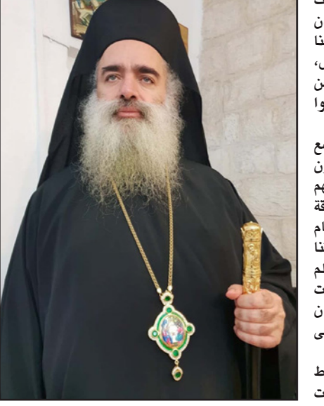
المطران عطا الله حنا

غدا الكشف عن حجب وزارة الأمن الإسرائيلية وثائق حول جرائم ارتكبتها الصهيونية في عام 1948، أكدت صحيفة «هآرتس» أمس في افتتاحيتها أن النكبة الفلسطينية لن تخفى، وأوضحت الصحيفة التي تحذر خارج السرب الإعلامي الإسرائيلي، أن إقامة إسرائيل كانت نمطية تجارب المجتمع الفلسطيني، بعدما تم تحويل مئات الآلاف الفلسطينيين إلى اللاجئين ودمرت قرامهم وصورت أراضهم وأقام فيها يهود.