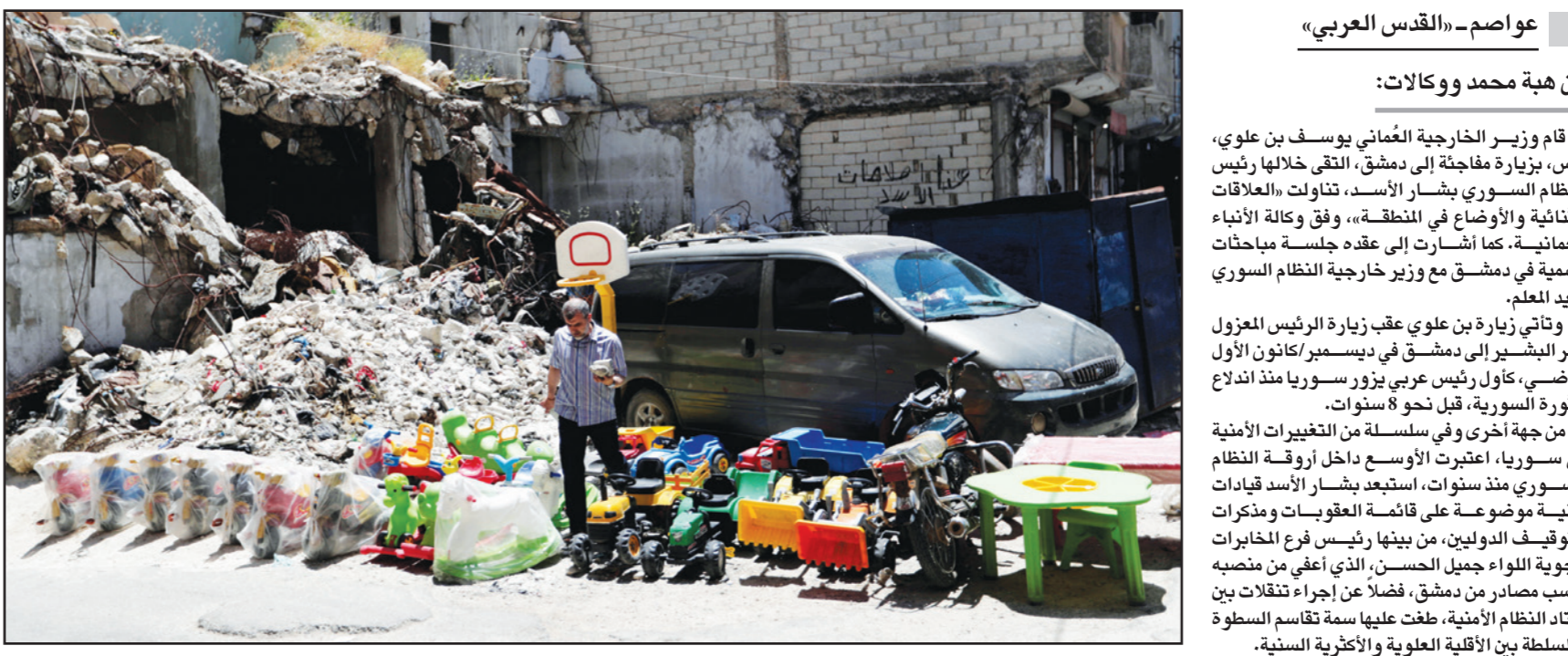
بائع ألعاب بلاستيكية قرب انقاض مبنى تعرض للقصف في مدينة ادلب شمال سوريا

الدوحة - «القدس العربي»- وكالات: قال وزير خارجية قطر، الشيخ محمد بن عبد الرحمن آل ثاني، إن الدوحة تتطلع إلى حوار بناء يلي رغبات الشعب الأفغاني وطموحاته في السلام والاستقرار. جاء ذلك عبر حسابه في «تويتر»، تعليقاً على انطلاق «المؤتمر الأفغاني للسلام»، في الدوحة، بالشراكة مع ألمانيا، ويستمر لمدة يومين. ويجمع المؤتمر العديد من الشخصيات الأفغانية، التي تمثل الكثير من الأطراف المختلفة في البلاد، في إطار الجهود المبذولة لدعم عملية السلام. وقال ماركوس بوتزل، المبعوث الألماني لأفغانستان وباكستان، خلال انطلاق المؤتمر، إن بلاده وقطر اتخذتا زمام المبادرة لإجراء هذا الحوار بغية فتح