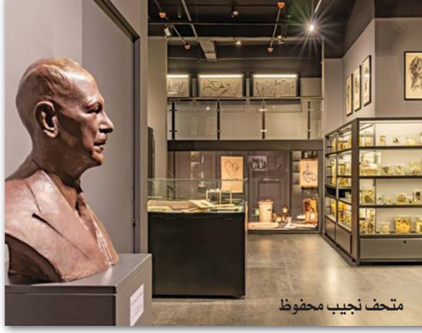
متحف نجيب محفوظ

المكان والزمان في روايات اعنتت بحفظ الذاكرة السياسية والوطنية، وقدمت عبر رؤى فلسفية عميقة تفسيرات مهمة للصراعات الكونية وطابع البشر، واختلاف المراحل وانتصارات وإخفاقات الإنسان على اختلاف درجات وعبه وثقافته وسمات عصره. بدأ محفوظ مشواره الإبداعي الطويل بالرواية التاريخية، متمثلة في أولى تجاربه «عبث الأقدار»، ثم مضى في الضمار نفسه، فكتب «كح طيبة» و«أربوبيس» و«أمم العرش» و«العاشق في الحقيقة»، أي أن التاريخ كان محركا أساسيا للأحداث وخلفية ضرورية أشرت كثيرا في إبداع الأديب الكبير، إذ استوحى منه ما يعينه على رسم ملامح الشخصية المصرية بتطوراتها الفكرية والمعرفية وتجاربهما الحياتية، ولو أنه أنتج بعد ذلك نهجا اجتماعيا سياسيا لكنه لم يهجر تماما المنطق التاريخي وظل على صلة وطيدة بها، بيد أنه غاب في مسانلة التوظيف فكتب «الحرافيش» من منظور شعبي ليجيطن بالمفهوم العام للقوة في مواجهة القانون الذي تصعنه القوة نفسها أحيانا، وأبرز كذلك تأثيرات وتأثيرات البيئة الشعبية في التكوينات الإسانية لإبطال رواياته، ورسم من يخات أفكاره صورا لأنماط الحياة المختلفة في الأحياء الشعبية بخصوصياتها ودلائها، كما في روايات «حسان الخليلي» والثالثة الشهيرة «بين القصرين قصر الشوق والسكوية»، ولهذا كان مشروع المتحف الذي يشمل أقساما متعددة تضم مقتنياته الشخصية، الملابس والأحذية والنظارة وأدوات الكتابة، ومكتبه ووراقه وأقلامه وجناحا خاصا لرواياته، استحفاقا يجذب به قلمه وموهبته وإسهامه الروائي والقصصي، بعيدا عن امتياز نوبل، الجائزة التي وضعت في المشهد العالمي فصار يقام إبداعا بمقتضاها.