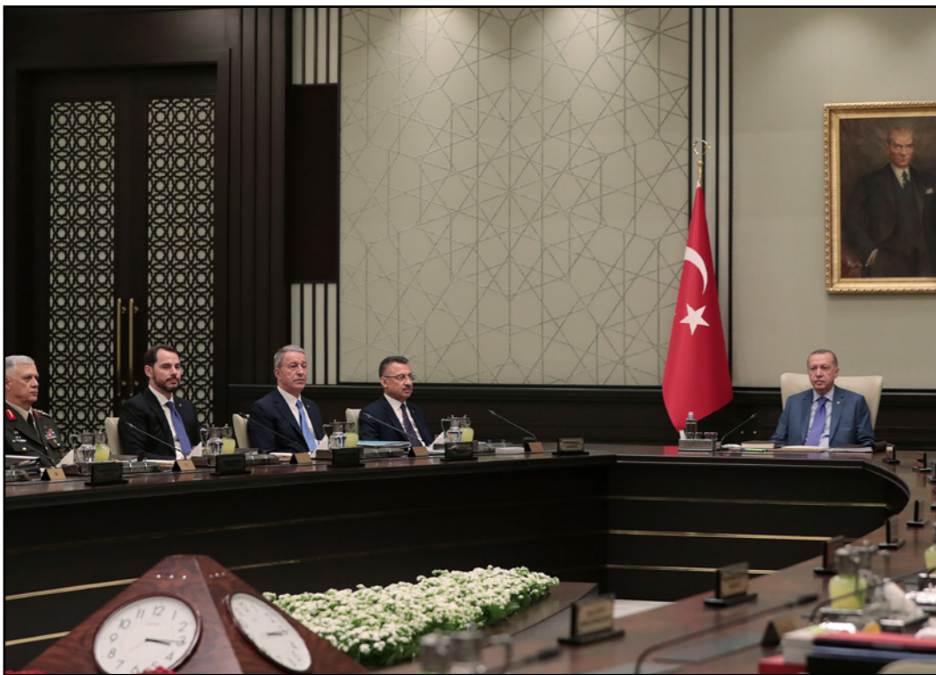
اجتماع مجلس الأمن التركي على رأسه الرئيس رجب طيب اردوغان

عودة تركيا للحديث بقوة عن إقامة منطقة أمنة للاجئين السوريين. وعقب اتصال هاتفى جرى، مساء الإثنين، بين وزير الدفاع التركي خلوصي اكار ونظيره الأمريكي مارك إسبر، شدد الوزير التركي على أن بلاده مستضطر إلى إنشاء منطقة أمنة في سوريا بعفورها «إن لم تتوصل إلى تفاهم مشترك مع الولايات المتحدة في هذا الشأن»، وفي تهديد مشابه، قال الرئيس التركي رجب طيب اردوغان، الجمعة، إن تركيا مصممة على تدمير الممر الإرهابي شرق الفرات في سوريا، مهما كانت نتيجة المحادثات مع الولايات المتحدة حول إنشاء منطقة أمنة، في تصعيد غير مسبوق بالهجة التركية اتجاه الإدارة الأمريكية. والأربعاء الماضي، أعلن وزير الخارجية التركي مولود جاوش أوغلو، رفض بلاده المقترحات الأمريكية الجديدة التي حملها المبعوث الخاص إلى سوريا جيمس جيفري، حول المنطقة الآمنة في سوريا، وهدد مجددا بالتحرك عسكريا شرقي نهر الفرات بعدما شدد على أن صبر بلاده قد نفد. في سياق متصل، يتوقع أن تصفى تركيا للحصول على دعم روسي أو روسي إيراني لعملياتها العسكرية المرتقبة شرقي نهر الفرات، وذلك على هامش الجولة الثالثة عشرة من مباحثات أستانا حول سوريا، المقرر انعقادها يومي الخميس والجمعة في العاصمة الكازاخستانية نور سلطان.