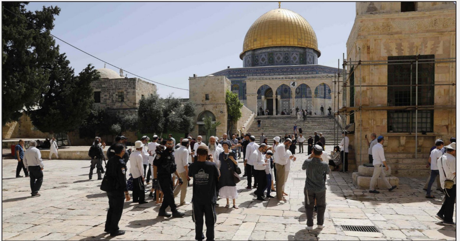
مستوطنون يقتحمون الأقصى