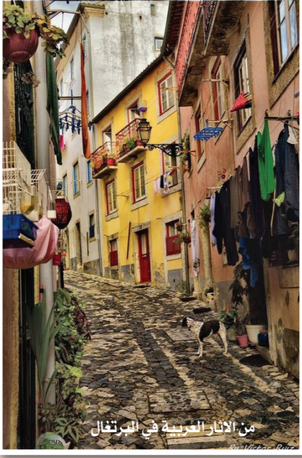
من الأثار العتيبة في البرتغال