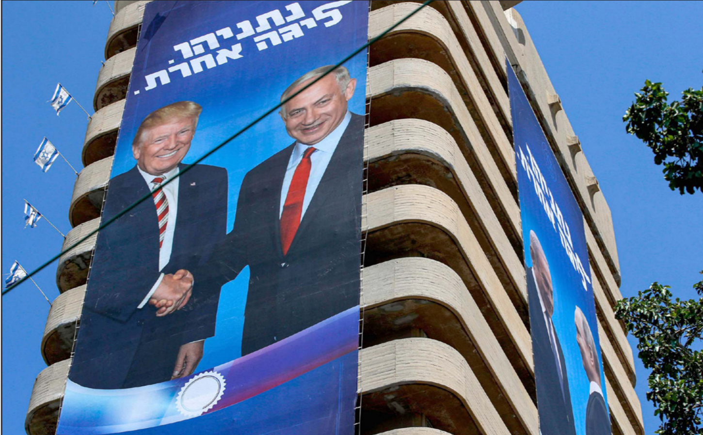
ملصق دعائي لحملة نتنياهو قبيل الانتخابات الإسرائيلية

يستعد الرئيس الأمريكي دونالد ترامب لتقديم هدية جديدة لرئيس حكومة الاحتلال بنيامين نتنياهو قبيل الانتخابات العامة المعادة للكنيست المقررة في 17 سبتمبر/ أيلول المقبل. وحسب التسريبات الإسرائيلية فإن نتنياهو حدد ملامح الهدية السياسية الجديدة وهي مؤتمر كامب ديفيد جديد برئاسة ترامب وبمشاركة رؤساء عرب تعقد قبيل انتخابات الكنيست كي تطرح نتنياهو قاندا دوليا ووجهته السلام وإتاحة الفرصة أمام حزب المعارضة «أزرق - أبيض» للمشاركة في حكومتهم. ولهذا الغرض وصل إلى المنطقة أمس مندوب الشخصي للرئيس ترامب لشؤون الشرق الأوسط وصهره جاريدي كوشنر حاملا معه دعوة للحكام العرب للمشاركة في مؤتمر كامب ديفيد بحضور ترامب. وقد بدأ كوشنر جولته بقاء العاهل الأردني الملك عبد الله. وتنقل صحيفة «يديعوت أحرونوت» عن مصادر أمريكية قولها إن المخطط سيلتزم قبيل انتخابات الكنيست الوشيك وفيه يطرخ ترامب مبادئ و«ملاحم «صفقة القرن». وتؤكد هذه المصادر أن الخطة المقترحة لـ «السلام» تمت صياغتها بالتنسيق الكامل من وراء الكواليس بين نتنياهو والبيت الأبيض والسفير الإسرائيلي في واشنطن رون ديمير الذي عاد للبلاد والتقى نتنياهو لهذا الغرض.