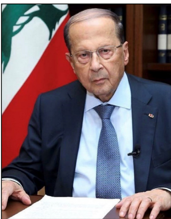
الرئيس اللبناني ميشال عون

مرة جديدة، يخاطب رئيس الجمهورية العماد ميشال عون مجلس النواب في ولايته الرئاسية، فيعيد استخدامه صلاحيته الدستورية قبل فترة لتأجيل انعقاد المجلس النيابي شهرًا لعدم إقرار قانون انتخابي لا يؤمن العدالة للتمثيل المسيحي، ما هو يبيعت أمس الأربعاء برسالة إلى رئيس مجلس النواب نبيه بري بعد وقت قصير من توقيع قانون موازنة العام 2019، مطلب فيها تفسير المادة 95 من الدستور لتوضيح الفقرة «ب» منها الواردة تحت عنوان «وفي المرحلة الانتقالية»، حيث «تلقى قاعدة التمثيل الطائفي ويعتمد الاختصاص والكفاءة في الوظائف العامة والقضاء والمؤسسات العسكرية والأمنية والمؤسسات العامة والمختلطة وفقاً لمقتضيات الوفاق الوطني»، معطوفة على الفقرة «ب» من مقدمة الدستور التي تنص على أن «لا شرعية لأي سلطة تناقض ميثاق العيش المشترك». والداعي إلى توجيه الرسالة الرئاسية هو ما ورد في المادة الثمانية من قانون الموازنة لجهة «حق الناخبين في الميارات والامتحانات التي أجراها مجلس الخدمة المدنية بناءً على قرار مجلس الوزراء وأعلنت نتائجها حسب الأصول بتعيينهم في الإدارات المعنية»، والذي لا يتضمن مناصف بين المسيحيين والمسلمين. وجاء في رسالة رئيس الجمهورية: «بما أن هذا النص، على إطلاقه، يعني الأخذ بكامل هذه النتائج الملغاة من دون أي اعتبار أو تحفظ، إن لجهة مرور الزمن القانوني عليها أو لجهة أي أخطاء قد تعترتها، أو لجهة آثار أي مراجعات قضائية بشأنها على أي لجهة أي تداعيات على انتظام العمل الإداري في ضوء حاجات الإدارات المعنية وتطوهرها أو انحسارها بعد مضي وقت على نتائج الميارات، أو -وهذا هو الأهم الذي يعني