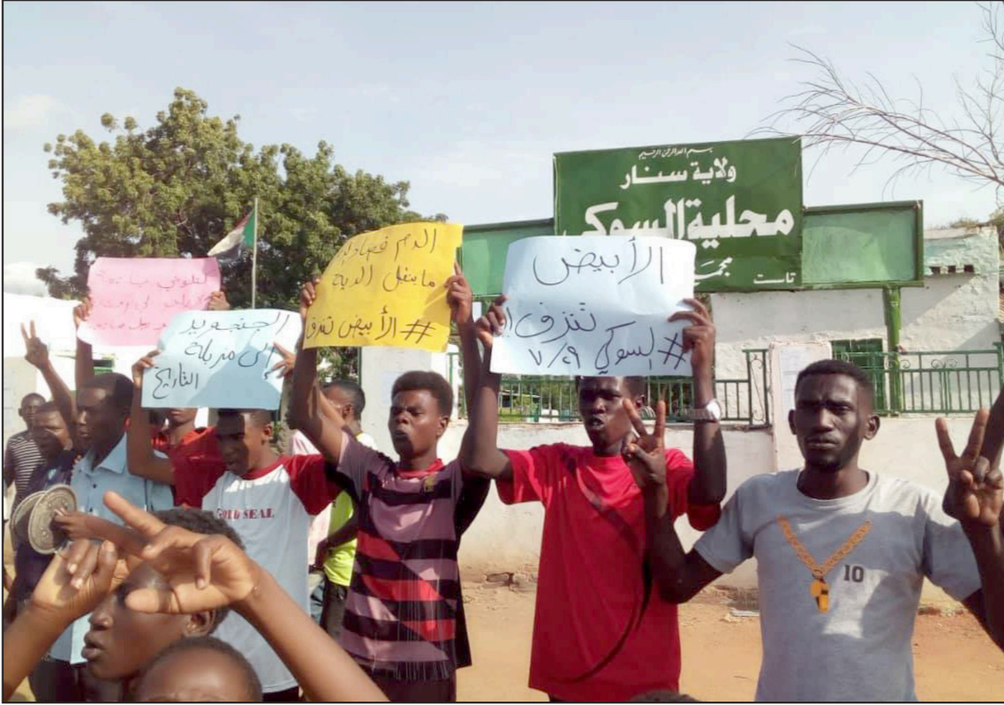
وقفة احتجاجية لطلاب سودانيين تنديدا بمقتل ستة متظاهرين