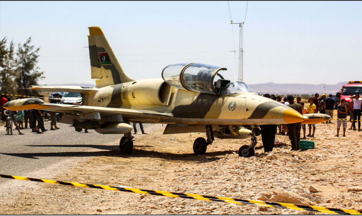
الطائرة العسكرية الليبية التي هبطت في تونس

تعطل جهاز الملاحة في طائرته، وبعد يوم واحد من هبوطها، نزع الجيش التونسي صواعق القنابل التي كانت تنقلها الطائرة العسكرية الليبية التي هبطت اضطراباً على طريق قرب مدينة مدين على بعد نحو 100 كلم من الحدود الليبية، وقالت وزارة الدفاع التونسية إنه عقب هبوطها تم وضعها على شاحنة ونقلها إلى موقع تخزين في تونس من دون مزيد من الإيضاحات، فيما لم تعلق الوزارة حول مسألة إعادة الطائرة. وفي الوقت الذي جسات فيه الرواية الرسمية التونسية حول سقوط الطائرة في مطار غرداية بالتعاون الدولي في الحكومة الليبية المؤقتة أن الطائرة كانت في مهمة استطلاعية ودرورية وتعرضت لخلل فني أدى إلى هبوطها اضطراباً في منطقة بن غزير في معتمدية مدين الشمالية بالجمهورية التونسية، وأكدت أنها على تواصل مع السلطات التونسية لضمان استرجاع الطائرة والطيار بأمان إلى أرض الوطن. قبل ذلك، كانت حكومة الوفاق قد طالبت السلطات التونسية بالتنسيق معها قبل اتخاذ أي قرار بشأن الطائرة الحربية الليبية وقائدتها، لكن وزارة الدفاع التونسية استنقت مساعي الأطراف الليبية لتوضيح