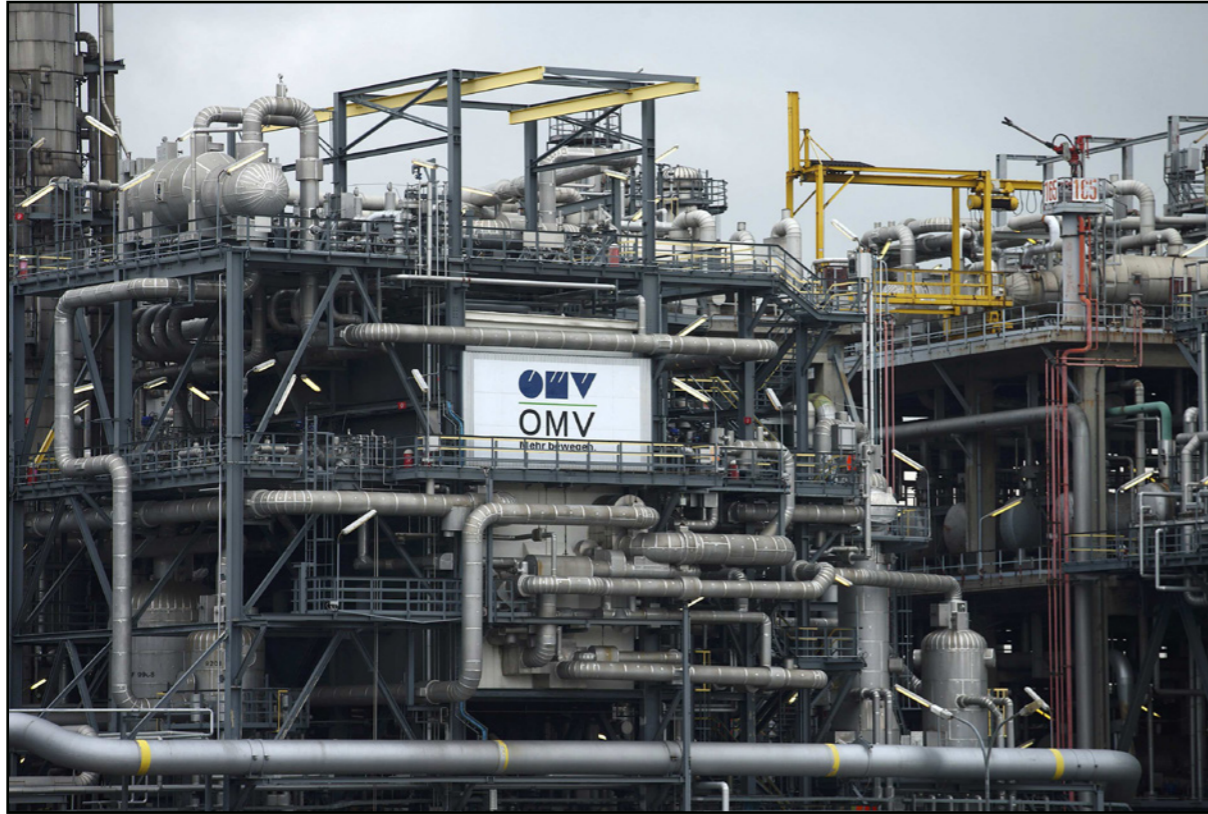
مصفاة مجموعة «أو.إم.في» النمساوية للنفط والغاز في مدينة شويتشات في النمسا

وخصصها في حقل نفط بابوظلي وحصتها البالغة 15% في حقل أستا هانستين للغاز في النرويج الذي بدأ الإنتاج في ديسمبر / كانون الأول.