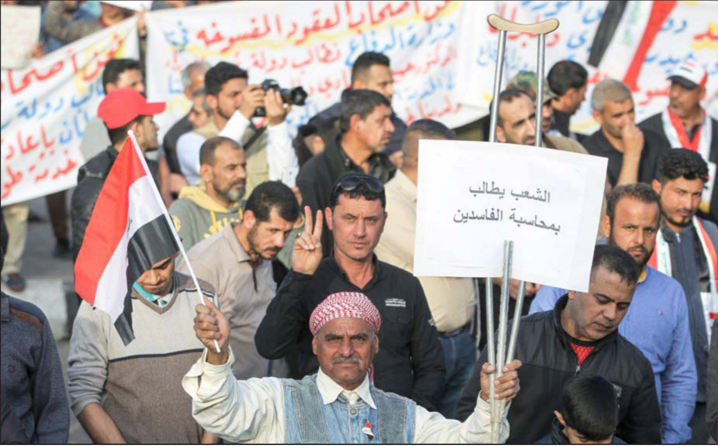
وقفة احتجاجية تطالب بمحاسبة الفاسدين في العراق

بشعة، صار لزاماً علينا كلجنة احتجاجات أن ندعم تلك الخطوات الإصلاحية ونؤيدها». وأضاف: «في الوقت الذي نعرب فيه عن سعادتنا ونحن نرى المبادرة الإصلاحية التي يتبناها الزعيم العراقي، مقتدى الصدر، متمثلة بتشكيل لجنة جمع المعلومات المختصة بمتابعة شبهات الفساد والتثبت منها، فإننا نوجه النداء للحكومة والقضاء العراقيين والمجلس الأعلى لمكافحة الفساد بأن يباشروا النظر في الوثائق المقدمة من قبل تلك اللجنة، فكل يوم يمر دون محاسبة المفسدين يمثل خيانة للعراق والشعب». وتابع أن «مطلبنا الأساسي هو الضرب بيد من حديد على الفاسدين، وإحكام قبضة القانون عليهم وفتح ملفات جريمة سقوط الموصل». وأضاف: «كما وستستمر الفرصة لنشكر الزعيم العراقي، مقتدى الصدر، والأخوة في التيار الصدري، لجهودهم الإصلاحية الوطنية الكبيرة فيما يخص مكافحة الفساد والتبرؤ منه».