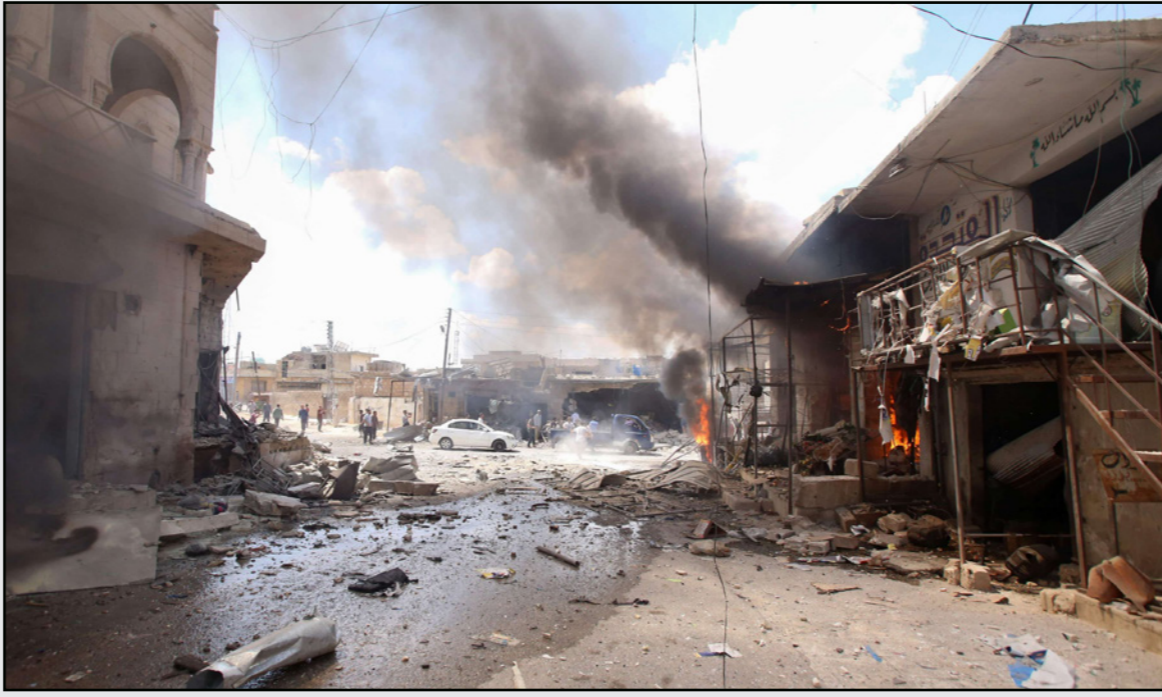
الدمار الذي خلفه قصف النظام لريف ادلب

فالحرب كان يجب أن تنتهي في الربع والصف في العام الماضي، بعد أن أنهى هجوم بالكلر آخر معقل للمقاتلين في الغوطة الشرقية، وتحرك