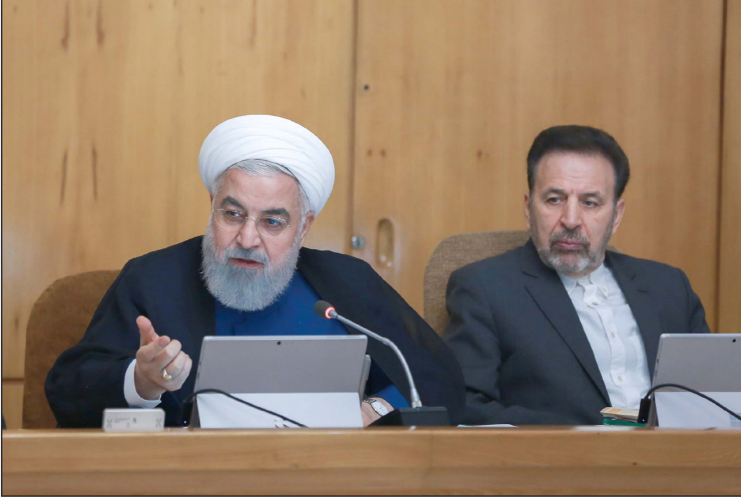
الرئيس الإيراني حسن روحاني خلال مؤتمر صحفي أمس

وأردف بالقول إن «إينستكس أداة لتفكيك التزامات