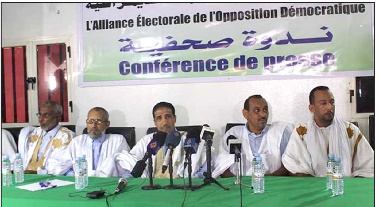
ندوة للمعارضة الموريتانية

وقلل مدونون موريتانيون معارضون من الأثر المترتب على مثل هذا الإجراء في ظل ما وصفوه بخبرة المسؤولين وقدرتهم على تطوير أساليبهم في التحايل على الممتلكات العمومية. وشددوا «على أهمية الإجراء من الناحية القانونية، لكنهم شككوا في تأثيره العملي، لأن معظم المفسدين، في نظرهم، يسجلون ممتلكاتهم بأسماء غيرهم من عائلاتهم وأصدقائهم، بل وحتى بأسماء وهمية أحياناً في ظل عدم وجود حالة مدنية مضبوطة بشكل قوي». وأكد المدونون «أن فاعلية هذا الإجراء لن تتأتى إلا بوجود قضاء مستقل قوي، وبنية قانونية وأمن اقتصادي يهدفان إلى محاربة التسجيل غير الشرعي للممتلكات».