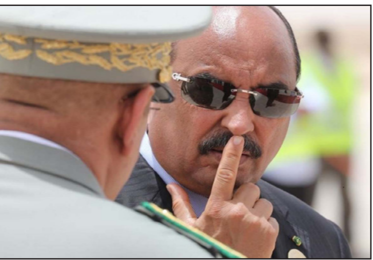
محمد ولد عبد العزيز