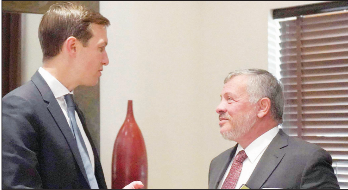
الملك الأردني عبد الله الثاني خلال استقبال جاريد كوشنر أمس

بعد فشل المؤتمر الذي دعت إليه الإدارة الأمريكية وانعقد في العاصمة البحرينية المنامة في حزيران / يونيو الماضي، وطرحته من خلاله الشق الاقتصادي من مشروعه لإحلال السلام في الشرق تحت اسم «صفقة القرن»، وإخفاقه في تحقيق أهدافه، تسعى الإدارة الأمريكية مجدداً إلى إعادة تسويقه عبر جولة جديدة يقوم بها جاريد كوشنر كبير مستشاري الرئيس الأمريكي. ووصل كوشنر أمس إلى العاصمة الأردنية عمان، المحطة الأولى في جولته، والتي يرافقه العاهل الأردني الملك عبد الله الثاني برفقة آفي بيركوفيتز، وغرينيلات، والمبعوث الأمريكي الخاص بإيران براين هوك. وحسب بيان صادر عن الديوان الملكي، أكد العاهل الأردني على ضرورة تحقيق السلام العادل والدائم وبما يضمن إقامة الدولة الفلسطينية المستقلة التي تعيش بأمن إلى جانب إسرائيل استناداً إلى حل الدولتين. وتشمل جولة كوشنر بالإضافة إلى الأردن، إسرائيل ومصر والسعودية والمغرب، فيما ذكرت صحيفة «واشنطن بوست» أن الإمارات ستحجز ضمن الجولة، والتقى كوشنر أمس رئيس الحكومة الإسرائيلية بنيامين نتانياهو في إسرائيل عقب وصوله إليها. ونقلت صحيفة «يديعوت أحرونوت»