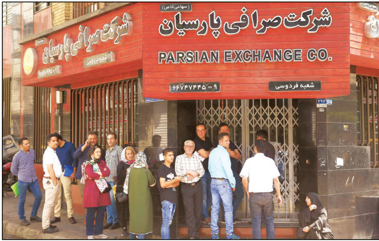
طابور مواطنين إيرانيين قبالة إحدى شركات تصريف العملات في إيران