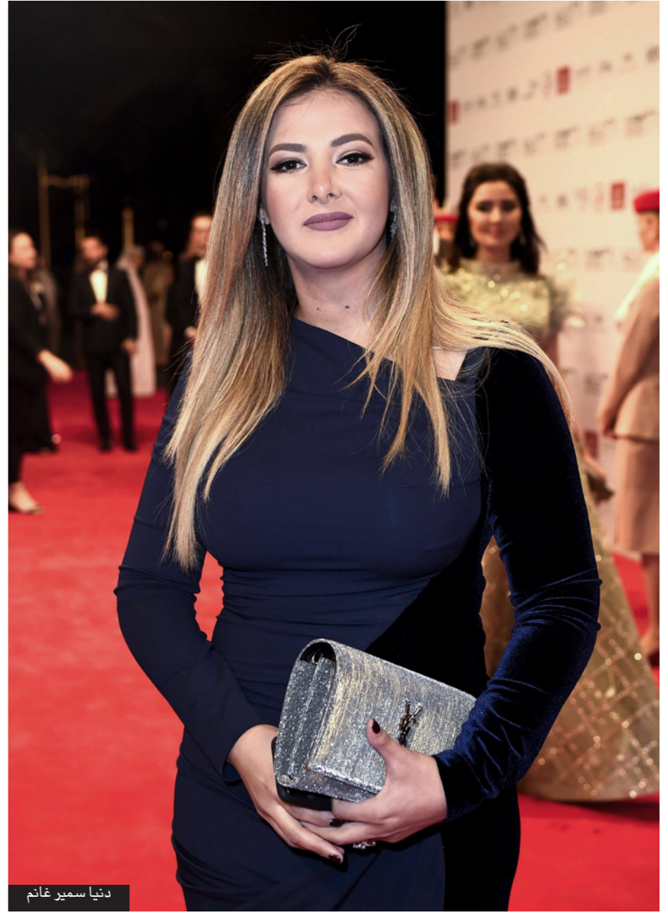
دنيا سمير غانم