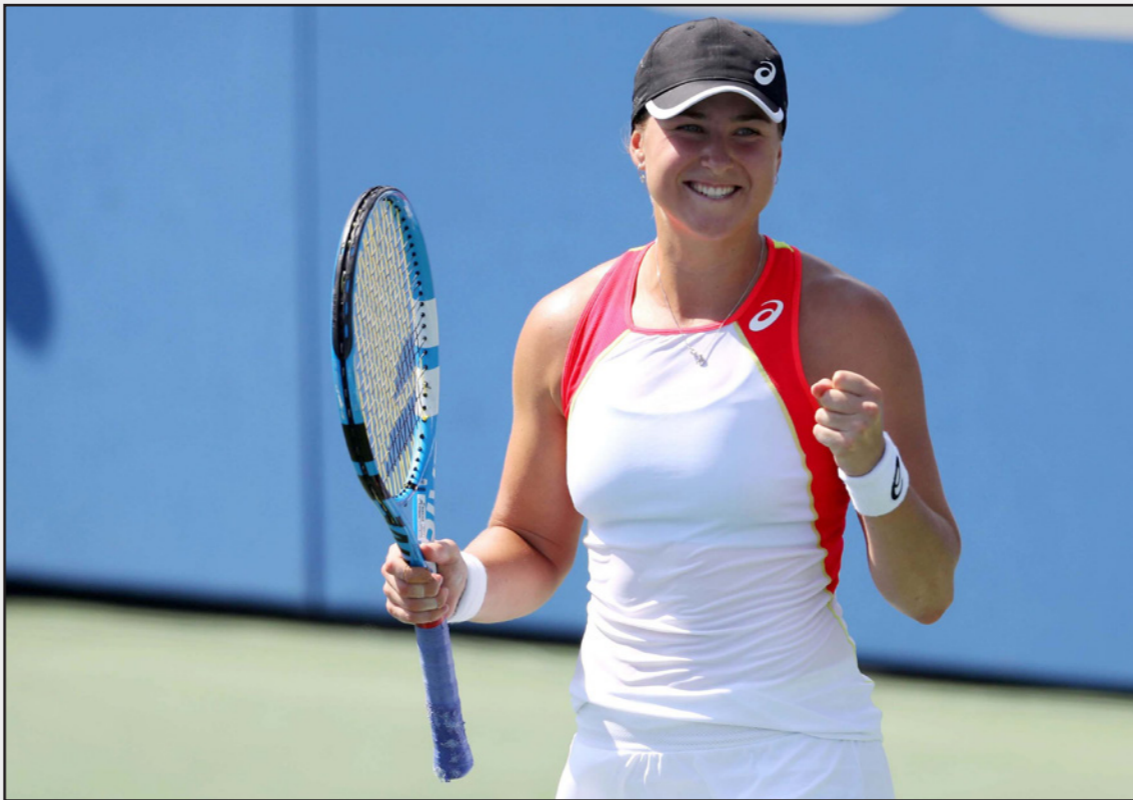
السويدية ريبكا بيترسون

■ واشنطن - رويترز: ودعت المصنفة الأولى والبطلة السابقة سلون ستيفنز بطولة واشنطن المفتوحة للتنس من الدور الأول بعد خسارتها المفاجئة 6-2 و7-5 أمام السويدية ريبكا بيترسون كما خرجت الواعدة كوكو جوف بعد الهزيمة في مجموعتين متتاليتين أيضا. وبدت ستيفنز، التي كان أفضل نتائجها هذا العام بلوغ قبل نهائي بطولة مدريد في مايو/ أيار الماضي، بعيدة عن مستواها من البداية ولم تنجح أبدا في الوصول إلى إيقاعها المعتاد أمام لاعبة السويدية المصنفة 70 عالميا في لقاءهما الأول. وتمتعت بيترسون ببداية رائعة حيث تقدمت 2-5 وحسمت المجموعة الأولى في 29 دقيقة عندما أعادت ستيفنز ضربة خلفية من الخط الخلفي للملعب في الشبكة. وبدأت ستيفنز، التي توجت في اللقب عام 2015، في استعادة هديرها في المجموعة الثانية وتقدمت 5-4 لكن بيترسون كسرت إرسال منافستها مرتين متتاليتين ثم حسمت الفوز في المباراة. وستلحق بيترسون في الدور المقبل مع الإيطالية كاميليا جورجى التي تفوقت على الأمريكية ساشيا فيكرى.