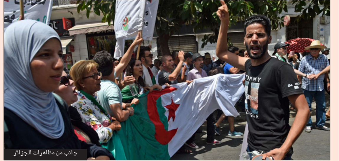
جانب من مظاهرات الجزائر

المهرجان الدولي تنظمه وزارة الثقافة بالتنسيق مع الديوان الجزائري للثقافة والإعلام، وديوان حقوق التأليف (حكوميين)، وفي مؤتمر صحافي قال رئيس المهرجان، يوسف بونخشاش، إن «حملات المقاطعة انطلقت فنانون لم توجه لهم الدعوة»، مشدداً على أن «الحراك الشعبي ليس ضد الفن والثقافة»، وتابع إن «الجمهور والسلطات المحلية، سواء البلدية أو المحافظة، راضين بالمهرجان، ويسهرون على إنجاح الدورة الـ41 للمهرجان».