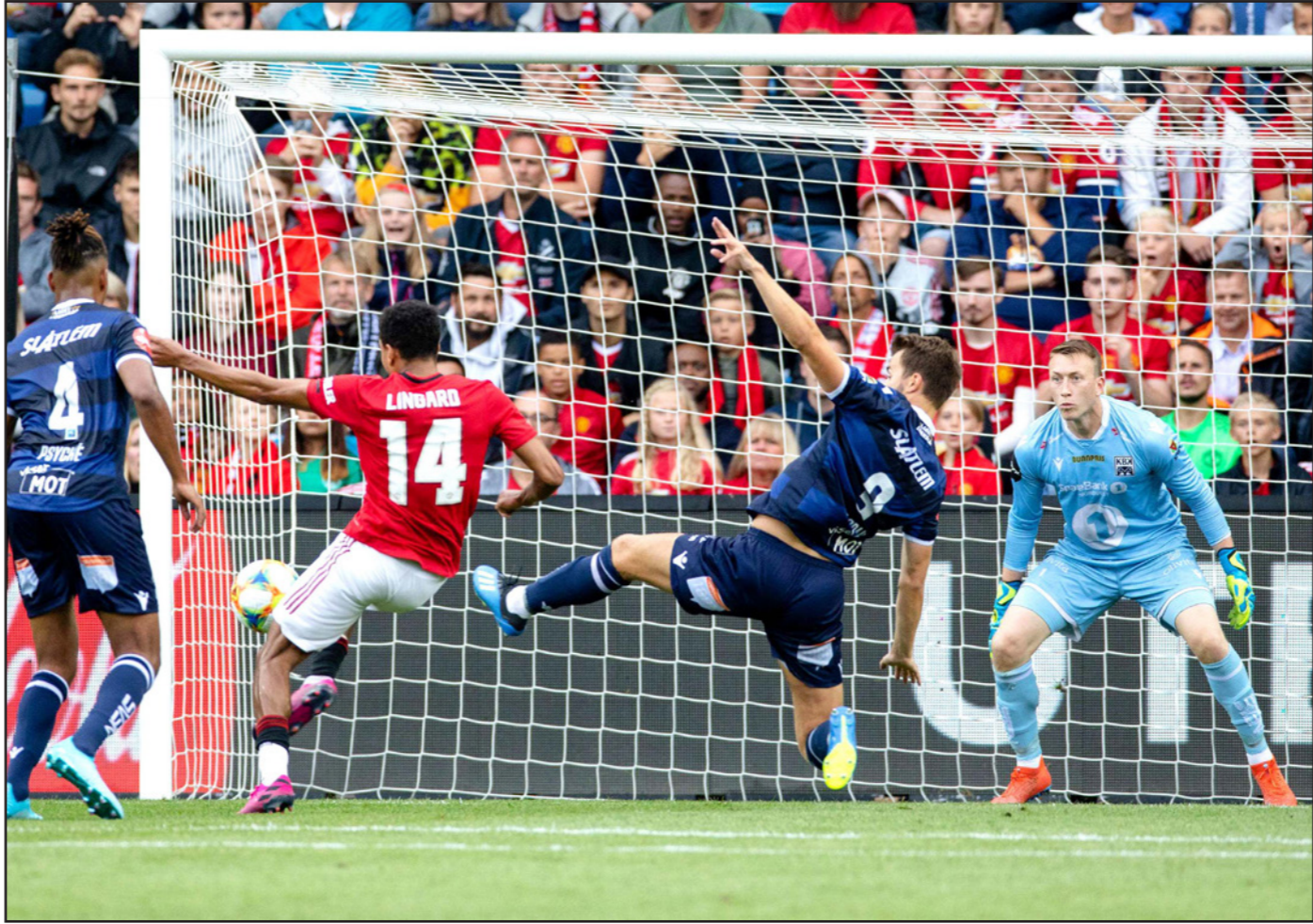
نجم فريق مانشستر يونايتد لينغارد (14) يحاول التسجيل في مرمى فريق كريستيانسوند

■ أوسلو- الأناضول: حقق فريق مانشستر يونايتد الإنكليزي، الفوز على نظيره كريستيانسوند النرويجي بهدف نظيف وديا، ضمن استعداداتهما للموسم الكروي الجديد. أحرز هدف اللقاء الوحيد، الإسباني خوان ماتا من ضربة جزاء في الدقيقة 90 من زمن المباراة، وأنهى مانشستر يونايتد الدوري الإنكليزي الممتاز (البريميرليغ) الموسم الماضي في المركز السادس برصيد 66 نقطة. وأسفرت مباريات ودية أخرى الثلاثاء عن فوز نانت الفرنسي على سبورتنغ خيخون الإسباني بهدفين دون رد، واكتساح بوروسيا دورتموند الألماني لسانت غالن السويسري بأربعة أهداف لهدف، على صعيد آخر قال النرويجي أولي جونار سولسكاير المدير الفني لنادي مانشستر يونايتد الإنكليزي لكرة القدم، أن الإيفواري إيريك بابل مدافع الفريق سيغيب عن أربعة إلى خمسة أشهر بعد خضوعه لعملية جراحية في الركبة.