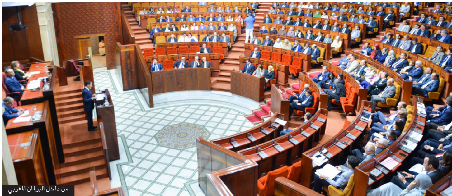
من داخل البرلمان المغربي

ويطرح إحداث القناة البرلمانية المغربية سؤالاً حول ما إذا كانت هذه المبادرة من شأنها تحسين صورة البرلمان وأعضائه لدى الرأي العام؟ وهل ستمكن من الارتقاء بمستوى أدائه في مجال التشريع والرقابة والدبلوماسية البرلمانية؟ هل ستمكن على محو وتجاوز النظرة النمطية التي تكونت على المؤسسة التشريعية منذ ميلاد أول برلمان سنة 1963 مروراً بالتجارب التي جاءت في ما بعد؟ هل ستمكن مبادرة القناة التلفزيونية من ربح رهان المهنية والجودة والمصادقية وهي دعائم رئيسة لاستقطاب اهتمامات الرأي العام لكي يتصلح مع مؤسسته التشريعية. كما أنه من المطروح مدى تمكن القناة من التوفيق بين توجهات الغرفتين خاصة في ظل الاختلاف الحاصل على مستوى تركيبة مكوناتها وموقعها في التسريعية. وعلى مستوى الأداء المهني الاعلامي والخط التحريري للقناة تثار تساؤلات أخرى من قبيل ما هي حدود التماس بين الطاقم الإداري والصحافي؟ وهل سيتم استنساخ تجربة قنوات الإعلام العمومي السمي البصري وأسلوب تناوله لقضايا البرلمان وأنشطته؟ أم سيتم اعتماد مقاربات مهنية متجددة في تقديم برامج القناة وافتتاحها على الأسئلة الحقيقية التي يطرحها الرأي العام على أدوار البرلمان كمؤسسة تمثل السيادة الشعبية؟ أم ستمثل قناة لتقديم خدمات للتواصل والدعاية عوض الانخراط في التحولات المتسارعة التي يعرفها الإعلام والاتصال الذي ينحو بشكل أكبر في اتجاه أن يكون إعلام الحقيقة.