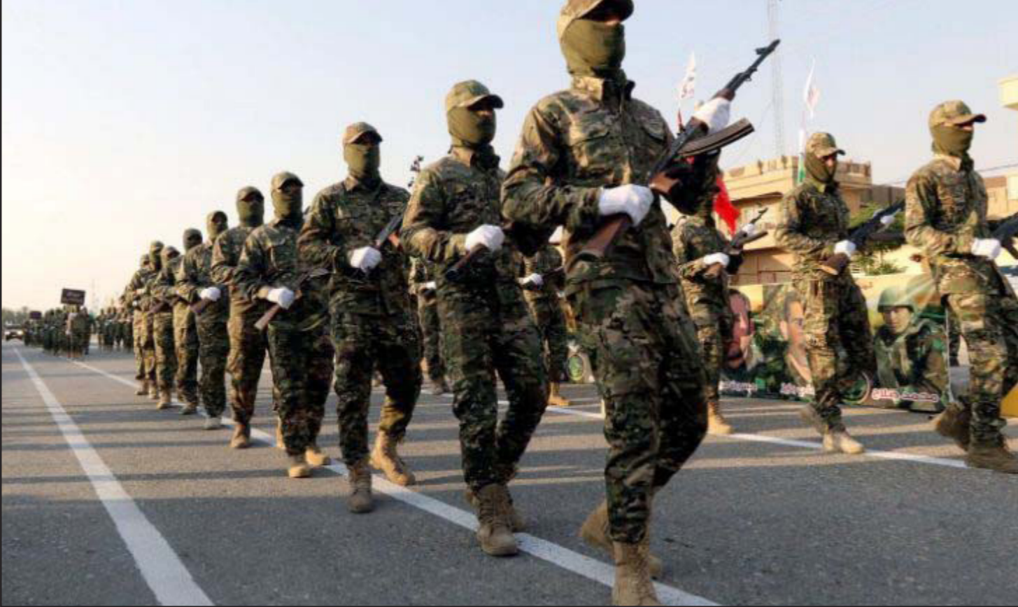
قلق إسرائيلي من الوجود الإيراني في العراق

المستعدة لتعزيز اقتصاد العراق. لهذا السبب بعد العراق الدولة الوحيدة التي يغمض عينيها عنها في الوقت الذي تحافظ فيه على الاتجار مع إيران رغم العقوبات. مؤخراً، زادت طائرات التجسس الأمريكية نشاطها في منطقة الحدود بين العراق وسوريا. وربما هذه هي الطريقة الأمريكية من أجل التوضيح لإسرائيل بانهم سيزيدون الرقابة على ما يحدث في المنطقة وعلى مرور وسائل قتالية متطورة لحزب الله والمليشيات في العراق وسوريا. إضافة إلى ذلك، ربما بدأت الولايات المتحدة في العمل ضد التمركز الإيراني في العراق خشية من أن تتضرر هي نفسها في المستقبل من المليشيات الشيعية.