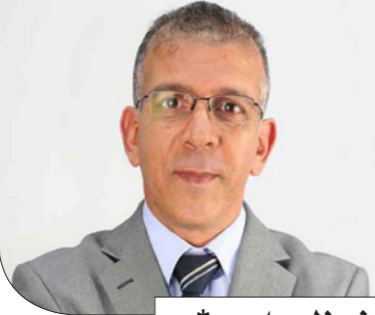
حفيظ دراجي *

■ زيوريخ - الأناضول: أعلن الاتحاد الدولي لكرة القدم (فيفا)، أمس الأربعاء، عن القائمة الأولية المكونة من 10 أسماء المرشحة لجائزة أفضل مدرب في العالم عن الموسم الماضي. وتصدر الجزائري جمال بلماضي، هذه القائمة، كأول عربي وأفريقي يتم ترشيحه لهذه الجائزة منذ انطلاقتها في عام 2010، إلى جانب أسماء أخرى أبرزها على الإطلاق الأسباني بيبي غوارديولا والألماني يورغن كلوب والفرنسي ديدييه ديشامب.