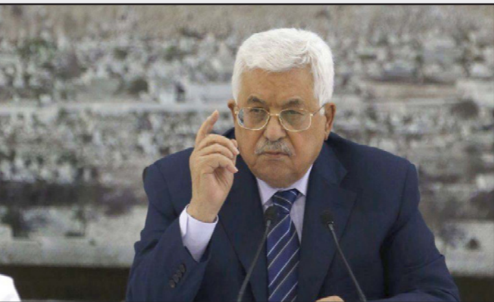
الرئيس الفلسطيني محمود عباس (أبو مازن)

القانون الإسرائيلي على المستوطنات الإسرائيلية الذي يسمونه ضمًا، سؤدي المعتدلة عن اشتراط التقدم في التطبيع مع إسرائيل بتنازلات من قبل إسرائيل. ووفق كل ذلك (في ظل غياب احتمال تقدم العملية السلمية)، فرض القانون الإسرائيلي على المستوطنات الإسرائيلية في يهودا والسامرة (الأمريكيون لا يكلّفون أنفسهم عناء منزع الانطباع بانهم سيسلمون بهذه الخطوة).