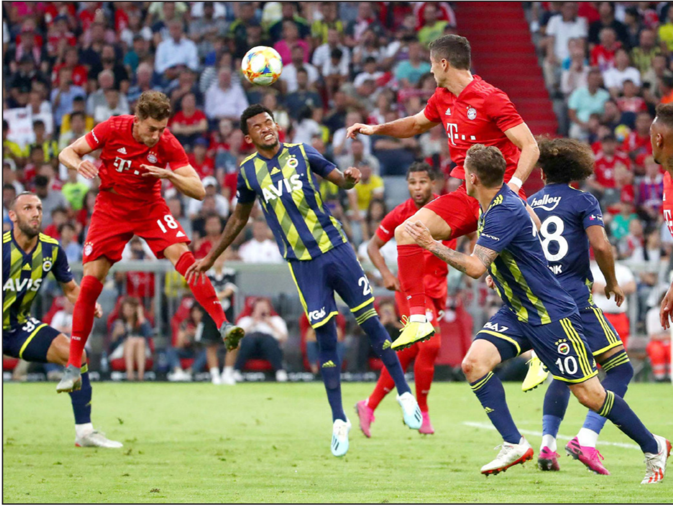
صراع هوائي بين لاعبي بايرن ميونخ وفناربخشة التركي