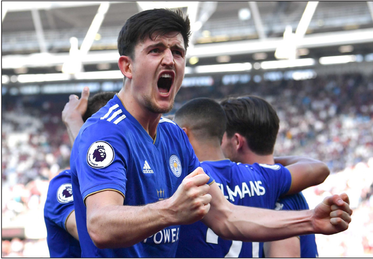
ماغواير نجم مانشستر يونايتد الجديد أصبح أغلى مدافع في العالم