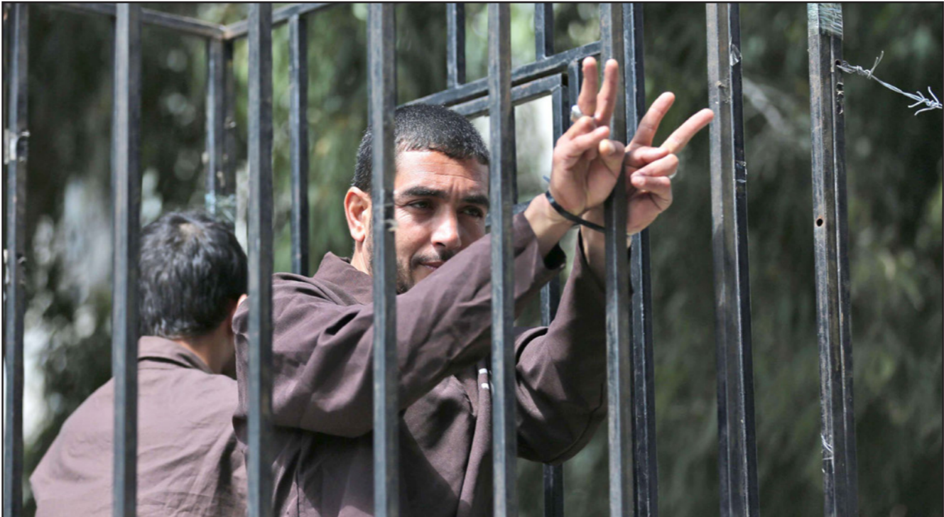
أسرى فلسطينيون في سجون الاحتلال

بين الحين والآخر يبارعا عملية تنقّلات بحقّهم من أجل إرهابهم والضغك عليهم لكسر الإضراب.