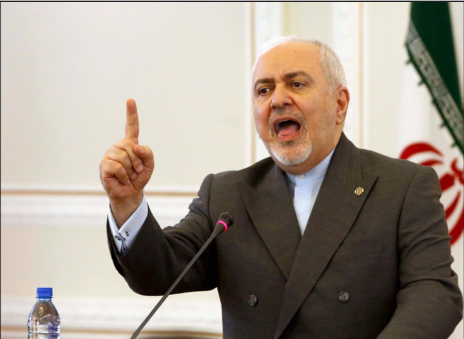
وزير الخارجية الإيراني محمد جواد ظريف يحذر الأوروبيين

وكانت السفارة الأمريكية في برلين قد قالت يوم الثلاثاء، إن الولايات المتحدة تطلب من ألمانيا الانضمام إلى فرنسا وبريطانيا في مهمة لحماية حركة الملاحة عبر مضيق هرمز، والتصدي للاعتداءات الإيرانية». ورفضت ألمانيا الطلب.