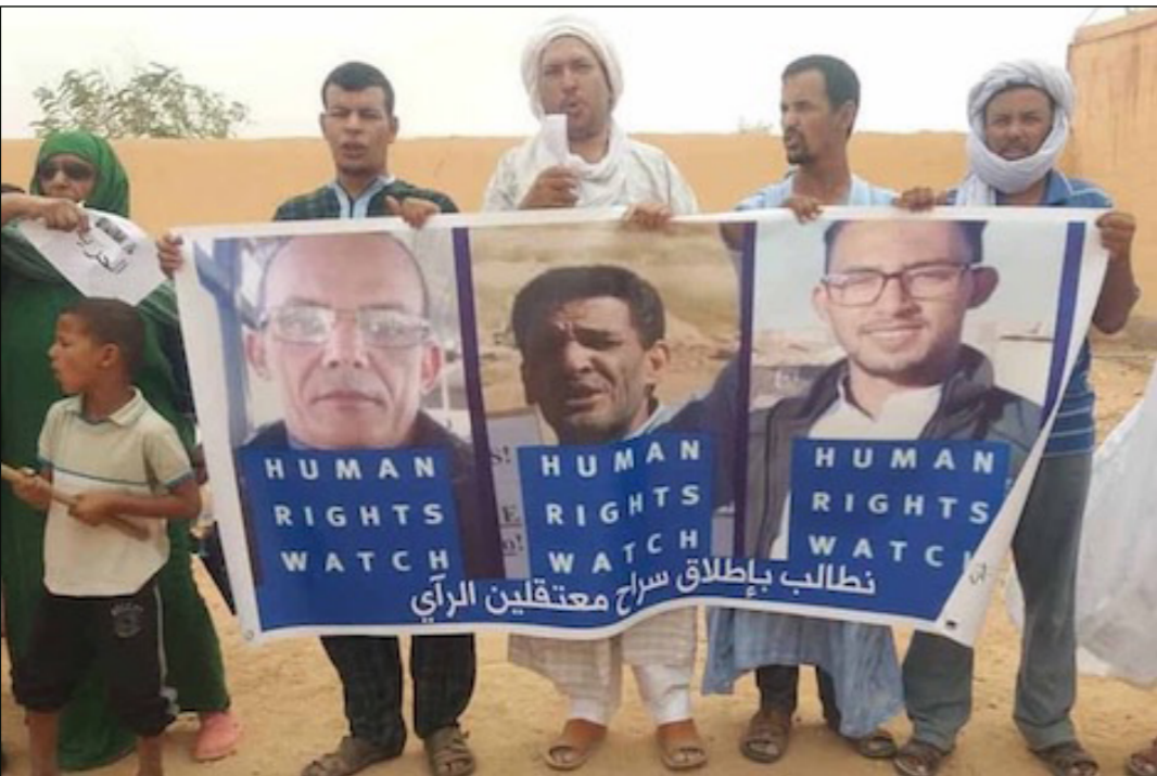
وقفة احتجاجية للمطالبة بإطلاق سراح المعتقلين