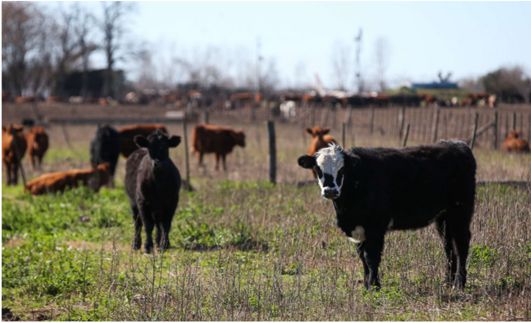
يتسبب إنتاج كيلو غرام واحد من اللحم البقري في دخول 13 الفا و 300 غرام من مكافئ ثاني أكسيد الكربون إلى الغلاف الجوي

■ جنيف - د ب: بينما تشهد الدول الغنية جدلا حول ما إذا كان السفر بالطائرة أو حرق الفحم مبررين أخلاقيا، فإن هناك جدلا أقل حدة يجري حول الزراعة والغابات والاستخدامات الأخرى للأراضي، وهي من الأمور المسؤولة عن نحو ربع انبعاثات الغازات السببية لظاهرة التغير المناخي.