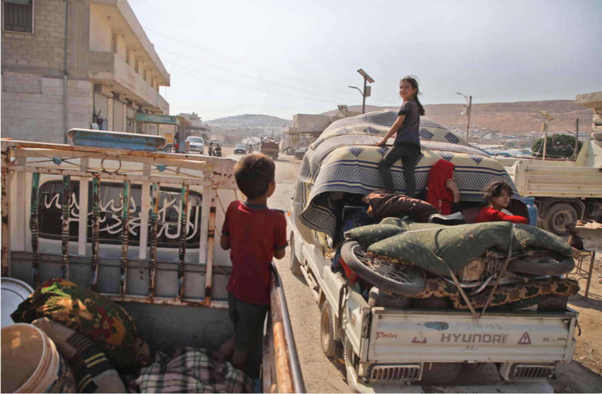
سوريون ضمن عملية تزوج واسعة شهدها جنوب إدلب أمس بسبب قصف النظام

من جهة أخرى جددت تركيا الاثنين دعوتها الولايات المتحدة كي تكف عن دعم الفصائل الكردية في شمال سوريا، في وقت تعمل واشنطن لمنع هجوم تهدد أنقرة بشنّه ضد هذه الفصائل. وصرح وزير الخارجية التركي مولود تشاوش أوغلو خلال مؤتمر صحافي في أنقرة «ننتظر من الولايات المتحدة أن ترد إيجابياً على دعوتنا الكف عن التعاون» مع وحدات حماية الشعب الكردية.