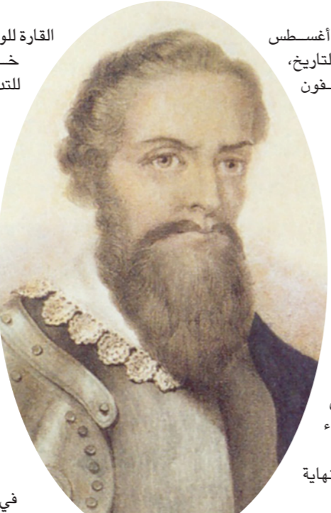
بيدرو ألفاريس كابرال بينيرو

أصبح البرتغالي فاسكو دا غاما أول أوروبي يصل إلى الهند عبر أفريقيا، وهو قام بجولة حول «رأس الرجاء الصالح» الذي اكتشفه دياس قبل عقد. غادر لشبونة في العام 1497 وأبحر حول طرف