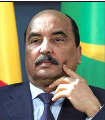
محمد ولد عبد العزيز

موريتانيا: مشاورات متواصلة لتشكيل الحكومة وانتقاد لتعيين أعوان للرئيس السابق