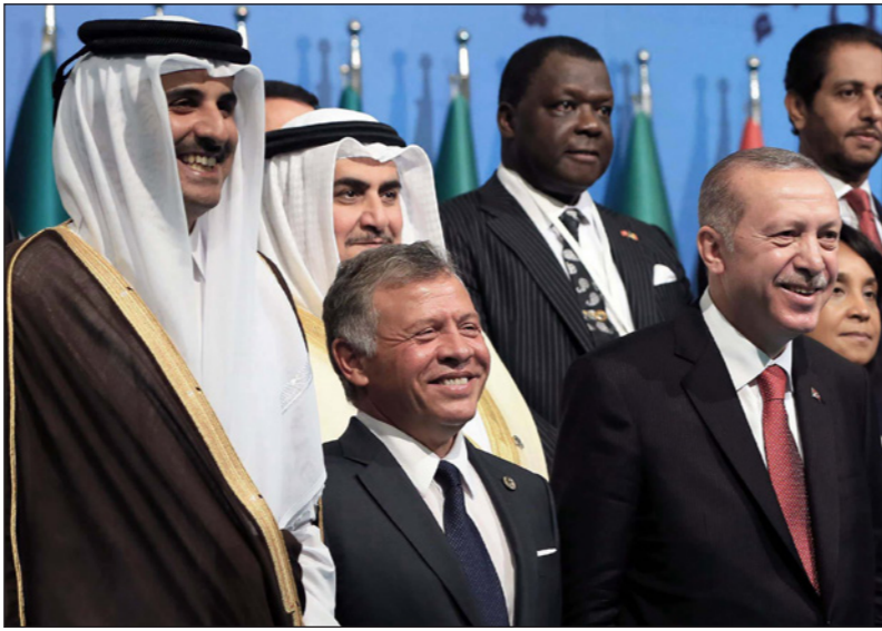
الملك عبد الله متوسلاً أمير قطر الشيخ تميم بن حمد آل ثاني والرئيس التركي رجب طيب أردوغان خلال الاجتماع الاستثنائي لمنظمة التعاون الإسلامي في إسطنبول العام الماضي

الأردن، عندما فتحت المجال لاستقبال شخصيات سعودية مطبوعة مع إسرائيل مثل الجنرال أنور عشقي وغيره، وعندما حاولت العام الماضي تنظيم لقاء بين الأمير بن سلمان وما يسمى بوجهاء وممثلي أهل مدينة القدس. تلك الزاوية في العلاقة بين جنرالات فلسطينيين ومقربين من ولي العهد السعودي خاصة أخرى بالمقاربات الأردنية يمكن أن ينسلل منها أي ترتيب يؤدي إلى مخاطر محتملة في أهم ورقة أردنية، وهي شرعية الوصاية للقدس، خصوصاً أن اللقاءات بدأت تستبدل مفردة الوصاية بالرعاية وباللور. سعوديون وإسرائيليون وأحياناً مغاربة ومبعوثون للفاتيكان، وفي حالات نادرة أردنيون، يتحدثون اليوم عن رعاية بدلاً من الوصاية. ولأحظت أوساط التوجس الأردني، مؤخرًا، أن دولتين فقط تتقدسان استعمال عبارة الوصاية الهاشمية بدلاً من الرعاية أو الدور الأردني في القدس، وهما تركيا وقطر. لذلك، وبإختصار، يختبر الأردن في الساعات المقبلة العقيدة كحيفة هندسة رسالة سياسية بعد التخلي للموقف الغربي وتجنب منازعات حسابات الفاتيكان وما يسمى بالأطباع السعودية وإبر التخدير الإماراتية. هل تشهد العلاقات الأردنية مع تركيا وقطر خطوة كبيرة في الاتجاه قريباً؟ هل يلتقي الملك عبد الله الثاني الأمير تميم والرئيس اردوغان في قمة ثلاثية تستمر في مؤتمر إسطنبول بشأن القدس مجدداً؟ سؤال قيد الدرس الآن، والإجابة عنه تحتاج إلى مزيد من الحسابات والوقت والترقب.