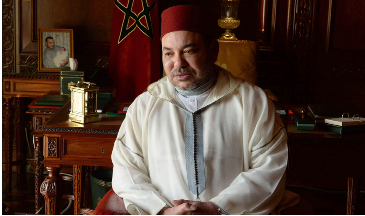
الملك محمد السادس

وقالت الصحيفة المغربية من صناعات القرار بالمغرب، في تقريرها المطول الذي نشره موقع «العمق» إنه ينتشر في العاصمة جماعات ضغط تعمل بشكل قانوني، وهي تجارة مريحة في أقوى دولة بالعالم، وتعرف إقبالاً ودعماً من الشركات الكبيرة والحكومات الأجنبية. ويعتبر المغرب واحداً من الزبائن الرئيسيين لشركات k-street الاستشارية المتخصصة في الضغط، وk-street هو شارع ملىء بهذا النوع من الشركات، حيث لجأ إليها المغرب للدفاع عن سيادته على الصحراء أمام أعضاء الكونغرس والإدارة الأمريكية، وتوضيح قاعدة بيانات وزارة العدل الأمريكية وجود 85 عقداً مسجلاً بأسماء شخصيات ومؤسسات في المغرب مع شركات الضغط. أقدم هذه العقود يعود تاريخه إلى العام 1947، وقعه حزب الاستقلال بالنيابة عن حركة الاستقلال بشمال إفريقيا. وقالت «جون أفريك» إن شخصيات سياسية مغربية تاريخية، مثل عمال الفاسي وعبد الخالق