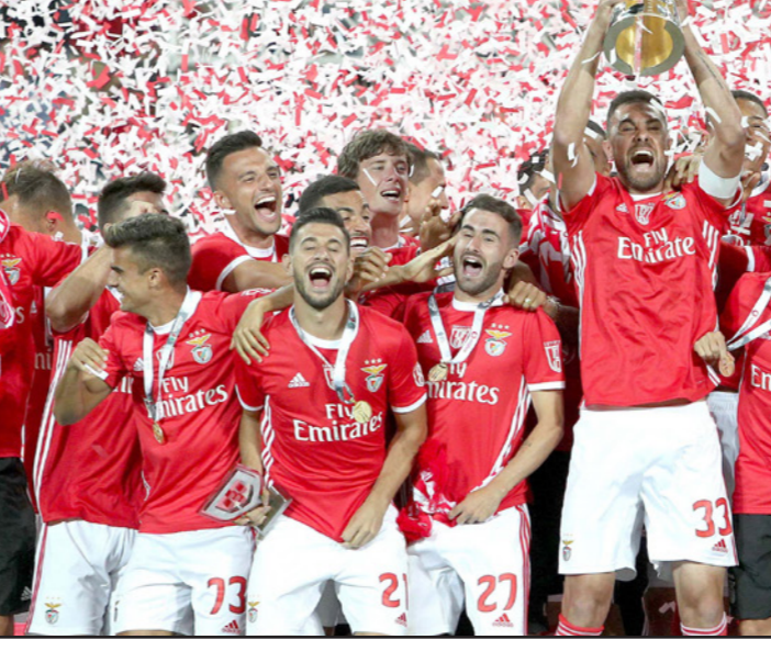
لاعبو بنفيكا يحتفلون بالكأس السوبر للمرة الثامنة