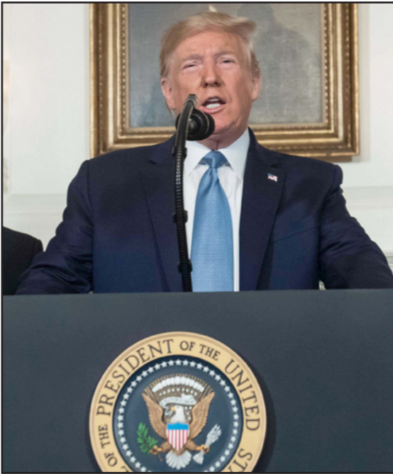
الرئيس الأمريكي دونالد ترامب

وتشير بيانات الحكومة المكسيكية إلى أن 70 ٪ من الأسلحة التي تستخدم في تنفيذ الأعمال الإجرامية في المكسيك تدخل البلاد عبر حدودها الشمالية. وسجلت المكسيك العام الماضي عدداً غير مسبوق من جرائم القتل بلغ 35 ألف جريمة.