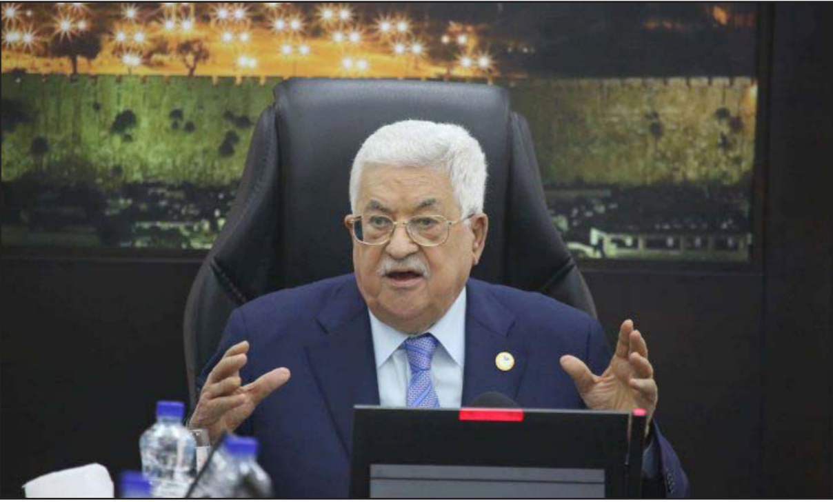
الرئيس الفلسطيني محمود عباس

بعد تصريحه بوقف العمل بالاتفاقيات الموقعة