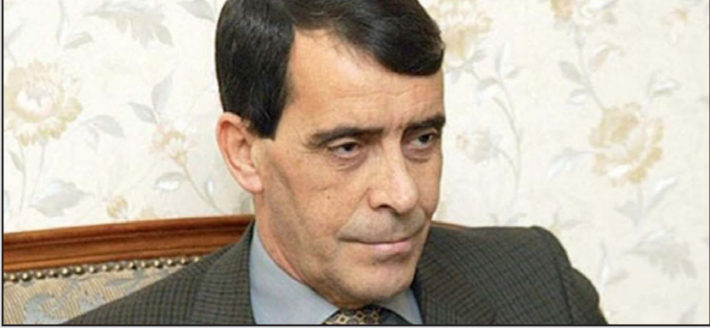
الجنرال المتقاعد حسين بن حديد

من أجل مواصلة تجسيد مطالب الجزائريين، التي تحقق الكثير منها. واعتبر المحامي أن هذا الكلام تم تحويره من طرف بقايا العصابة داخل النظام، وفسره بطريقة خاطئة وقدموه على أساس أنه جنحة المساهمة في وقت السلم في إضفاء معنويات الجيش، والمنصوص عليها في المادة 75 من قانون العقوبات، وأن هذا التكليف الخاطئ لتصرفه في حين كان وراءه النائب العام السابق لدى مجلس قضاء الجزائر العاصمة، ووكيل الجمهورية بمحكمة سيدي أحمد، المقربين من وزير العدل السابق طيب لوح، والذي تم اتهامه وحبسه بعد توقيف وحبس الجنرال بن حديد. وتوقعت مصادر مقربة من هذا الملف «أن يعلن عن خبره بالتأكد أن الجنرال بن حديد سبق أن تم حبسه خلال فترة حكم الرئيس عبد العزيز بوتفليقة، قبل أن يطلق سراحه بعد أشهر من توقيفه ليحسب مجدداً منذ حوالي أربعة شهر، أياماً قليلة بعد نشره رسالته المفتوحة في الصحف اليومية، وهي الرسالة التي أثارت الكثير من الجدل.