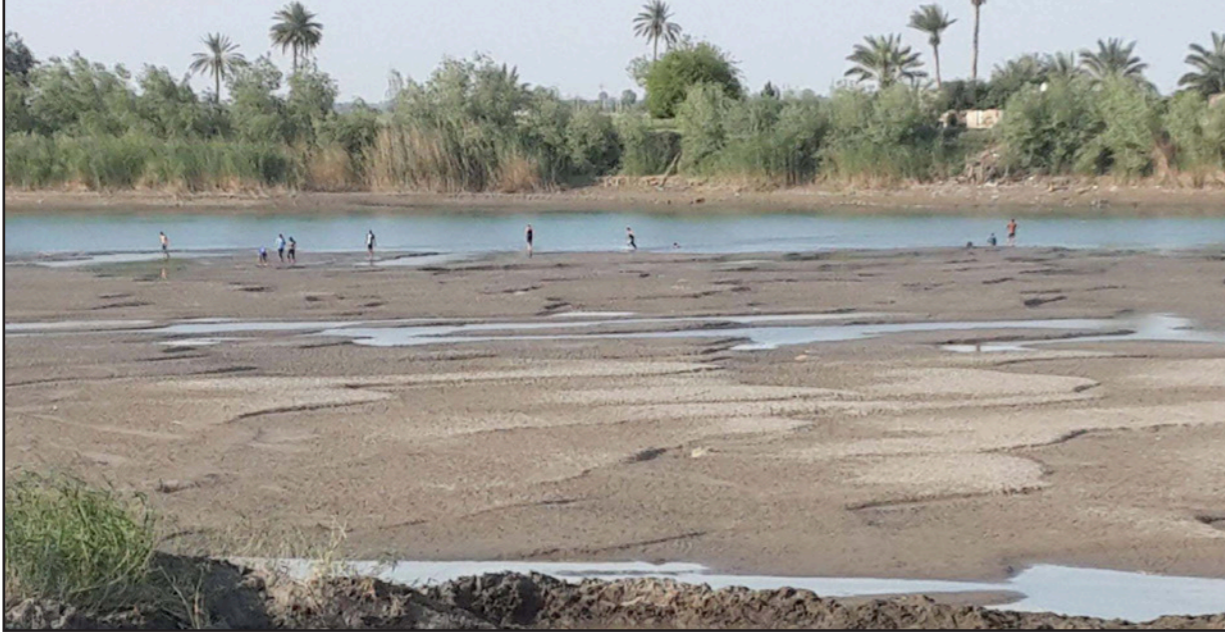
قلق من انخفاض منسوب المياه في نهر الفرات