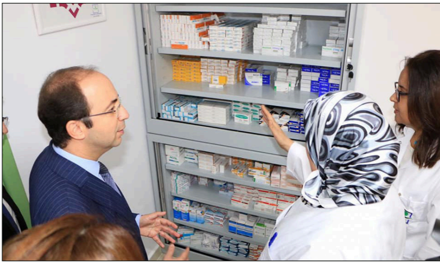
صيدلية في المغرب

وقد فتح غياب دواء ليفوتيروكس لضربات الغدة الدرقية المجال لاستيراد بطريقة غير قانونية من طرف المواطنين، حيث نشطت سوق مليئة (المدنية المغربية التي تحتها إسبانيا) وسوق الفلاح بوجدة، حسب مصادر موثوقة، وأصبح يتم إدخال هذا الدواء بطريقة غير قانونية من إسبانيا أو من الجزائر، وهذا يشكل مصدر قلق للفاعلين المدنيين في مجال الصحة، فمفظمة الصحة العالمية تقول إن أكثر من 10 بالمائة من الأدوية المتداولة في إفريقيا مفسومة، ويخشى هؤلاء الفاعلون من أن تصاب السوق المغربية بهذه العدوى، أي ظاهرة الأدوية المفسومة الناتجة في إفريقيا جنوب الصحراء. ورغم الحديث عن كتيبة من الدواء قد تم جلبها، إلا أن العديد من المرضى والصيدلية أقيادوا أن لا أثر لها بالصيدليات وأن الدواء ما زال مفقوداً، وهو ما أكدته