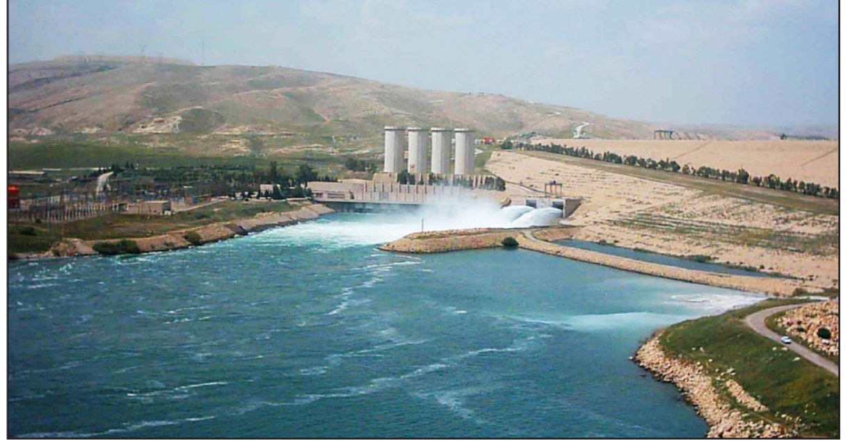
أرضيفية لسد أليسو التركي

ويبينما شدد الوزير العراقي على أن البلدين يمكن حاليا علاقة أفضل بالمقارنة مع الفترة السابقة، لفت إلى أن المبعوث التركي «نقل الينا مواقف الرئيس أردوغان الإيجابية والبناءة حول مسألة المياه، ونحن نرحب بذلك»، بدون الكشف عن مزيد من التفاصيل. ويتضح من جميع التصريحات الرسمية السابقة، إلى جانب التفاصيل التي تحدثت عنها مصادر عراقية وتركية مقيمة من المباحثات أن تركيا قدمت للعراق تطبيقات وعود تتعلق بموضوع ملء السد بشكل مباشر، وأخرى تتعلق بتعزيز التعاون الاقتصادي بين البلدين. وفي ما يتعلق بملء السد تعهدت أنقرة بمراعاة مصالح العراق، وملء السد بشكل تدريجي وينسب ضليلة والأخذ بعين الاعتبار حصول أي نقص أو مشاكل على الجانب العراقي خلال هذه الفترة، والحفاظ على استمرار وصول نسب مناسبة وكافية للجانب العراقي. وعلى جانب آخر، قدم المبعوث التركي وعدا للجانب العراقي بمساعدة في بناء مشاريع تتعلق بالمياه والكهرباء والغابات وخطوط المياه والمجاري والتوزيع وغيرها بما يعزز البنية التحتية للمياه في العراق ويقلل من احتمالات تضرره من السد التركي.