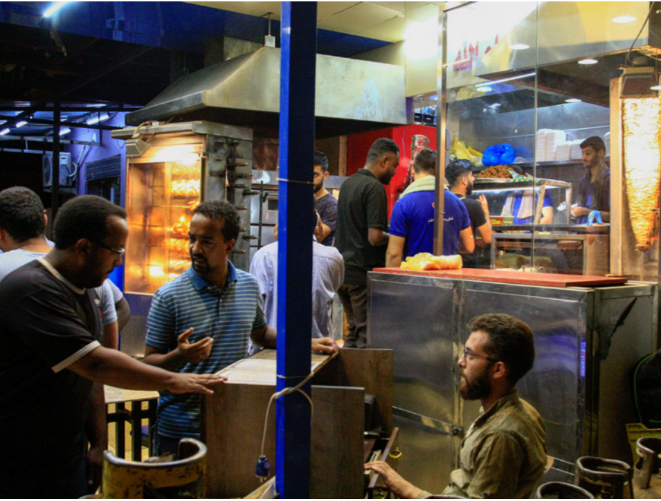
متجر أثاث ومطعم سوريين وسودانيون يتناولون طعاما شاميا