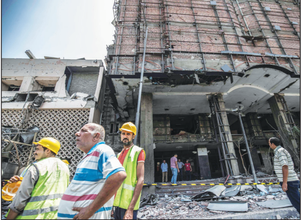
مصريون قرب المبنى الذي حصل التفجير امامه في القاهرة أمس (تفاصيل ص 3)

حسّمت وزارة الداخلية المصرية ترددها الذي استمر لساعات بشأن الانفجار الذي شهد محيط معهد الأورام في القاهرة، فجر أمس الإثنين، وأعلنت أنه نتج عن هجوم إرهابي بعد أن كانت روايتها الأولى أن سبب الانفجار هو حادث سير. وقالت الوزارة في روايتها الأولى إنه في إطار فحص حادث انفجار إحدى السيارات في منطقة شارع القصر العيني أمام معهد الأورام، تبين أنه نتيجة تصادم إحدى السيارات الخصوصية بثلاث سيارات أثناء محاولة سيرها عكس الاتجاه. وكشفت في آخر بيان لها بعد ظهر أمس أن «إحدى السيارات، المبلغ عن سرقته من محافظة المنوفية منذ بضعة أشهر، كانت تحمل كمية من المتفجرات وعند اصطدامها بسيارات أخرى وقع الانفجار». ونقلت إلى أن التقديرات تفيد بأن السيارة كانت في طريقها إلى أحد الأماكن لاستخدام المتفجرات التي حملها في تنفيذ عملية إرهابية. ووجهت الوزارة الاتهامات إلى حركة «حسم» (حركة سواد مصر) التي تقول إنها تابعة لجماعة الإخوان، في وقت تنفي الجماعة أي علاقة لها بهذه الحركة. وأكدت الوزارة أن «حسم» وراء إعداد وتجهيز تلك السيارة استعدادا لتنفيذ إحدى العمليات الإرهابية بمعركة أحد عناصرها. وأعلنت وزيرة الصحة المصرية هالة زايد أن حصيلة الحادث بلغت 20 قتيلًا و47 مصابا. وقالت وزيرة في بيان أمس الإثنين، إن الوضع الصحي للمصابين مطمئن بشكل عام، باستثناء 3 حالات خطيرة أدخلت في الرعاية المركزة، مشيرة إلى ارتفاع عدد الوفيات إلى 20 بينما 4 جثث لجوهولن وكيس أشلاء.