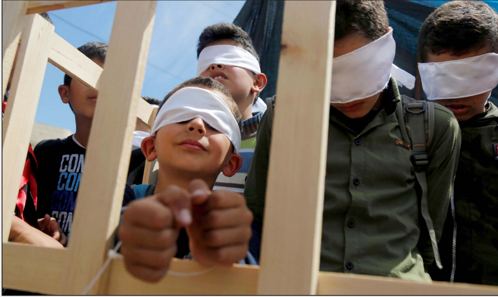
تظاهرة لإطفال فلسطينيين معصوبي الأعين دعما للأسرى في سجون الاحتلال