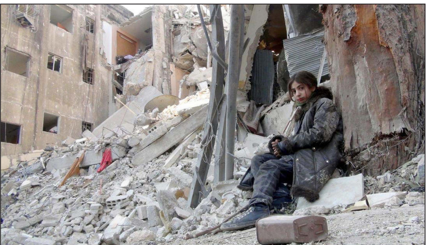
طلعة سورية تجلس وسط الدمار أمام منزلها

عندما يسمع اللاسامي كلمة «يهودي»، فإن الصور التي تظهر في ذهنه المشوه لا تكون معاناة اليهودي – المايح وفوق كل شيء الكارثة – بل صورة يهودي قبيح الوجه وجشع، يحاول السيجطرة على العالم. يبدو أننا بعد لحظة سنحصل على وميض آخر لتسفير: إضافة إلى أعمال الإرهاب الكثيرة التي ينسبها سياسيو اليمين للفلسطينيين – «إرهاب دبلوماسي»، «إرهاب النضال الشعبي»، «إرهاب المقاطعة» – فمئة نوع آخر من الإرهاب وهو «الإرهاب الأدبي».