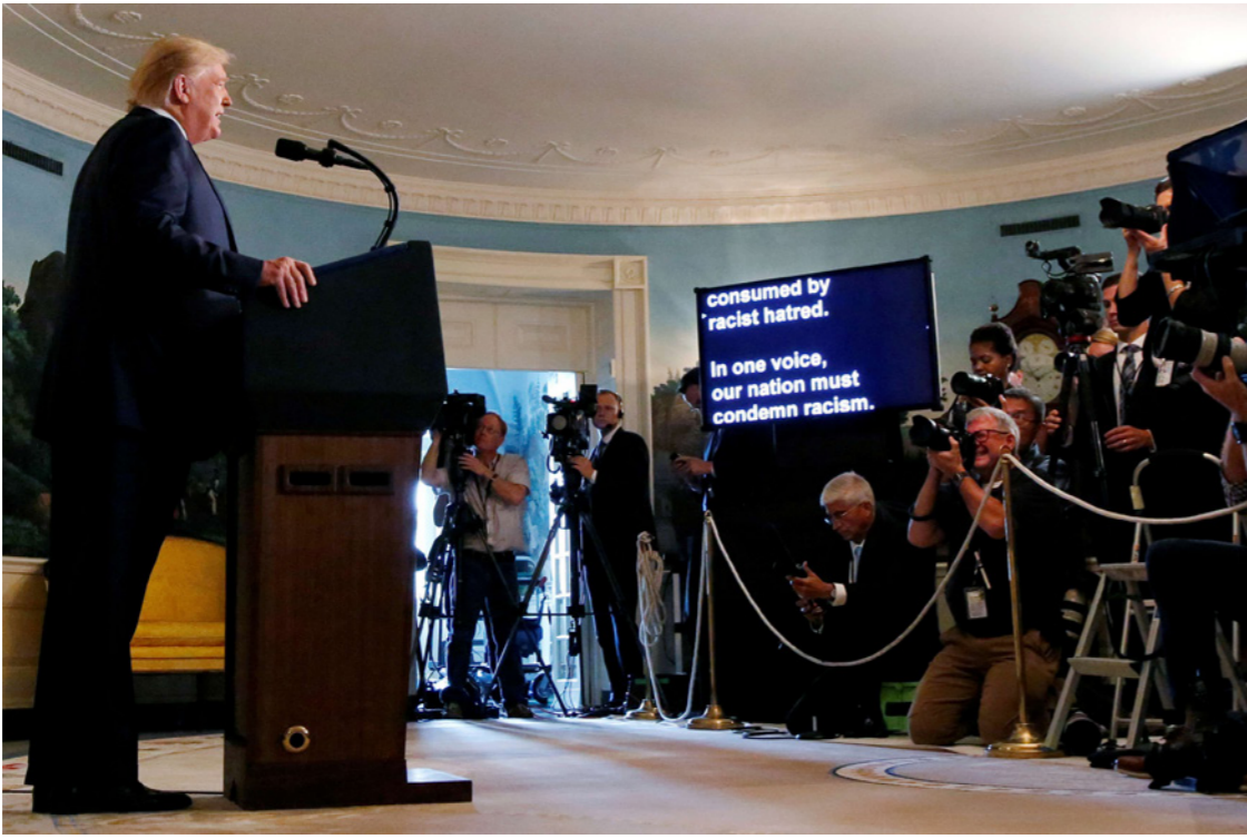
ترامب في مؤتمر صحافي أمس في البيت الأبيض مندداً بالاعتداءات العنصرية التي طالت الأمريكيين

رسم الحادثة على أنها «مشكلة أمراض عقلية».