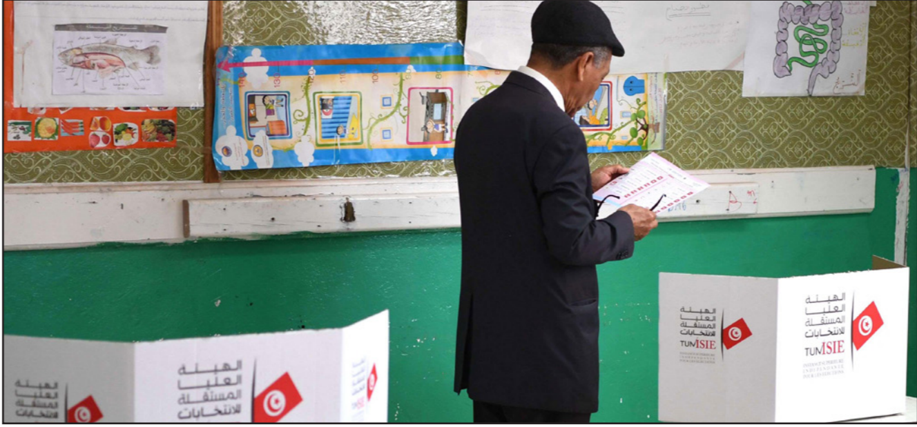
ناخب في أحد مراكز الانتخابات الرئاسية في تونس