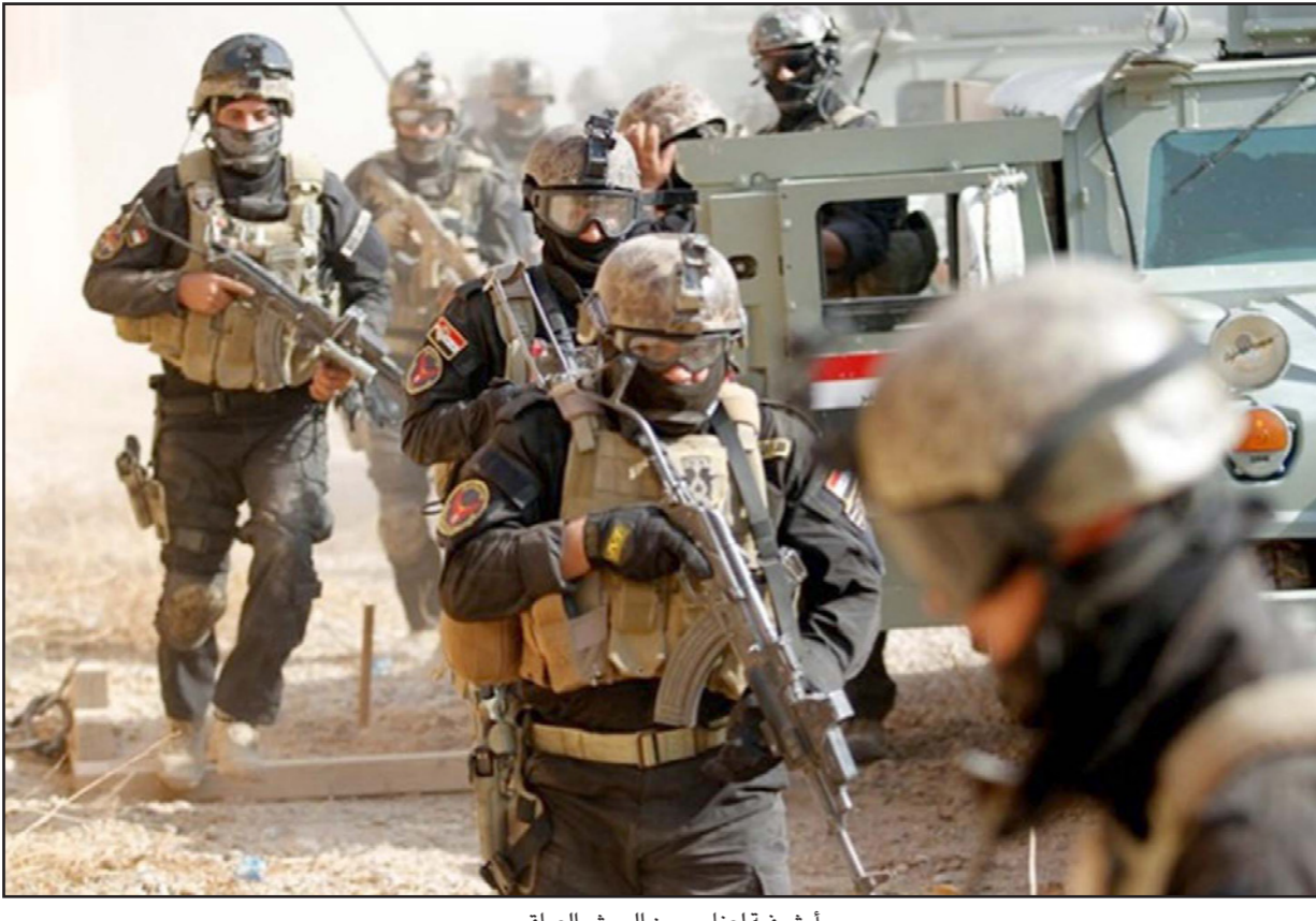
أرضيفية لعناصر من الجيش العراقي

■ بغداد - الأناضول: أعلنت وزارة الدفاع العراقية، أمس الإثنين، انطلاق المرحلة الثالثة من عملية «إرادة النصر» التي تستهدف عناصر تنظيم «الدولة» (داعش) الإرهابي، في محافظتي ديالى (شرق) ونيوى (شمال). وفي بيان لها قالت قيادة العمليات المشتركة التابعة للوزارة إن عملية إرادة النصر الثالثة انطلقت، وصل رئيس الوزراء وتفتيش وتطهير مناطق شمالي محافظة ديالى، ومناطق جنوب محافظة نينوى، بهدف القضاء على فلول تنظيم «داعش»، وإنهاء تهديد. ونقل البيان عن نائب قائد العمليات الفريق الركن عبد الأمير رشيد يار الله، قوله إن «العملية شاركت فيها الفرقة الخامسة في الجيش العراقي، ولواء مغاوير قيادة العمليات، وشرطة ديالى و3 ألوية في قاطع محور الحشد الشعبي». وتابع أن «العملية تمت بإسناد جوي من