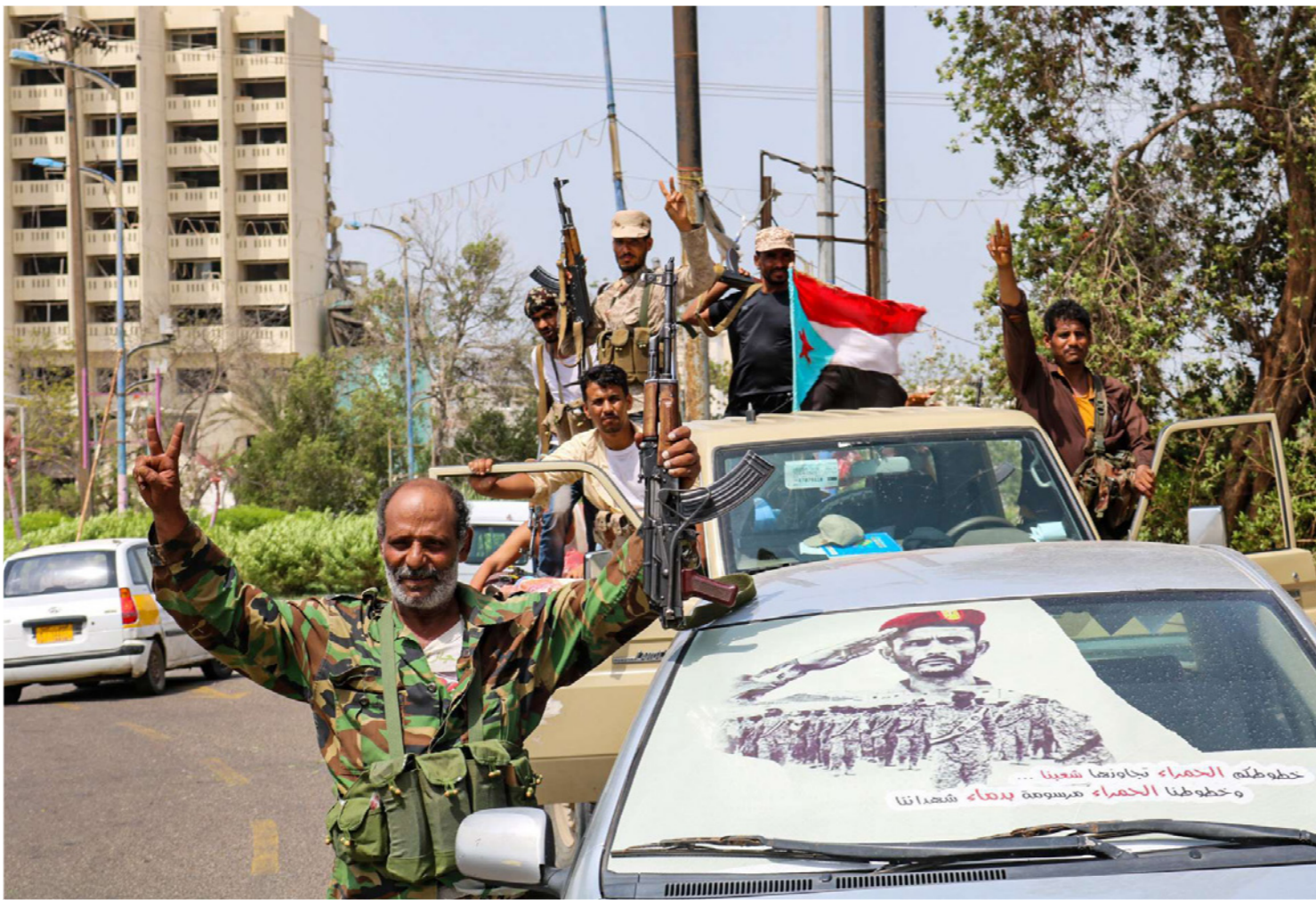
عناصر من الانفصاليين اليمنيين يحملون علم الجنوب

الحوثيين على العاصمة صنعاء عام 2014، وأدت لخروج هادي إلى عدن ومنها إلى الرياض. ويقول الكاتب إن الجنوب يواجه خطر الإنهيار فيما يتشردم التحالف وتتعرض العلاقات السعودية - الإماراتية لحالة امتحان. ويشير الكاتب إلى أن الحرب الأهلية في اليمن بدأت عام 2015 بهدف إعادة هادي إلى صنعاء ثم تطورت لحرب بالوكالة اتهمت فيها السعودية والإمارات إيران بدعم الحوثيين. إلا أن الحرب دخلت حالة انسداد، معها بدأ التصعد يظهر في التحالف عندما أعلنت الإمارات في تموز (يوليو) عن خطط لسحب قواتها من اليمن على خلفية دعم المبادرات التي ترعاها الأمم المتحدة ووقف إطلاق النار الهش في ميناء الحديدة المهم على البحر الأحمر. ويقول إن الدولة الخليجية تفكر منذ وقت طويل تخفيف وجودها في اليمن لأنها سئمت من هادي وشعرت بأن وجودها في اليمن يشوه صورتها ولأن الحل العسكري بات بعيداً. وقالت إنها دريت 90.000 مقاتل جنوبي من أجل الحفاظ على الوضع وعدم ترك فراغ، إلا أن المجلس الانتقالي الجنوبي قام بعد فترة قصيرة بالهجوم على عدن وطرده الحكومة الشرعية.