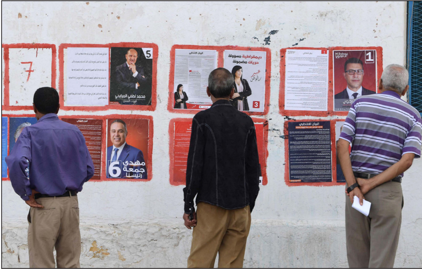
تونسيون أمام ملصقات مرشحين قبيل انطلاق الحملة الانتخابية

ولدى افتتاحه لحملة الانتخابية، تعهد الشاهد بإحياء مشروع اتحاد المغرب العربي، وإنشاء منطقة للتبادل الحر مع الجزائر، كما تعهد بالانضمام بثوابت الدبلوماسية التونسية، مع العمل على تعزيز علاقات تونس الخارجية، خصوصاً مع دول الجوار، عبر التدخل لإيجاد حل للأزمة الليبية ولعب دور أقوى وأنجح من ذي قبل.