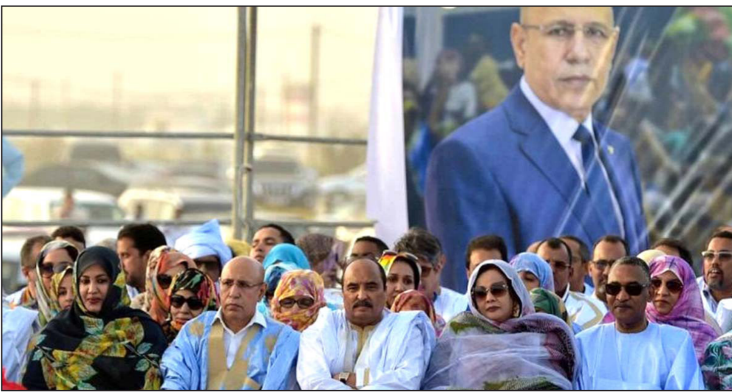
صورة تجمع الرئيس الموريتاني محمد الغزواني والرئيس السابق محمد ولد عبد العزيز

«إن الثقة التي منحها للرئيس غزواني غالبية مواطنيه في الانتخابات الأخيرة، يضيف المحلل، ستتناثر كثيراً إذا ظهر أن غزواني مجرد بيدق بيد الرئيس السابق أو مجرد شخص مسخر للرئيس المنصرف». واز: «إن أول قرار يتيسر إلى التغيير الذي يسعى له الرئيس غزواني، هو تعيينه يوم الرابع آب/أغسطس المنصرم لحكومة بقيادة اسماعيل الشيخ سيديا، وهو ستيقي تم إصفاؤه من طرف الرئيس المنصرف، كما أن إرادة التغيير واضحة من خلال الطابع التكنوقراطي الشامل لأعضائها، الذين عينهم الرئيس غزواني دون مراعاة أن يكونوا من حزب الرئيس السابق حزب الاتحاد من أجل الجمهورية، بل للسهر على تطبيق برنامج الرئيس غزواني». وأوضح الكاتب «أن اشتغال الحكومة الجديدة على ستة وزراء (بينهم وزير العدل ووزير الداخلية ووزير الثقافة ووزير التعليم العالي) من مجموعة «الحراطين» (الزنوج المستعربين) يشير إلى رغبة الرئيس الجديد في إنهاء سياسة الإقصاء التي تشكو منها هذه الجموعة منذ عقود».