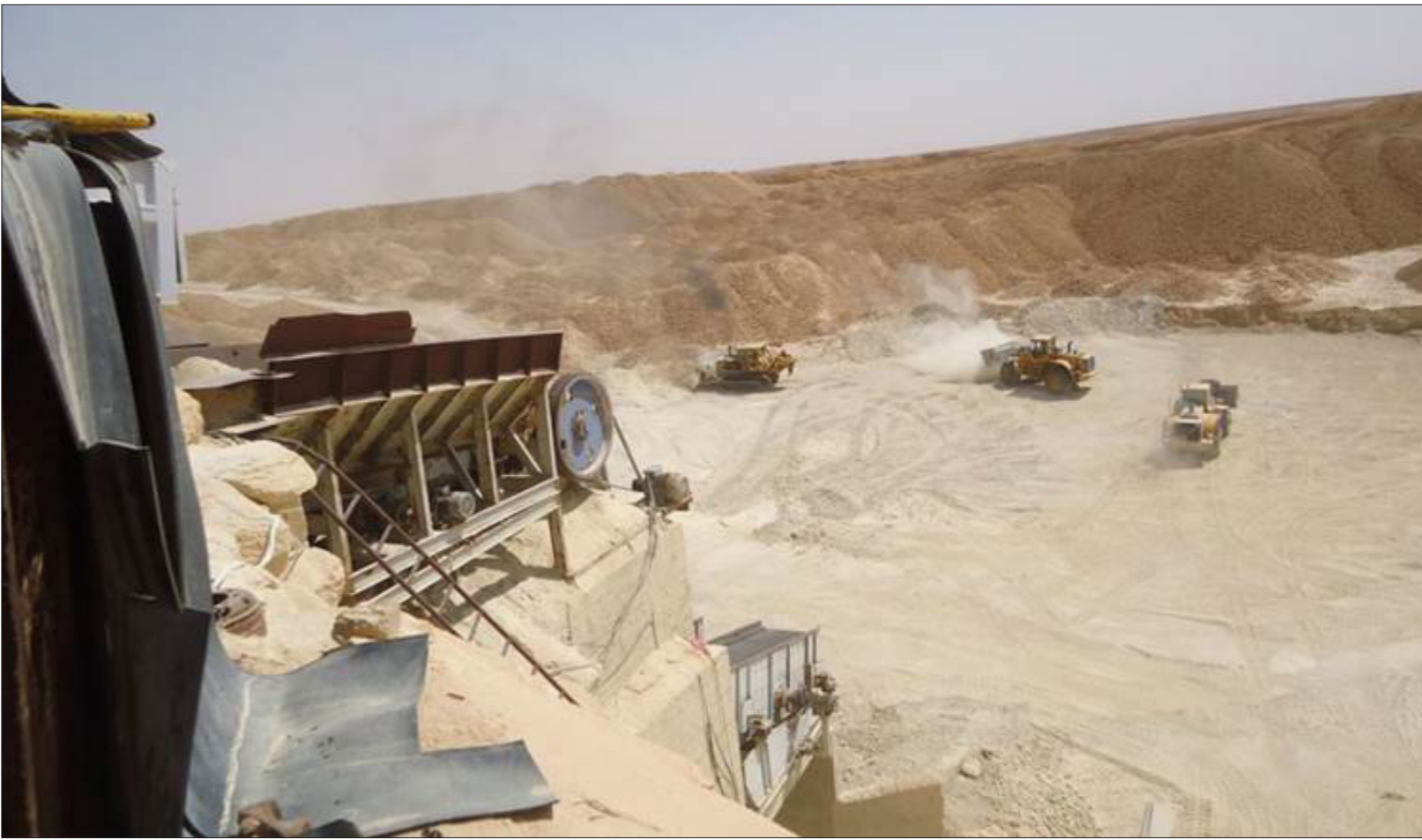
جانب من منجم سطحي للفوسفات قرب حمص