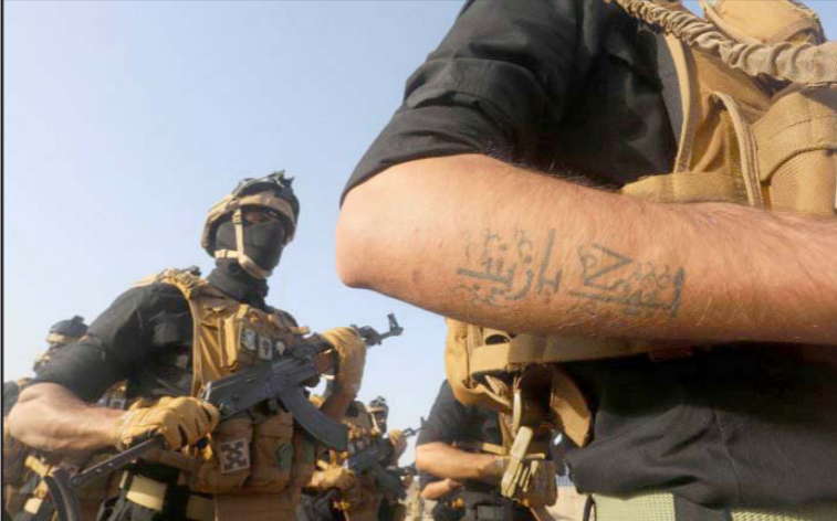
عناصر مؤيدة للنظام الإيراني

التي تملكها إسرائيل والولايات المتحدة فيما يتعلق بالخطط التكتيكية لإيران هو في محله. من الواضح أنه يمكنها الدخول عميقا إلى مستوى الوحدات التنفيذية الإيرانية والحصول على معلومات في الوقت الحقيقي. لذلك حاولت المخابرات إلى الجسم الأهم في عملية اتخاذ القرارات التي يمكنها التأثير على التطورات السياسية والاستراتيجية في المنطقة. ولكن هذا يحتاج مضلل. إن إحباط إطلاق القمر الاصطناعي الإيراني أو الانفجار المجهول لقاعدة صواريخ في العراق، وتدمير منشأة خاصة لمسلح مواد لتفجير وتدمير مبنى كان يستخدم لإطلاق الطائرات المسيرة ضد إسرائيل، تشبه على مستوى التكتيك، ورغم الفوارق اللوجستية الكبيرة، ضرب أهداف في قطاع غزة. يمكن اغتيال قادة لحماس وتدمير بنى تحتية مدنية