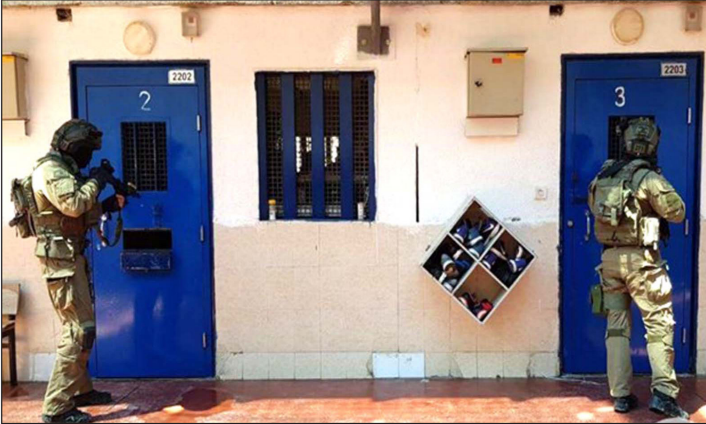
جنود الاحتلال يقتحمون زنازين الأسرى الفلسطينيين

وكانت قيادة الحركة الأسيرة، قد أعلنت أول من أمس أن السائح بات قلبه يعمل بنسبة 15 % فقط، ما يهدد حياته، فيما تواصل سلطات الاحتلال اعتقاله على سرير المرض في أحد المشافي الإسرائيلية. ودخل المشفى منذ شهر، حيث يعاني حالياً من تدهور إضافي طرأ على عضلة القلب، وأوضحت الحركة الأسيرة، في تصريح مقتضب، أن الرئة اليمنى للسائح توقفت عن العمل بسبب السوائل الزائدة، مشيرة إلى أن المياه بدأت تنزل لمنطقة القدمين، ما أعجزه عن الحركة. وأقلت الحركة الأسيرة بالمسؤولية على عاتق سلطات الاحتلال وإدارة السجن الإسرائيلية، وأكدت أنها ستستخذ «خطوات احتجاجية واسعة» مالم تقدم إدارة السجن العناية الطبية اللازمة للأسيرين. إلى ذلك أكدت هيئة شؤون الأسرى والمحررين، أن