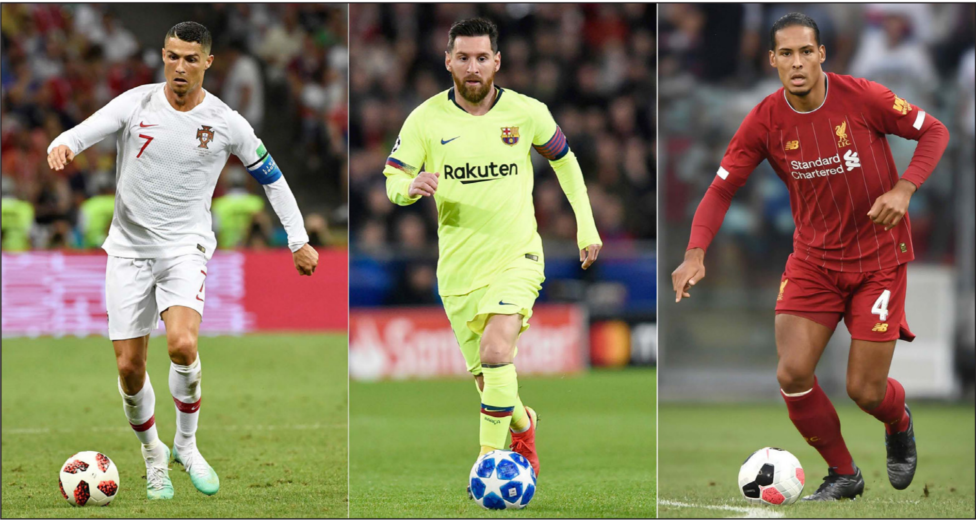
المرشحون الثلاثة لجائزة أفضل لاعب من اليمين: فان دايك وميسي ورونالدو

البرشلونة الأرجنتيني ليونيل ميسي عن هدف لبرشلونة في شباك ريال بيتيس ضمن الدوري الإسباني في 17 آذار/مارس 2019، والكولومبي خوان فيرناندو كينتينو عن هدف سجله لريفر بلست في شباك ريسينغ كلوب في الدوري الأرجنتيني في العاشر من شباط/فبراير 2019. والجري دانييل جوري عن هدف سجله لفريق ديبيريشن في شباك فيرنكفورش في الدوري المجري في 16 شباط/فبراير 2019.