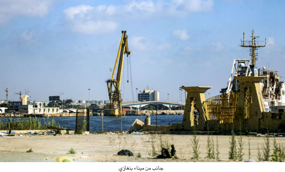
جانب من ميناء بنغازي