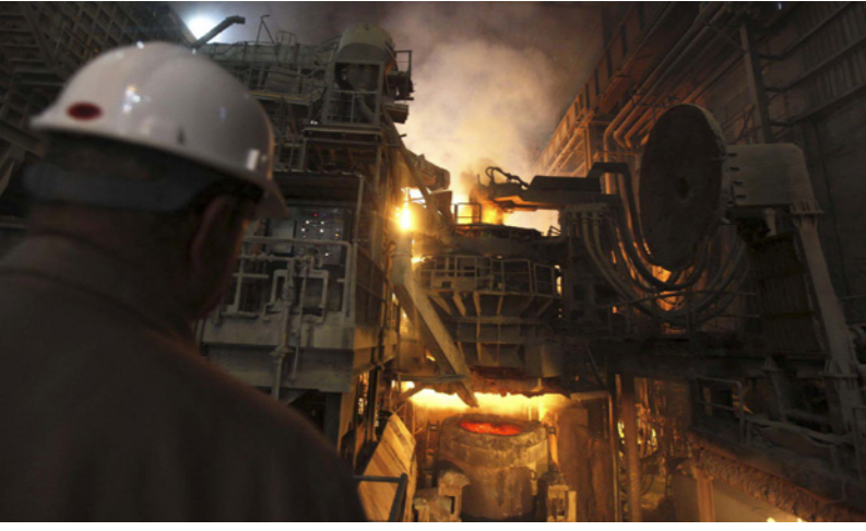
مهندس يراقب صب الحديد المنصهر في حاوية في مصنع تابع لشركة «حديد عز»

سهم «حديد عز» المصرية يهوي 10% بعد خفض سي.أي كابيتال لسعره المستهدف 65%