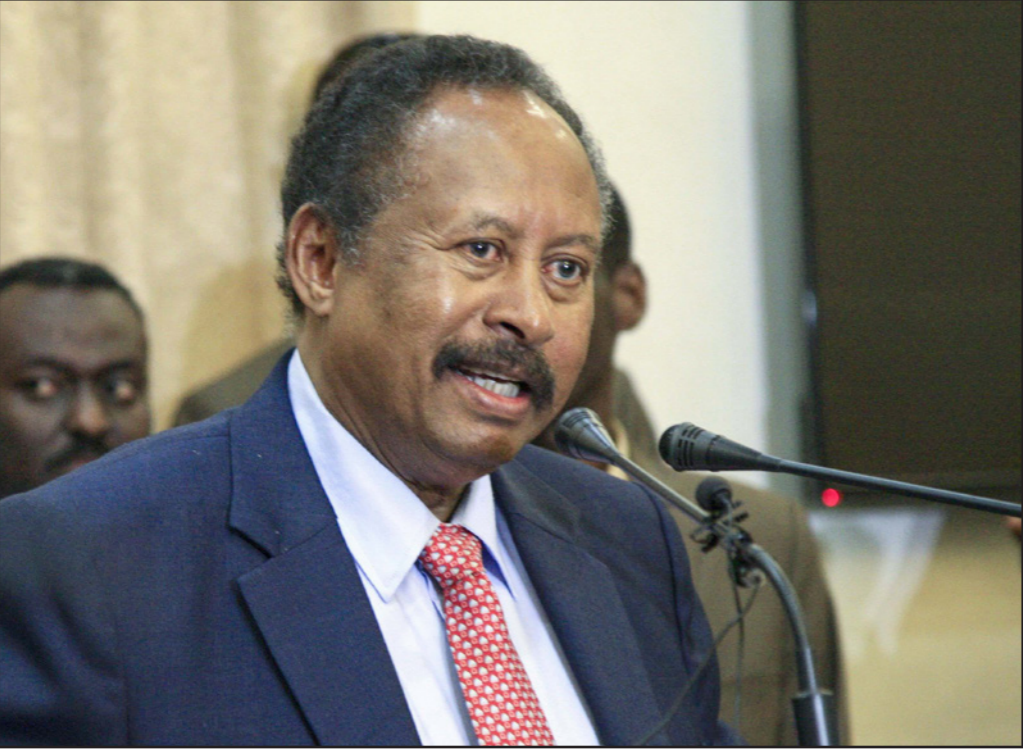
رئيس الوزراء السوداني الجديد عبد الله حمدوك

حيث نعتزم الاطلاع على مهام بعثة الأمم المتحدة لتحقيق الاستقرار في جمهورية الكونغو الديمقراطية المعروفة اختصارا باسم «مونوسكو» وكذلك على جهود مكافحة وباء إيبولا. وتأتي زيارة ماس، في وقت لا تزال فيه الجهود متواصلة من قبل رئيس الوزراء السوداني الجديد عبد الله حمدوك، لتشكيل حكومته، وسط انباء عن إجرائه تعديلات على قائمة المرشحين المقدمة من قوى «الحرية والتغيير»، حيث استغنى عن مرشحيها الثلاثة لوزارة الخارجية وسمى امرأة للمنصب، مما يعني قرب إعلان الحكومة. وقالت قوى «الحرية والتغيير» في بيان لها عقب اجتماع لجنة ترشيحاتها مع حمدوك، مساء الأحد، إن الاجتماع اتسم بمناقشات عميقة وبناءة حول الاختيار الأمثل لكل موقع من مواقع التشكيل الوزاري بما يحقق معايير الكفاءة العلمية والعملية والإدارية والموقف الملتزم بأهداف الثورة والتوازن النوعي والتمثيل للعدد السوداني الفريد. لكن حزب الأمة القومي اعتبر أن الترشيحات الوزارية لتشكيل الحكومة «لم تلتزم بالمعايير المتفق عليها»، وتقوم على المحاصصة الحزبية. وأدى عبد الله حمدوك، في 21 أغسطس/ آب الماضي، اليمين الدستورية كرئيس للوزراء، خلال مرحلة انتقالية تستمر 39 شهرا، وتنتهي بإجراء انتخابات. وأضاف نائب رئيس الحزب، فضل الله برمة ناصر، في بيان: «بدي أسفنا لتجاوز المنهجية والأسس المتفق عليها، إذ أظهرت الترشيحات التي تم الدفع بها للرئيس الوزراء، بواسطة لجنة الترشيحات (تابعة لقوى إعلان