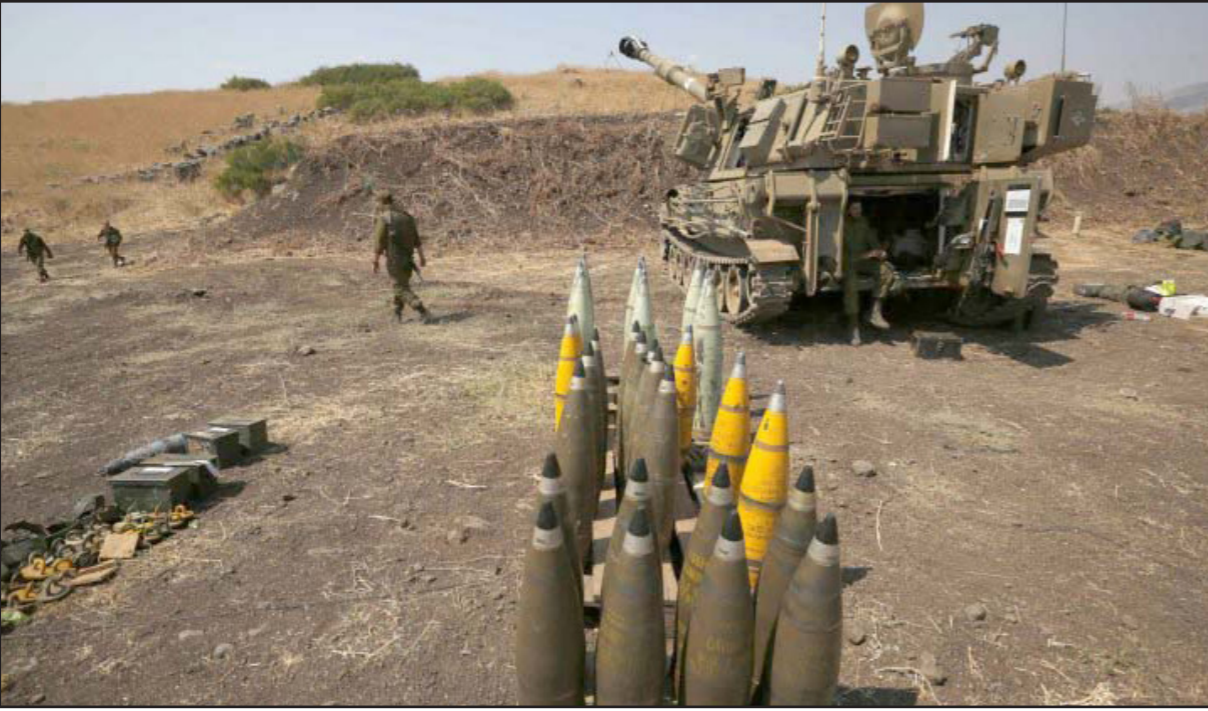
استعدادات إسرائيلية على الحدود اللبنانية