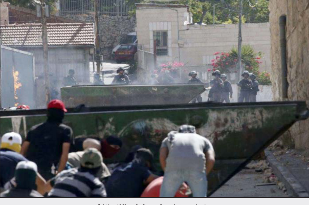
مواجهات بين شبان من العيسوية والشرطة الإسرائيلية