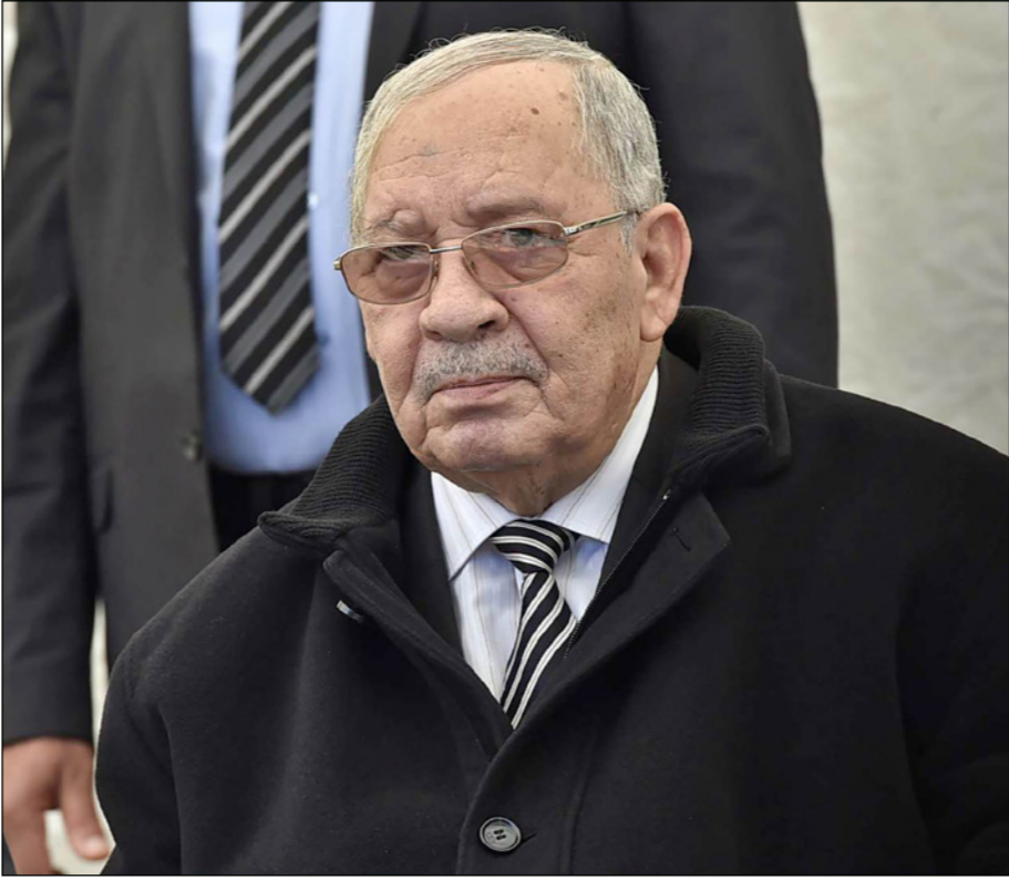
أحمد قايد صالح

كل الإمكانات المادية والبشرية لضمان دخول مدرسي في أحسن الظروف، لا سيما من خلال رفع علاوة المدرس لتصبح الأخطاء وإعادة مسار البناء إلى اتجاهه الصحيح"، وأوضح أن الإسراع بالانتخابات من شأنه ذلك "إفشار رهان العصابة وعملائها على التوشيش على الدخول المدرسي المقبل، من خلال زرع بذور الشك والبلبلة في صفوف التلاميذ وأوليائهم، تواصل جهود الدولة في توفير الظروف الملائمة لإنجاح هذا الدخول المدرسي، حيث اتخذت الحكومة كافة الإجراءات وقررت