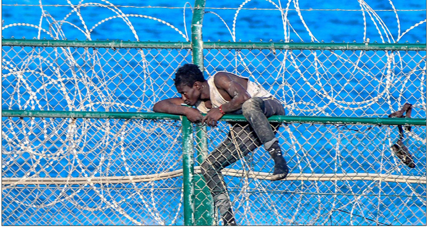
مهاجر أفريقي يتسلق سياج سبتة