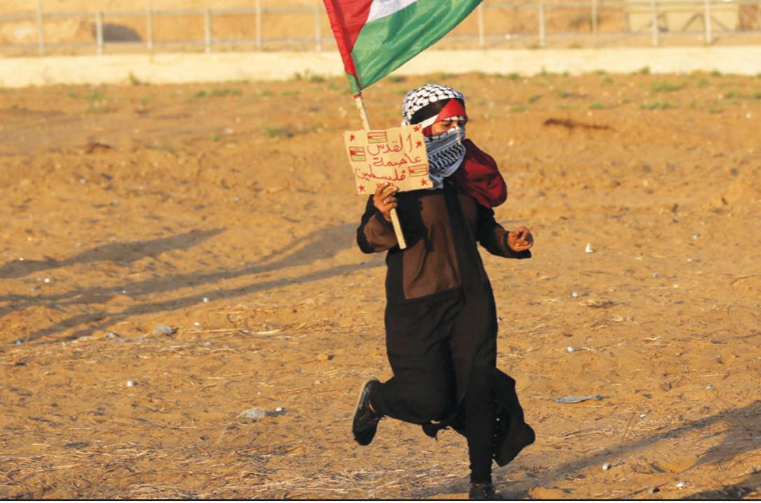
فتاة ترفع علم فلسطين في بلدة خان يونس خلال مظاهرة ضد الاحتلال الإسرائيلي

وأعلن جيش الاحتلال أيضاً عن توسعة مستوطنة «شيلو» الواقعة بين نابلس ورام الله، حيث نشرت الإدارة المدنية الإسرائيلية خريطة تضمنت إيداع مخطط استيطاني جديد في قريوت وجالود وترمسلياً، لتوسعة نطاق سيطرة مستوطنة «شيلو»، ويقوم المخطط الاستيطاني الجديد على ابتلاع مزيد من الأراضي لصالح المستوطنة.