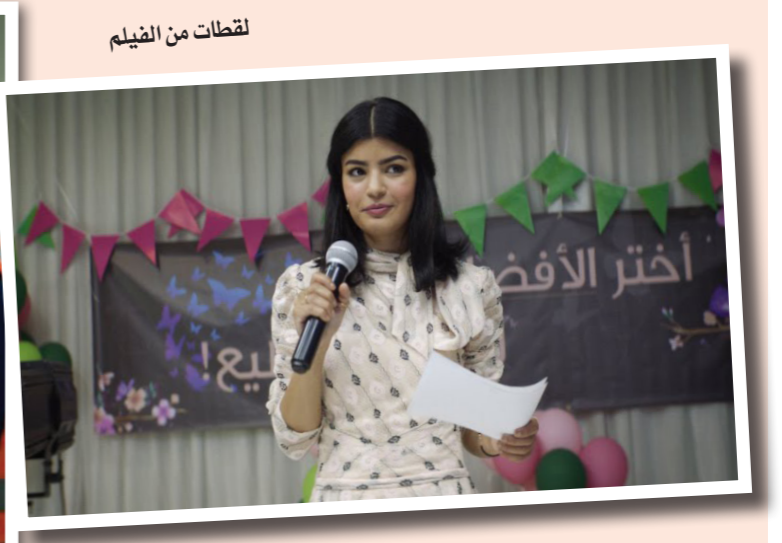
لقطات من الفيلم