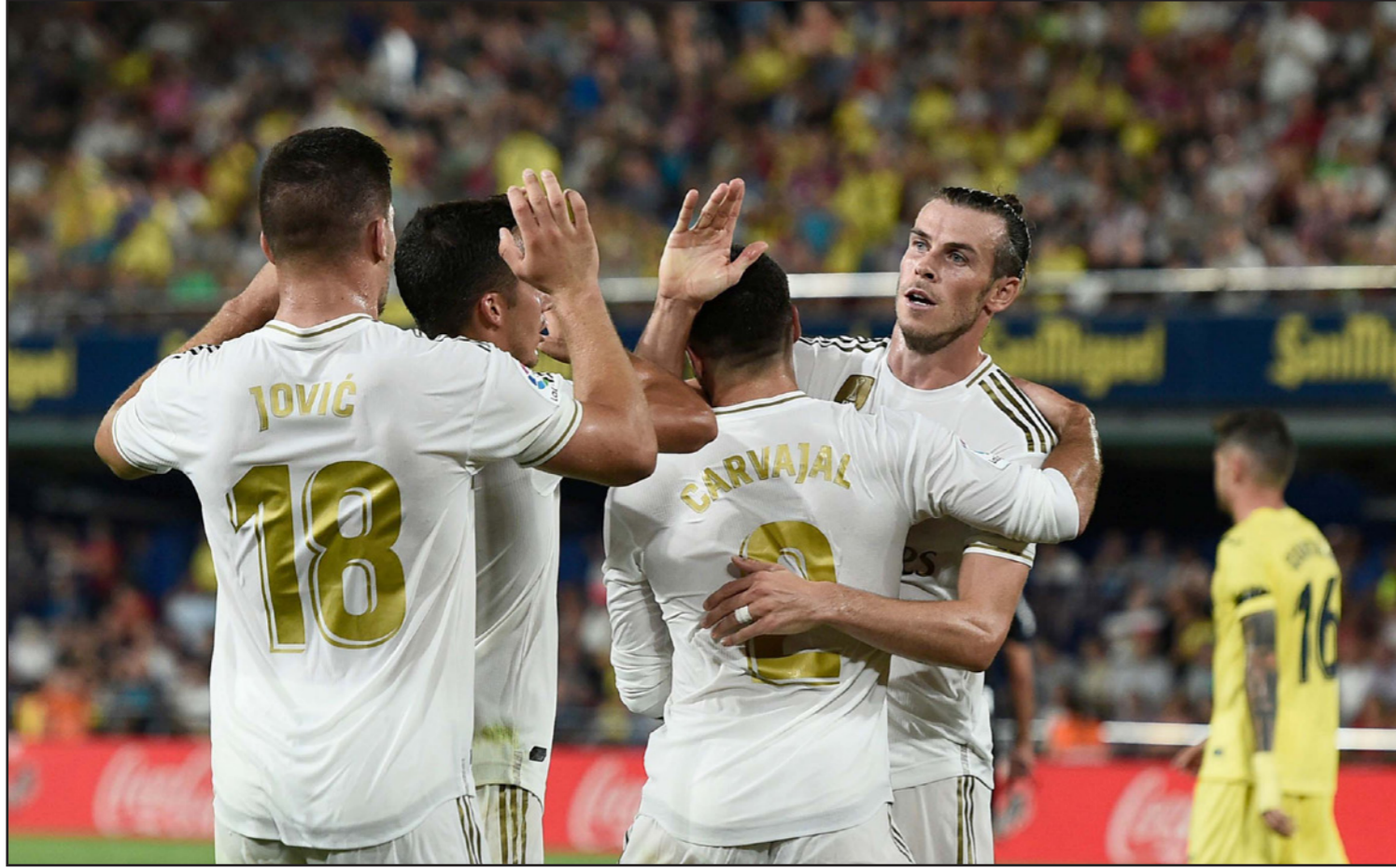
بيل يتلقى التهاني عقب تسجيل هدفين للريال قبل ان يطرد لاحقا

■ مدريد — رويترز: أنقذ غاريت بيل ريال مدريد