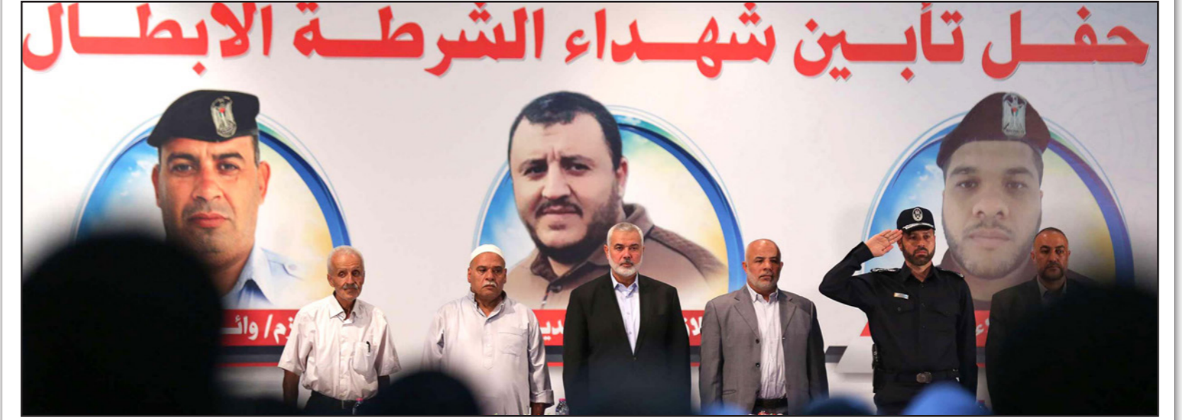
هنية يتحدث خلال حفل تأبين رجال الشرطة الذين استشهدوا في العملية الانتحارية في مدينة غزة الأسبوع الماضي