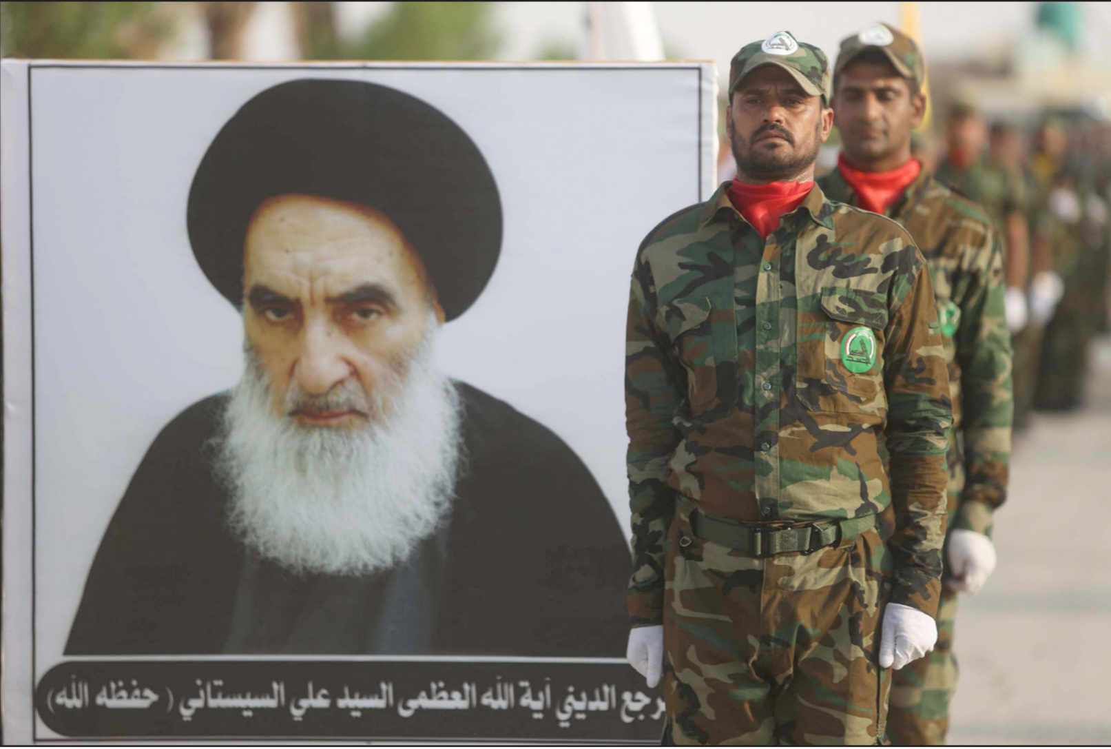
رجع الديني آية الله العظمى السيد علي السيستاني (حفظه الله)