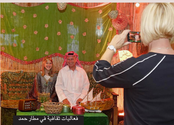
فعاليات ثقافية في مطار حمد

وحظيت منطقة الأطفال أيضاً باقبال واسع، حيث تواجد عليها أطفال من جميع الأعمار لممارسة مجموعة من الألعاب العصرية مثل لعبة «الجوجو» وتجربة مهاراتهم الفنية على جدار الرسم، وذلك خلال أوقات انتظار رحلاتهم. وعززت منطقة الأطفال أجواء البهجة المصاحبة لاحتفالات العيد عبر توزيع بطاقات التهنئة على الأطفال. كما كانت فعاليات العودة إلى المدرسة حاضرة في أروقة المطار، حيث ساهمت في استقطاب العديد من الأطفال وتهنئتهم لاستقبال العام الدراسي الجديد، وحظي المسافرون عبر المطار ممن لديهم