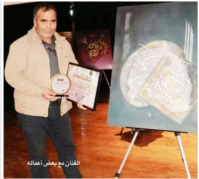
الفنان مع بعض أعماله