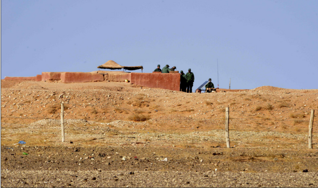
جنود مغاربة يحرسون الجدار الفاصل بين الصحراء الغربية الخاضعة لسيطرة البوليساريو والمغرب

وبينما تعتبر جبهة البوليساريو تيفاريتي وبير لحلو منطقتين محررتين وتابعتين لسلطتها، يؤكد المغرب أنهما تدخلان في المجال الجغرافي للمناطق العازلة منزوعة السلاح، وأن الأراضي الواقعة وراء الجدار العسكري الذي يقسم الصحراء أراض مغربية تحت إشراف الأمم المتحدة مؤقتاً.