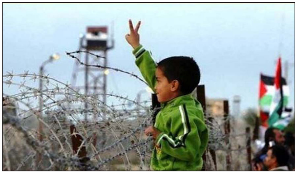
حصار غزة أكبر جريمة ضد الإنسانية