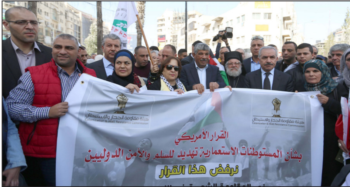
رئيس الوزراء الفلسطيني محمد اشتية خلال تظاهرة في رام الله