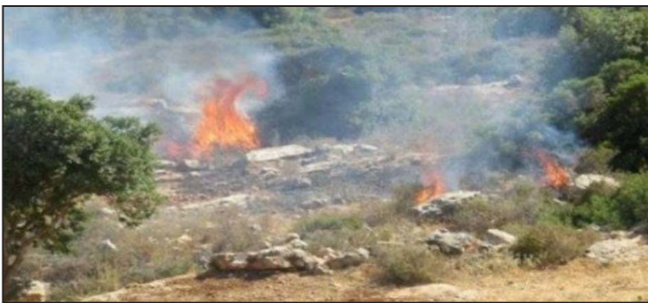
المستوطنون يضرمون النيران بأشجار الزيتون في إحدى قرى شمال الضفة