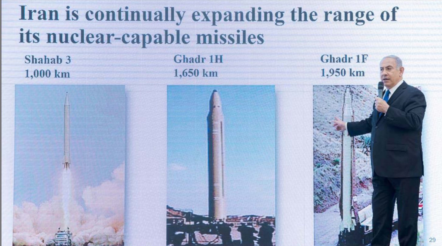
أرشيفية: لنتنياهو يشرح للصحافيين مدى خطورة قدرات إيران النووية