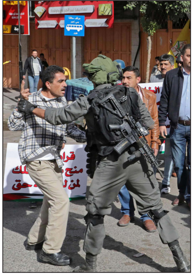
جانب من المواجهات في الضفة الغربية في يوم الغضب الفلسطيني ضد شرعنة الاستيطان