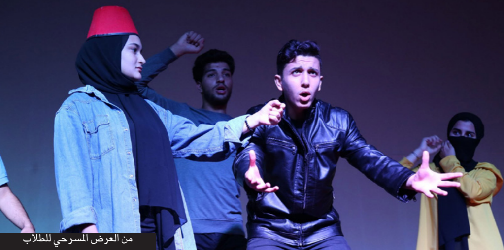
من العرض المسرحي للطلاب