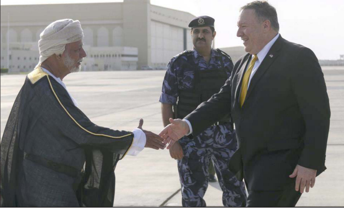
أرشيفية لوزير الخارجية العماني في لقاء سابق مع نظيره الأمريكي

في الحديدة، الإثنين، بعد إعلان الحوثيين عن عملية بالطائرات المسييرة والصواريخ الباليستية، ما أدى إلى مقتل وإصابة أكثر من 350 جندياً يمينياً، ومن ضمنهم سعوديون وإماراتيون وسودانيون. وفي المقابل، سُكنت مقاربات التحالف غارات جوية على مواقع الحوثيين في الحديدة والساحل الغربي، وأعرب رئيس البعثة الأممية في بيان، الثلاثاء، عن