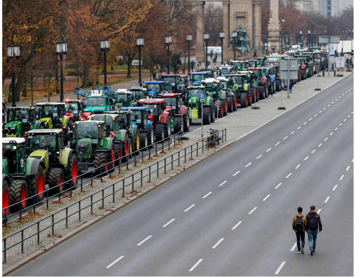
مئات الجرارات الزراعية تصطف على الطريق المؤدي إلى بوابة براندنبورغ في وسط برلين

في البلاد. ويشتكى المزارعون الألمان من عدم اهتمام الحكومة السياسية بهم، ومن رأي عام تزداد حساسيته للقضايا البيئية ويطالب الحكومات المحلية والحكومة الاتحادية بزيادة من التشدد في هذا الخصوص. يذكر انه تم في وقت سابق من العام قيام أكثر من 1.8 مواطن ف ولاية بافاريا بتوقيع عريضة تهدف إلى «إنقاذ النحل» من المبيدات الحشرية، ما دفع الحكومة المحلية للتعهد بذلك. وحسب دراسة أنجزت في ألمانيا عام 2017، فقدت أوروبا نحو 80 في المئة من حشراتنا في أقل من 30 عاما ما أسهم في انقراض أكثر من 400 مليون طائر كانت تتغذى على هذه الحشرات.