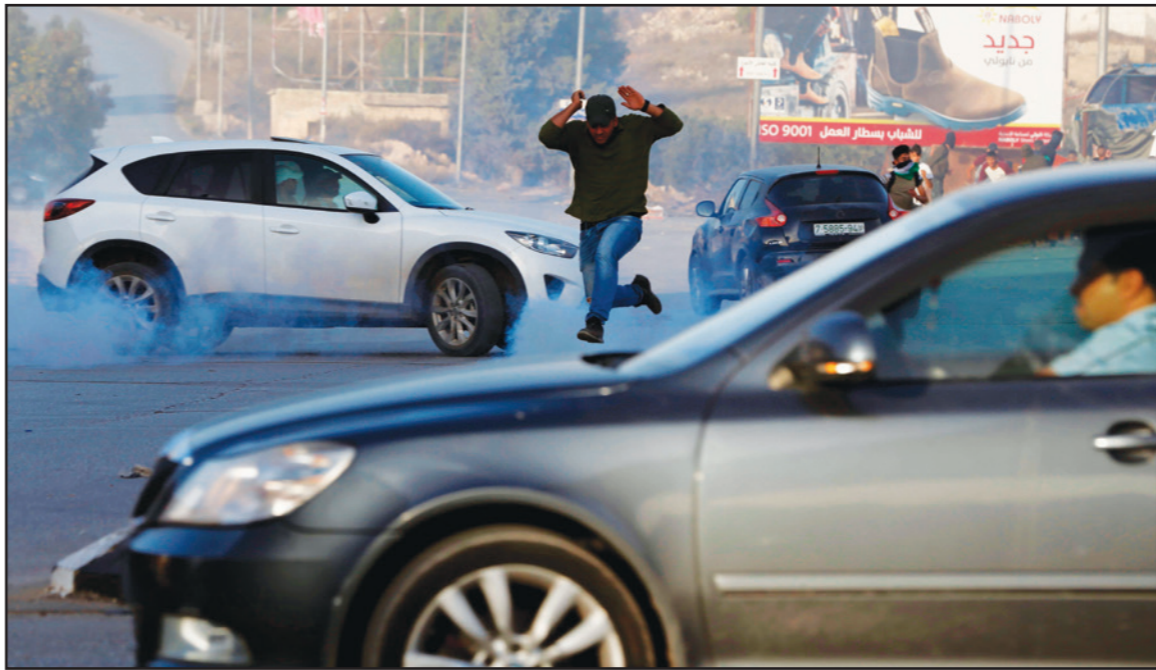
شبان فلسطينيون يهربون من قنابل الغاز المسيل للدموع خلال اشتباكات في مدينة رام الله أمس

عمّ الغضب أمس جميع الأراضي الفلسطينية وخرجت المسيرات التي شارك فيها عشرات الآلاف في جميع مدن الضفة من شمالها وجنوبها وحتى قطاع غزة، ردا على قرار وزير الخارجية الأمريكي مايك بومبيو شرعة الاستيطان في الأراضي الفلسطينية في تناقض تام مع قرارات الشرعية الدولية، فيما أعلن جيش الاحتلال رصد صاروخين أطلقا من غزة نحو إسرائيل.