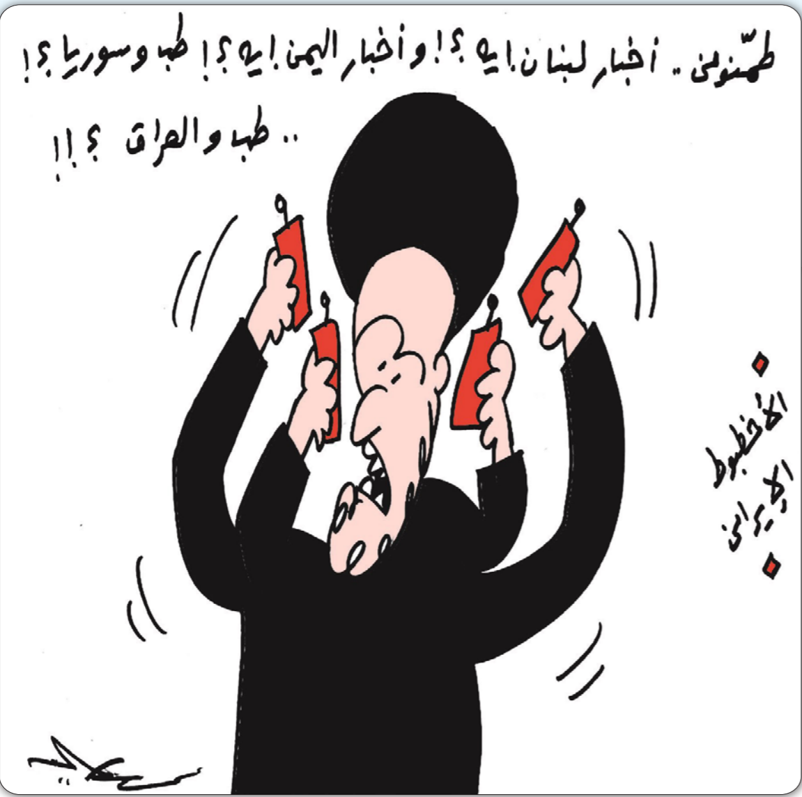
طمنوني.. أخبار لبنان ايه؟! وأخبار اليمن ايه؟! طب وسوريا؟! طب والعراق؟!..