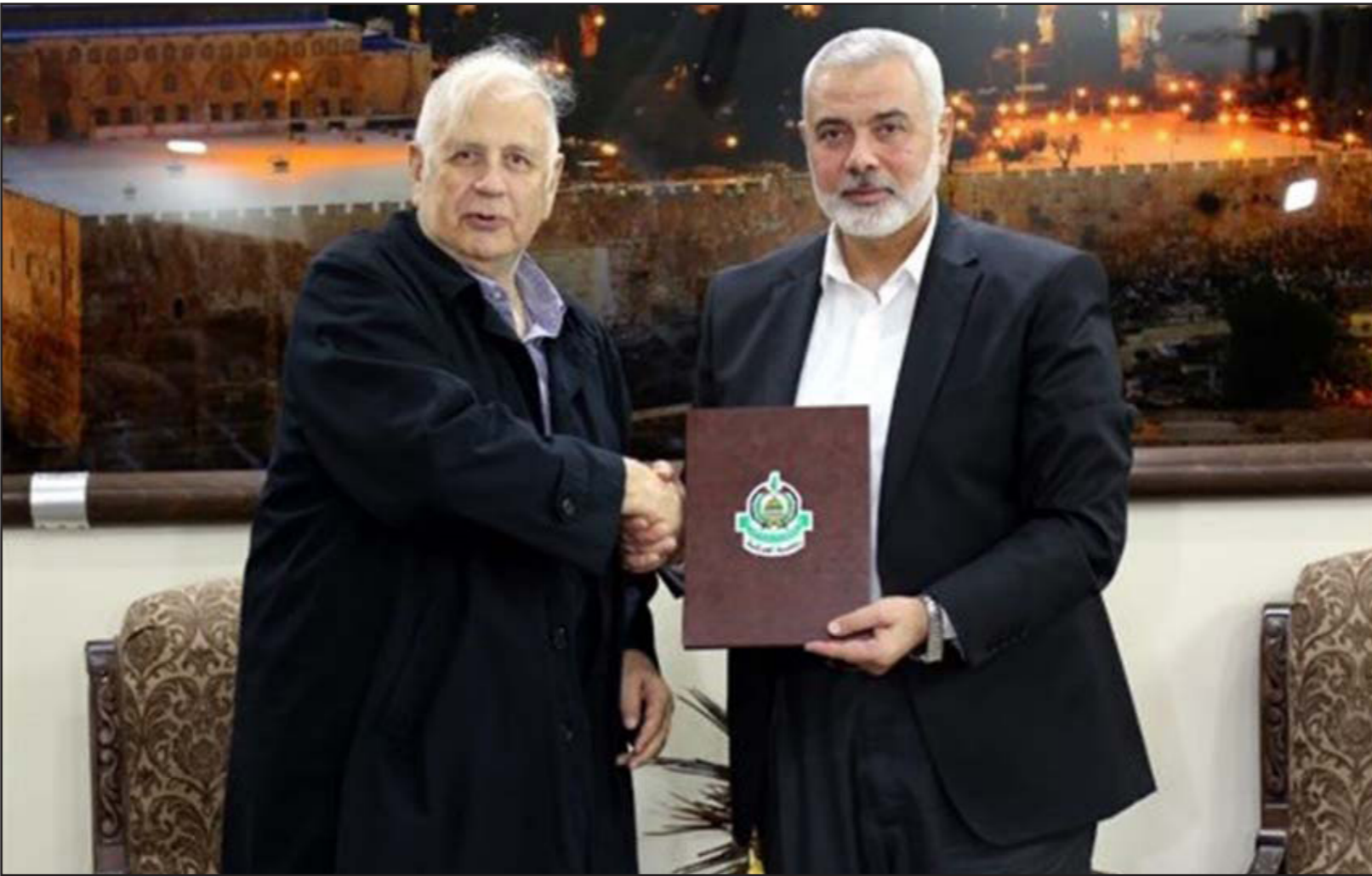
هنية يسلم ناصر رد حماس الإيجابي على رسالة عباس بشأن الانتخابات

وأضاف «معلت على تذييل كل العقبات في طريق إجراء الانتخابات وخلق الأجواء الإيجابية، منوها إلى أن حركته أعدت رداً