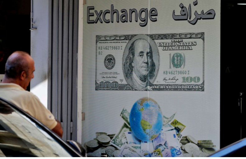
مواطن يقف منتظراً أمام مكتب صرافة في بيروت