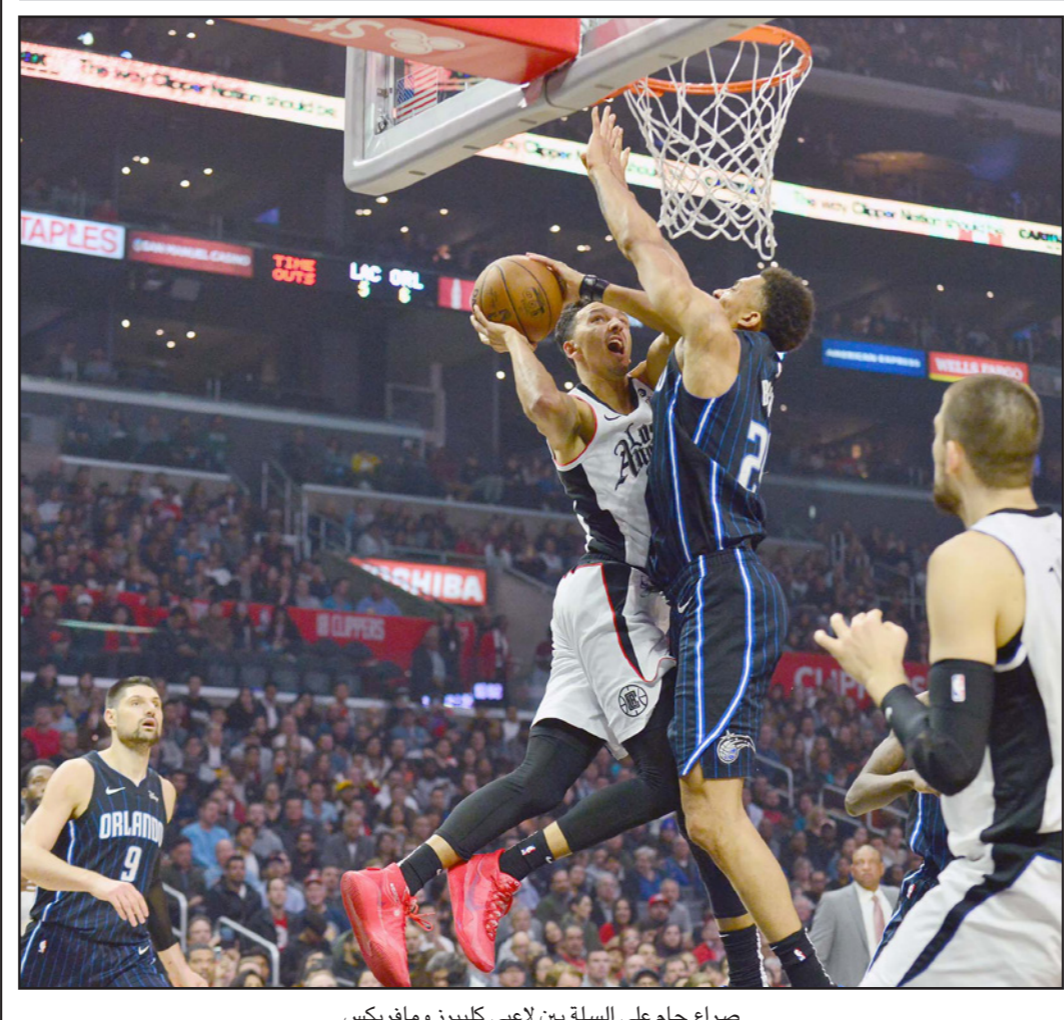
صراع حام على السلة بين لاعبي كليبز ومافريكس