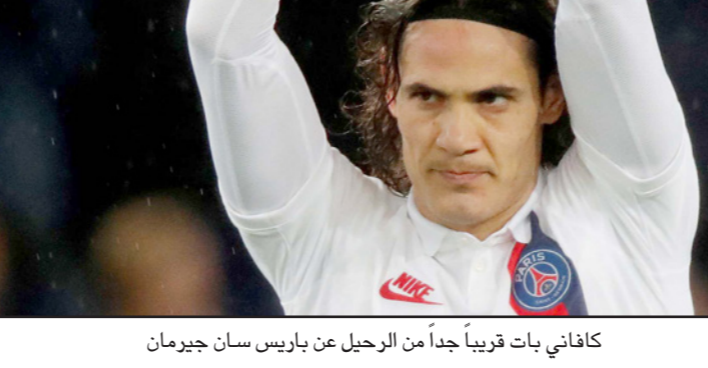
كافاني بات قريباً جداً من الرحيل عن باريس سان جيرمان

باريس - أ ف ب: بدأت انتقال المهاجم الأوروغواني إدينسون كافاني من باريس سان جيرمان وشيكا على ما يبدو، بعد استبعاده عن التشكيلة التي لعبت ليلة الأربعاء ضد رينس في نصف نهائي كأس الرابطة.