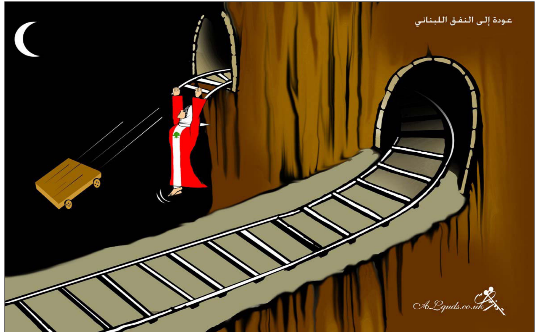
عودة إلى النفق اللبناني