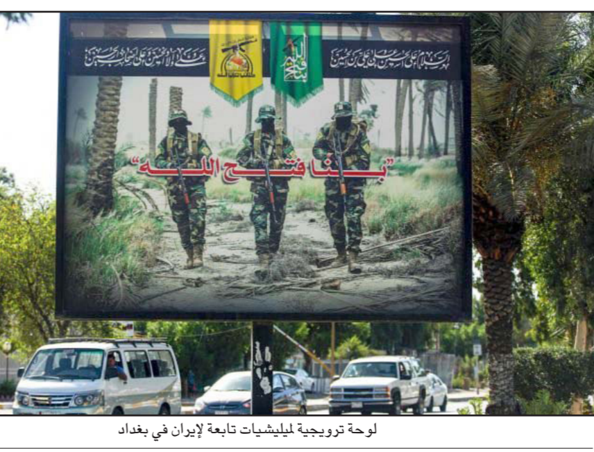
لوحة ترويجية للمليشيات تابعة لإيران في بغداد

الذين يفرحون دائماً برؤية العرب يذبح بعضهم بعضاً، يمكنهم القيام بأن سيطرة «الدولة الإسلامية» على فضاء الشرق الأوسط كانت ستستل على المنطقة كارثة إنسانية ثقيلة جداً، التي كانت ستؤثر على المدى البعيد بشكل سيئ أيضاً على مستقبل إسرائيل. وقبل التهديد الإسرائيلي الرسمي وضعب «داعش» في الميدان الماضي في قلب بلاد الهلال الخصيف، ساهمت إيران بشكل لا باس به في وقف تدهور المنطقة كلها إلى هاوية حقيقية من الإبادة الجماعية الشديدة، وربما حتى بمسوى يغتر من الفظائع التي حلت بأوروبا المنتورة والمنحصرة في منتصف القرن السابق، التي كانت ستسود في المنطقة عند إقامة خلافة «داعش» في العراق وسوريا. والاعتراف بإيذه الحقيقة لا يوجد فيه ما يقلل من إبعاد تهديد إيران لإسرائيل، مثلما لا يوجد فيه ما يطمس التأثيرات السلبية والضارة لتدخل إيران العسكري في الشرق الأوسط، أو الطابع المنحعب والديكتاتوري لنظام آيات الله، ولكن من أجل التعامل مع التهديد الإيراني بصورة منطوية، ومزينة ومروسة، فمن الأفضل لإسرائيل أن ترقى واقع وسياق النشاط الإيراني في المنطقة بكامل تركيبته.