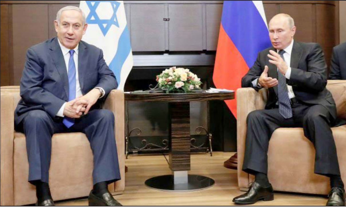
لقاء سابق للرئيس الروسي فلاديمير بوتين ورئيس وزراء الكيان الصهيوني بنيامين نتنياهو

بعودة نعمة، بشكل عام، يبدو وكان عودتها القريبة تخطي - حسب التغطية الإعلامية - على أهمية الاحتفال السنوي لإحياء الذكرى الـ 75 على تحرير معسكر الإبادة أوشفيفس - برنكاو، بمشاركة أكثر من 40 رئيس دولة، الذين جاؤوا لإحياء الذكرى من رئيس الدولة رؤوبين ريفلين الذي بلور هذا الاحتفال وقاده. متعلقو رئيس الحكومة يتشغلون في أن يوضحوا لنا إلى أي درجة يدل مجيء الزعماء على مكانته العالية بين الأمم. ورفع ذكرى الكارثة، كما يبدو، هو زينة مساعدة لإنجاز