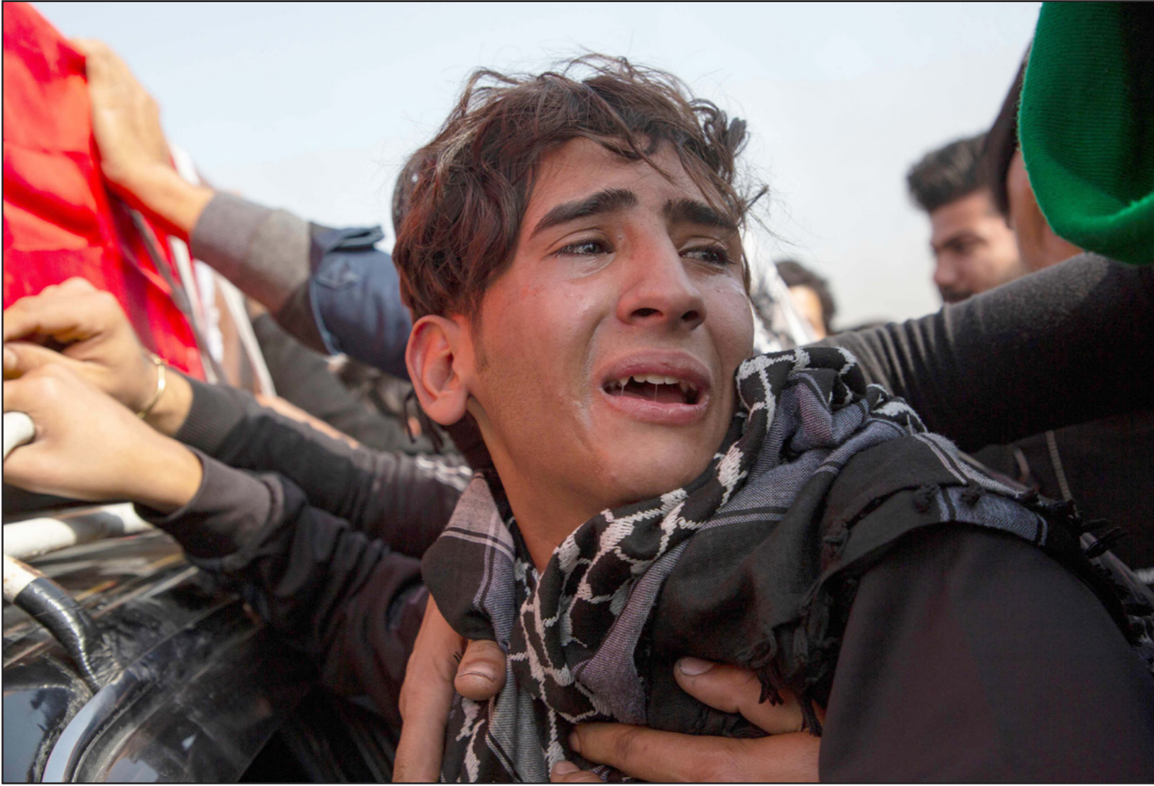
من تشييع إحدى المظاهرات التي قتل برصاص الأمن العراقي