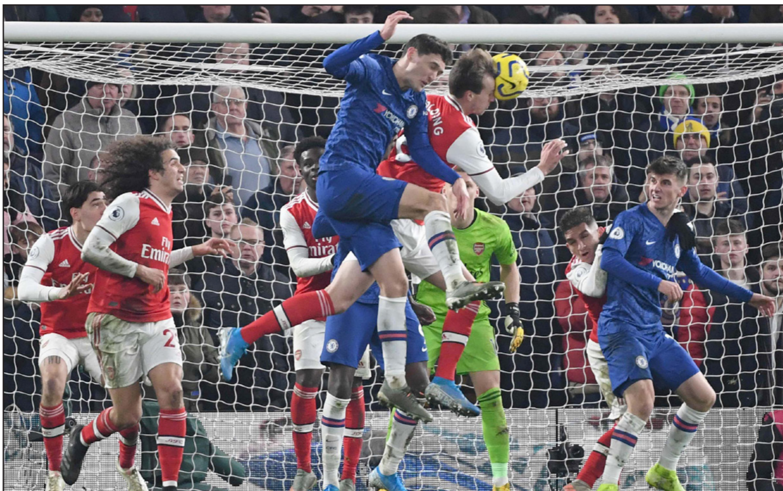
مدافع أرسنال هولنديغ يصل إلى الكرة أولاً في صراع هووائي مع لاعب تشلسي كريستينسن

لندن - رويترز: تعادل تشلسي 2-2 مع عشرة لاعبين من أرسنال، الذي سجل الهدفين رغم طرد ديفيد لوز في الشوط الأول، في دربي تشلسي في المرحلة الرابعة والعشرين من الدوري الإنجليزي، والتي شهدت فوز مانشستر سيتي على مضيغه شيفيلد يونائيتد 0/1، وبورنموث على ضيفه برايتون 1/3، وساوثهامبتون على مضيغه كريستال بالاس 2/صفر واستون فيلا على ضيفه وانفورد 1/1، وتعادل إيفرتون مع نيوكاسل 2/2. وبدا تشلسي المباراة بقوة وتقدم بهدف من ركلة جزاء نفذها جورج جينيو بعدما استغل تامي أبراهام تمريرة خاطئة من شكودران موسستافي قبل أن يتعرض لخطأ من البرازيلي لوزي مدافع تشلسي السابق، وتلقى لوزي بطاقة حمراء مباشرة من الحكم ستيفن أوتويل قبل أن ينفذ جورج جينيو الركلة بنجاح. وكان الطرد الوحيد الآخر للمدافع البرازيلي في الدوري عندما كان يلعب مع تشلسي ضد أرسنال في «ستامفورد بريدج» عام 2017.