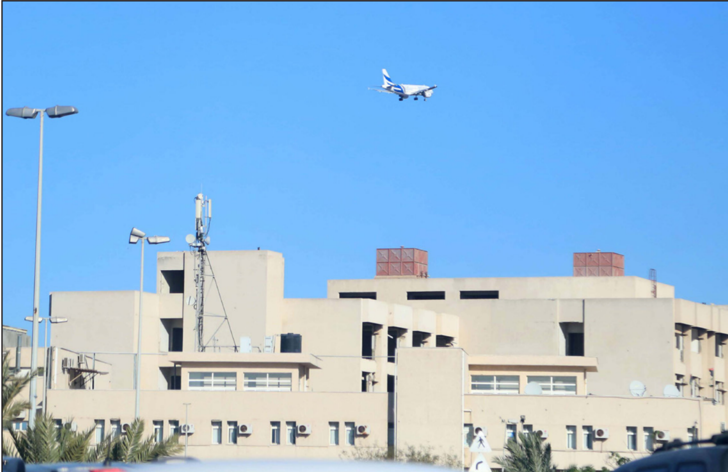
هبوط طائرة في مطار معيتيقة في طرابلس بعد ساعات من تعرضه لقصف

للكونغو لسدى الاتحاد الإفريقي، لازار سافاوس، في إطار التنظيم لاتخاذ اللجنة العليا للاتحاد الإفريقي حول ليبيا يوم 30 يونيو/ حزيران بالكونغو في برازافيل. وقال إسماعيل شرقي، في تغريدة نشرها على حسابه الرسمي بوقع «تويتر»، إن الاجتماع سيبحث الأوضاع المتزامنة في ليبيا وسبل إنهاء الاقتتال والتدخلات الأجنبية. وكان وزير الشؤون الخارجية والتعاون الكونغولي، جان كلود جاكوسو، قد زار الجزائر السبت الماضي، بصفته معوًا لرئيس جمهورية الكونغو، دينيس ساسو نغييسو، وحظى باستقبال الرئيس عبد المجيد تبون، وتتمحور الزيارة أساساً حول الوضع في ليبيا والتطورات الأخيرة الحاصلة بالشقيقة.