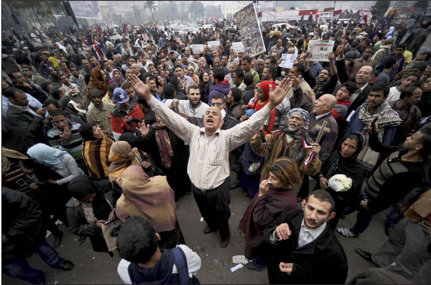
أرشيفية للمظاهرات التي خرجت في مصر ضد الرئيس المعزول حسني مبارك