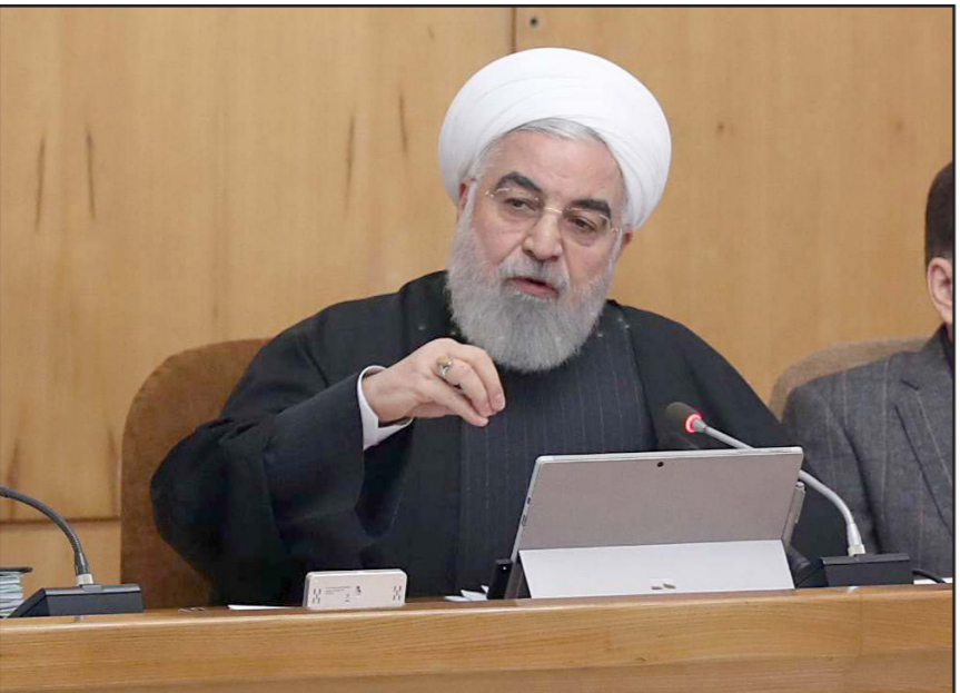
الرئيس الإيراني حسن روحاني

وقال الرئيس الإيراني، حسن روحاني، على موقعه الإلكتروني، أمس الأربعاء، إن الولايات المتحدة ارتكبت خطأ بانسحابها من الاتفاق النووي. وقال: «هل تريدون ارتكاب الخطأ نفسه (...). أنا أؤكد أنه إذا ارتكب الأوروبيون خطأ وانتهكوا الاتفاق، فسيكونون مسؤولين عن عواقب أفعالهم». ويقول الرئيس الأمريكي، دونالد ترامب، إن سياسة «الضغط القصوى» التي أمر بها تهدف إلى دفع إيران نحو اتفاق موسع يقصص نشاطها النووي وينهي برنامجها الصاروخي ويوقف الحرب بالوكالة في الشرق الأوسط. وأيدت الدول الأوروبية الثلاث استعدادا كبيرا للعمل باتجاه ما سماه رئيس الوزراء البريطاني، بوريjs جوسون، «اتفاق ترامب». وقالت فرنسا إن الوقت ربما يكون قد حان لاتفاق موسع. وفي هذا الإطار، قال الرئيس الفرنسي، إيمانويل ماكرون، في زيارة لإسرائيل: «في السياق الراهن وفق ما أوردت وكالة أنباء أوديتا، وكذلك عندما باعت الدول الأوروبية الثلاث خطة العمل المشتركة لتجنب تعريفات ترامب الأسبوع الماضي، حذرت من أن ذلك لن يكون من شأنه سوى أن يفتح شهيته... سيكون من الأفضل أن يمارس الاتحاد الأوروبي سيادته... سيكون دبلوماسيون أوروبيون إنهم كانوا سيقومون بتفعيل الآلية بصرف النظر عن تهديدات ترامب».