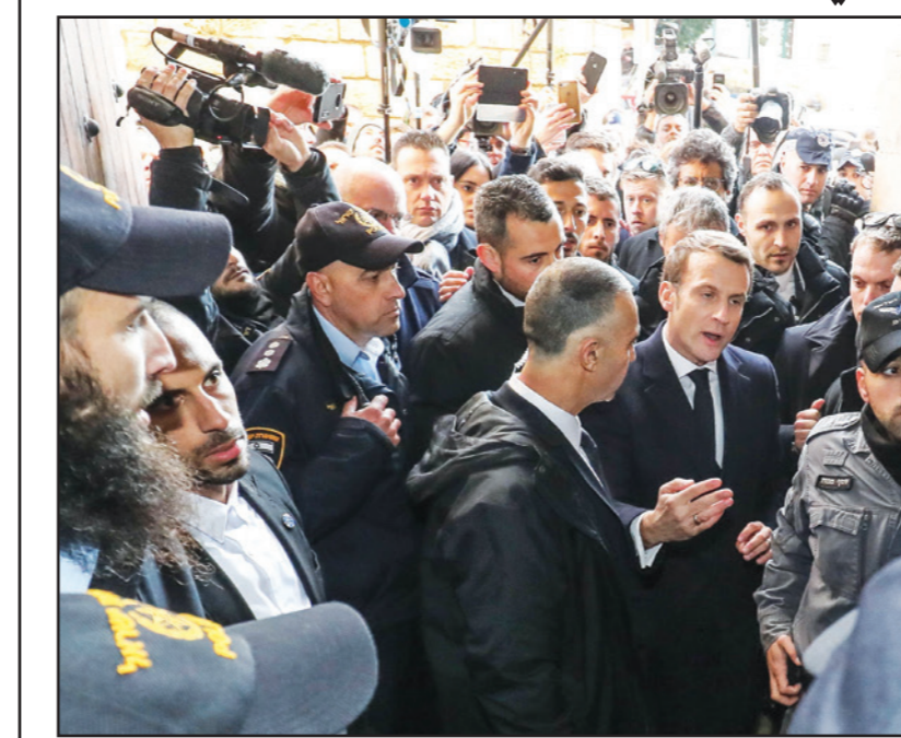
الرئيس الفرنسي إيمانويل ماكرون لحظة المشادة مع عناصر الشرطة الإسرائيلية في كنيسة سانت آن في القدس أمس

البيت الأبيض يعارض أي خطوة إسرائيلية أحادية الجانب لضم أجزاء من الضفة الغربية، قبل نشر خطته المرتقبة لتسوية الصراع، والمعروفة باسم «صفقة القرن». ونقلت اللحظة الإخبارية الإسرائيلية (13) عن مسؤول أمريكي لم تحدد اسمه، قوله إن «البيت الأبيض يعارض أي ضم إسرائيلي في الضفة الغربية، قبل نشر خطة السلام الأمريكية ستؤيد خطوات ضم إسرائيلية بعد