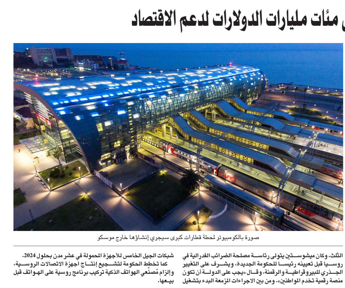
صورة بالكاميرا الحرارية تظهر كبرى سيجري إنشائها خارج موسكو

موسكو - أف ب: يعد الرئيس الروسي فلاديمير بوتين باستثمار عشرات تريليونات الروبل في البنية التحتية المتداعية في بلاده، وغير ذلك من الخطوات الأخرى، على مدار السنوات الخمس المقبلة في محاولة لتحفيز النمو الاقتصادي الهزيل.