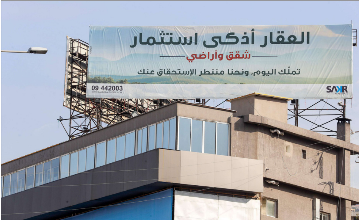
إعلان يشجع اللبنانيين على الاستثمار في العقارات ضمانا لودائعهم العالقة