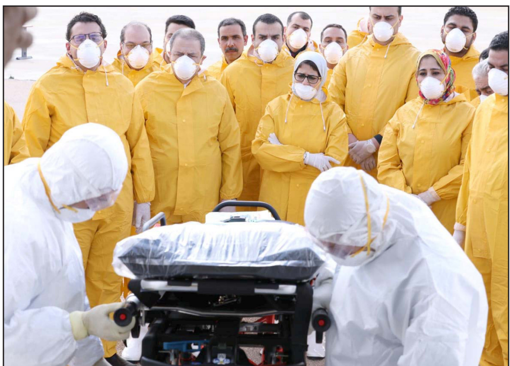
وزيرة الصحة المصرية تتوسط فريقاً طبياً في مطار العين

وأشار إلى أن جار الآن عمل معاينة لمكان الانفجار، وسيتم اتخاذ الإجراءات اللازمة للإصلاح في أسرع وقت ممكن. ويشار إلى أن عمليات تفجير خط الغاز في سيناء عادت مرة أخرى بعد توقف أكثر من خمس سنوات، حيث تعرض الخط للتفجير لأكثر من 27 مرة، مما أدى إلى توقف مصر عن تصدير الغاز الطبيعي لإسرائيل.