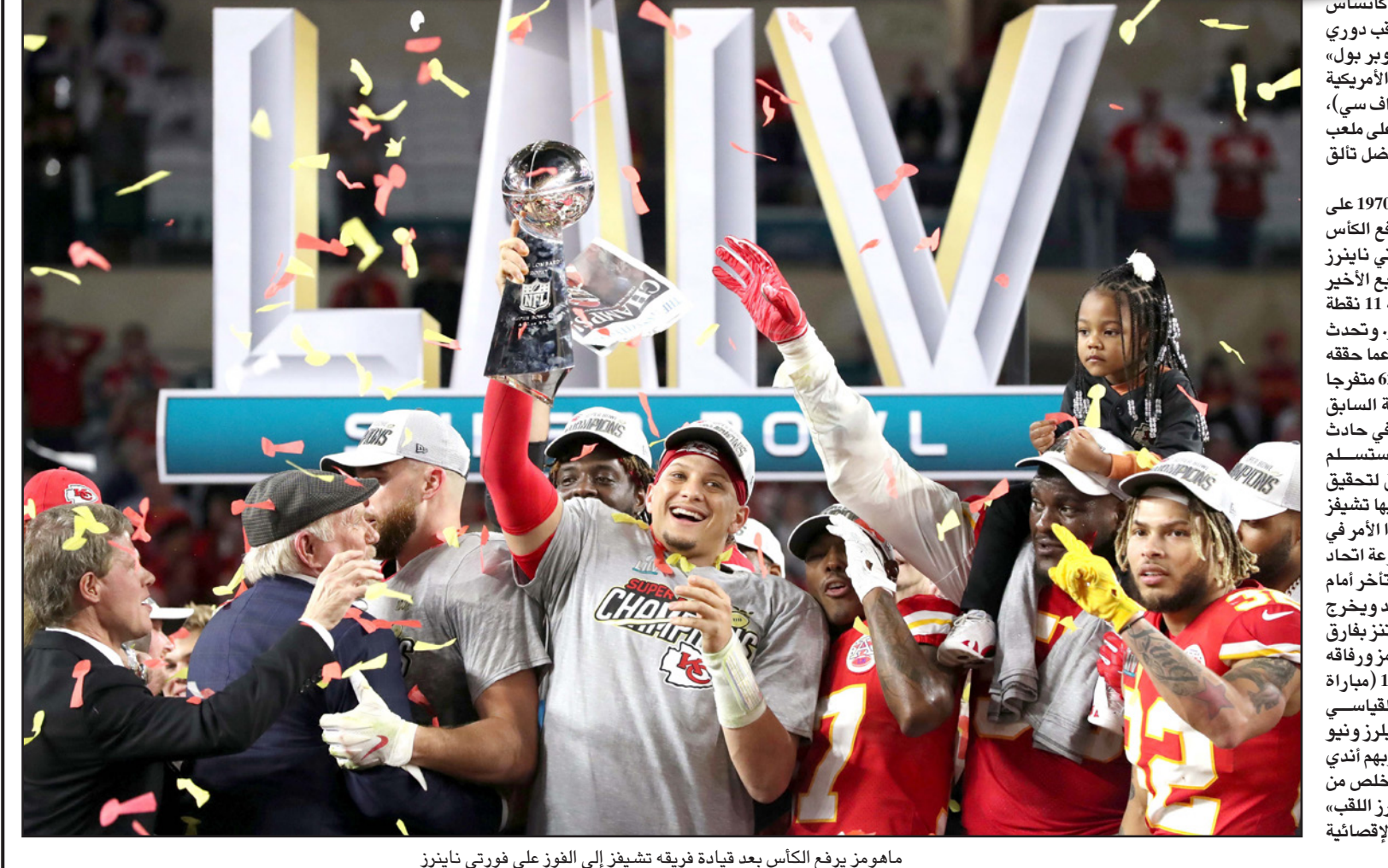
ماهومز يرفع الكأس بعد قيادة فريقه تشيفز إلى الفوز على فورتا ناينرز