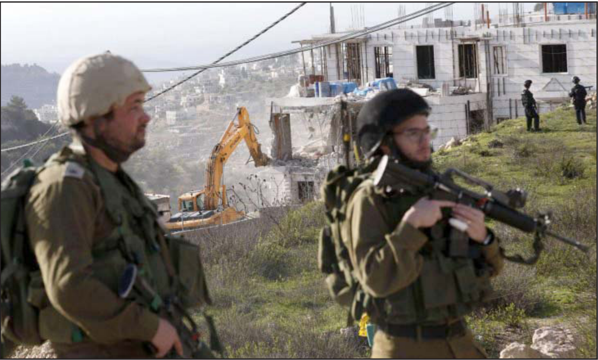
أرشيفية لقوات الاحتلال الإسرائيلي تهدم منزل فلسطينيين في منطقة (ج)

في شرقي القدس، ولكن خطة ترامب تقتضي وأقعا مختلفا، فهي تلزم بإعطاء المواطنة الكاملة للـ 450 ألف شخص من مواطني الضفة وشرقي القدس الذين سيستقر ضمهم، ويمكن الافتراض بأنه سيكون أكثر صعوبة التكيف بهم، لذلك غلب حصولهم على المواطنة، ستكون الدولة مندمجة بالاستثمار لتعسين وضع العرب في شرقي القدس والضفة، والمبلغ المطلوب لذلك قد يكون كبيرا جدا.