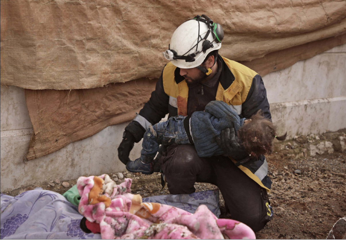
عنصر من الدفاع المدني يحمل جثة طفل قتل في قصف النظام لريف حلب

فوق منطقة ادلب لخفض التصعيد تراقبها القوات الجوية الغضائية الروسية باستمرار، وأن الطائرات الحربية التركية لم تخرق الحدود السورية، كما لم يتم تسجيل ضربات ضد مواقع القوات التابعة للنظام السوري. أما إيران، وهي ثالث الأطراف الضامنة في سوريا، فقد قال المتحدث باسم خارجيتها عباس موسوي: «من حق الجيش السوري شن عمليات على أي أرض سورية تعرضت للاحتلال أو الإرهاب أو ضد ما يعرض أمن سوريا ووحدتها للتهديد»، مشدداً على أن على جميع الدول «احترام وحدة الأراضي السورية وأمنها القومي»، وأشار المسؤول الإيراني، إلى أن مسار «استانة» هو المسار الوحيد القادر على حل الأزمة السورية وينبغي الحفاظ عليه.