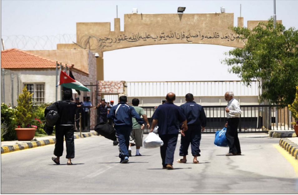
إطلاق سراح سجناء من أحد السجون الأردنية