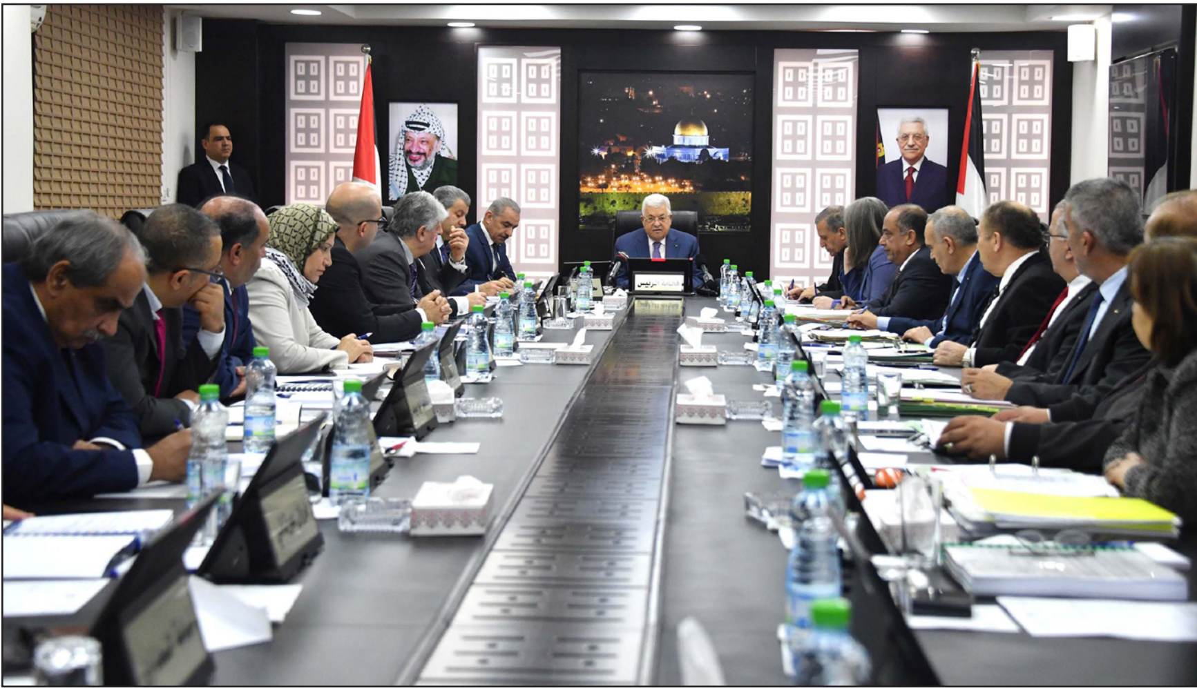
الرئيس الفلسطيني محمود عباس يترأس اجتماعاً لمجلس الوزراء