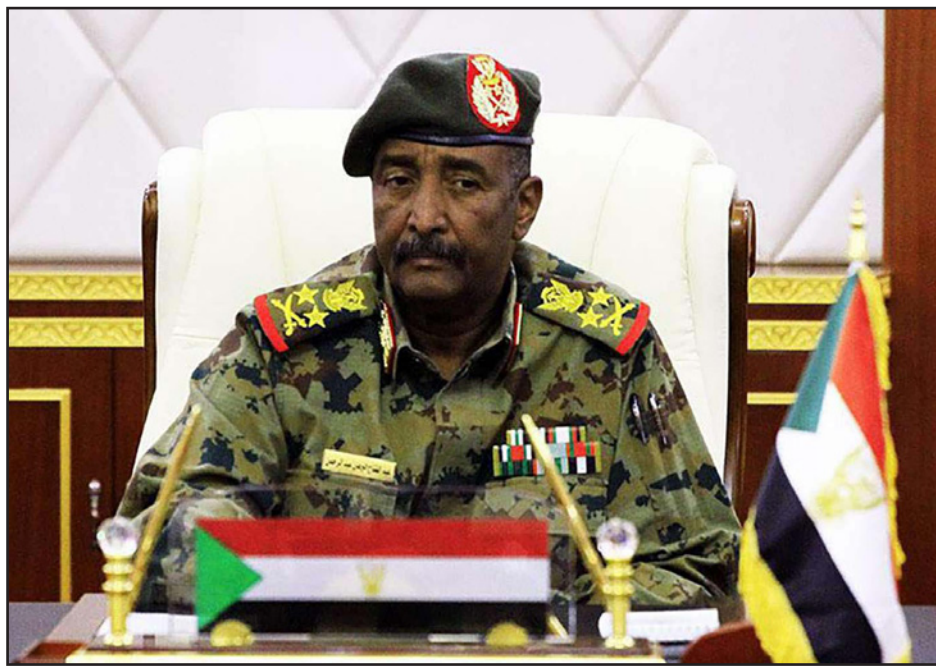
عبد الفتاح البرهان

وسبق أن وجه وزير الشؤون الدينية السودانية نصر الدين مفرح، دعوة لليهود للعودة إلى السودان. وقال إن «السودان هو بلد تعددي من حيث الأفكار والقيم والثقافة والأديولوجيات ومدارس الفكر الإسلامي وحتى في دياناته. هناك الإسلام والمسيحية وهناك أقلية من اليهود». وأضاف «قد يكونون غادروا البلاد، ولكننا ندعوهم من هنا إلى أخذ حقهم في أن يصبحوا مواطنين ونحضرهم على العودة إلى هذا البلد».