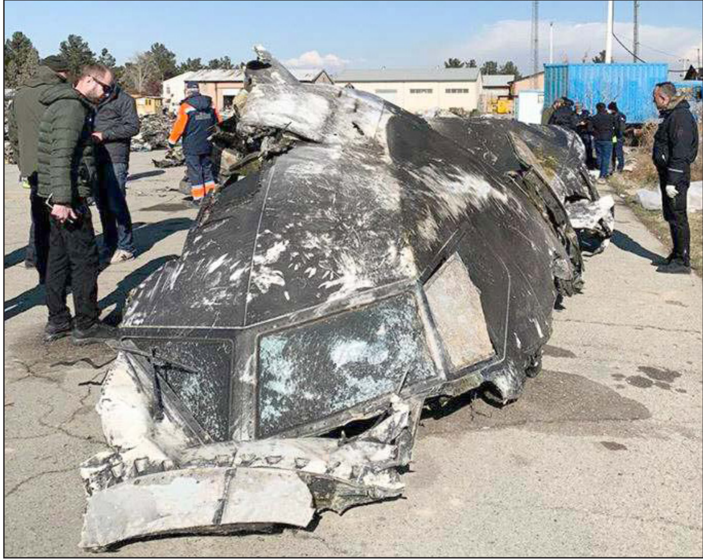
أرشيفية لحطام الطائرة الأوكرانية المنكوبة

■ دبي - رويترز: قال الرئيس الأوكراني، فولوديمير زيلينسكي، إن تسجيلاً صوتياً مسرباً لطييار إيراني يخاطب برج المراقبة في طهران يظهر أنه علمت إيران على الفور أنها أسقطت طائرة ركاب أوكرانية الشهر الماضي على الرغم من نفيها ذلك على مدى أيام. ويبتدئ قضاة تلفزيونية أوكرانية، مساء الأحد، التسجيل الذي سمع فيه طيار طائرة أخرى يقول إنه رأى ضوء صاروخ في السماء قبل تحطم طائرة الخطوط الجوية الأوكرانية في رحلتها رقم 752 في انفجار. وألقت طهران اللوم على السلطات الأوكرانية في تسريب ما وصفته بأنه دليل سري، وقالت إنها لن تشارك مع كيبف بعد الآن مواد خاصة بالتحقيق في تحطم الطائرة.