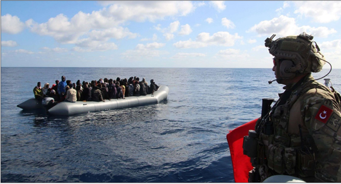
عنصر من البحرية التركية شارك في إنقاذ قارب لأخارقة مهاجرين مقابل السواحل الليبية

البارز في البنتاغون الجنرال ستيفن تاونسند أمام الكونغرس حيث شجب تركيا وروسيا وتجنب ذكر الإمارات.