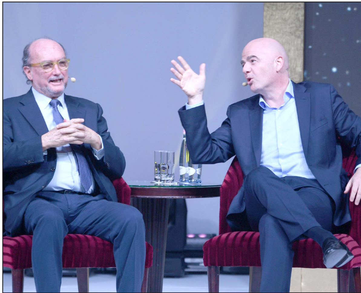
انفانتينو (يمين) يتحدث إلى رئيس رابطة الصحفيين الرياضيين ميرو

بوايست - د ب أ: يرى السويسري جاني إنفانتينو رئيس الاتحاد الدولي لكرة القدم (فيفا) أن قطر ستكون على أهبة الاستعداد لاستضافة كأس العالم قبل عامين من الحدث الأبرز على مستوى اللعبة.