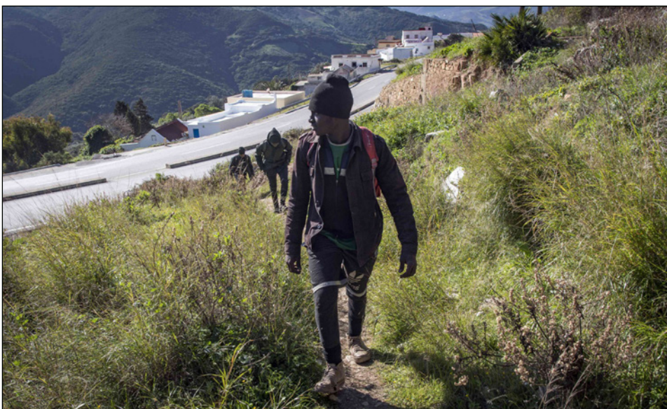
المهاجرون الأفارقة يسيرون بالقرب من مخبئهم في غابة بيلونيتش