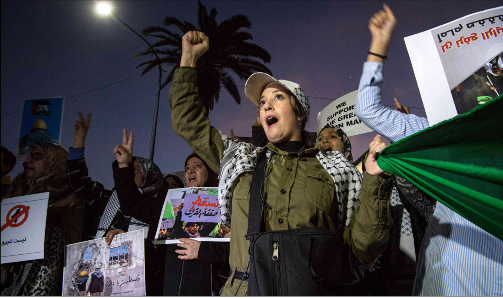
وقفة احتجاجية ضد صفقة القرن في الدار البيضاء