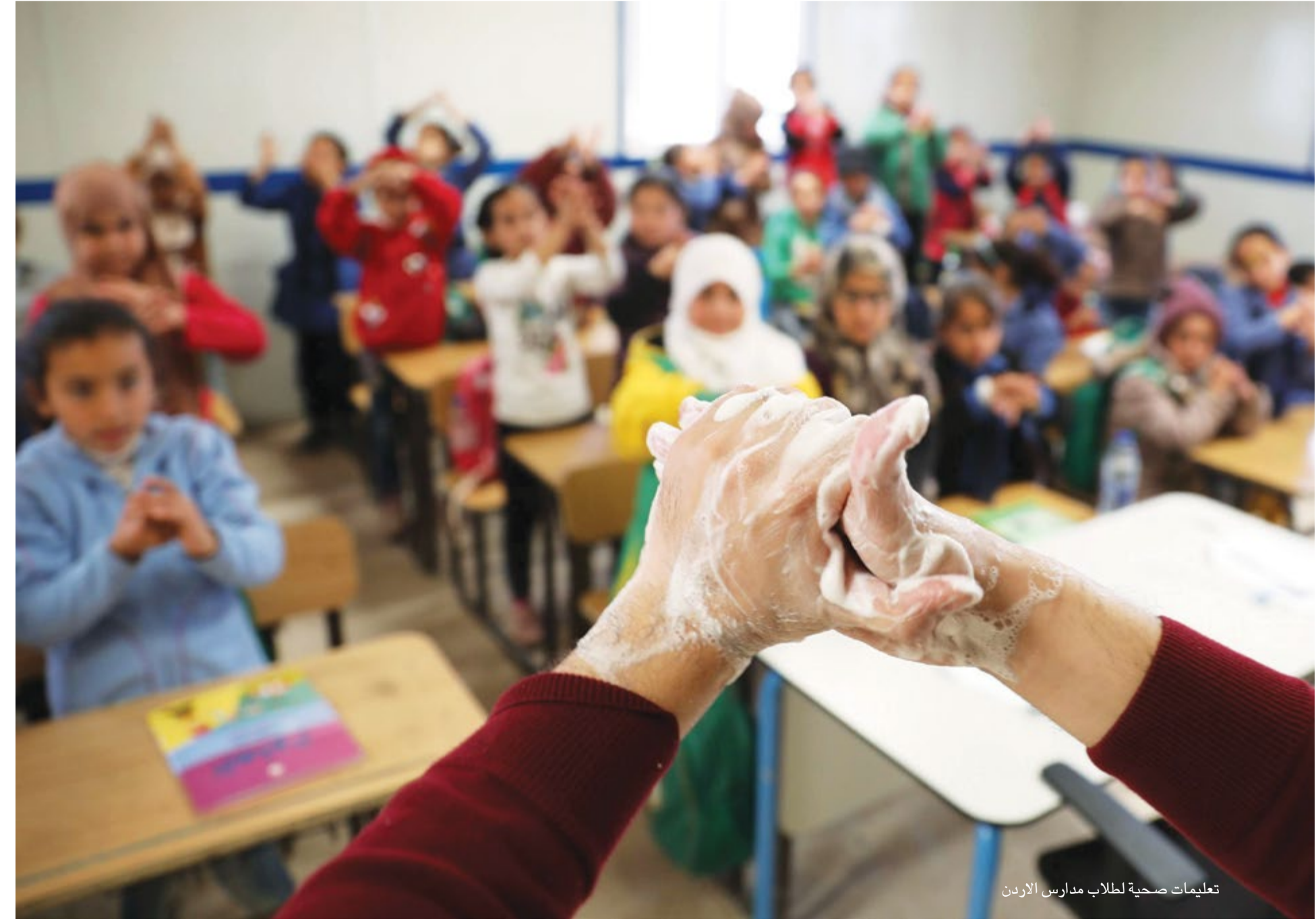
تعليمات صحية لطلاب مدارس الأردن

الكويت بدأت تعيد فعلا الأردنيين العاملين والمقيمين لديها إلى بلدهم بعدما قررت عدم استقبال الأجانب. والسعودية لا تسمح بمرور الشاحنات الأردنية،