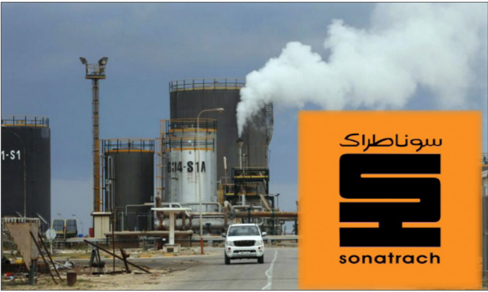
مصفاة نفطية تابعة لـ «سوناتراك»

بقرض قيمته 100 مليون دولار يوجه لاقتناء الأجهزة الطبية ضمن خطة احتواء تفشي وباء «كورونا»، وأن «البنك الأوروبي للإنشاء والتعمير» وعد 32 مليار دولار، للغرض نفسه. وأضاف أن الرئيس تبون أمر بتسخير مبلغ 100 مليون دولار للمجمل باستيراد كل المواد الصيدلانية والألبسة الواقية (القفازات) لسداد ثمن واردات الغذاء و«مسلع أخرى». تقدر بنحو 45 مليار دولار سنويا، بالرغم من قيود مفروضة على الاستيراد. وتوقعت الحكومة إنفاق 41 مليار دولار على مشتريات من الخارج في 2020، لكن تبون أصدر توجيهاته للحكومة بخفض فاتورة الاستيراد إلى 31 مليار دولار، وتعيد تبون، الذي انتخب في ديسمبر/كانون الأول، بتنفيذ إصلاحات سياسية واقتصادية لتلبية مطالب المتظاهرين الذين خرجوا في احتجاجات حاشدة منذ أوائل العام الماضي أدت إلى استقالة الرئيس عبد العزيز بوتفليقة الذي حكم البلاد لمدة طويلة. ووافقت الحكومة بالفعل على خفض الإنفاق بنسبة 9.2 في المئة في 2020، لكنها أبقت على إعانات مهمة للمواد الغذائية الأساسية والوقود والإنسان والأدوية دون تغيير لتجنب اندلاع اضطرابات في المجتمع. وجاء في البيان إن قطاعات مثل التعليم والصحة لن تتأثر بالخفضات الجديدة في الإنفاق العام. وجاء أيضا أن «صندوق النقد الدولي» وعد سلطات البلاد