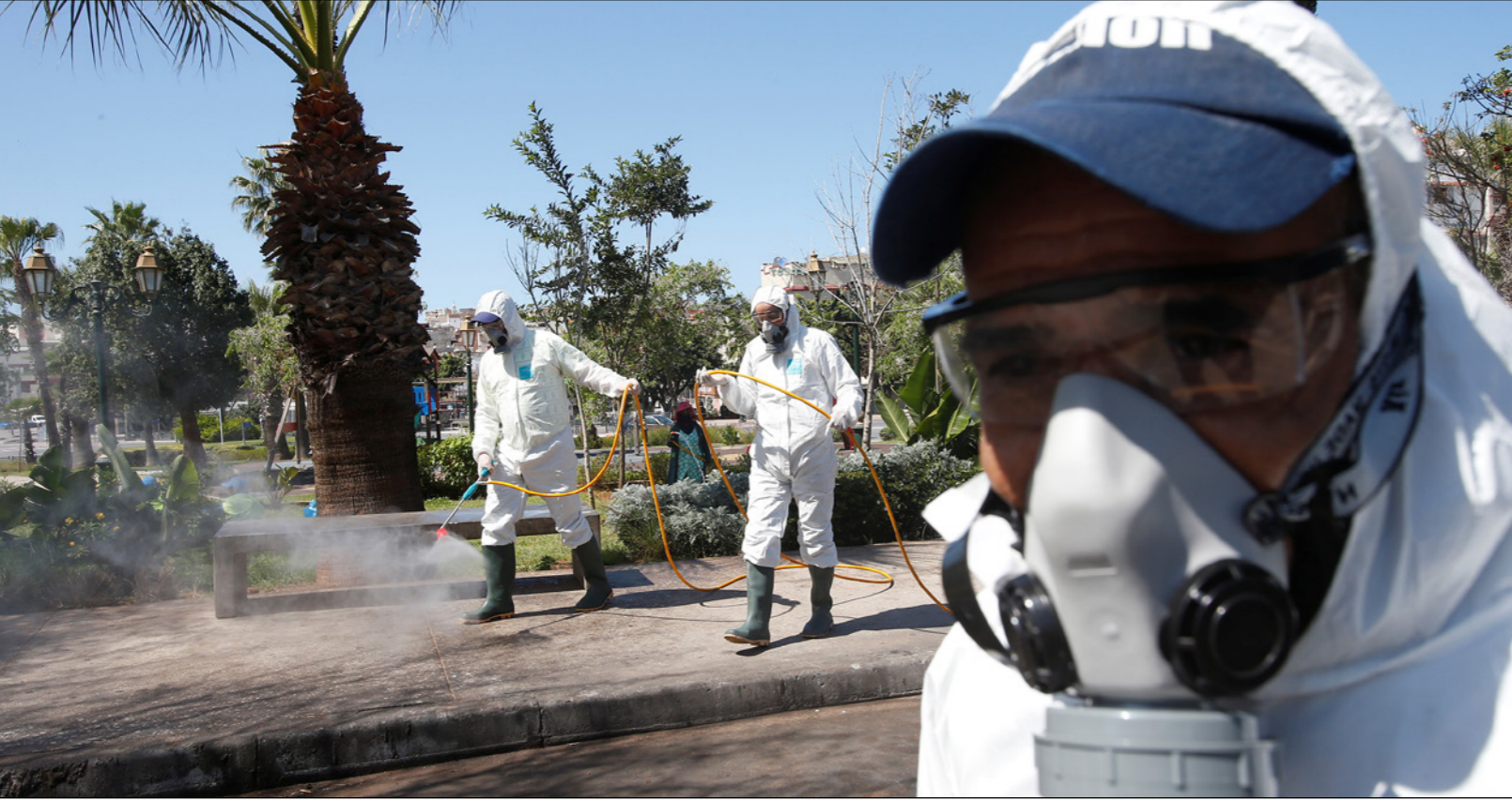
تعميم شوارع الرباط

مفتوحة فقط أمام خروج السياح الأجانب في البلاد، كما تم إغلاق الطرق المؤدية إلى المغرب، أمام المغاربة الموجودين خارج البلاد. وفي يوم الأحد 15 آذار/ مارس، أوقف المغرب بالفعل جميع الرحلات الدولية و ترك فقط تلك الرحلات الضرورية للغاية لإعادة السياح إلى بلدانهم الأصلية مفتوحة. وعلى الرغم من أن الإنتاج لم يتوقف في البلاد، وما زال يسمح بمزاولة الوظائف الضرورية، إلا أن الإجراءات تركت الشوارع بكل البلاد شبه فارغة. وبدأت المركبات العسكرية تجوب المدن الكبرى، كما يطلب من المواطنين البقاء في المنزل من خلال مكبرات الصوت. وقد طلبت الحكومة اليوم الأحد من الصحف والمجلات الورقية تعليق إصداراتها الورقية.