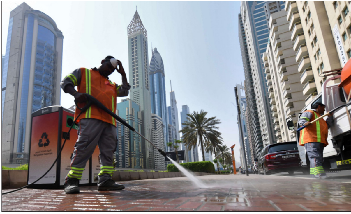
أبينة وشوارع خالية وعمال يعقمون الطرقات في دبي

وكانت دبي، التي يزورها أكثر من 16 مليون شخص سنويًا وتعتمد على السياحة بشكل كبير، قد قرّرت في وقت سابق وقف السماح بدخول حاملي التأشيرات، وتعليق منح تأشيرات لدى وصول المسافرين. وأمس الإثنين قالت وزارة الصحة والهيئة الوطنية للطوارئ والأزمات في بيان مشترك أنه تقرّر «إغلاق كافة المراكز التجارية ومراكز التسوق والأسواق المفتوحة التي تشمل بيع الأسماك والخضار واللحوم»، ويسرى القرار لمدة أسبوعين «قابلة للمراجعة والتقييم على أن يكون ساريًا بعد 48 ساعة». وبدت مراكز تجارية في دبي ظهر أمس خالية من الزبائن وأمسية المهوودة. كما تقرّر إلزام المطاعم عدم استقبال الزبائن والاكفاء فقط بخدمة تسليم الطلبات والتوصيل المنزلي. وجاء ذلك بعدما قررت حكومة دولة