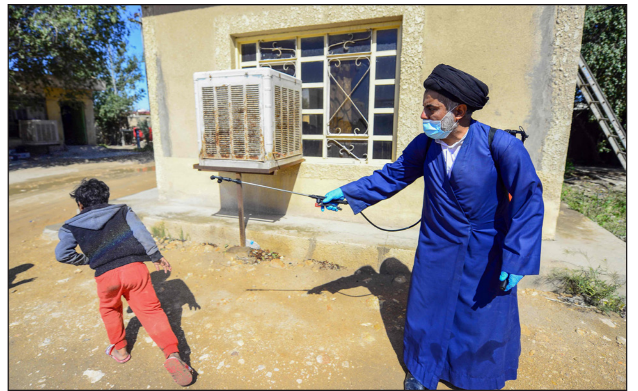
شيخ شيعي يرش ابنه بالمطهر في مدينة النجف

ودعت المفوضية في بيانها إلى «تشكيل لجان لمراقبة حالات الاحتفاظ في السجون ومواقف الاحتجاز ومراكز الإصلاح وإمكانية إخلاء سبيل الموقوفين على ذمة التحقيق بكفالات ضامنة حسب المواد القانونية، وتعليق الزيارات العائلية والإزام العاملين في السجون والنسبيين ومتعديي الأطعمة باتخاذ أعلى درجات التحوط الصحي والاهتمام بنظافة الأطعمة وأدوات الطبخ وإجراء الفحوصات الطبية الدورية للنزلاء من قبل الفريق الصحي المختص». وأشدت أيضاً بـ«جهود القوات الأمنية لتحملها العبء الأكبر منذ تشخيص الوباء ولغايات اليوم (أمس)، وتطالب في الوقت نفسه بعدم زجهم