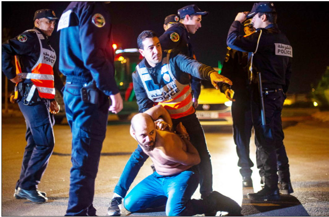
الشرطة المغربية تعتقل رجلا يرفض اتباع الحجر المعمول بها كجزء من حالة الطوارئ لمكافحة انتشار الفيروس

وأوقفت الشرطة القضائية في مدينة تطوان، مساء الأحد، شخصين (22 و21 سنة)، للاشتباه في تورطهما في عرقلة تنفيذ تدابير وقائية صحية والتحريض على التجمهر والعصيان. وعدم الامتثال للتدابير الوقائية المعتمدة في إطار حالة الطوارئ الصحية للحد من انتشار فيروس كورونا المستجد، وهي حملات التحريض التي أخرجت عددا من الأشخاص للشارع العام في مدينة تطوان في ظروف من شأنها تعريض حياة وسلامة المواطنين للخطر. وأن الأبحاث والتحريات متواصلة لتوقيف كل من ثبت تورطه في التحريض أو المساهمة أو المشاركة في ارتكاب هذه الأفعال التي تمس بالأمن الصحي لعموم المواطنين. وتمكنت الشرطة القضائية في مدينة فاس من توقيف أربعة أشخاص يشتبه في تورطهم في أحداث ليلة السبت الماضي وباشرت بإجراء تشخيص هويات جميع الأشخاص الذين قاموا بالتحريض على التجمهر مساء السبت في فاس وتعدوا والصين وعدم الامتثال للاحترازية للوقاية من وباء «كورونا» المستجد، وأوقف أمن مدينة طنجة شخصين (24 و42 سنة)، أحدهما من ذوي السوابق القضائية، وذلك للاشتباه في تورطهما في التحريض على التجمهر والعصيان وتعريض حياة الأشخاص للخطر، وخرق إجراءات الطوارئ الصحية بالمدنية.