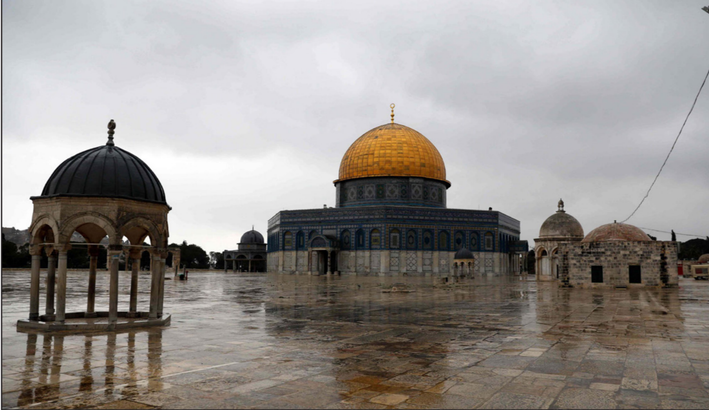
باحة الأقصى خالية من المصلين

(ابو مازن) ورئيس مجلس الوزراء محمد إشتية باتخاذ جميع الإجراءات الوقائية وتجاوب المؤسسات والقوى الوطنية مما ساهم بالحد من انتشار الفيروس. وأكدت على ضرورة الالتزام بكافة التعليمات والتوجيهات والقرارات الصادرة عن الجهات المسؤولة والتي تدعو أهالي مدينة القدس ومحافظة القدس للالتزام بجميع الإجراءات والالتزام في المنازل والحجر المنزلي الذاتي وعدم الخروج إلا للضرورة القصوى حفاظا على حياتكم وللحد من انتشار الفيروس، معتبرين من المخاطر التي جابهت الدول الأوروبية الصديقة.