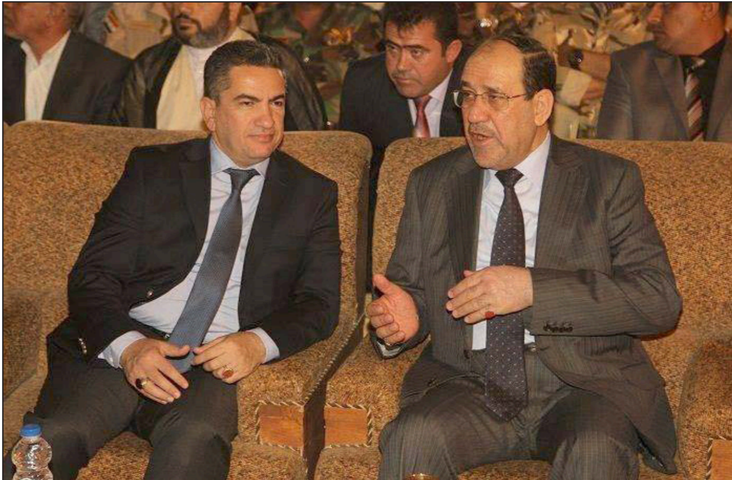
أرشيفية لرئيس ائتلاف دولة القانون نوري المالكي مع رئيس الحكومة المكلف عدنان الزرفي

وحسب «تغريدة» للسياسي العراقي صادق الموسوي، فإن «نتائج اجتماع القوى الشيعية في منزل العامري (عشيرة أول أمس) أسفرت عن ترشيح الأسماء التالية بديلاً عن الزرفي: منير السعدي (رئيس جامعة كربلاء سابقاً)، أحمد الغيبان (رئيس الجامعة التكنولوجية حالياً)، محسن الظالم (رئيس جامعة الكوفة سابقاً)». على إثر ذلك، نشر الظالم، منشوراً على صفحته في «فيسبوك»، يقول: «فوجئت أليس أمس بخبر ترشيحي لتكليف بمنصب رئاسة مجلس الوزراء»، مؤكداً «رفضه