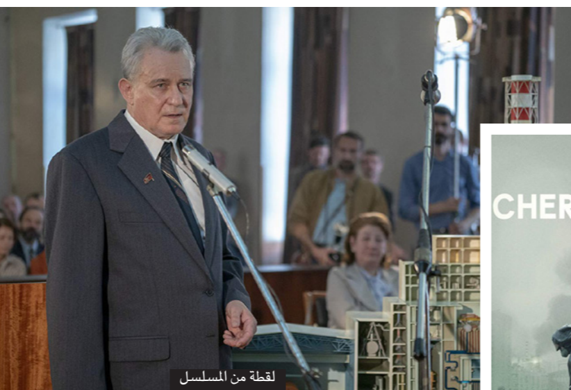
لغظة من المسلسل

وسوف يضم النادي الجديد في برلين ملعبا للمنافسات ومقهى للألعاب ومطعم للبرجر وحانة وقاعة عرض سينمائي وستوديو تليفزيوني، ويمكن للمبنى أن يستضيف 500 شخص في وقت واحد، ويتوقع المنظمون أن يصل عدد زائريه إلى حوالي 250 ألف زائر سنويا. وسوف يتم بث الألعاب مباشرة عبر قنوات يوتيوب.