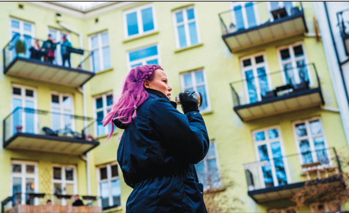
أمرأة تطلب من الجيران المغزولين في بيوتهم في العاصمة النرويجية أوسلو المساهمة في مسابقة تسليمهم خلال فترة الحجر

تصوّل جنرالات الجيش المصري الكبار إلى هدف لفيروس «كورونا» فجأة فتوفي إثنان من لواءات الإدارة الهندسية التابعة للجيش، والمسؤولة عن تنفيذ مشروعات مدينة بالفروس، وسط أنباء عن إصابة لواءين آخرين.