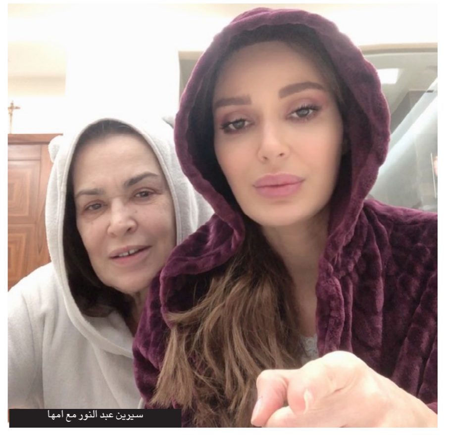
سيرين عبد النور مع أمها

لأنها تساعدها وتهتم بأولادها، وتحمل ما وصفته بجنونها الناتج عن ضغط العمل. ودعت الجميع إلى البقاء في المنزل، من أجل حماية أنفسهم وعائلاتهم من خطر الإصابة بالفيروس القاتل، وإعذرت من محبيها، بسبب ظهورها بهذا الشكل، وقالت: «ما توأخذوني على مناظرنا».