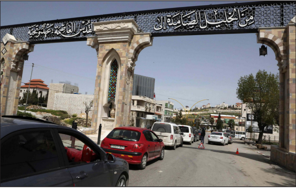
مدخل مدينة الخليل