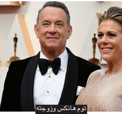
توم هانكس وزوجته

أما ريتا ويلسون وهي ممثلة ومغنية فقد أقامت حفلات في سيدني وبريزبين قبل أن تتبين إصابتها بالفيروس كورونا المستجد أمس الاثنين أنها «في وضع أفضل» بعد أسبوعين تقريبا من الحجر في أستراليا.