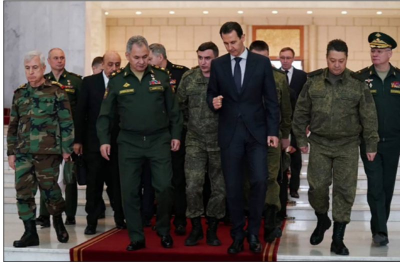
الأسد مستقبلاً وزير الدفاع الروسي في دمشق أمس

قام وزير الدفاع الروسي «سيرغي شويغو» بزيارة عسكرية وأمنية خاطفة إلى العاصمة السورية - دمشق، التقى فيها رئيس النظام السوري بشار الأسد، وتمحو اللقاء غير الملغ حول محافظة إدلب في الشمال السوري، والتي شهدت بدورها أمس، عودة الدوريات التركية - الروسية المشتركة تم اختصارها للمرة الثانية على الطريق الدولي - إم 4. شويغو الذي دخل الأجواء السورية محاطاً بأحد المقاتلات الحربية الروسية - سو 35، تركت مقابله للأسد حول قضايا عدة وعلى رأسها إدلب، في حين أن وزارة الدفاع الروسية ذكرت، أن الزيارة التي عقدت بتوجيه من الرئيس فلاديمير بوتين، شمل «مناقشة مسائل ضمان نظام وقف مستدام للأعمال القتالية في منطقة إدلب لخفض التصعيد، وإرساء الاستقرار في باقي أراضي سوريا، وكذلك جوانب مختلفة للتعاون العسكري التقني (بين البلدين) في إطار مكافحة التنظيمات الإرهابية الدولية بشكل مشترك».