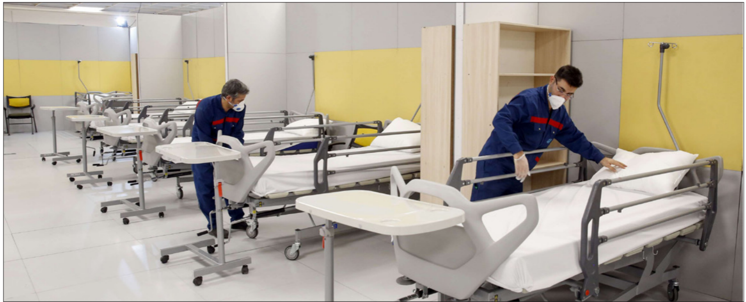
أقامت إيران مستشفى مؤقتاً داخل مجمع تسوق وسط طهران

نشر موقع «بلومبيرغ نيوز» تقريراً أعده كل من ديفيد وينر وغنار توتيفاني ونيك ووداهم، أشاروا فيه للضغوط التي تمارس على الإدارة الأمريكية لتخفيف العقوبات على إيران التي تواجه وباء كورونا المدمر. وقالوا إن دولاً أوروبية تدعو لتخفيف العقوبات، وإدارة دونالد ترامب لم تستجب حتى الآن. ووصل عدد الوفيات حسب الأرقام الرسمية الإيرانية إلى 1650 حالة، في وقت يقول فيه قادة الجمهورية الإسلامية ومنظمات إنسانية إن العقوبات القاسية المسماة «أقصى ضغط» التي فرضت منذ خروج ترامب من الاتفاقية النووية عام 2018 أدت لتدمير الاقتصاد وزادت من الكارثة الإنسانية. وتقول الولايات المتحدة إنها مستعدة للمساعدة في مواجهة فيروس كورونا، وفي الوقت نفسه تلقي بالومع للنتظام وطريقة إدارته للأزمة.