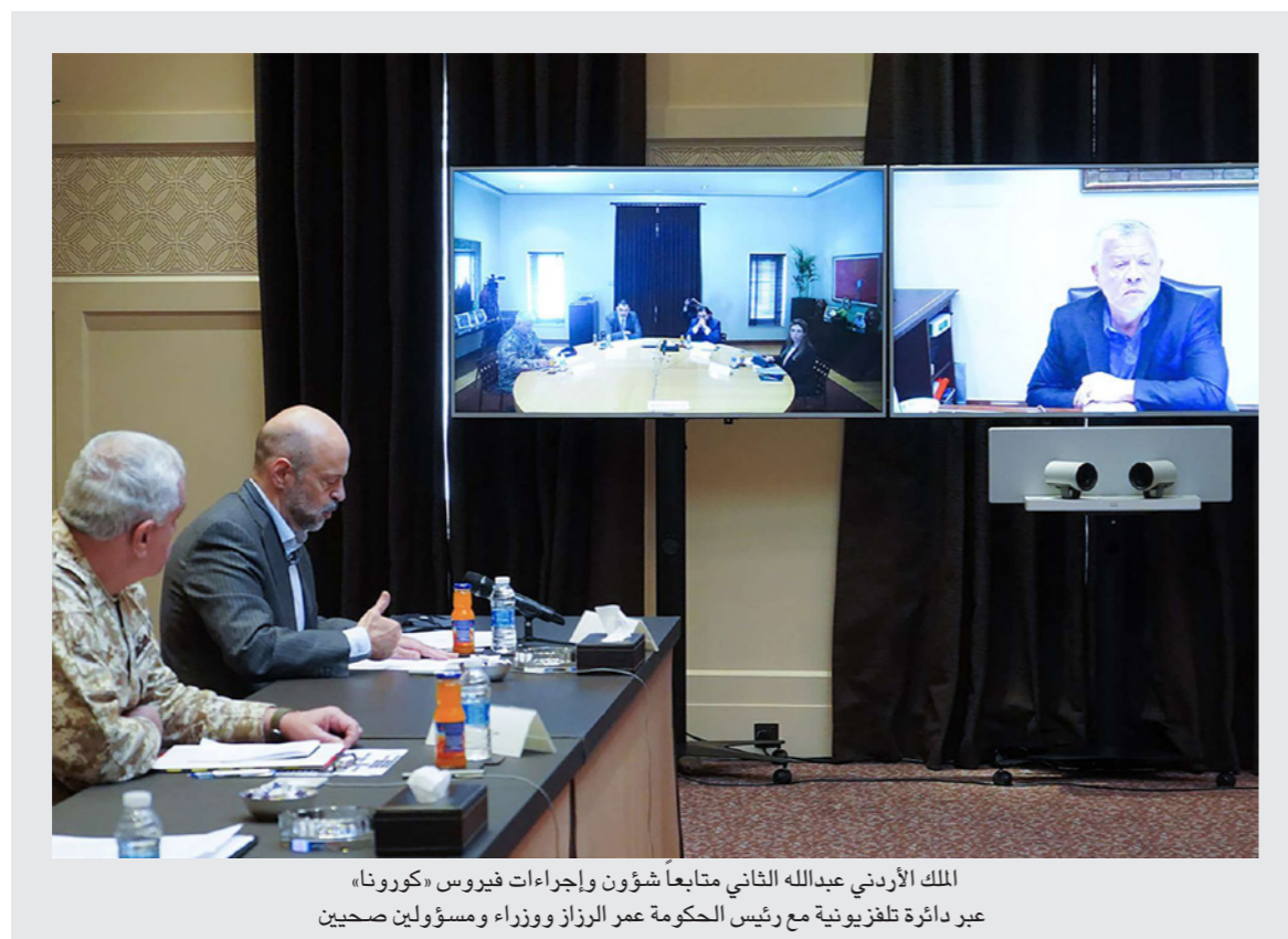
الملك الأردني عبدالله الثاني متابعاً شؤون وإجراءات فيروس «كورونا» عبر دائرة تلفزيونية مع رئيس الحكومة عمر الرزاز ووزراء ومسؤولين صحيين

الزأي العام لا يبدو معنياً بطرح مثل هذه التساؤلات، ومستويات الحذر زادت وكذلك الخوف، خصوصاً مع زيادة نسبة الامتثال في ظل ما تنقله وسائل الإعلام عن أحوال فيروس كورونا في العالم وخصوصاً الدول الغربية.