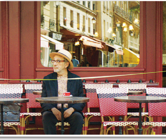
لتأملات من الفيلم

يقدم هذا التصور، في تشكيل اللوحات، وفي منتهجها لتعطي سردية، وهي سردية الشخصية الرئيسية (ES)، إيليا سليمان نفسه، يقدم للسنياريو بعدا تأمليا بعدنا نراه مباشرة، أو مما نشاهده، ويعني سليمان الشخصية في الفيلم، نعرف أنه في عوم أفلامه، وفي الأخير منها تحديداً كونه موضوعنا هنا، يتأمل وحسب، يلقى المشهد ثقتنا، يشاهده (لا أقول يراه أو ينظر إليه بل يشاهده)، تتحول المشاهد (بصفتها مراقبة) إلى تأمل، يثقل التأمل الافتراض إلى الممكن في الفيلم، والممكن إلى حدث في الواقع، ليصير التأمل تنبؤا، هو تنبؤ استغرق عشرين سنوات ليصل إلينا على هيئة السينمائية، مشاهد لا نملك حياها سوى المشاهد، وحالات لا نملك حياها سوى التأمل في ما ستؤول هي (ونحن معها) إليه، فيلمه «إن شئت كما في السماء»، صور الناصرة وباريس ونيويورك، كل في حالتها المكشوفة للتأمل، المراقبة، الركود