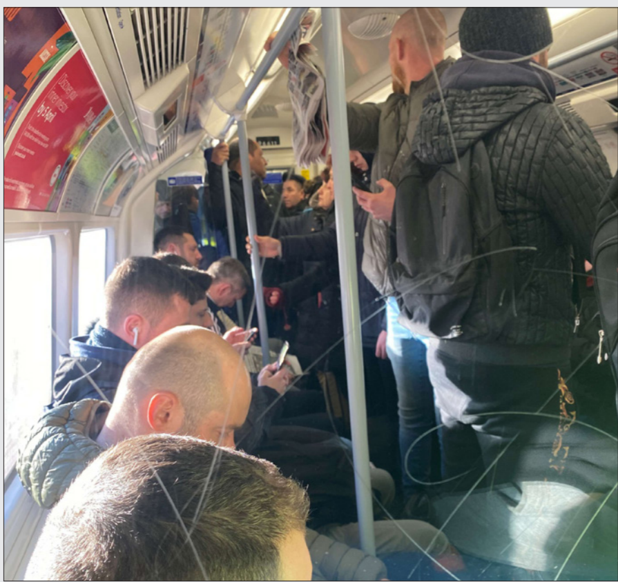
بالرغم من استمرار انتشار تفشي الفيروس في لندن مازالت القطارات مزدحمة بالراكب

ولعلت الصحيفة أن صوراً للشوارع المزدحمة والمتنزعات العامة مثيرة للقلق. ويدل على أن الراي العام لم يفهم أهمية ممارسة التباعد الاجتماعي الأكثر قلقاً هي المسؤولية التي يتحملها بوريس جونسون. فما قاله الأسبوع الماضي من أنه سيوقف فيروس كورونا في بريطانيا والمدة التي حدها ما بين 12 أسبوعاً للتخلص منه كان غير مسؤول. وفي وقت يقول فيه الباحثون العلميون إن سياسات الحد من الفيروس قد تحتاج إلى عام.