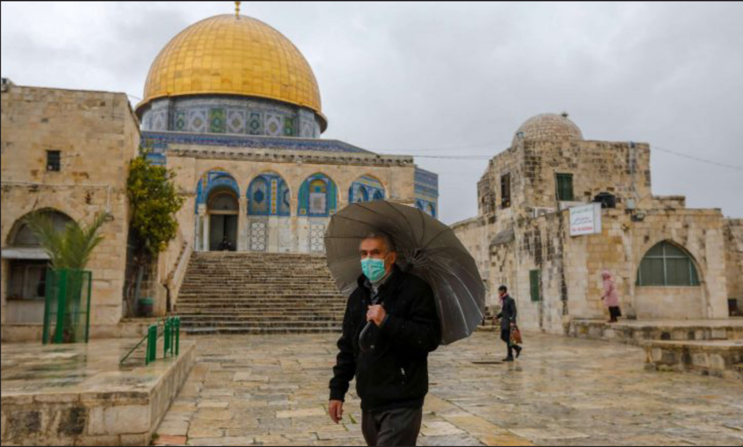
فلسطيني يمر بالقرب من مسجد قبة الصخرة بالقدس المحتلة