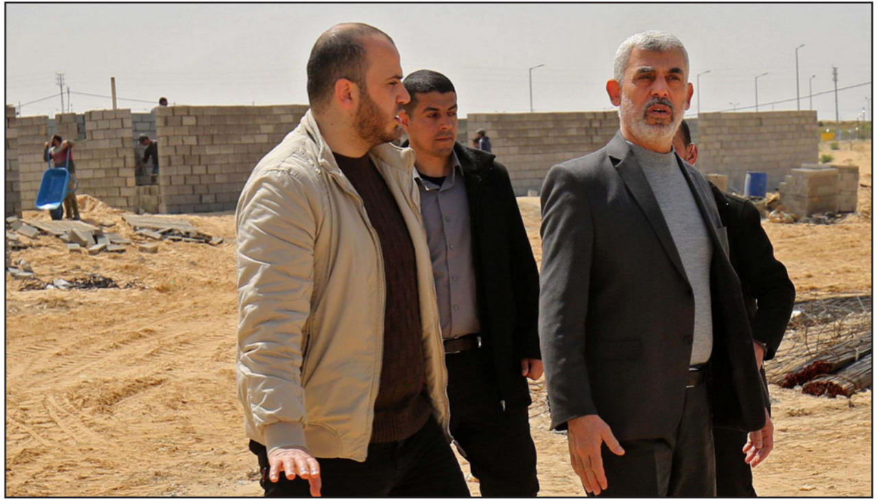
رئيس حماس في غزة يحيى السنوار يتفقد موقعا لبناء مستشفى ميداني للمصابين بالكورونا في رفح