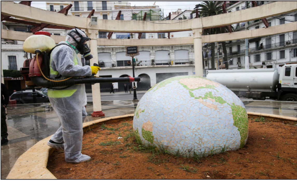
تقييم الساحات العامة في الجزائر

وكان الرئيس الجزائري أمر، الثلاثاء الماضي، بحظر الاحتجاجات بمختلف أشكالها وغلقت المساجد وتعليق صلاة الجمعة والجماعة ضمن خطة للتصدي لفيروس كورونا. وقال تبون في خطاب بثه التلفزيون الرسمي إنه «تقرر منع التجمعات والمسيرات كييفاً كانت وتحت أي عنوان وغلقت أي مكان يشتبه فيه بأنه بؤرة للوباء».