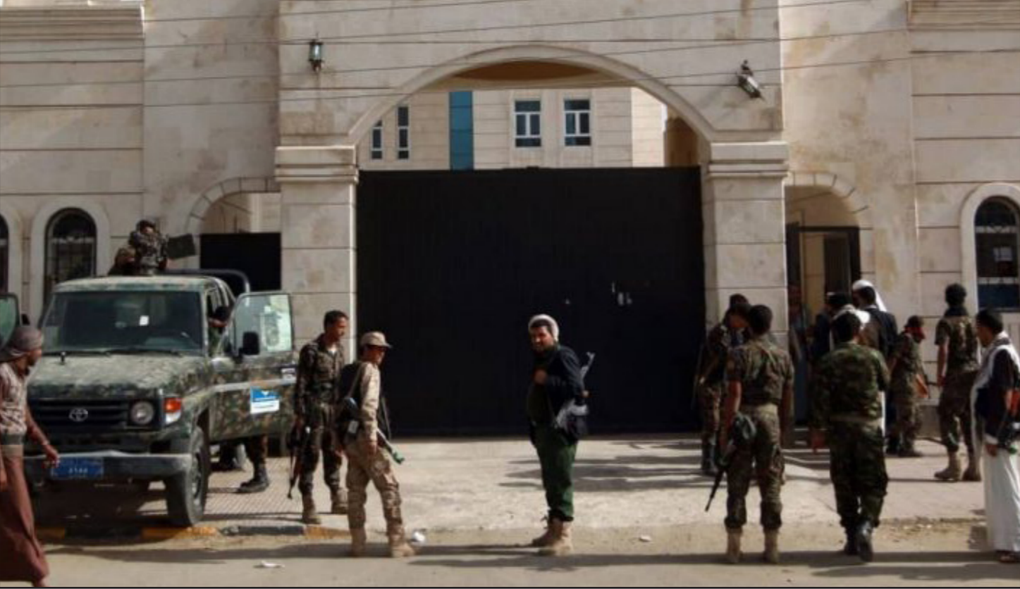
أرشيفية لعناصر من الحوثيين في صنعاء

جماعة الحوثي بصنعاء، أن الناشطات الحقوقيات يعدن الأكثر تعرضاً لأفظع أنواع التعذيب بطرق مهينة وغير الإنسانية، يشمل قس شعر الرأس بالسكاكين وتكبيد البدين والقدمين بالسلاسل، منع هؤلاء المعتقلات من النوم أو الجلوس على الأرض. وكان تقرير اللجنة العقوبات بشأن اليمن التابعة للأمم المتحدة أصدرت مطلع العام الجاري تقريراً كشفت فيه عن حملة اعتقالات منظمة للنساء في العاصمة صنعاء تقوم بها جماعة الحوثي عبر جهاز أمني نسوي أطلق عليه تسمية (الزيبديات) ويعد من أخطر الأجهزة الأمنية لدى جماعة الحوثي.