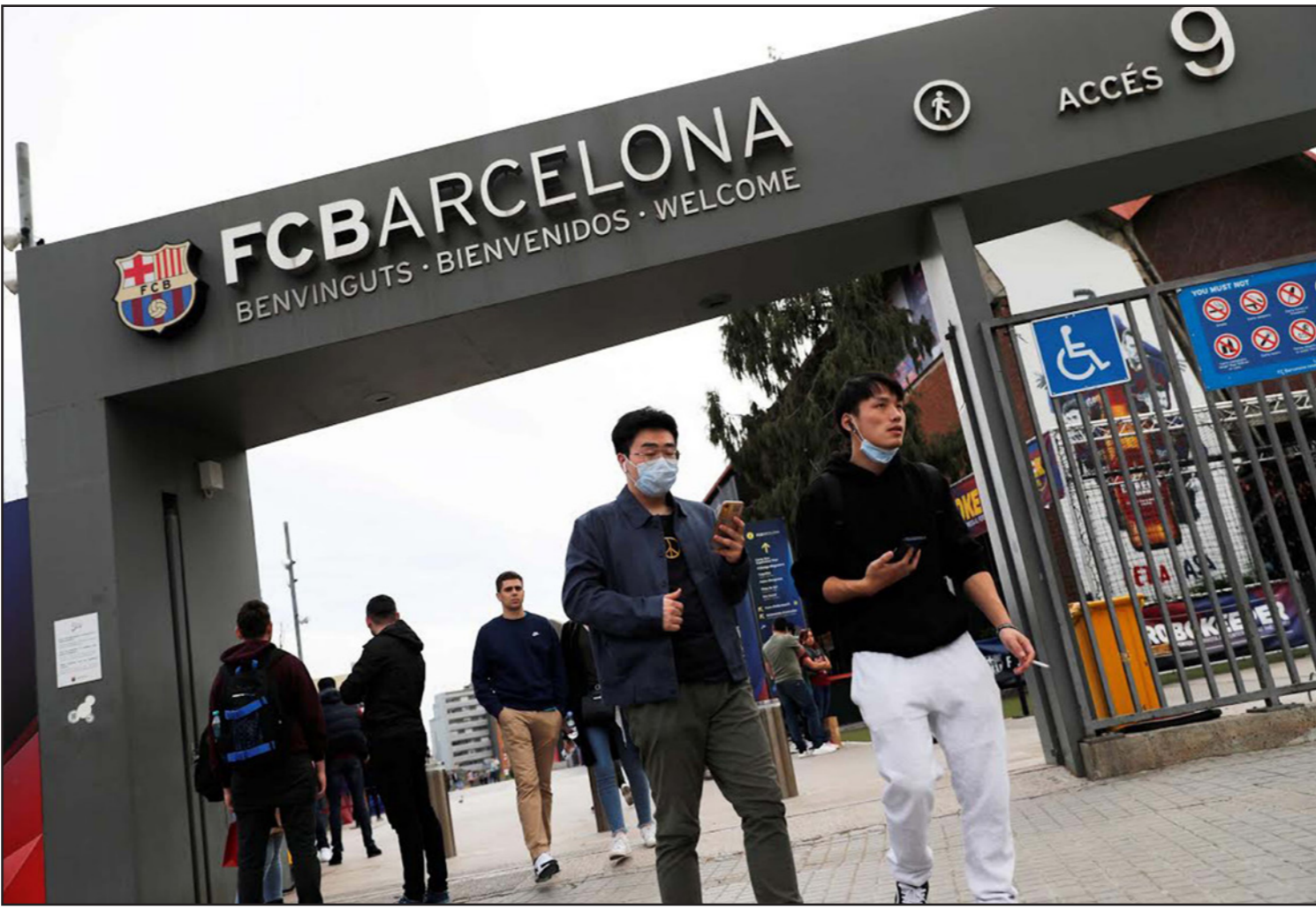
نادي برشلونة سيخسر إيرادات طائلة من الإغلاق في وجه الزوار

تخديرات نقابات اللاعبين من عدم التحرك في مثل تلك الظروف، وبالتالي فإن أي استئناف للموسم سيجعل اللاعبين غير لائقين. ويأمل برشلونة بأن تتمكن كافة الأندية من جميع أنحاء أوروبا، من التوصل إلى اتفاقيات تجعل تنفيذ الإجراءات أسهل. ولم تتخل الأندية عن أملها في استئناف الموسم، بعد تأجيل كأس أمم أوروبا 2020 حتى العام المقبل، لكن برشلونة يجب أن يستعد لقبول احتمالية عدم استئناف الدوري، وكذلك دوري الأبطال. وذكر النادي في بيانه الجمعة: "من الواضح أن هذه الأزمة سيكون لها تأثير سلبي كبير على صناعة كرة القدم وصناعة الرياضة ككل. النادي ملزم بالاستعداد لمواجهة جميع السيناريوهات المحتملة".