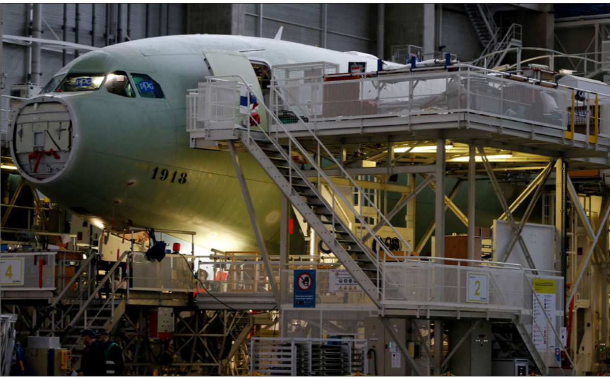
إحدى طائرات إيرباص على خط التجميع النهائي في مقر الشركة في كولومبي بالقرب من تولوز الفرنسية

واشنطن - د ب أ: توقع جيمس بولارد، رئيس فرع مجلس الاحتياط الاتحادي (الركزي الأمريكي) في مدينة سانت لويس في ولاية ميسوري، أن يسجل معدل البطالة الأمريكي 30 في المئة في الربع الثاني بسبب حالات الإغلاق لمواجهة تفشي فيروس «كورونا» الجديد، مع تراجع غير مسبوقي في إجمالي الناتج المحلي يبلغ 50 المئة. ودعا إلى استجابة مالية قوية للتلّامتن 2.5 تريليون دولار لتعويض دخل مفقود خلال ذلك الربع السنوي، من أجل ضمان تعاف قوي في نهاية المطاف للاقتصاد الأمريكي، مضيفا أن مجلس الاحتياط «البنك المركزي، سيكون على استعداد لعمل المزيد لضمان عمل الأسواق خلال فترة تقلب شديدة».