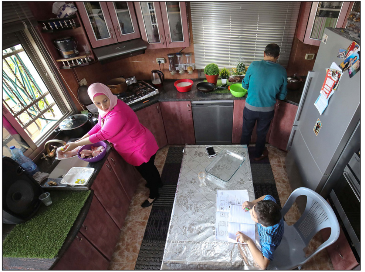
مدرسة فلسطينية تتحدث عن تجربتها في التعليم عن بعد

في خلية الأزمة المطلة على كافة تفاصيل الوضع الصحي في غزة وفي المنطقة بأكملها، وكان إياه اليزم الناطق باسم وزارة الداخلية، قد أكد أن لدى الوزارة خططا جاهزة للتعامل في حال وقوع إصابات وتفشي المرض في قطاع غزة. وقال في تصريحات أدلى بها بسا حيا مقابلة تلفزيونية إن "وزارة الداخلية في غزة وباقي الوزارات جهزت نفسها للتعامل مع أسوأ الظروف، مضيفا "نجنهت بالأدخل إلى هذه المربعات الخطيرة التي سنكفلها الكثير". وأضاف أن "لدى وزارته خطط طوارئ جاهزة للتعامل مع الظروف الصعبة فيما يتعلق بظروف فيروس كورونا، وتم تكيف الخطط بشكل سريع لتتمكن الأجهزة الأمنية من تحمل مسؤولياتها في مواجهة الوباء، وكذلك في مواجهة الأعباء والتحديات الأمنية".