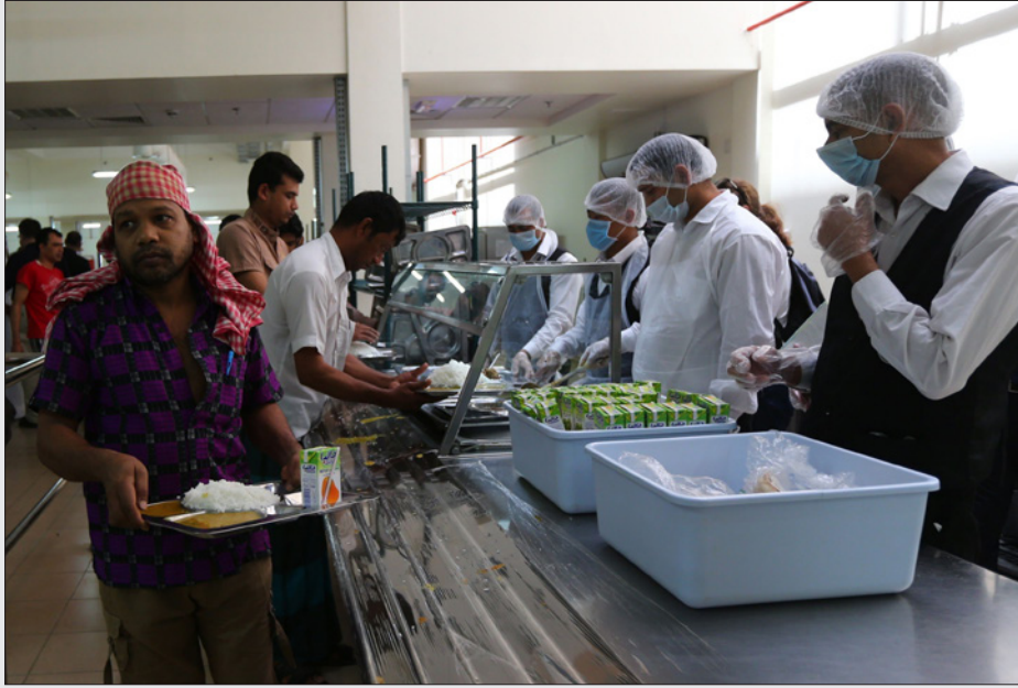
عمال أجنبي في أحد مراكز سكنهم في قطر

وقال إقبال رشيد، عامل البناء في باكستان في قطر: