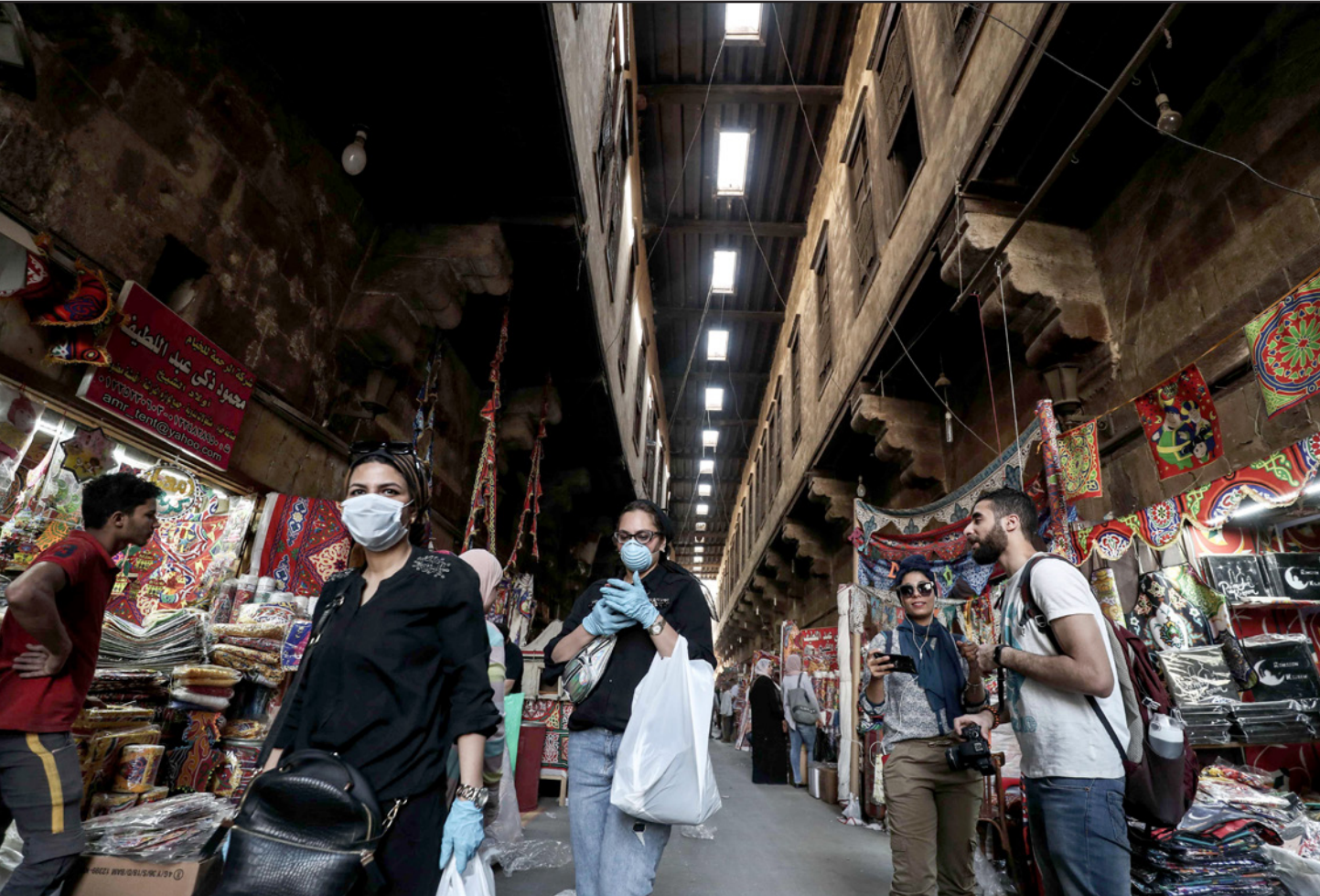
مصريون في أحد الأسواق في القاهرة

المصابة للحجر الطبي، لتلقي الرعاية الطبية اللازمة». وأكد المصنع «استعداداه الكامل لمواجهة الجائحة منذ البداية، بتطبيق الإجراءات الوقائية للحفاظ على سلامة فرق العمل، والبالغ عددهم 1500 موظف، يعملون في المصنع ومنافذ ومواقع البيع وإدارة سلسلة الموردين، أو حتى الذين يعملون عبر الإنترنت في منازلهم، متوافقاً مع توصيات منظمة الصحة العالمية ووزارة الصحة».