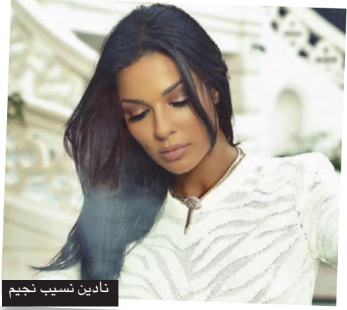
نادين نسيب نجيم