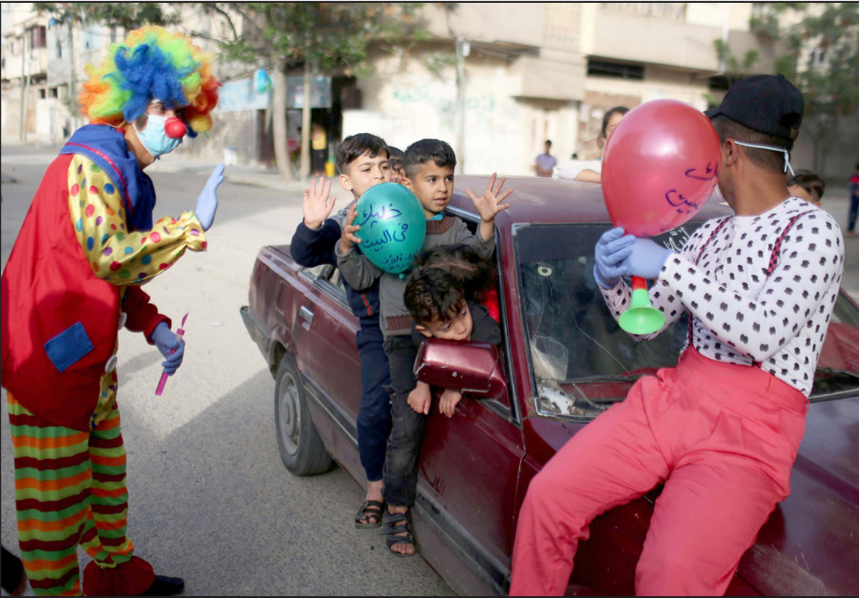
مهرج يحاول أن يضفي البسمة على وجوه أطفال في غزة