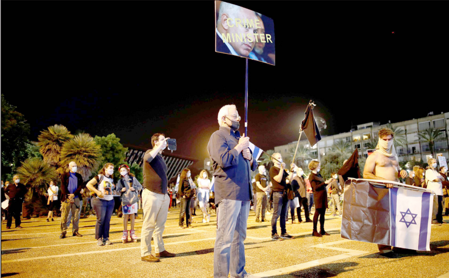
مظاهرة مناهضة للتناهاو في تل أبيب ليل السبت رغم كورونا

اقتصادية تذكّر في حجمها بالانهايار الكبير في 1929. وتعلل رؤيتها بالقول إن الناتج المحلي الصافي العالمي انخفض بـ12% ومن المتوقع استمرار هذا الانخفاض، مع معدلات بطالة هائلة في الولايات المتحدة وفي أماكن أخرى. ومن المتوقع أن تؤدي الأزمة الاقتصادية العالمية، من بين أمور أخرى، إلى انخفاض الطلب على الغاز، وبذلك لن يفرغ تصدير مركزي كانت إسرائيل تنوي الاعتماد عليه في السنوات المقبلة، ومن المتوقع أن تتراقق الأزمة الاقتصادية مع منافسة قوية بين الدول، وخصوصاً على الموارد في المجال الصحي، والطلب العالمي الهائل على المستلزمات الطبية، كما تجلّى منذ نشوب الأزمة، من المتوقع أيضاً أن يستمر، وأن يزيد في التورات الدولية. ويعتقد مسؤولون في وزارة خارجية الاحتلال أن تشابه هذه التورات مع الأزمة الاقتصادية وشلل عالم الطيران، سيؤدي إلى قواعد لعبة جديدة بشأن كل ما له علاقة بالتجارة العالمية، وبحسب الوثيقة، التجارة الحرة كما هي معروفة اليوم ستتغير نحو سياسة انطواء الدول. ومن المتوقع أن تعود الدول إلى بناء سلاسل إنتاج وإمداد محلية، وخصوصاً في مجالات حساسة لأمين القومي رغم ارتفاع التكلفة الاقتصادية الناجمة عن ذلك.