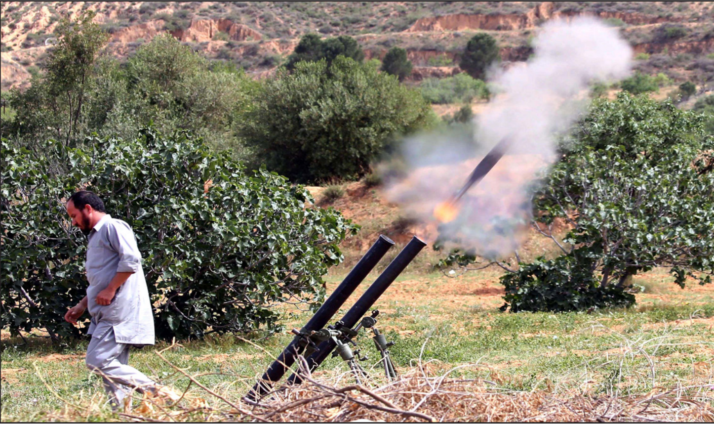
عنصر من القوات التابعة لحكومة الوفاق خلال اشتباكات على حدود مدينة ترهونة جنوب غرب العاصمة الليبية طرابلس

واستعمال صور قديمة في الغرض. وأضاف: "من يقف مع ثورة ليبيا وشعب ليبيا العظيم في ثورته ضدّ محمور الموت العربي إنما هو يقف مع نفسه قبل أن يقف مع أهل ليبيا. معركة ليبيا وتحرير ليبيا هي معركة الأمة ومعركة كل حز في هذه الأمة، إنها معركة بين الحق والباطل وبين الظالم الباغي والمظلوم المدافع عن الحق". وتابع بقوله: "يا أهلنا في ليبيا، الفضل لله أولاً ولسواعد الأحرار، لكن لا تنسوا أنه لولا وقوف تركيا وقطر معكم ومع ثورة فبراير المجيدة لتكالب عليكم ضباغ الأرض ومرتزقة الأمم وكل المجرمين والخونة والقتلة، ولكان شيطان العرب يرقص في العاصمة طرابلس، لا سمح لله، ويجواره المجرمان حفتر والسيسي".