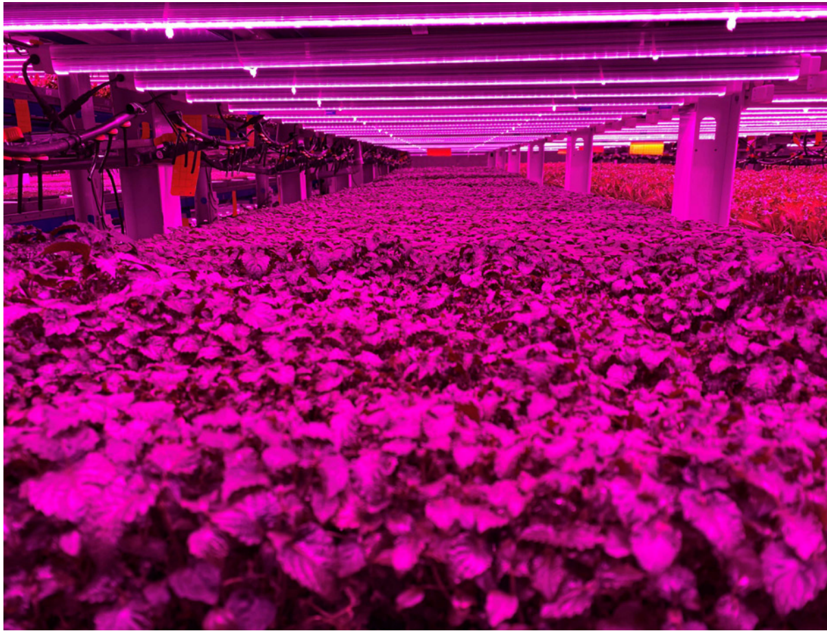
داخل إحدى المزارع التي تعتمد على التكنولوجيا المتقدمة في الإمارات

من جهة ثانية قال زياد فريز، محافظ البنك المركزي الأردني، أن ربط العملة الوطنية (الدينار) بالدولار خدم الاقتصاد بشكل جيد، ولا يوجد شيء على المدى المتوسط سيؤثر على هذه الركيزة الأساسية للسياسة النقدية رغم الضغوط الناجمة عن أزمة فيروس كورونا.