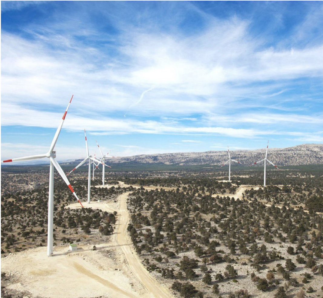
طواحين هواء في مزرعة رياح تركية لتوليد الكهرباء

الثاني بنسبة 8 في المئة مقارنة مع الشهر المقابل من عام 2019، وبلغت 619 مليوناً و214 ألف دولار. وفي فبراير/شباط ارتفعت قيمة صادرات الولاية من السيارات 21.76 في المئة، مقارنة مع الشهر نفسه من العام الماضي، وبلغت 759 مليوناً و599 ألف