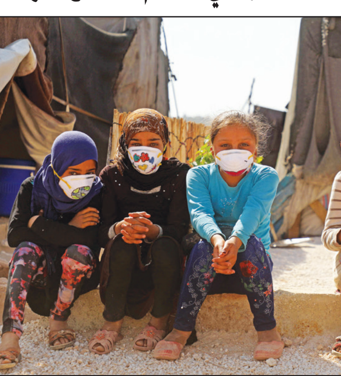
نازحات سوريات يضعن كمادات عليها رسوم للوقاية من كورونا في معسكر بردكلي شمال ادلب أمس

مالك شركة فيرجن يطلب مساعدة مالية حكومية قال رجل الأعمال البريطاني ريتشارد برانسون، أمس الإثنين، إن شركة فيرجن للطيران بحاجة لمساعدة مالية حكومية لتتجنب التنازلات القاسية لفيروس كورونا على قطاع الطيران. وتعد برانسون «ببذل كل ما يستطيع» من أجل استمرار عمل شركة فيرجن اتلانتيك للطيران.