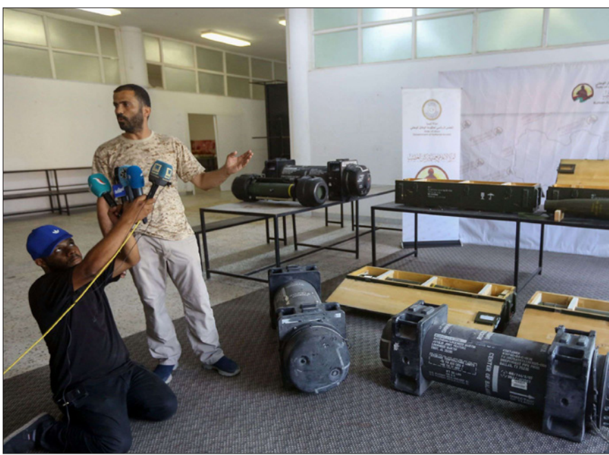
متحدث باسم حكومة الوفاق الوطني الليبي المعترف بها دولياً

واشتمكى الدبلوماسيون وأشهرهما وصفوه الخرق الصارخ والمكرر الذي قامت به القوى الخارجية بما فيها الإمارات العربية المتحدة الداعمة لطرف في النزاع في الحرب الأهلية، وتكشف وثائق الشحن والنقل التي اطلعت «فايننشال تايمز» عليها تفاصيل نادرة عن ثلاث شركات متورطة في العملية، وتظهر الوثائق أن الجهة المزودة للوقود هي «أفريقيين لوجستك أف زد إي» ومقرها إمارة الشارقة، وتم تحميل الوقود على متن «أم غالف بيتروليم 4».