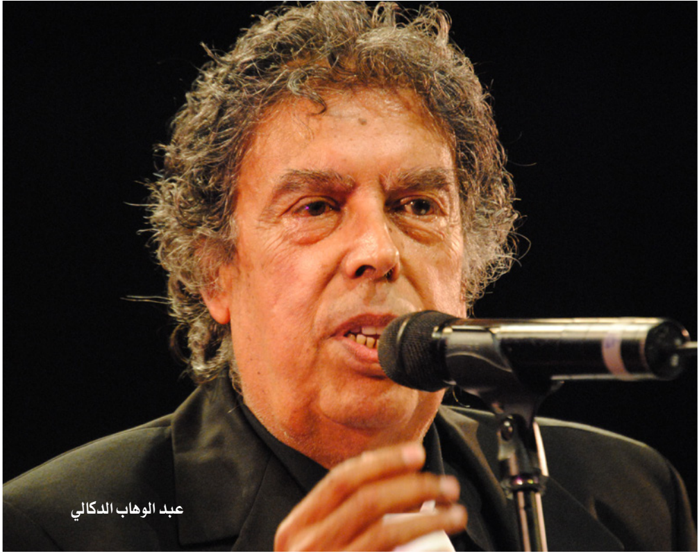
عبد الوهاب الدكالي

وتتناوله سريعا، لكننا نستطيع أن نحدد بعض الملامح الأساسية البارزة في فنه، وعلى رأسها أنه يهتم بالجانب التعبيري والوصفي في موسيقاه، ويمنح الكلمة أيضا كل طاقاته التعبيرية أثناء الغناء، كما في أغنية «حكاية هوى» وأغنية «مشي غزالي»، بالإضافة إلى التنوع بين عنوية الألحان وبساطتها، وقوة الموسيقى وعمقا، وتعقيدها والتصورات الفنية، التي أنتجت أغنيات كانت عصرية جدا في زمنها ولا تزال، وهو دائم الابتكار والانتقال بين الألوان المختلفة، معتادا على درايته الموسيقية الكبرى وتمكنه من التنكيك واتساع مدى موهبته، ولإيقاع موسيقاه أهمية بارزة تظهر أكثر ما يكون في الألحان الموعلة في السرعة، ويكون بارعا في توظيف الإيقاعات