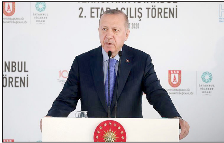
الرئيس التركي رجب طيب اردوغان

وعلى غرار ما جرى في كافة دول العالم، شكل انتشار فيروس كورونا بمثابة الاختبار الأكبر للنظام الصحي في تركيا، لا سيما مشروع الرئيس التركي النّير للجدد لبناء سلسلة من المستشفيات العملاقة في كبرى المحافظات في البلاد، وهو المشروع الذي يستند إليه للتأكيد على قوة ونجاح النظام الصحي في بلاده والاعتقاد بأنه سيخرج من هذه الأزمة أكثر قوة من السابق. ويعول الرئيس التركي على الإصلاحات التي أدخلها على النظام الصحي وبناء مستشفيات عملاقة والإعلان عن مجانية علاج كافة المواطنين المصابين بـ«كورونا» دون أي رسوم، وتوزيع الكمادات الطبية مجاناً وغيرها من الإجراءات من السيطرة على فيروس كورونا والخروج منه بأقل الخسائر مما سيمكته من الحديث عن إنجازات كبيرة لحكومته مقابل الأزمة التي