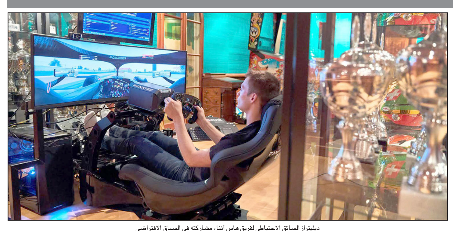
ديليترز السائق الاحترافي فريق هاس أثناء مشاركته في السباق الافتراضي

■ لندن - رويترز: احتفل شارل لوكلير بفوزه الثاني على التوالي في مشاركتين في فبراري ببطولة سباقات فورمولا-1 الافتراضية بالانتصار في سباق الصين. وقاز السائق البالغ 22 عاما، الذي انتصر في سباقين متتالين في السباقات الحقيقية الموسم الماضي في بلجيكا وإيطاليا، بعدما انطلق من مركز أول المنطلقين بعد أسبوعين من فعل الأمر ذاته في جائزة فينتام الكبرى، واستخدم لوكلير جهاز المحاكاة في منزله في موناكو لينهي السباق متقدما على التايلندي الكسندر ألون سائق رد بول بفارق 2.5 ثانية. وجاء الصيني جوانيو تشو، المشارك في سباقات فورمولا-2 والفائز بالجوقة الأولى، في المركز الثالث مع رينو، وأبلغ لوكلير نحو 60 ألف متابع عبر منصة "تويتش": "الأمر كان صعبا، كان صعبا حقا". وكان السباق هو الثالث في السلسلة التي انطلقت لإمتاع الجماهير في ظل توقف رياضة المحركات حول العالم بسبب تفشي فيروس كورونا ما أدى إلى عدم انطلاق موسم فورمولا-1. وشارك ستة سائقين في فورمولا-1 في سباق الأحد وعانى لاندو نوريس سائق مكلارين، الذي كان يمكنه إنهاء السباق في المركز السابع، من مشكلة ميكانيكية للمرة الثالثة على التوالي، وتعرض زميله الإسباني كارلوس ساينز لحادث بعدما كان في الصدارة لفترة قصيرة واكتفى في النهاية بالمركز 11.1، وشارك تيبو كورتوا حارس ريال مدريد وتشيريو إيموبيلي مهاجم لاتسيو كضيفين مع رد بول وألفا تاوري واحتل المركزين 15 و17. كما شارك إيان بولتر لاعب الغولف مع رينو، واحتل جورج راسل سائق ويليامز المركز الرابع بعد عقوبة ضد البلجيكي ستوفل فاندورنه.