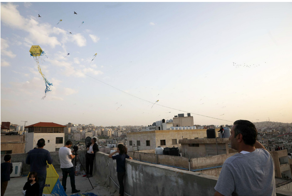
أردنيون يطلقون في السماء طائرات ورقية كجزء من مبادرة إطلاقها البنك الأردني الكويتي لدعم العاطلين عن العمل ورفع مستوى الوعي ضد الفيروس

ولا ينبغي أن يسقط بكل الاعتبار التقيمي العنصر المتعلق بشفقة الشارع» الكبيرة في المؤسسة العسكرية تحديداً، التي راقت تماما ميدانياً كل مظاهر التفعيل الحكومية وكل القرارات والإجراءات التي اتخذتها الحكومة ودون «مزاحمة» لأي جهة في السلطة والحكومة وعلى أساس معادلة يقولها الجنرالات في كل الاجتماعات «مدينة الطابع»، وتتمثل في أن «القوات المسلحة لحماية الجميع، ولا تريد أصلاً الظهور أكثر مما ينبغي». وتوقفت «القدس العربي» من تلك المقولة مفيد بعبارات وردت أصلاً بالنص الملكي المرجمي المؤسسة بحريات المواطنين وحقوقهم» خلافاً لأن الرأي العام «ليس» فعلاً نتاجات في المعادلة الصحية الرسمية أظهرت قدرًا من الكفاءة وحقق بعض الأرقام الإيجابية لصالح المنطق الرسمي ولصالح الخضوع الاجتماعي.