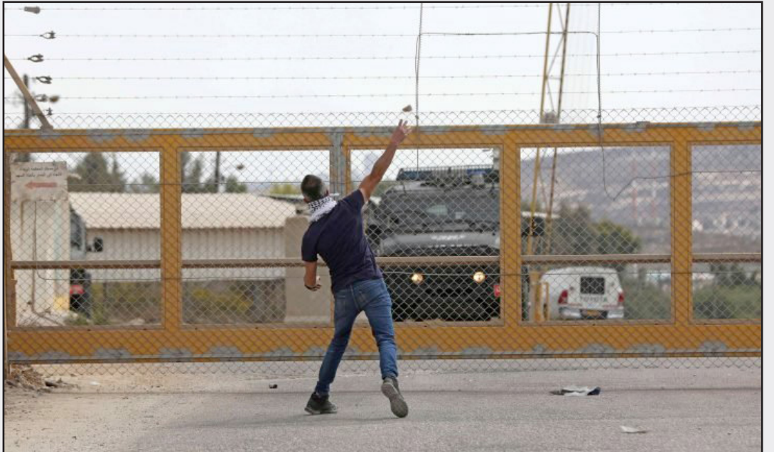
فلسطيني خلال اشتباكات على مدخل سجن عوفر الإسرائيلي