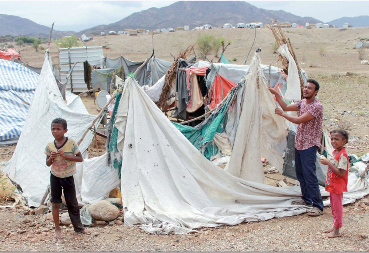
يعني يحاول إصلاح خيمته عقب الفيضانات التي ضربت البلاد في أحد معسكرات للاجئين

الحوثيين والقوات الحكومية في محافظتي مأرب والجبوف، وتبادل الاتهامات فيما بينهم بشأن التصعيد العسكري وعدم الالتزام بوقف إطلاق النار. وكان التحالف العربي بقيادة السعودية قد أعلن في التاسع من الشهر الجاري وقف إطلاق النار في اليمن لمدة أسبوعين قابلة للتديد بعد على إنهاء الحرب والتصدي لفيروس كورونا.