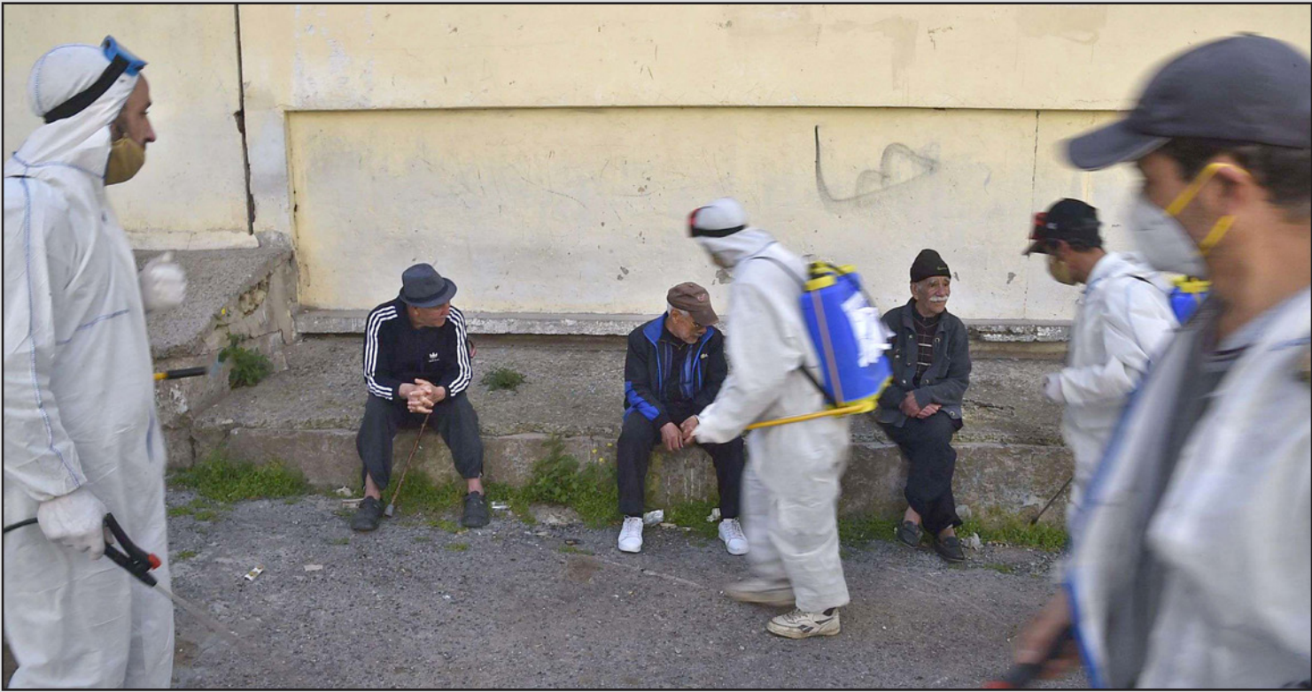
عمال صحة يعقون أحد شوارع العاصمة الجزائرية

لرابط بين العطش ومخاطر الإصابة بفيروس كورونا المستجد، وأن عدم الصيام يفرضه الصيام في رمضان. وقال يوسف بلهمدي، وزير الشؤون الدينية، في تصريحات لإذاعة الحكومية، إن الاجتماع تم بحضور جمال فورار، الناطق الرسمي باسم لجنة متابعة وصد تفشي وباء كورونا، وأن الاجتماع قرر بجماع عدم علاقة صوم الأصحاء بالوباء، وهو الأمر الذي أكده فورار، وأنه لا وجود