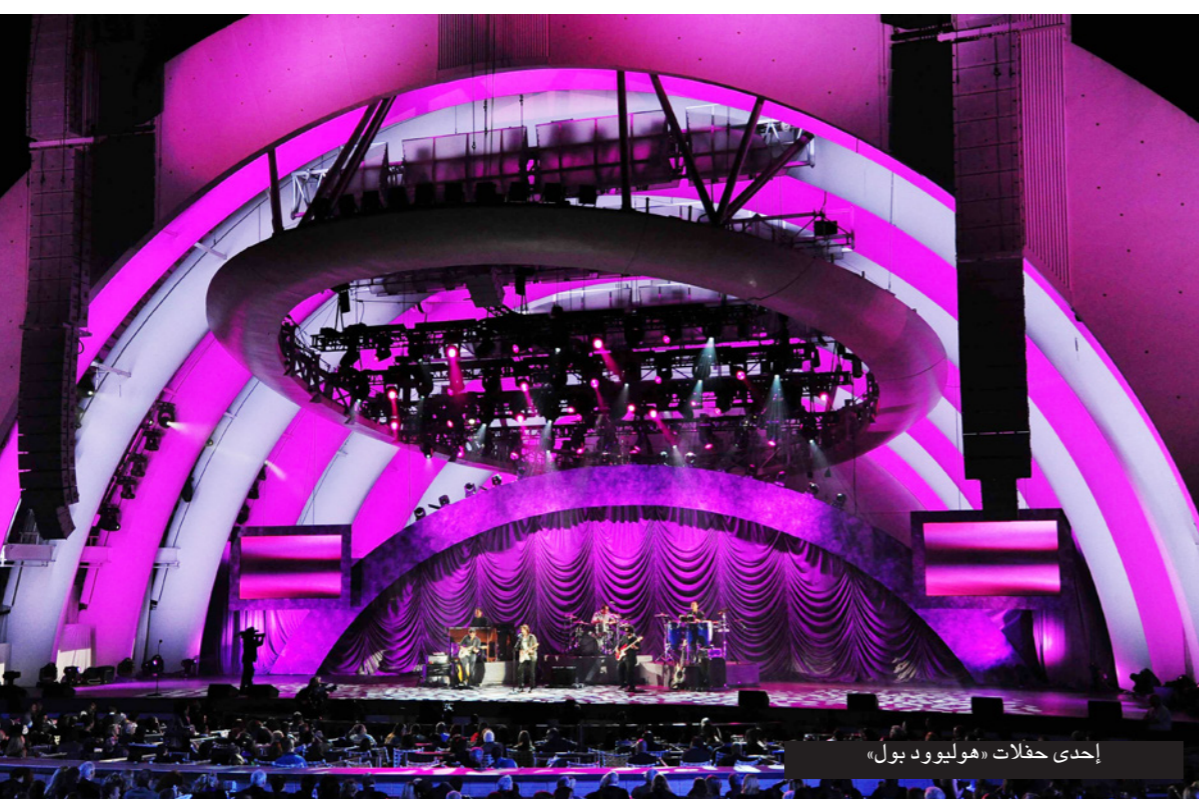
إحدى حفلات «هوليوود بول»

وستتبدل أوركسترا لوس أنجليس الغيلها رومانية التي تدير الموقع مع سلطات المنطقة، ربحاً فائداً قدره 80 مليون دولار. وقال رئيس الأوركسترا تشاد سميت في بيان «جميعنا حزنين من عواقب هذه الأزمة وننتشرك في خيبة أمل كل الذين كان ينتظرون بفارغ الصبر، انطلاق الموسم، ويشكل موسم الصيف في الموقع ملتقى ثقافياً أساسياً في لوس أنجليس وقد شهد في السابق مرور كوكبة من النجوم من أمثال «فرقة «بيتلز».