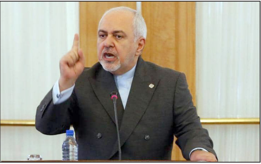
وزير الخارجية الإيراني محمد جواد ظريف

وقال ظريف للصحافيين: «المزاعم الحققاء للمسؤولين الأمريكيين ليست شيئاً جديداً»، وأضاف: «ليس مفاجئاً أن نستمع مثل هذه الأمور من أشخاص يوصون بشررب المظاهرات لره فيتروس كورونا- أن يزيموا أنهم لا يزالون طرفاً بالاتفاق بعد الانسحاب منه رسمياً، ويبدو أنه كان يشير إلى اقتراح ترامب إجراء أبحاث عما إذا كان من الممكن علاج الإصابة بفيروس كورونا بحقن الجسد بمطهرات».