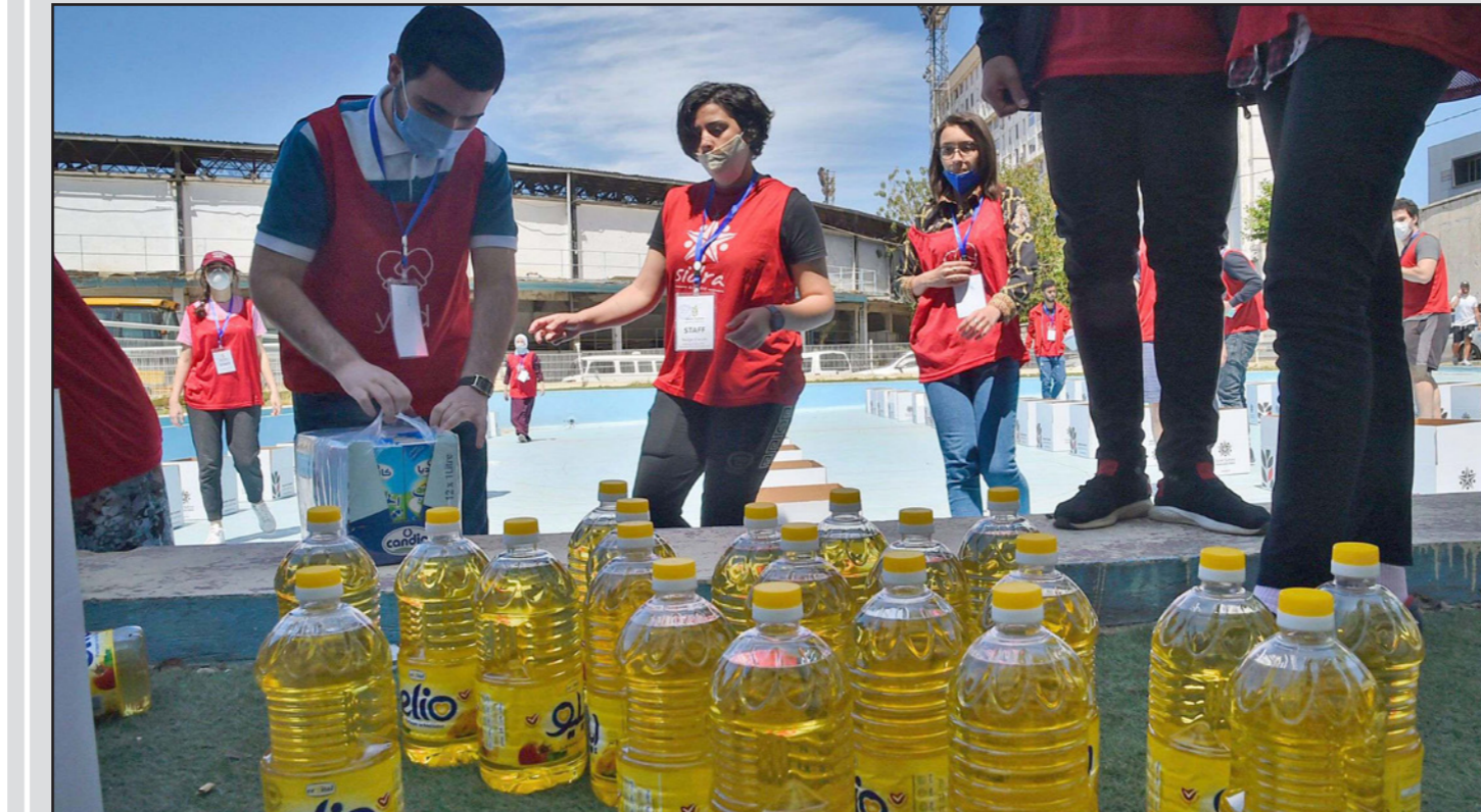
مطعمون يوزعون زجاجات زيت الطعام لبعض المحتاجين في العاصمة الجزائرية

أرقام الإصابة مقارنة بالولايات الأخرى التي شهدت زيادة في عدد المصابين. ودعا إلى ضرورة الالتزام بوضع الكمادة خلال أيام العيد والحد من تنقلاتهم، قائلا: "كورونا ليست إنفلونزا موسمية هي فيروس يتكيف مع محيطه صيفا وشتاء". على جانب آخر، قالت السفارة الصينية في الجزائر إن فريقاً من الخبراء الطبيين الصينيين، والذي أرسلته الحكومة الصينية، وصل أمس الخميس إلى مطار هواري بومدين الدولي بالعاصمة الجزائرية، من أجل المساعدة والمساعدة في جهود محاربة فيروس كوفيد-19. وتذكرت السفارة الصينية أن الفريق