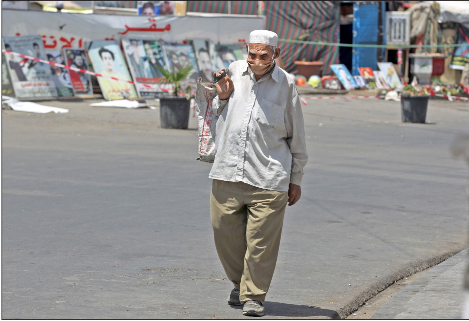
مسن عراقي يضع كمامة طبية للوقاية من كورونا