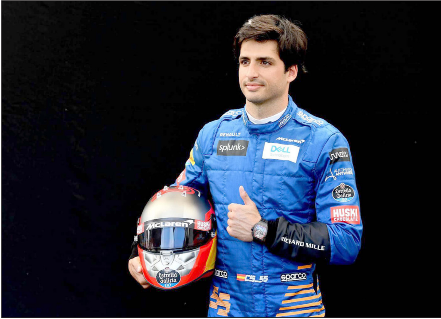
ساينز سيرتق فريق مكلارين في نهاية العام ليلتحق بفيراري