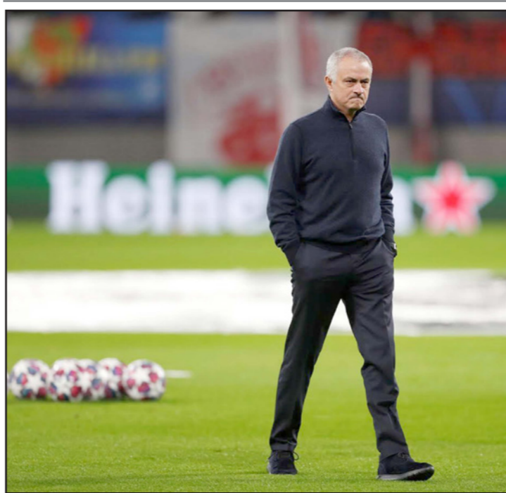
مورينيو يتلهف للعودة إلى مركز تدريبات توتنهام

لندن - أف ب: أكد مدرب توتنهام جوزيه مورينيو أنه متلهف لاستئناف الدوري الانكليزي رغم تزايد القلق حول مخاطر استكمال موسم 2019-2020 بسبب تفشي فيروس كورونا. وكان نجوم عدة أعبروا عن مخاوفهم من معاودة مباريات الدوري، وعلى رأسهم الأرجنتيني سيرخيو اغويرو وزميله في مانشستر سيتي رجم ستيرلينغ ومدافع نيوكاسل المعان من توتنهام داني روز. كما أعرب أكثر من محب عن مخاوفهم من استئناف الدوري منتصف حزيران/يونيو خلال اجتماع لجمعية المدربين. بيد أن مورينيو قال إنه يتطلع للعمل مجددا رغم التحديات التي تترافق تقشفي «كوفيد-19». وقال مورينيو: «لم أطلب بأي تأخير، أريد الاشراف على التدريبات وأنا متلهف لعودة الدوري في أسرع وقت تتوف فيه السلامة للقيام بذلك، خصوصا أن دوريات أخرى تستعد للعودة». وكان مورينيو أجبر على الاعتذار في نيسان/أبريل الماضي بعدما نشرت الصحف صورة له أثر خرقه قوانين الحجر الصحي حيث شوهد إلى جانب لاعب الوسط الفرنسي تانغي ندومبيلي في إحدى الحدائق العامة. كما اعتذر ثنائي الفريق سيرج اويوبي وموسي سيسوكو لخرقهما قواعد الحجر الصحي من خلال التدريب جنبا إلى جنب أيضا. لكن رغم الحادثتين، أعرب مورينيو عن سعادته بقوله: «أنا فخور جدا بالطريقة التي حافظ فيها لاعبو الفريق على لياقتهم البدنية. لقد أظهروا احترافية عالية، شفقا وتصميما». وتابع: «بذلنا جميعا جهودا شاقة خلال حصص التدريبات عن بعد وخلال التدريبات الفردية بعد السماح باستعمال مقرات التدريب». وختتم: «كل لاعب أظهر تصميما كبيرا في العمل الفردي الذي قام به والان تنتظر الأضواء الاخضر للتدريب ضمن مجموعات صغيرة وهذا ما أؤيده جدا».