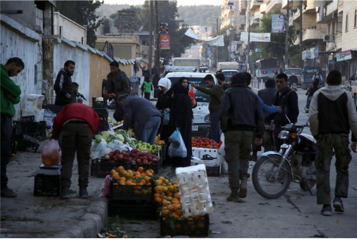
سوريون يتسوقون في أحد أسواق مدينة عفرين شمال غرب سوريا

كورونا تؤثر داخل السوري، وفي المناطق الحرة خصوصا بسبب إغلاق الماعبر مع تركيا أو حتى إغلاق الماعبر مع النظام ارتفعت أسعار البضائع بشكل خيالي».