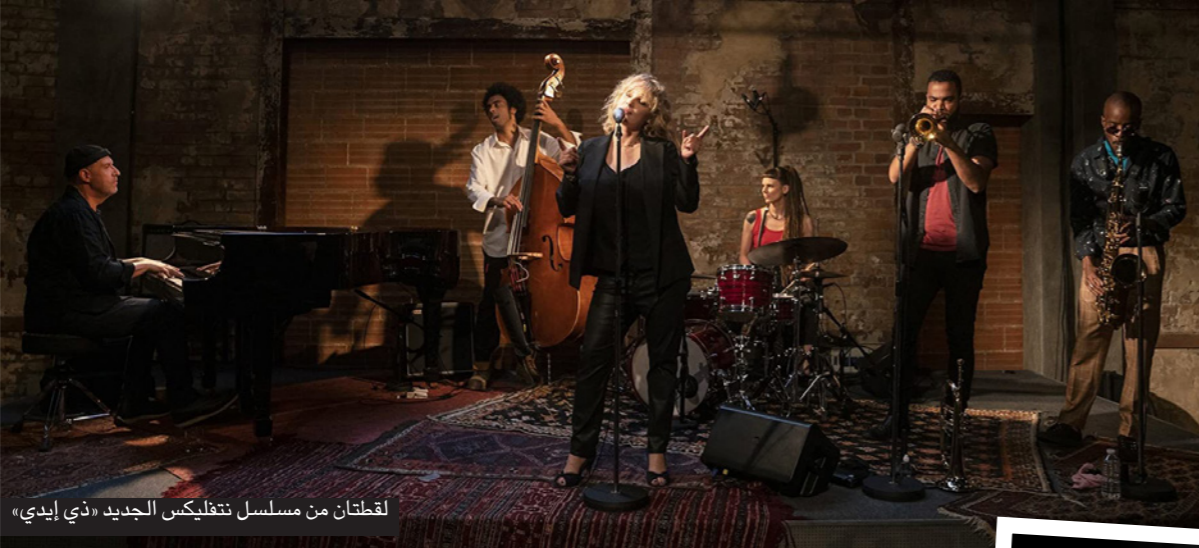
لقطتان من مسلسل نتفليكس الجديد «ذي إيدي»

شازيل سينمائية الألفة، كما أنه لم يتطرق فيها للقضايا الاجتماعية التي تعد المحرك الأساسي للجاز. فواجه انتقادات لاذعة من قبل بعض المعلقين حرقياً، لكنهم بإمكانهم إيجاد هذه الأرضية المشتركة موسيقياً وهو يتوافق حتماً مع حقيقة الجاز، الذي يعتبر اليوم شكلاً من أشكال الفن الدولية والعالمية المتعددة الميادين، تشاهده في طوكيو أو هلسنكي أو باريس في الحيوية نفسها التي تشاهده فيها في الولايات المتحدة، ونحن نشاهد مجموعة من الأشخاص لديهم الكثير من الأمور للحدث بشأنها والكثير من الأسرار التي يكتبونها، وليسوا متأكدين من كيفية الحديث عنها، لكنهم يمتلكون الموسيقى دائماً كوسيلة للتعبير أحياناً عن أكثر ما يصعب التعبير عنه».