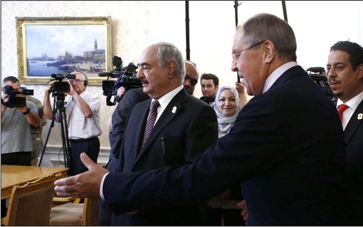
وزير الخارجية الروسي سيرغي لافروف والجنرال خليفة حفترا