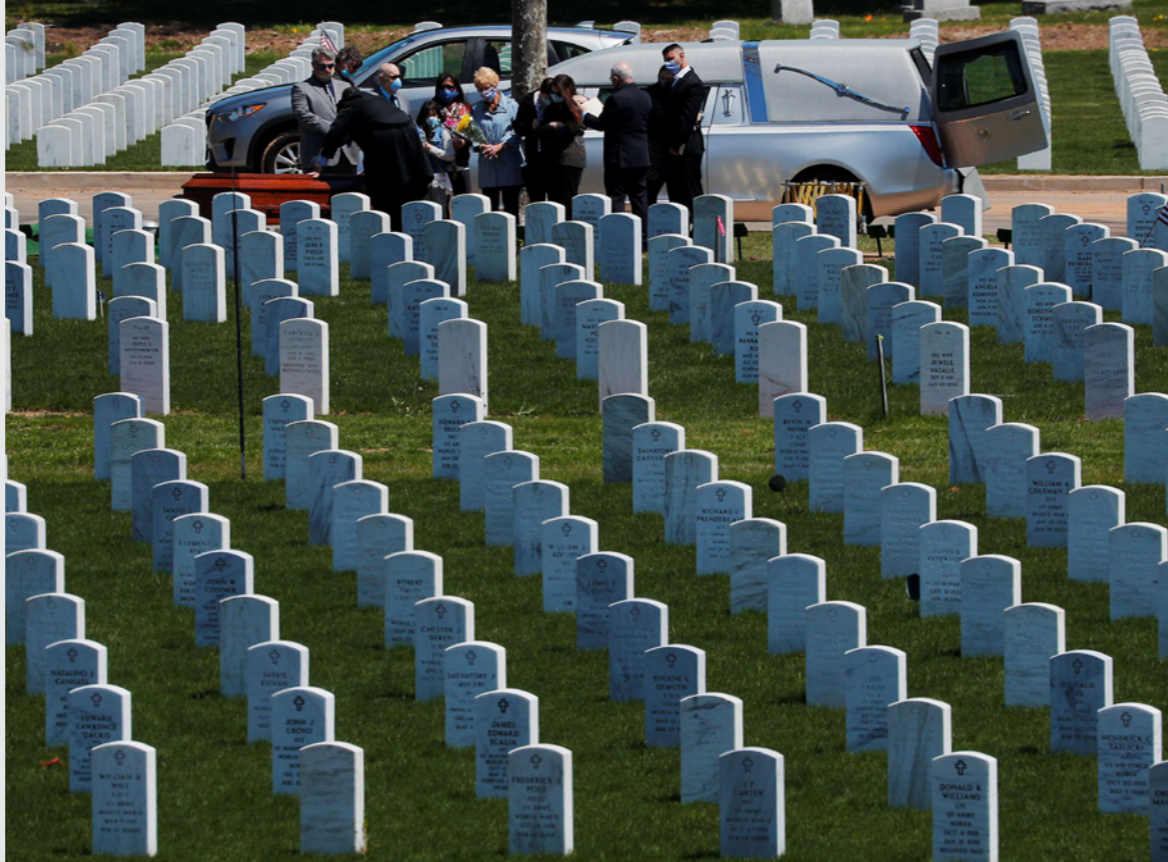
أمريكيون يدفنون يدفون قريبا لهم توفي بسبب الوباء في ماساتشوستس

سبعة أسابيع، مثلاً، مات 70.000 أمريكي أكثر من العدد المسجل في الظروف العادية وفي الفترة نفسها. ولا يشمل عدد 70.000 الكبير ولايات كونيتيكت ولا نورث كارولينا أو بنسلفانيا والتي تم استبعادها لعدم وجود بيانات أو لشك فيها. وفي تلك الفترة كان الرقم الرسمي للوفيات من كوفيد-19 هو 49.100 مما يقترح تجاوز أكثر من 20.000 حالة وفاة بسبب فيروس كورونا حتى 25 نيسان/إبريل. وعند إضافة الـ 20.000 وفاة غير المضمنة في الرقم الرسمي فعندما سيكون عدد الوفيات الإجمالي في أمريكا أكثر من 100.000 وفاة، إلا أن تجاوز إحصاء الحالات استمر حتى بعد 25 نيسان/إبريل وإن بمعدلات متدنية.