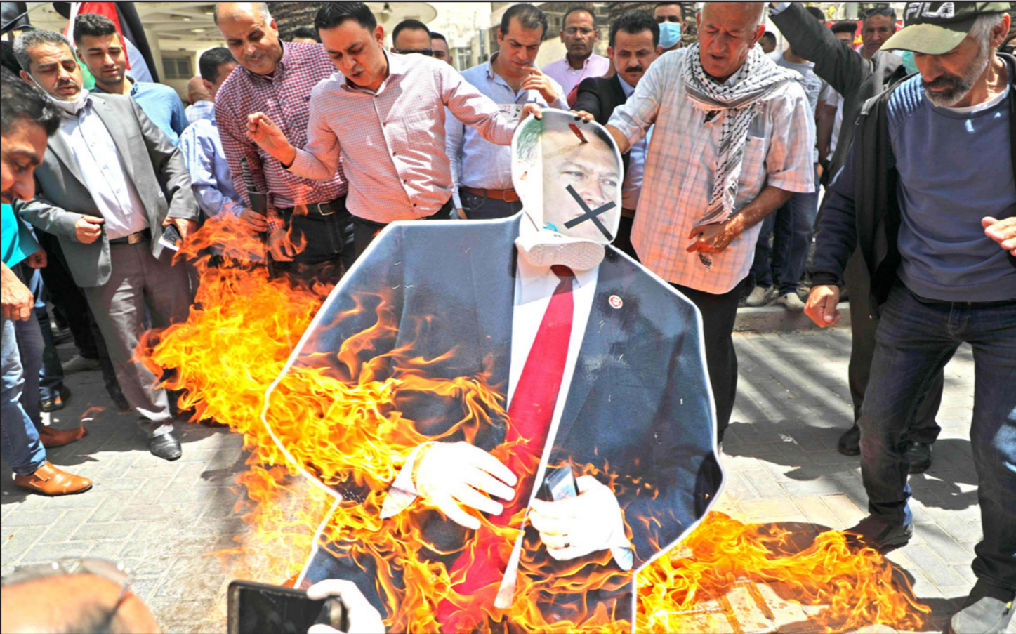
محتجون في نابلس في شمال الضفة يعبرون عن رفضهم للسياسة الأمريكية بحرق صورة وزير الخارجية مايك بومبيو

يشار إلى أنه عقب نشر تفاصيل الاتفاق الائتلافي بين الليكود و"أزرق أبيض" حذر مسؤولون رسميون من مختلف أنحاء العالم من مخيبة تنفيذ عملية الضم، كما نص عليها اتفاق نتنياهو وغانتس لتشكيل حكومتها المشتركة: إمكانية طرح هذه المسألة للبحث في "المجلس الوزاري المصغر" وفي الحكومة، ثم في الحكومة والكتيبات لإقرارها، ابتداء من مطلع تموز/ يوليو المقبل على أن الضم وفرض السيادة الإسرائيلية على الضفة الغربية وغور الأردن يفتقدان "بموافقة الولايات وبالحوار الدولي فقط". وجاء هذا التص بناء على طلب غانتس و"أزرق أبيض" لتجنب حدوث أزمة سياسية حادة في العلاقات مع الأردن، قد تصل في نظرهم إلى حد إلغاء اتفاقية السلام بين البلدين، في حال إصرار نتنياهو على تطبيق الضم على غور الأردن أيضاً، كما أعلن وتعيد مرات عديدة. وقال المفوض الأعلى للشؤون الخارجية والأمنية في الاتحاد الأوروبي، جوزيف بوريل، إن بروكسل "ستتابع الوضع عن كثب وستترصد إسقاطاته ثم ستتصرف بما يتلاءم معها". وفي فرنسا، حذر مسؤول حكومي رفيع من أن "الضم لن يمر دون رد فعل ولن نتغاضي عنه بسبب علاقاتنا مع إسرائيل". بينما قال مسؤول كبير في الحكومة الألمانية "ستكون للضم انعكاسات جديدة وسلبية على مكانة إسرائيل في العالم". كما صدرت تصريحات مماثلة عن دول أوروبية أخرى، من بينها روسيا، وبلجيكا، وإيطاليا، وإيرلندا، وإيطاليا والنرويج وبريطانيا. وقال يفتال بلومر، الناطق السابق باسم وزارة الخارجية الإسرائيلية والمسؤول الكبير في "الوكالة اليهودية" اليوم، إن "التجاهل الإسرائيلي للتحذيرات والتوبيخات الصادرة من دول عديدة في العالم هو تصرف غير حكيم ولا يعبر عن استقرار وازتزان في السياسة الإسرائيلية، حتى لو كانت هذه التهديدات غير دقيقة وغير جديدة تماما".