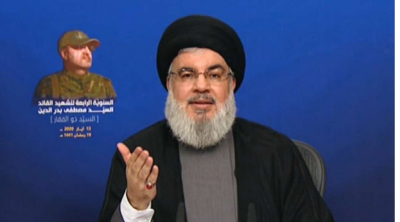
السيد حسن نصر الله خلال إلقائه كلمة متلفزة

بفترة محددة على الأرجح تفس حكومة سابقة استمر رئيسها بالإدارة لأكثر من أربع سنوات، لهذا السياق، في المقابل، وفي أروقة الخفية، ثمة من يتصور بيان «التقدم» في تحقيقات قانونية في بعض ملفات الفساد وتقديم «بعض الرموز» والسروروس» للتحقيق العادل، خطوة يطلبها فيها أدلة وقرائن سيحكم فيها القضاء، ووراء الكواليس تصريحات وتعليقات منقولة لنجوم التحقيقات، يدافعون فيها عن أنفسهم مع تهامس عن «كنايات سياسية»، وتصفية حسابات وصراعات في أقطاب البرلمان وطبقة كبار القاولين قد يكون لها تأثير سياسي قبيل حسم موعد ملف الانتخابات المقبلة، الأمر الذي يضع المسائل برمتها في منسوبة الإشكاليات السياسية والشعورية في ظل «عائلة كورونا»، الطويلة، و«شوق هوس الرأي العام بمتابعتها مثل هذه التجاذبات، وأحياناً «التسلي» بحيثياتها. طبعاً، اتهامات بالجملة من وراء ستارة توجه