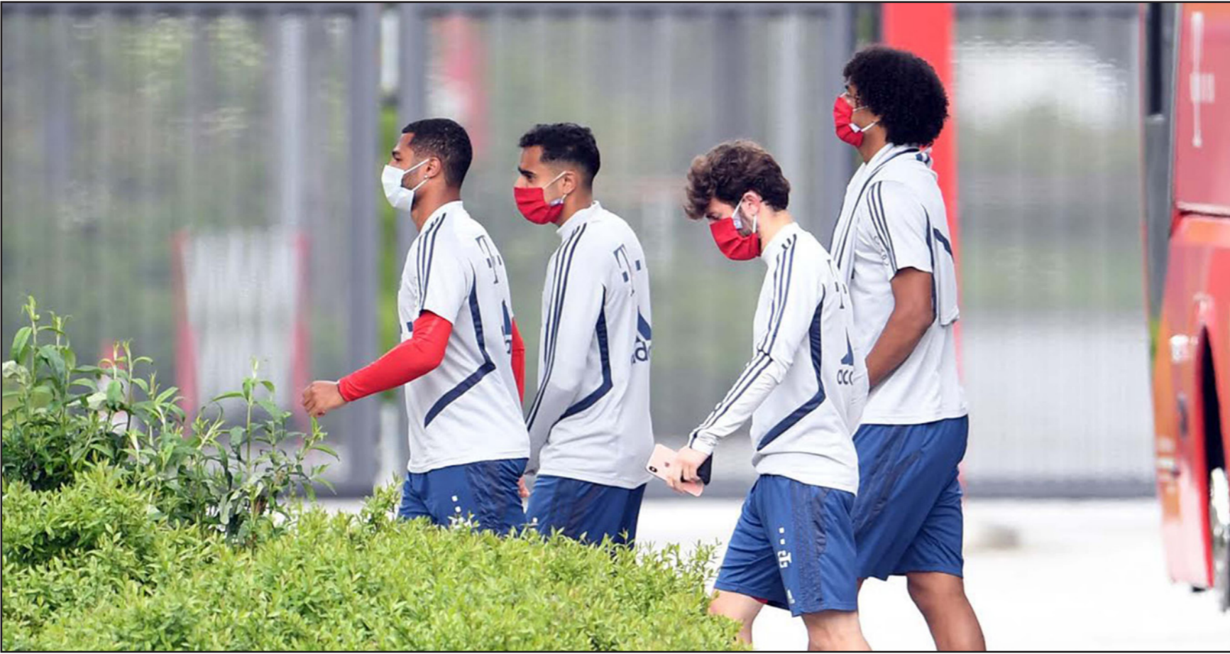
لاعبو بايرن ميونيخ يلتمون بالوقود الصحية خلال توجههم إلى حصة تدريبية

وفي باقي مباريات هذه المرحلة، يلتقي لايبزيغ مع فرايبورغ وهو فنهاف مع هيرتا برلين وفورتونا دوسلدورف مع بادربورن وأوغسبورغ مع فولفسبورغ وإتراخت فرانكفورت مع بوروسيا مونشنغلاذباخ والسبت وكولون مع ماينز الأحد وفييردر برين مع باير ليفركوزن في ختام المرحلة يوم الاثنين. تحت قيادة مدرين جديدين هما برونو لايبديا في هيرتا ومايكو هيرليش في أوغسبورغ.