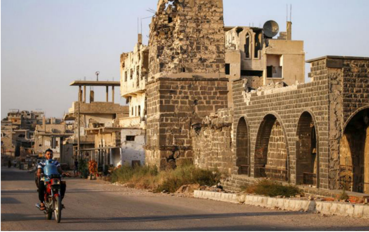
سوري يقود دراجة تارية وإلى جانبه مبنى دمرته الحرب في درعا

وأشار الكراد، إلى أن النظام السوري برعاية روسية، خلق حالة من عدم الشعور بالثقة، بعد اتفاق عام 2018 وذلك على إثر عمليات الاعتقال والملاحقات وحالات الاضطهاد على الحواجز، مؤكداً أن الأهالي يسعون لاتفاق لا يقهر فيه أهل الجنوب، اتفاق يضمن كرامتهم جميعاً لأنهم جزء من سوريا وكل. وأوضح أنه أجرى اتصالات مع ناشطين وقيادات في الجنوب السوري، الذين عبروا عن رفضهم للحرب، وتأييدهم للتهدئة. وأضاف القيادي: «نحن لا نريد الحرب، من أجل الحفاظ على هوية حوران، والحفاظ على كرامة الأهالي هنا، يجب أن لا نقرهم بالآلة العسكرية التي لم تبق على أخضر أو أبيض، ويكفي ما عانوه خلال تسع سنوات». وأضاف: «أرسلت عبر الطرق الدبلوماسية والأصدقاء كتاب لموسكو، فيه مبادء تطالب فيها الضامن الروسي، بضممان المفاوضات الجديدة التي