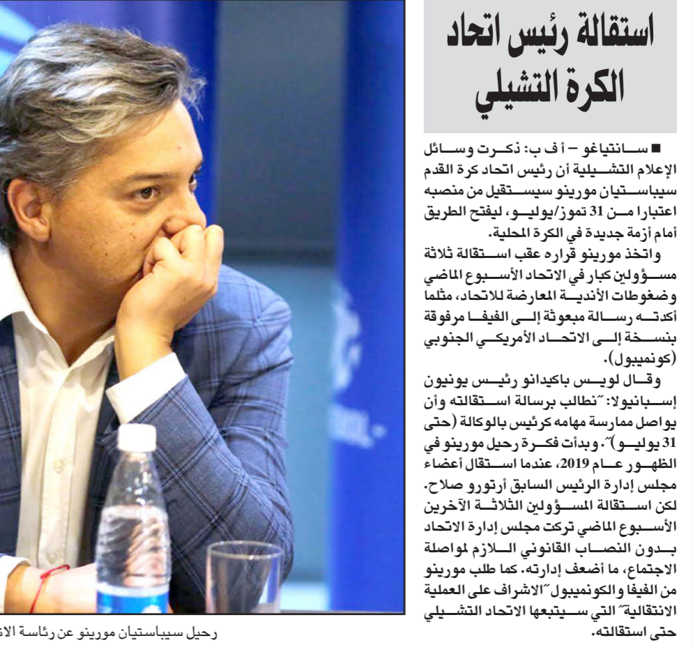
رحيل لويس بايكادو رئيس يونيون إسبانيولا: تطالب برسالة استقالته وأن يواصل ممارسة مهامه كرئيس بالوكالة (حتى 31 يوليو). وبدأت فكرة رحيل مورينو في الظهور عام 2019، عندما استقال أعضاء مجلس إدارة الرئيس السابق أرتورو صلاح. لكن استقالة المسؤولين الثلاثة الآخرين الأسبوع الماضي تركت مجلس إدارة الاتحاد بدون النصاب القانوني اللازم لموالفة الاجتماع، ما أضعف إدارته. كما طلب مورينو من ليفيا والكونميوبل "الإشراف على العملية الانتقالية" التي ستبنيها الاتحاد التشيلي حتى استقالته.

■ اسونسيون - أ ف ب: أقر الاتحاد الأمريكي الجنوبي لكرة القدم (كونيومبول) تعديلات على قوانينه المتعلقة بمسابقات الأندية وبروتوكولا جديدا لمكافحة فيروس كورونا، يمنع تبادل القمصان والبصق أو التمشط على أرضية الملعب. وحسب القوانين الجديدة يستطيع الاتحاد القاري الطلب من لاعب أو أحد أفراد الجهاز الفني معلومات صحية وإصدار الأمر بالخضوع لفحوصات طبية للكشف عن وباء كوفيد-19 قبل المباريات أو خلال الحصص التدريبية. وقال الاتحاد: "كل الأشخاص الذين يرفضون الخضوع للفحص لا يستطيعون المشاركة في البطولات التي تقام بإشراف كونيومبول". ولن يكون بإمكان اللاعبين والمدربين والحكام والبصق والتمخط على أرضية الملعب أو على مقاعد اللاعبين الاحتياطيين، كما لا يستطيعون أيضاً تقبيل الكرة وتشارك زجاجات المياه وتبادل القمصان أو شعارات الأندية. وأضاف أن ارتداء الكمامة إجباري على مقاعد اللاعبين الاحتياطيين، في المراكز الرسمية وخلال المؤتمرات الصحفية، وستقوم الأجهزة الطبية بقياس حرارة الجسم لكل اللاعبين وأفراد الجهاز الطبي والحكام قبل كل مباراة. وأكد الاتحاد القاري أنه سيجري باجراً خمسة تديلات خلال المباراة تماشياً مع القوانين الجديدة لمجلس الاتحاد الدولي (إيغاب) خلال مباريات دور المجموعات ومباريات ثمن النهائي من مسابقته الأهم كأس ليبرتادوريس، على أن يسمح بثلاثة تديلات فقط اعتباراً من الدور ربع النهائي.