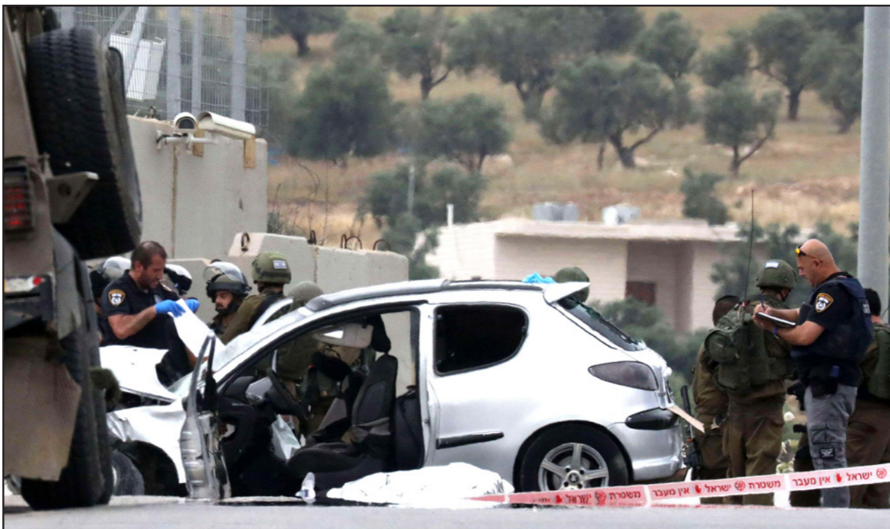
موقع عملية دهس جندي إسرائيلي وأستشهاده شاب فلسطيني