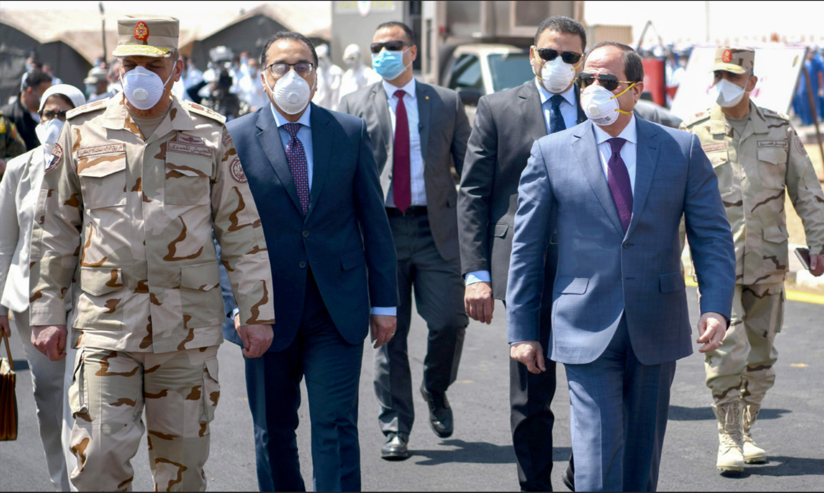
السيسي خلال تفقده قاعدة عسكرية شرق القاهرة