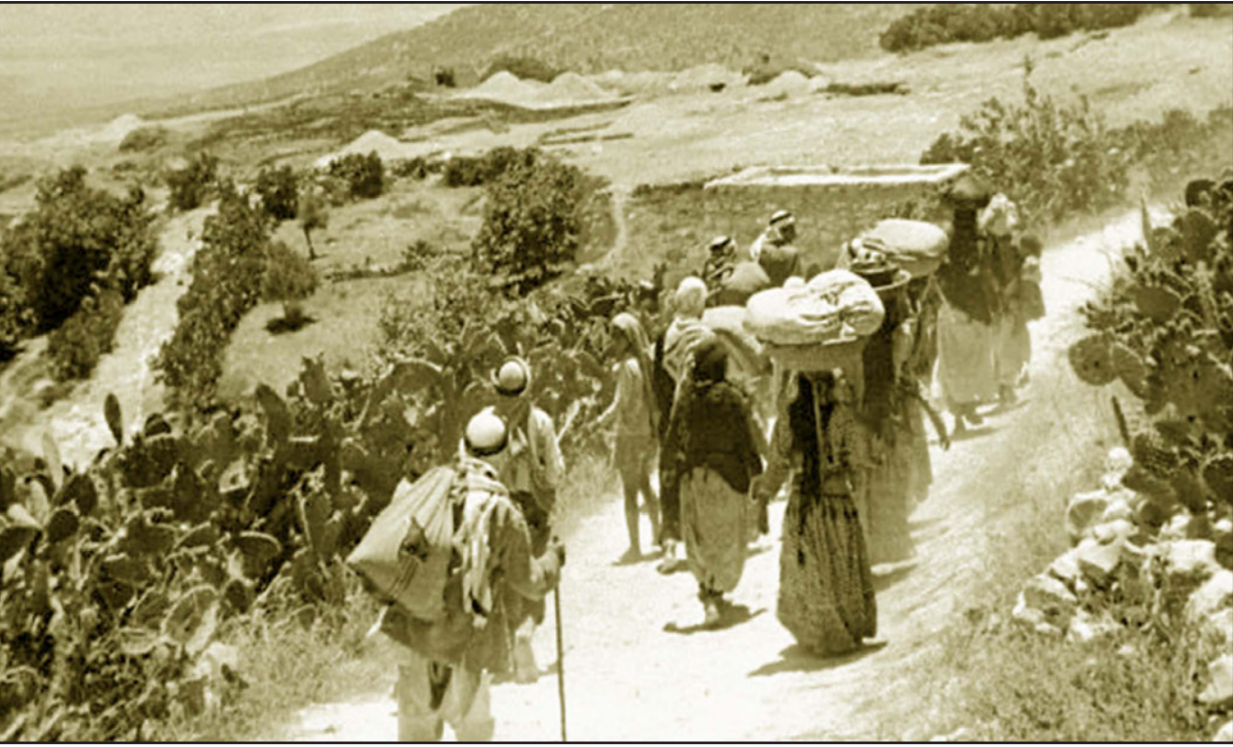
عجز فلسطيني لم تنسه العقود والسنوات النكبة ولا يزال يحتفظ ببعض المفاتيح... وصورة من أيام النكبة والتهجير القسري