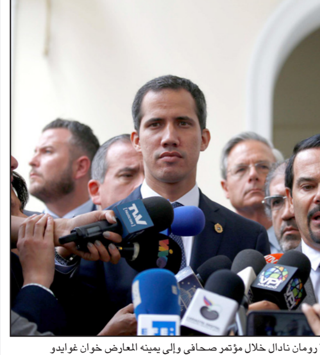
السفير الفرنسي لدى فنزويلا ورومان نادال خلال مؤتمر صحفي وإلى يمينه المعارض خوان غوايدو

وقال غريفيث من أن «فيروس كورونا والتباطؤ الاقتصادي العالمي يهددان بالزيد من الحن في اليمن الذي عانى بالفعل أكثر من أي دولة أخرى»، وأضاف: «الأمم المتحدة قدمت خريطة طريق قابلة للتنفيذ، والأمر متروك لمن يمتلكون السلاح والقوة وإمكانية اتخاذ القرارات»، وجاء ذلك في إفادة قدمها غريفيث خلال جلسة مجلس الأمن الدولي التي عقدت عبر دائرة تلفزيونية مغلقة، بشأن الأوضاع السياسية والإنسانية في اليمن.