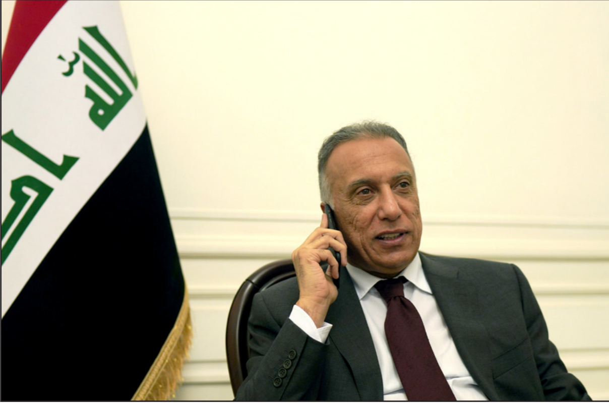
رئيس الحكومة العراقية مصطفى الكاظمي

وكَظف، وقد وظف في جوانب متعددة، منها وسيلة ضغط على الحكومة العراقية، وإعطاء عامل نفسي للجماهير بالمطالبة بإبقاء التحالف حتى يستطيع العراق التغلب على مشكلة ضعف الطيران، يكون إن الطيران العراقي لم يتمكن حتى الآن من تأمين كامل السماء العراقية.. وعلى مستوى جهة نظر طهران من الحوار، قال: «موقف إيران من الحوار هو التهديد، إيران لا ترغب بالتحديد وحتى فصائل المقاومة الإسلامية»، مشبها الحوار الاستراتيجي المرتقب بـ«استراحة مقاتل».