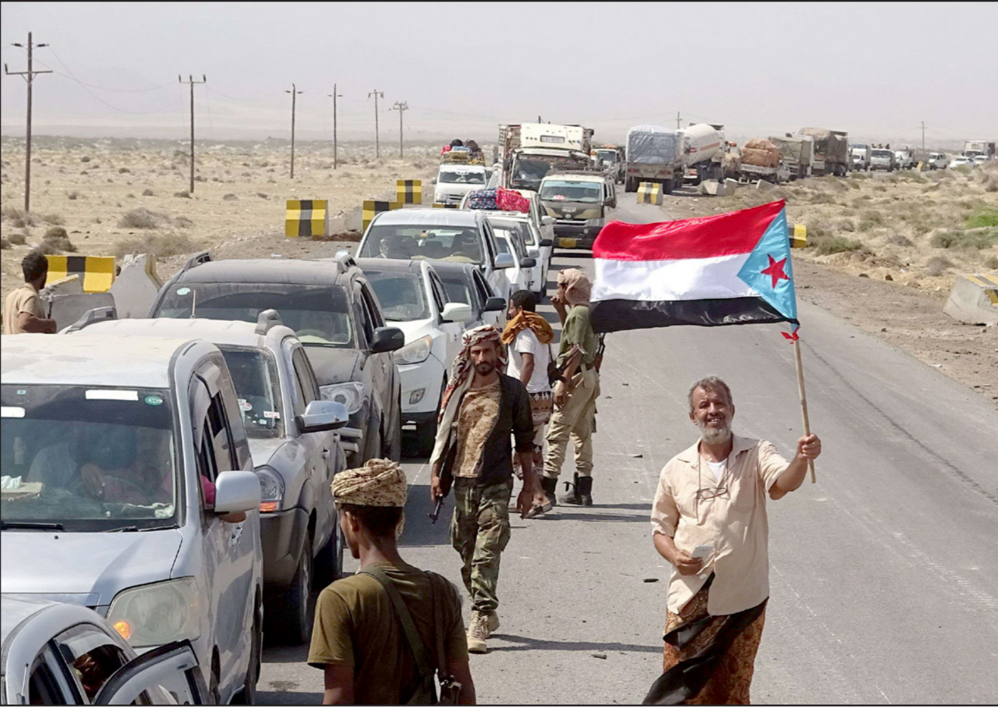
يمني جنوبي يحمل علم «الانفصال» بعد فتح الطريق عقب المواجهات مع قوات هادي بالقرب من عدن