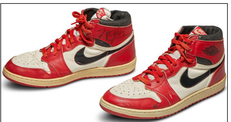
حذاء النجم الشهير "أير جوردان 1" الأعلى في التاريخ بيعه بأكثر من نصف مليون دولار

حذاء "أير جوردان 1" أول نموذج صممته شركة "تايبكي" خصيصا لجوردان، وانتعله في موسمه الأول في السان أن بي إيه- حين بدأ مسيرته مع "ذا لاست دانس" (الرقصة الأخيرة) التي تلقى الضوء على مسيرة جوردان ونجاحاته مع بولز، والتي تبث عبر شبكة "إي أس بي إن" الأمريكية وخدمة "نتفليكس" للبيب التدفقي حول العالم، ما عزز مبيعات التذكارات الخاصة بجوردان وتداول بعضها بعشرات آلاف الدولارات. ويعتبر وهذا الحذاء هو أكثر التذكارات قيمة في السوق حاليا. وعلى عكس حذاء "أير جوردان 1"، فإن حذاء "تايبكي مون" الذي بيع العام الماضي لم ينتعله أي لاعب. وكان أعلى حذاء في التاريخ انتعله رياضي يعود للحذاء الجلدي الخاص بالبريطاني روجر باينستر انتعله عام 1954 حين أصبح أول حذاء يركض مسافة ميل بأقل من أربع دقائق. وبيع الحذاء عام 2015 بقيمة 409 آلاف دولار لشخص لم يكشف عن هويته في دار كريستي في لندن. واكتسبت أحذية "أير جوردان" بتصميمها المختلفة، شعبية واسعة لدى جامعي المقتنيات على مدى العقود الماضية، وكذلك القمصان والتذكارات المصورة الخاصة باللاعب الذي فاز بسبعة ألقاب في "أن بي إيه" مع بولز (بين 1991 و1998)، ويعتبر على نطاق واسع أعظم من زاول اللعبة على مر التاريخ.