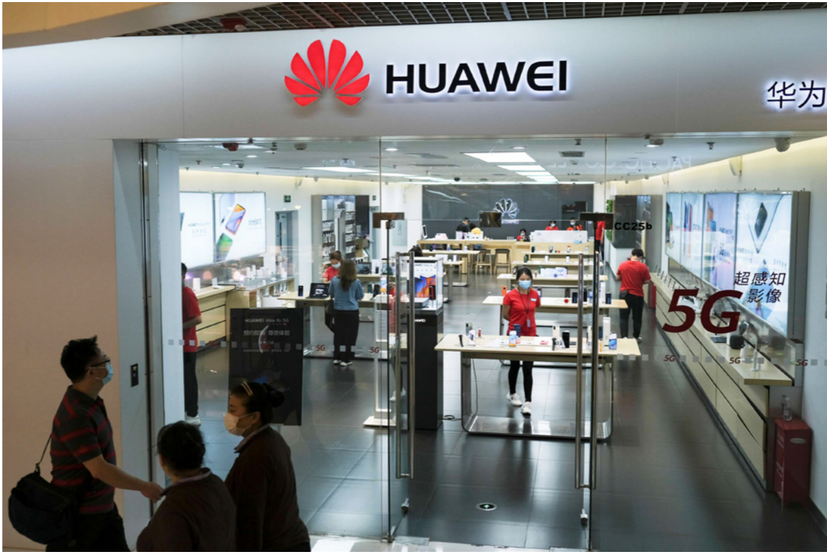
موظف وزبائن «هاواي»، يرتدون أقنعة واقية في أحد المراكز التجارية في بكين

الصينية من أنها ستستخذ «إجراءات ضرورية» لم تحدها لحماية «هاواي». وكانت «هاواي» تتسعد لتصبح رائدة عالمياً بخصوص شبكات الجيل الخامس، لكن واشنطن ضغطت على دول أخرى لعدم استخدام معداتها بسبب المخاطر الأمنية المحتملة. وضخت الحكومة الصينية أموالاً في تطوير أشباه موصلات محلية الصنع، لكنها لا تزال متخلفة عن الولايات المتحدة واليابان وكوريا الجنوبية، التي يقول محللون إنها كعب أخيل للولايات المتحدة.