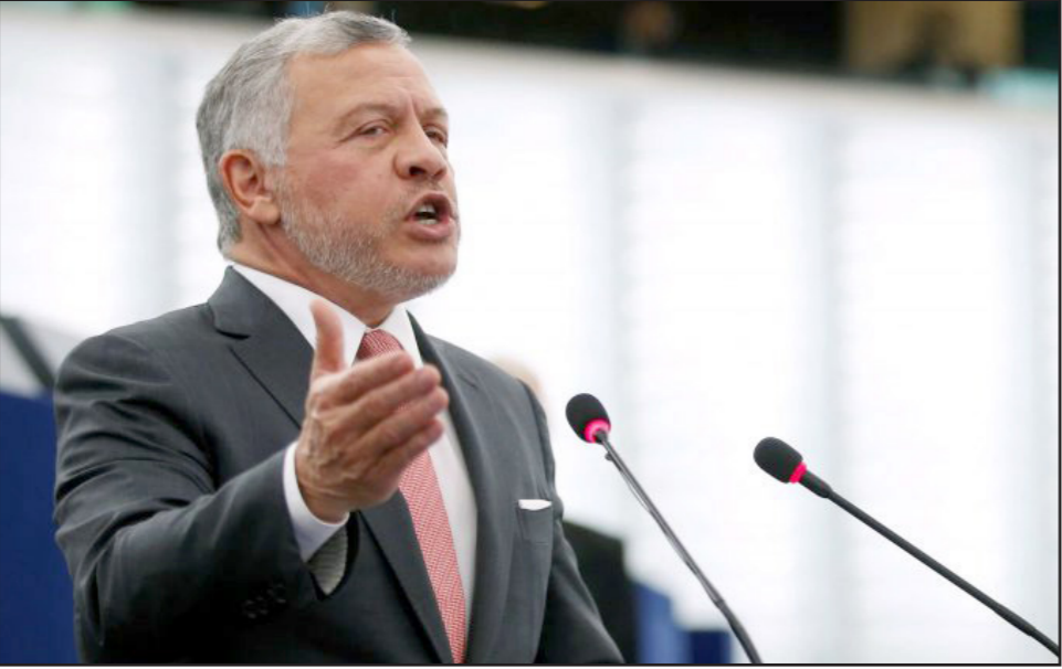
العامل الأردني الملك عبد الله الثاني

لا سيما غانتس وأشكنازي، كي يوقفوا هذا التدهور، رغم أنهم سيعارضون خطوات أحادية الجانب وأن كل ضم يقدم موقفاً دبلوماسياً واقعياً.