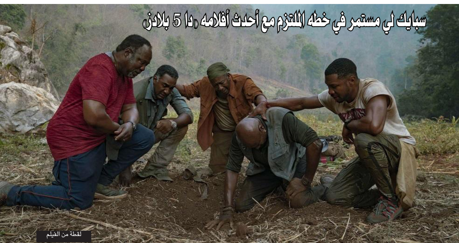
لقطة من الفيلم

بعد أربعة أشهر من الإغلاق التام الذي فرضه وباء كوفيد-19، و«ديزني لاند» في كاليفورنيا هو ثاني متنزّه ترفيهي في العالم من حيث عدد الزوار بعد ديزني ورلد، في أورانجو في فلوريدا، وعادة ما يجذب ملايين السياح كل عام. وقد حصل المتنزّه على موافقة السلطات ومن المفترض إعادة فتح أبوابه قبل أيام من «ديزني لاند» في كاليفورنيا. واستؤنفت النشاطات في «ديزني لاند» في شنغهاي. وتعتبر هذه المتنزّهات مصدرها مهما للإيرادات لمجموعة «ديزني» الأولى في عالم في مجال الترفيه. ففي الشهر الماضي، أشارت «ديزني» إلى أن إيراداتها الفصلية في هذا القطاع انخفضت بأكثر من النصف مقارنة بالربع نفسه من العام 2019 ويرجع ذلك بشكل رئيسي إلى تفشي فيروس كورونا المستجد. وعند إعادة افتتاح المتنزّه في كاليفورنيا، سيطلب من الزوار الحجز المسبق واحترام مسافة فصلية بينهم. ومن المفترض فتح الفنادق الموجودة في الموقع خلال الأسبوع الذي يلي استئناف العمل في المتنزّه.