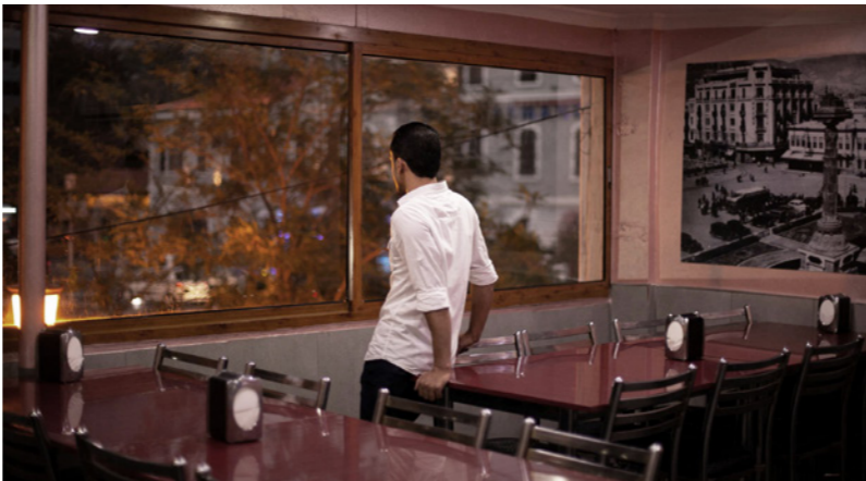
عامل في مطعم دمشقي فارغ ينتظر الزبائن

عليها، في عطلة نهاية الأسبوع وهم يدخون المشيشة الخاصة بهم دون حاجة إلى اللقب بشأن قيمة الفاتورة.