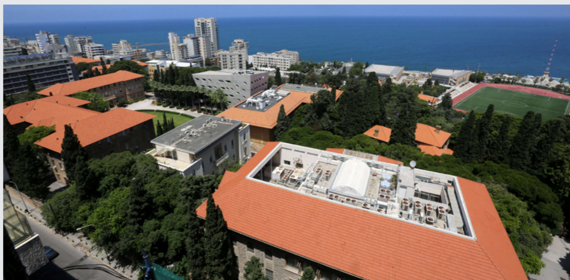
مبنى الجامعة الأمريكية في بيروت

وصلت إلى الحافة، ويقول الكاتب أنه لا يرى استثماراً يعود بمنافع جيدة في الاستثمار، ويرى أن أثر الجامعة واضح من مشاركة 1945 متخرجاً منها في تأسيس الأمم المتحدة عام 1945. ويعلق أن الناس الآن يسرحون من القيم الأمريكية عندما يفكرون في الحكومة الأمريكية، وهو أمر صحيح، إلا أن العالم راقب صورة أخرى عن القيم الأمريكية هذا الشهر، حيث خرج ملايين الأمريكيين إلى الشوارع يطالبون بالعدالة ونهاية وحشية الشرطة، وهي الصورة نفسها عن الديمقراطية الأمريكية المنضبطة التي يعثر بها العالم وثبت الحياة في مؤسسات مثل الجامعة الأمريكية في بيروت.