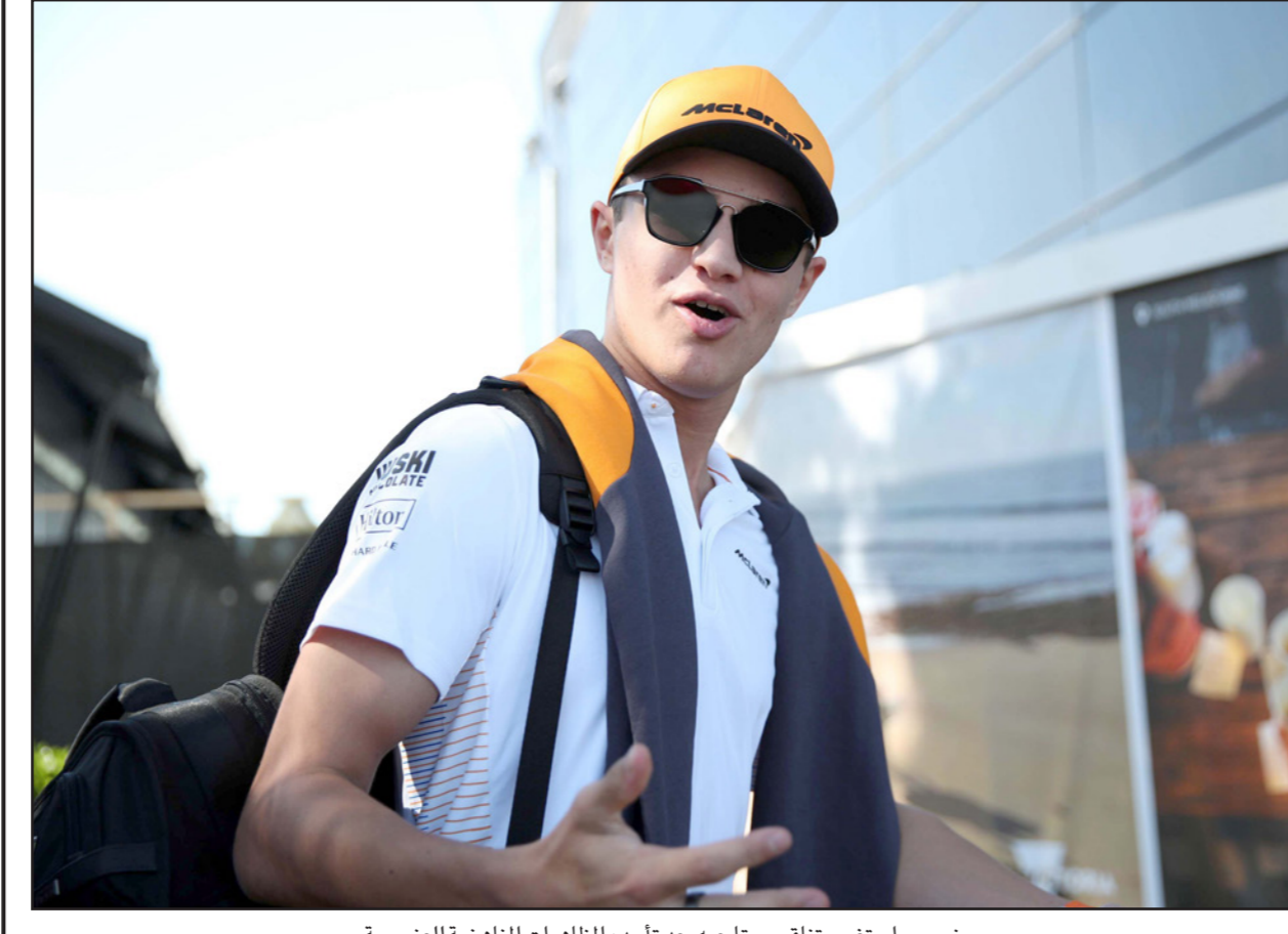
نوريس استغرب تناقض متابعيه بعد تأييده المظاهرات المناهضة للعنصرية

وبعد انتشار فيديو يصور وفاة فلويد (46 عاما) في 25 مايو/أيار الماضي اندلعت احتجاجات ومظاهرات كبيرة حول العالم منددة بالعنصرية ومطالبة بالتغيير بما في ذلك حركة "حياة السود مهمة". وطالب نوريس (20 عاما)، الذي يتابعه أكثر من 400 ألف شخص عبر "تويت" ونفس العدد تقريبا عبر "تويتش"، المتظاهرين بتوقيع وثيقة للمطالبة بحماية التمييز والعنصرية. ونقلت صحيفة "إيفينغ ستاندارد" عن نوريس قوله: "في هذا اليوم خسرت أكبر عدد من المتابعين لي عبر مواقع التواصل الاجتماعي". وأضاف: "أنت تحاول القيام بما هو صحيح ومفيد لكن في الوقت نفسه هناك كثير من الناس لا يعترفون بذلك. وإن لم يعجبهم ذلك فيسعدني أيضا أنهم تخلوا عن متابعتي". وأكد نوريس أنه رغم ذلك سيسعى دوما لمحاولة اقناع الناس باتخاذ المواقف الصحيحة. وفي وقت سابق انتقد البريطاني لويس هاميلتون وهو أول سائق أسود يفوز ببطولة فورمولا-1 صمت البطولة عقب وفاة فلويد وعبر عن دعمه للمظاهرات والاحتجاجات التي شهدتها مدينة بريستول الانكليزية والتي حطم خلالها المتحون تمثالا لأحد تجار العبيد خلال القرن ال17.