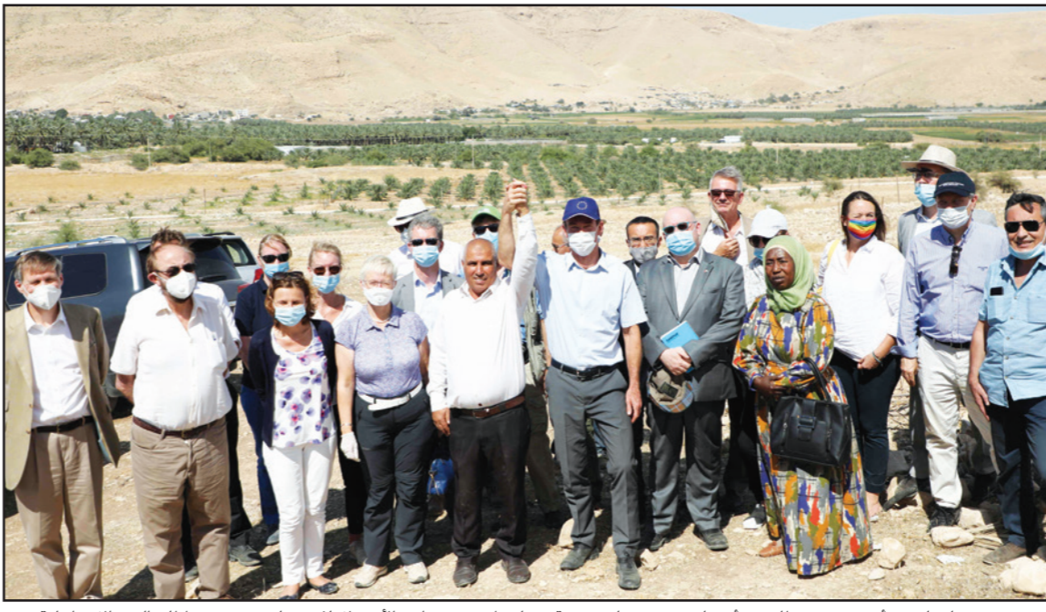
وفد من دبلوماسيين أوروبيين وبريطانيين وأعضاء في مؤسسات تنموية مع فلسطينيين من وادي الأردن لإعلان تضامنهم ضد مخططات الضم الإسرائيلية

الهاوية - «القدس العربي» وأشارت خطة الضم مخاوف الكثيرين من الإسرائيليين على مستقبل إسرائيل. وفي هذا السياق حذر قضاة ورجال قانون في إسرائيل وخارجها، رئيس الوزراء الإسرائيلي بنيامين نتنياهو من تطبيق خطة