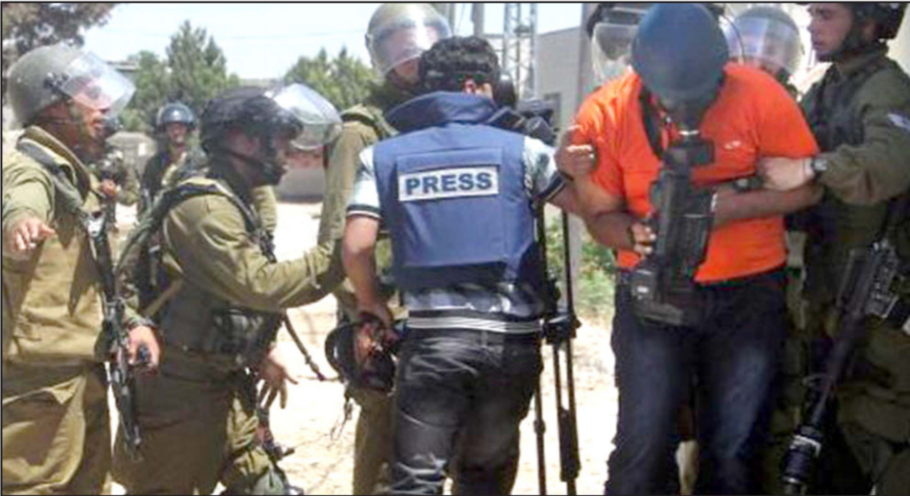
قوات الاحتلال تعتقل صحافيين خلال اشتباكات في الضفة