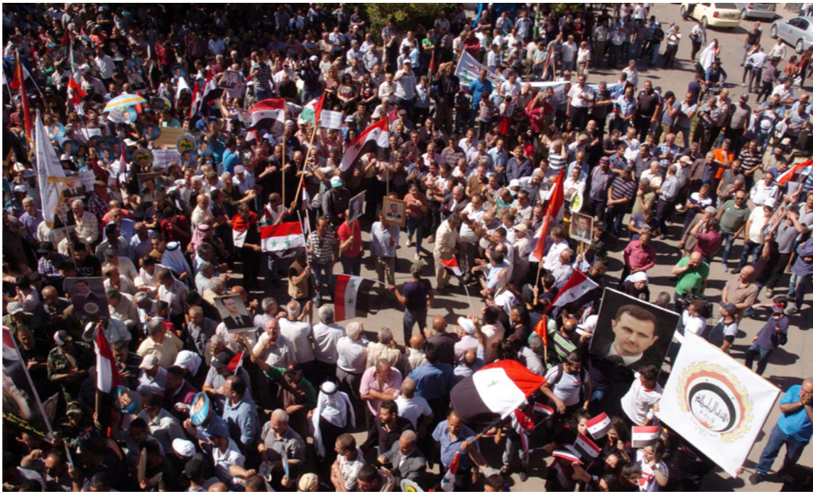
جانب من مظاهرات السويداء