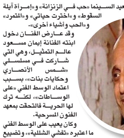
صعيد السينيما «حب في الزنازة» و«امرأة آيلة السقوط»، و«أخترت حياتي» و«المفرد»، و«الحب وأشياء أخرى».

توفي الممثل المصري محمود مسعود في أحد مستشفيات منطقة العباسية، في القاهرة إثر هبوط مفاجئ في الدورة الدموية وبعض أمراض الصدر. وأعلنت نقابة المهن التمثيلية وفاة الفنان محمود مسعود، فجر الخميس، عن عمر يناهز 67 عاماً. اشتهر الراحل بأدوار الخير والوظائف الشريف. ولد في 3 سبتمبر/أيلول 1952، وحصل على درجة البكالوريوس من المعهد العالي للفنون المسرحية عام 1975. وكانت آخر أعماله ومسلسل «آخر نفس» مع ياسمين عبد العزيز، والذي عرض في رمضان 2019 كما أنه شارك في العديد من الأعمال التلفزيونية والسينمائية الهامة خلال مسيرته، منها مسلسلات «جمهورية زفتى» و«م كلثوم» و«فراح إيليس» و«القضاء في الإسلام»، و«رجل الأقدار»، و«الإمام المرابي» و«نسيم الروح» و«سيدنا السيد»، و«عالم خفية»، و«حارة اليهود» و«دنيا جديدة»، وعلى