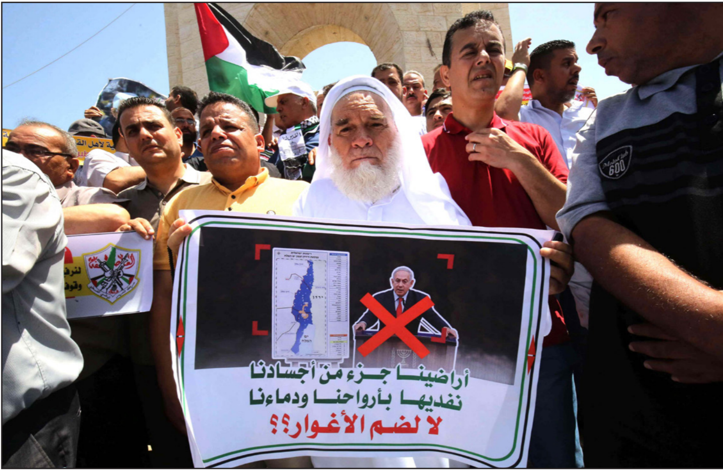
فلسطينيون في وقفة احتجاجية في غزة ضد الضم

الدولي ويتهكك الاتفاقيات ويدمر حل الدولتين. جدير بالذكر أن وزير الخارجية الفلسطيني رياض المالكي، أكد في كلمته أمام الاجتماع الاستثنائي مفتوح العضوية للجنة التنفيذية على مستوى وزراء خارجية الدول الأعضاء في منظمة التعاون الإسلامي أن خطة الضم الإسرائيلية لأراض من دولة فلسطين يجب ألا تتم، ويجب ردها ووقفها في مهدها.