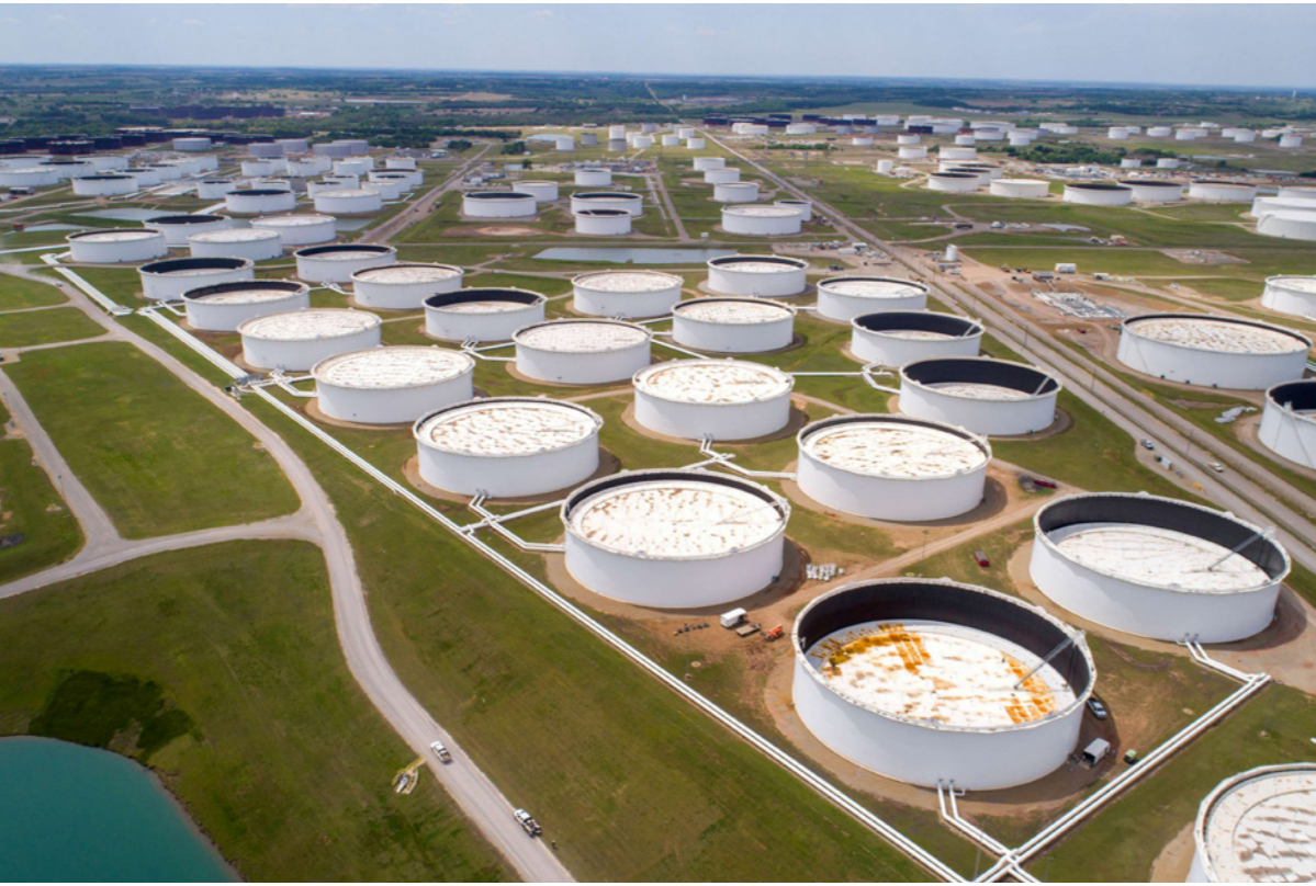
مخزونات نفط في ولاية أوكلاهوما الأمريكية

■ سنغافورة/عواصم - رويترز: تراجعت أسعار النفط بنحو أربعة في المئة أمس الخميس بفعل مخاوف بشأن تطاؤ نمو الطلب مع ارتفاع عدد حالات الإصابة بفيروس كورونا، فيما بلغت مخزونات الخام الأمريكية أعلى مستوى على الإطلاق، وقال مجلس الاحتياطي الاتحادي الأمريكي إن التعافي من الجائحة قد يستغرق أعواماً. وفي العاصمات الآسيوية المتأخرة، نزلت العقود الآجلة لخام برنت 3.4 في المئة أو ما يعادل 1.42 دولاراً إلى 40.31 دولاراً للبرميل، لتتحو مكاسب حققها أمس الأول. وفي وقت سابق من الجلسة، هبط برنت بمقدار 1.53 دولاراً أو ما يعادل 3.7 في المئة.