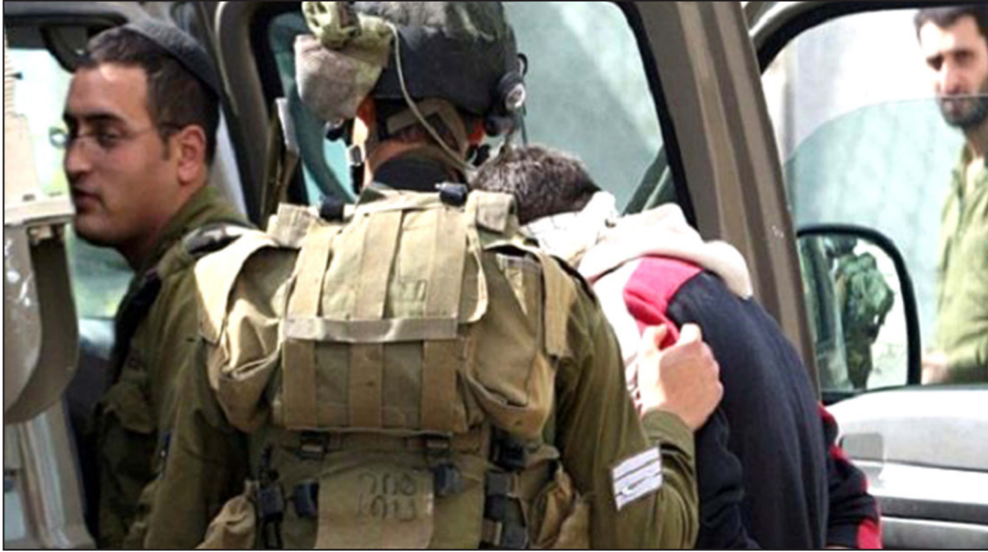
جنود الاحتلال يعتقلون فلسطينيا

وكان شبان البلدة قد تصدوا لاقتحام جديد في إطار الحملة العسكرية المستمرة ضد البلدة. والمعروف أن بلدة العيسوية في القدس، تتعرض منذ عدة أشهر لحملة إسرائيلية احتلالية شرسة، تمثلت في فرض حصار على البلدة، وعمليات اقتحام وتفتيش شبه يومية، واعتقال مئات المواطنين، بينهم أطفال صغار ونساء، كما تقوم تلك القوات باستهداف المواطنين بالرصاص، وهو ما أوقع شهيدا وعشرات