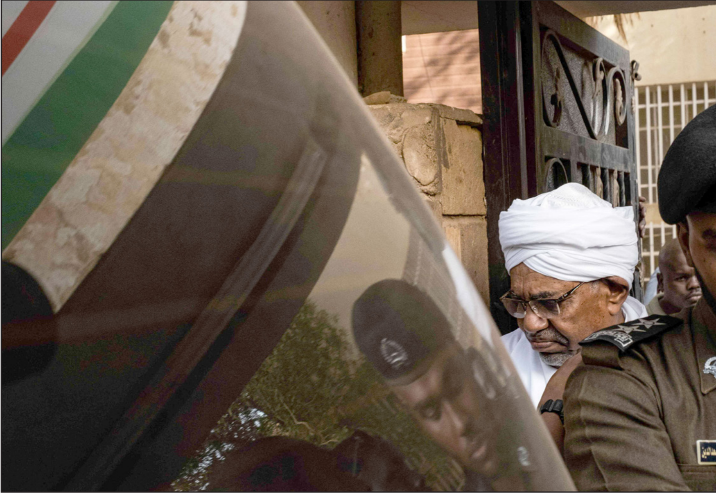
الرئيس السوداني الخلووع عمر البشير أثناء خروجه من إحدى جلسات محاكمته