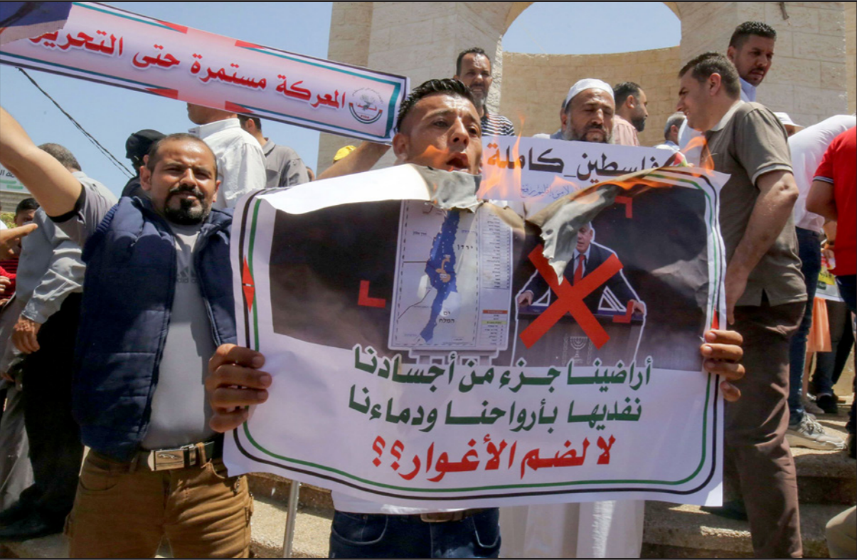
فلسطينيون يتظاهرون في رفح ضد الضم

الغلبية الفلسطينية من معاني الضم، بما فيها الاضطراب الشعبي الواسع، فقد تصل إلى انحلالها وإنهاء دورها. إذا كان هذا ما سيحصل، فستجد إسرائيل نفسها مسؤولة عن 2.7 مليون فلسطيني من سكان المناطق في جوانب القانون والنظام، وفهمها الأساس، ومنهم، وأكثر من ذلك، ذلك، بينما يتعاطف مع المناطق التأييد الشعبي لفكرة الدولة الواحدة، كبديل عن رؤيا الدولتين التي خاب، فضلا عن العبء الأمني، سيقع على كاهل إسرائيل عبء الاقتصاد الفلسطيني، دون مساعدة من الأسرة الدولية، التي تتبرع للسلمة الفلسطينية على مدى السنين. إضافة إلى ذلك، ستؤثر هذه التطورات الإشتكالية بقدر واضح على الطابع الديمقراطي والديمقراطي للدولة الإسرائيلية، كون معناها هو تسريع الانزلاق إلى واقع الدولة الواحدة وستضعف الرؤيا الأساس لدولة إسرائيل - دولة يهودية، ديمقراطية، أمّة وأخلاقية - معترف بحدودها وتتمتع بشعرية دولية. في العقد ذاته، فقد التزاع الإسرائيلي - الفلسطيني مركزيته في الساحة الإقليمية والدولية، جراء الاعتراف بأن الرض الفلسطيني لعب دورا حاسما في إحباط التقدم نحو تسوية سياسية يروح فكرة الدولتين للشعبين. على هذه الخلفية، تفرغت إسرائيل لتعدي لنحدي الإسرائيلي الأساس... توسع النفوذ الإيراني والتوسع الإيراني في الساحة الشمالية، إلى جانب ذلك، صار ممكنا تطوير علاقات إستراتيجية بين إسرائيل والدول العربية المزمعة وبناء جبهة واسعة ضد إيران. ومن هنا توقع أن يوقف الضم هذه المسيرة ذات الفضل العظيمة.