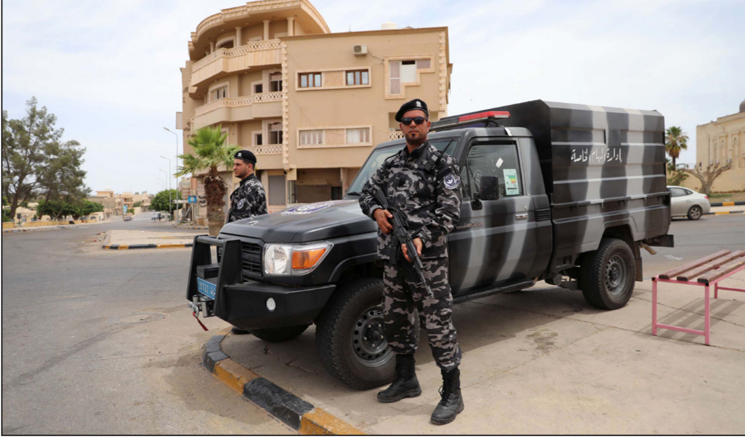
عناصر من القوات التابعة لحكومة الوفاق في أحد شوارع مدينة تهرونة

ولوقت إطلاق نار واستئناف مباحثات الحل السياسي عقب سيطرة الوفاق على سرت. يذكر أن وزير الخارجية التركي مولود جاوش أوغلو أعلن، الأربعاء، رفض بلاده لمبادرة القاهرة لوقف إطلاق النار واعتبرها محاولة لإفناج حفتر. وزير الدفاع التركي وفي حوار تلفزيوني، الأربعاء،