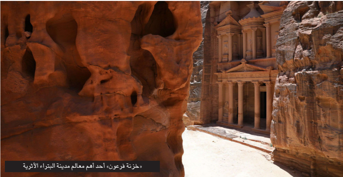
«خزنة فرعون»، أحد أهم معالم مدينة البتراء الأثرية