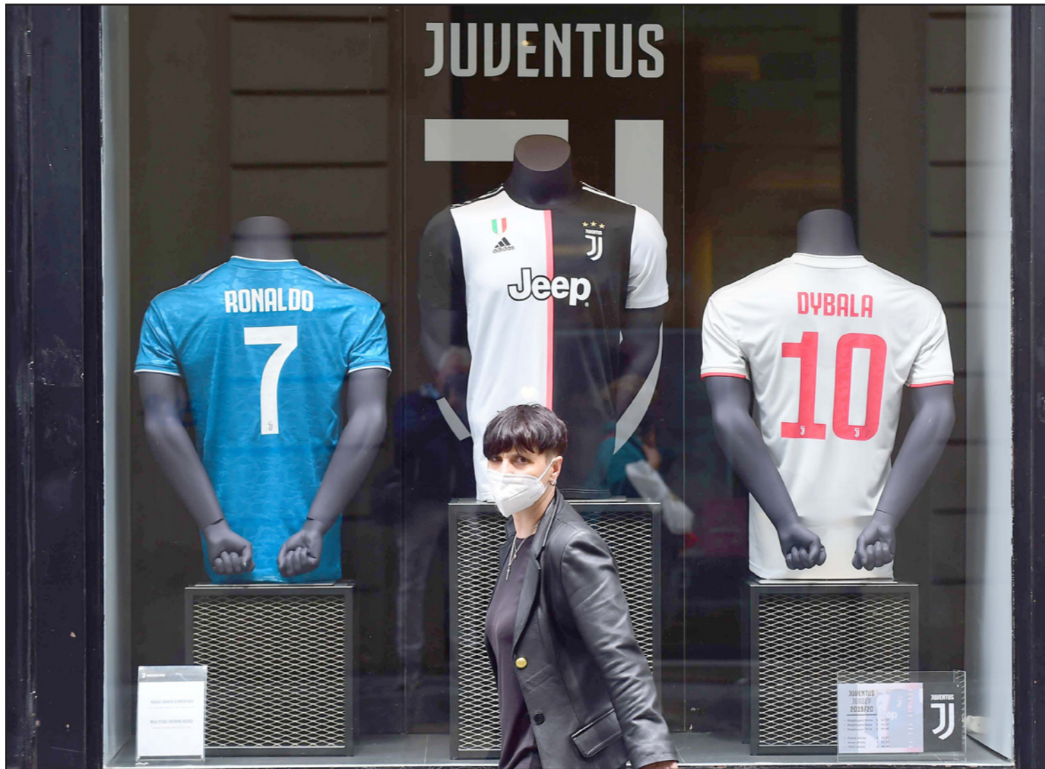
اقتصاديات كرة القدم ستتأثر بشكل كبير في البطولات الأوروبية الخمس الكبرى