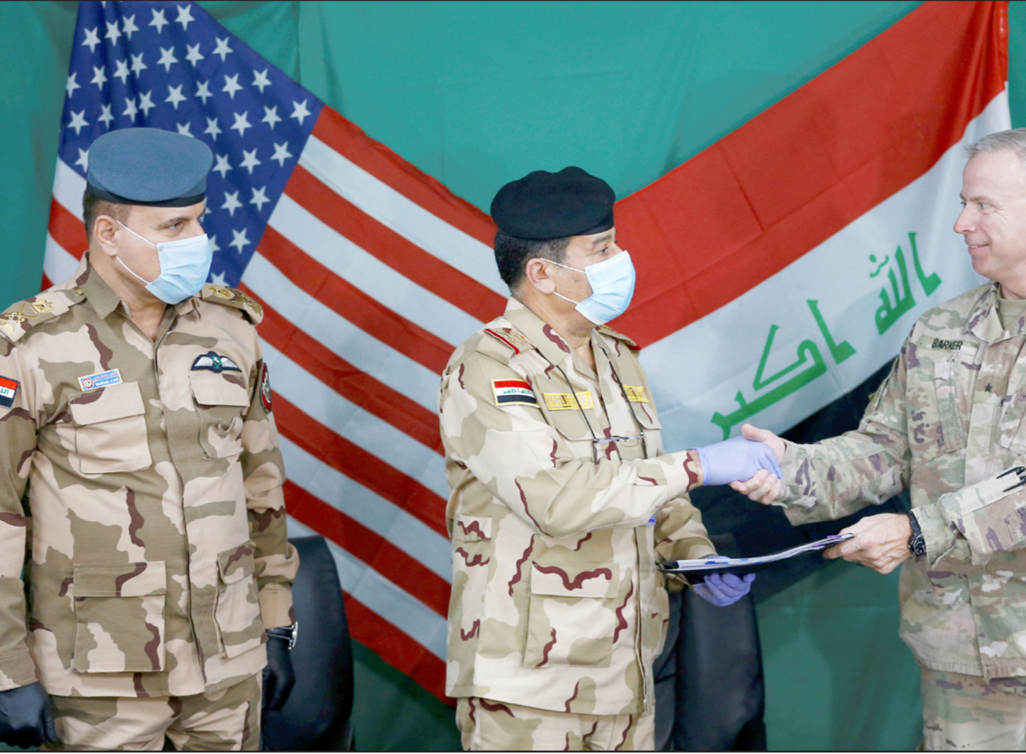
العميد الأمريكي فينتست باركر يصافح الضابط العراقي محمد فاضل خلال تسليم قاعدة «القيارة» للقوات العراقية

إيران، لأنه قد يقطع طريق طهران - بيروت، ولأنه يربط مصير محور المقاومة فيما يتعلق بالتواصل البري، حيث سيواجه جدلاً كبيراً وشديداً من سياسيين بارزين، في مقدمتهم الكردي والسنة الذين يرون أن هذا هو الحل المنطقي وينبغي للأحزاب الشيوعية المنسجمة مع إيران قبوله، أو الذهاب إلى توقيع مذكرة تفاهم مع الأمريكان لحين تفكيك عقدة الرض، ونتائج رفض هذا الحل كارثية إذا قررت الولايات المتحدة المغادرة وحساب العراق على محور إيران، وهذا يعني عقوبات سياسية واقتصادية وعسكرية أمريكية وأوروبية وخليجية». وأتم قائلا: «حتى يمكن التحكم في السيناريوهات المحتملة من جانب الأطراف، من المهم أن يتفتح حوار بناء وفعل بين كافة أطراف السلطة وصناع الرأي العام والفاعلين، بهدف مصلحة العراق، والسعي على نوح الاتفاقية 2008 السياسية من أجل الوصول لحلول وطنية، وخلق واقع حواري يتعدى فكرة التخادم مع مسلحة إيران والذهب، على حساب صيغة العراق، وحسن إدارة الموارد المالية، وكافة موارد البلاد، مع أهمية ارتباط ذلك بعدالة التوزيع، والعمل على نزع السلاح، وإصلاح هيكلية هيئة الحشد الشعبي في إطار القانون العراقي، ومكافحة الفساد على كافة الأصعدة، سواء من الناحية العسكرية، أو الخدمية، أو الاقتصادية بوضع خطة نهوض شاملة لكافة محافظات العراق».