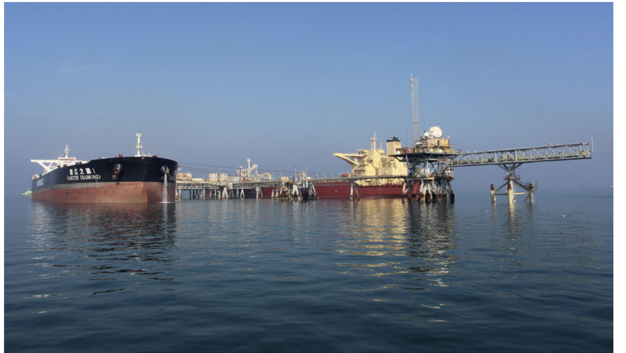
منصة تحميل في ميناء البصرة النفطية العراقية

■ لندن - رويترز: قالت «بترو-لوجستكس» لتتبع التقلبات في رسالة بالبريد الإلكتروني أمس الإثنين «باستثناء إيران وليبيا وفنزويلا، وهي الدول التي لا يشملها اتفاق خفض، ما زالت الإمدادات من دول أوبك العشر الأخرى تبعد نحو 1.55 مليون برميل يومياً عن مستوى الالتزام الكامل...العراق وتيجيريا والكويت هي أكبر الدول خففاً لإمداداتها منذ مايو/أيار، مع تقليص حجم تخفيضات السعودية والإمارات وأنغولا». وخلصت تقديرات الشركة إلى أن «أوبك» قلصت إنتاج النفط في يونيو/حزيران 1.25 مليون برميل يومياً عن مستويات مايو/أيار في إطار تنفيذها الاتفاق البرم مع روسيا وحلفاء آخرين للحد من الإمدادات. وأفقت «أوبك» وحلفاؤها، في إطار ما يعرف بمجموعة «أوبك+»، على خفض الإمدادات بمقدار غير مسبوق يبلغ 9.7 مليون برميل يومياً بدءاً من أول مايو/أيار لتعويض هبوط سعر النفط والطلب عليه بسبب أزمة فيروس كورونا. ويبلغ نصيب «أوبك» من الخفض 6,084 مليون برميل يومياً، وأظهرت بيانات تحميل ومصادر في القطاع أن