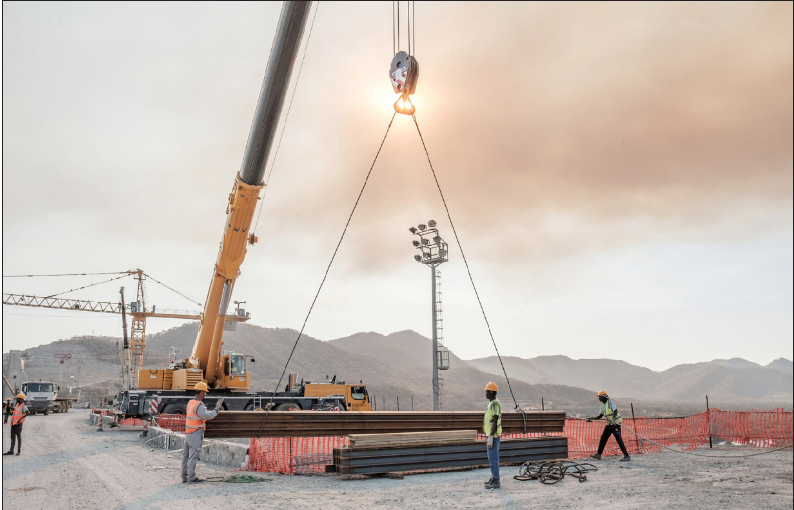
من أعمال بناء سد النهضة

لعقود علاقاتها الأفريقية». واتهم الحزب الإدارات المصرية المتعاقبة بالتعالي على الأفارقة، وتبني موقف ودعاية عنصرية تجاه دول قارة أفريقيا. وزاد الحزب: «إعلان المبادئ نفسه، رغم نواياه الطيبة وحمله رسالة أفريقية جديدة، كان يتطلب متابعة وجهوداً مصرية على مستويات مختلفة لتفعيل هذا التوجه وسبل التعاون المشترك واستثمار أكبر في أطر العمل الإفريقي طوال الخمس سنوات الماضية، فإفريقيا تتغير ونخبها وطبقاتها الحاكمة تشهد تحولات داخلية مهمة وتوحيها في علاقاتها الخارجية، ويزداد حضور دول كالسودان وإثيوبيا في الخريطة الدولية وتجاذبتها، واعتراف مصر بحقوق إثيوبيا والسودان في الاستفادة من مياه النيل في أغراض التنمية هو فرصة لأن يتحول هذا الحضور لقوة للإرادة الأفريقية المستقلة والعمل