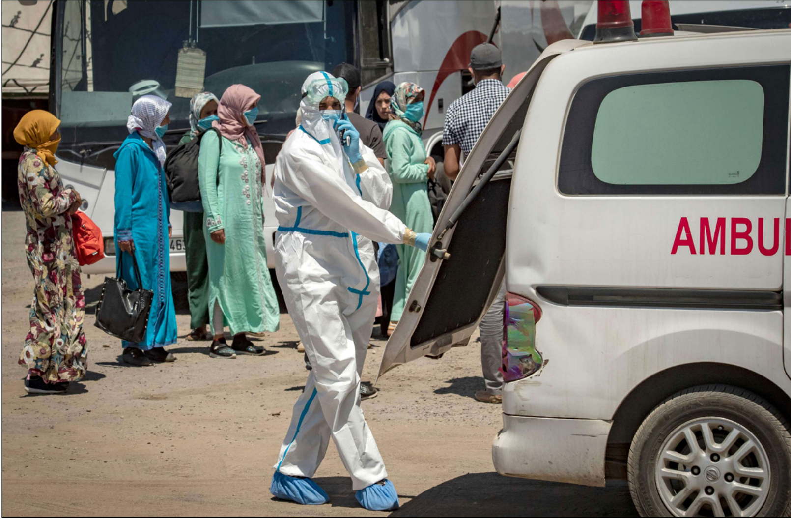
مواطنات مغربيات في إحدى ساحات العاصمة لإجراء فحص كورونا بعد ظهور إصابات جديدة

وشدد الحزب على «ضرورة التشبث بالخيار الديمقراطي كأحد التوابت الدستورية التي لا يمكن التراجع عنها، وبالآلية الانتخابية كمدخل أساسي لاكتساب المشروعية الشعبية في تدبير الشأن العام، والحرص على انتظامية العملية الانتخابية التي أصبحت مكسبا سياسيا وسترواها لا يمكن التفریط فيه، وتدعو بالمقابل إلى التصدي لكل محاولة من شأنها الانتكاف على المسار الديمقراطي في بلادنا والعودة بها إلى ممارسات ماضوية بائدة».