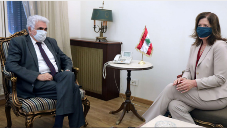
وزير الخارجية ناصيف حنّي مستقبلاً السفيرة دوروثي شيا أمس

بموجب مبدأ احترام سيادة الدولة والقواعد الدولية، كما تعزيز التعاون الدولي لمكافحة الفساد. ليس للروس الصينية ذات الصلة أي شروط سياسية»، وأضاف «في المناطق والبلدان التي نذكرها الجانب الأمريكي مراراً وتكراراً للمتلاعبين بالأمر، فنسبة صغيرة من ديوننا تكديتها مشاريع التعاون مع الصين ولم نسمع أبداً عن وقوع أي دولة في «فخاخ الديون» بسبب التعاون مع الصين. بند قادة كل من سريلانكا وجيبوتي مزاعم ما يسمى «فخاخ الديون الصينية». إن هذه البلدان النامية هي في أفضل موقع للحكم على آثار تعاونها مع الصين». وأملت السفارة «أن تتمكن الولايات المتحدة من النظر إلى تعاون الصين مع الدول الأخرى بطريقة صحيحة وموضوعية، وعلى الجانب الأمريكي على الأقل التوقف عن عرقلة الآخرين عن مساعدتهم لهذ البلدان النامية،