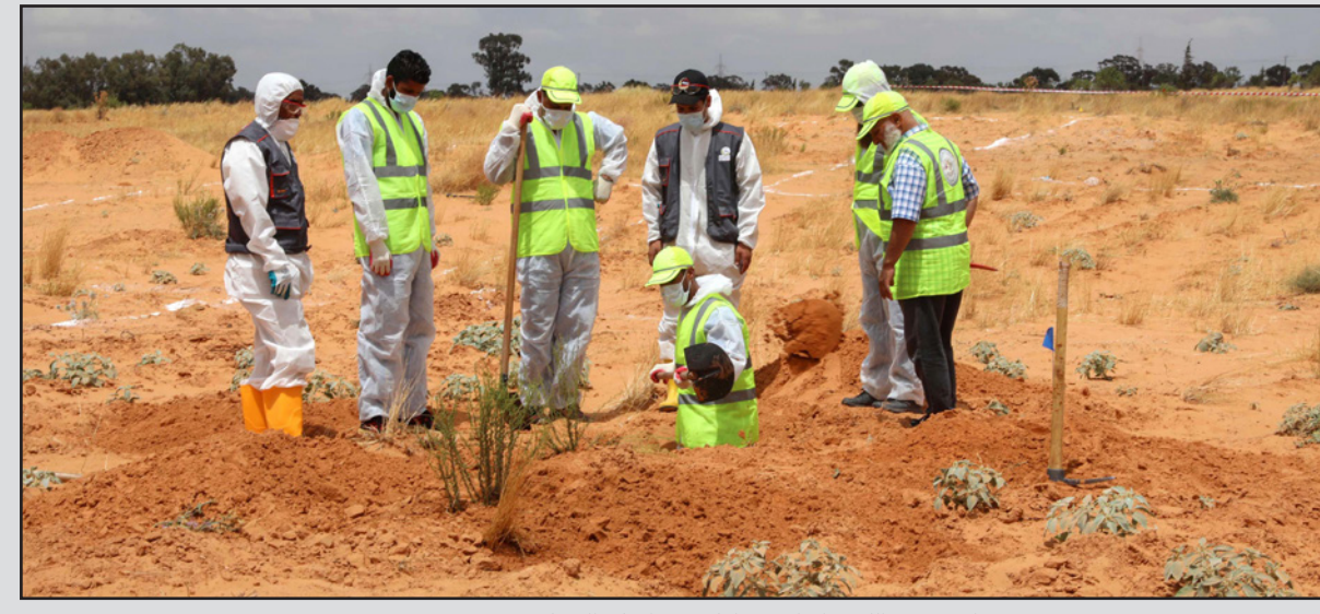
ليبيون من اللجنة المكلفة بعمليات فتح المقابر الجماعية في مدينة ترهونة

جماعية في ريف المدينة في 12 من الشهر ذاته، وفي 17 من الشهر الجاري، أعلن الجيش الليبي أنه بانتظار تحقيق أمني يكشف للعالم