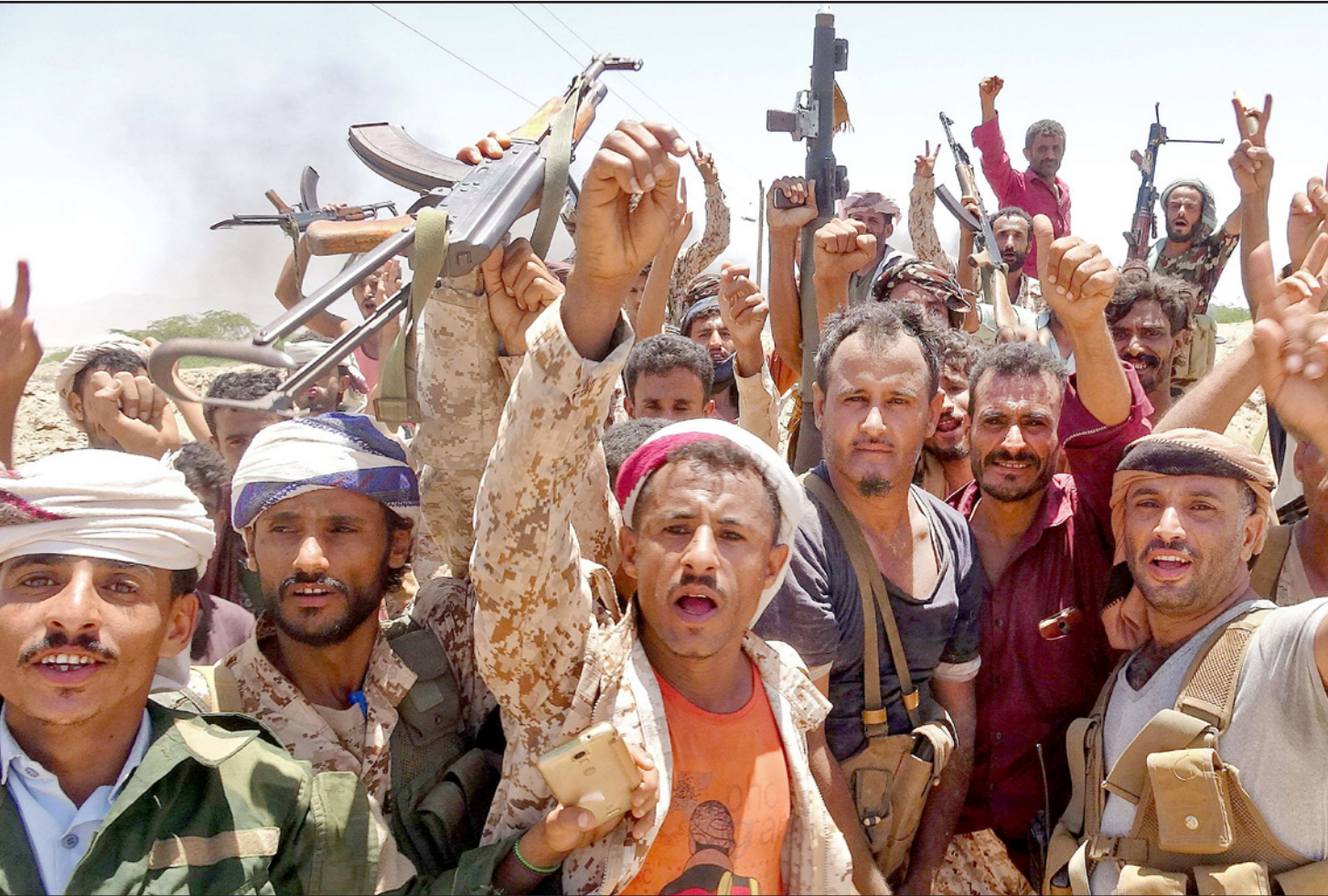
ميليشيا تابعة للمجلس الانتقالي الجنوبي المدعوم إماراتياً

في مواجهة الحوثيين، وأدت الحرب وفق تقديرات دولية إلى إحدى أسوأ الأزمات الإنسانية في العالم، حيث بات 80% من سكان اليمن في حاجة إلى مساعدات إنسانية، ودفع الصراع الملايين إلى حافة المجاعة.