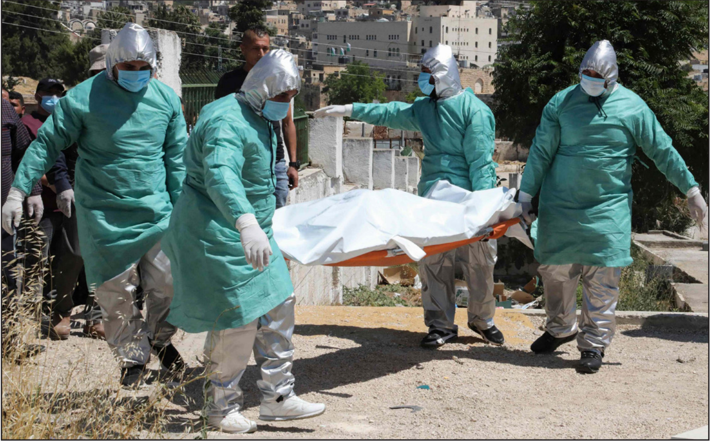
عاملون من وزارة الصحة الفلسطينية يتلقون وهم يرتدون الثياب الواقية جثة سيدة توفيت جراء كورونا في الخليل امس