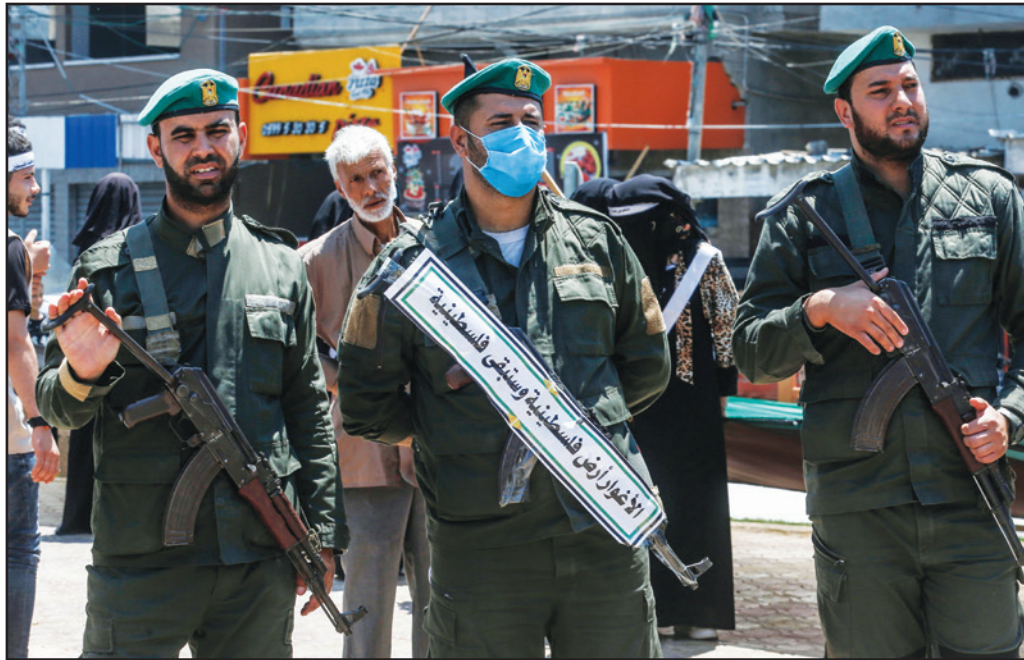
قوات تابعة لحركة «حماس» خلال مسيرة في رفح للاحتجاج على مخططات إسرائيل لضم أجزاء من الضفة والأغوار

لندن - الناصرة - غزة - رام الله «القدس العربي» - من وديع عوادرة وأشرف الهور: