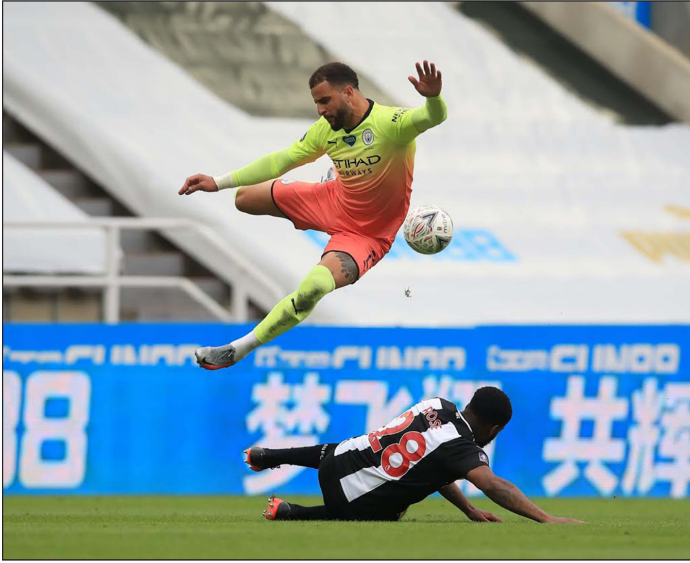
وكرر مدافع السيتي يتغادى عرقلة روز مدافع نيو كاسل

ومتح البديل الإسباني داني سيبايوس فرقة أرسنال التاهل إلى نصف النهائي بهدف الفوز المتأخر (1-2) على المضيف شيفيلد يونايتد، وسجل أرسنال عبر الأيفواري نيكولا بيبيني من ركلة جزاء (25)، وعادل شيفيلد في الدقيقة 87 عبر ديفيد مكغولدريك، قبل أن يحسم سيبايوس النتيجة في الدقيقة الأولى من الوقت بدل الضائع، في مباراة شهدت إلغاء هدفين لشيفيلد بداعي التسلل، وحاول "الدفعجية" في المسابقة التي يحملون الرقم القياسي في عدد ألقابها (13 آخرها عام 2017)، تعويض تأخرهم في الدوري، حيث تراجعوا إلى المركز التاسع.