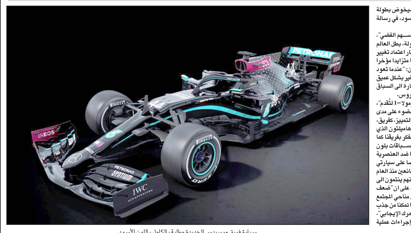
سيارة فريق مرسيدس الجديدة مطلية بالكامل باللون الأسود