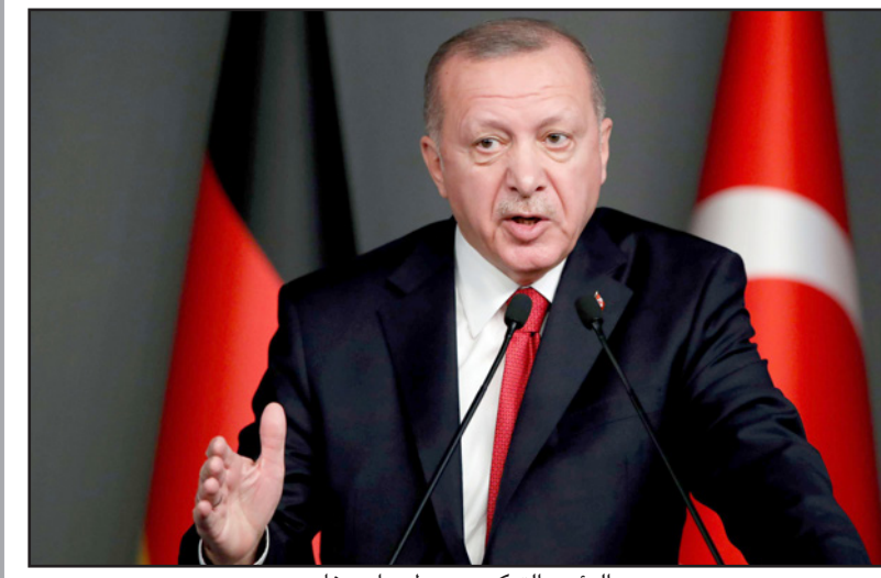
الرئيس التركي رجب طيب اردوغان

وكانت وسائل إعلام أمريكية قد أفادت بأن روسيا